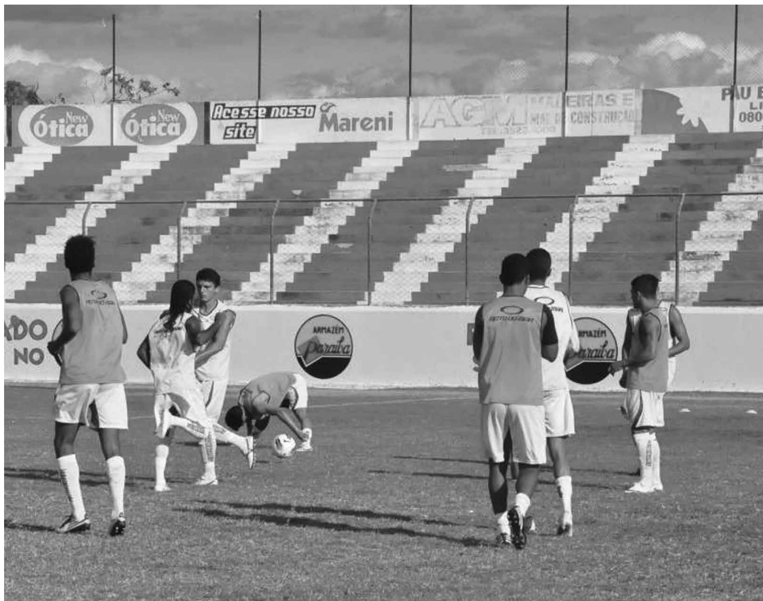
Jogadores do Sousa durante treinamentos físicos na semana visando o jogo de hoje contra o Vitória da Conquista, no interior baiano