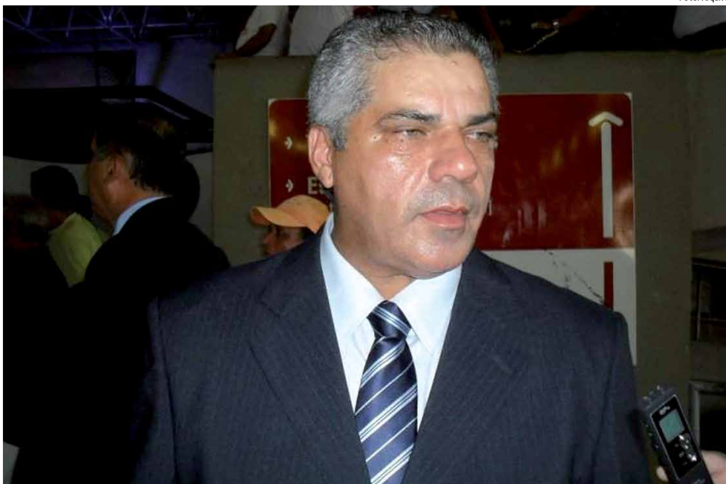
Rosas disse que a criação da nova legenda representou a busca de alguns deputados estaduais por melhores espaços políticos

“Vamos reforçar a segurança em todo o Estado e a população pode ficar certa de que teremos um pleito tranquilo”, afirmou o coronel Euler, ao explicar que uma série de reuniões que vai ser realizada deixará todo corpo de oficiais muito bem orientado.