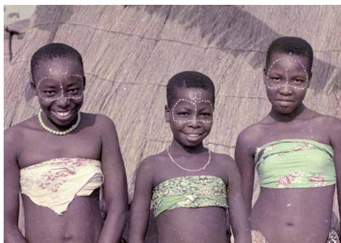
O longa-metragem Acácio, de Marília Rocha, é um dos filmes que serão exibidos no Espaço Cine Digital

O objetivo é exibir filmes que, em sua maioria, ficam fora do circuito comercial dos cinemas, possibilitando o acesso do público aos trabalhos dos diretores e atores brasileiros. Com isso, espera-se criar o hábito nos brasileiros de apreciarem sua própria produção cinematográfica. O Projeto é reflexo de uma iniciativa do Ministério da Cultura