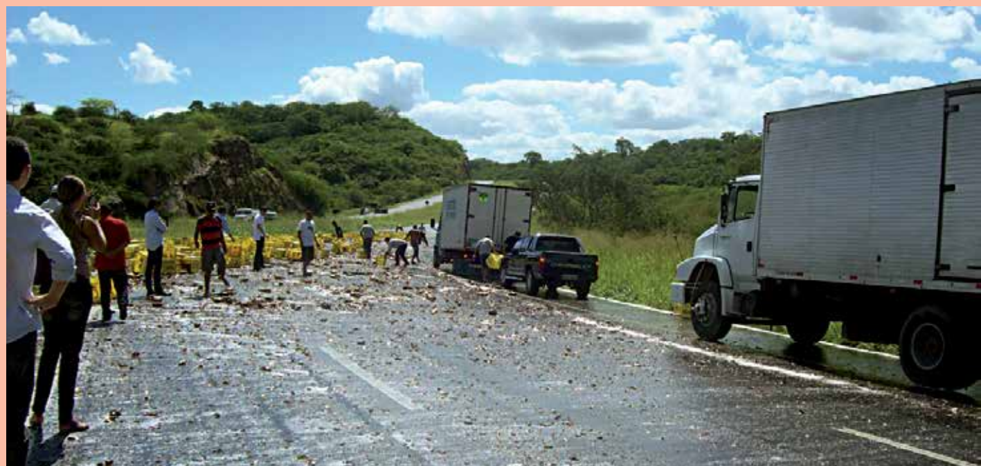
Muitos curiosos que passavam pelo local tentaram se aproveitar da situação pegando garrafas espalhadas pela pista da BR