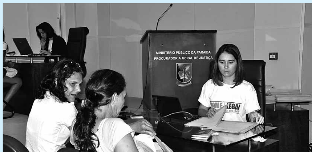
O projeto se destaca no Estado e está resolvendo problemas relacionados com a paternidade

Desde que o projeto teve início há um ano, mais de 500 crianças e adolescentes do