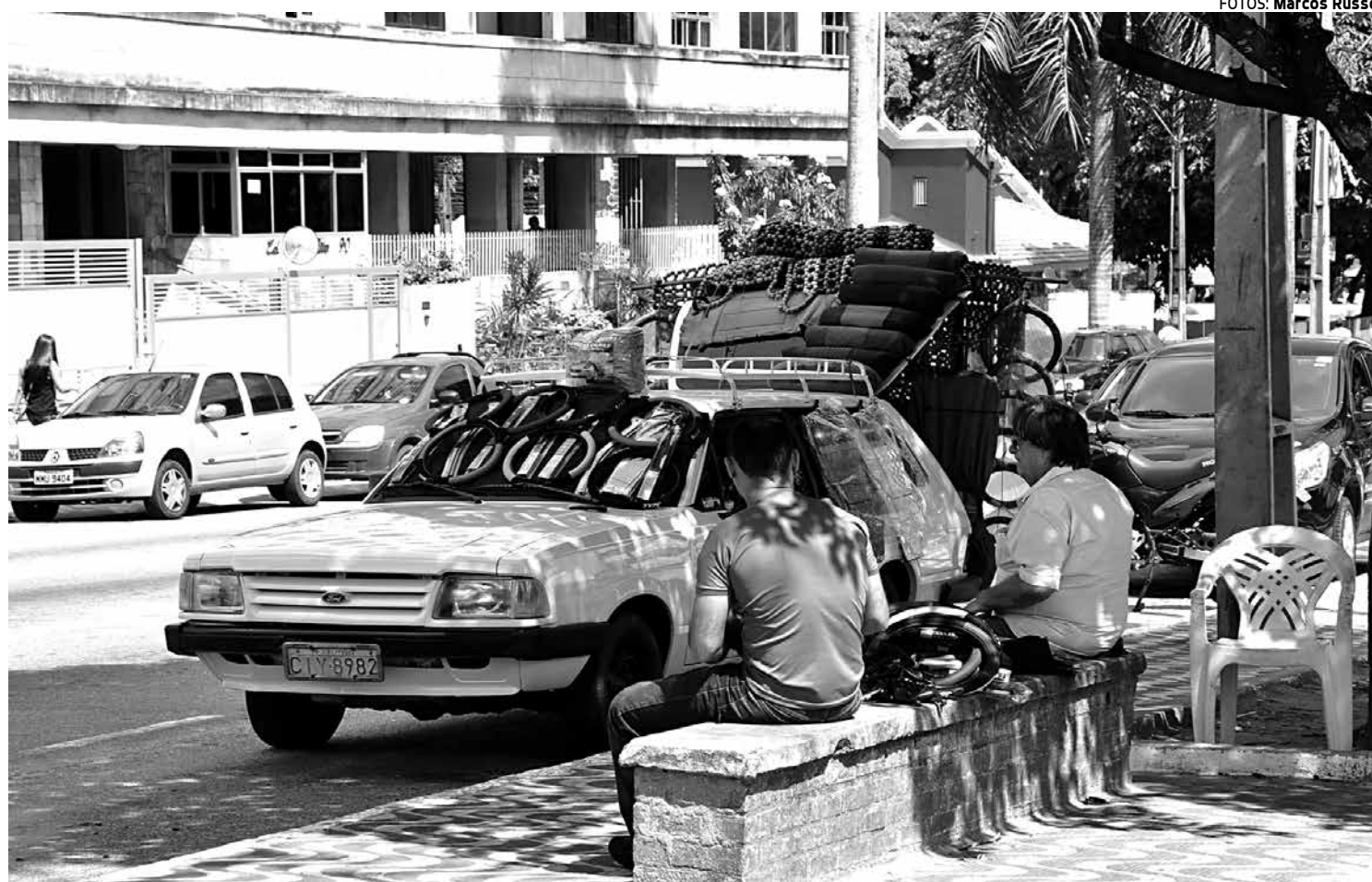
Na Avenida Getúlio Vargas, os camelôs estacionam seus veículos, onde podem ser vistos acessórios, cofres e outros produtos

Segundo ele, um dos produtos mais vendidos são limpadores de parabrisa, capas de silicone ou de tecido para direção ou jogo de capa para bancada do carro. O ambulante disse também que se o cliente precisar de uma capa de couro,