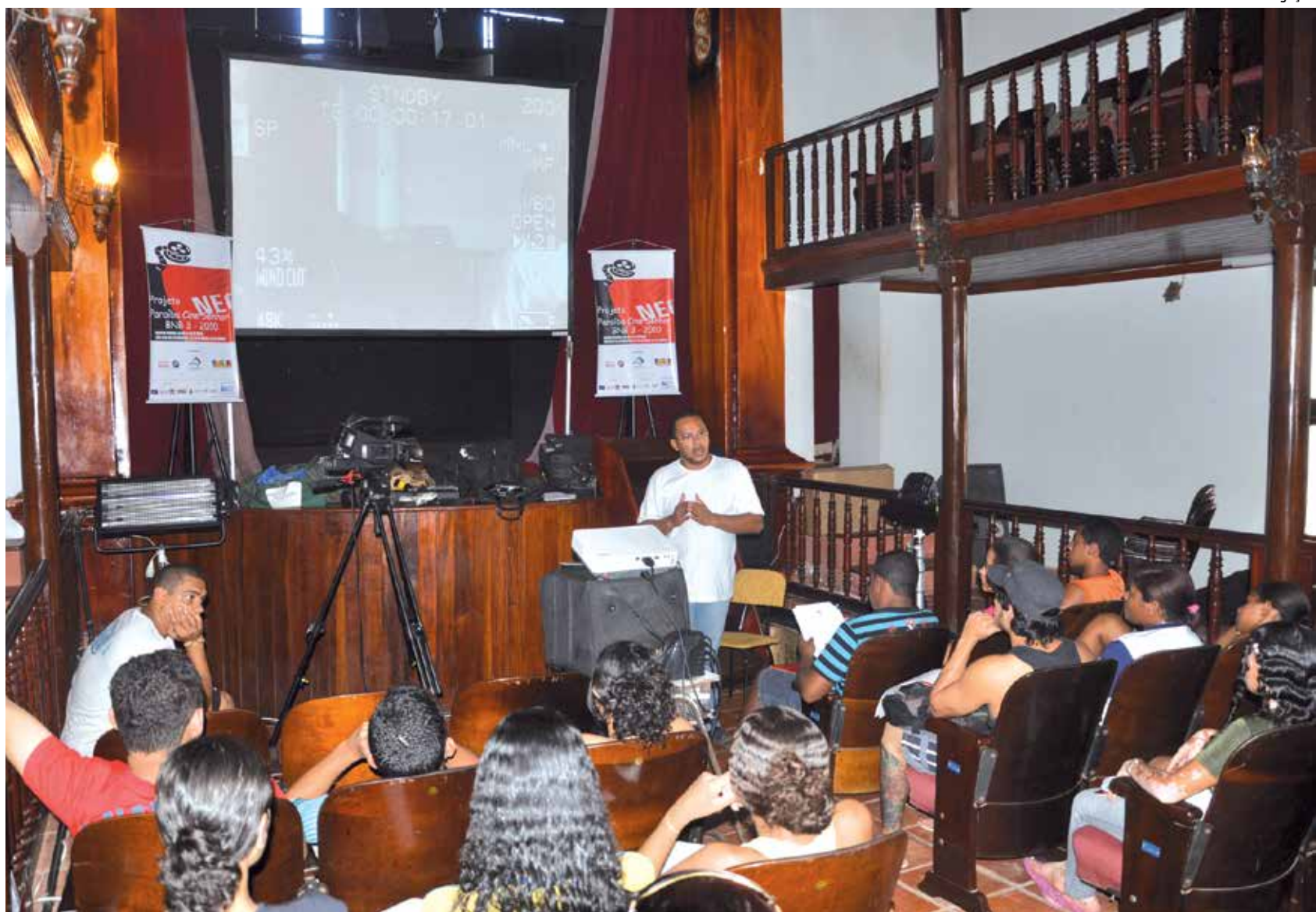
O Teatro Santa Ignez, em Alagoa Grande, recebeu oficinas em uma das edições do Projeto Cine Senhor, que completa cinco anos de atividade

O Projeto Paraíba Cine Senhor, realizado pela Empresa de Serviços Culturais (Emsec) e pelo Grupo Castelo Audiovisual, é composto de 22 oficinas de realização audiovisual, além de três mostras de exibição de filmes e três campanhas socioeducativas. “Como falei anteriormente