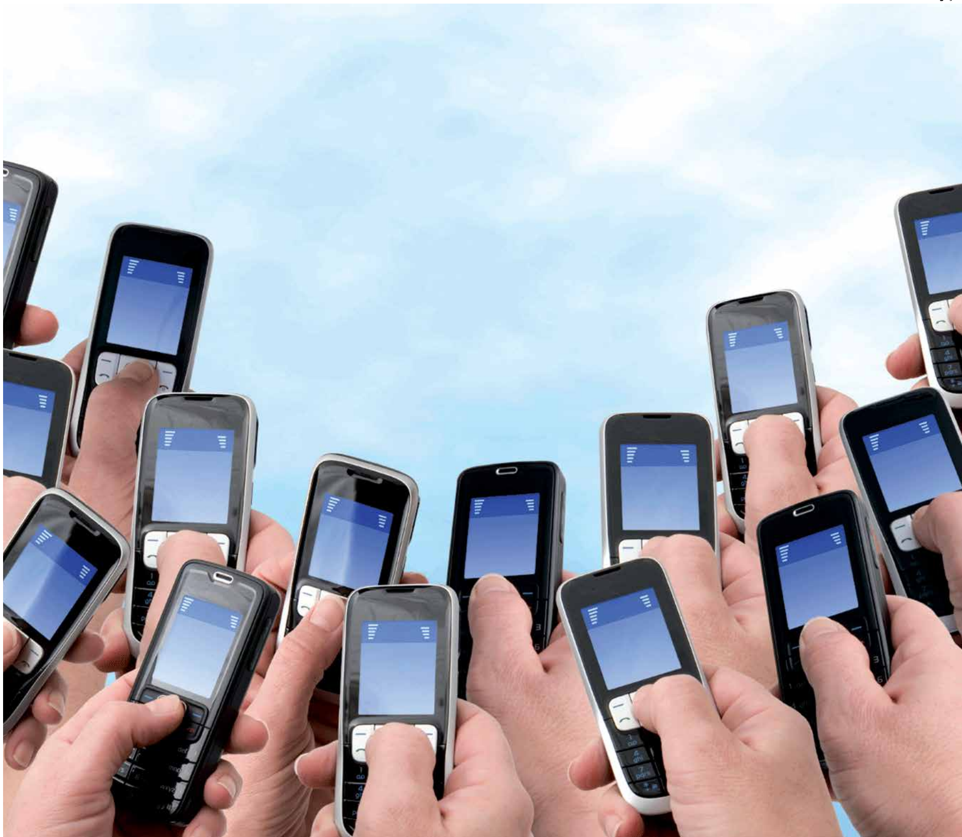
A expectativa da agência reguladora é de que num prazo de seis meses os usuários de telefone celular já perceberão melhoria nos serviços de dados e voz