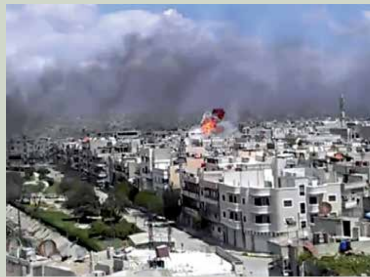
Os confrontos são intensificados entre o governo e os rebeldes

mudar, então, obviamente, a missão será retirada após 30 dias", acrescentou.