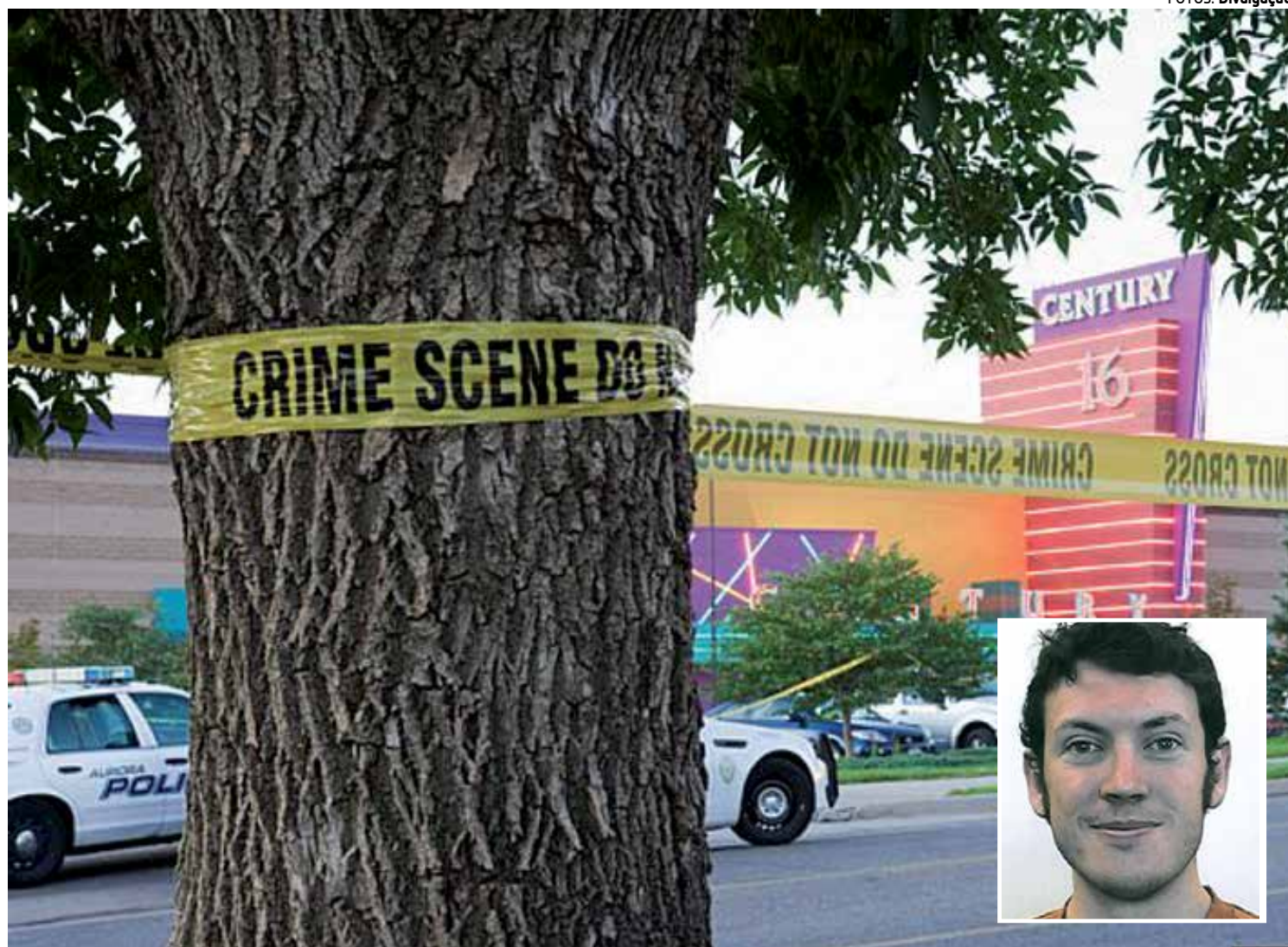
A tragédia aconteceu durante a pré-estreia do filme sobre Batman, quando James Holmes (detalhe) promoveu uma série de tiros

Várias testemunhas afirmaram que Holmes estava fantasiado de "Bane", personagem que mede forças com o Batman no filme e que tem o rosto coberto por uma máscara. Também disseram que ele usava um colete à prova de balas e estava com duas armas de alto calibre. O jovem jogou um tubo com gás lacrimogêneo, pegou uma das