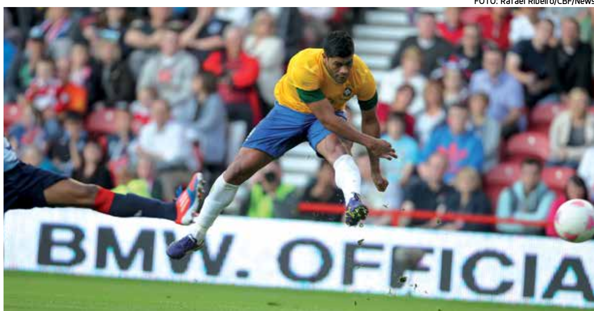
Com Hulk em campo, Seleção Brasileira vence por 2 a 0 a Grã-Bretanha PÁGINA 24