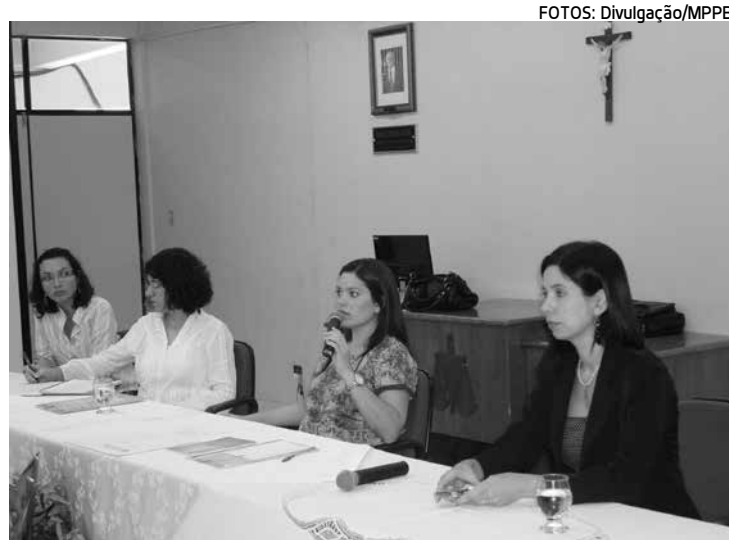
Curso aconteceu no auditório do Tribunal do Júri, em Monteiro

À tarde, foram trazidas as vozes de controle externo, iniciando-se com o Tribunal de Contas do Estado, por