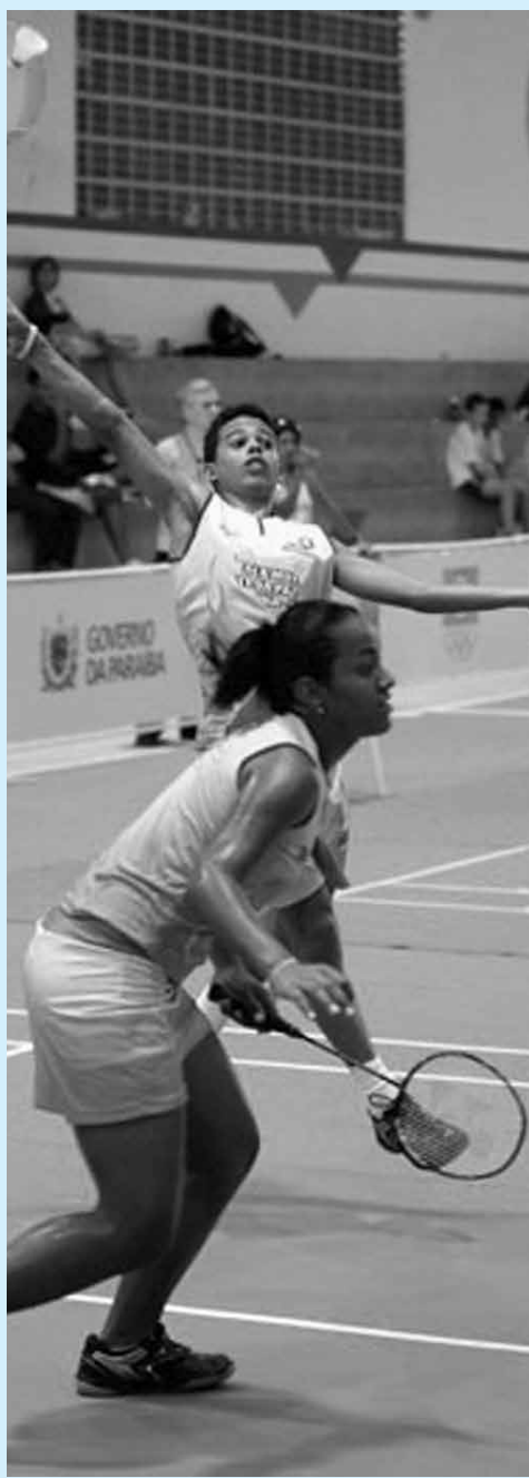
O Badminton vem crescendo bastante

“Hoje o Badminton não é um esporte desconhecido. Desde que o COB botou a modalidade em competições escolares o Badminton cresceu bastante. Aqui na Paraíba muitas escolas vão disponibilizar para os alunos a prática da modalidade. O que falta é só mais apoio para que o Badminton seja mais difundido ainda. É um esporte que qualquer pessoa de qualquer idade pode jogar”, finalizou.