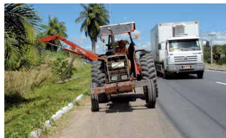
10 máquinas roçadeiras estão sendo utilizadas no serviço