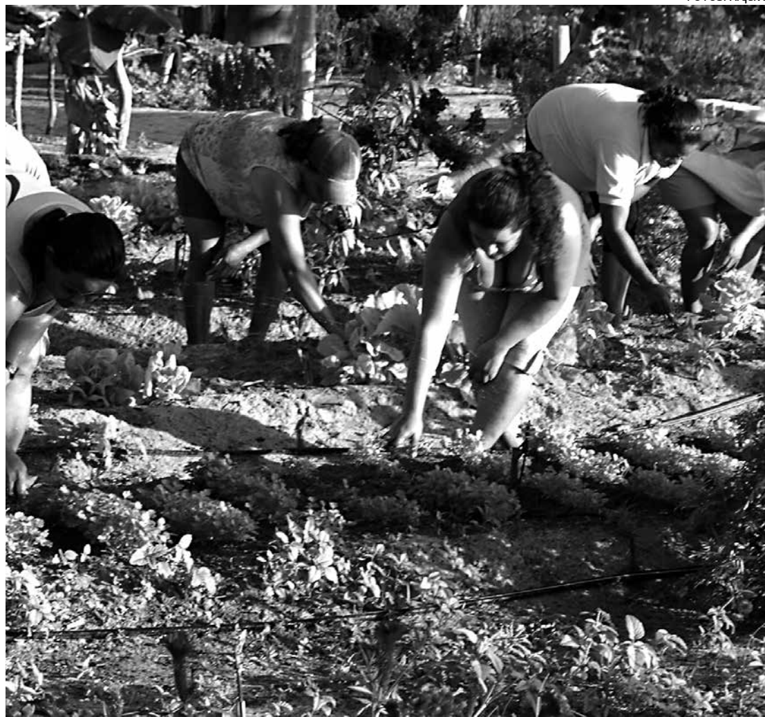
Recursos serão aplicados em ações de inclusão social nas regiões do Cariri e do Seridó paraibano

Está prevista a capacitação de 4 mil jovens, sendo 50% mulheres, que receberão apoio adequado na produção e comercialização dos seus produtos. A política de inclusão social que o projeto vai viabilizar, segundo estimam os técnicos, transformará a região com repercussão em todo o Estado.