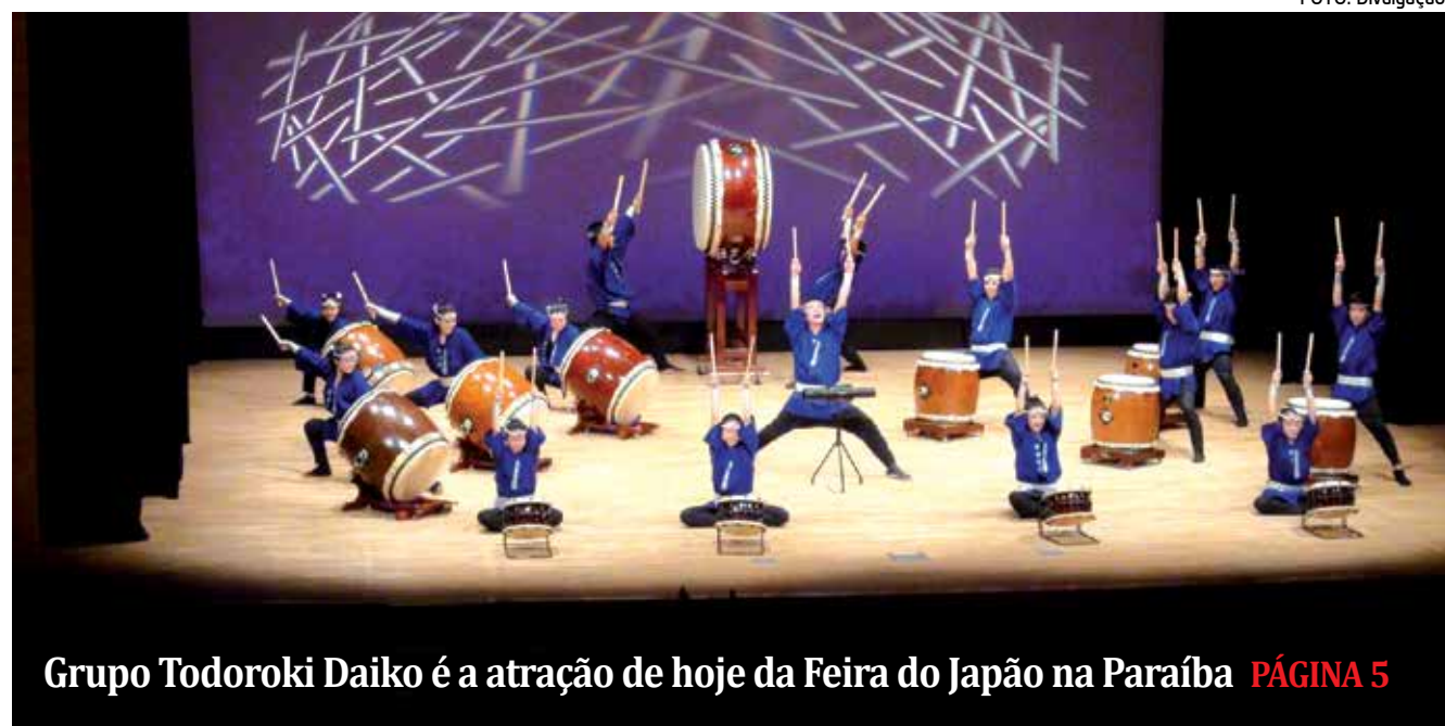
Grupo Todoroki Daiko é a atração de hoje da Feira do Japão na Paraíba PÁGINA 5