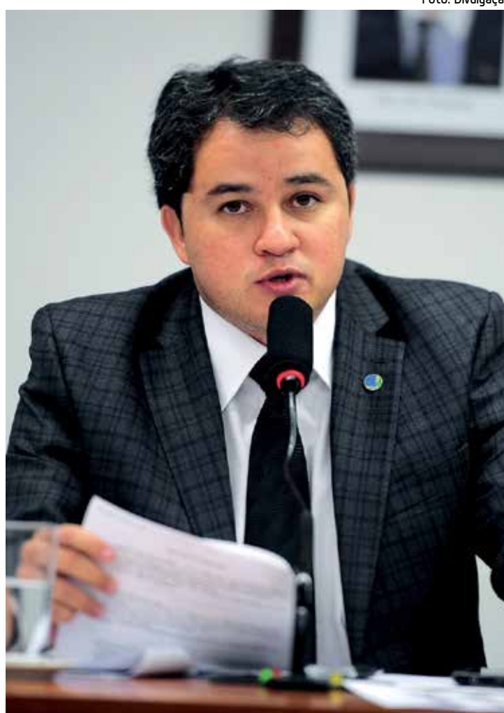
Efraim Filho lembrou que maioria do eleitorado não se decidiu ainda

Além de gerar fonte de renda às famílias, o projeto também proporciona o conhecimento de técnicas próprias, como: melhoramento do solo, das sementes, do plantio, da colheita e da criação de peixes. Além de conferir qualidade ao que está sendo produzido e desenvolvido nas áreas de piscicultura, bananicultura e hortifruticultura.