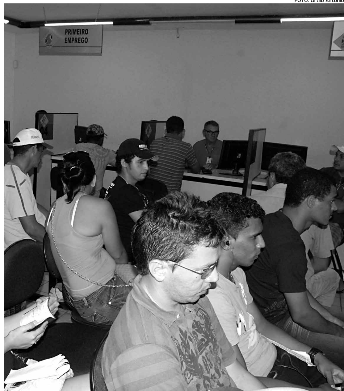
O Sine-PB vem sendo muito procurado por candidatos, que buscam oportunidades de empregos

Os interessados nas vagas podem consultar a lista completa de vagas, na sede do Sine Estadual em João Pessoa, situada na Rua Almeida Barreto, número 520, no Centro, próximo ao Mercado Central. O órgão funciona até as 17 horas e os candidatos devem apresentar identidade, CPF e carteira de trabalho.