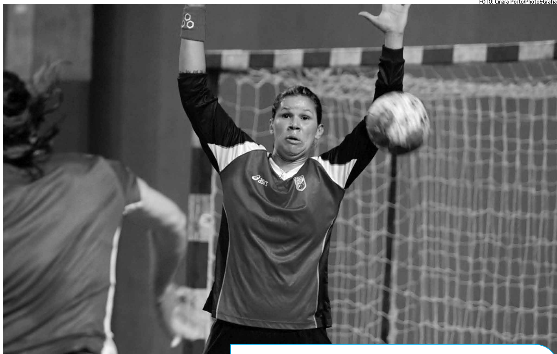
A goleira paraibana em ação durante os treinamentos da Seleção Brasileira que começa hoje a sua caminhada em busca da medalha

A mesma opinião tem a pivô e capitã Dara, na seleção desde 2003. “Já conhecemos e enfrentamos nossas adversárias com frequência. Elas não são mais um bicho pa-