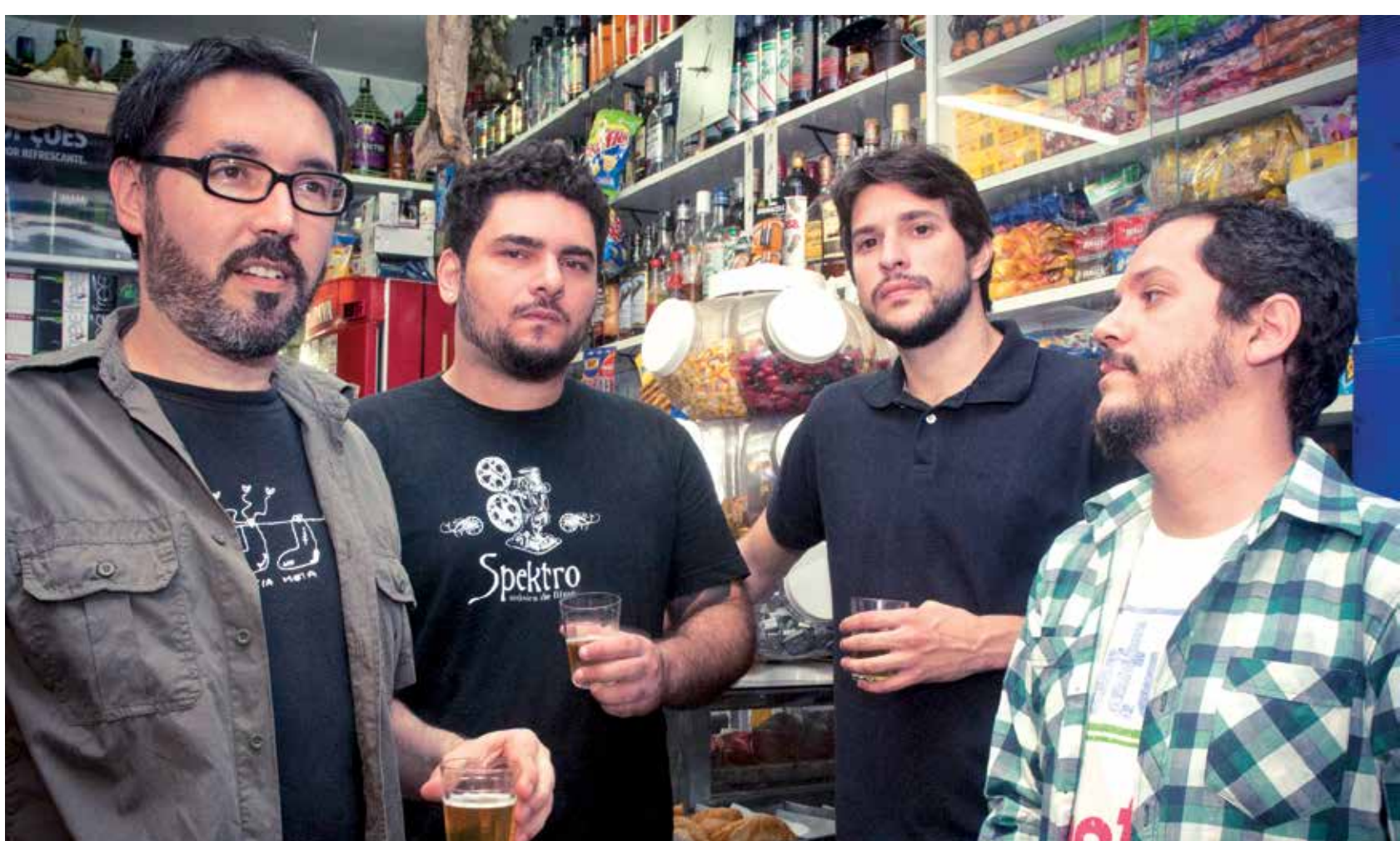
A banda carioca Jason, que volta a se apresentar em João Pessoa depois de cinco anos, vai interpretar músicas no novo álbum