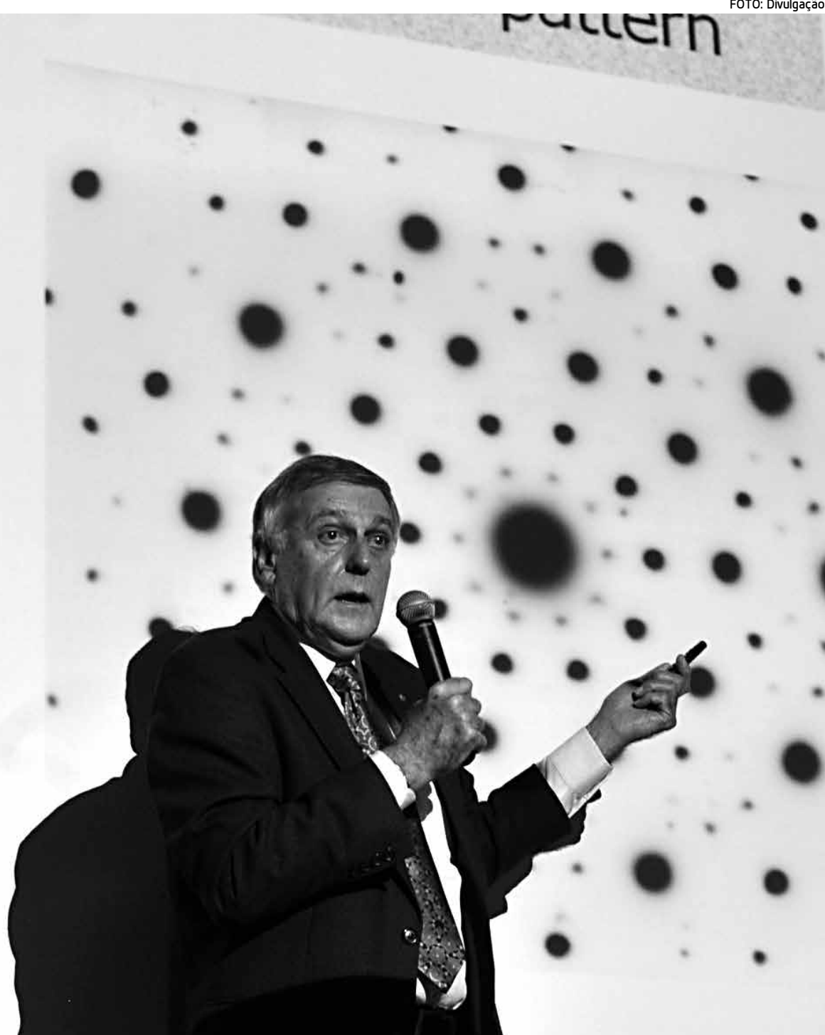
Antes do reconhecimento público, o cientista Daniel Shechtman enfrentou a rejeição de suas ideias por colegas, professores e publicações científicas

distances central spot ots is the mber \tau or \varphi s the “Golden