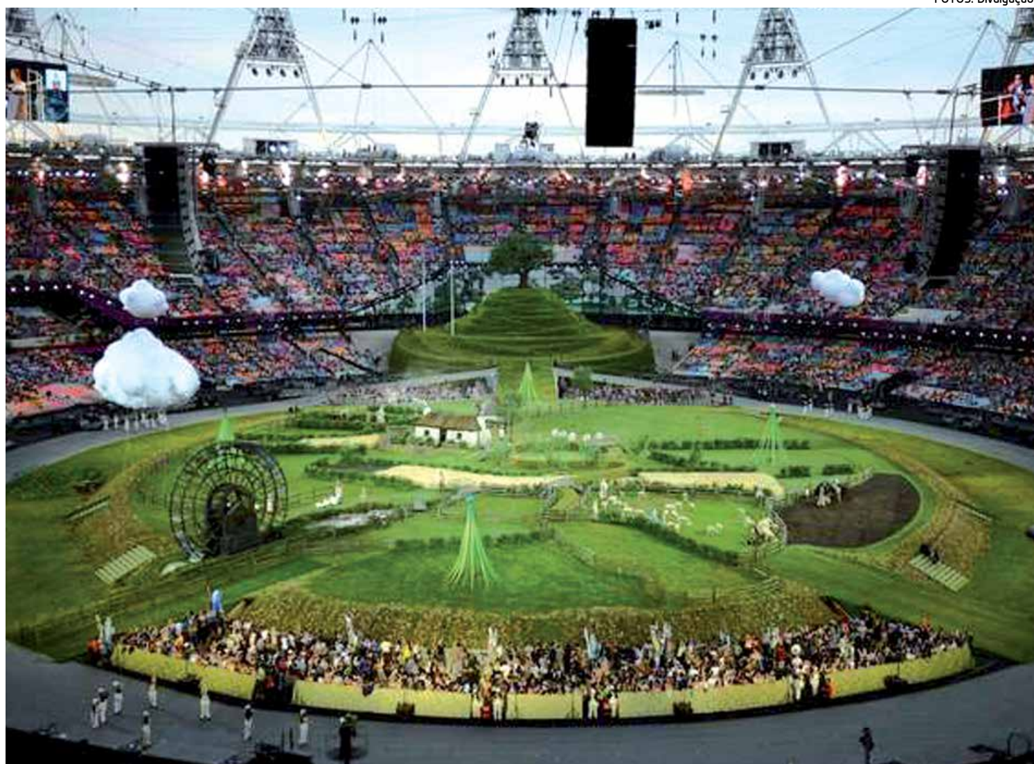
O Estádio Olímpico de Stratford passou por diversas transformações ontem durante a abertura oficial dos Jogos Olímpicos 2012

Londres gastou 9 bilhões de libras esterlinas e quer lucrar 16 milhões com os Jogos Olímpicos. Diante do início do espetáculo, o atraso de obras perde importância, assim como o desfalque na segurança contratada, que mobilizou tropas militares para atuar em revistas.