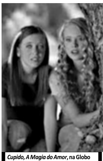
Cupido, A Magia do Amor, na Globo