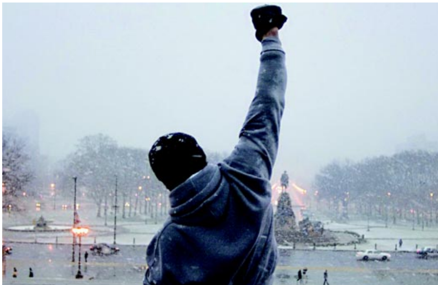
Tubarão (no alto), Guerras Estrelas (acima) e Rocky - O Lutador (ao lado) são filmes com trilhas sonoras clássicas abordadas pelo autor