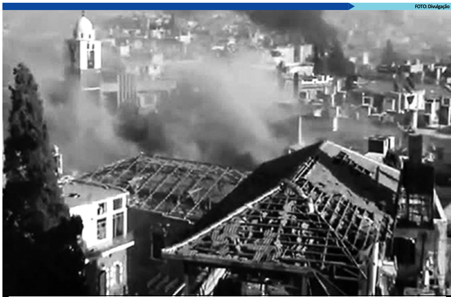
A província de Homs está sendo alvo de intensos bombardeios das forças leais ao ditador do Bashar Al Assad, que é pressionado para deixar o país

Os combates se intensificaram nos últimos dias em várias cidades do país e atingiram Damasco. O Exército Sírio Livre (ESL), formado principalmente por militares dissidentes, aumenta cada vez