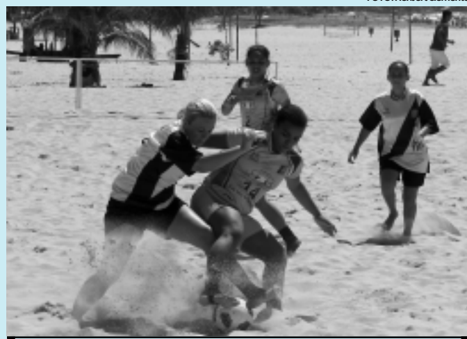
As meninas da Juventude Brasileira mostraram mais qualidade