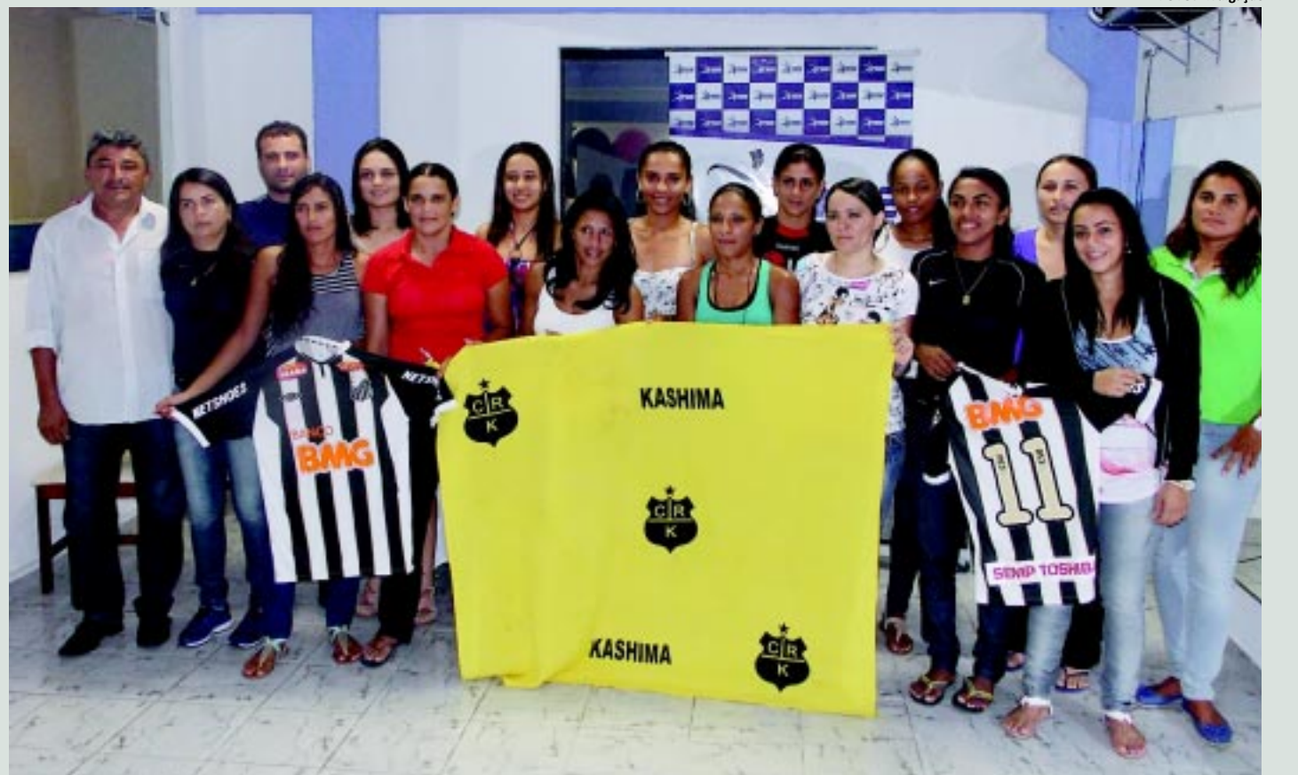
Jogadoras que fizeram sucesso no Botafogo trocaram, todas, de clube e vão defender a equipe do Cristo Redentor no Certame Estadual

Dú foi revelado pelo Nacional de Patos na temporada de 2010 e disputou a Copa São Paulo de Juniores de 2011 quando despertou o interesse de outros clubes. Seu passe pertence ao Treze Futebol Clube.