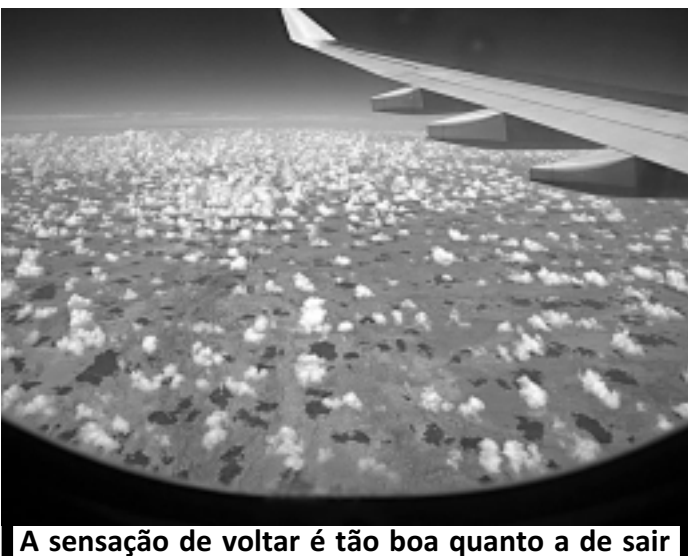
A sensação de voltar é tão boa quanto a de sair

Desço a escadinha da aeronave com esta reflexão: é bom sair da rotina em busca da aventura, mas, voltar à rotina bem que é gostoso.