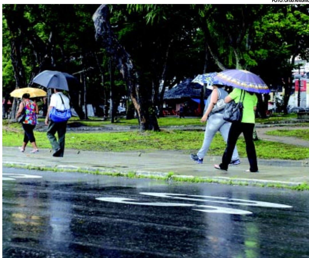
Os meses de junho e julho são os que registram os maiores índices de chuva na faixa litorânea da Paraíba