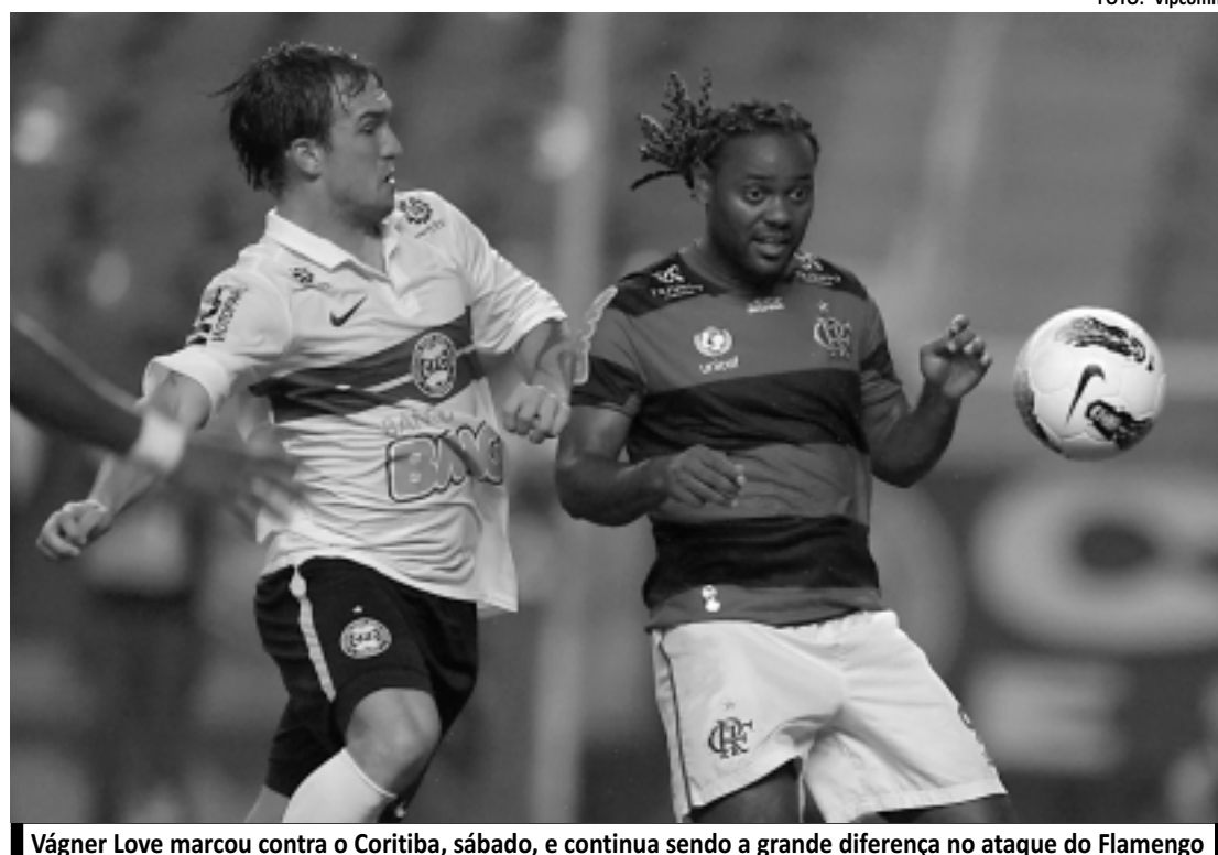
Vágner Love marcou contra o Coritiba, sábado, e continua sendo a grande diferença no ataque do Flamengo

Os jogadores do Flamengo receberam dois dias de folga da comissão técnica. A reapresentação está marcada hoje, às 9h30, na Gávea. Na ocasião, o time começa a se preparar para o confronto contra o Santos e a sequência no Brasileiro 2012.