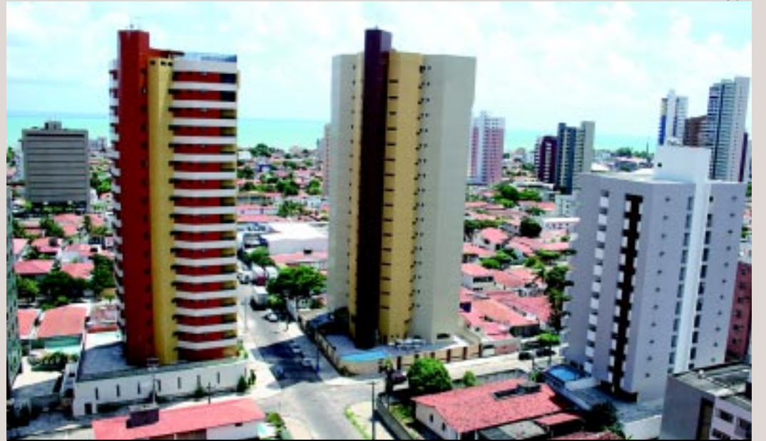
Contratos de aluguel de imóveis pelo Índice Geral de Preços - Mercado (IGP-M) devem subir menos