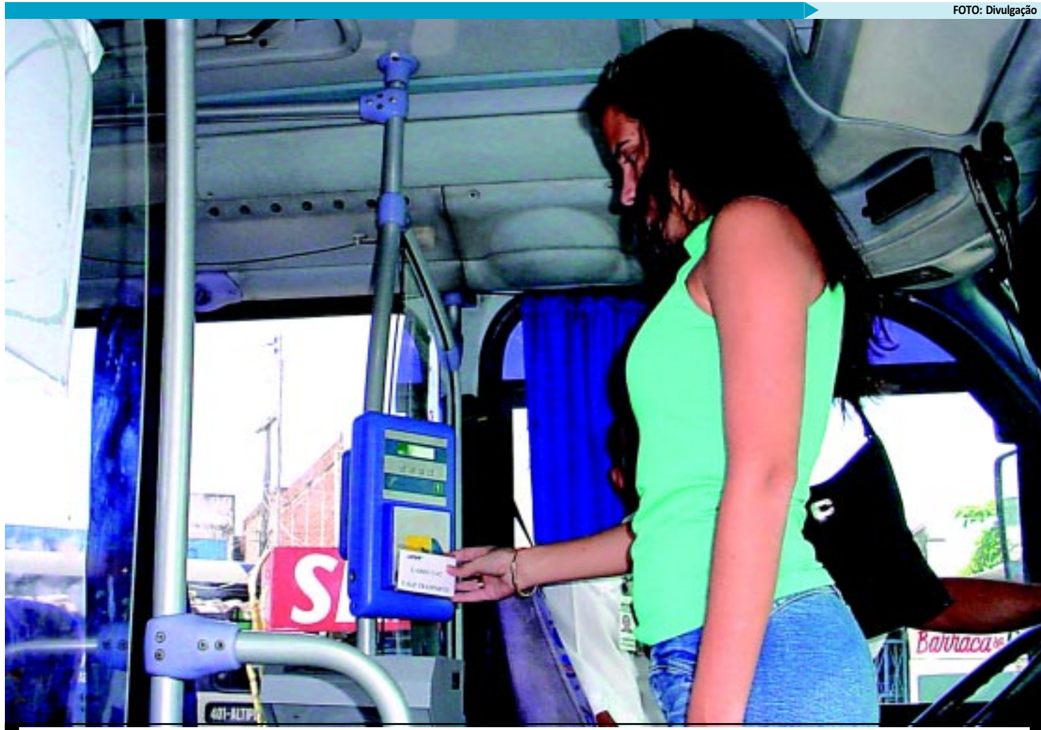
Foi dado um prazo de 72 horas para que o atendimento através do cartão de passagem nos transportes coletivos de João Pessoa seja normalizado