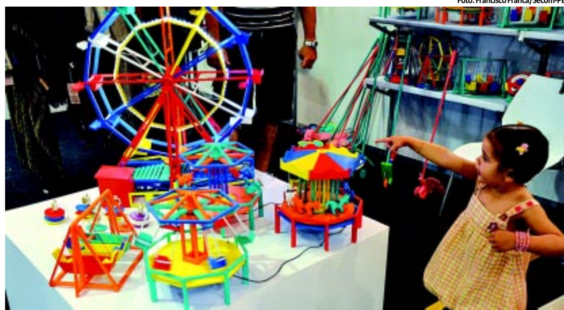
Salão de Artesanato Paraibano, que acontece em Campina, deve registrar aumento de 20% nos negócios

O ministro do STJ, Marcos Buzzi, reconheceu que a vaga na Série C do Brasileirão é do Treze. PÁGINA 16