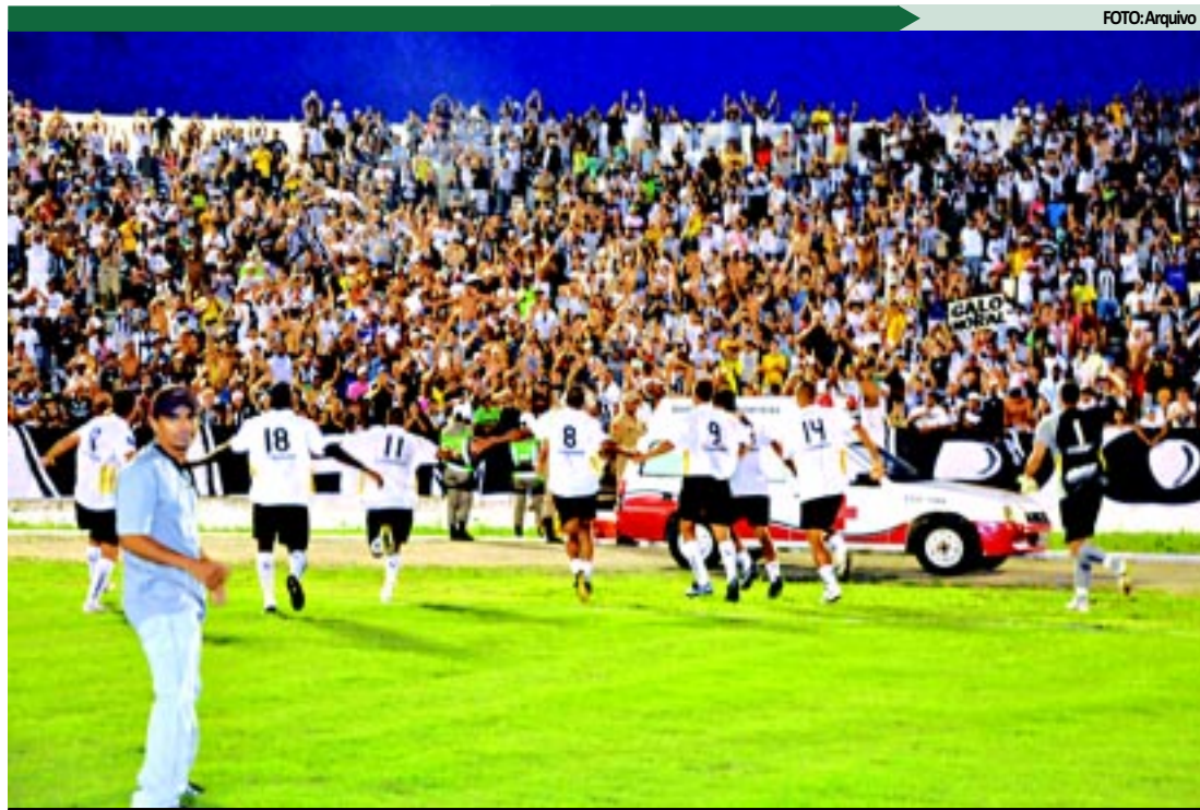
A equipe do Treze com um "pé" na vaga continua se preparando para sua possível estreia na competição

Ao expedir a liminar, o ministro do STJ designa a juíza Ritauro Rodrigues, da 1ª Vara Cível de Campina Grande, como competente para "resolver as medidas urgentes" e torna sem validade as limitações conquistadas pelos outros dois clubes na Justiça do Acre