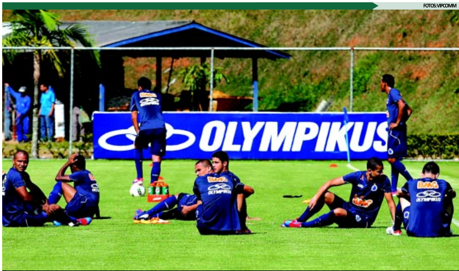
O Cruzeiro, que joga contra o Figueirense, terá o apoio de sua imensa torcida, em Belo Horizonte, e precisa vencer para tentar chegar aos líderes