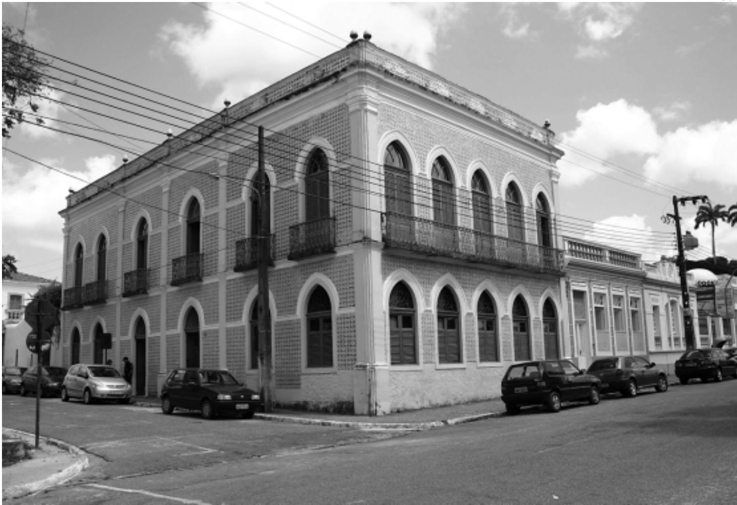
Em João Pessoa, o processo de votação para a comissão será no Casarão dos Azulejos, sede da Secretaria de Cultura