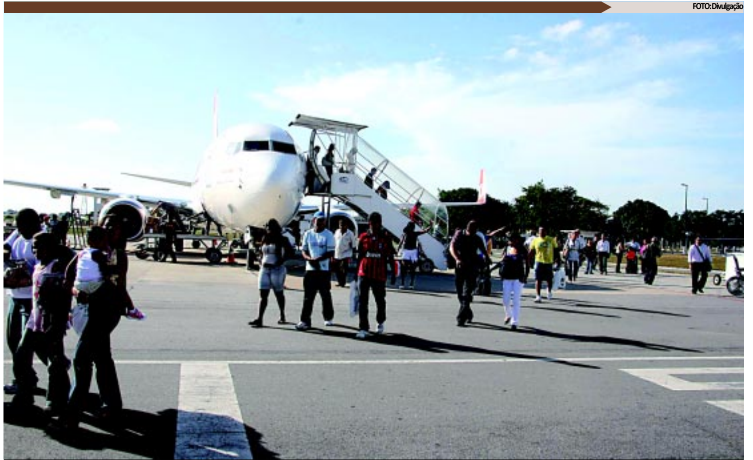
Segundo a Infraero, foi registrado um crescimento de 25,72% nos embarques e desembarques no Aeroporto Presidente Castro Pinto, em maio

"A partir da abertura do Centro de Convenções teremos condições de ampliar essas estatísticas e iniciar o trabalho junto aos empresários para que iniciem investimento na ampliação da rede hoteleira, entre outros segmentos para atender a demanda de turistas que será ainda mais crescente", afirmou a executiva.