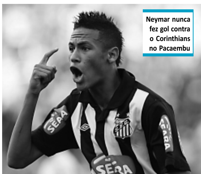
Neymar nunca fez gol contra o Corinthians no Pacaembu

Na próxima quarta-feira, na partida de volta das semifinais, uma coisa é certa independentemente do resultado: algum desses tabus envolvendo Corinthians e Santos vai cair no Pacaembu.