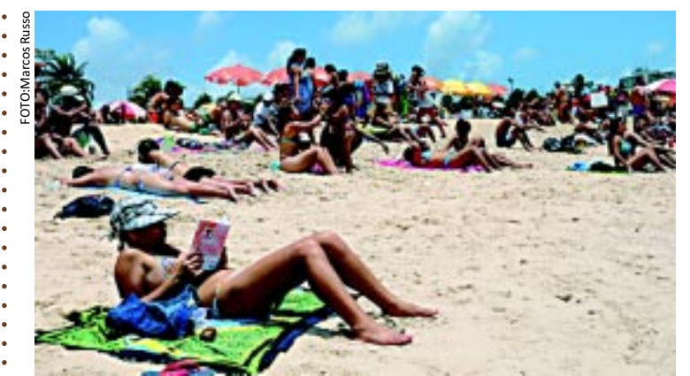
[FOTO&LEGENDA] A Sudema classificou 52 praias como próprias para banho, variando entre excelente, muito boa e satisfatória. A classificação é válida até 22 de junho.