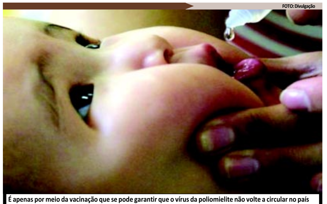
É apenas por meio da vacinação que se pode garantir que o vírus da poliomielite não volte a circular no país

INCUBAÇÃO - O período de incubação (tempo que demora entre o contágio e o desenvolvimento da doença) é, geralmente, de 7 a 12 dias, podendo variar de 2 a 30 dias. O poliovírus se desenvolve na garganta ou nos intestinos e, a partir daí, espalha-se pela corrente sanguínea, ataca o sistema nervoso e paralisa os músculos das pernas. Em outros casos, pode até matar, quando o vírus paralisa músculos respiratórios ou de deglutição.