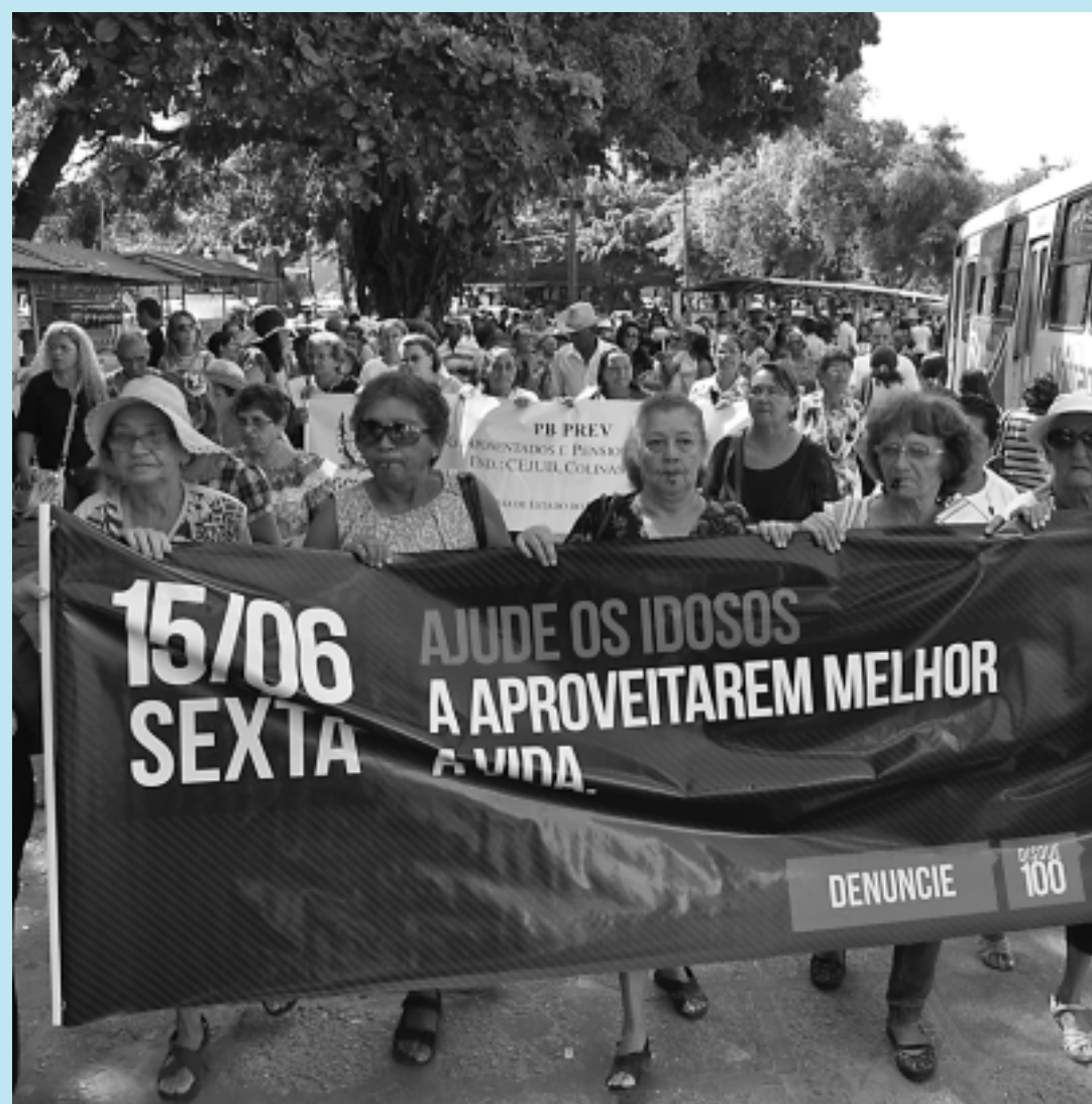
Idosos de vários municípios da Paraíba, conduzindo faixas, fizeram ontem uma caminhada na Lagoa

Segundo a coordenadora, além dos dados apresentados, existem outras violências contra a pessoa idosa que não são notificadas, já que, essas pessoas sofrem violência em casa e não procuram os centros de referências de combate, que possuem assistência psicopedagógica. "A população