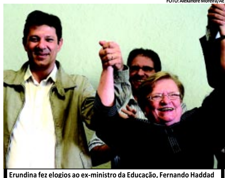
Erundina fez elogios ao ex-ministro da Educação, Fernando Haddad

Em quase 40 minutos de discurso, Erundina admitiu que relutou em aceitar a proposta de compor a chapa petista. "Confesso que não foi uma decisão fácil, que relutei muito em aceitá-la", ressaltou. Segundo ela, a resistência não ocorreu por causa do candidato, mas porque ela não queria deixar seu trabalho na Câmara.