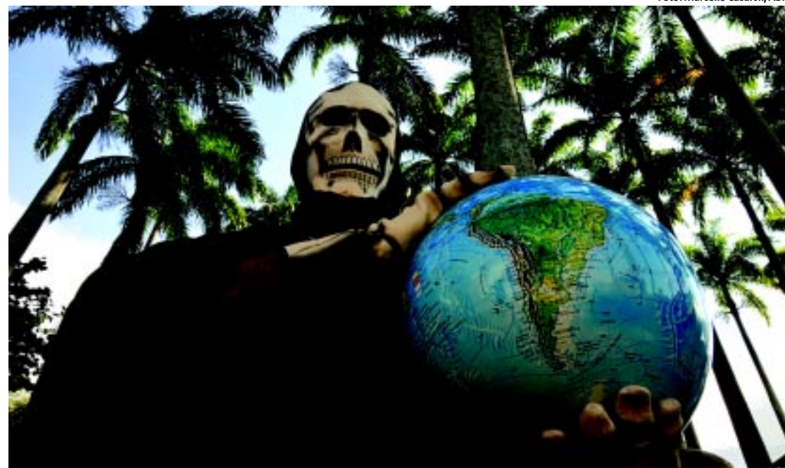
ESPORTE | Protesto pela preservação do meio ambiente durante a Conferência Rio+20

ções municipais de outubro. As cartas de convocação começarão a ser enviadas no final deste mês. Somente na Capital vão funcionar 1.210 seções eleitorais. PÁGINA 3