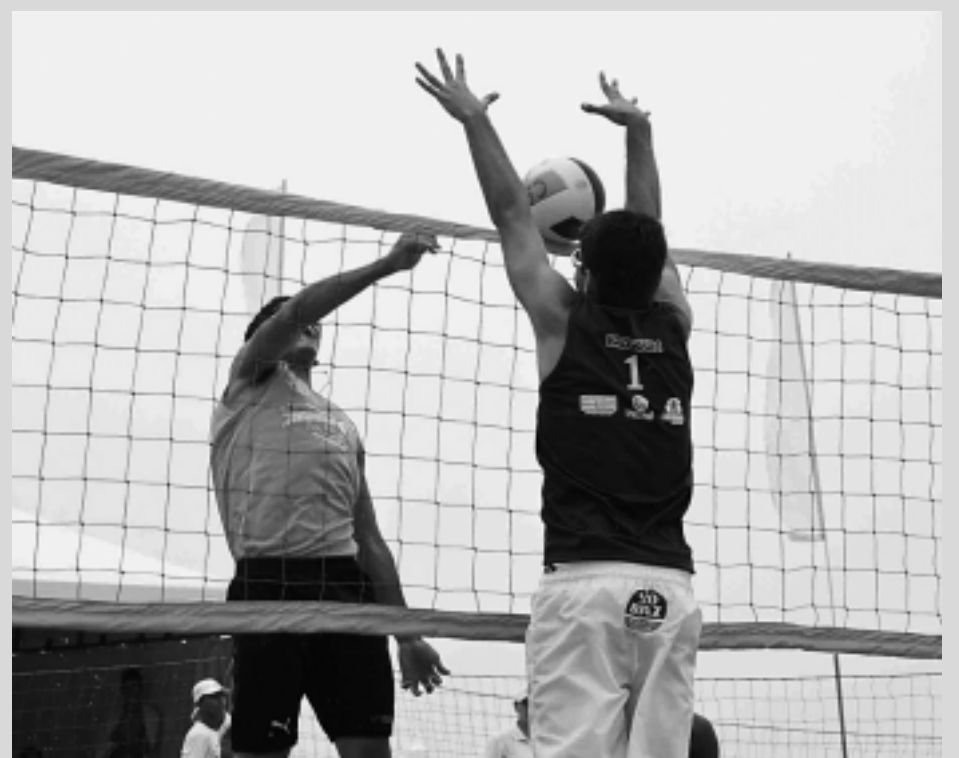
A fase principal do torneio começa hoje com a participação de vários atletas paraibanos

Na fase principal, as duplas serão divididas em quatro chaves. Após os confrontos internos, avançam à segunda fase as duas melhores parcerias em cada grupo. A partir daí, a competição