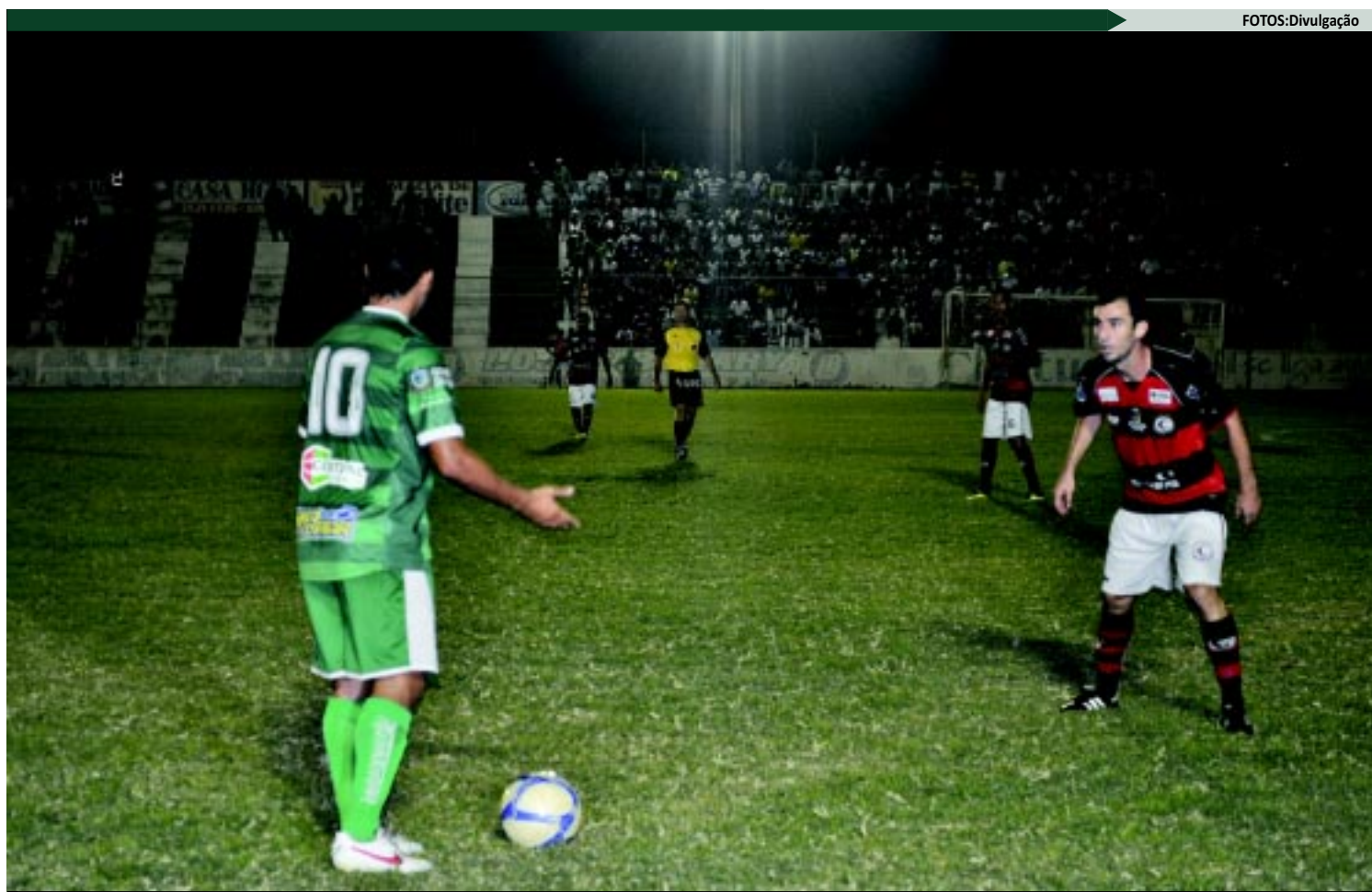
Sousa e Campinense à espera de uma decisão da CBF sobre a Série D e para evitar maiores despesas desistiram de amistosos no final de semana