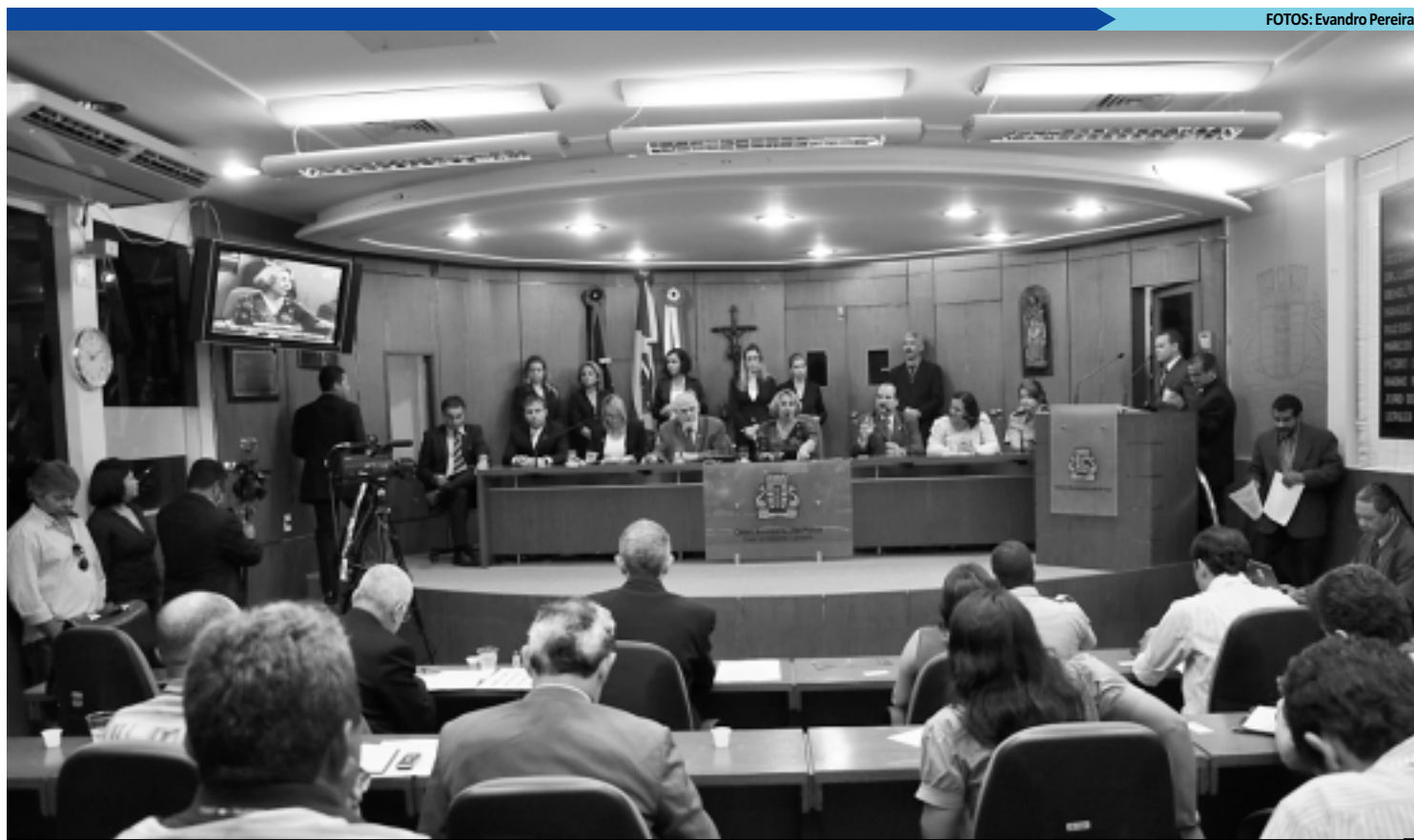
A exploração sexual de crianças e adolescentes no Estado foi debatida ontem em audiência pública realizada na Câmara Municipal de João Pessoa

A presidente da CPI, deputada Erika Kokay (PT/DF),