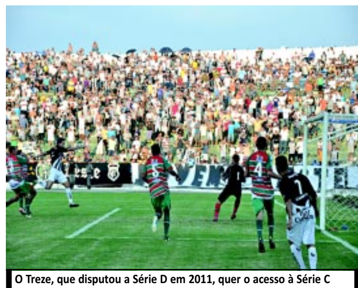
O Treze, que disputou a Série D em 2011, quer o acesso à Série C