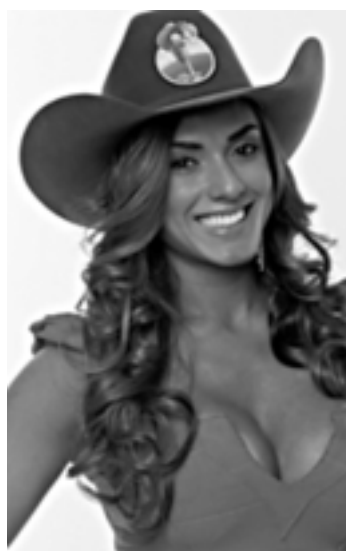
A Fazenda, na Record