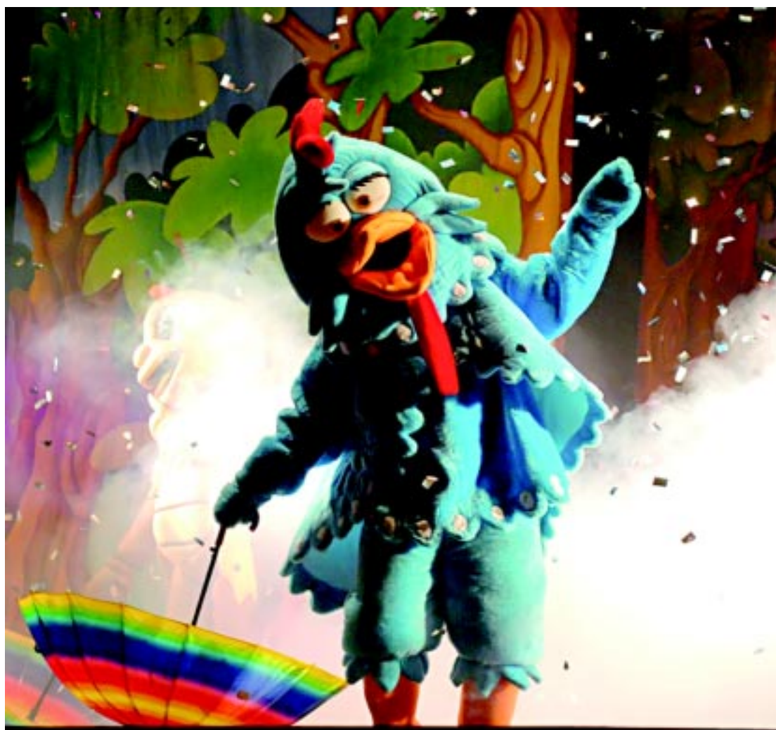
A Galinha Pintadinha conquistou as crianças por causa da explosão de cores e movimentos