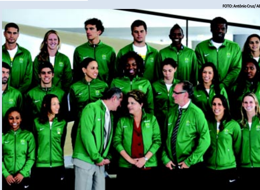
Presidente tirou fotos com o grupo e vestiu um agasalho oficial da delegação, com o nome dela escrito