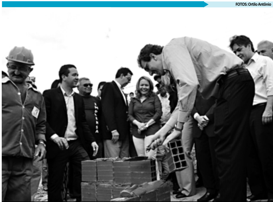
O evento, ocorrido na manhã de ontem em Campina, contou com a participação de diversas autoridades

A instituição realiza 6.450 atendimentos por dia em 13 unidades distribuídas pelo Brasil. Campina Grande é a segunda cidade do Nordeste a receber uma unidade, a primeira foi Recife.