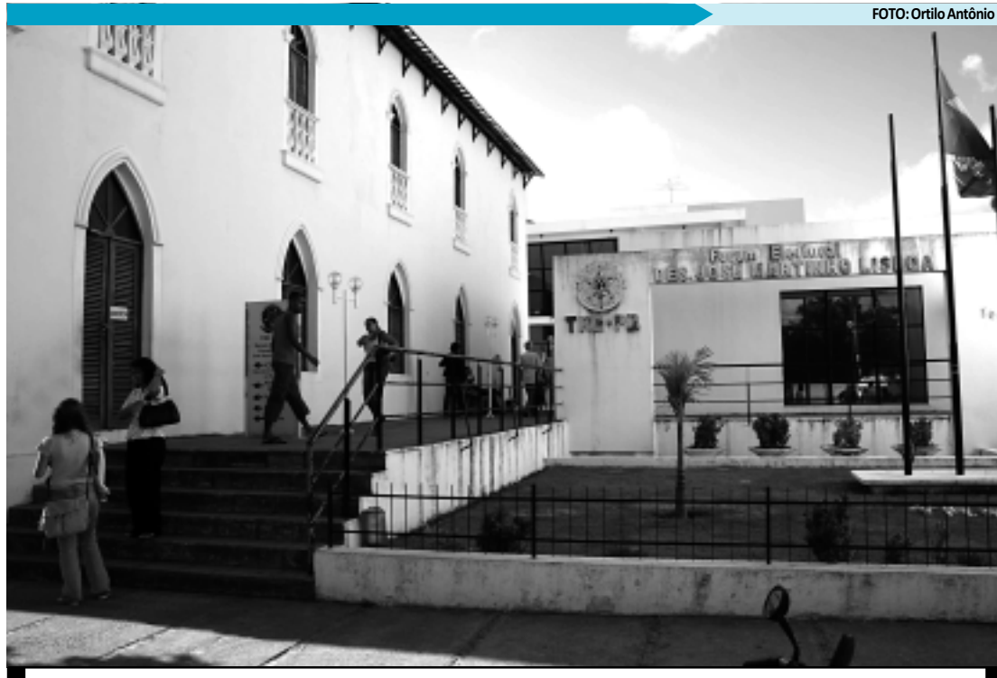
Os bancos de dados estão sendo atualizados pelos cartórios eleitorais responsáveis pela convocação

Na Capital, as 1.210 urnas serão montadas em 192 locais de votação, para atender um eleitorado de cerca de 470 mil eleitores. Em toda a Paraíba, que tem um eleitorado de 2,7 milhões, serão 9.270 seções, distribuídas em 1.779 locais de votação.