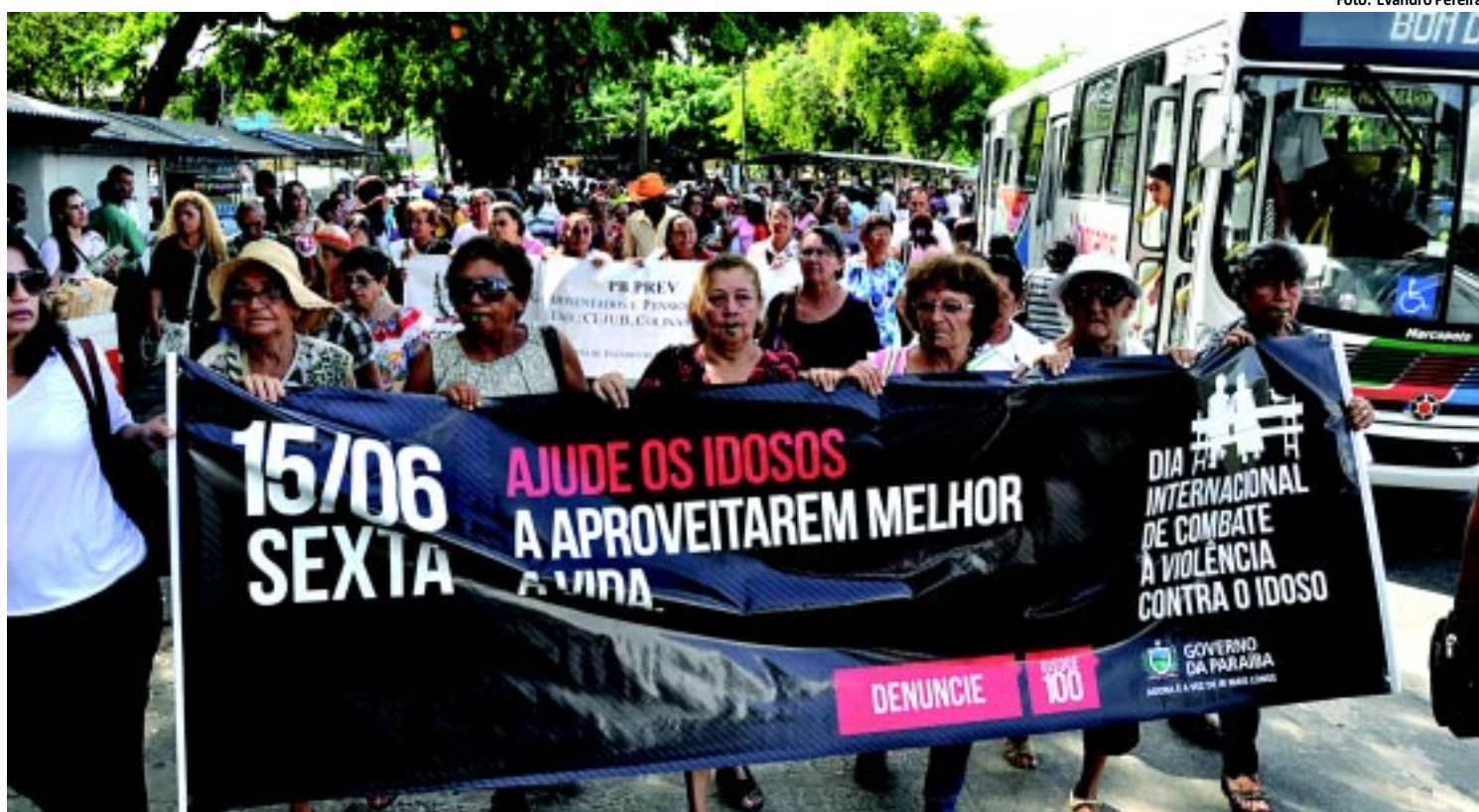
CIDADANIA | Caminhada na Lagoa e panfletagem pediram o fim da violência contra os idosos PÁGINA 11

Estado recebeu 442.772 visitantes. Em todo o ano passado, a Paraíba recebeu 990 mil turistas. O levantamento mostrou, ainda, que a ocupação média no setor hoteleiro paraibano no mesmo período cresceu 3,69%. PÁGINA 12