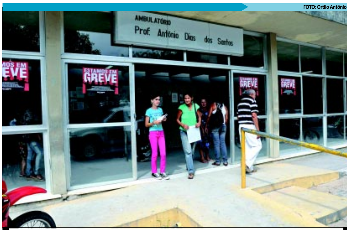
Boa parte das cirurgias pediátricas do HU vem sendo encaminhadas para o Hospital Arlinda Marques, em Jaguaribe

No mês passado, nove médicos foram classificados