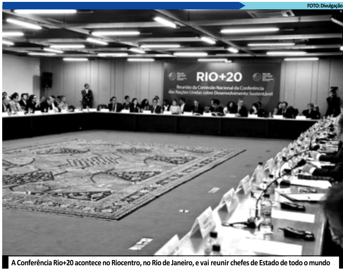
A Conferência Rio+20 acontece no Riocentro, no Rio de Janeiro, e vai reunir chefes de Estado de todo o mundo

"Não há plano B", garantiu Seth, referindo-se à possível apresentação de um texto alternativo ao que já vem sendo negociado - como já ocorreu em outras conferências, como a da Convenção do Clima em Copenhague, em 2009, quando um grupo de presidentes da Europa e dos Estados Unidos acabou produzindo um documento próprio de última hora para evitar um fracasso total do encontro. Seja qual for o formato escolhido pelo Brasil, ele garantiu que será um processo "transparente".