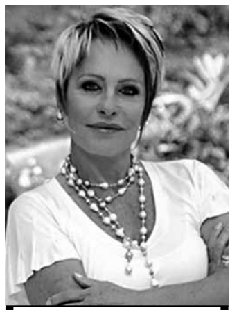
Mais Você, na Globo

dos Irlandeses 17h47 - Globo Notícia 17h50 - Malhação 18h20 - Amor Eterno Amor 19h10 - Jpb - 2ª Edição 19h30 - Cheias de Charme 20h30 - Jornal Nacional 20h55 - Avenida Brasil 21h40 - Futebol 2012 - Taça Libertadores - Corinthians x Santos 23h50 - Gabriela 00h10 - Jornal da Globo 00h40 - Programa do Jô 02h10 - Mentecriminosas 03h00 - Corujão I