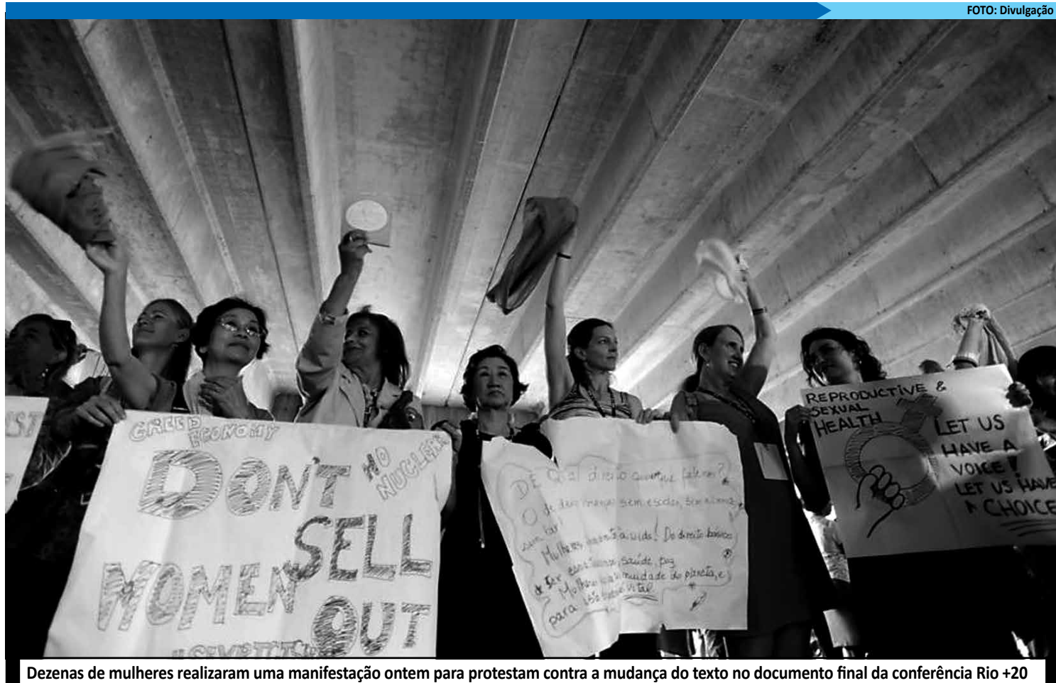
Dezenas de mulheres realizaram uma manifestação ontem para protestar contra a mudança do texto no documento final da conferência Rio+20

Um dos principais resultados esperados pelo Brasil no texto acabou não saindo: a decisão de lançar o embrião de um acordo para a proteção de áreas mari-