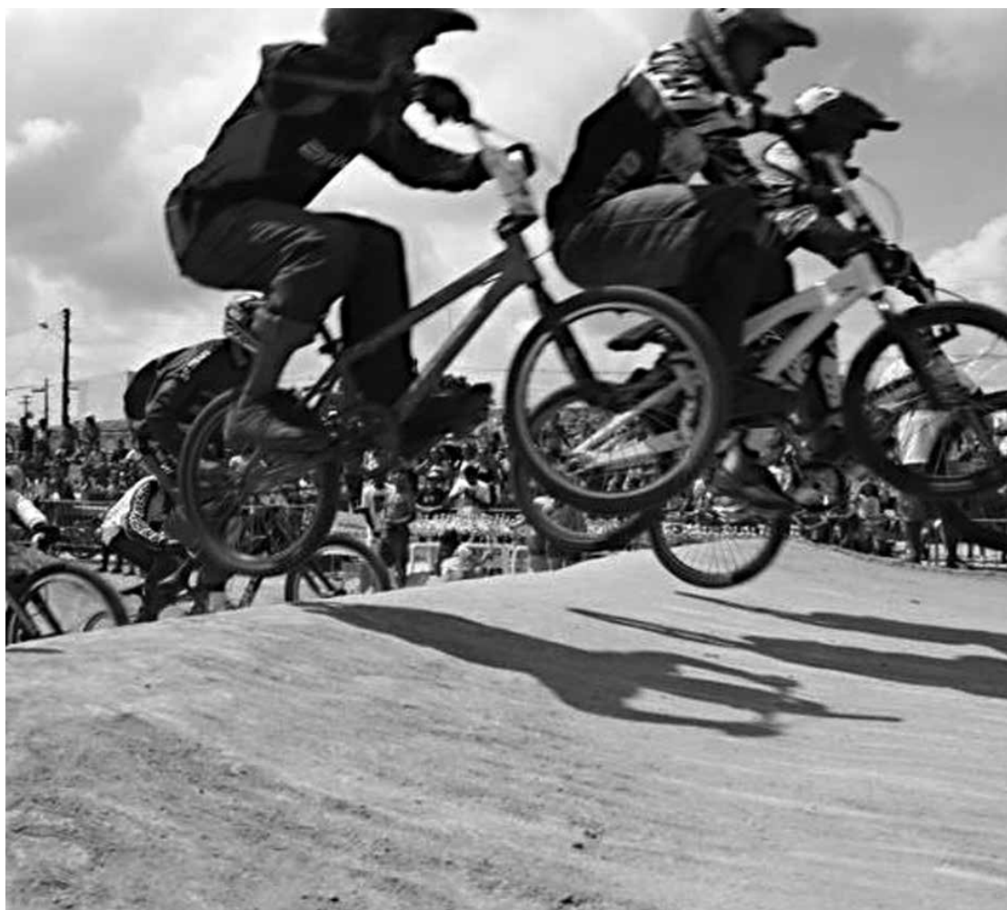
Depois da Copa do Nordeste, disputada em Mangabeira no domingo passado, pilotos já pensam no Brasileiro

A segunda etapa da Copa Nordeste Brasil de Bicicross será disputada em Natal, no mês de setembro, em data ainda a ser confirmada pela federação local.