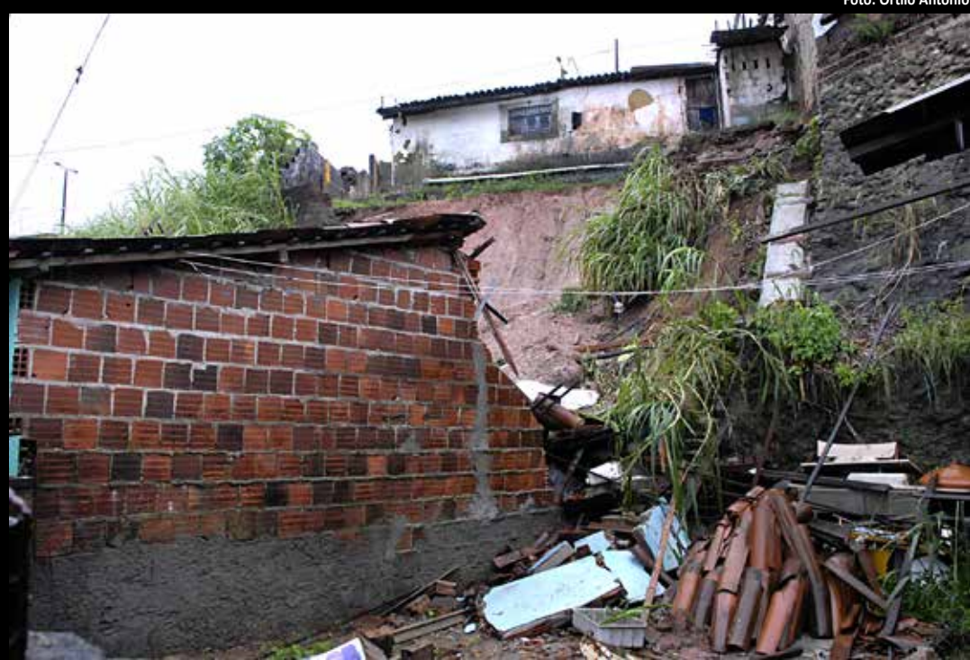
Desmoronamento de barreira na Saturnino de Brito deixou uma jovem ferida