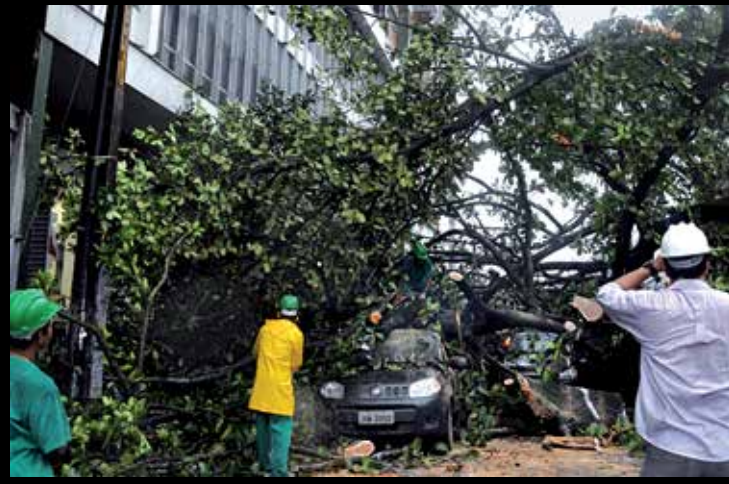
Uma árvore caiu e danificou quatro carros na Lagoa, enquanto que a Defesa Civil registrou desabamento na Comunidade do Timbó