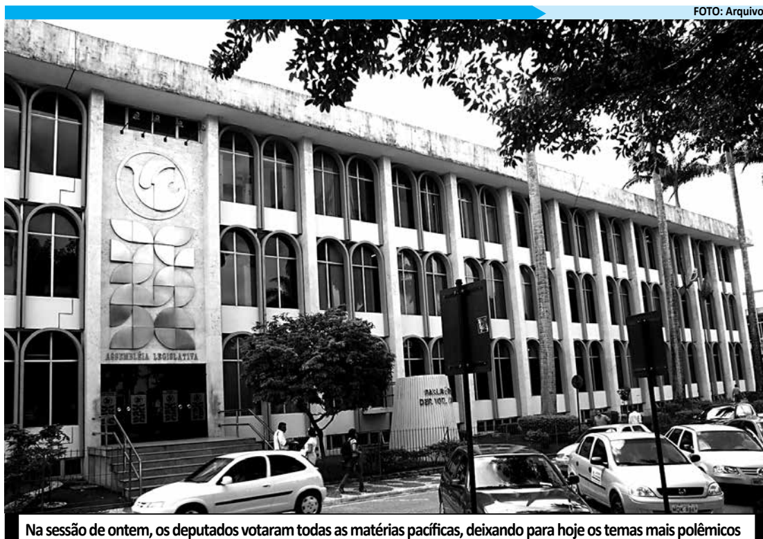
Na sessão de ontem, os deputados votaram todas as matérias pacíficas, deixando para hoje os temas mais polêmicos

Os candidatos, partidos políticos e coligações também passarão a ter direito, a partir de domingo, ao direito de resposta quando forem atingidos, mesmo que de forma indireta, por conceito, imagem ou afirmação caluniosa, difamatória, injuriosa ou sabidamente inverídica, difundidas por qualquer veículo de comunicação social.