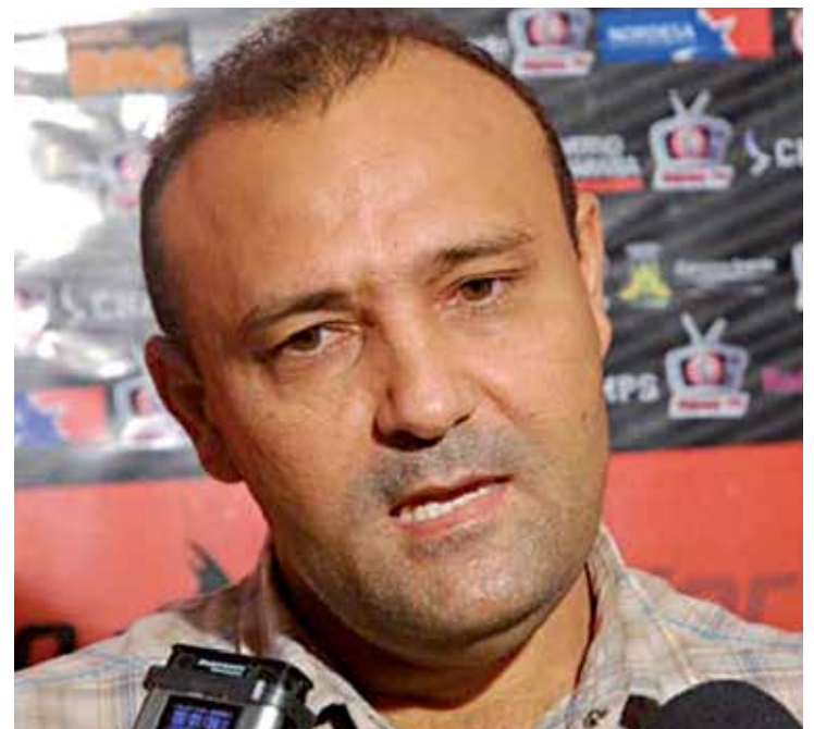
Para William, se os outros times desistiram é porque a situação não é boa