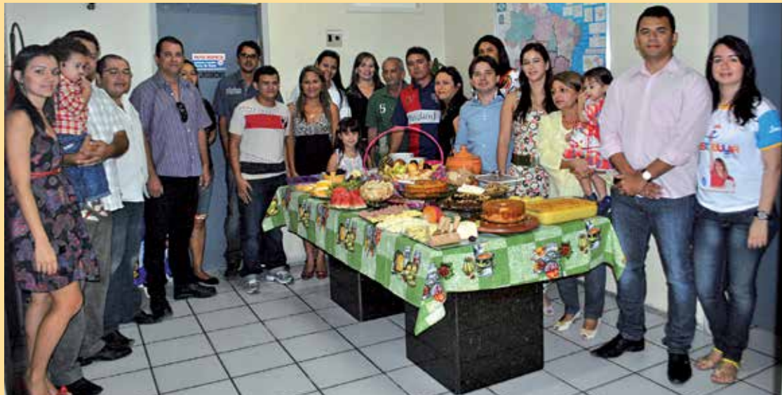
Os funcionários da Ecoplan no café da manhã