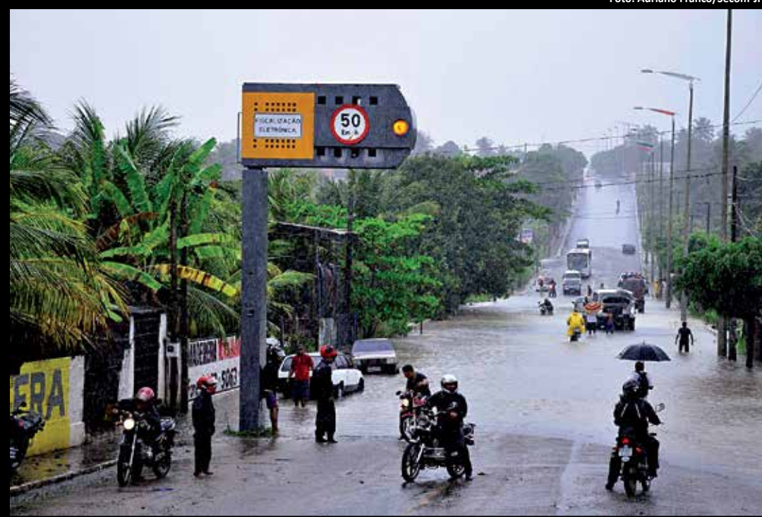
Acesso entre os bairros de Mangabeira e Valentina ficou bloqueado pelas águas