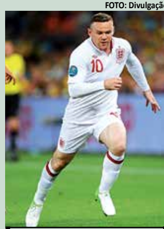
Rooney marcou o único gol

colocação do Grupo D e vão ter que encarar nas quartas a Espanha, duelo que o treinador Laurent Blanc gostaria de evitar. Segundo porque os franceses, que não perdiam desde setembro de 2010, em duelo contra a Bielorrússia, deixaram cair uma invencibilidade de 23 jogos. A partida contra a Fúria será no próximo sábado, em Donetsk. Amanhã começa as quartas de final com República Tcheca e Portugal às 15h45 em Varsóvia, na Polônia.