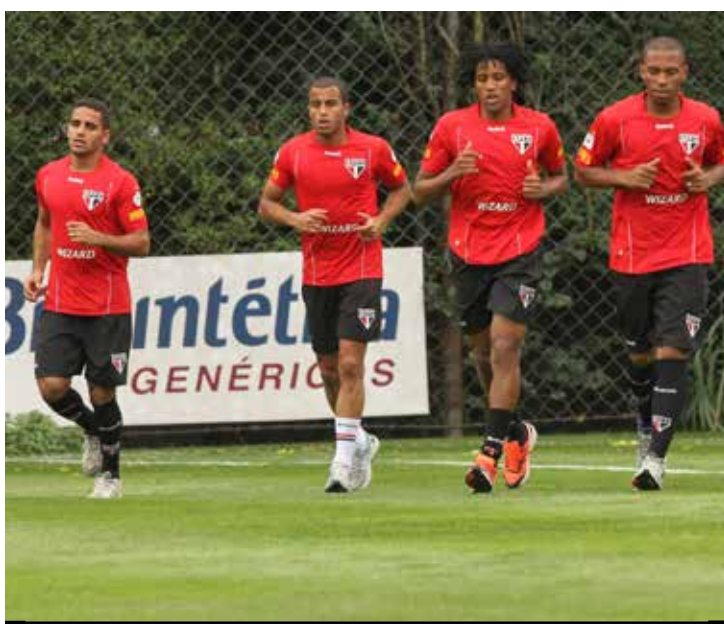
O São Paulo pode ficar com a vaga na final mesmo perdendo jogo

Já o técnico do time paranaense, Marcelo Oliveira, tem dois problemas para escalar a equipe