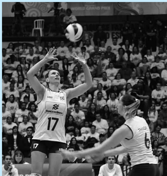
Em Londres, a seleção vai defender o título conquistado em 2008