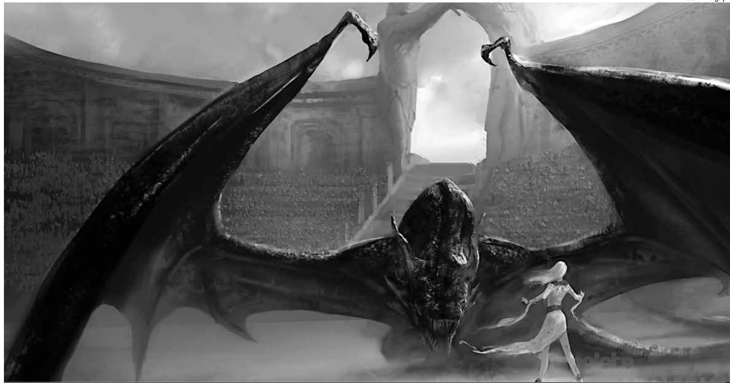
A Dança dos Dragões seria, originalmente, o quarto romance da série, destinado a cobrir um longo período de tempo na história