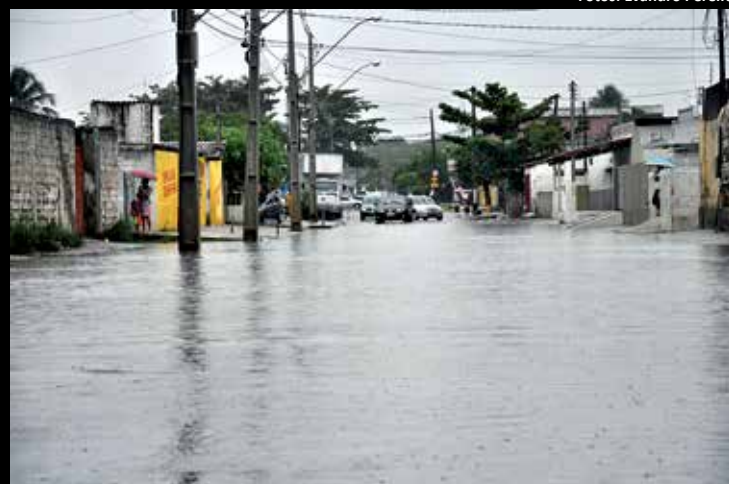
Diversas vias tiveram o trânsito interrompido pelos alagamentos e o pessoense precisou de paciência para enfrentar a chuva

do gravemente uma adolescente de 17 anos. Em vários bairros, as galerias pluviais não deram vazão ao grande volume de água e os alagamentos fizeram a Semob interditar o trânsito. A Aesa informou que em 24h choveu em João Pessoa 50% do previsto para todo o mês e que mais chuvas fortes devem ser registradas no Litoral do Estado. PÁGINAS 9 E 10