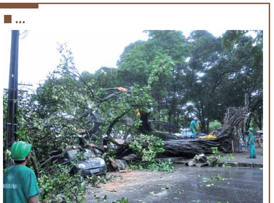
A queda de uma árvore ontem pela manhã no Parque Sólton de Lucena danificou quatro veículos