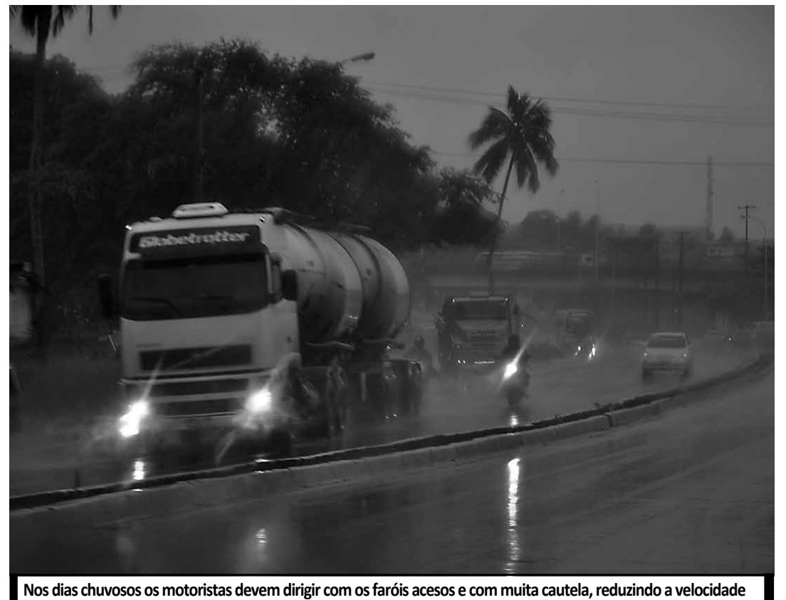
Nos dias chuvosos os motoristas devem dirigir com os faróis acesos e com muita cautela, reduzindo a velocidade

A Avenida Sérgio Guerra, principal dos Bancários, ficou intransitável, obrigando os motoristas a procurarem vias alternativas. Também foram registrados alagamentos e lentidão no trânsito na altura do Viaduto do Cristo, sentido José Américo, na Avenida Sérgio Guerra, no bairro