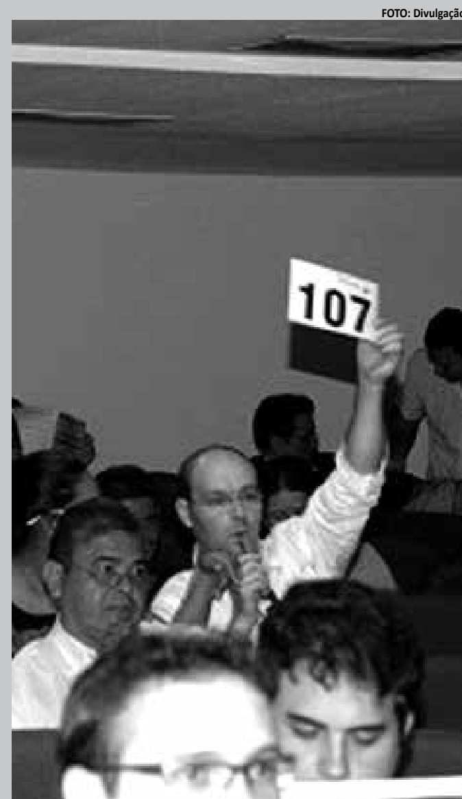
O evento aconteceu em todo o Brasil no período de 11 a 15