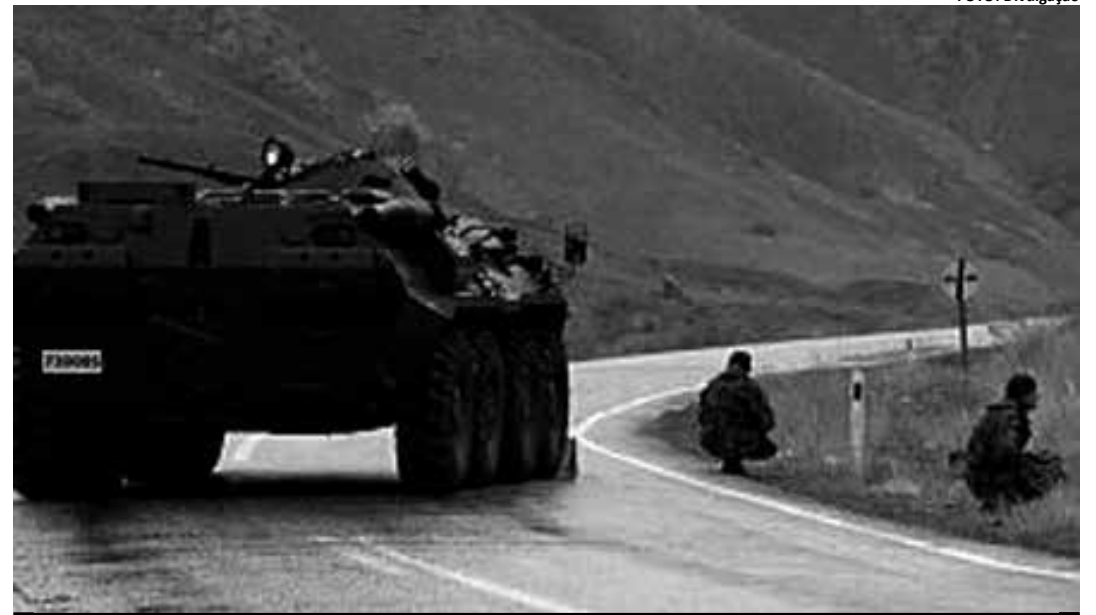
Guerrilheiros do ilegal Partido de Trabalhadores do Curdistão travaram combate com o Exército turco

da Turquia, Necdet Özel, se transferiu à zona para dirigir os combates, informa a rede de televisão "CNNTürk".