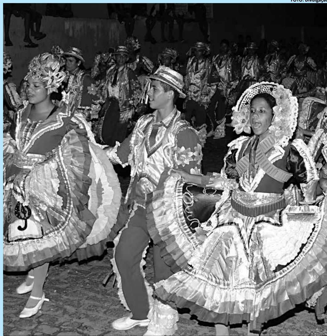
As quadrilhas foram divididas em Grupo A ou Especial que se apresentam hoje e amanhã, no Centro