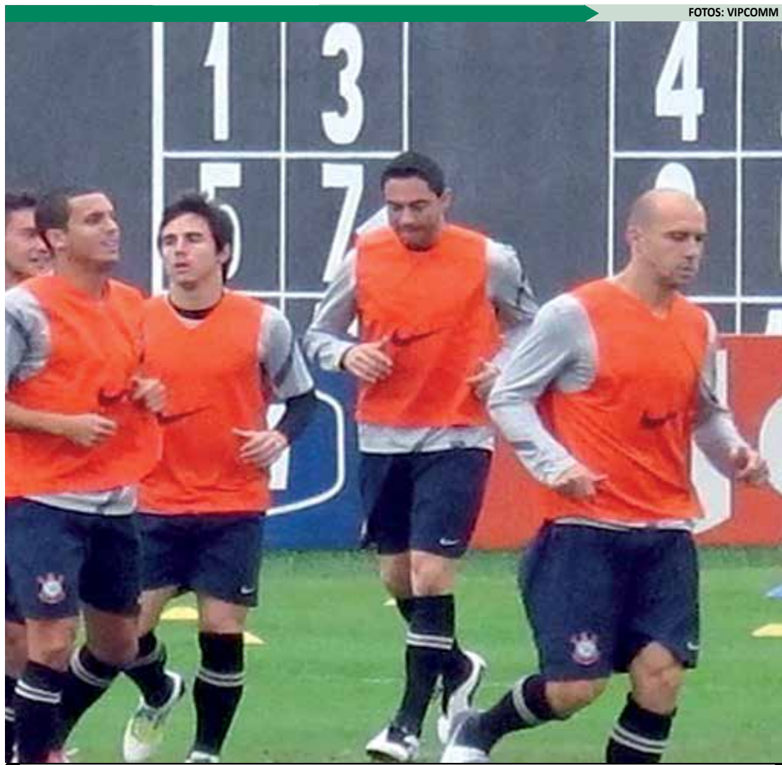
Depois de vencer o jogo de ida, elenco corinthiano só pensa numa boa apresentação e na conquista da vaga

“Não dá para administrar o jogo com a qualidade que o Santos tem. Precisamos ser agressivos com a bola e fazer uma marcação forte. Temos de ir para dentro, pro-