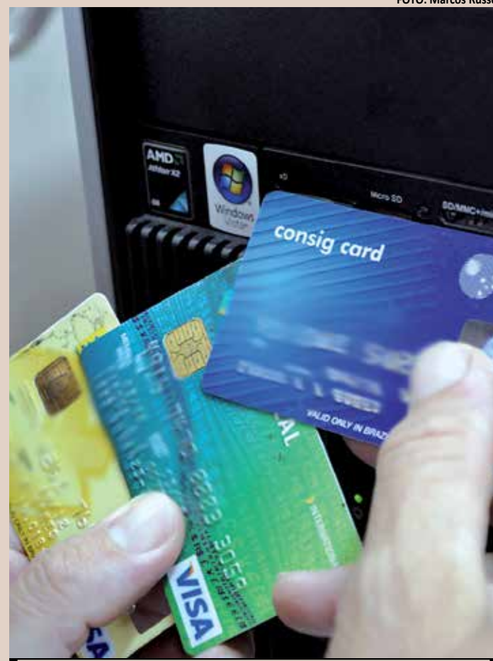
Em caixas eletrônicas, cubra o teclado com a mão ao digitar a senha

Ao notar a falta do cartão, ligue para operadora e faça o bloqueio do serviço. Isso evitará possíveis compras indesejadas na próxima fatura.