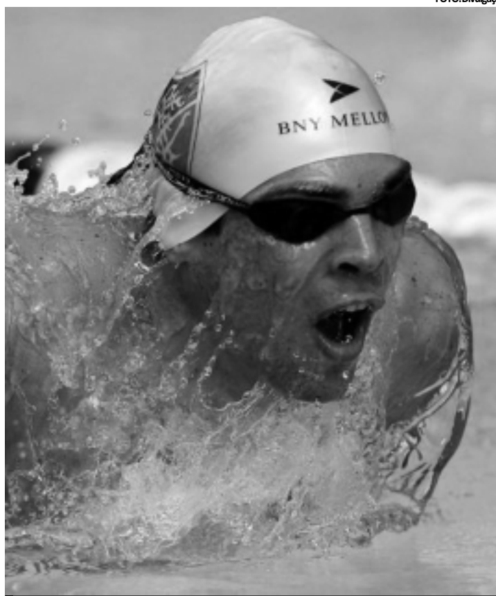
O paraibano conseguiu duas medalhas de prata nos 100 e 200m borboleta