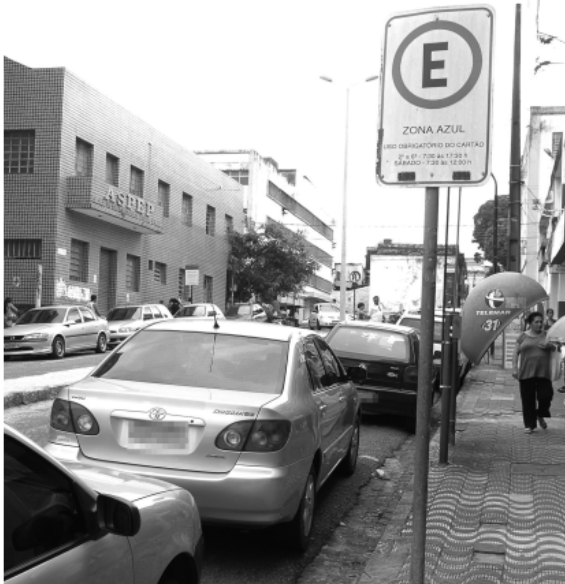
João Pessoa possui 1.350 vagas rotativas na Zona Azul, mas já existe projeto para expandir esse número