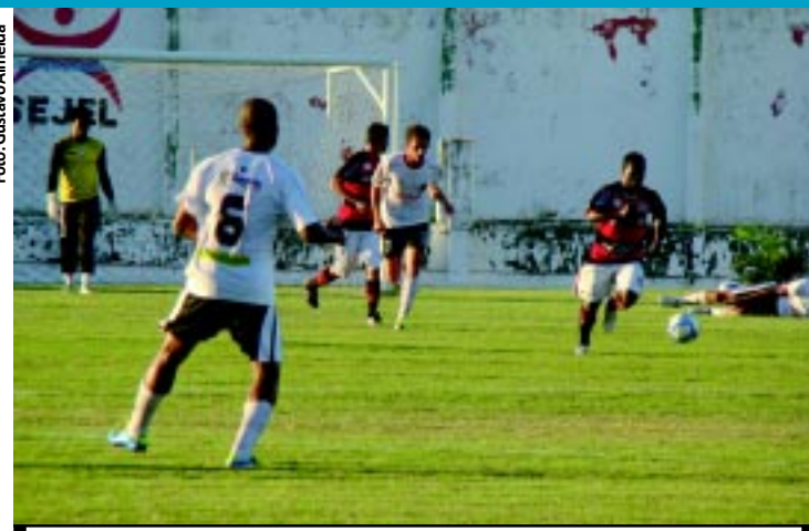
O Bota vai se reformular para tentar obter melhores resultados

Academia paraibana formada por atletas paraolímpicos que disputaram a fase Norte-Nordeste do Circuito Brasil de Atletismo, Halterofilismo e Natação no último final de semana terminou a competição com 11 medalhas. Os paraibanos conseguiram ainda quatro classificações para a etapa nacional. PÁGINA 14