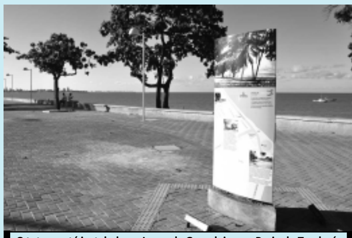
O totem está instalado no Largo da Gameleira, na Praia de Tambaú

"A escolha do totem foi uma excelente forma de aliar o resgate histórico de João Pessoa com a promoção do