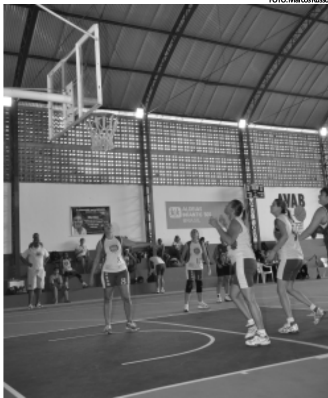
Jogo válido pelo Campeonato Norte-Nordeste na Aldeia SOS