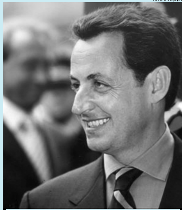
Nicolas Sarkozy, candidato à reeleição, vai realizar comício hoje

DEBATE CRUCIAL NA TV - Sarkozy tem provavelmente sua