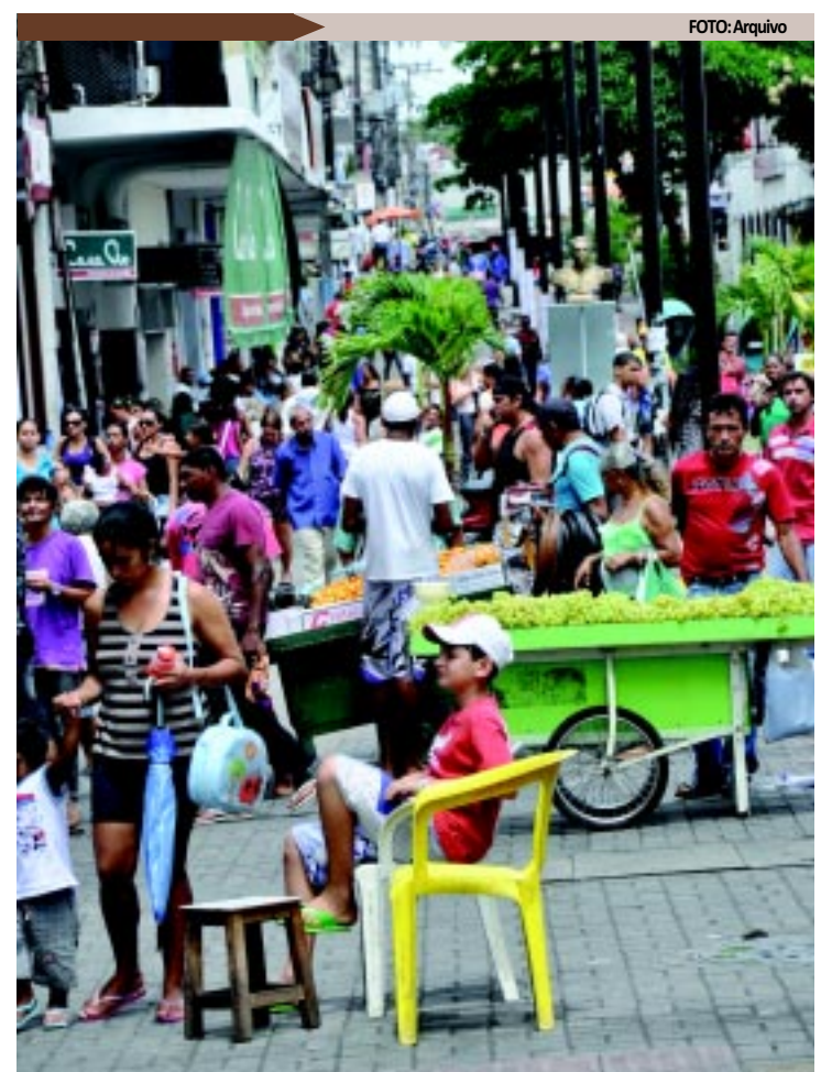
O comércio irá funcionar por causa das vendas para o Dia das Mães

JOÃO PESSOA - Em João Pessoa haverá banhos de piscina, jogos de tabuleiro como dama, xadrez e dominó, trilha ecológica e jogos de salão, além de show com a banda Forró da Burguesinha. Tudo isso a partir das 9h. Já em Campina Grande, as atividades começam às 8h30. E quem comparecer poderá contar com manhã recreativa, torneio de futsal, banho de piscina, aulas de hidroginástica, aulas de mesa e sinuca, além da realização de um show com música ao vivo para alegrar os trabalhadores.