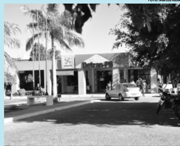
Ações do departamento visam identificar veículos com irregularidades

Segundo a Corregedoria Geral do Detran-PB, existem no Estado 100 autoescolas cadastradas junto ao órgão, no entanto 20 a 25 atuam de forma irregular e que a "Operação Andróide" visa exclusivamente detectar as mesmas para que se enquadrem no que