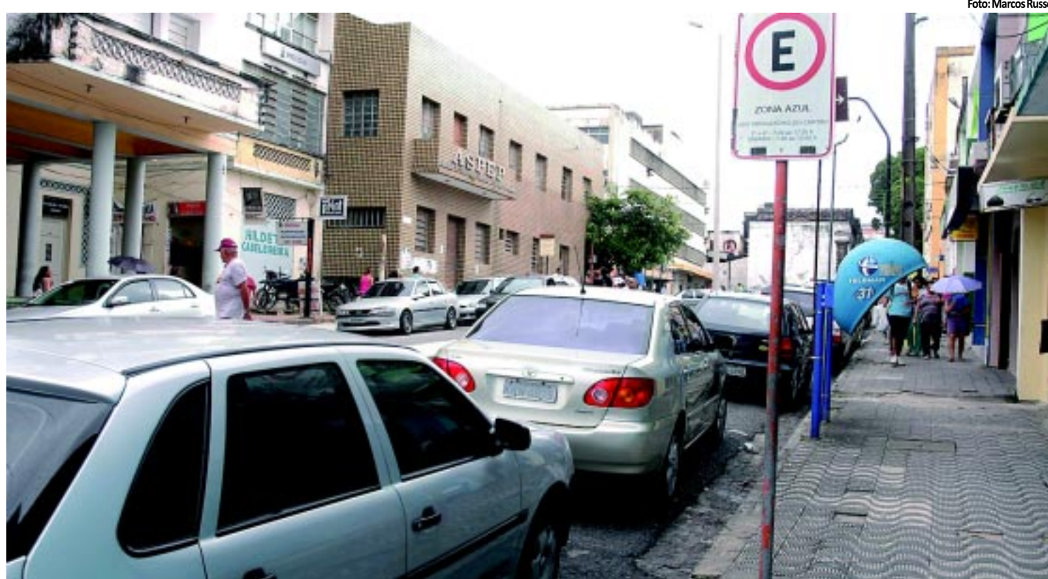
NA CAPITAL | Novo valor da Zona Azul definido pela Semob é R$ 1,50 e entra em vigor amanhã PÁGINA 10

Polícia (Acadepol), no bairro de Mangabeira, na zona sul de João Pessoa. O governador Ricardo Coutinho participou do evento e destacou os benefícios sociais do investimento. PÁGINA 8