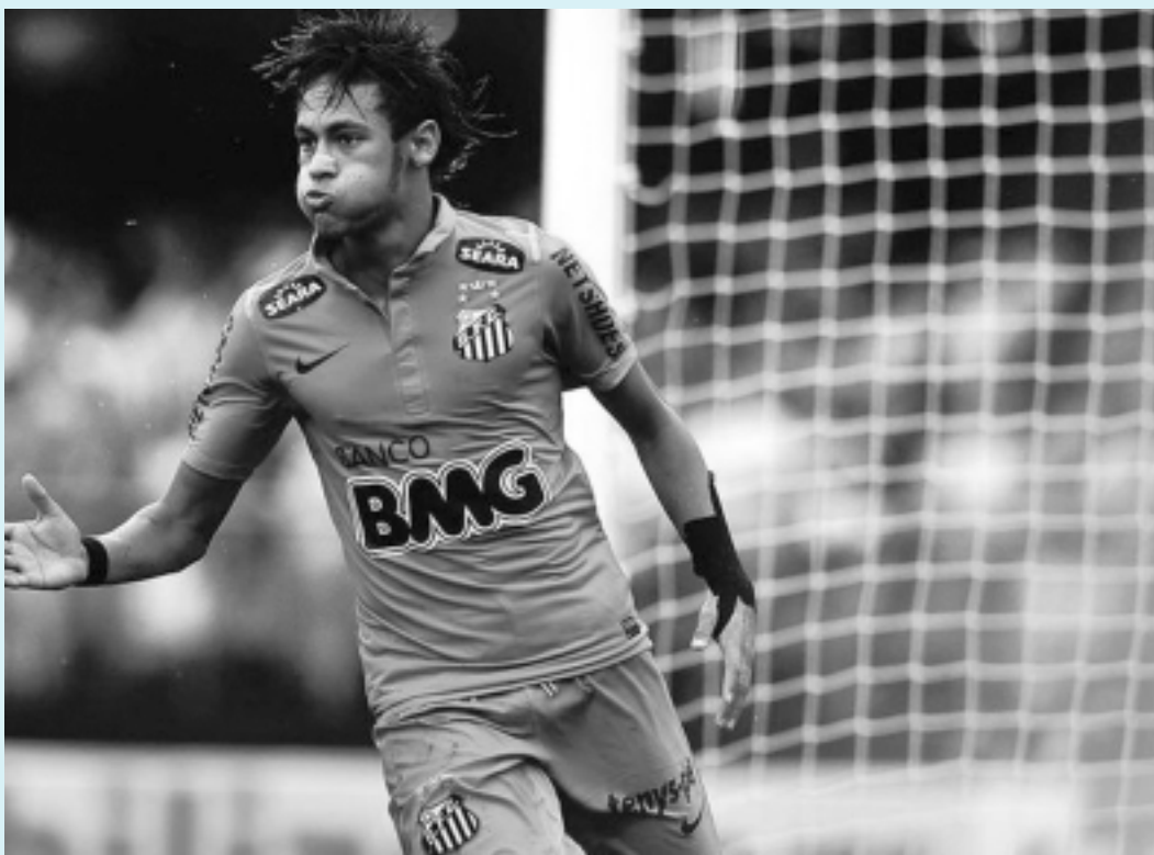
Neymar marcou três gols e foi o principal jogador da partida em que o Santos eliminou o São Paulo

Ou outros campeonatos como Pernambucano e o Paranaense ainda estão indefinidos. O Pernambuco, por exemplo, já tem o Sport garantido na final da disputa, aguardando tão somente o desfecho de Santa Cruz e Salgueiro.