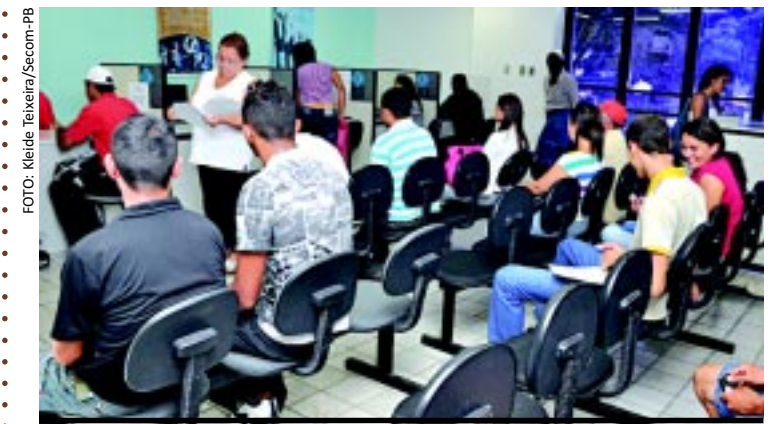
[FOTO&LEGENDA] A semana em que se comemora o Dia do Trabalhador começa com muitas oportunidades de trabalho no Sine-PB. São cerca de 370 vagas que estão sendo oferecidas.