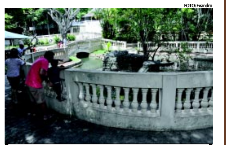
A Bica, com seus 510 animais, é outra opção de lazer na Capital

Além do contato direto com a natureza, o parque conta com cerca de 510 animais entre aves, répteis e mamíferos. A Bica conta ainda com um grande lago, onde são oferecidos passeios de pedalinhos,