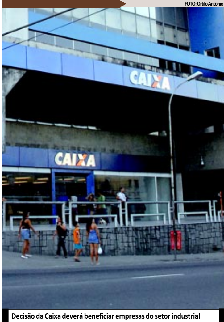
Decisão da Caixa deverá beneficiar empresas do setor industrial

De acordo com a Caixa, podem ser beneficiárias desta