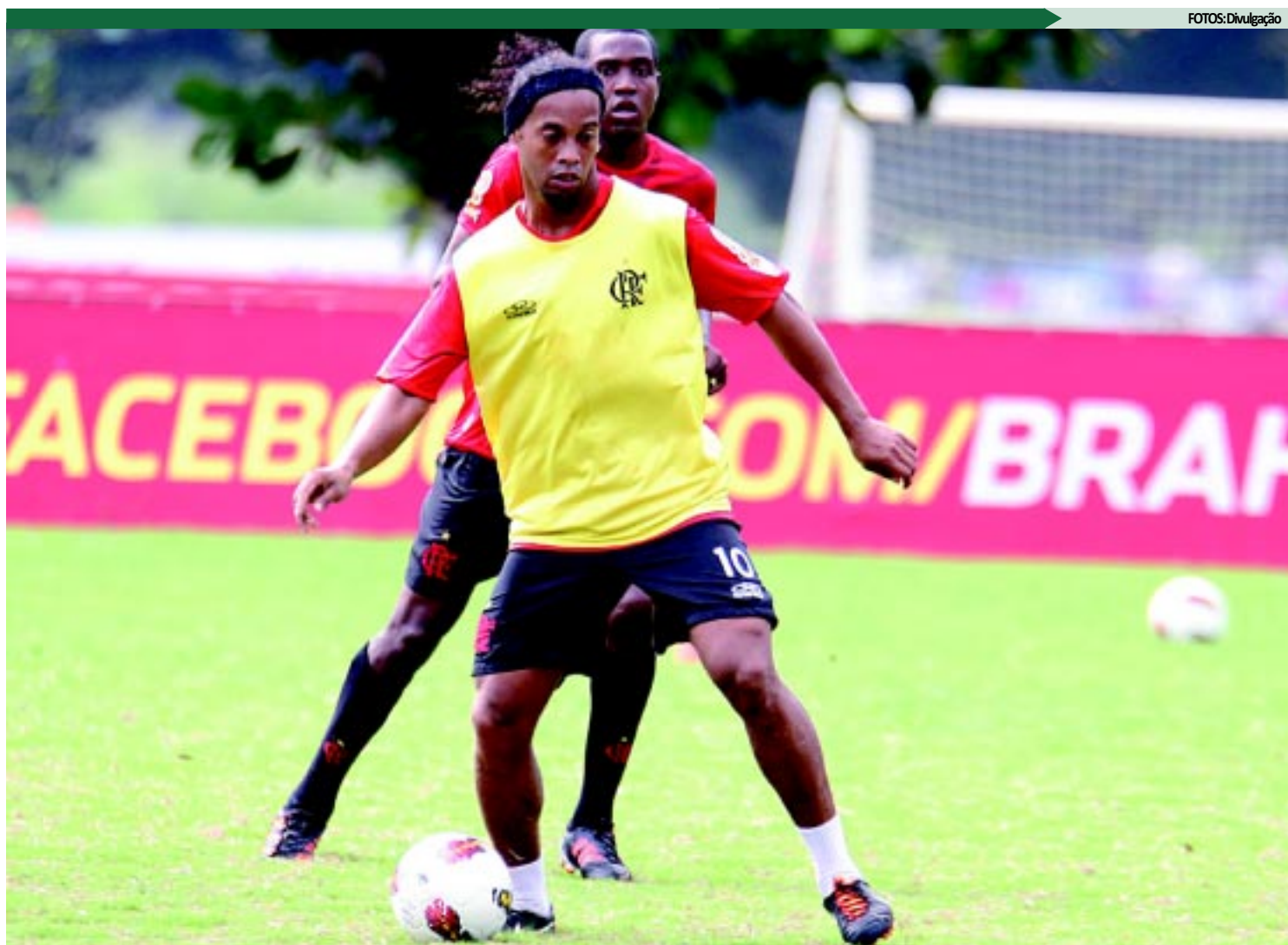
Atacante Ronaldinho Gaúcho continua treinando no Ninho do Urubu, mas sua permanência no elenco do time é praticamente insustentável

Segundo Levy, o pagamento dos salários atrasados, em um primeiro momento, estão condicionados ao fechamento de um contrato de patrocínio master para o futebol do Flamengo. Assis, porém, negou a existência desse acordo e notificou o clube extra-judicialmente cobrando uma definição so-