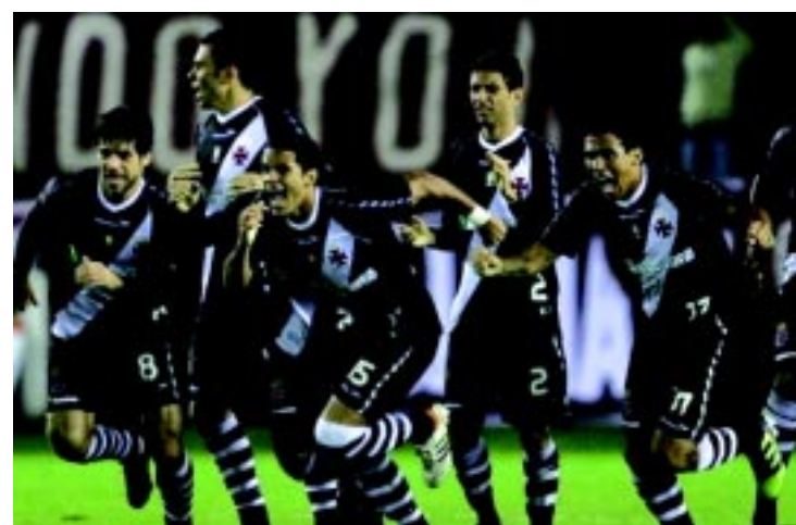
Equipe cruzmaltina comemora muito a vitória na cobrança de pênaltis

competição, o Vasco consegue um feito comemorado intensamente nos bastidores. O projeto de reerguer o clube nos torneios mais relevantes foi iniciado em 2009, quando o time disputou a Série B do Campeonato Brasileiro. A partir daí, título da Copa do Brasil e vice-campeonato brasileiro no ano passado. Agora, o Vasco terá pela frente o Corinthians e a possibilidade de manter vivo o