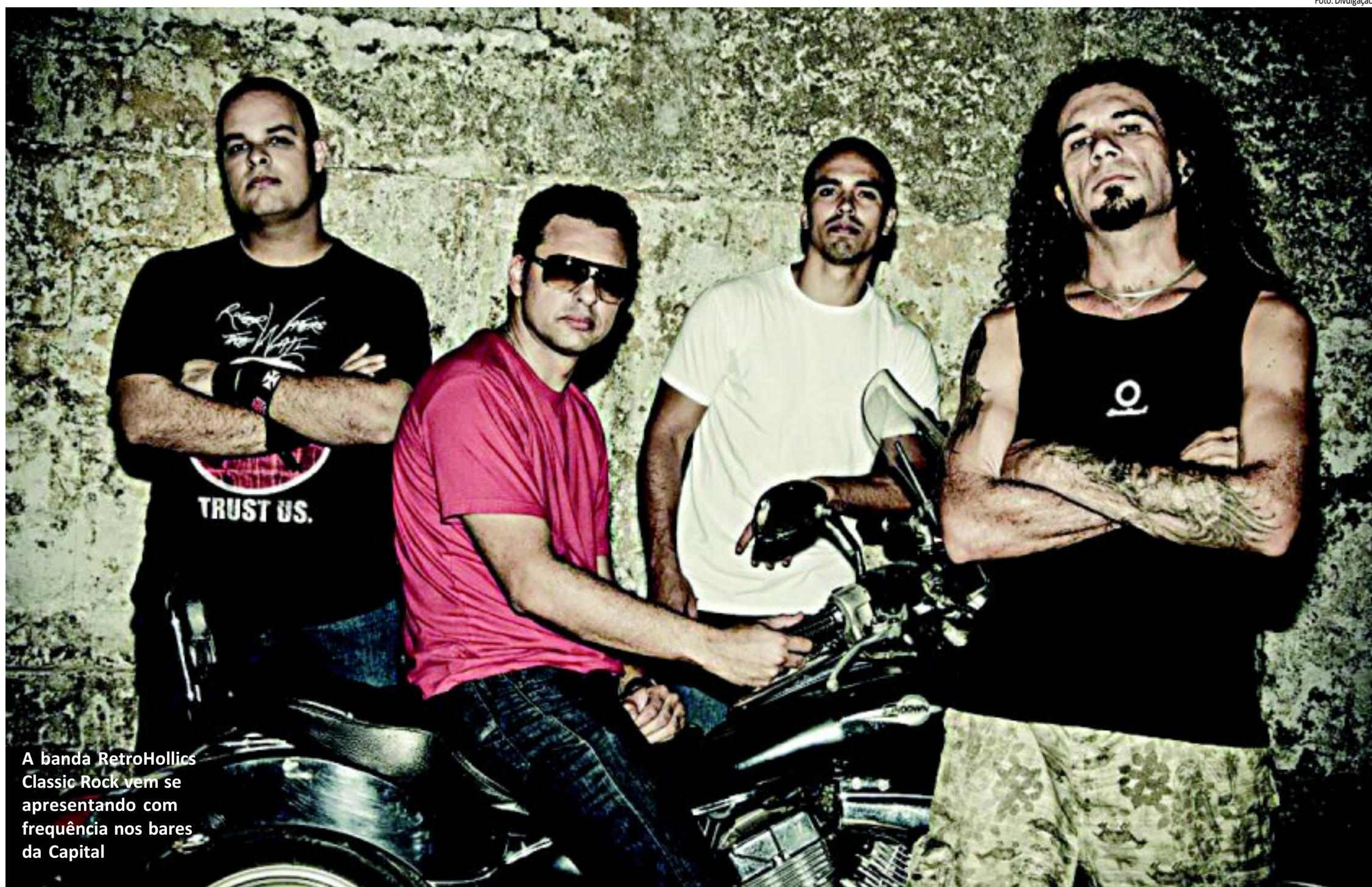
A banda RetroHollics Classic Rock vem se apresentando com frequência nos bares da Capital