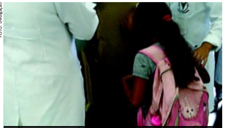
Com o projeto "Blitz Carga Máxima", alunos do curso de Fisioterapia do Unipê estão avaliando o peso da mochila carregada pelas crianças em escolas municipais.