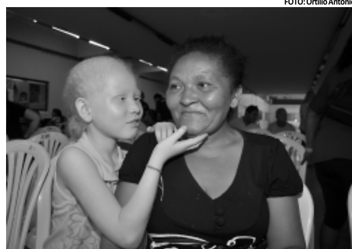
Mães viveram momentos de muito carinho durante a programação

As ações do Programa Cidadão tiveram seus atendimentos estendidos também para as servidoras da instituição. A festa se prolongou