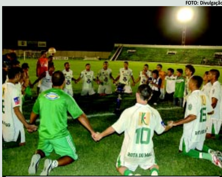
Atletas do Sousa durante a oração em agradecimento pelo título de 2009