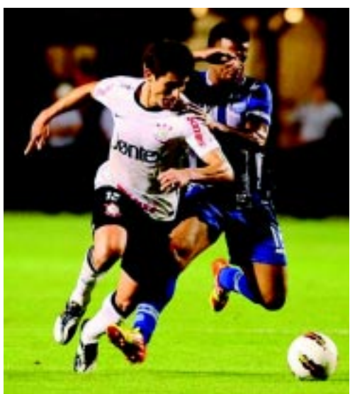
Timão enfrentou o Emelec na fase das oitavas

O triunfo sobre o Emelec, ontem, por 3 a 0, no Pacaembu, foi o 13º mata-mata corinthiano no mais tradicional torneio continental sul-americano, sendo apenas a quinta vez em que obteve sucesso. Foram oito resultados positivos. O time chegou invicto aos duelos contra o Boca Juniors,