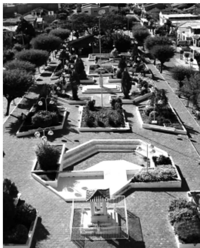
São José de Piranhas será beneficiado com os cursos da Esppep

Já em São José de Piranhas, os cursos oferecidos são: Capacitação em Práticas Docentes - Ensino Fundamental e Médio, Introdu-