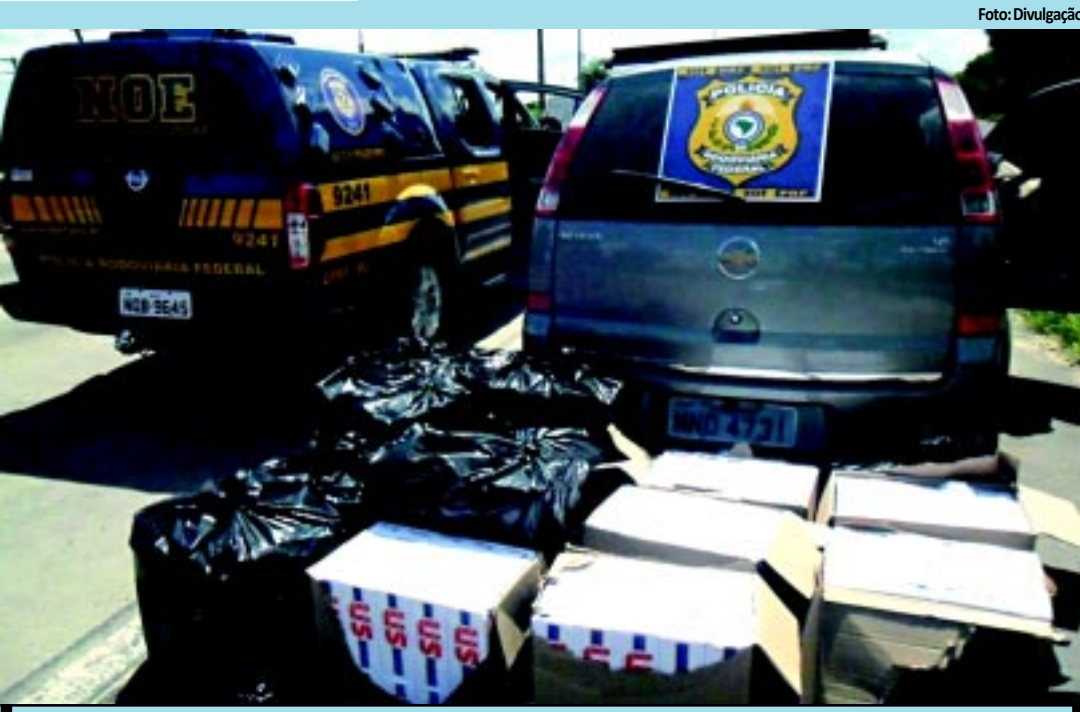
Pacotes de cigarros apreendidos estavam sendo transportados num veículo Meriva

PRF apreende 140 mil cigarros do Paraguai