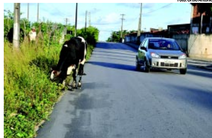
Animais representam risco à segurança dos motoristas

Os animais soltos nas estradas ameaçam a segurança dos motoristas. Somente este ano, a PRF registrou 63 acidentes na Paraíba com atropelamentos de animais. PÁGINA 9