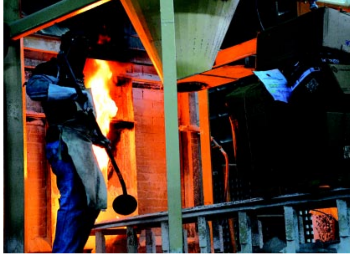
COMBATE AO TRÁFICO | Polícia Civil incinera 200 quilos de drogas, como crack, maconha e cocaína, em João Pessoa PÁGINA 24