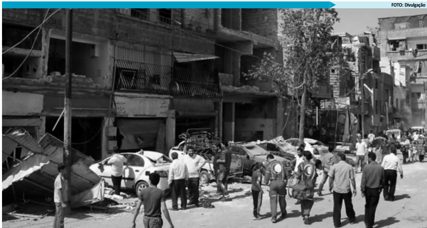
População observa a destruição provocada pela forte explosão de duas bombas. Desde o início da revolta, 12 mil pessoas já morreram no país

Estes ataques ocorrem no momento em que a comunidade internacional multiplica