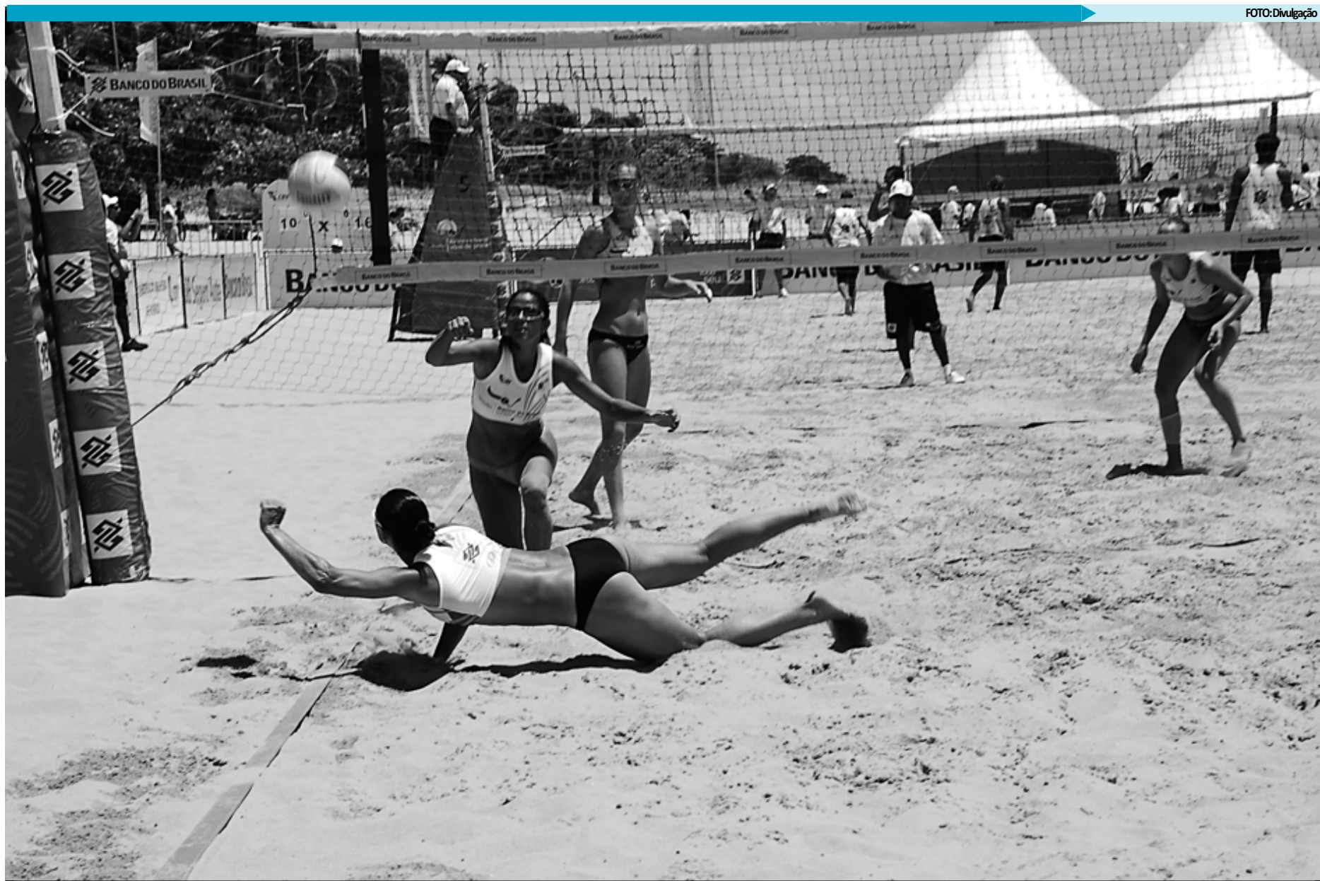
Lances de muita emoção devem marcar mais uma etapa do Circuito Nacional de Vôlei de Praia nas categorias feminino e masculino. As disputas na orla da Capital vão até o próximo domingo