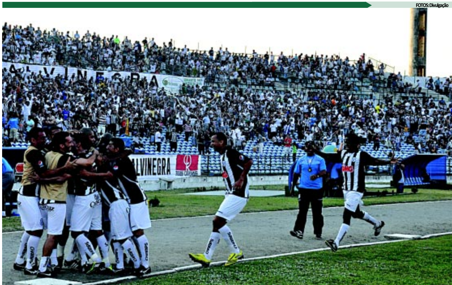
Apesar do excelente elenco, o Galo da Borborema ficará no jejum das competições a serem promovidas no restante da temporada pela CBF