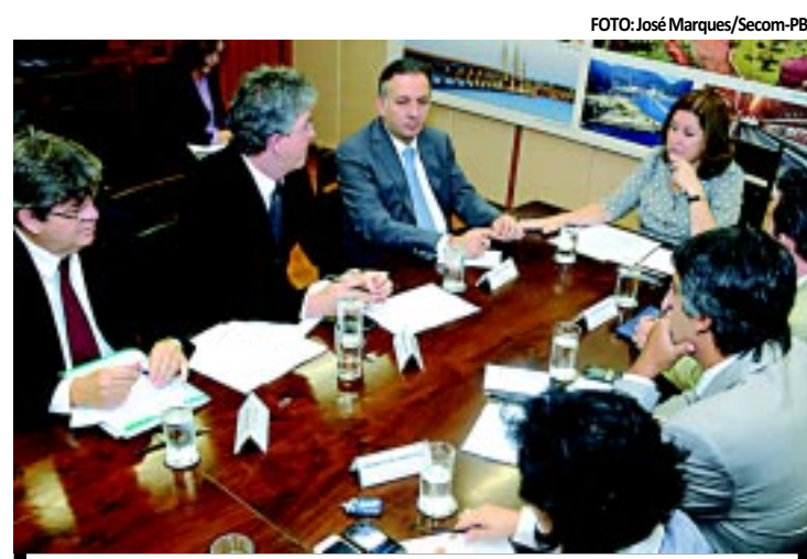
Governador debate com a ministra do Planejamento sobre projetos

O Dia da Enfermeira e o do Enfermeiro é comemorado em 12 de maio, em referência a Florence Nightingale, enfermeira britânica, um marco da enfermagem moderna no mundo. Nascida em Florença, em 12 de maio de 1820, ficou famosa por seu pioneirismo e extrema dedicação ao tratar dos feridos de guerra.