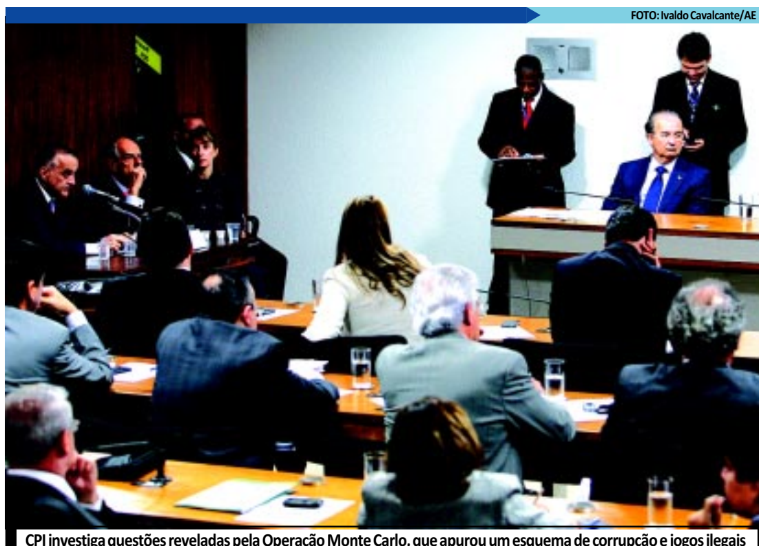
CPI investiga questões reveladas pela Operação Monte Carlo, que apurou um esquema de corrupção e jogos ilegais

O ministro destacou ainda que o Governo Federal aumentou o espaço fiscal para os Estados e liberou mais recursos para investimentos, R$ 40 bilhões. "Isso é investimento na veia para os Estados." Mantega participou de audiência pública da Comissão Mista da Medida Provisória 567, que trata das mudanças na caderneta de poupança.