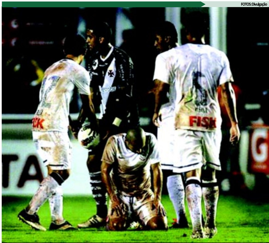
No jogo de ida, em São Januário, cariocas e paulistas ficaram no 0 a 0 e hoje um se despede da competição

Ainda sem contar com Dedé, a tendência é que o Vasco entre em campo com a mesma equipe que começou a primeira partida. A dúvida continua sendo a utilização de Juninho ou Felipe no meio de campo. No último domingo, o Reizinho atuou durante todo o segundo tempo. Já o Maestro vem sendo utilizado como reserva.