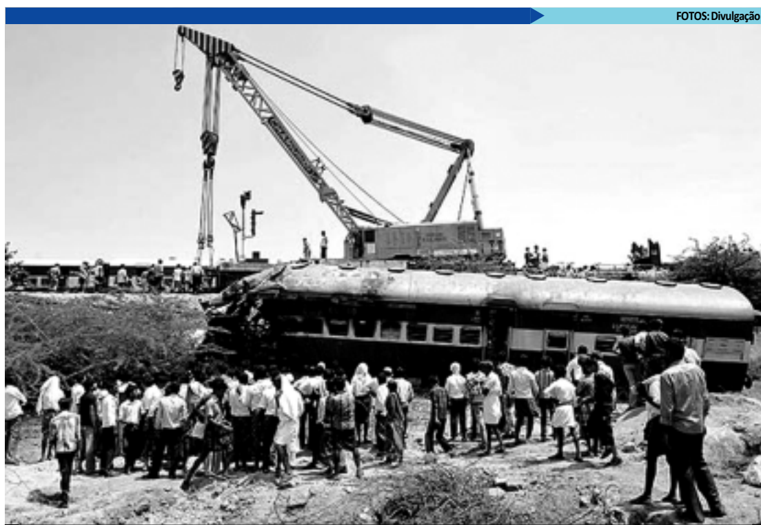
Moradores locais observam restos das composições dos trens que se chocaram no distrito de Anantapur

O ministro das Ferrovias indiano, Mukul Roy, anunciou compensações econômicas de 500 mil rúpias (US$ 9 mil) a cada uma das famílias dos falecidos, de 100 mil rúpias (US$ 1.800) para os gravemente feridos e de 50 mil rúpias (US$ 900) para os que apresentam lesões leves.