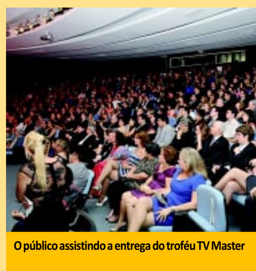
O público assistindo a entrega do troféu TV Master