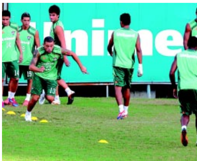
O time das Laranjeiras treinou forte para reverter desvantagem

A partida entre Fluminense x Boca Junior será às 19h30, no estádio Engenhão e no jogo de ida, na semana passada, na La Bombonera, a equipe brasileira perdeu por 1 a 0, placar que os brasileiros prometem tirar a diferença e deixar a praça de jogo com a classificação às se-