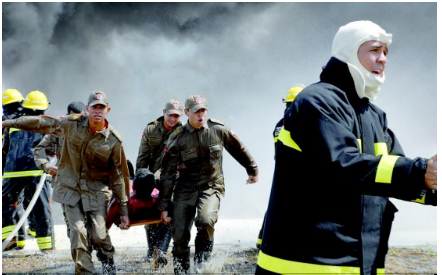
O objetivo da simulação que ocorre anualmente é treinar toda a comunidade aeroportuária buscando mais agilidade no atendimento às vítimas