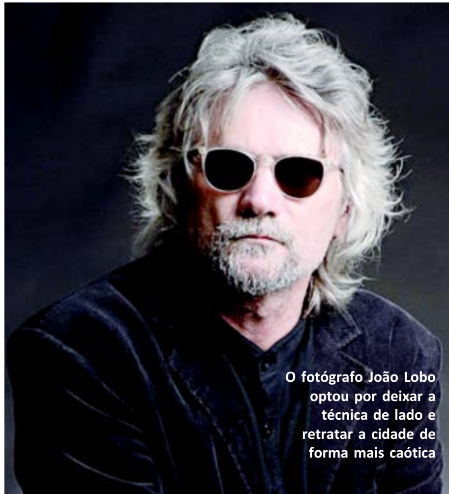
O fotógrafo João Lobo optou por deixar a técnica de lado e retratar a cidade de forma mais caótica

João Lobo captura o caos da Capital após dois anos de pesquisa nas ruas