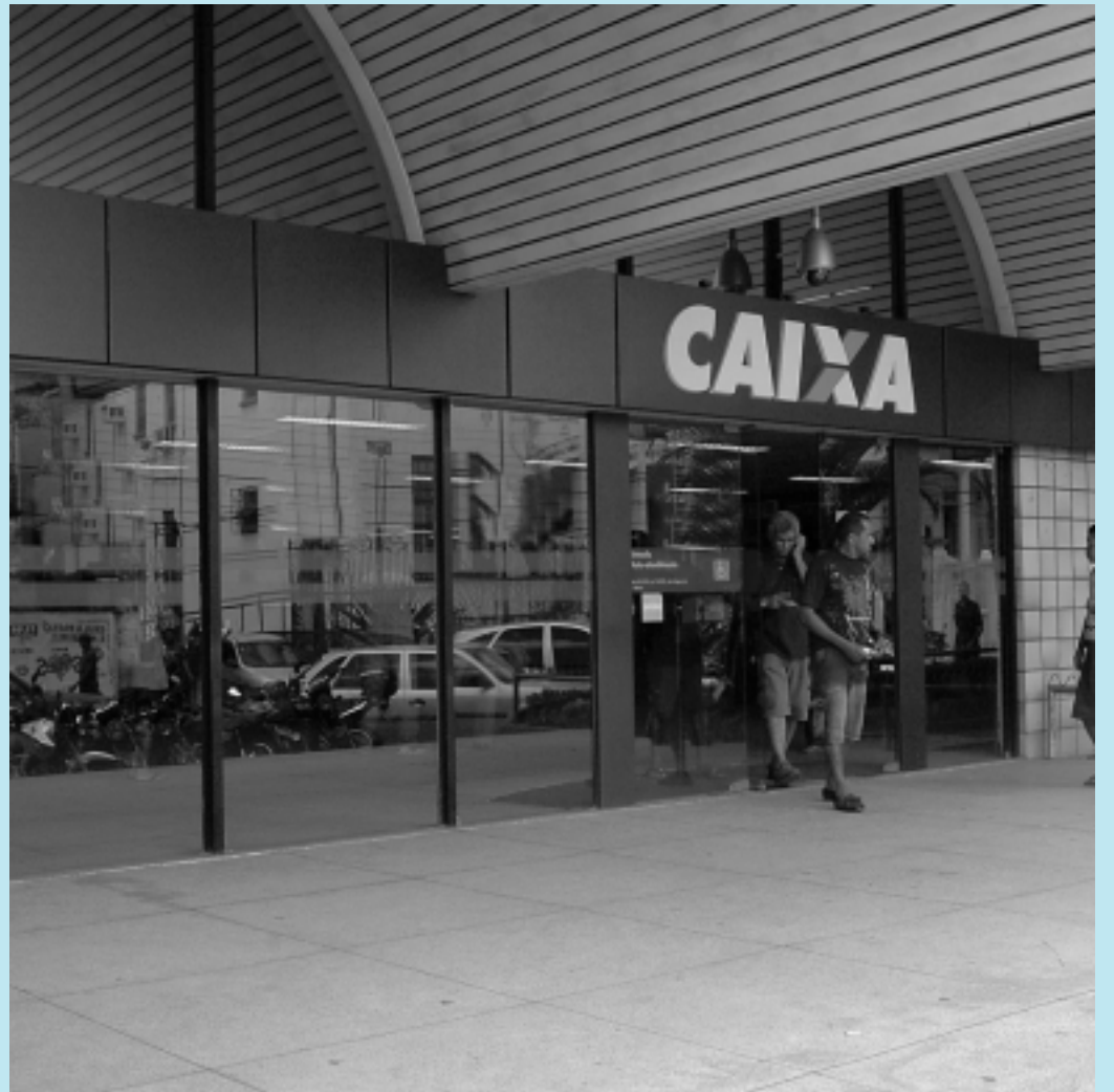
Duas portas que dão acesso ao interior da agência foram danificadas e apenas uma TV de LCD foi roubada