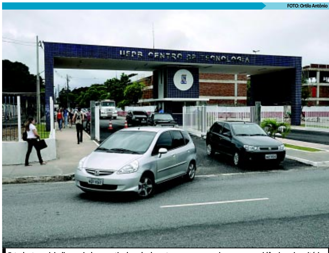
Estudantes reivindicam ainda garantia de aula durante as greves e mais vagas na residência universitária

Ao novo gestor da UFPB também está sendo cobrada,