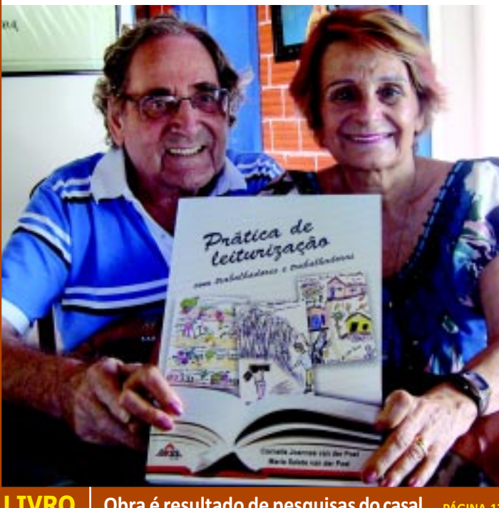
LIVRO | Obra é resultado de pesquisas do casal PÁGINA 17