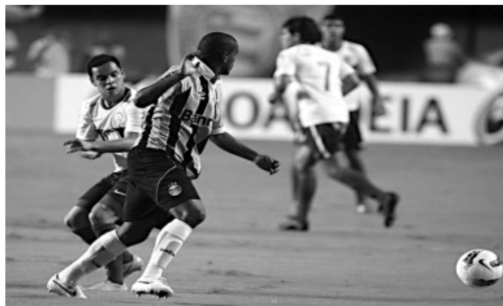
No primeiro jogo disputado em Salvador, o Grêmio levou a melhor e venceu de virada por 2 a 1