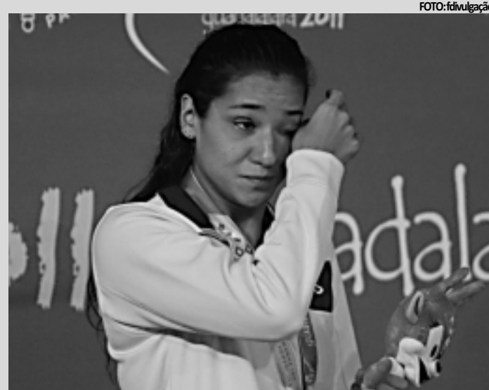
Joanna, a exemplo de Xuxa, também foi abusada sexualmente

e eu sobrevivi, porque a vida é muito linda para não ser vivida ao extremo!" disse Joanna Maranhão, em sua página no Twitter.