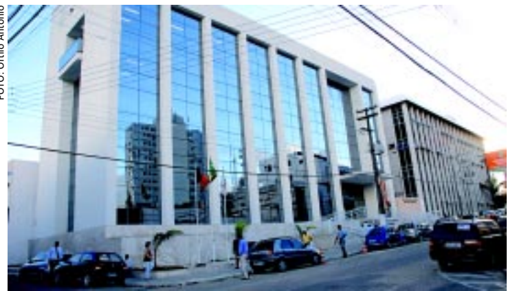
O Centro de Apoio Operacional da Cidadania e Direitos Fundamentais definiu o calendário de oficinas de capacitação dos conselheiros municipais de idosos até o final do ano. Serão realizadas 11 oficinas, entre junho e dezembro.