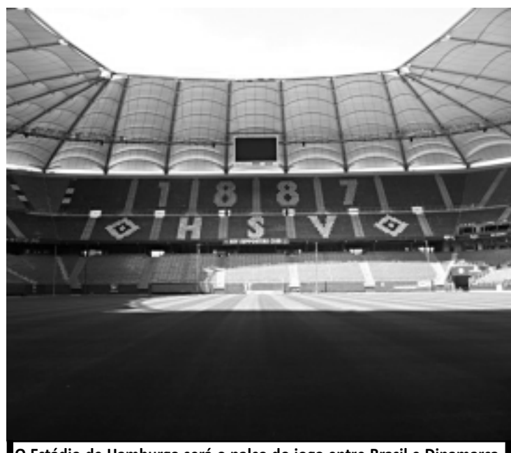
O Estádio de Hamburgo será o palco do jogo entre Brasil e Dinamarca