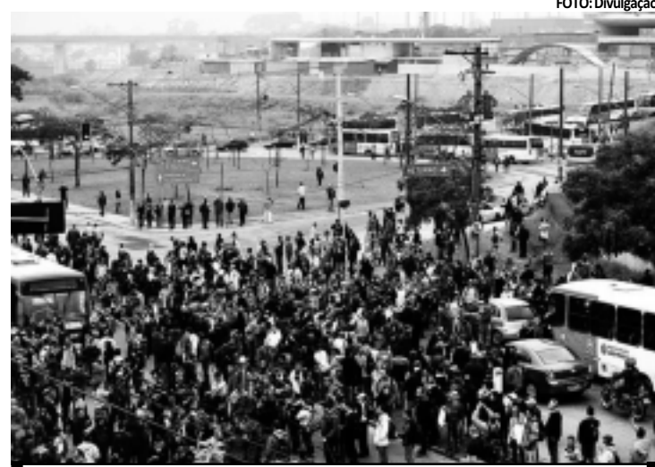
Paulistanos enfrentaram ontem um dia de caos por conta da paralisação

Inicialmente, o metrô tinha oferecido reajuste de 4,65%, enquanto o sindicato pedia 20,12%. A nova proposi-