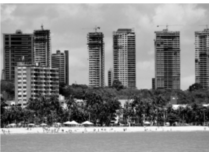
A orla marítima é uma das áreas mais valorizadas

Assim, não deve parecer absurda ou tão pretenciosa a expressão "Altiplano Nobre", usada pelo mercado da construção civil para valorizar a cobiçada área com aspectos que lhe conferem inegável distinção.