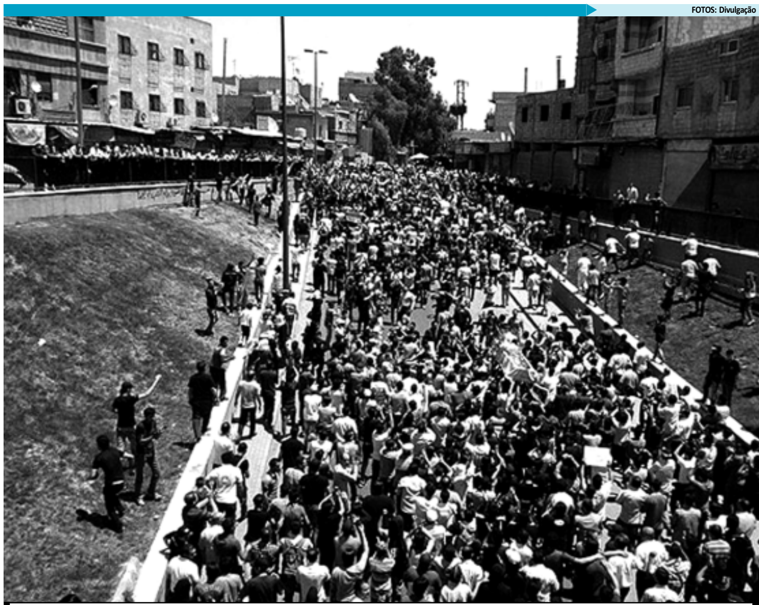
Opositores ao regime do ditador Bashar al Assad participaram do funeral de Mahmoud Sukaria, que teria sido morto por forças do governo

Damasco se negou recentemente a entregar um relatório ao comitê contra a tortura da ONU. A Anistia denuncia ainda que o regime não realiza investigações independentes sobre assassinatos, torturas e outras violações dos direitos humanos.