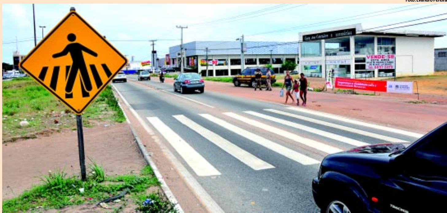
Atualmente os pedestres precisam disputar espaço com os veículos para conseguir fazer a travessia do trecho da BR-230

O DER inicia hoje a construção de uma passarela na BR-230, no conjunto Renascer, em Cabedelo. A previsão é que a obra seja concluída em seis meses. O Estado também está finalizando o projeto para construir uma passarela no trecho da rodovia onde fica a comunidade Boa Esperança, no bairro do Cristo, na Capital. PÁGINA 9