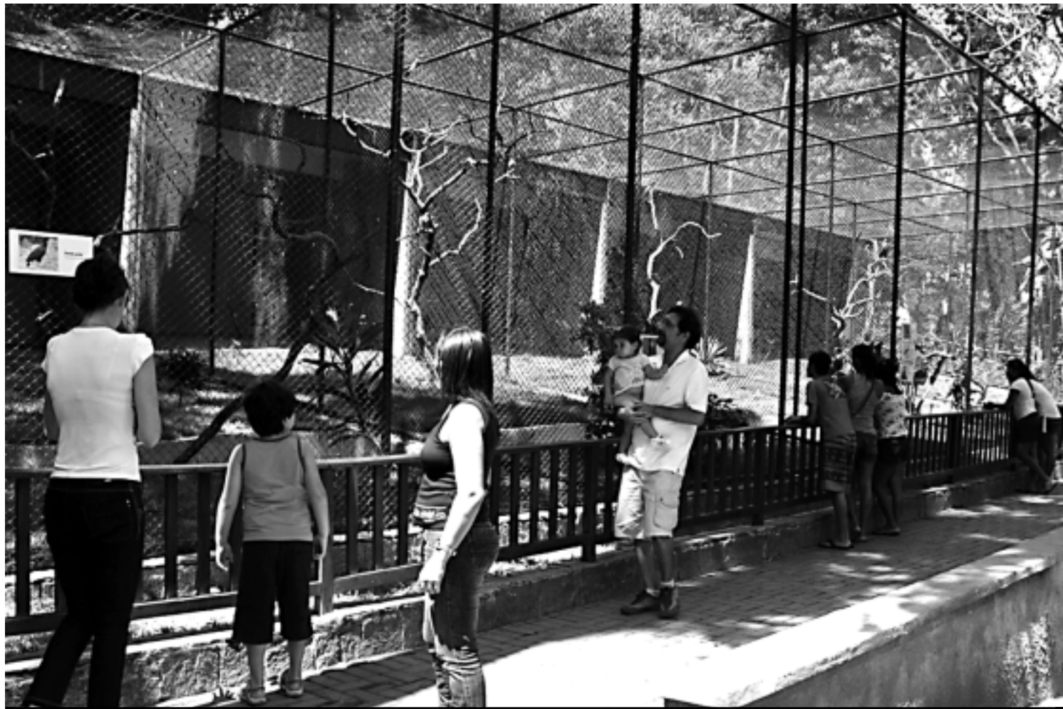
As visitas públicas ao Parque Arruda Câmara serão feitas de terça-feira a domingo, das 7h30 às 17h, com a bilheteria funcionando até as 16h