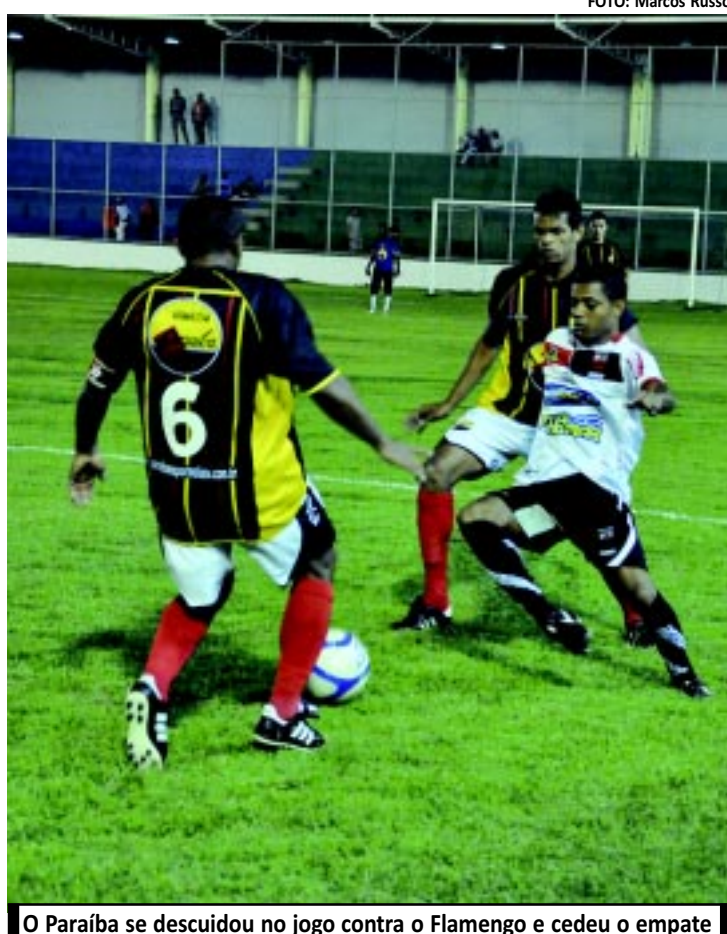
O Paraíba se descuidou no jogo contra o Flamengo e cedeu o empate