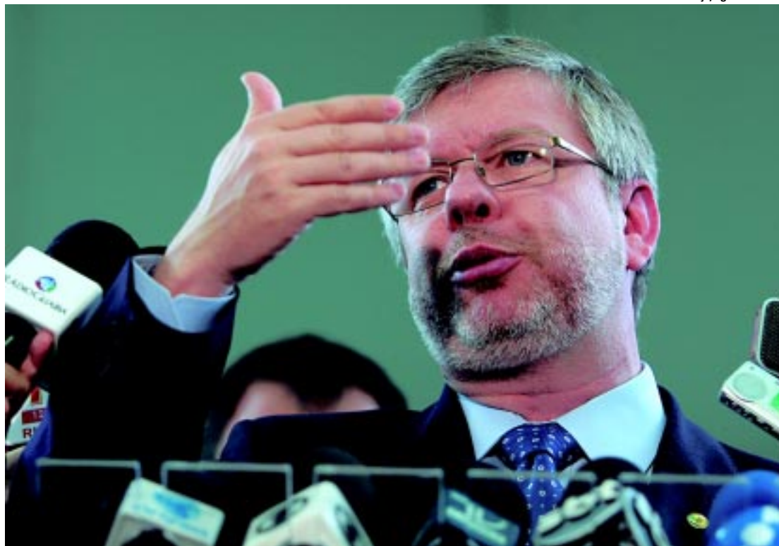
Para Maia, o Supremo não levou em conta o timing do Congresso ao determinar o cumprimento da legislação

Mas afirmou que a base continua "solidária" com o Executivo porque "entende que o governo dirige o país com competência e honestidade" e acredita que a própria presidente tem jogo de cintura para apaziguar aliados rebelados. "O que houve foi um episódio que não significa uma crise que esteja acontecendo na vida pública brasileira. Episódios como esses ocorrem em todos os governos. A presidente Dilma é política. Sabe como lidar com sua base parlamentar", disse, após encontro com empresários em Belo Horizonte.