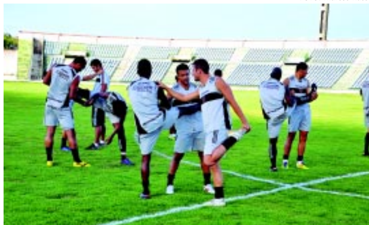
Depois da vitória sobre o Esporte, os jogadores voltaram a se exercitar