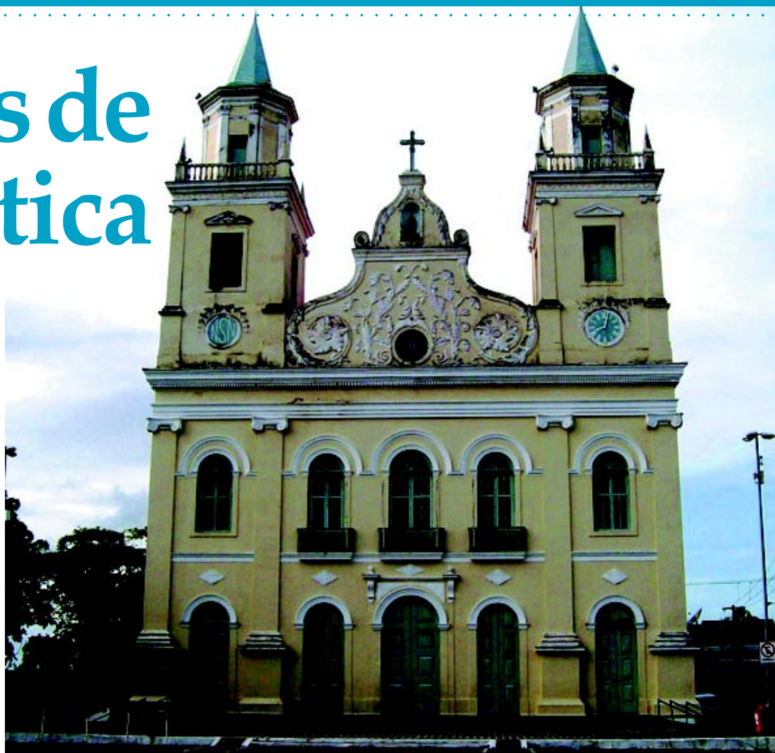
Igreja Matriz de Santa Rita de Cássia, palco das grandes manifestações políticas e culturais da cidade

A temperatura média anual desse município oscila em torno de 26,5°C. Sua vegetação é a Vegetação Pioneira, Campos e Mata de Restingas, Manguezais e Mata Úmida. É o terceiro município do Estado em população e em número de eleitores, o segundo em extensão territorial e o maior produtor de abacaxi da Paraíba. Santa Rita é também conhecida como a cidade dos canaviais, pela grande produção de cana-de-açúcar.