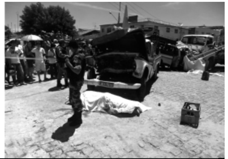
O único ferido neste acidente está internado na cidade de Patos. Até o final da tarde de ontem o motorista do caminhão não havia sido localizado