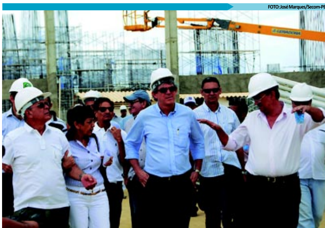
Comitiva formada pelo governador Ricardo Coutinho e pelo prefeito Luciano Agra visitou os canteiros de obras

O prefeito de João Pessoa elogiou o andamento da obra e destacou a importância dela para o desenvolvimento local. "Com o Centro de Convenções, a fachada sul de João Pessoa vai ser um dos lugares mais bem equipados para o exercício do turismo no Estado e também para o lazer e o entretenimento. E tudo isso de forma sustentável", defendeu Agra.