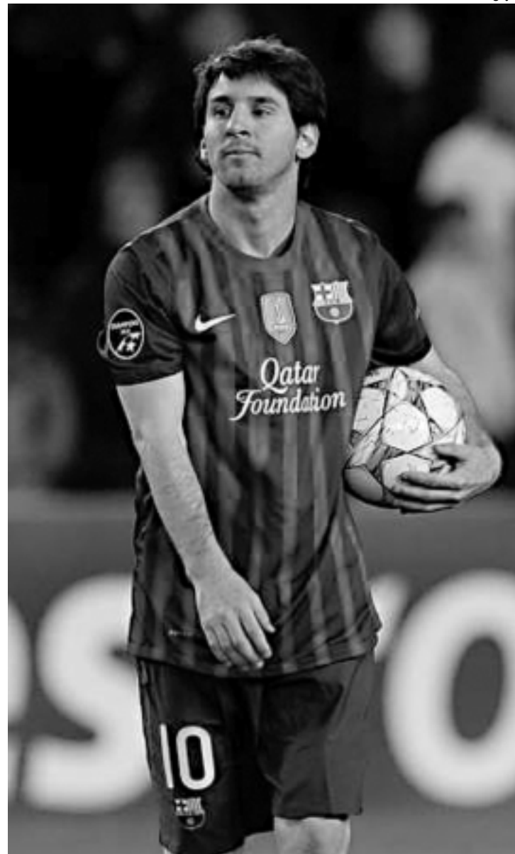
Aos 24 anos, Messi já marcou 263 gols e segue brilhando no Barcelona

Os números de Messi levam em conta as partidas pelo Barcelona e pelas seleções argentina principal, Sub-23 e Sub-20.