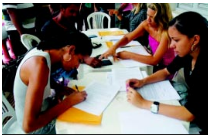
Moradores assinam contrato para recebimento de novas casas

A Prefeitura de Santa Rita realizou o sonho da casa própria de 100 famílias carentes do município com a entrega das chaves das casas do Conjunto Habitacional Zilda Ams, localizado no distrito Nossa Senhora do Livramento.