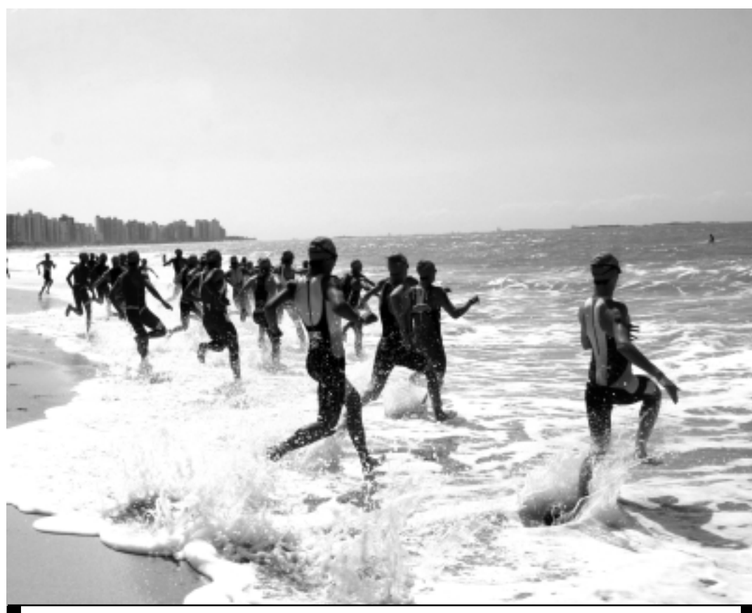
Nadadores enfrentarão um percurso de 3 Km do Cabo Branco até Picãozinho, retornando por Tambaú