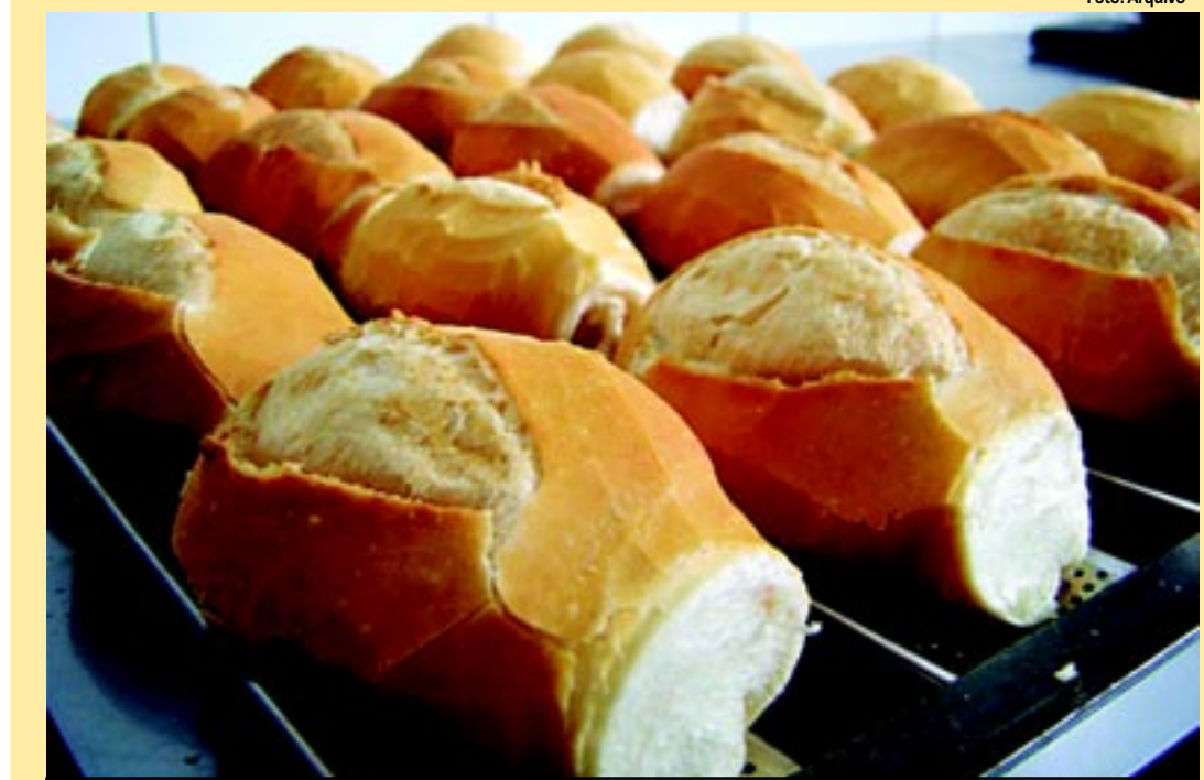
O quilo do pão francês é vendido nas padarias com preços que variam de R$ 3,50 a R$ 7,98