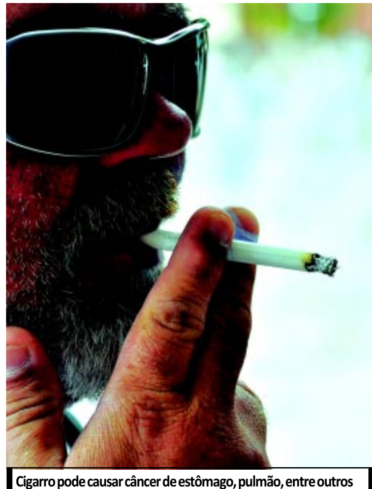
Cigarro pode causar câncer de estômago, pulmão, entre outros

Dados do Instituto Nacional do Câncer (Inca) apontam que a Paraíba contabiliza mais de 2,5 mil mortes por ano em decorrência do uso do tabaco. Este ano, 17 pessoas já morreram na Paraíba em 2012 por câncer de esôfago, laringe e pulmão, órgãos diretamente afetados pelo consumo do tabaco. Além de comprometer estes órgãos, o uso do cigarro pode desencadear neoplasias em outras áreas do corpo, se o fumante tiver predisposição. PÁGINA 9