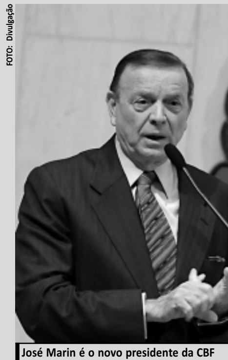
José Marin é o novo presidente da CBF

Mas, a assessoria do COL não confirmava a saída do dirigente, dizendo que não havia informações até o momento. Caso Teixeira de fato se afaste, seu substituto à frente do comitê deve ser o ex-jogador Ronaldo. Explica-se: é ele quem compõe o conselho do COL ao lado de Teixeira e do também ex-atleta Bebeto, que assumiu há pouco tempo. A questão é que, além de presidente, Teixeira tam-