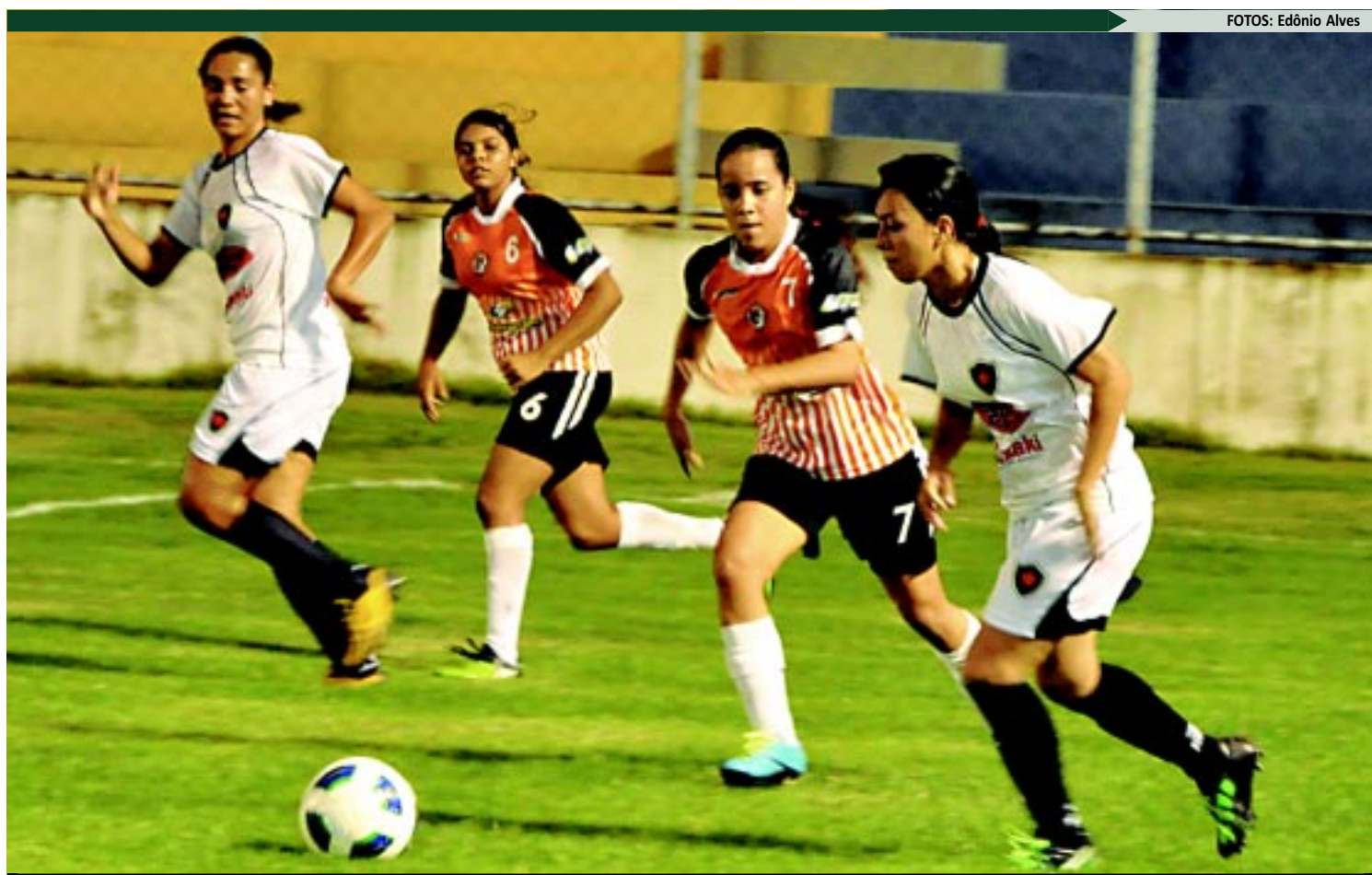
As meninas do Botafogo voltam a disputar a Copa do Brasil com a estreia diante das norte-riograndenses a partir das 20h30 no Estádio da Graça