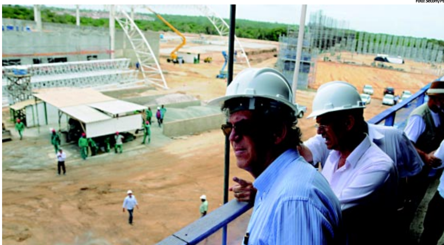
INSPEÇÃO Governador visita Centro de Convenções e destaca ritmo acelerado da obra PÁGINA 4

mendado pelo Ministério da Saúde. A Secretaria de Estado da Saúde está desenvolvendo grupos de estudos para implantar o tratamento supervisionado. PÁGINA 8