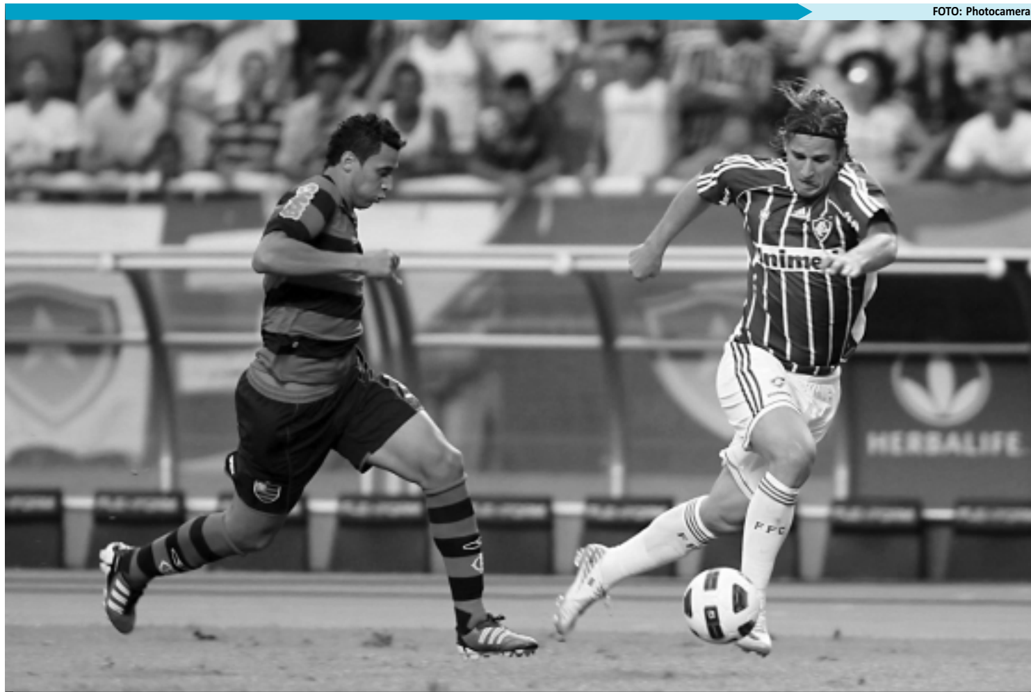
Nos últimos seis confrontos, o Fluminense de Diguinho não conseguiu vencer o Flamengo. Neste domingo as equipes se enfrentam no Engenhão

Na última quarta-feira, Thiago Neves foi liberado pelo Departamento Médico do Fluminense e teve boa participação. Ele foi substituído somente aos 27 minutos da segunda etapa. Rafael Sóbis entrou no lugar do meia-atacante.