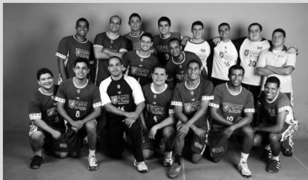
A equipe masculina do Sohands/Maurício de Nassau é uma das favoritas ao título do Paraibano 2011