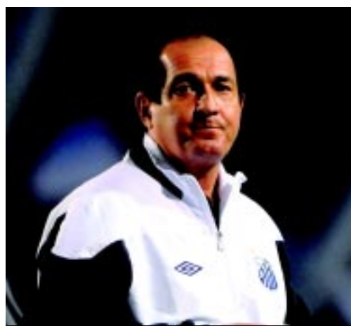
Muricy está priorizando a Copa Libertadores

Além de Adriano e Elano, o time B do Santos contará com recentes renegados de Muricy Ramalho. O lateral direito Maranhão volta a defender o time após perder espaço com a chegada do uruguaio Fucile. Ele atuará devido à lesão muscular de Crystian, segunda opção de Muricy no setor.