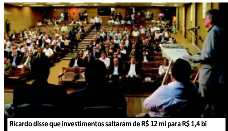
Ricardo disse que investimentos saltaram de R$ 12 mi para R$ 1,4 bi