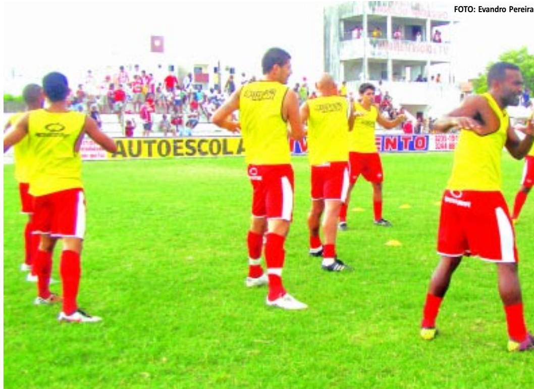
Jogadores do Auto Esporte voltaram aos treinamentos físicos ontem à tarde no Estádio Mangabeirão

Com o resultado o Galo da Borborema ficou na quarta colocação, com 18 pontos ganhos. "Foram fatores que contribuíram para que o Treze não tivesse uma boa postura contra o time patoense. Chegamos até a criar, mas fomos incompetentes para aproveitar as boas chances de gols para matar o adversário ainda no primeiro tempo", disse.