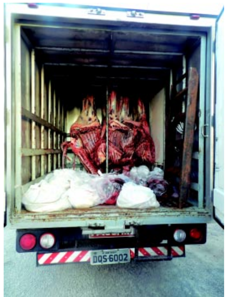
Em Santa Rita, a PRF apreendeu 70 kg de carne bovina sem autorização

Já no km 41, em Santa Rita, a PRF flagrou e apreendeu 70 kg de carne bovina que eram transportados num Kia K2700, de placas DQS-6002/SP. Os policiais detectaram presença de moscas na carne que seria vendida para consumidores.