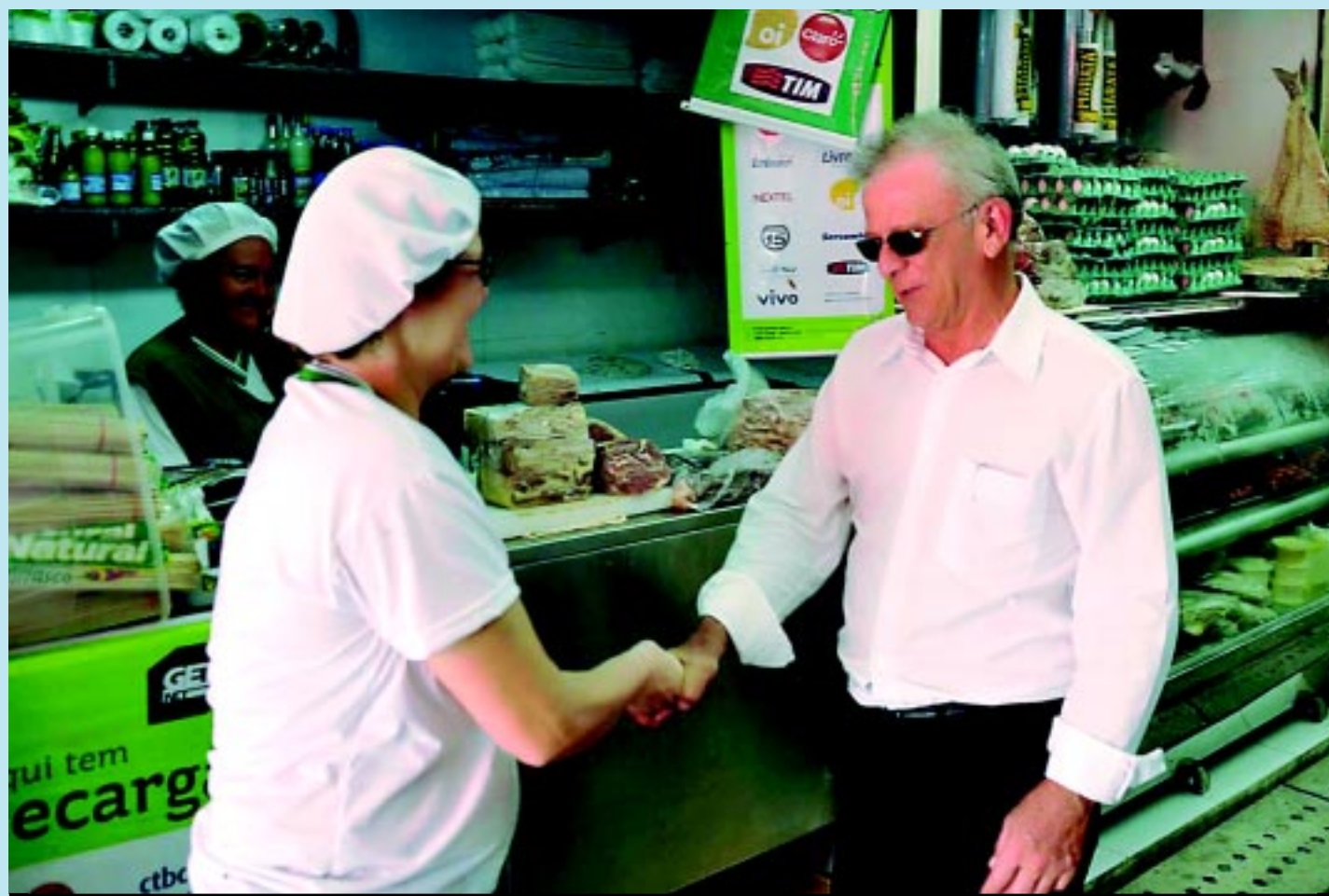
Agra conversou com os comerciantes, fez compras e percorreu os galpões e foi até a praça da alimentação conferir o almoço servido no local