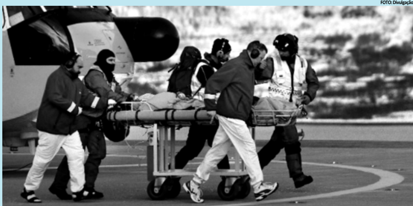
Equipes de resgate levam sobrevivente ao Hospital Universitário da Noruega, após ele ser atingido por uma avalanche em Kåfjorden