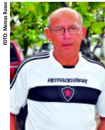
Técnico terá muito trabalho