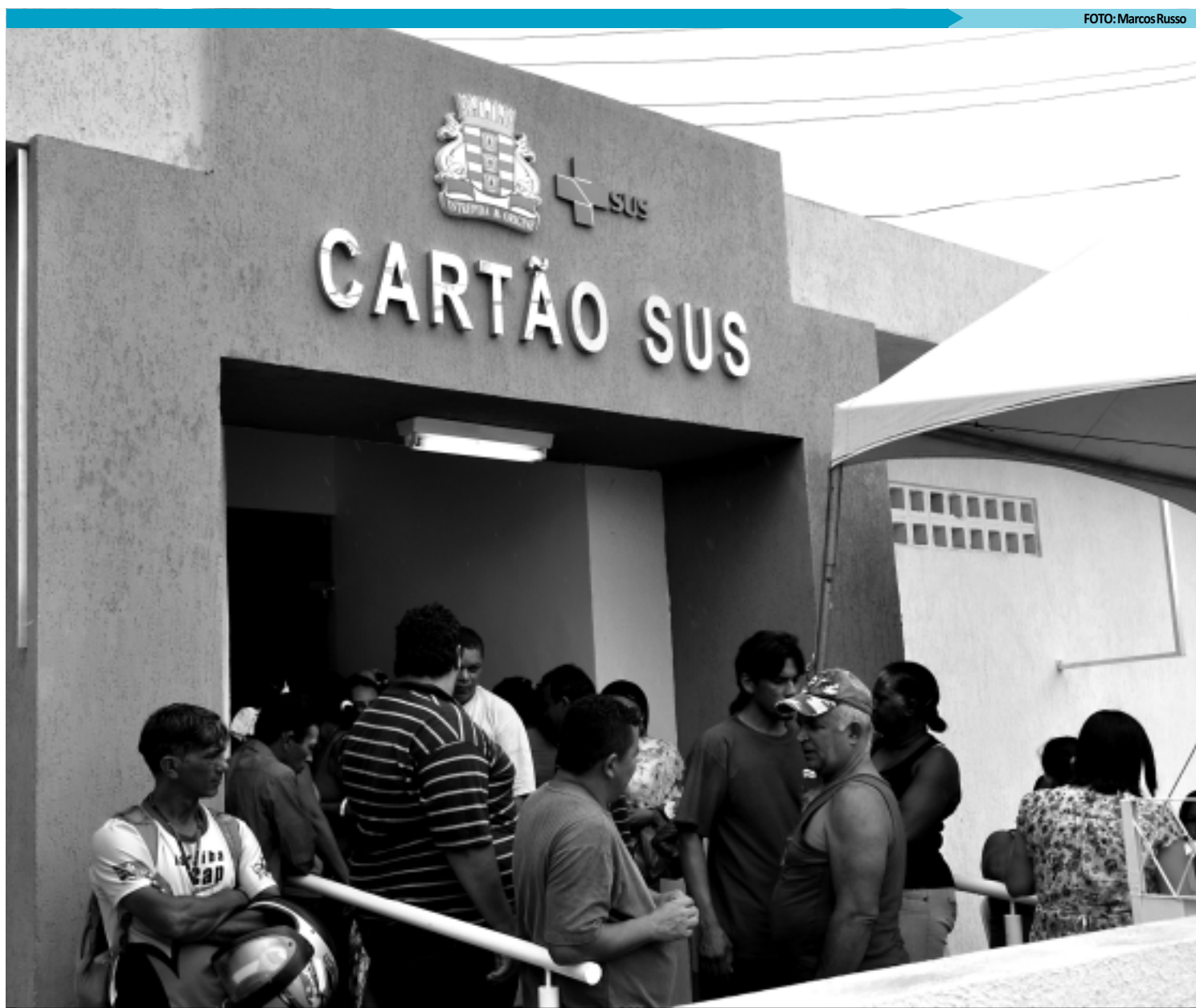
Atendimento ao usuário está sendo realizado de segunda a sexta-feira, das 8h às 11h30 e de 13h30 às 17h e vem provocando longas filas no local