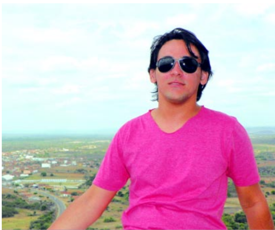
Deleon Souto tinha experiência na realização de documentários e estreia na ficção com As Folhas

O processo de produção de As Folhas começou quando Deleon escolheu o primeiro de uma série de contos que escreveu a partir do