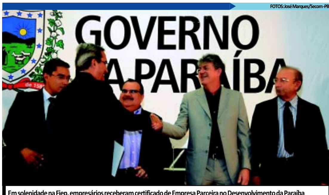
Em solenidade na Fiep, empresários receberam certificado de Empresa Parceira no Desenvolvimento da Paraíba

"É um momento virtuoso, e nós temos que aproveitar e dar-nos as mãos, em campanha pelo desenvolvimento e pela implantação de novas empresas", disse. De acordo com o empresário, o Serviço Nacional de Aprendizagem Industrial (Senai) está ampliando escolas para capacitar pessoas.