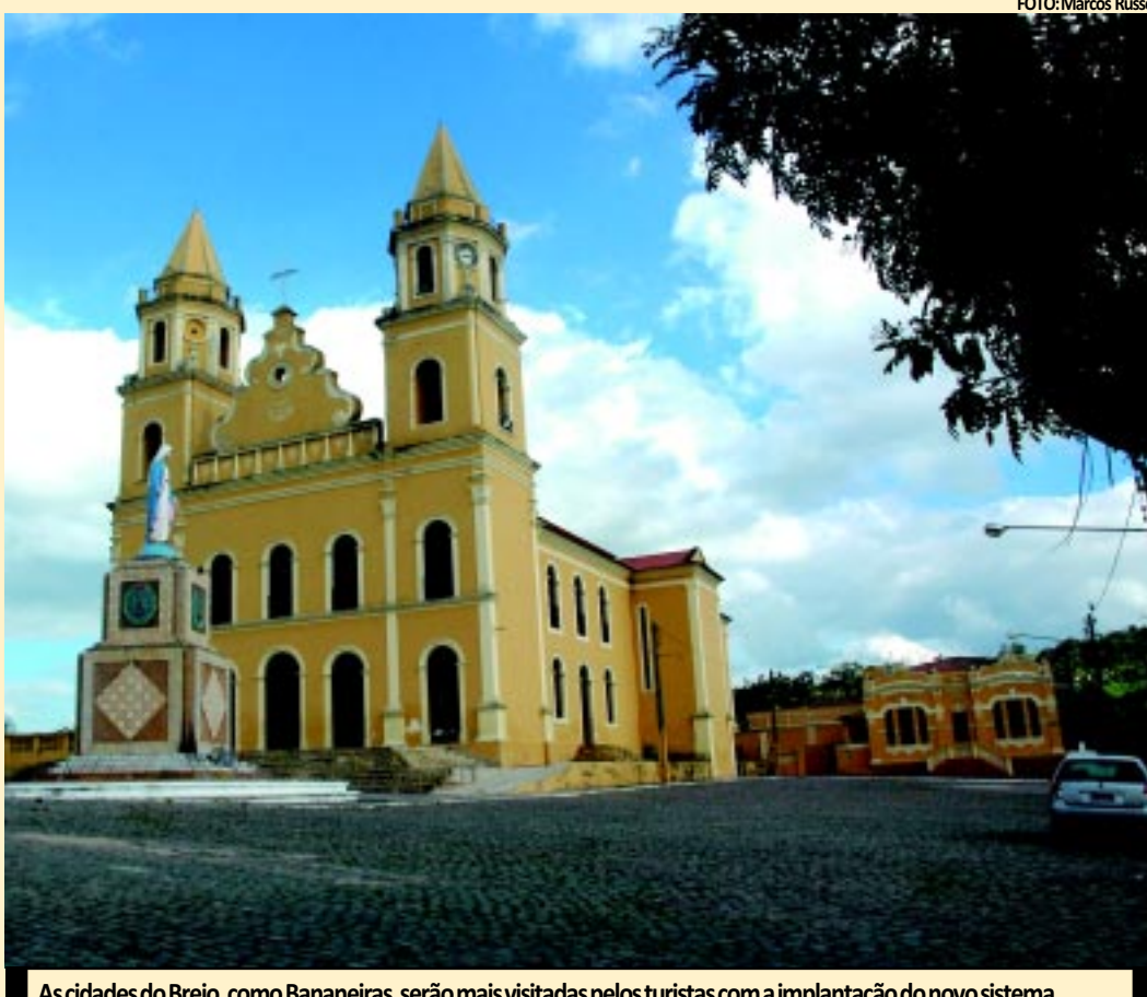
As cidades do Brejo, como Bananeiras, serão mais visitadas pelos turistas com a implantação do novo sistema