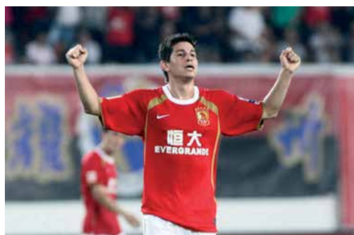
Conca joga na Ásia e quer voltar a atuar por um clube do Brasil

Nas Laranjeiras, o retorno de Conca no primeiro semestre de 2013 é considerado “improvável” pelos dirigentes.