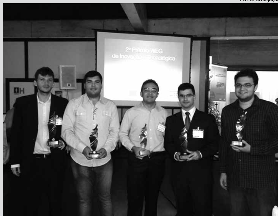
Pesquisa do Campus JP foi o primeiro lugar na categoria Graduação

O objetivo da pesquisa do Campus JP foi produzir um conversor estático com um gerador