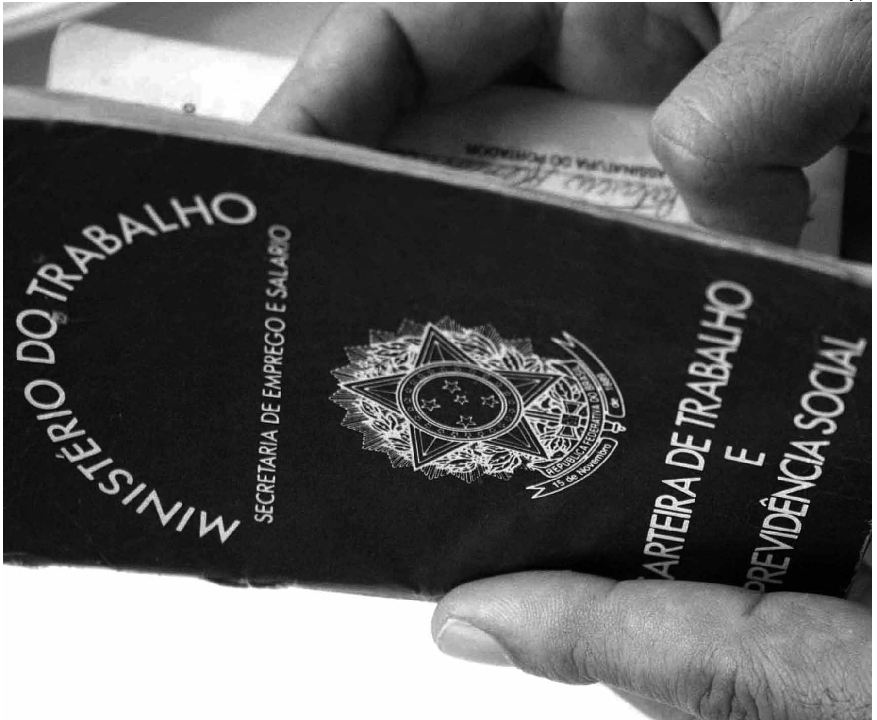
Carteiras velhas serão substituídas pelas novas feitas com material sintético mais resistente que trazem mais segurança para o trabalhador e evitam fraudes

Além da segurança, a informatização facilita a identificação dos trabalhadores por meio de uma base única de dados. Em caso de extravio do documento, os trabalhadores poderão pedir uma nova via em qualquer posto do ministério, em qualquer unidade