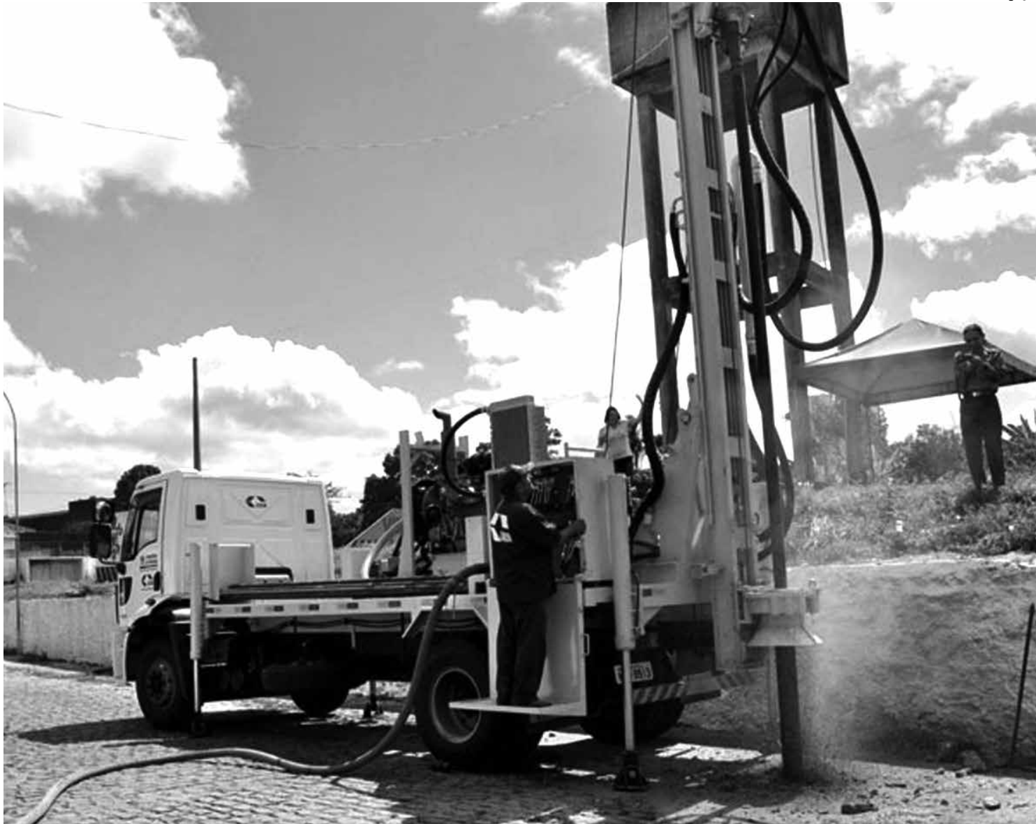
Na perfuração de poços, vem sendo utilizado equipamento moderno e o Governo do Estado investiu mais de R$ 1,5 milhão este ano

“Segundo os registros do órgão, esse é o número mais elevado dos últimos 15 anos e isso demonstra a intensidade com que o Estado está trabalhando para minimizar os problemas da seca em toda Paraíba. Essas ações são fundamentais para o Semiárido, onde existem milhares de pessoas em situação extrema