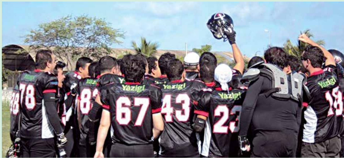
A equipe paraibana está invicta vai enfrentar no próximo sábado o Arsenal Cuiabá, uma das equipes mais fortes da competição

A partida contra os matogrossenses acontece às 18h do sábado, no Estádio Eurico Gaspar Dutra, o Dutrinha, em Cuiabá. O adversário do time pessoense vai enfrentar a equipe que foi campeã em 2010, e que ficou na segunda colocação no ano passado. O treinador da equipe Brian Guzman reconhece o currículo do adversário e sabe que o duelo será o maior desafio até hoje do Belo.