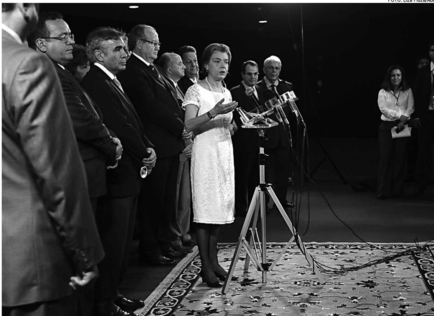
A presidente do Tribunal Superior Eleitoral (TSE), ministra Cármen Lúcia, fez ontem um balanço das eleições municipais deste ano

O TSE recebeu, ao todo, 8,3 mil processos relacionados às eleições municipais deste ano, sendo que 7,7 mil são recursos relacionados a registros de candidatura. Até agora, 5,4 mil processos foram julgados.