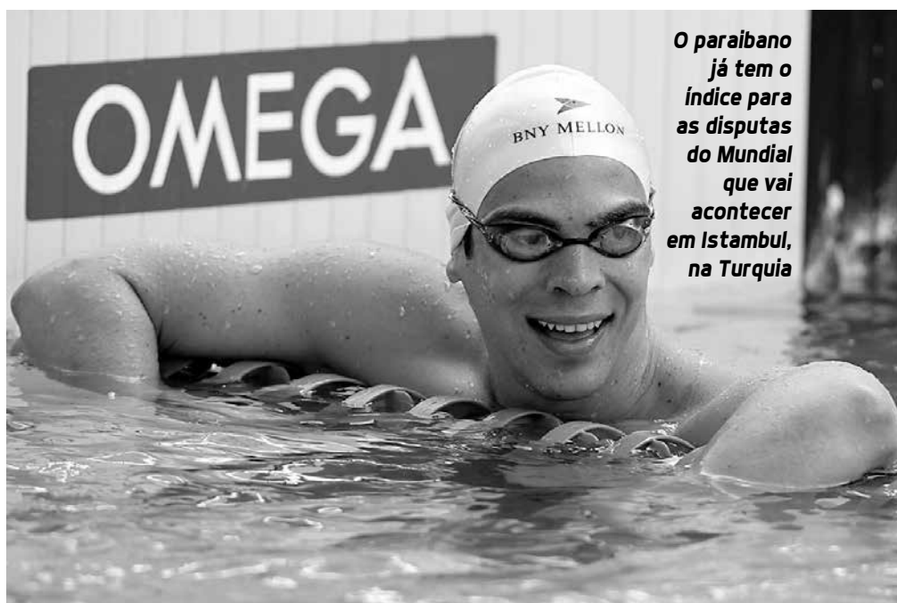
O paraibano já tem o índice para as disputas do Mundial que vai acontecer em Istambul, na Turquia

O time de nadadores da capital paulista também têm seis conquistas no Aberto de nataçao, mas perdeu a última edição para o Minas Tênis Clube. Dentre os cerca de 300 participantes, oito já conquistaram o índice, mas buscaram a classificação para mais provas. As competições começarão hoje e se estenderão até o próximo sábado. Os torneios serão simultâneos na cidade do interior paulista.