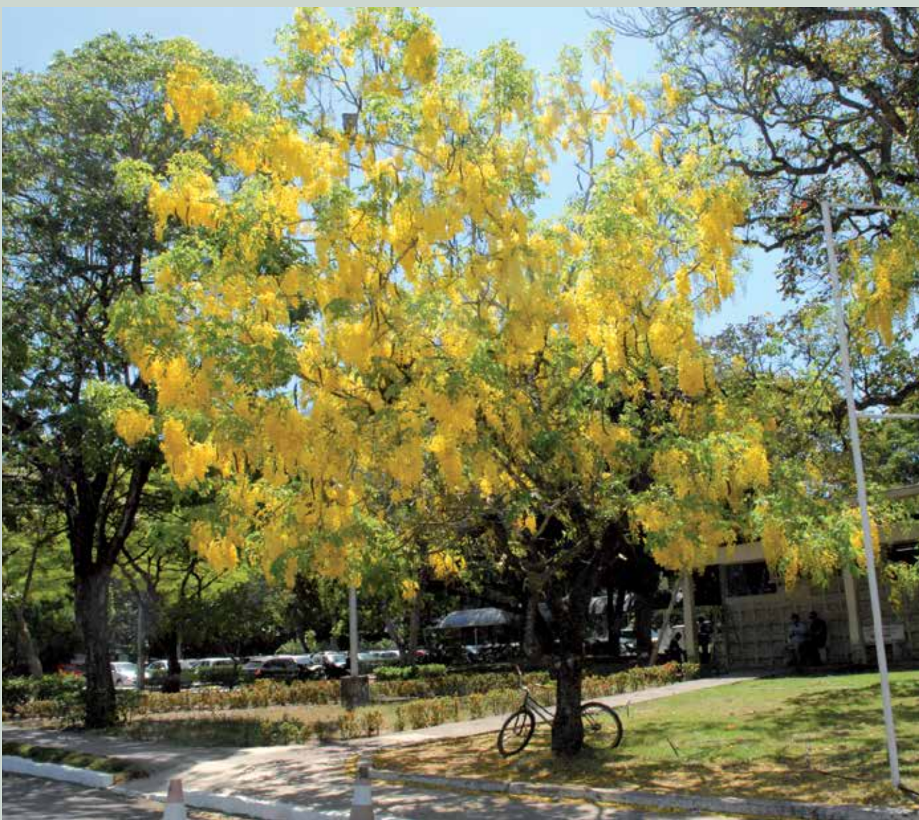
Quem transita pelas ruas do campus da UFPB, em João Pessoa, deleita os olhos com a beleza grandiosa das Acácias

Uma outra moradora da Capital da Paraíba, ainda aguarda o momento certo para atrair os olhares. Os ipês amarelos que embelezam o entorno do Parque Solon de Lucena estão em fase de preparação para florir. Em tupi-guarani, Ipê, significa "árvore de casca grossa", ele é apreciado pela qualidade da madeira, também servindo para fins ornamentais e decorativos. A árvore tem origens do cerrado, por conta disso, não neces-