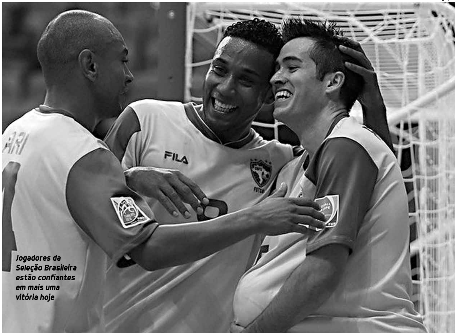
Jogadores da Seleção Brasileira estão confiantes em mais uma vitória hoje