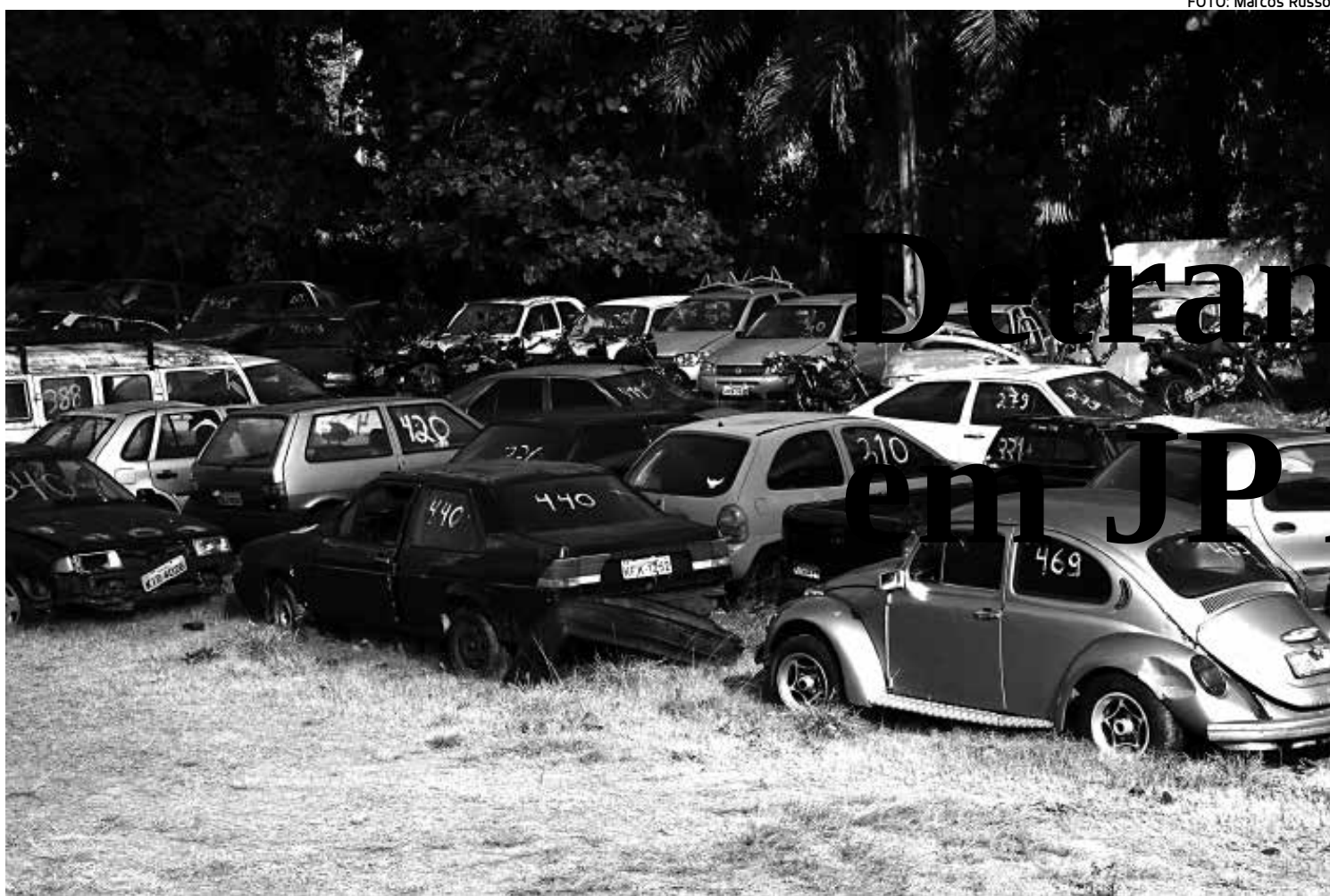
Os veículos que serão leiloados no próximo sábado estão recolhidos nos pátios do Detran e do Batalhão de Policiamento de Trânsito

No ato da arrematação, será exigida a apresentação de documentos do arrematante, original ou em cópia autenticada, sob pena de nulidade do lance. Para pessoas físicas serão exigidos CPF e cédula de identidade e CNPJ para pessoas jurídicas.