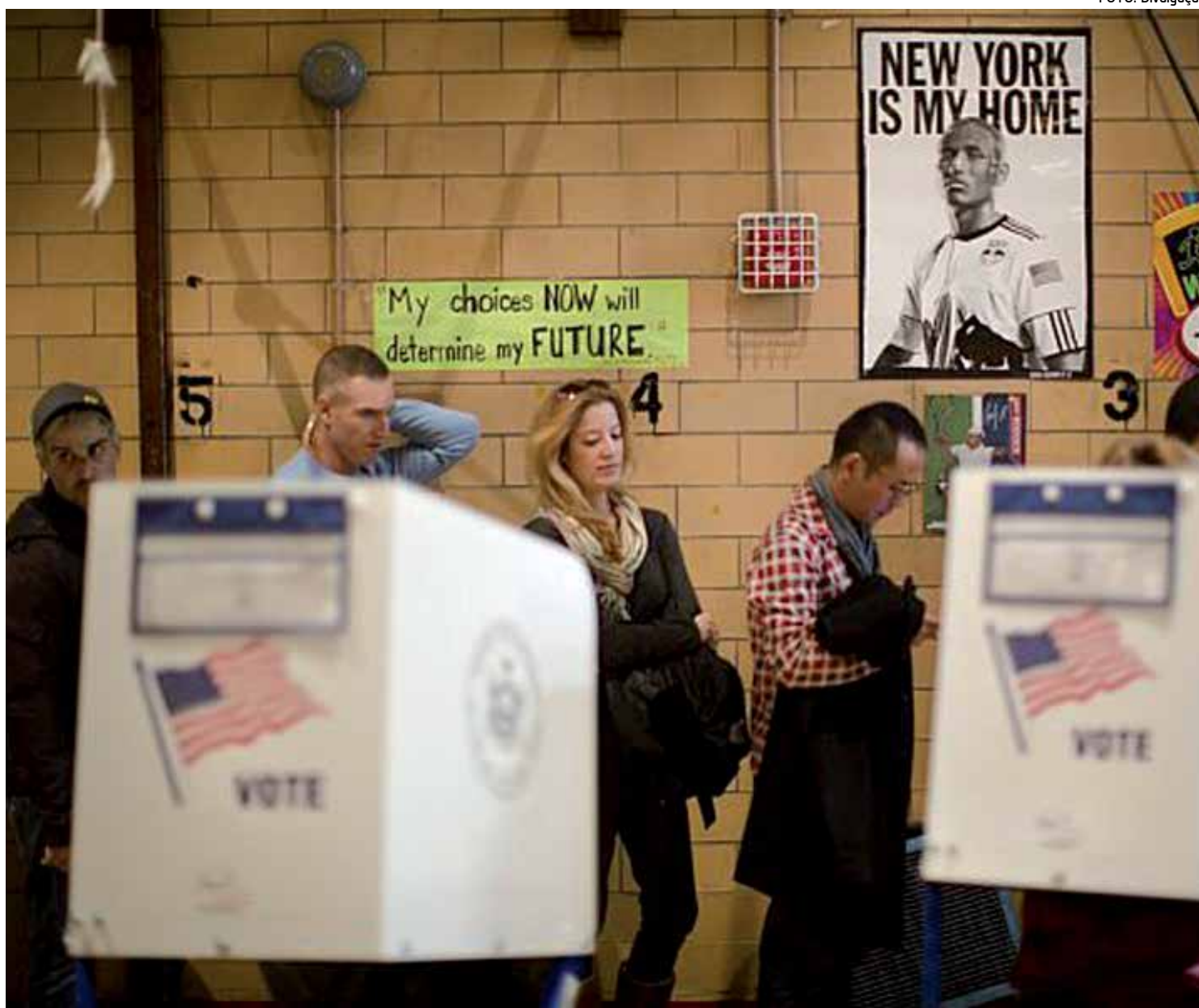
Os eleitores enfrentaram ontem longas filas e precárias condições dos locais de votação para participar das eleições presidenciais

“Tudo é possível, mas todos estão mais que preparados. Preparamos as pessoas para que compareçam onde for necessário, obviamente onde existir uma disputa acirrada”, disse Norcross.