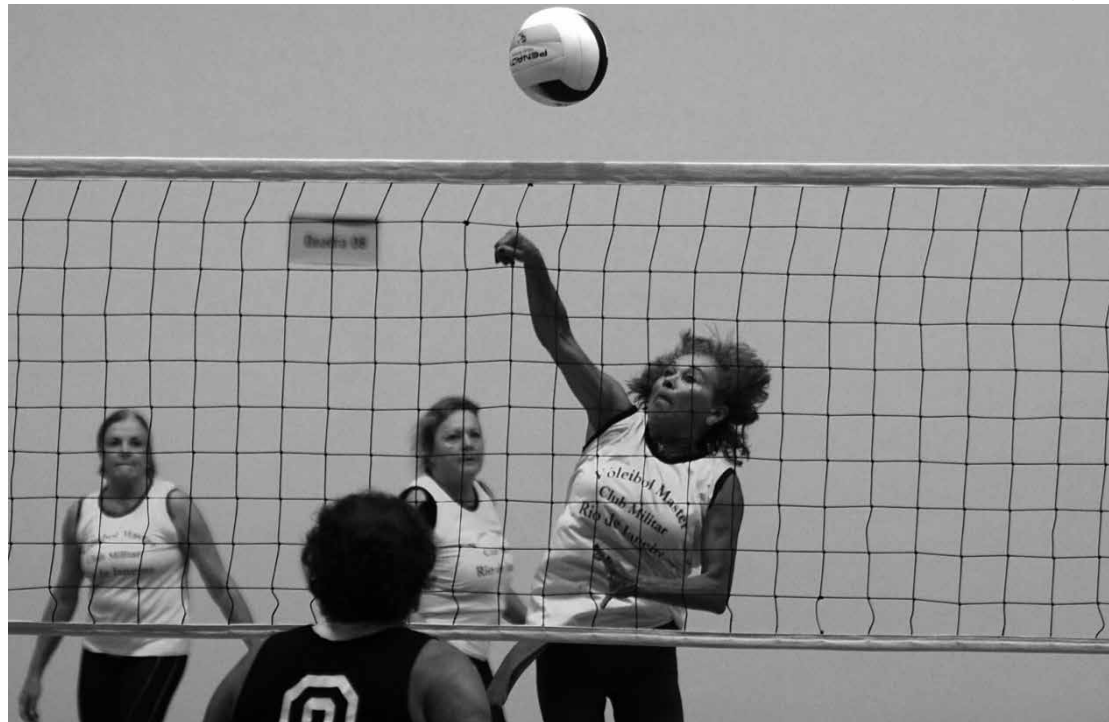
Competição também terá disputas de vôlei de quadra e prossegue até o próximo dia 17 no Rio de Janeiro