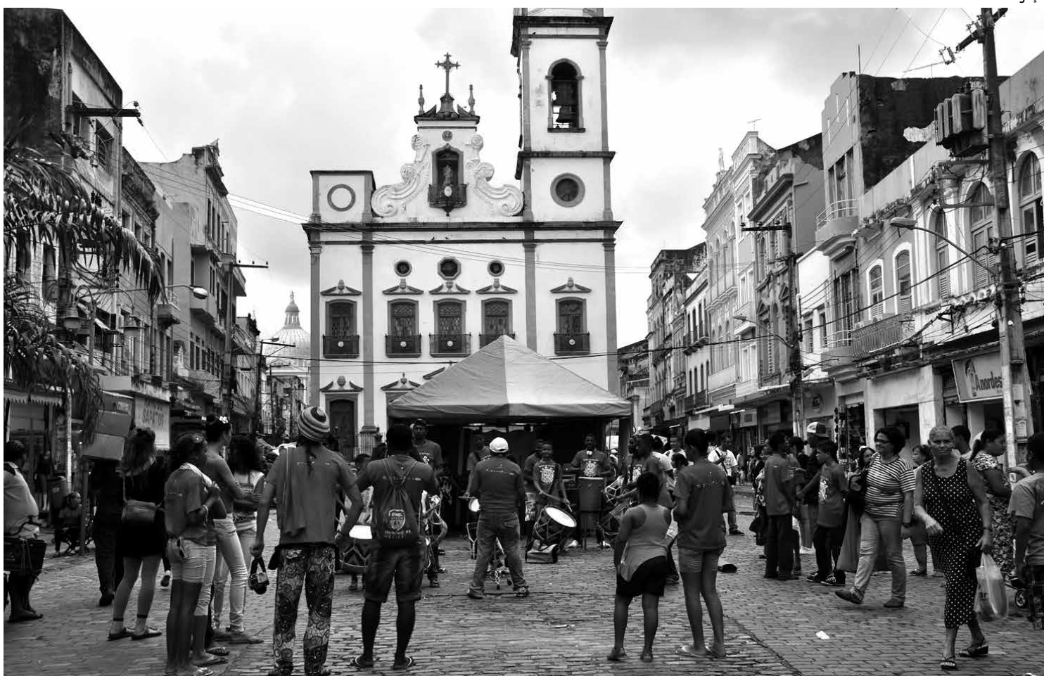
"O brasileiro tem uma alma mestiça e conseguiu essa mestiçagem naquilo que era mais difícil, no componente religioso", diz Mia Couto

"Faltava-me essa experiência", ressaltou. "Eu queria visitar a periferia de uma cidade brasileira pela mão de amigos, pela mão de gente da periferia", acrescentou o autor que também se sente procedente de um