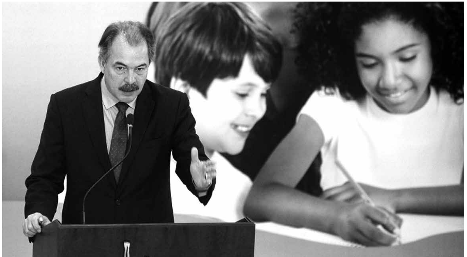
O ministro Aloizio Mercadante participou ontem do lançamento do Pacto Nacional pela Alfabetização na Idade Certa, no Palácio do Planalto

A média nacional de crianças não alfabetizadas aos oito anos chega a 15,2%