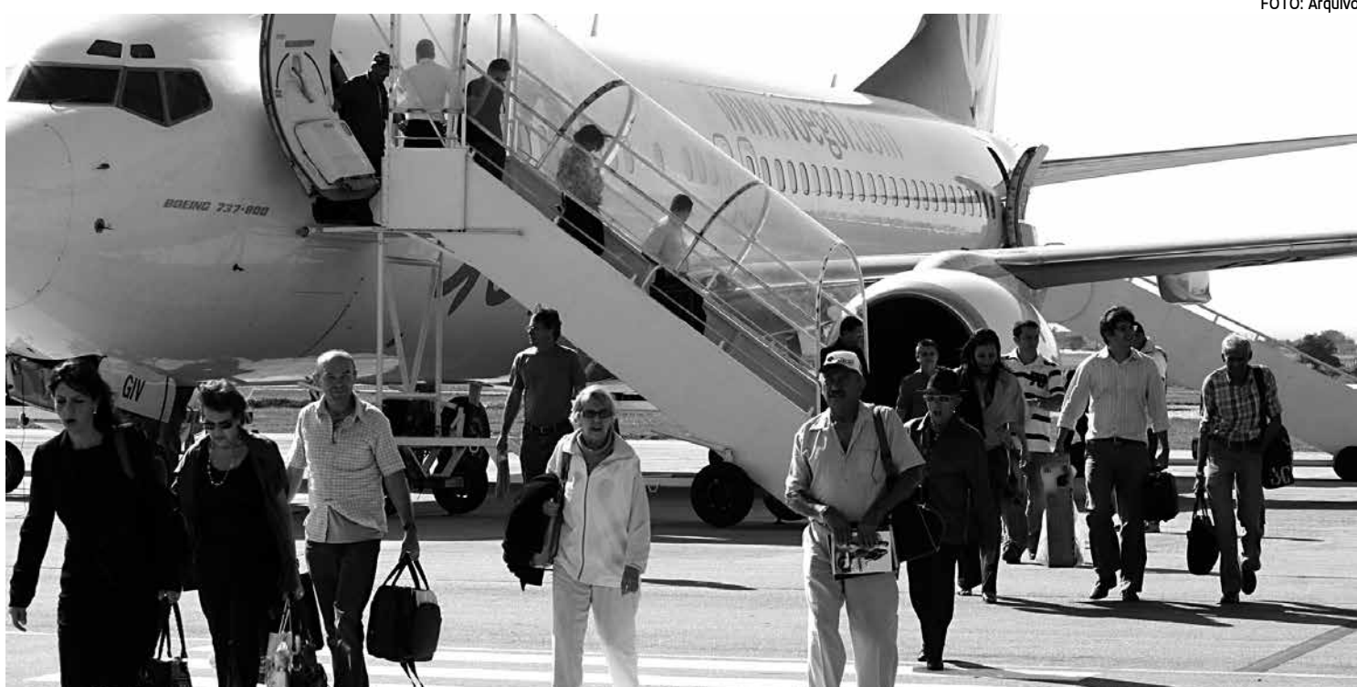
Em outubro passado foram registrados mais de 104 mil embarques e desembarques no Aeroporto Internacional Castro Pinto

Em 2011, o Castro Pinto registrou seu passageiro número um milhão em novembro. Neste ano, a Infraero divulgou o número em outubro, mais precisamente no dia 21. Pelos dados do setor de Estatísticas da PBTur, passaram pelos portões do equipamento 1.044.383 passageiros.