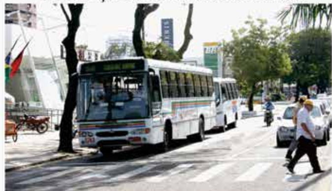
Com o estudo, novas ações que melhorarão o trânsito de João Pessoa serão implantadas