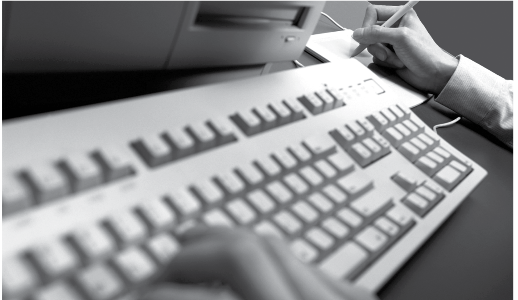
Unidade de produção de software da Microsoft no país será a quarta no mundo; outros laboratórios estão localizados na Alemanha, Israel e no Egito

O Brasil vai contar com o primeiro centro global de pesquisa e desenvolvimento (P&D) na área de software da Microsoft Research Internacional: o Laboratório de Tecnologia Avançada (ATL, sigla em inglês). Ele se insere no conjunto de iniciativas divulgadas pela empresa para o período 2012-2015, com investimento total de R$ 200 milhões.