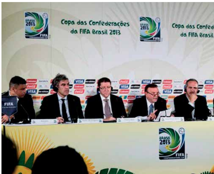
A alta cúpula da Fifa se reuniu no Brasil e deliberou sobre as sedes

Ele acrescentou que "nos darão conhecimento e experiência em transporte, segurança, acesso, infraestrutura para imprensa e tudo