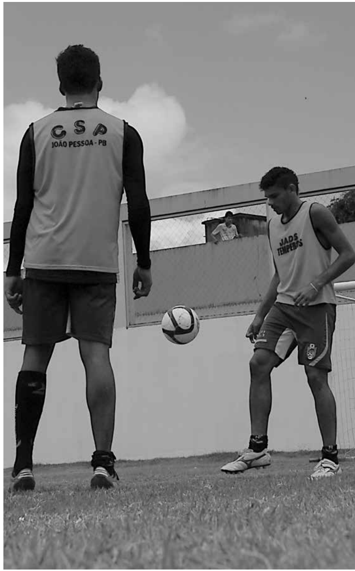
Jogadores do CSP treinaram ontem pela manhã no Estádio da Graça