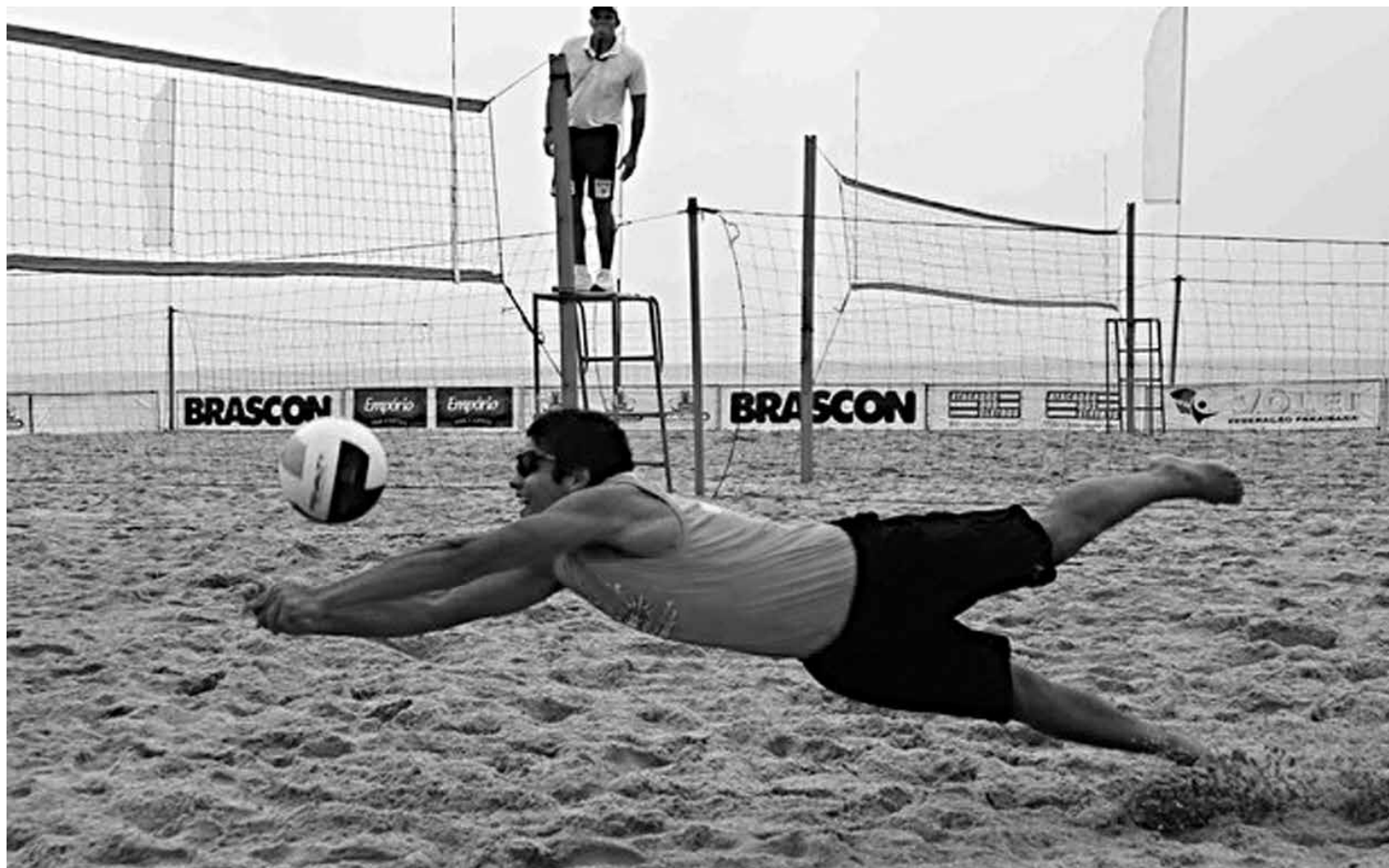
As disputas deste final de semana do Campeonato Paraibano Sub-21 vão acontecer na arena montada na Praia de Cabo Branco