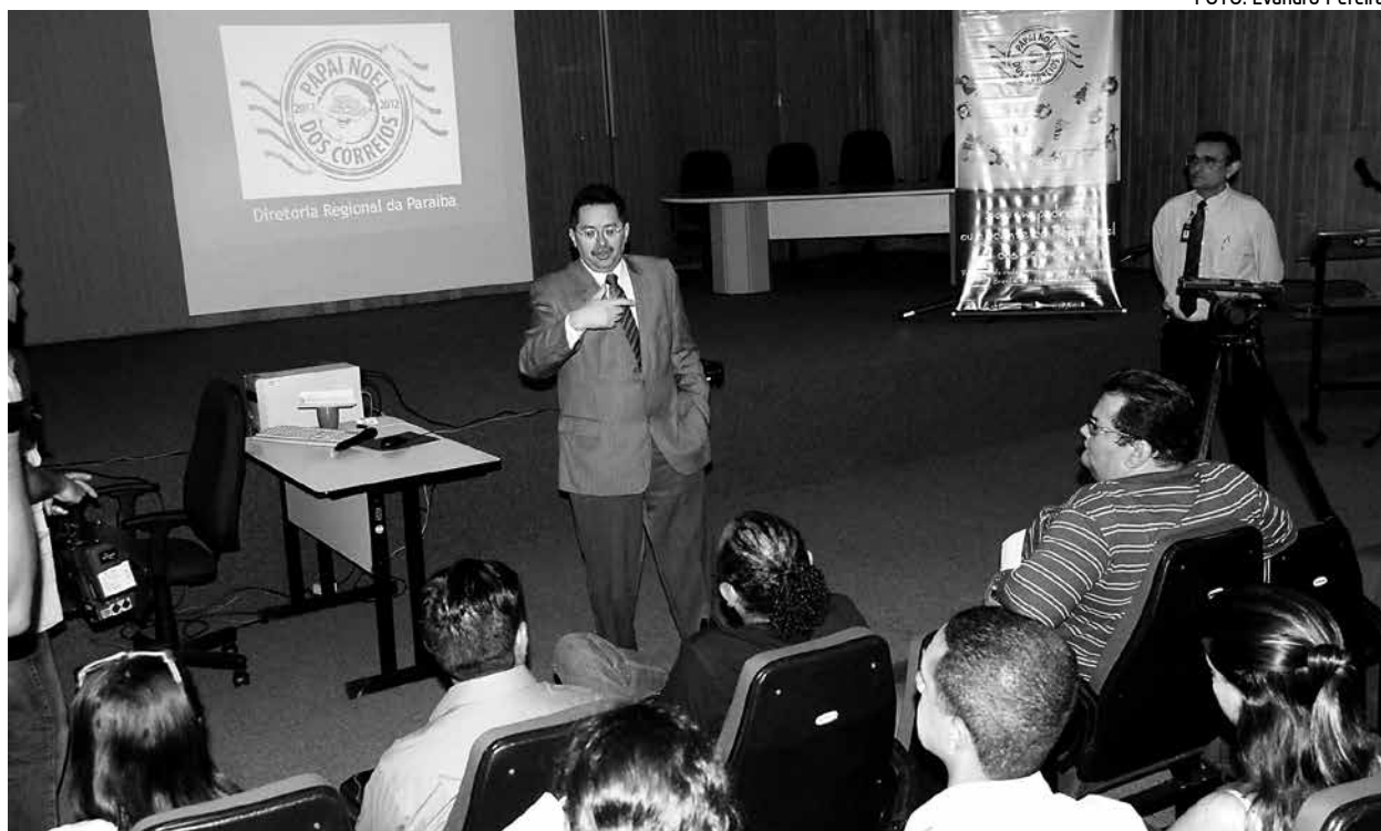
Durante reunião, ontem, a direção da ECT informou como será feita a Campanha Papai Noel dos Correios 2012