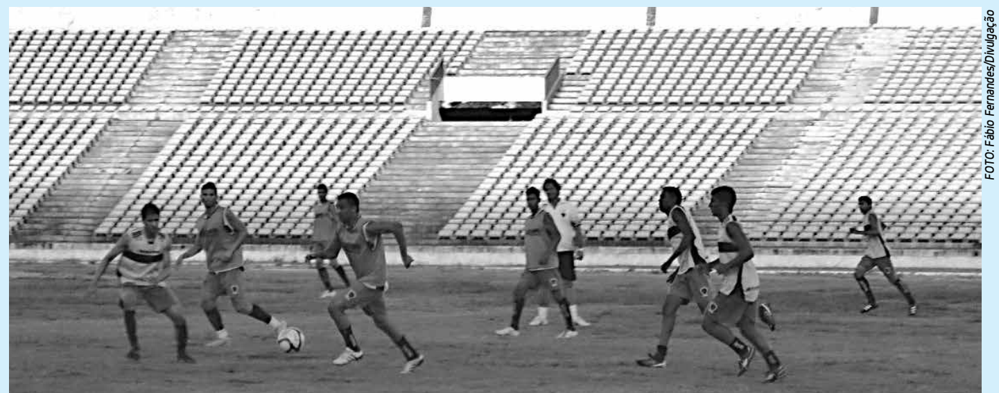
Jogadores participaram de um treinamento ontem pela manhã no Estádio Almeidão e hoje a prática vai acontecer na Graça

Os objetivos deste encontro é empessar os membros do Conselho Fiscal do Clube, recém-eleitos, assim como momologar o nome dos sócios indicados à compor as vice-presidências de patrimônio, administrativo, médico, social, finanças, futebol profissional, esportes amadores e olímpicos, além de marketing e relações públicas e jurídicos.