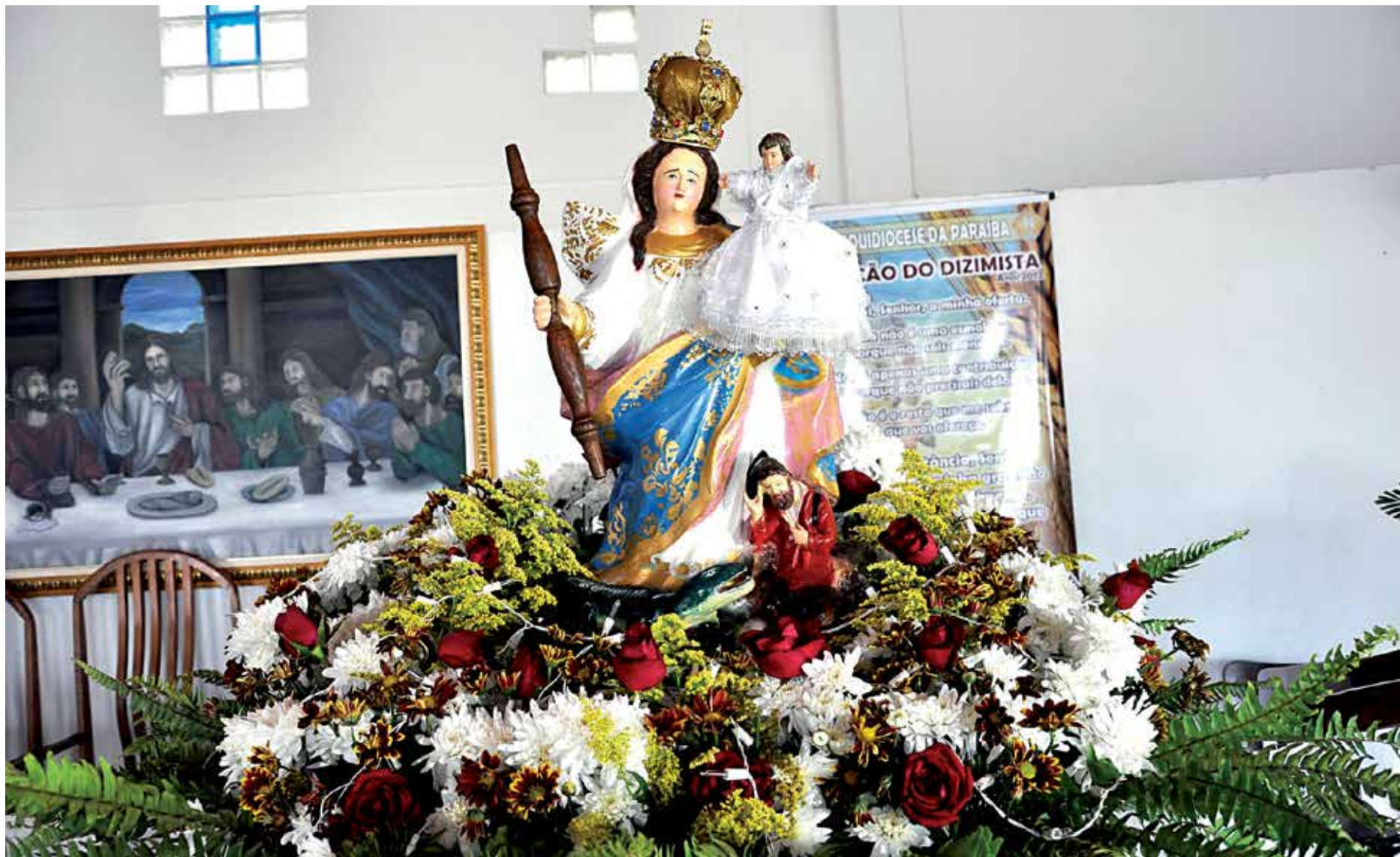
Imagem será ornamentada e, às 16h, segue para igreja de Nossa Senhora de Lourdes em carreta. Às 22h, ela retorna à Penha para celebração da missa