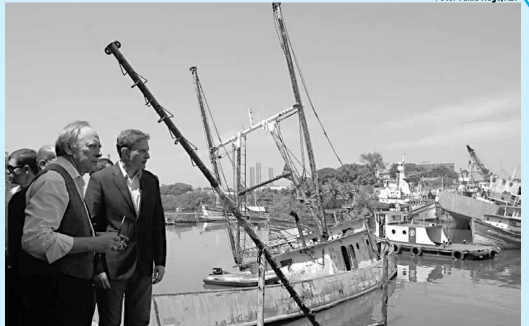
O secretário do Ambiente, Carlos Minc, e o ministro da Pesca, Marcelo Crivella, no Rio de Janeiro

Para a entrega, é necessário descarregar e embalar a arma. Munições devem ser transportadas separadamente. Os armamentos podem ser levados às delegacias da Polícia Federal, aos postos da Polícia Rodoviária Federal ou aos pontos cadastrados para o recebimento, que podem ser consultados no site da campanha.