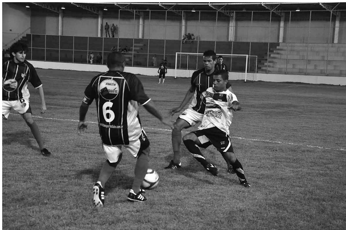
Debutante no Estadual e 2011, o Paraíba fez uma excelente campanha e terminou em quinto lugar

"Quem começa cedo se prepara melhor em todos os sentidos, afinal, será uma competição difícil e acirrada e não podemos perder tempo. Temos um planejamento definido e queremos manter a disciplina dos