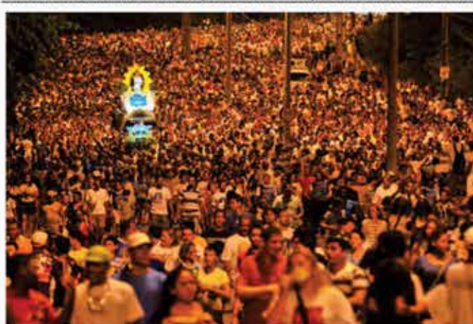
Os fiéis que participarão da Romaria contarão com reforço nos ônibus na volta para casa