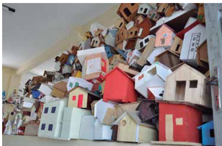
Fiéis deixam ex-votos para agradecer pela graça alcançada