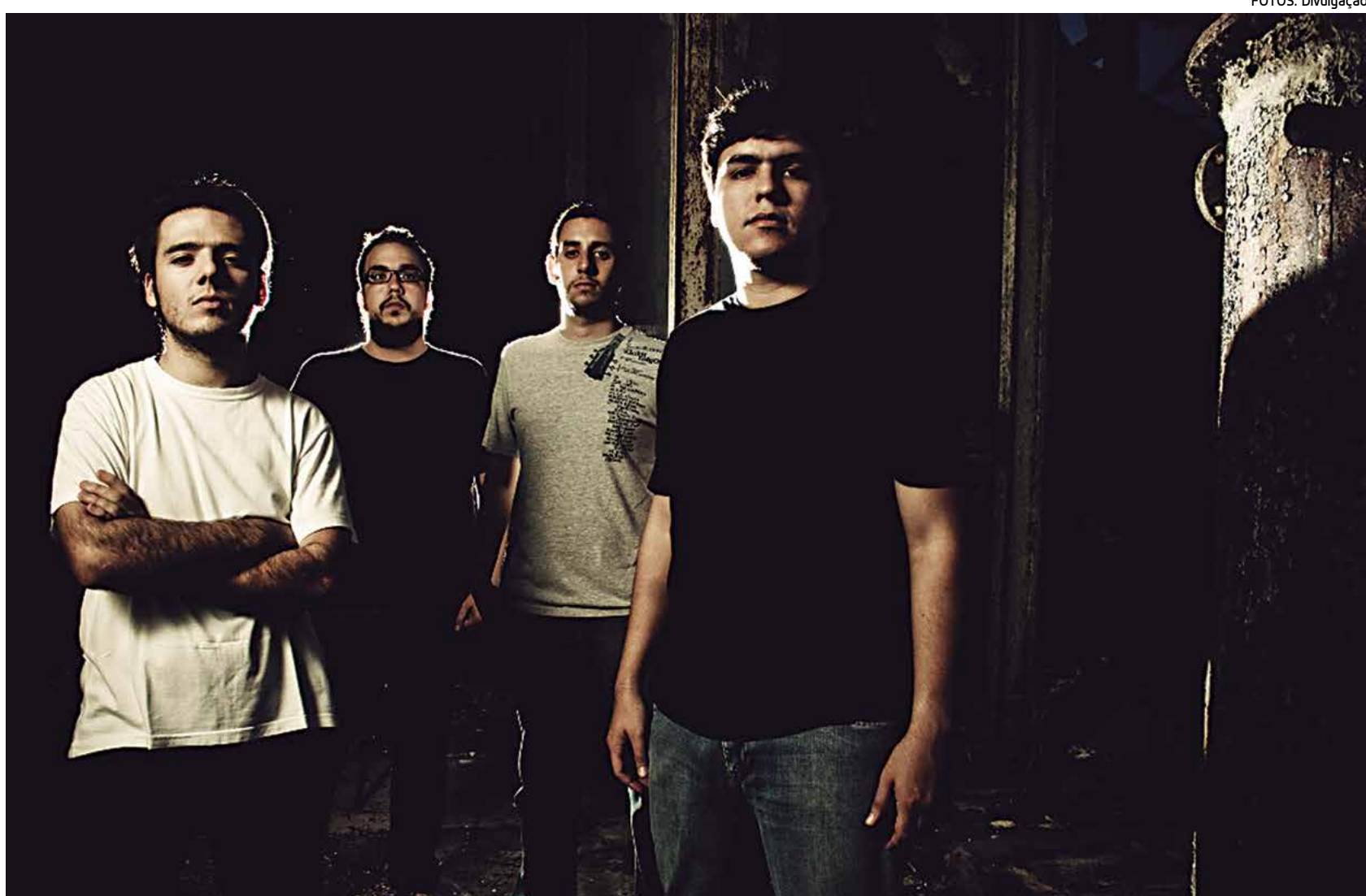
A banda Hazamat, que se apresenta hoje na Praça Rio Branco, faz um rock'n'roll multifacetado e deve começar a produzir um álbum em 2013

“Dizemos que começou em 2009 uma nova fase de uma velha ideia. Temos um grupo desde 2004, mas a