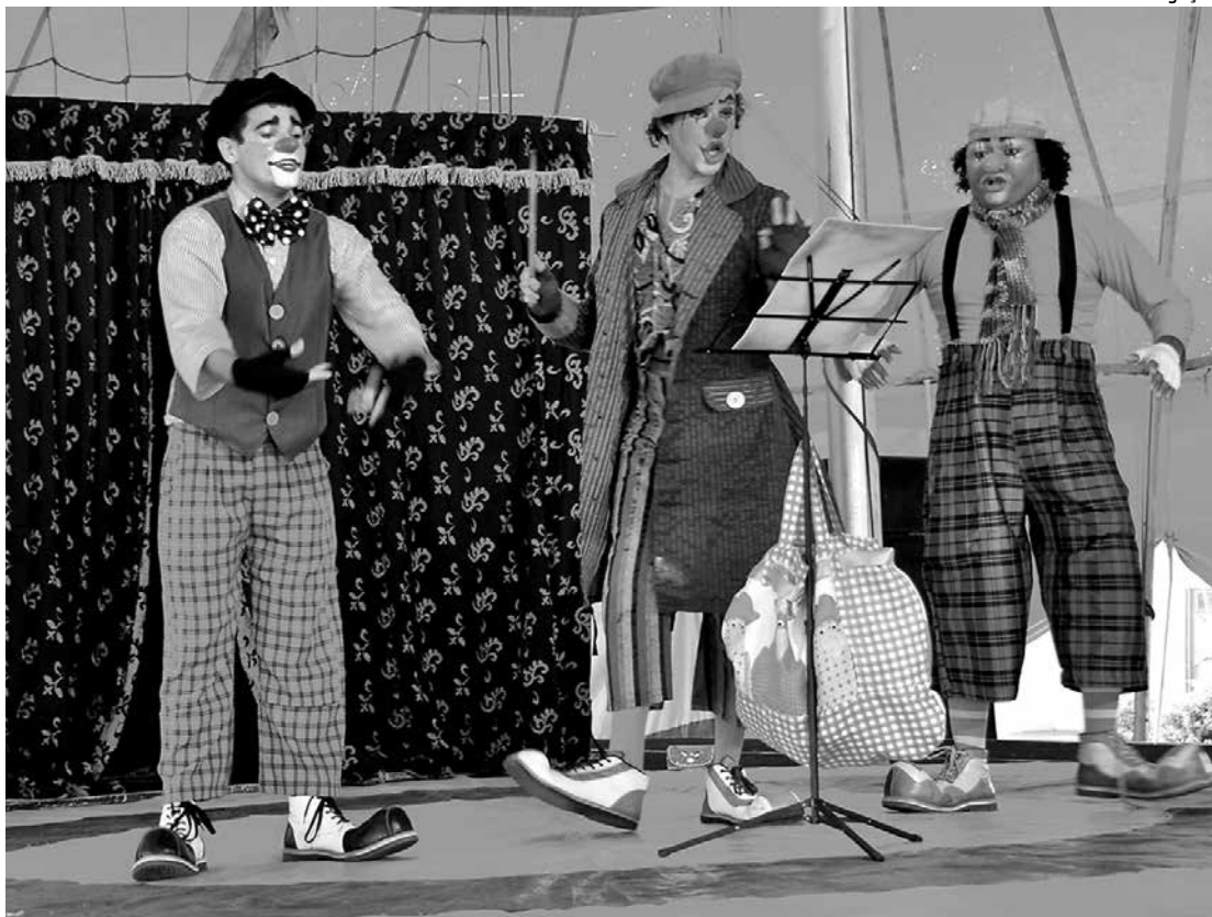
Por que Não Servem Pizza no Natal? , da Trupe Arlequin, mostra a discussão entre três palhaços