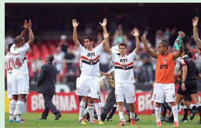
O São Paulo terá Ganso no jogo de hoje contra o Corinthians

Além disso, Dorival quer que o Flamengo termine o ano de maneira honrosa até por respeito ao torcedor. Segundo o treinador, o relaxamento natural que acontece nestas situações não pode ser visto no Rubro-Negro.