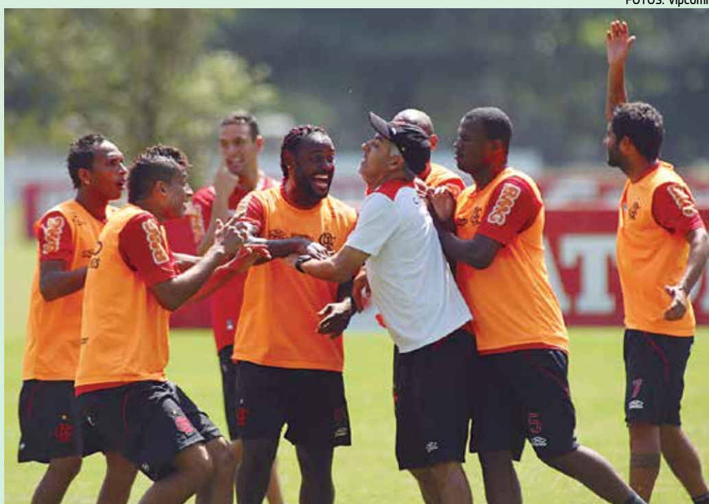
O Flamengo treinou de forma descontraída para enfrentar o Vasco hoje à noite no Engenhão

O atacante Neymar vai desfalar o Santos no clássico contra o Corin-