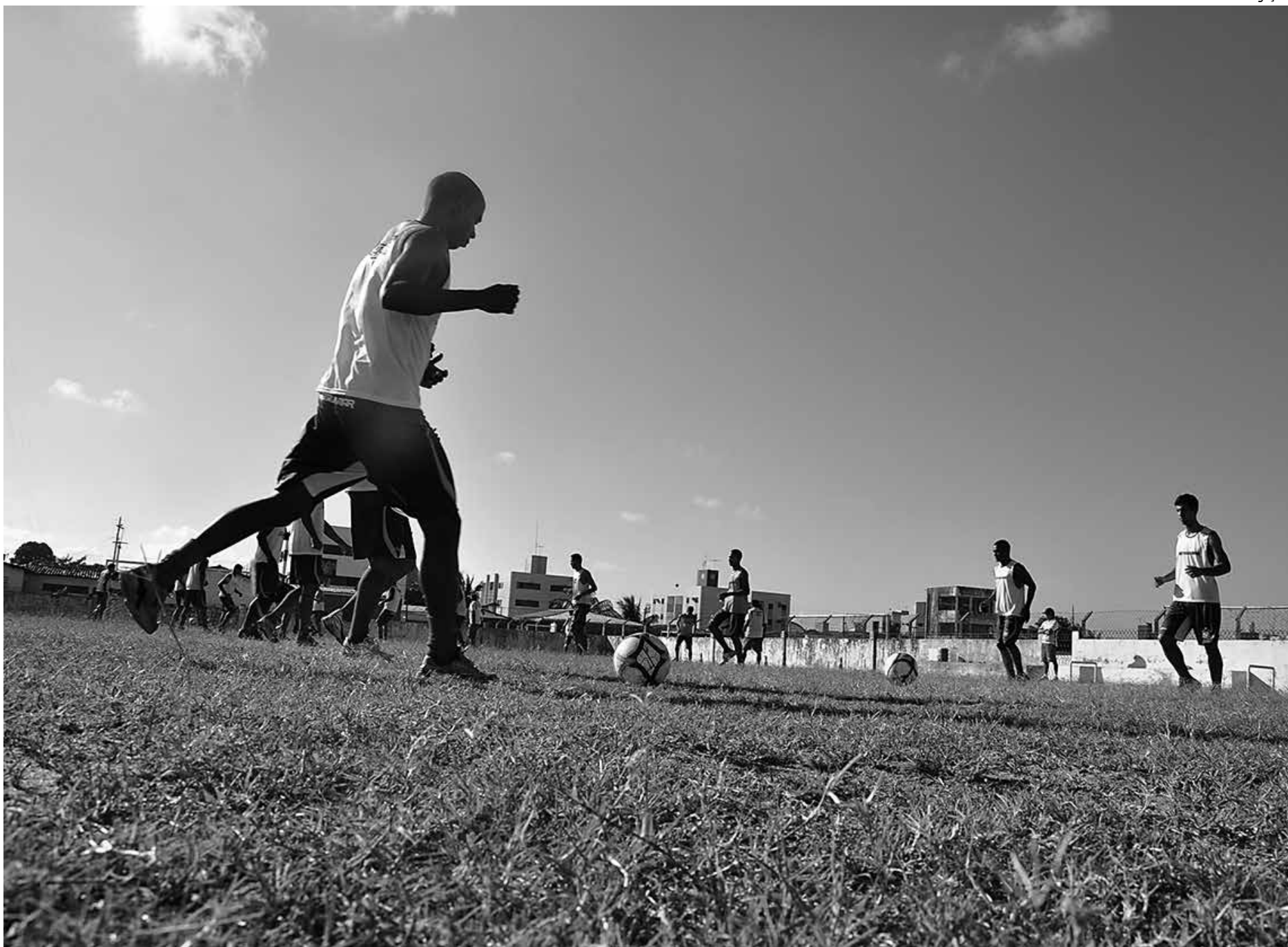
Sem condições de investir para formar um elenco de bom nível técnico, como fez no ano passado, o Auto vai aproveitar a base e atletas que estão despontando no futebol