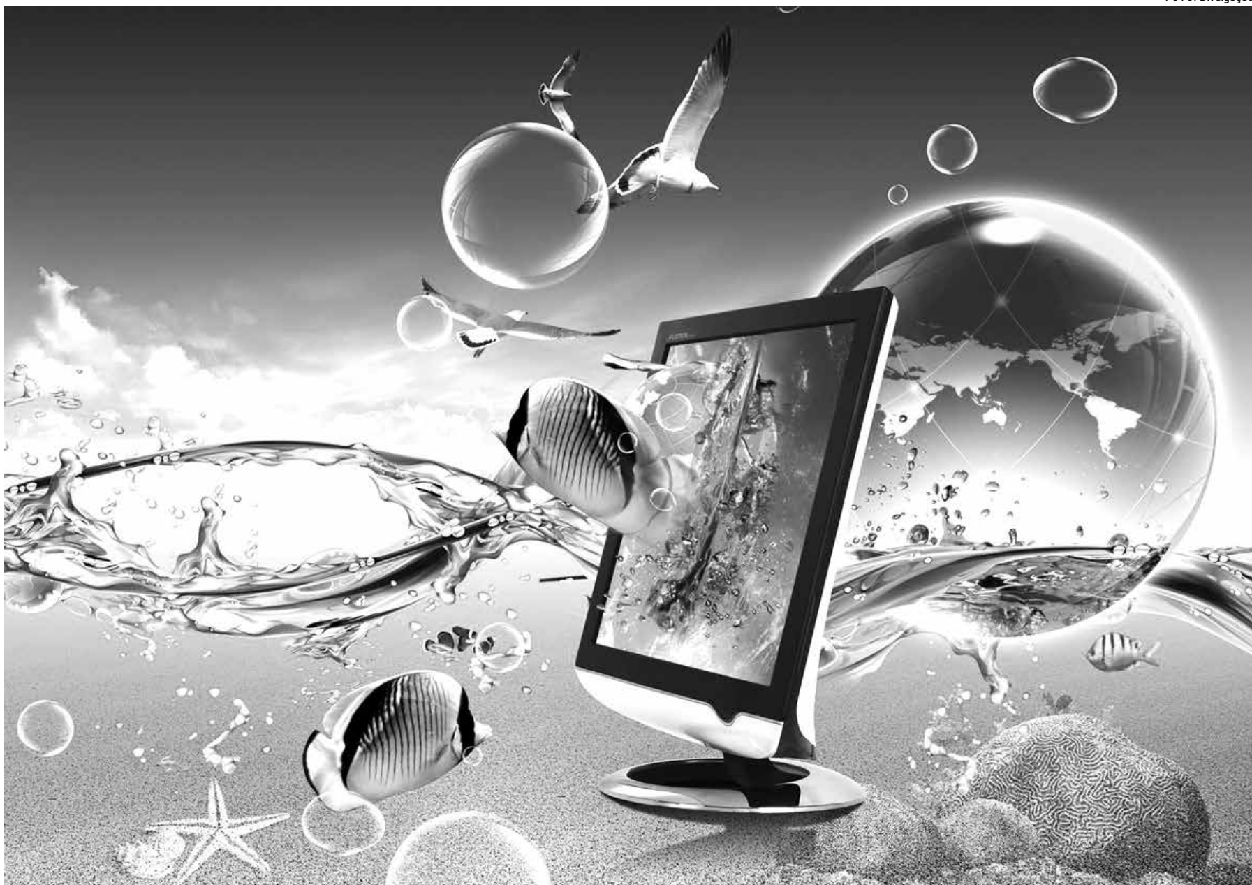
Tecnologia 3D permite uma maior interatividade dos alunos por meio de imagens tridimensionais e realidade virtual e vai melhorar o desempenho dos professores

A área de atuação da Sudene são os estados nordestinos (Alagoas, Bahia, Ceará, Maranhão, Paraíba, Pernambuco, Piauí, Rio Grande do Norte e Sergipe) além de municípios do extremo norte de Minas Gerais e do Vale do Jequitinhonha e do norte do Espírito Santo.