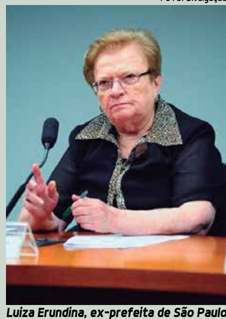
Luiza Erundina, ex-prefeita de São Paulo

A programação do evento, cujo credenciamento terá início às 8h30m, contará ainda com a transmissão ao vivo pela internet, através do blog do PSB disponível em http://www.psbpb.blogspot.com .