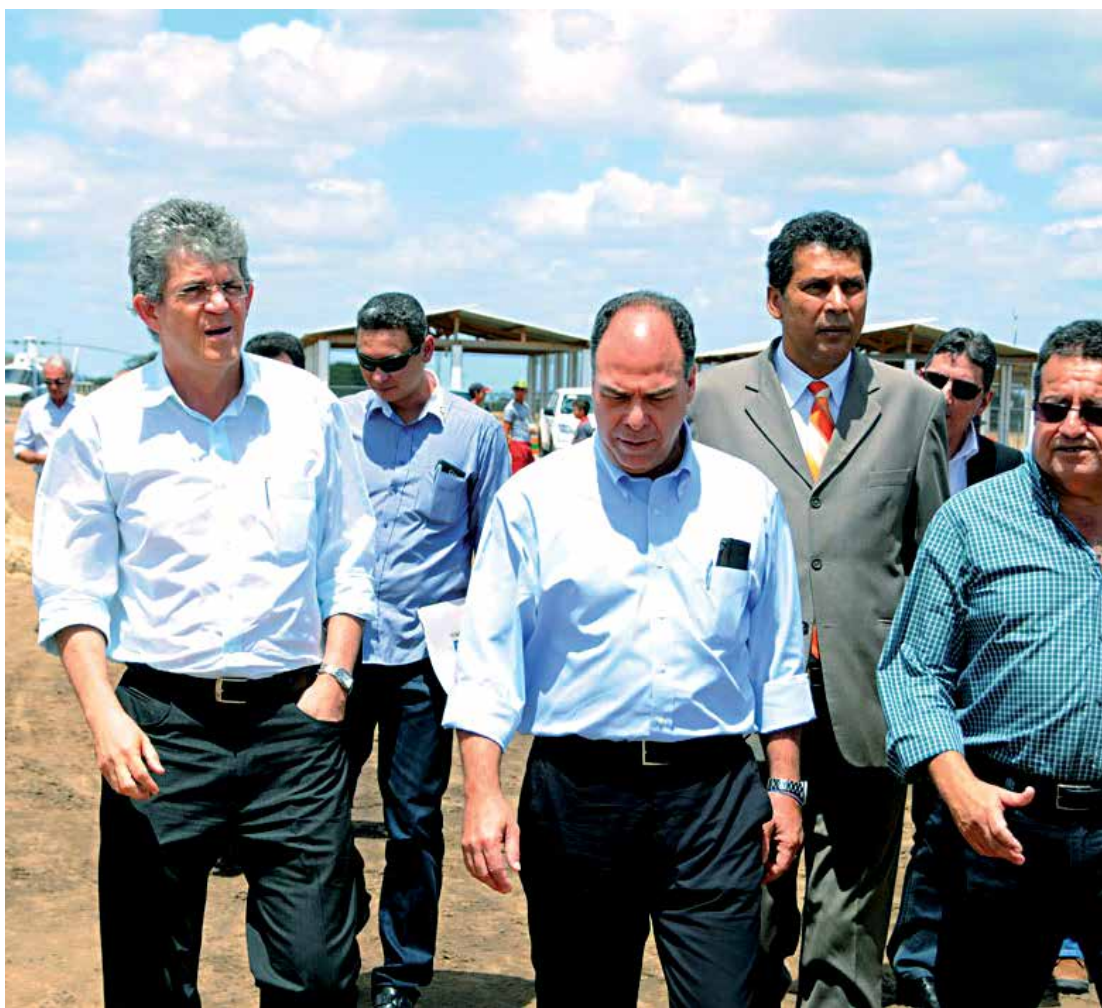
O governador Ricardo Coutinho e o ministro Fernando Bezerra visitaram o canteiro de obras