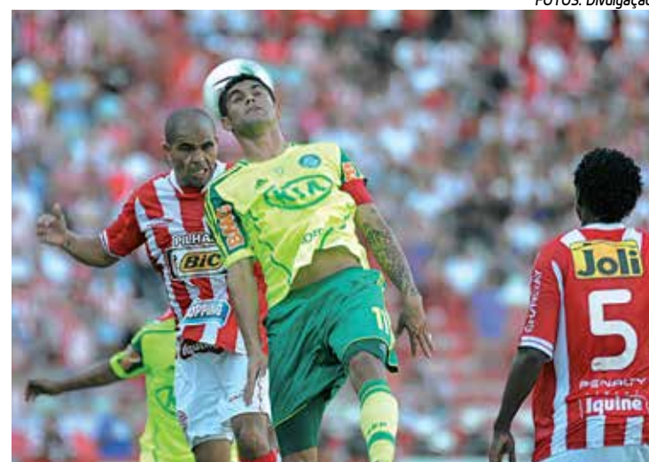
No último domingo, o Palmeiras voltou a perder para o Náutico