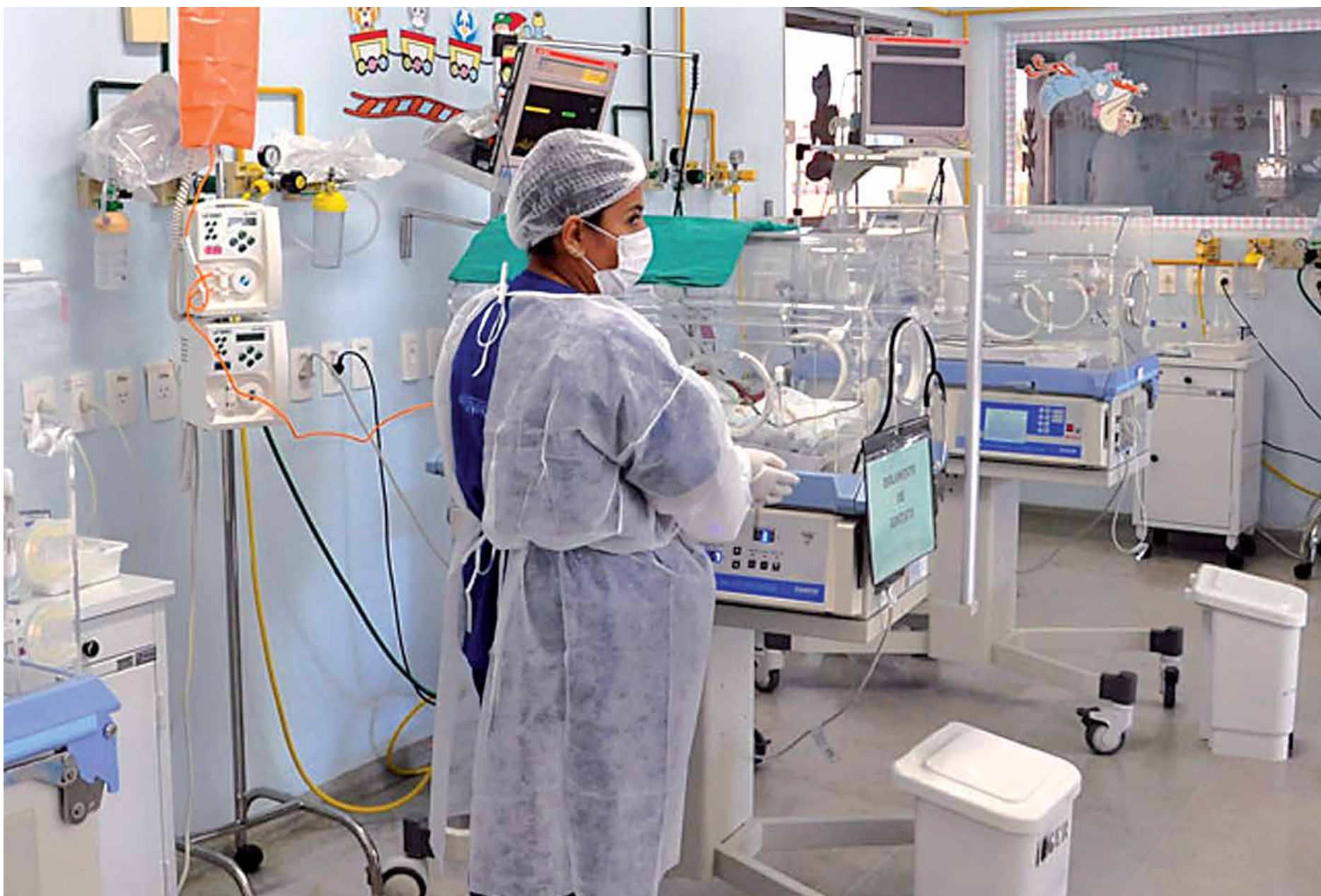
Unidade de Terapia Intensiva do Hospital Edson Ramalho presta serviço humanizado às crianças e integra a Rede de Cardiologia Pediátrica da Paraíba e de Pernambuco

“Os resultados até agora são positivos e temos que prestar conta ao Governo da Paraíba do que foi feito pelas crianças cardiopatas no Estado”, destacou o médico.