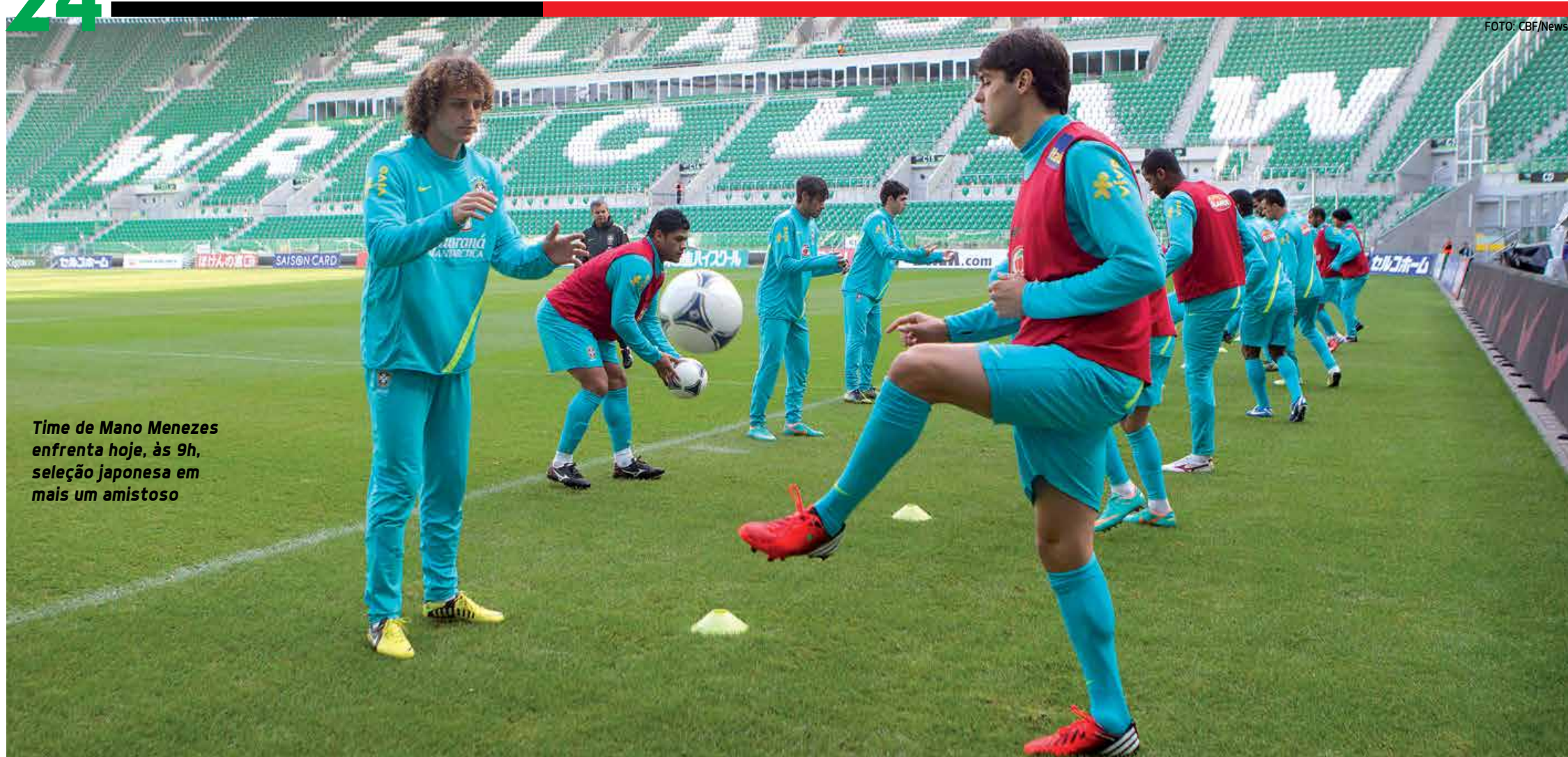
Time de Mano Menezes enfrenta hoje, às 9h, seleção japonesa em mais um amistoso