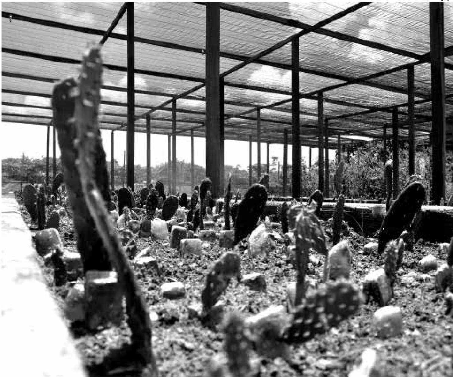
Palmas serão doadas a produtores com o objetivo de substituir as variedades que estão sendo dizimadas pela cochonilha-do-carmim