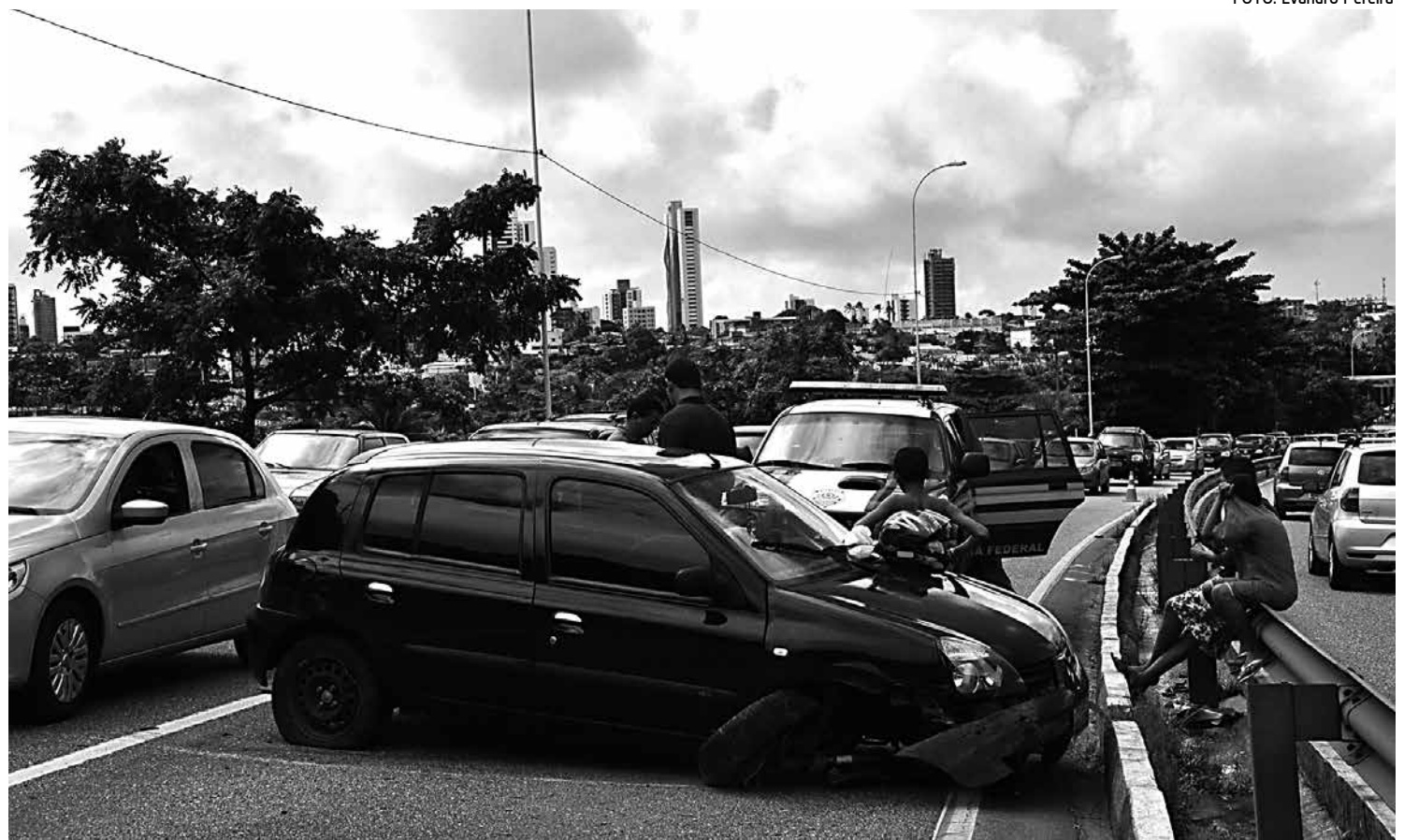
A Polícia Rodoviária Federal aponta a imprudência dos motoristas como a principal causa dos acidentes registrados no feriadão