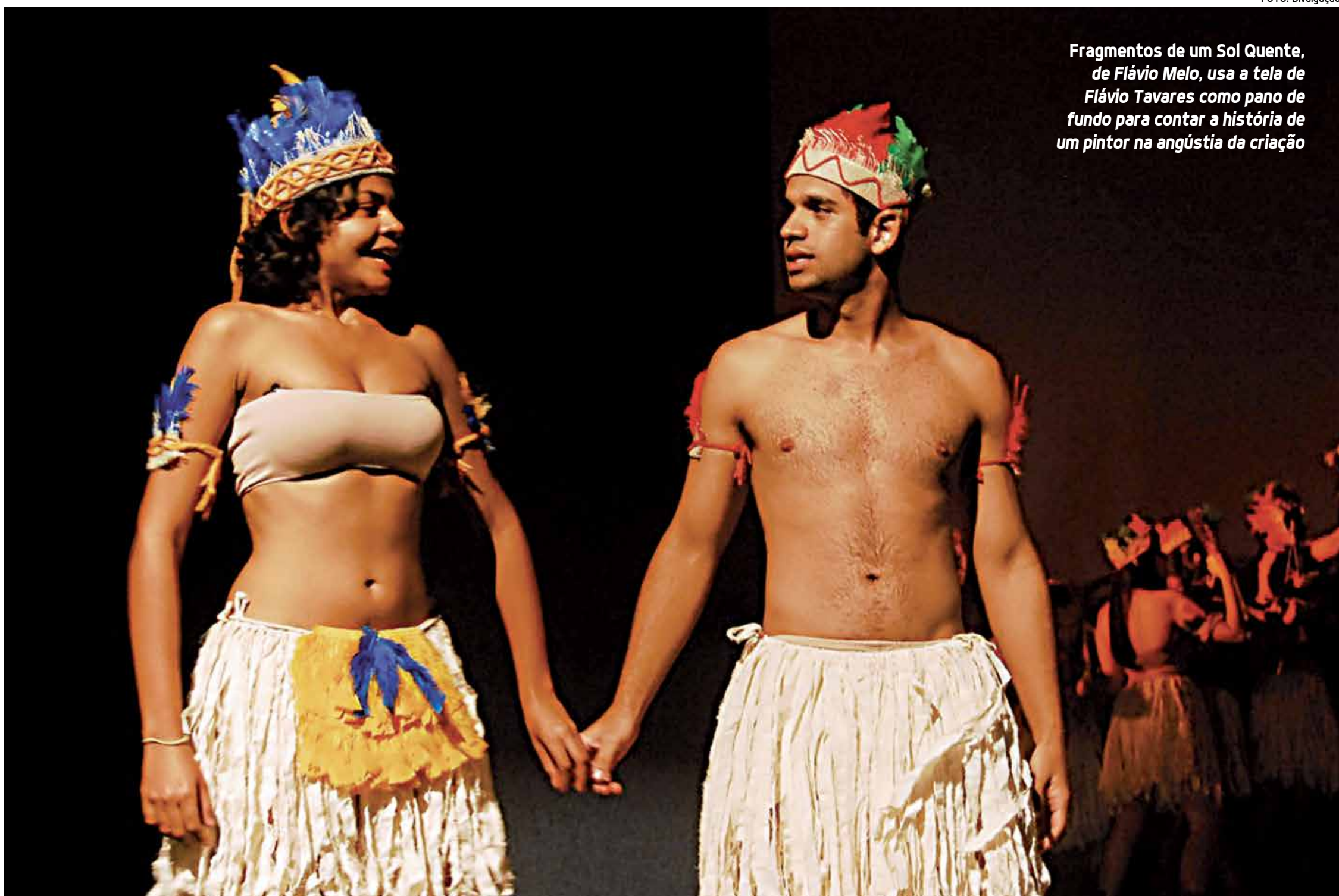
Fragments de um Sol Quente, de Flávio Melo, usa a tela de Flávio Tavares como pano de fundo para contar a história de um pintor na angústia da criação