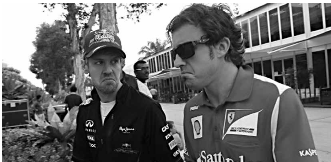
Vettel e Alonso estão travando a luta pelo título de campeão da temporada de 2012 da F-1

“No final do segundo trecho, cometi um erro e travei a roda dianteira direita na freada da curva 3. Acho que muita gente sofreu com os pneus dianteiros e, na última parte, tentamos controlar isso. Como tínhamos uma boa vantagem, pudemos controlar até o fim, mas ficamos o tempo inteiro monitorando a situação pelo rádio”, contou.