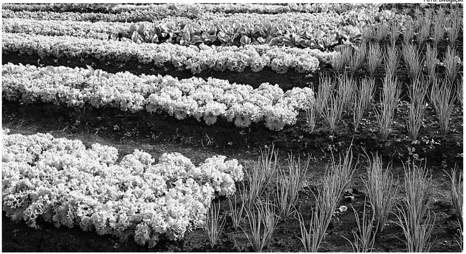
A cidade de Poço Dantas foi incluída no projeto de Horta Comunitária pelo Ministério do Desenvolvimento Social e Combate à Fome

Os recursos para o concurso estão previstos no orçamento do município e todo o processo está fundamentado na Lei federal 10520/2002.