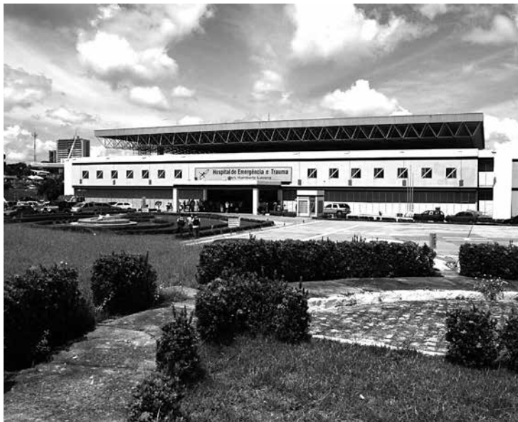
A unidade de saúde conta hoje com 65 fisioterapeutas

O Hospital Estadual de Emergência e Trauma Senador Humberto Lucena deu início ontem, as comemorações da ‘Semana Nacional de Fisioterapia’ com o tema ‘Resgatando a Valorização e Reconhecimento Profissional da Fisioterapia: Um Novo Recomeçar’. O objetivo é homenagear os profissionais da área, estimulando a interação e o trabalho em equipe. Atualmente, a unidade de saúde conta com 65 fisioterapeutas.