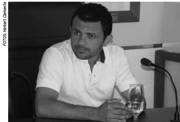
Presidente do CSP disse que houve uma pagão diante do Bota