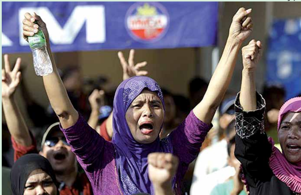
Mulheres comemoram o acordo de paz histórico entre o governo filipino e guerrilha muçulmana