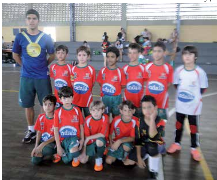
A equipe do Clube dos Oficiais brilhou na Taça Nordeste de Futsal