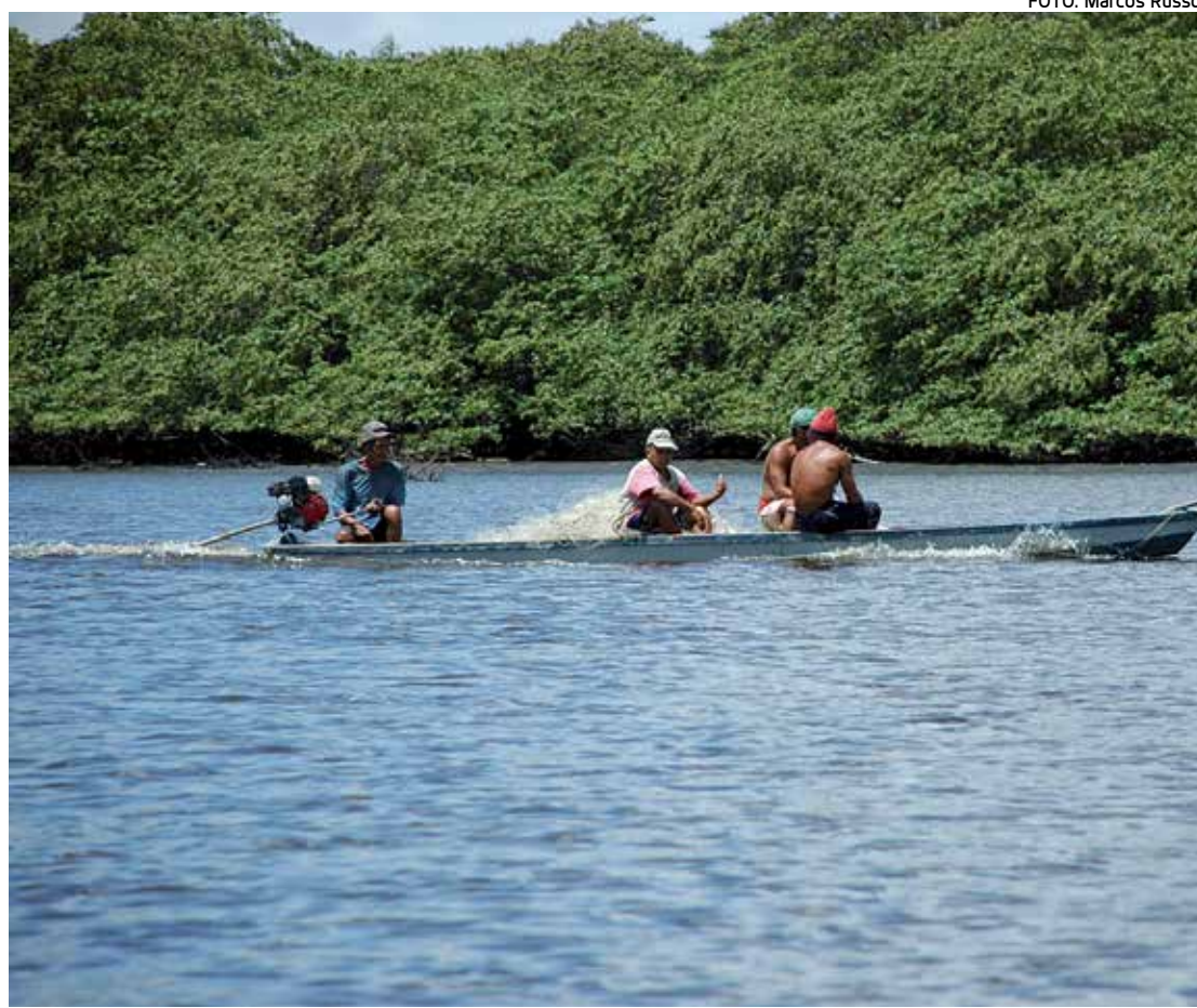
Cerca de nove mil pescadores paraibanos registrados serão beneficiados com um salário mínimo

ou ainda, nas entidades credenciadas pelo Ministério do Trabalho e Emprego - MTE, mediante a apresentação dos documentos da categoria, a exemplo da carteira de registro do pescador.