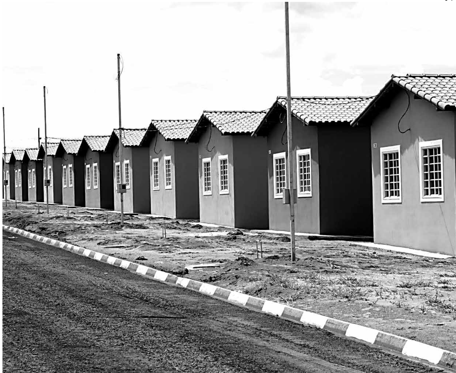
Acesso ao financiamento da compra da casa própria ficou mais fácil para as famílias com a ampliação do limite de renda

Para as cidades com população igual ou superior a um milhão de habitantes, o valor máximo para contratação dos imóveis do