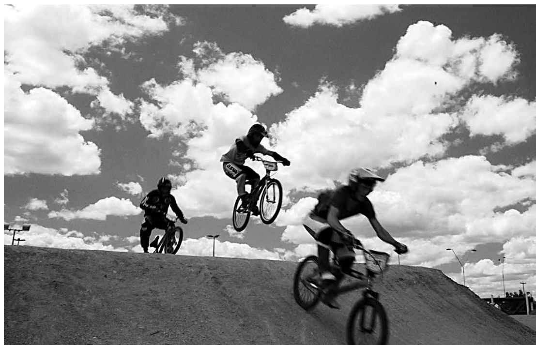
A competição nacional aconteceu no último final de semana na cidade de Feira de Santana-BA

"Para o Sul o Juninho deve ir, porque vai receber a premiação pelo título e, porque o pai dele deve pagar sua viagem, mas os outros não devem ir por falta de apoio. Estamos felizes com a volta do Bolsa-Atleta, apesar de que não voltou da forma que nós queríamos, mas de qualquer forma é uma ajuda. São sete estados que sediam a competição então é complicado bancar essas despesas", finalizou.