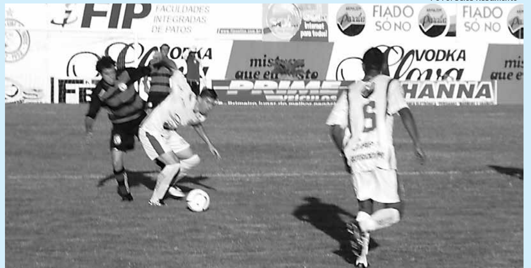
O Esporte de Patos caiu para a Segunda Divisão este ano depois de uma fraca campanha

"A partir da próxima temporada o Esporte terá uma nova realidade no futebol, com um CT digno de um grande clube da