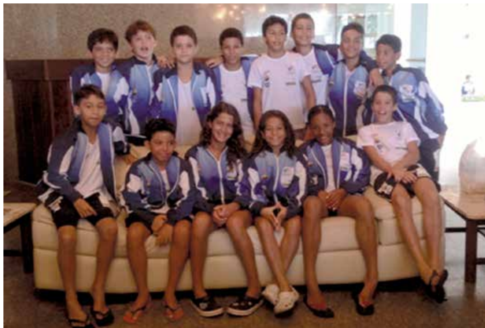
Os atletas paraibanos que disputaram o Norte-Nordeste de Natação na cidade de Maceió