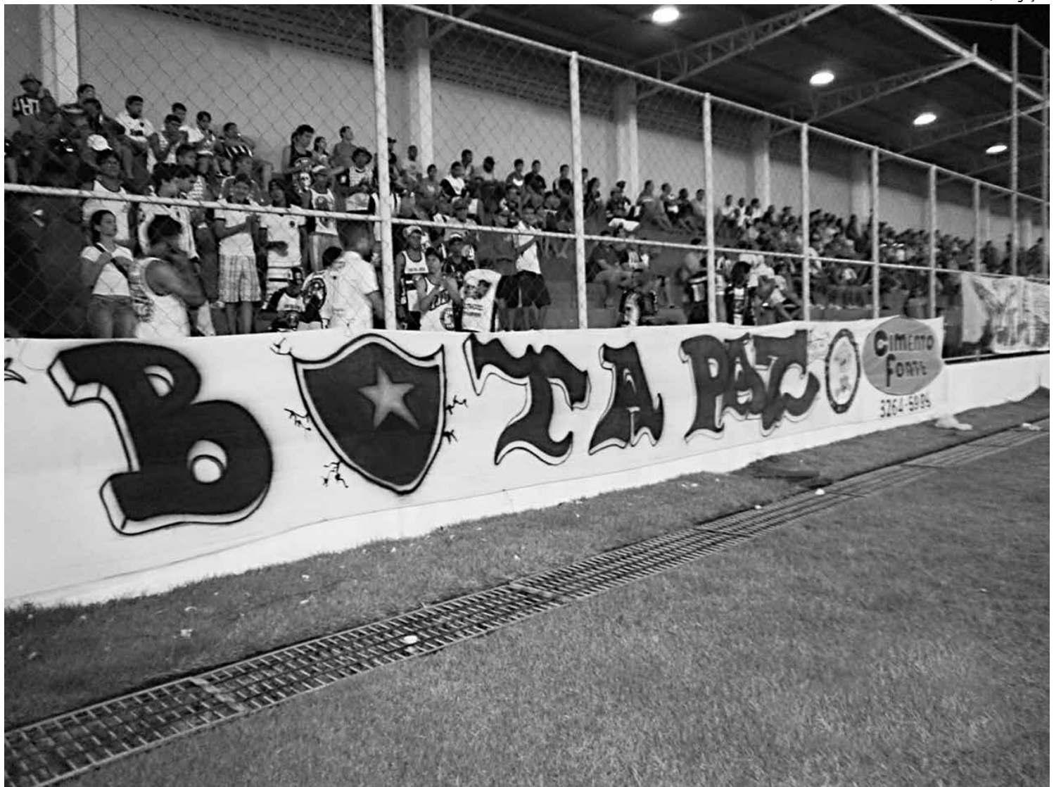
Torcedores do Botafogo estão sendo convocados para apostar na Timemania e ajudar o clube para que o mesmo não caia do Grupo 2