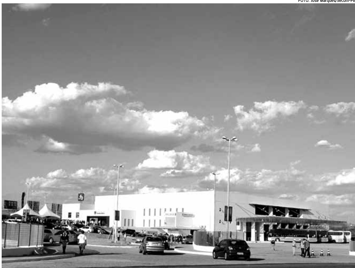
O Rodoshopping foi inaugurado pelo governador Ricardo Coutinho e conta com 47 lojas e órgãos de prestação de serviços