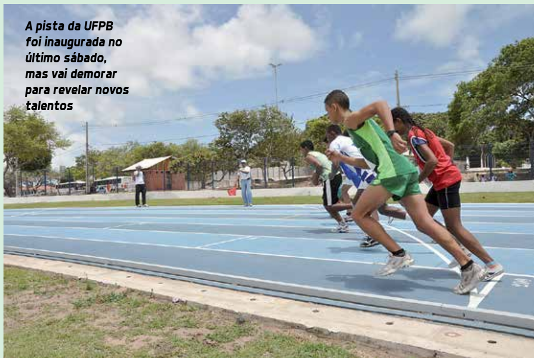
A pista da UFPB foi inaugurada no último sábado, mas vai demorar para revelar novos talentos