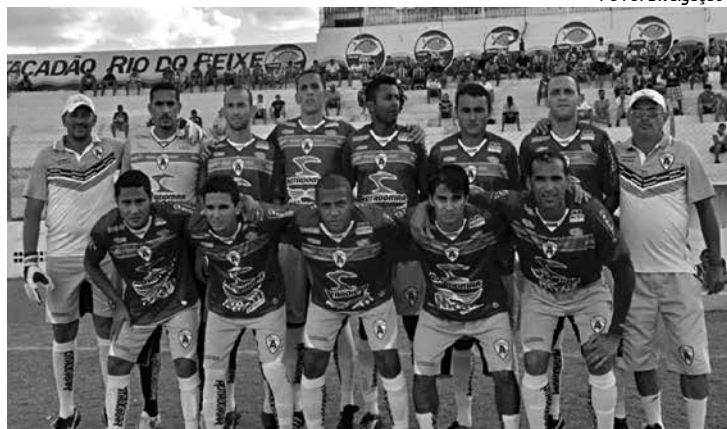
Atlético de Cajazeiras está em crise, mesmo sendo campeão