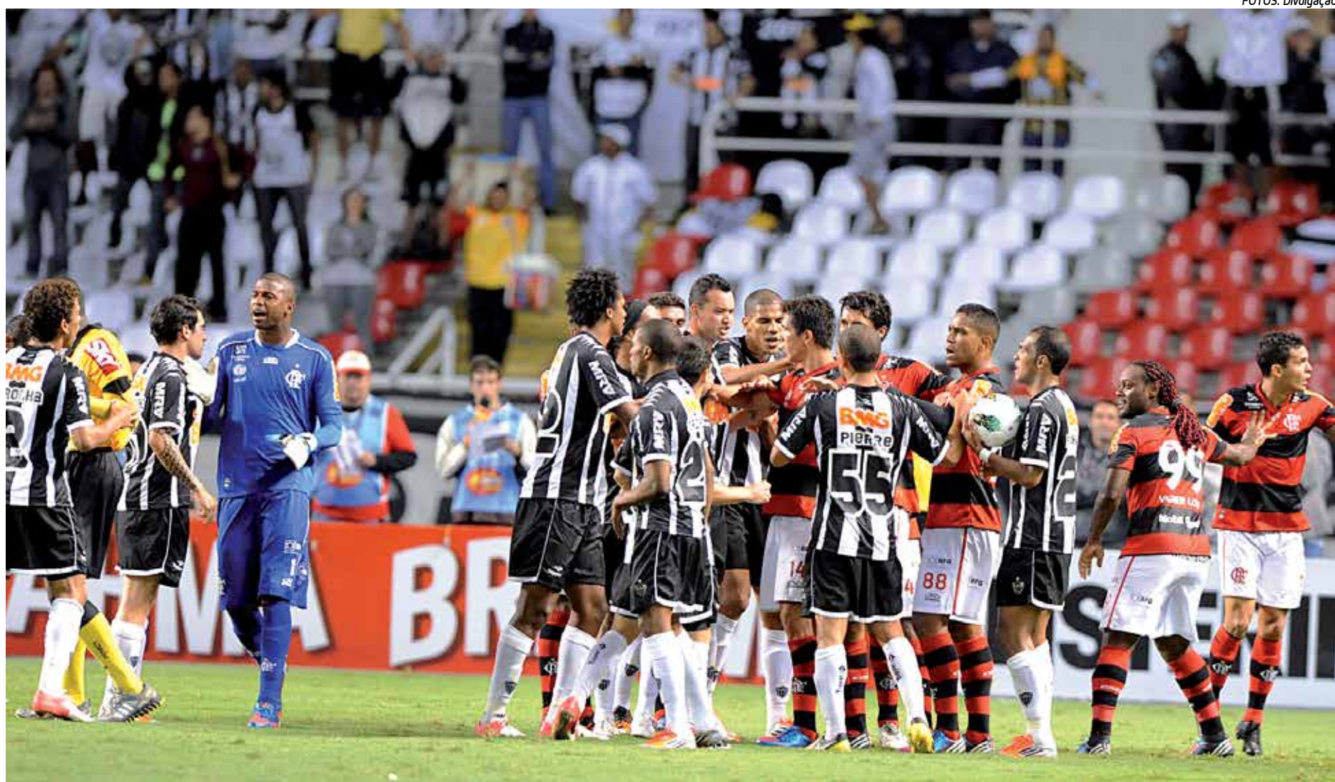
No primeiro encontro dos times, no Rio de Janeiro, a torcida flamenguista vaiou Ronaldinho Gaúcho, houve tumulto em campo e o time carioca ganhou por 2 a 1

Com 40 pontos e na tentativa de se afastar da zona de rebaixamento, o Flamengo busca confirmar o momento favorável após a vitória sobre o São Paulo. “Digamos que, pelas circunstâncias do campeonato, esse é um dos jogos mais especiais que teremos nesse momento, nessa reta final. Um brigando lá em cima e o outro lutando para sair lá de baixo. Envolve também a torcida e a história dos dois times”, apontou o jogador.