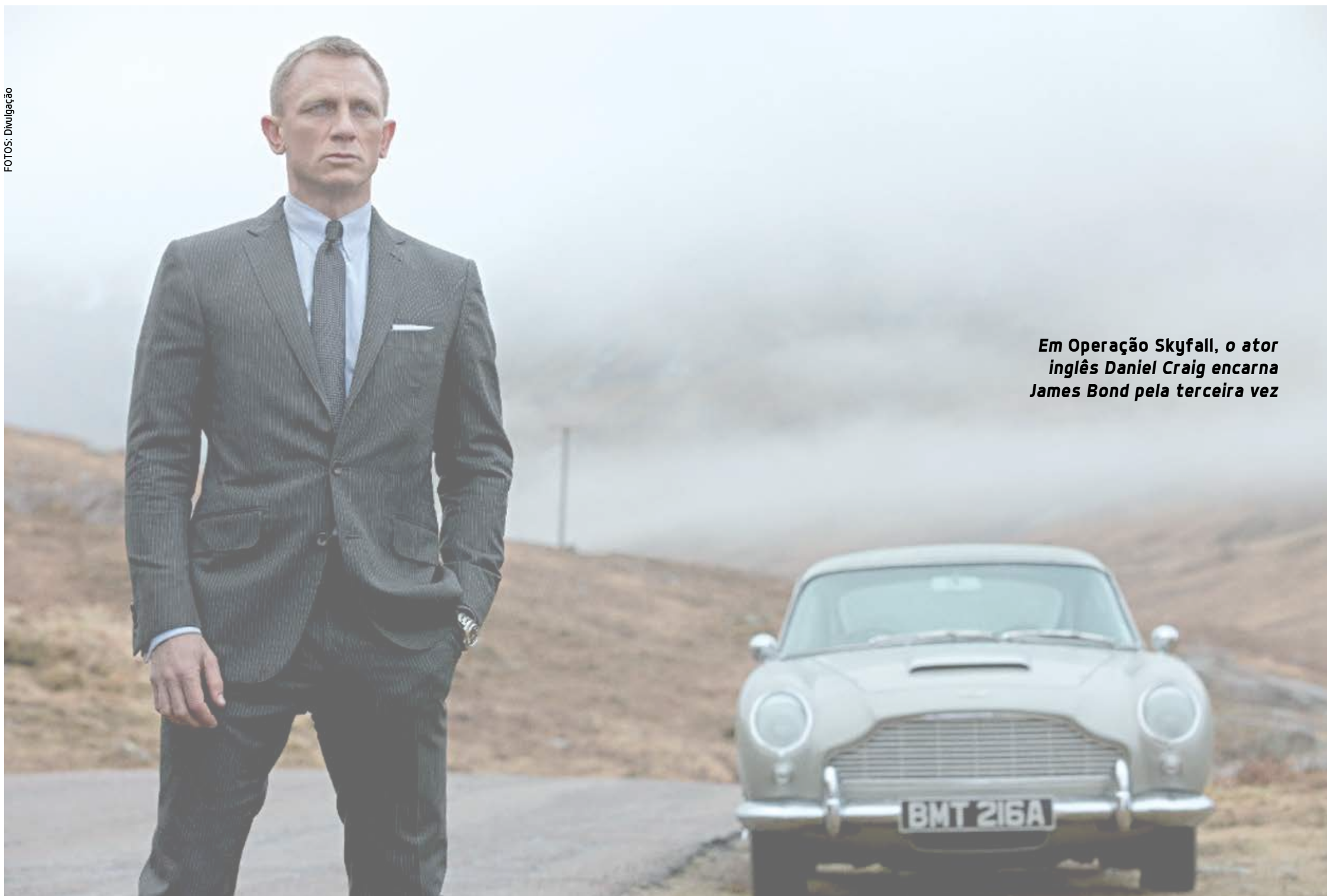
Em Operação Skyfall, o ator inglês Daniel Craig encarna James Bond pela terceira vez

A lealdade entre M e Bond é posta à prova e vira outra subtrama quando as desconfianças quanto ao comando na organização, põe em risco o destino dela.