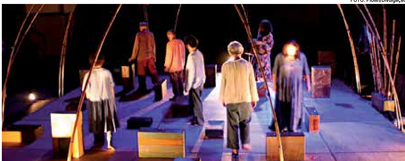
Piollin reestrea o espetáculo Retábulo hoje no Festival Mirada, em Santos PÁGINA 8

A Assembleia Legislativa votou na sessão de ontem apenas oito vetos das 200 matérias acumuladas em duas semanas. Durante o período de esforço concentrado, o Legislativo analisou só 15 vetos. PÁGINA 18