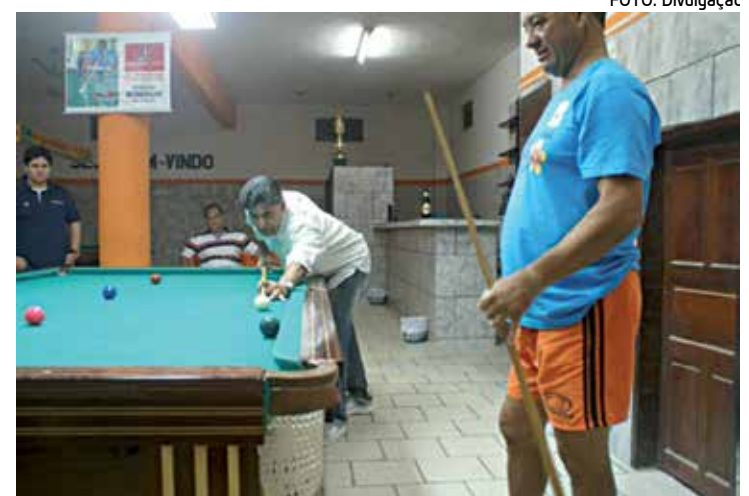
Jogos de sinuca fazem parte da III Olimpíada da Justiça Federal

As modalidades a serem disputadas são as seguintes: Futebol society, futsal, basquete, vôlei 4x4, Corrida de Rua, Caminhada, Passeio Ciclístico, Tênis de Mesa, Tênis e Quadra, Totó, Dominó, Sinuca, Xadrez e Natação