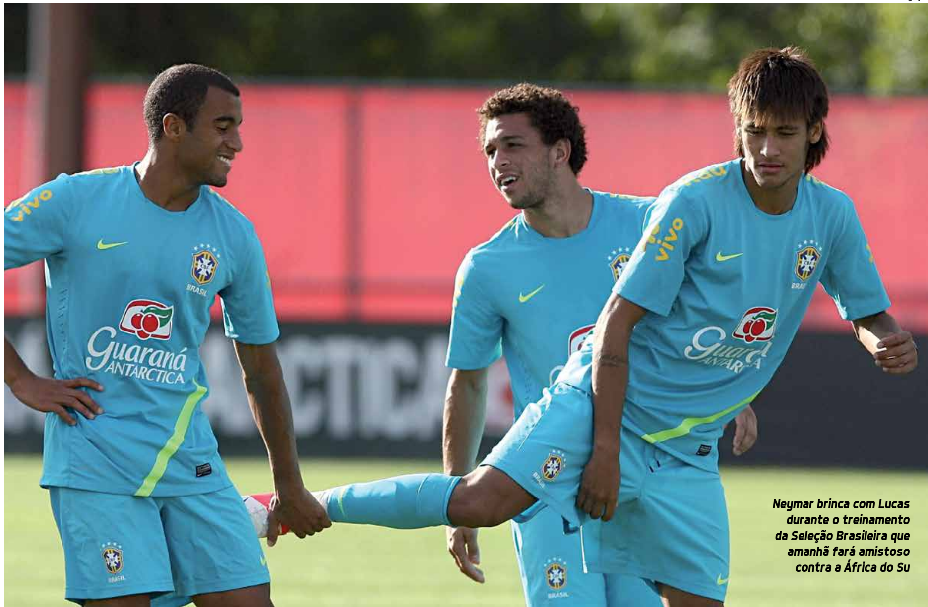
Neymar brinca com Lucas durante o treinamento da Seleção Brasileira que amanhã fará amistoso contra a África do Su

Agora com a camisa da Seleção Brasileira, Neymar espera manter o bom retrospecto, mostrando que conhece bem o estádio no qual joga o meia-atacante Lucas, seu companheiro na equipe de Mano Menezes.