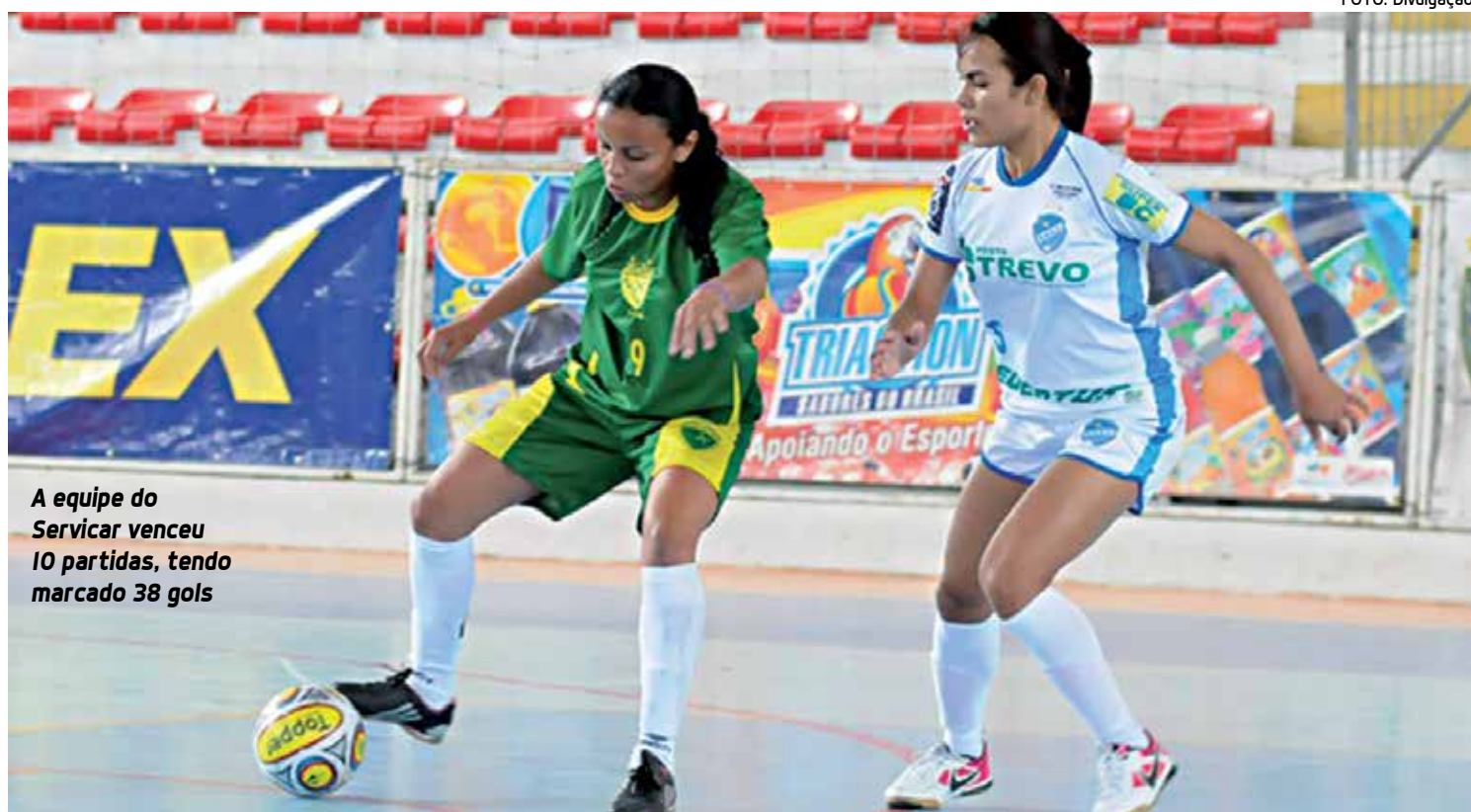
A equipe do Servicar venceu 10 partidas, tendo marcado 38 gols