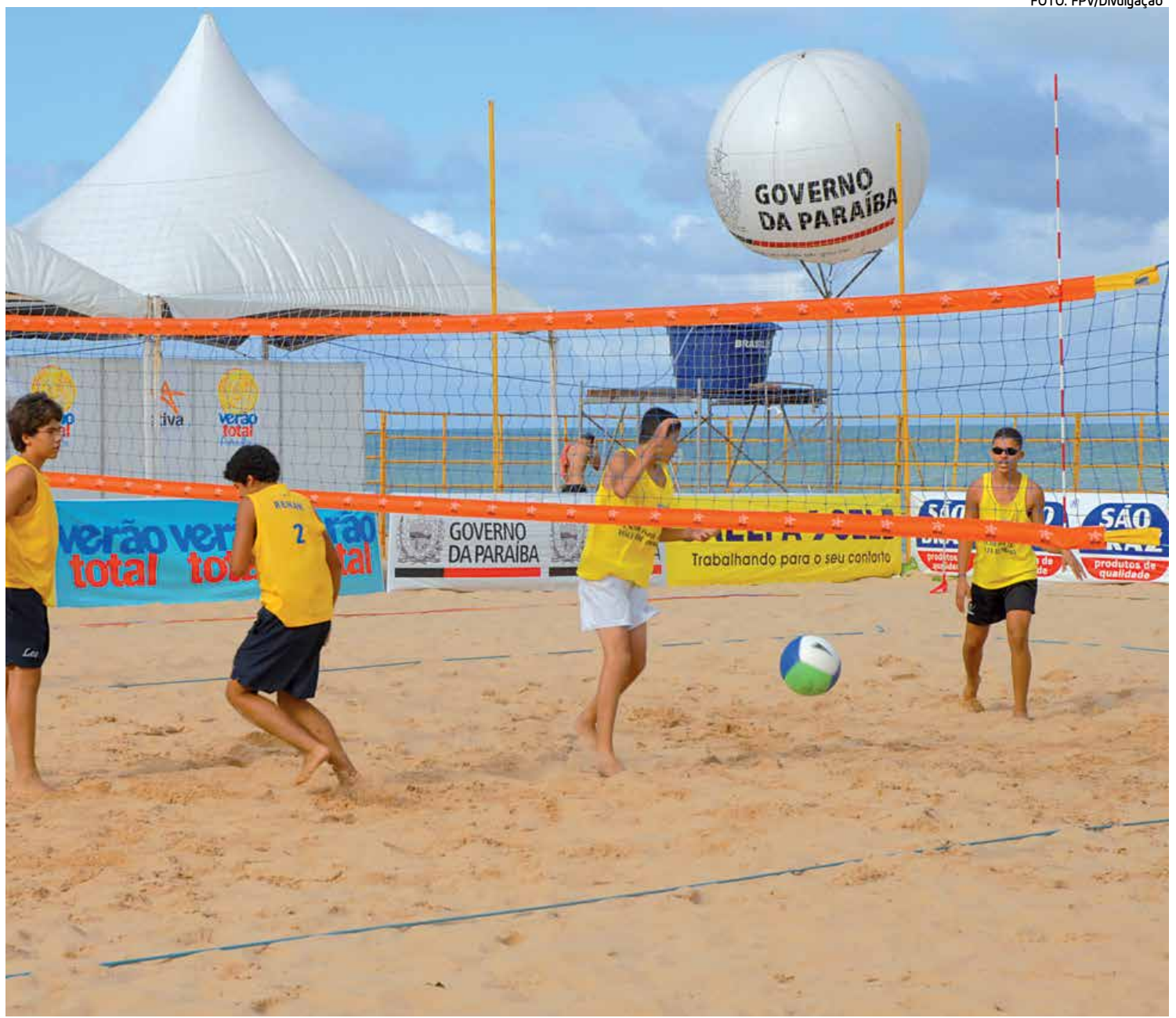
Jogos de vôlei de praia vão acontecer sábado e domingo na arena montada na Praia do Cabo Branco, em frente ao restaurante Olho de Lula

A Federação realiza ao todo seis etapas em cada uma das categorias participantes. Ainda este mês, no dia 29, os atletas da Sub-15 voltam às areias da Praia do Cabo Branco para competir na penúltima etapa do torneio. Já os garotos do Sub-17 retornam à quadra oficial da Federação no próximo dia 30 para disputar a última etapa do Circuito Paraibano e conhecer o vencedor da competição desta temporada.