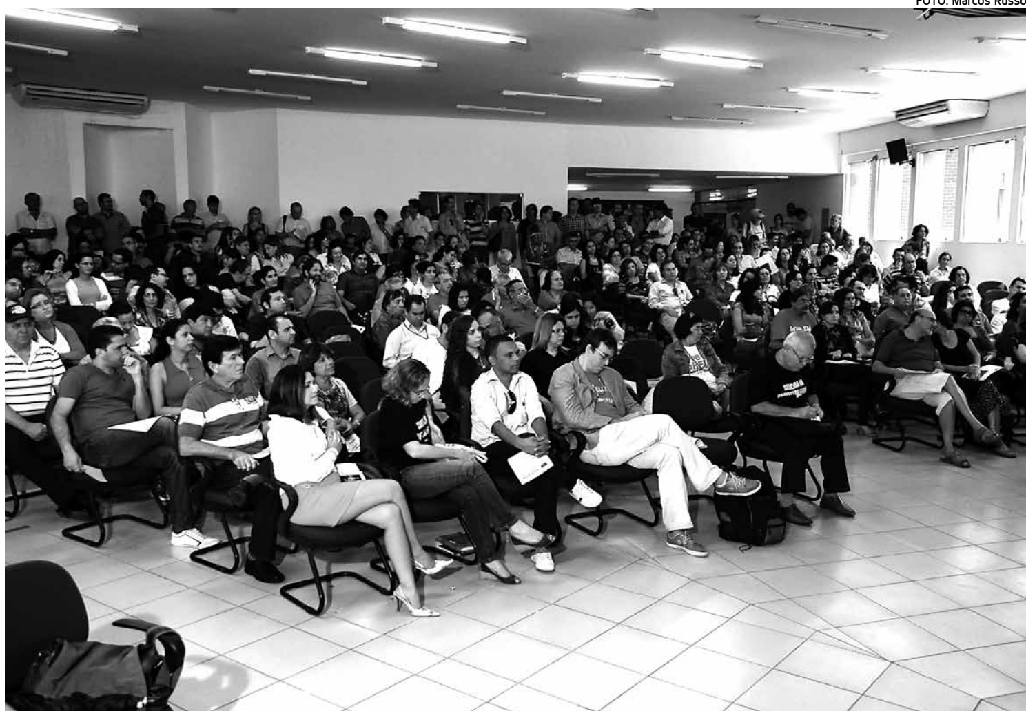
Assembleia em João Pessoa, realizada no auditório da reitoria, durou cerca de quatro horas e contou com a presença também dos alunos

Na capital, os servidores do IFPB são acusados de contrariarem orientação do Sindicato Nacional dos Servidores Federais da Educação Básica, Profissional e Tecnológica (Sinasefe), que acenou pelo acordo com o Governo Federal. Segundo Júlio Vinga, na Paraíba são 1.700 servidores, incluindo os docentes lotados nos 9 campi, além de 18 mil estudantes que estão sem aulas desde o dia 5 de junho. Além do IFPB, alunos de outras instituições públicas federais no Estado sofrem com os movimentos grevistas.