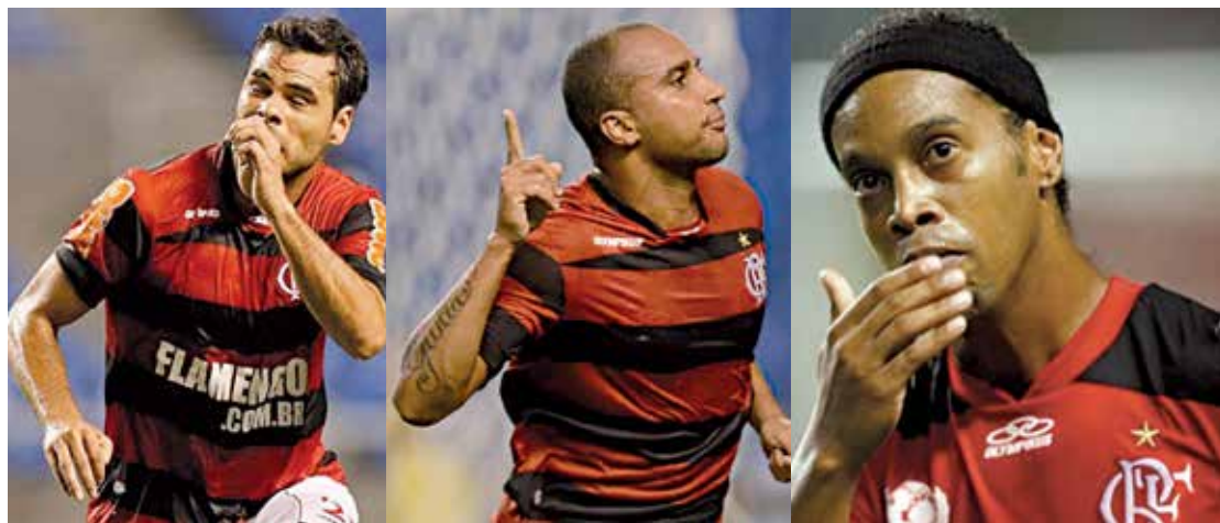
Rodrigo Alvim cobra R$ 6 milhões, Deivid R$ 5 milhões e Ronaldinho Gaúcho, R$ 40 milhões ao Fla

O Vitória pode lucrar com a transferência do atacante Hulk para o Zenit. E de acordo com a Fifa, o clube formador tem direito a 5% do valor da transação, proporcional ao tempo em que o atleta permaneceu nele. Hulk foi jogador do Vitória de 2003 e 2005. O paraibano foi vendido pelo Porto, por 60 milhões de euros, cerca de R$ 153 milhões, e levando em conta que o clube baiano é um dos formadores do atleta, uma indenização chegará em breve por conta da transação. O valor chegará a aproximadamente R$ 2,3 milhões.