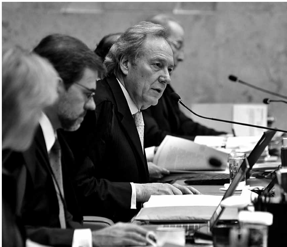
Lewandowski disse que a Procuradoria não conseguiu comprovar denúncias contra os ex-dirigentes

A proposta segue agora para votação no plenário da Casa e, se aprovada, será enviada para o Senado.