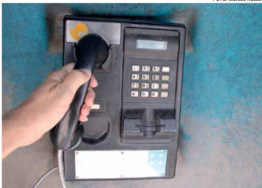
Vários locais da Paraíba têm poucos orelhões PÁGINA 13

Operação Carcará da Polícia Civil prendeu ontem 11 pessoas acusadas de tráfico, homicídio e roubo em vários municípios da divisa com Pernambuco. PÁGINA 15