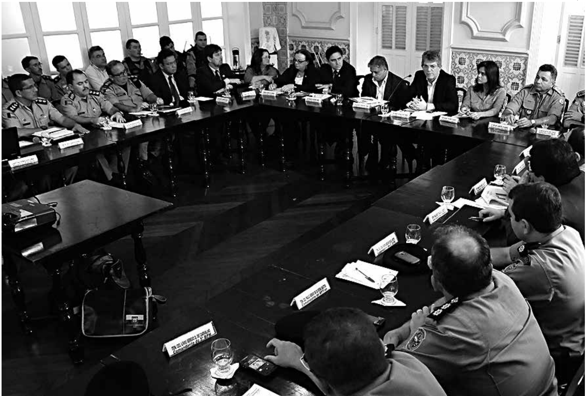
O governador Ricardo Coutinho se reuniu, no Palácio da Redenção, com gestores da Segurança para avaliar o trabalho realizado e discutir novas ações contra a criminalidade