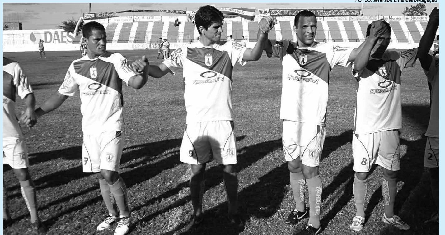
Os jogadores do time sousense têm uma missão das mais complicadas no próximo domingo para seguir no Campeonato