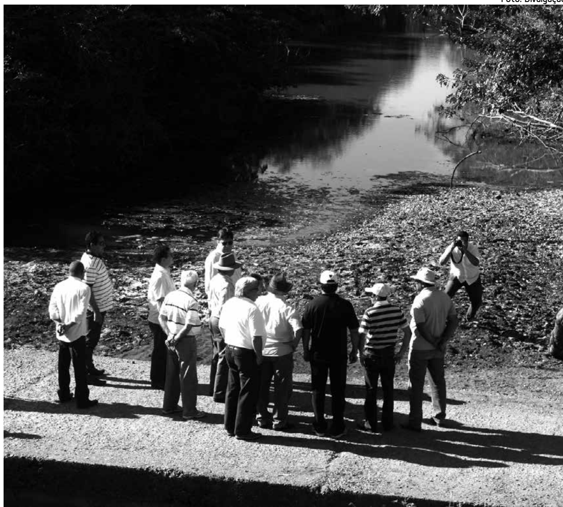
A comitiva detectou grave assoreamento do Rio Piranhas, principalmente, nas Várzeas de Sousa