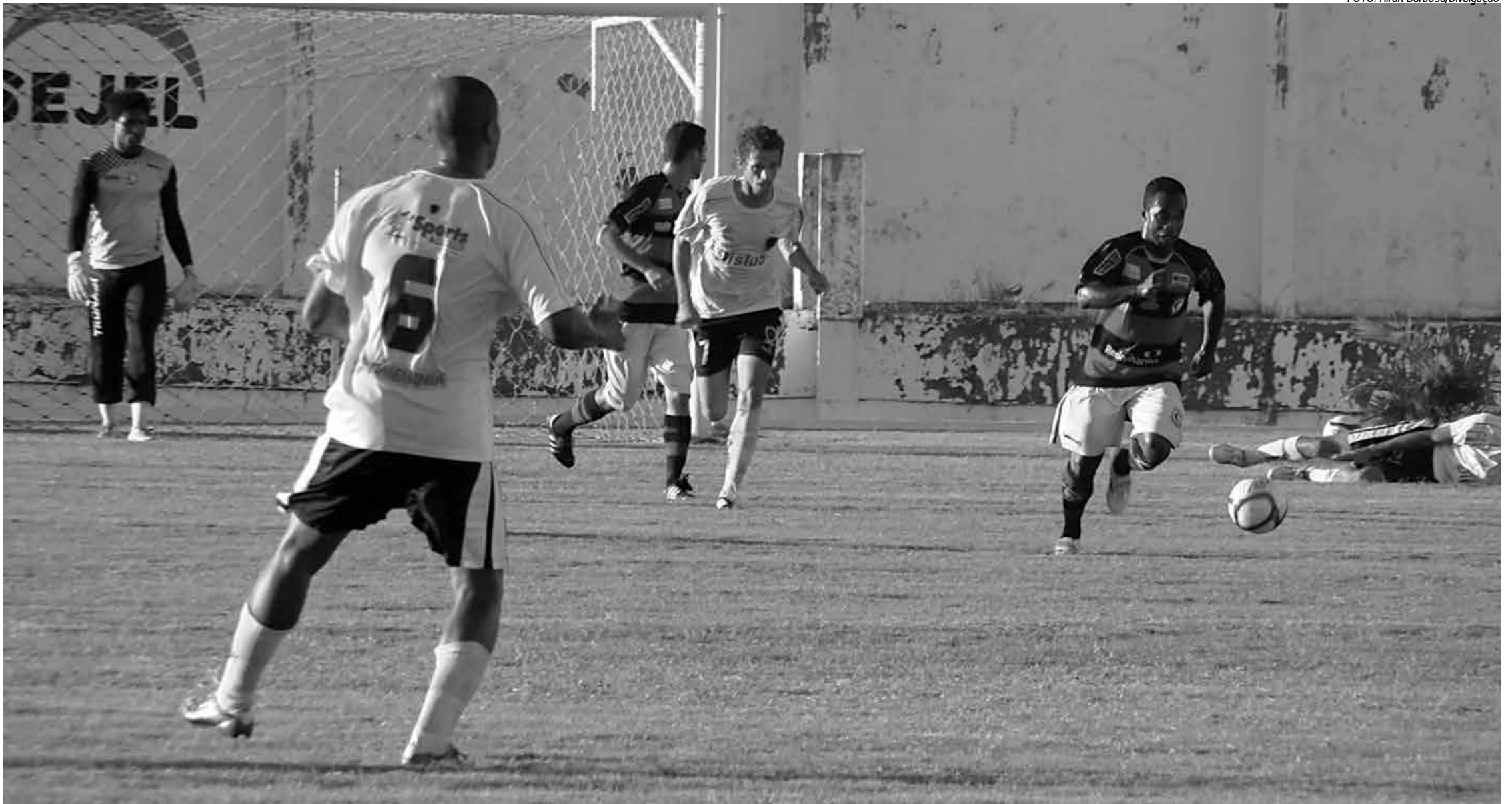
O insucesso no Paraibano deste ano, quando terminou em quarto lugar, o péssimo trabalho no Santa Cruz, eliminado na primeira fase da Segundona, e a pressão da torcida motivou mudança no comando técnico