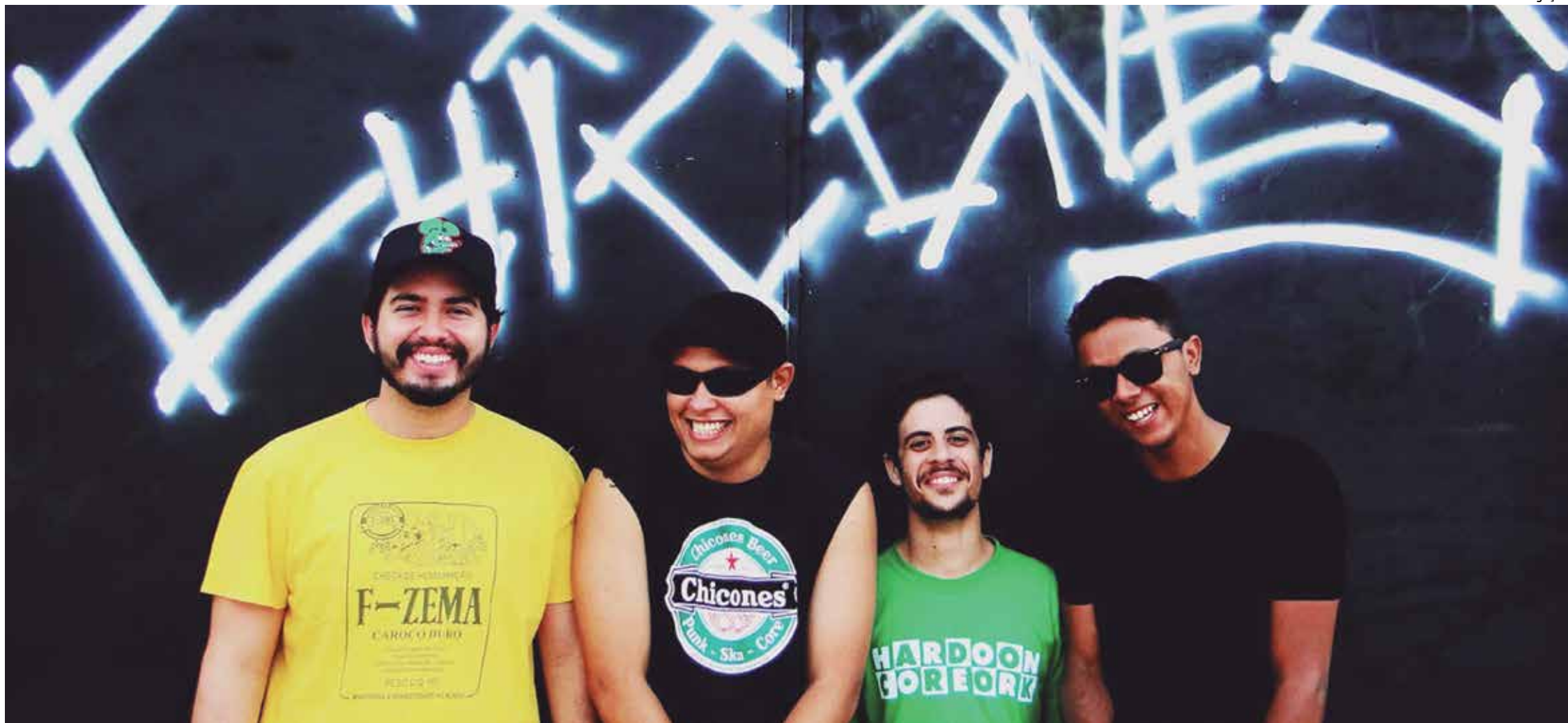
A banda Chicones, de Fortaleza, a única de fora do Estado, será uma das atrações do evento, que terá também um recital poético em homenagem aos ícones do rock