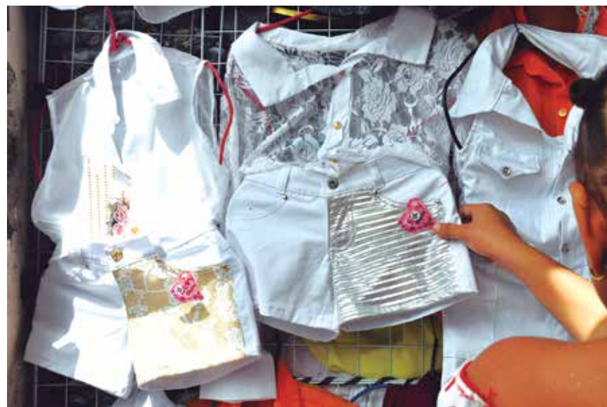
Lojistas apostam nas vendas de roupas brancas PÁGINA 14