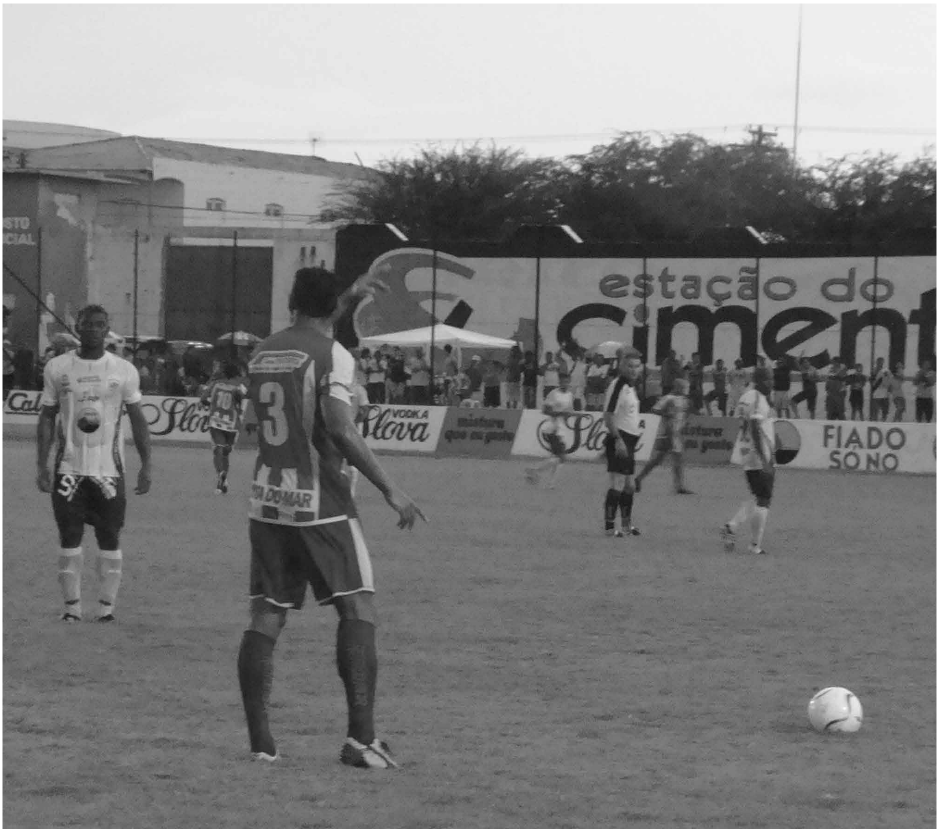
O Estádio José Cavalcante, em Patos, não terá jogos dos clubes locais, já que Nacional e Esporte desistiram do Campeonato, mas poderá sediar jogos de outras equipes

Ao saber de uma reunião na próxima segunda-feira no Ministério Público, o dirigente disse esperar que o bom senso prevaleça para que os clubes não sejam prejudicados.