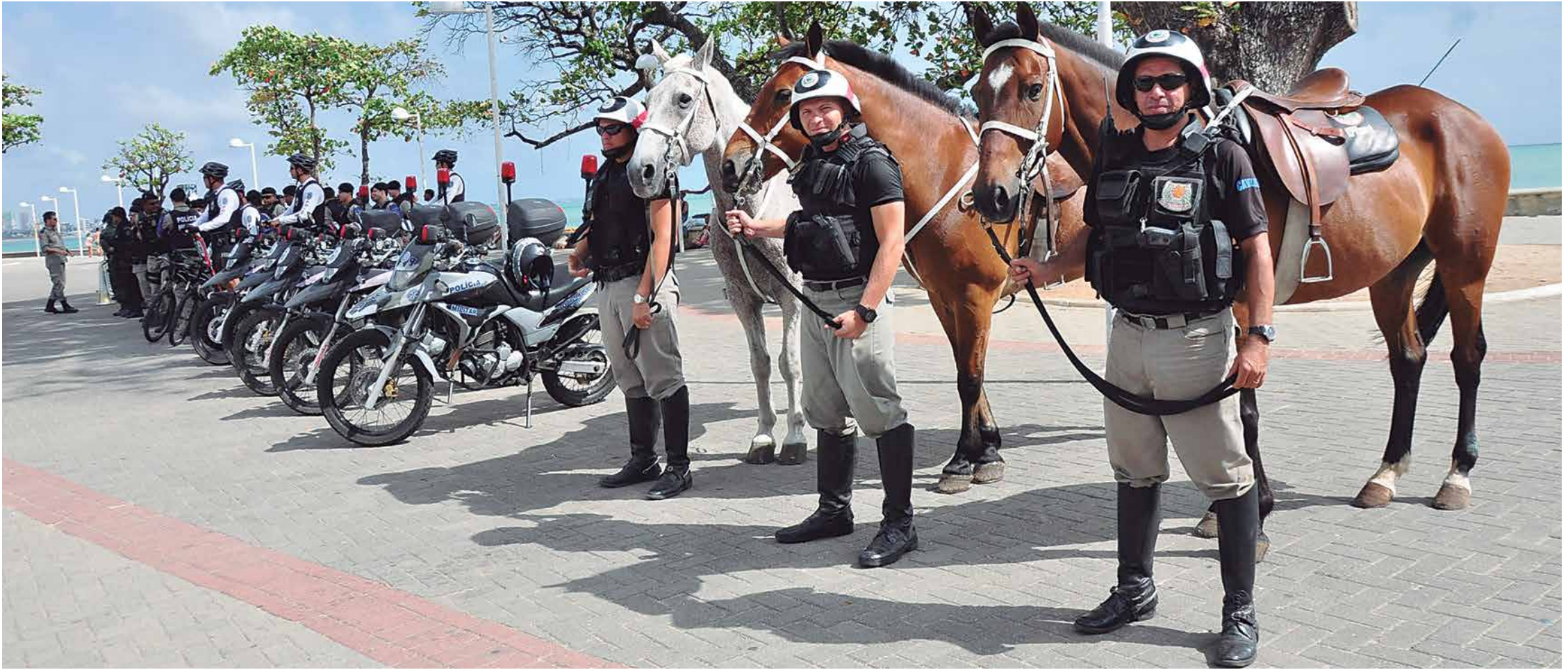
Polícias Militar, Civil e Corpo de Bombeiros iniciam Operação Réveillon com 3,5 mil homens, para garantir segurança no final de ano PÁGINA 13