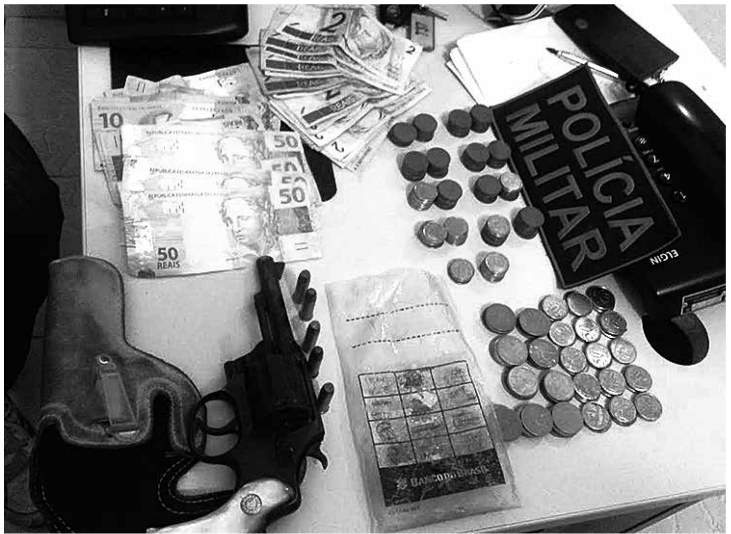
Na casa do acusado, os policiais encontraram dinheiro roubado do Multibank, um revólver calibre 38 e uma moto CG 150, placa MOL-4386