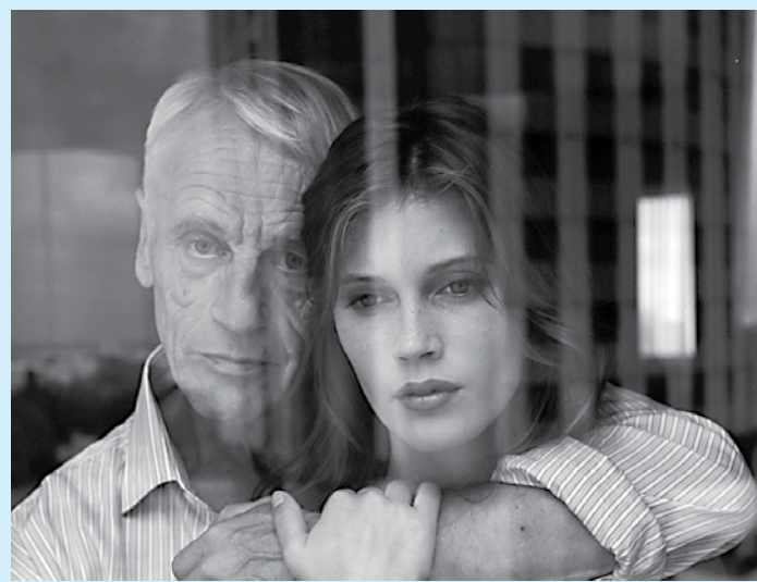
Marine Vacth como Isabelle no filme de François Ozon