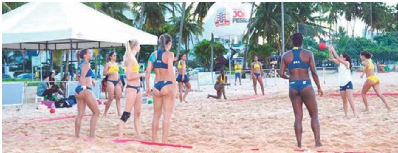
Seleção Feminina do Brasil com atletas paraibanas treinando na Praia de Cabo Branco para depois ser campeã fora do Brasil