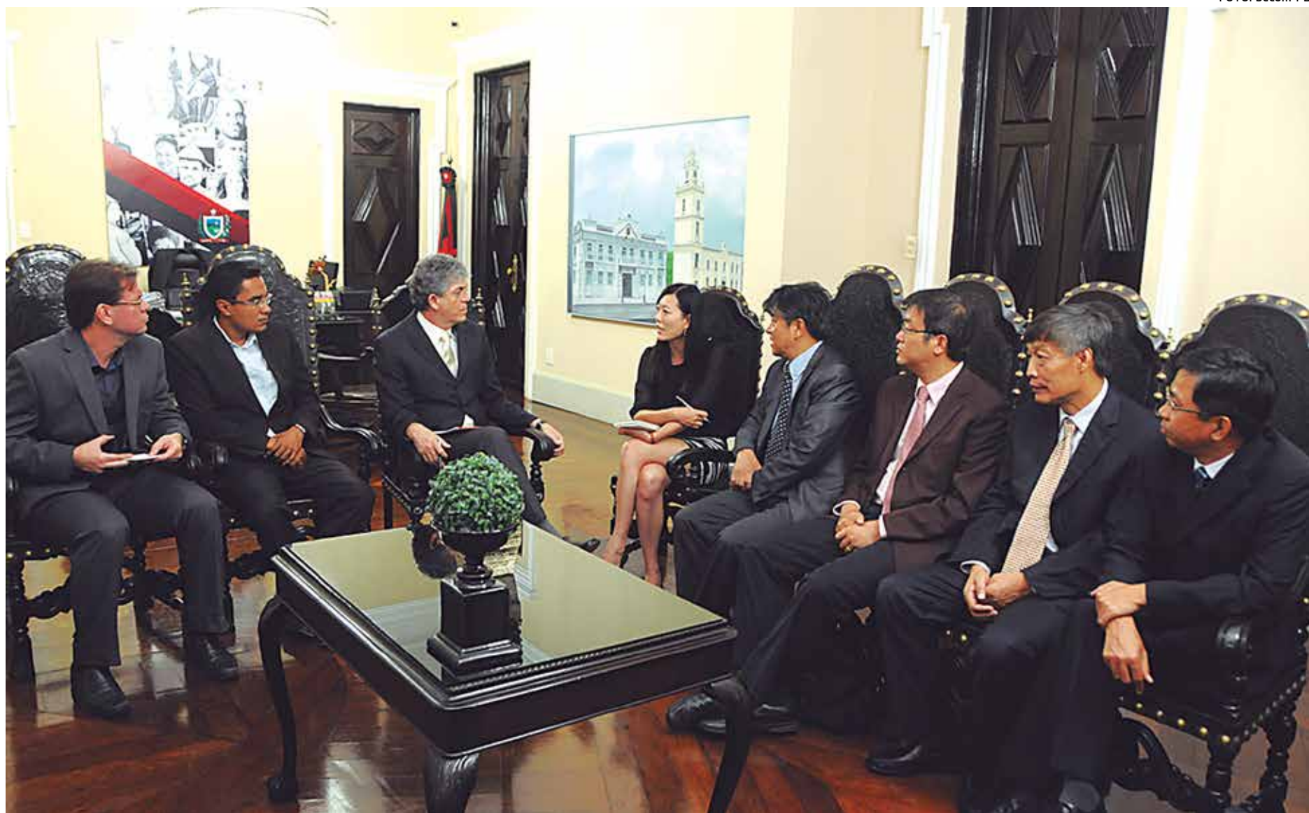
O governador Ricardo Coutinho apresentou um breve panorama sobre a Paraíba, e discutiu possibilidades de investimentos chineses, estatais e privados, no Estado

Ricardo Coutinho destacou a posição estratégica do Estado na região Nordeste, dada sua proximidade a outros grandes centros econômicos como Recife e Natal, além de ter ampliado sua capacidade de investimentos. "Recebemos investimentos, entre 2011 e 2013, de cerca de R$ 4,5 bilhões. Já os investimentos públicos saltaram