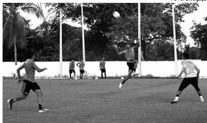
O Botafogo segue treinando forte para a Copa do Nordeste 2014

A CBF divulgou a tabela oficial da Copa do Nordeste, e