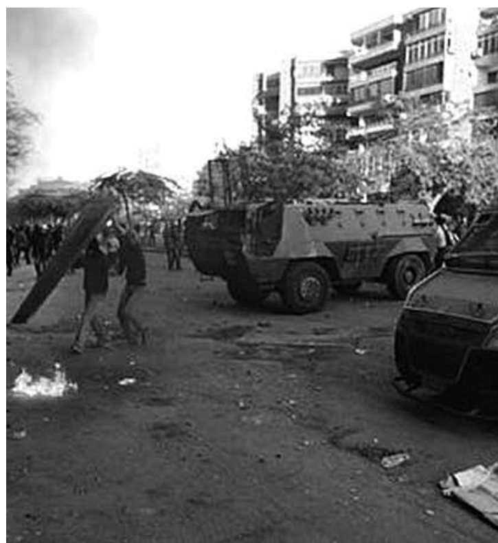
Os manifestantes foram às ruas pedir a volta de Morsi ao poder

Na última quarta-feira, o governo interino do país, que assumiu após um golpe de Estado, definiu o grupo como "terrorista".