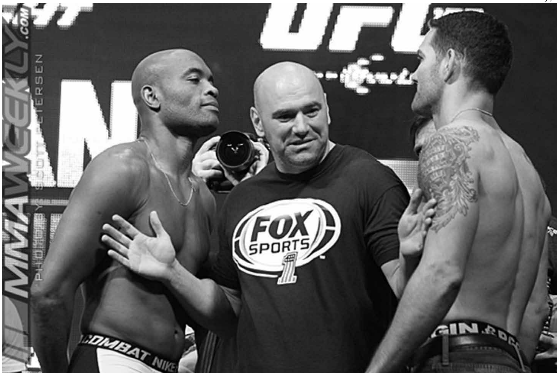
Na pesagem, o brasileiro Anderson Silva encara o norte-americano Chris Weidman. A luta, a mais esperada do ano, deve acontecer na madrugada de amanhã

“A maior mudança foi comigo mesmo. Toda minha equipe está de parabéns, todos fizeram seus trabalhos da melhor forma. Quem tinha que mudar era eu mesmo. É difícil ser atleta e tentar ser treinador também. Você acaba falhando. Aprendi a lição, ouvi todos os meus treinadores desta vez e estou preparado.”