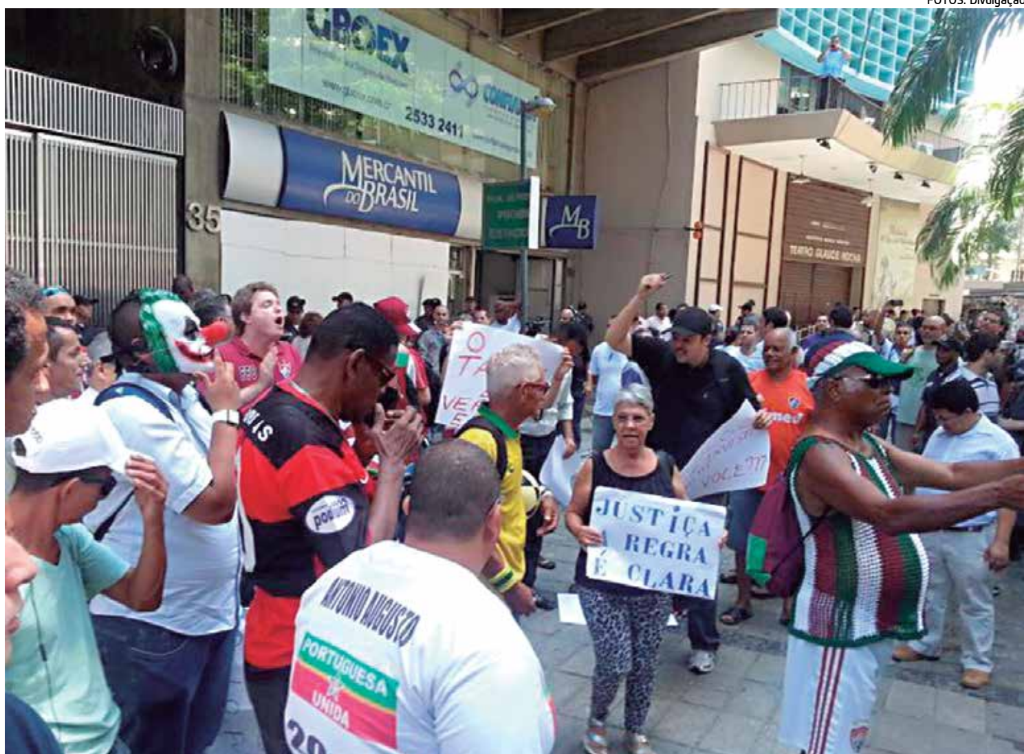
O julgamento do Tribunal Pleno que manteve o rebaixamento da Portuguesa ocorreu sob vários protestos em frente ao STJD

A diretoria da Lusa promete nos próximos dias novas defesas. Há, inclusive, a possibilidade de sua Assessoria Jurídica pedir ao Pleno do STJD a reconsideração da decisão do julgamento. Para todos existe a convicção de que a Portuguesa está sendo vítima e que o rebaixamento seria a pior pena que o clube