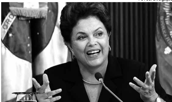
Dilma Rousseff sancionou orçamento de R$ 2,488 trilhões

Decisão deverá agradar aos parlamentares que queriam garantia para suas emendas