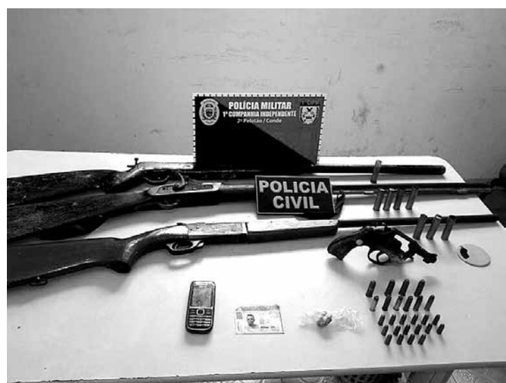
A operação policial apreendeu armas e munições com os acusados

Entre os crimes que teriam sido praticados pela dupla está um duplo homicídio, no começo deste mês, próximo à caixa d'água de Jacumã. As vítimas, de 44 e 26 anos, estavam trabalhando em obras de saneamento quando dois homens em uma moto chegaram atirando. Outro crime foi o assassinato de uma coretora de 37 anos, também em Jacumã, quando a vítima participava de uma festa com amigos e teve a casa invadida.