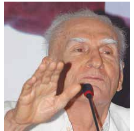
Academia Paraibana de Cinema premia filmes como Ariano e Suassunas PÁGINA 5