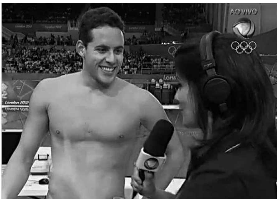
Thiago Pereira treinava no Centro Olímpico e foi um dos grandes prejudicados

Motivos para isso não faltam. Atletas de ponta usando suas piscinas atraem talentos, inspiram