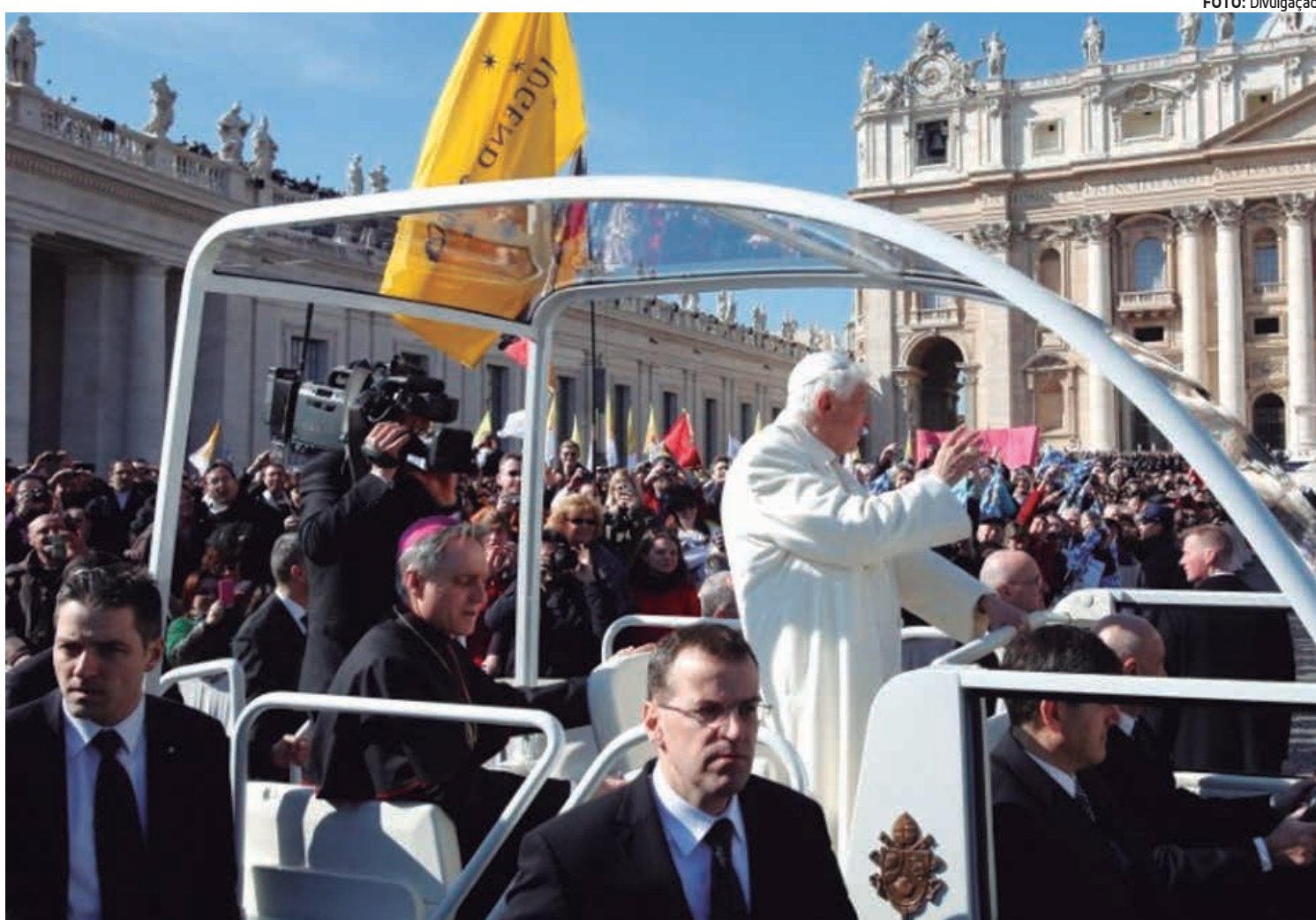
O papa Bento XVI acena para fiéis ao chegar na Praça São Pedro, no Vaticano, onde fez seu último sermão como líder da Igreja Católica

A previsão é que Bento XVI deixe o Vaticano de