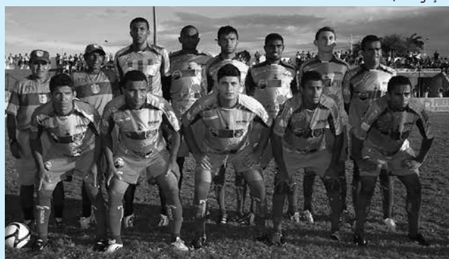
O Cruzeiro fracassou com este elenco no Paraibano 2013

"Tivemos altos e baixos no começo, principalmente com a mudança da comissão técnica que implantou uma nova filosofia de trabalho dentro da competição. Com a permanência da equipe na disputa poderemos trabalhar com mais calma e fazer um time mais forte para ficar entre os primeiros", avaliou o dirigente.