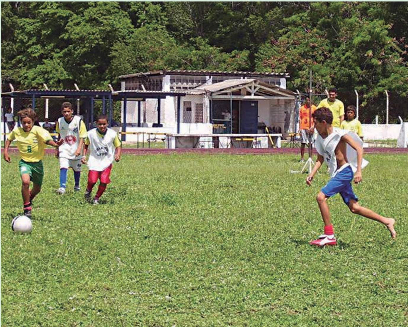
Os garotos da Grande João Pessoa e do interior vão ter oportunidade de mostrar o seu talento na Copa Paraíba Sub-15

O Unipê também abriu uma turma especial de musculação para idosos. Estão sendo oferecidas 20 vagas para pessoas acima de 60 anos, nas segundas, quartas e sextas, das 7h às 8h.