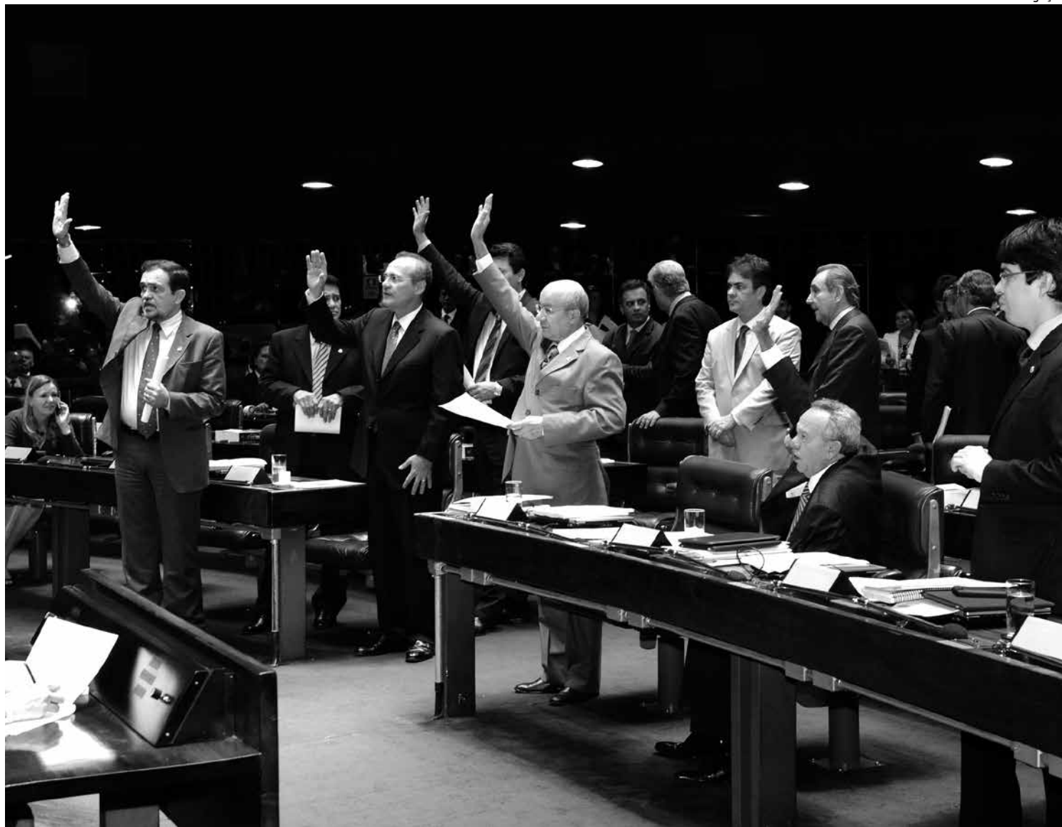
Deputados e senadores terão contribuições equivalentes ao valor do vencimento no início e no fim do mandato

A proposta que determina o fim do salário extra pago