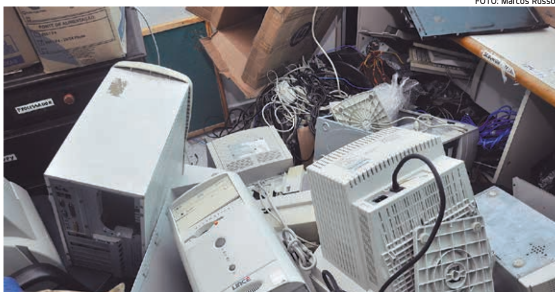
No ano passado foram recolhidas 130 toneladas de lixo eletrônico nos pontos de coleta no Estado

Chumbo e mercúrio. Esses são alguns dos elementos que estão presentes em equipamentos eletrônicos como computadores e TVs. Ao jogá-los no meio ambiente, é possível que contaminem a água do solo e até mesmo o ar, e, quando inalados ou ingeridos, podem causar danos ao sistema nervoso e, mesmo, danos cerebrais.