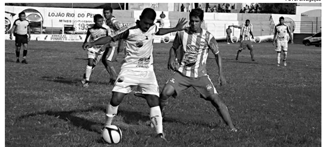
O Auto Esporte faz uma campanha sem empolgação. Se livrou do rebaixamento e quer vencer o Bota