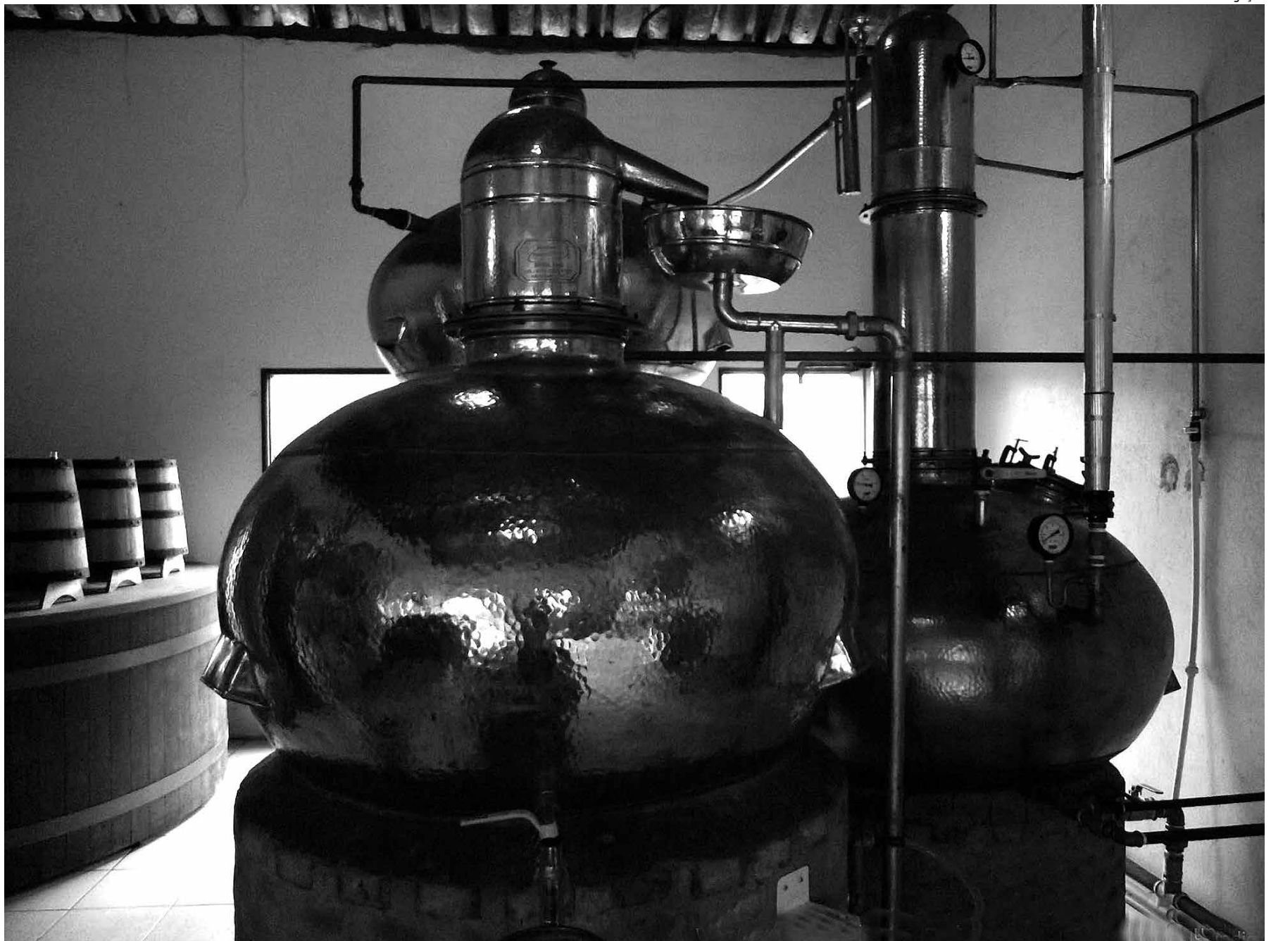
Alambique de cobre ainda é muito utilizado pelos produtores brasileiros para destilar a cachaça cujo manejo de produção foi aperfeiçoado nos últimos anos

Hoje, a iniciativa de melhoria da cachaça fluminense continua a