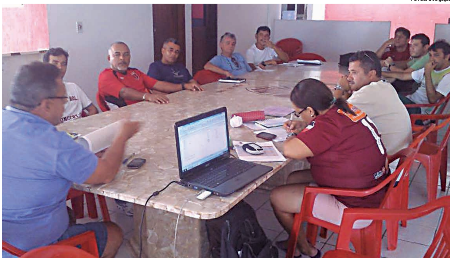
A reunião aconteceu na sede do Esporte Clube Cabo Branco. O Paraibano de 2013 na categoria Sub-17 terá a participação de nove clubes

Além do Paraibano, o calendário divulgado pela Federação prevê a realização de outras quatro competições: a X Taça Campina Grande de Futsal, a VIII Taça Paraíba, a Copa Primavera e a Copa Cidade Verde. A primeira ocorre no dia 22 de março, a segunda e a terceira no mês de setembro e a quarta em outubro.