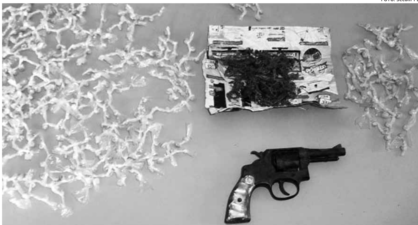
A droga e um revólver, apreendidos pelos policiais do serviço de inteligência, estavam em poder de um adolescente de 17 anos