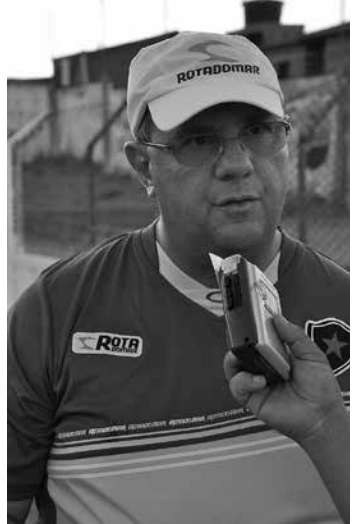
Técnico escalará força máxima

A expectativa para esta partida é muito grande, porque os dois times vêm de vitórias. O Belo venceu o Paraíba por 3 a 0, e o Auto Esporte o Cruzeiro, por 1 a 0. Os ingressos para esta partida já estão à venda deste a última terça-feira, na rede de postos Opção, ao preço de R$ 10 reais para o primeiro lote. A diretoria do Botafogo espera um público em torno de 4 mil pessoas no Estádio da Graça, para comemorar o título simbólico do 1º turno.