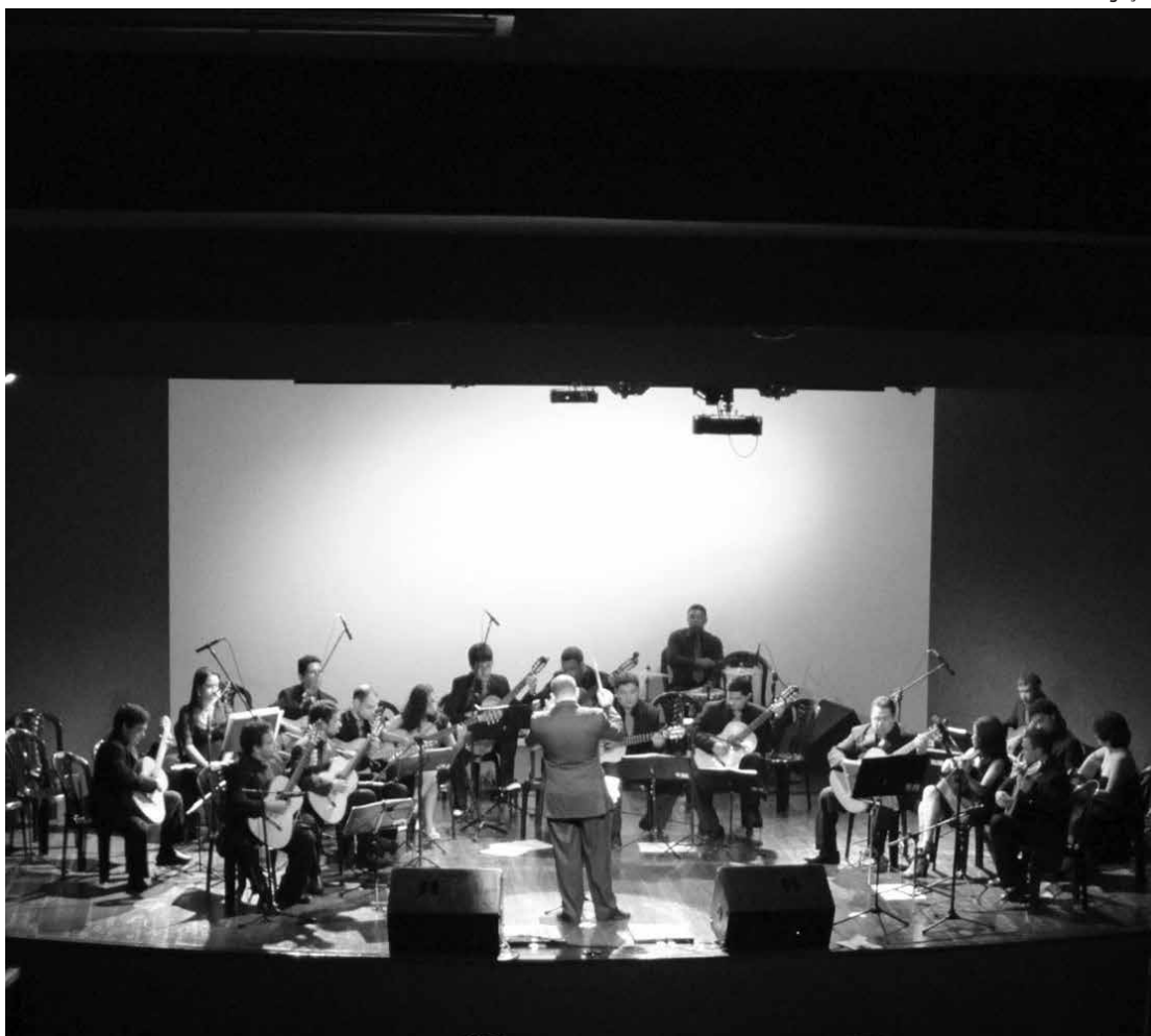
A Orquestra de Violões vai interpretar obras de grandes compositores, como Pixinguinha

Em 2009, a OVPB lançou seu terceiro CD, Orquestra de Violões Interpretando a Paraíba, com composições nova-