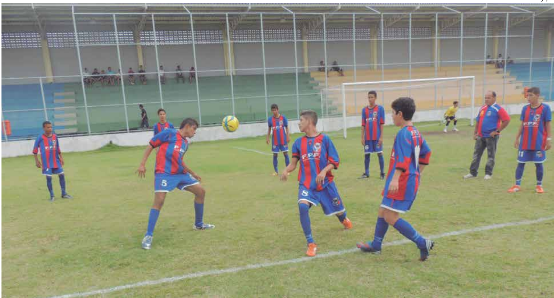
Jogadores do Femar durante o aquecimento antes do jogo diante do CSP, vencido pelo time de Ferreira, por 1 a 0 que garantiu vaga na grande final da competição hoje

A segunda edição da competição foi aberta na última quinta-feira na cidade de Patos, Sertão paraibano. A Copa atenderá escolinhas nas regiões do Sertão, Curimataú e Cariri. "Agora será a vez das equipes dos municípios que fazem parte do Sertão, Cariri e Curimataú lutarem para ganhar a segunda edição da Copa. Em Patos, será o lançamento, pois a meta é atingir todos os quatro cantos do Estado", finalizou o secretário.