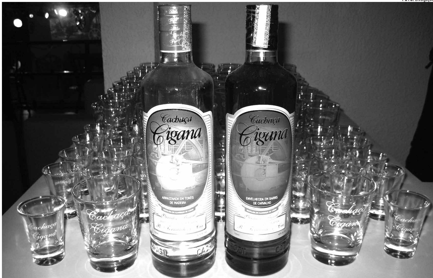
Cachaça Cigana ficou inserida entre os 22 rótulos da bebida consideradas as melhores do Brasil no 10º Concurso Nacional de Vinhos Finos e Destilados

Foram premiados 58 vinhos e 21 cachaças. Entre os vinhos, 10 conquistaram medalha Grande Ouro (acima de 95 pontos), 31 ficaram com Ouro e 17 com Prata. Dos vinhos premiados, 41 são do Rio Grande do Sul, 9 de Santa Catarina, 4 do Paraná, 2 de Pernambuco e 2 de Minas Gerais. Na avaliação de destilados, foram concedidas 4 medalhas Grande Ouro, 9 medalhas de Ouro e 8 de Prata. Das cachaças premiadas, 8 são gaúchas, 7 do Estado do Rio de Janeiro, 3 de Minas Gerais, 1 de São Paulo, 1 do Rio Grande do Norte, 1 da Paraíba e 1 de Alagoas.