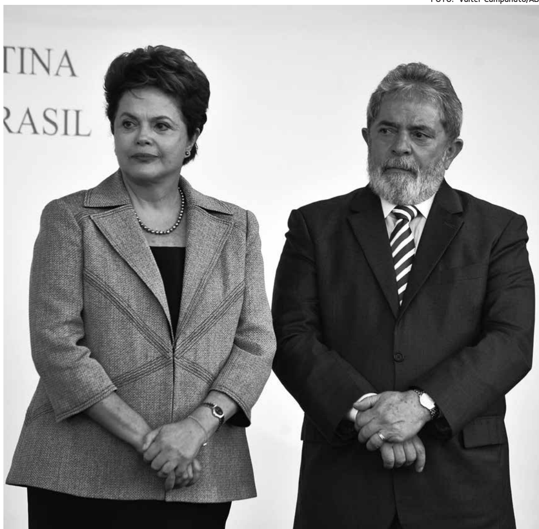
Dilma se mostrou preocupada com a queda da popularidade do governo durante o encontro com Lula

Após seis anos e sete meses à frente da SOF, a secretária disse que ainda não sabe quem assumirá o posto. "A ministra [Miriam Belchior] disse que ainda não tem nome em vista. Eu saio com a sensação de que contribuí muito e fiz o que pude. Agora escolhi cuidar um pouco de mim e da minha família", finalizou.