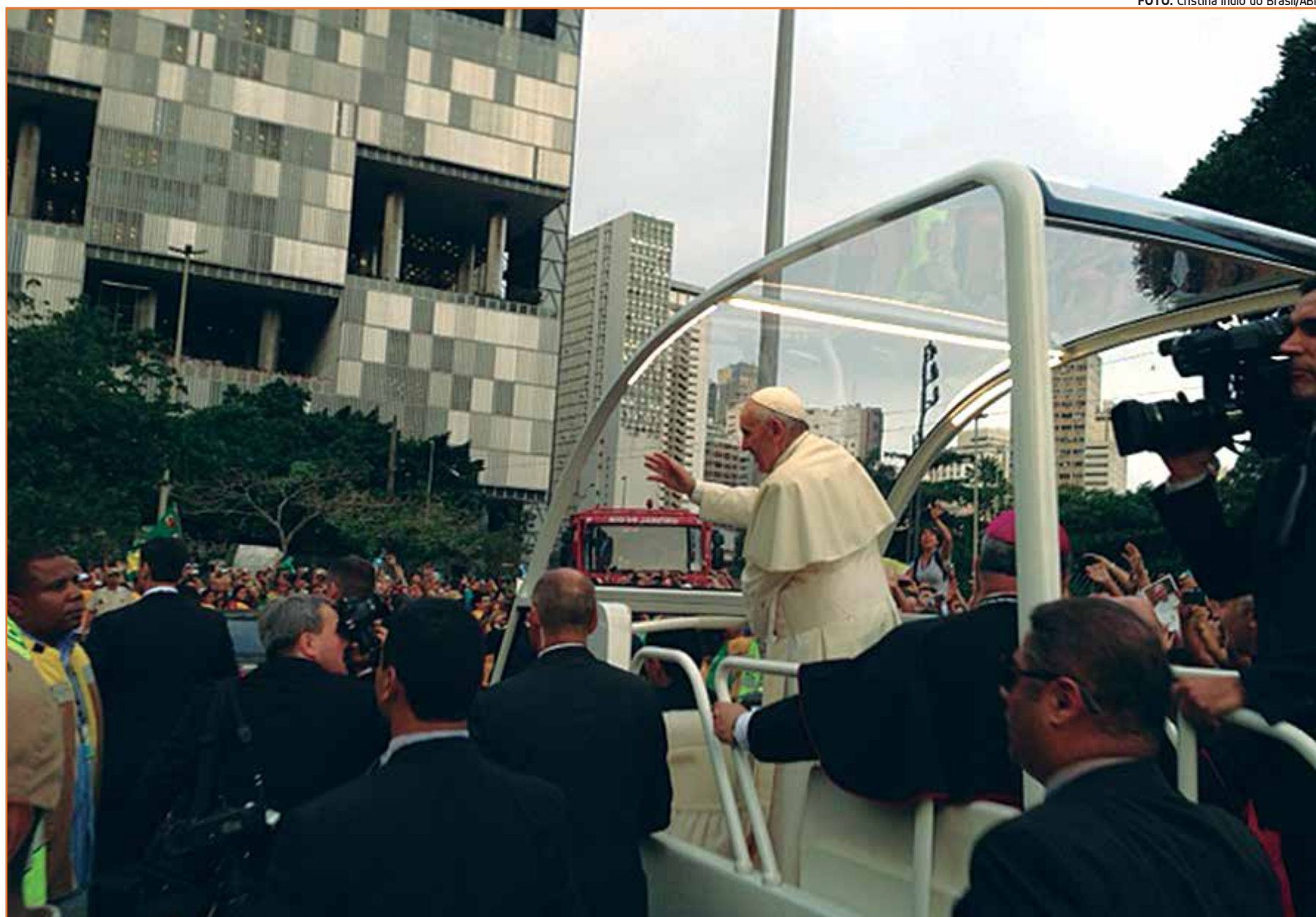
Papa Francisco foi mais uma alvo de carinhos de multidões de fiéis que acenavam e tentavam de várias maneiras chamar sua atenção na Avenida Atlântica, no Rio