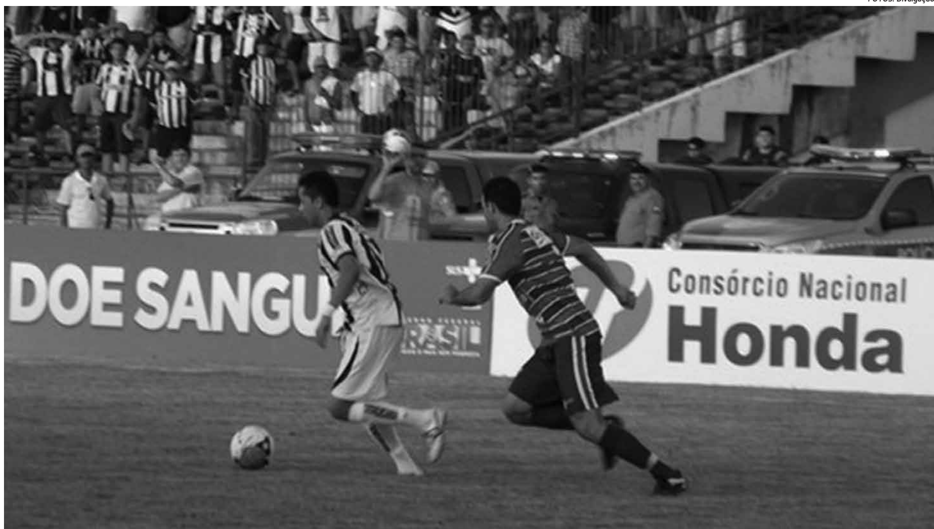
Ano passado pela competição nacional, o Treze perdeu para o Fortaleza por 2 a 1 jogando no Presidente Vargas, e hoje necessita vencer para sair da zona da degola

Pelo lado trezeano, a expectativa é de estreias e várias mudanças. De acordo com o coletivo realizado na