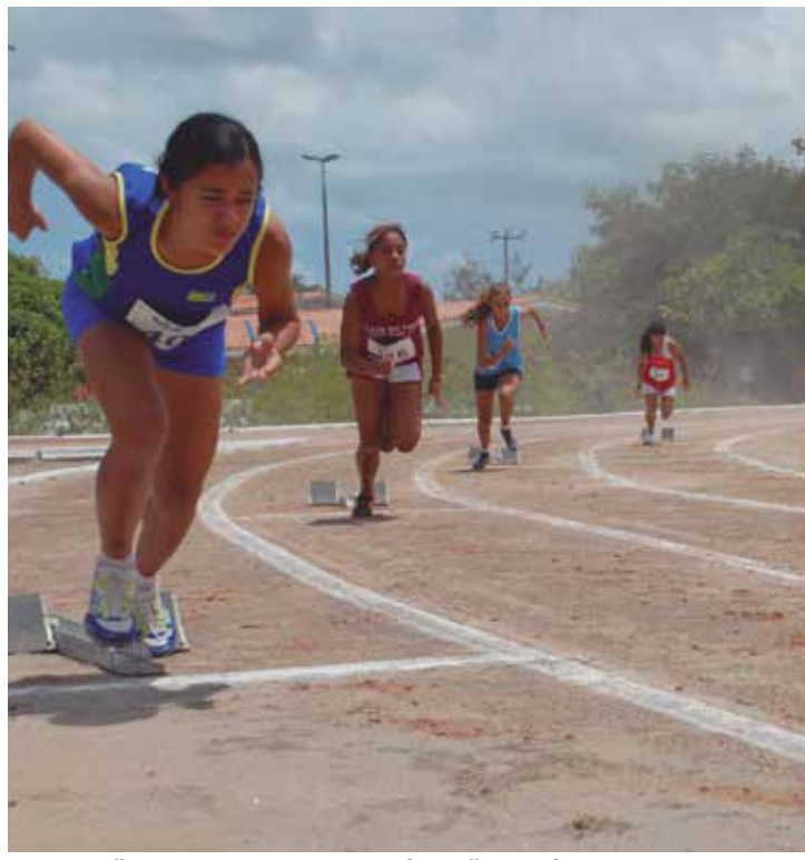
Provas vão ocorrer na tarde de hoje e vão reunir cerca de 100 atletas

O Paraibano Juvenil de Atletismo terá disputas em praticamente todas as categorias determinadas pela Confederação Brasileira de Atletismo – CBAt. São corre-