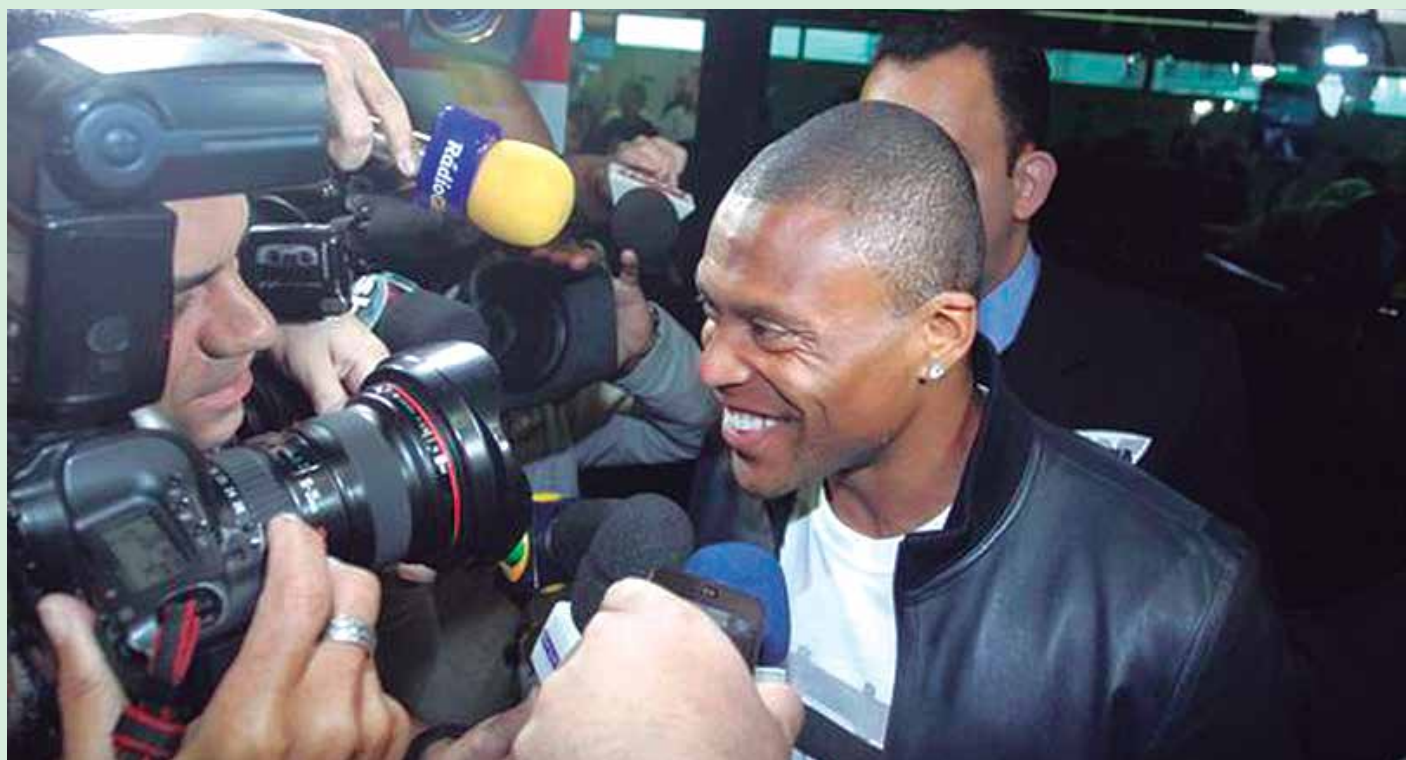
Jogador estava atuando no futebol europeu e retorna ao Brasil para defender a equipe do Cruzeiro no Campeonato Brasileiro

O meia assinou contrato por duas temporadas e será apresentado oficialmente amanhã, no Mineirão, antes do clássico entre Cruzeiro e Atlético, às 16h, válido pela nona rodada do Campeonato Brasileiro