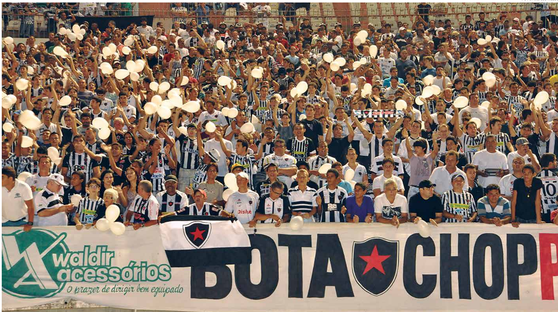
A diretoria do Botafogo está pedindo o apoio de sua torcida, que deu show no Campeonato Paraibano de 2013, para marcar presença no amistoso de hoje contra o Vera Cruz no Almeidão