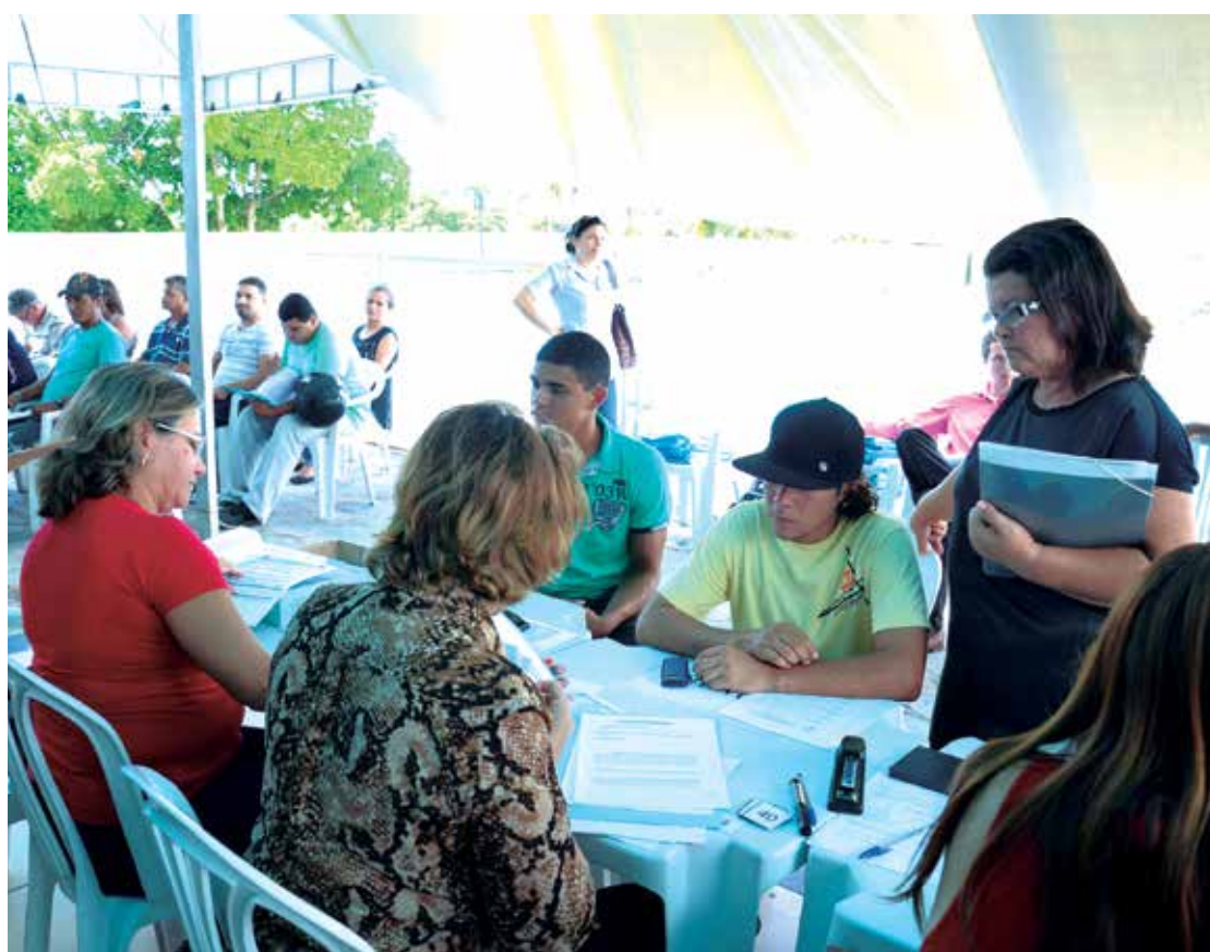
Mutirão Dpvat teve início na última 2ª feira; o atendimento era realizado no Sindicato dos Bancários