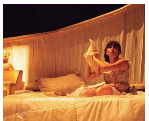
Os espetáculos dos grupos Bufões de Olavo (no alto) e Graxa (no centro) foram selecionados nas categorias circo e teatro