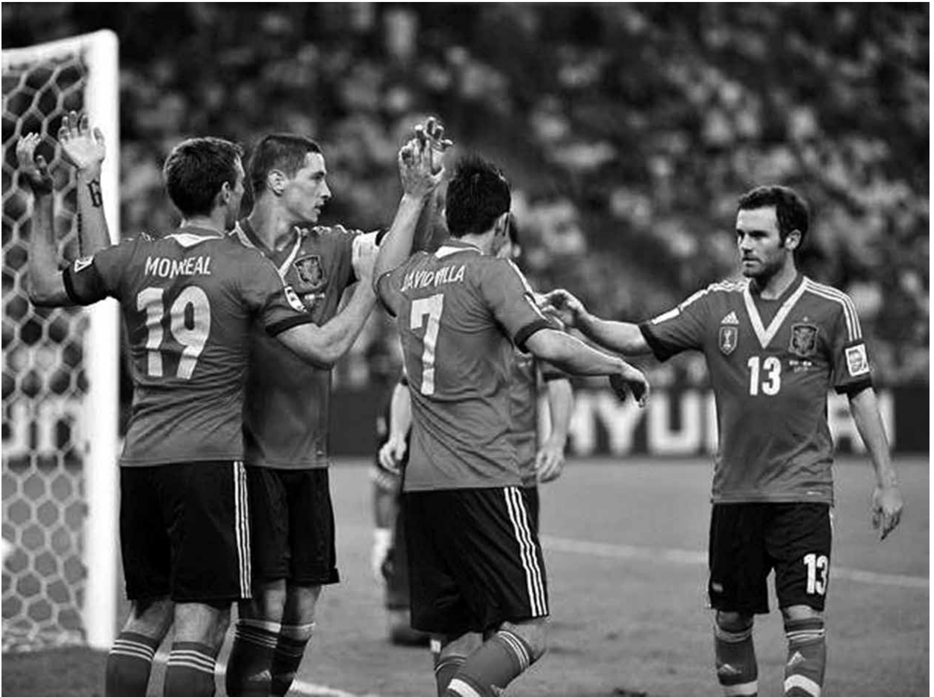
Apesar das duas vitórias no Brasil, a seleção espanhola não conseguiu a simpatia do torcedor brasileiro e os jogadores não se abateram com as manifestações

Os 10 gols deixaram um sabor levemente amargo para os goleadores, como David Villa que fez três gols. "É claro que estamos contentes, mas tristes pelo rival, que deu tudo em campo e acabou sofrendo várias decepções", diz Villa, que tirou muitas fotos com os adversários depois da partida.