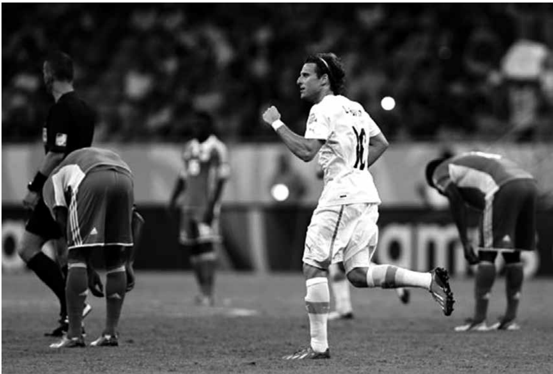
Forlán chegou ao centésimo jogo pela seleção uruguaia e marcou o gol da vitória contra a Nigéria

O treinador só espera manter até dezembro, quando se despede do Brasil enfrentando o Uruguai no Recife, a boa impressão que seu país deixou na primeira participação em um torneio da Fifa. Em relação às pessoas, fez a alegria de crianças carentes da Favela da Maré, do Rio de Janeiro, ao distribuir bolas oficiais e ingressos para o jogo desta quinta-feira, contra a Espanha.