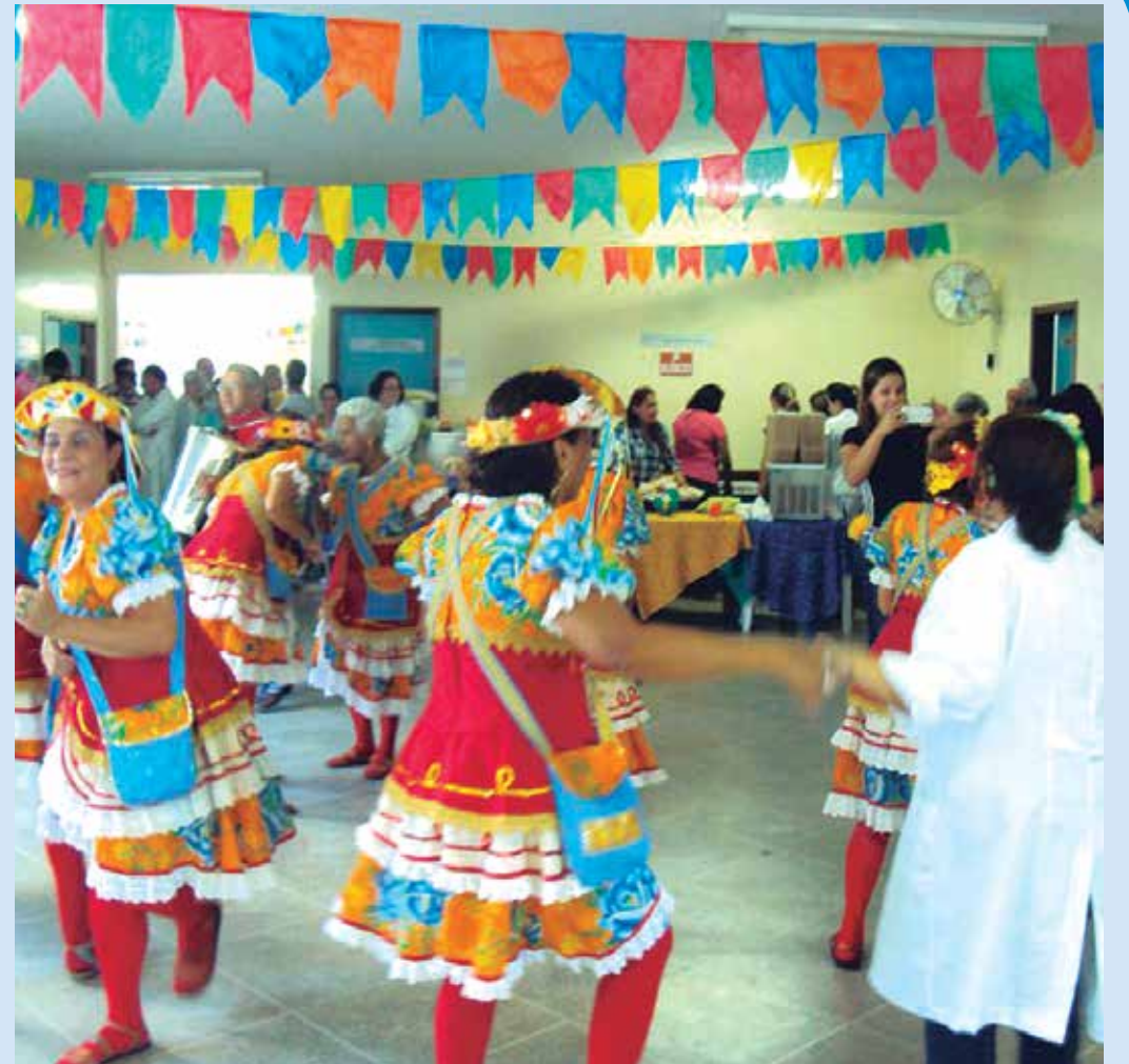
Os usuários do hospital fizeram a animação da festa dançando ao som de muito forró