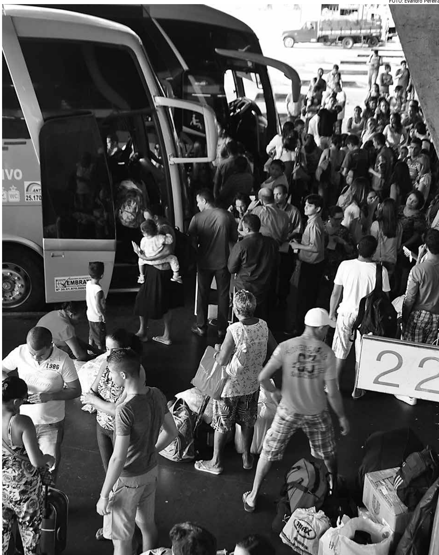
Desde ontem é grande a movimentação de passageiros no Terminal Rodoviário de João Pessoa por conta dos festejos no interior