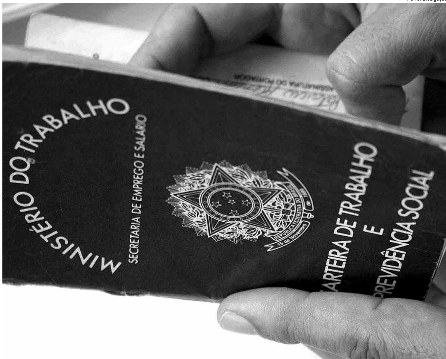
O saldo de pouco mais de 72 mil postos de trabalho criados é resultado de cerca de 1,8 milhão contratados menos 1,7 milhão demitidos

A desaceleração de crescimento não era verificada desde 2009, ano da crise financeira internacional, quando foram verificados os números mais baixos para o mês de maio: pouco mais de 131 mil postos de trabalho formal. Em 2009, houve recuperação e foi registrada a geração de mais de 298 mil empregos com carteira assinada. A partir de então, os saldos passaram a ter queda, 252 mil em 2011; 139 mil em 2012; culminando nos 72 mil em 2013.