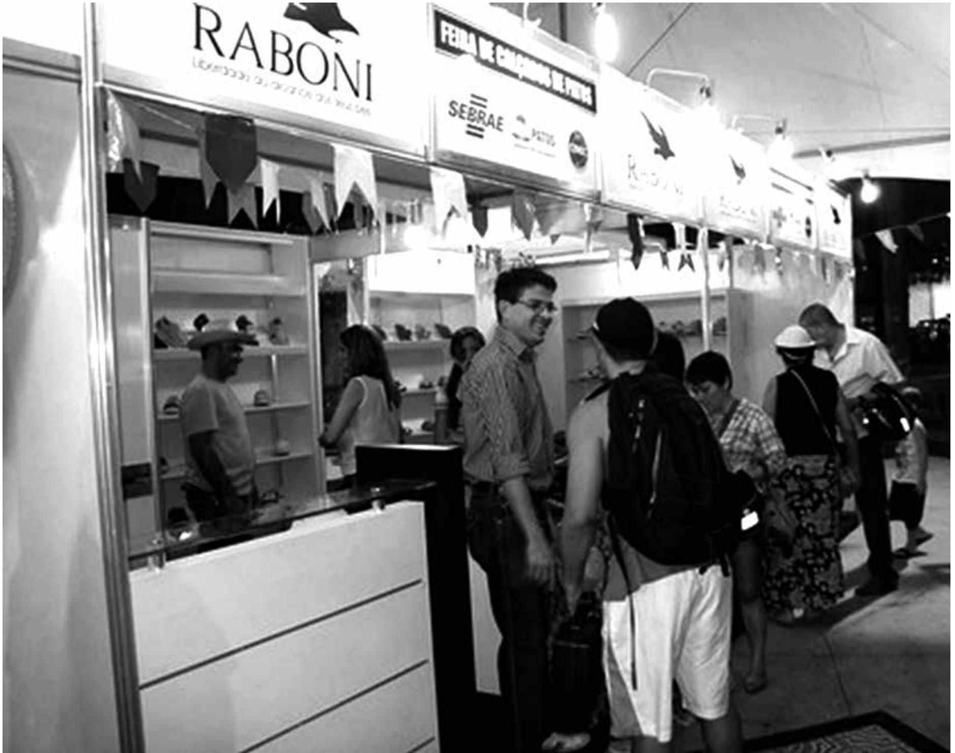
A feira é uma inovação no município de Patos e os empresários pretendem implantá-la na nova Central de Negócios das Indústrias de Calçados da Paraíba