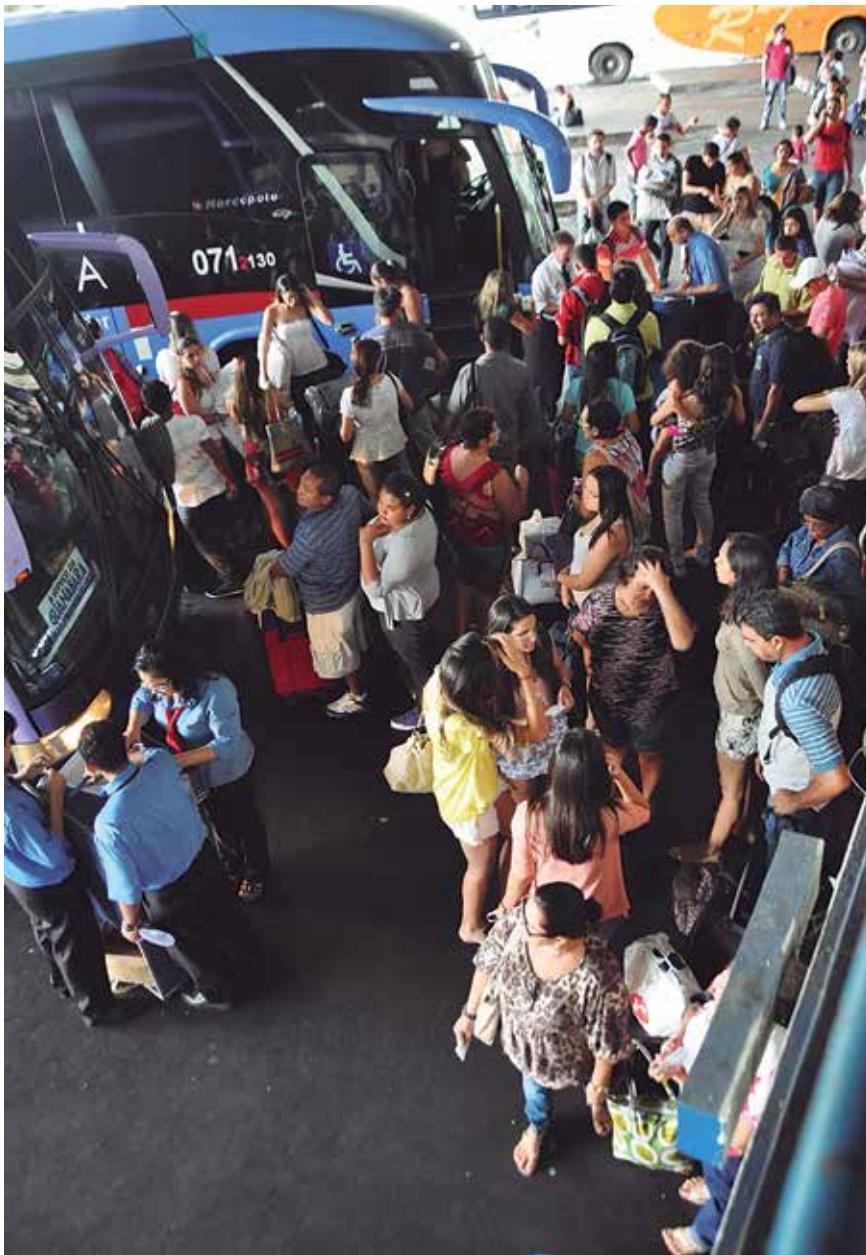
Rodoviária prevê 50 mil passageiros no São João PÁGINA 14