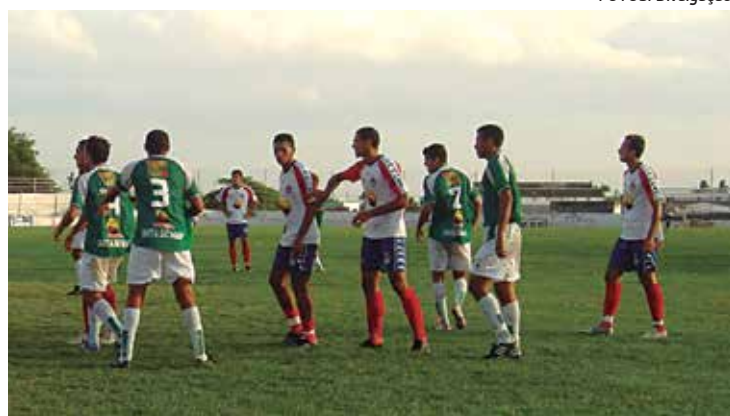
A Queimadense em ação pelo Campeonato Paraibano de 2008