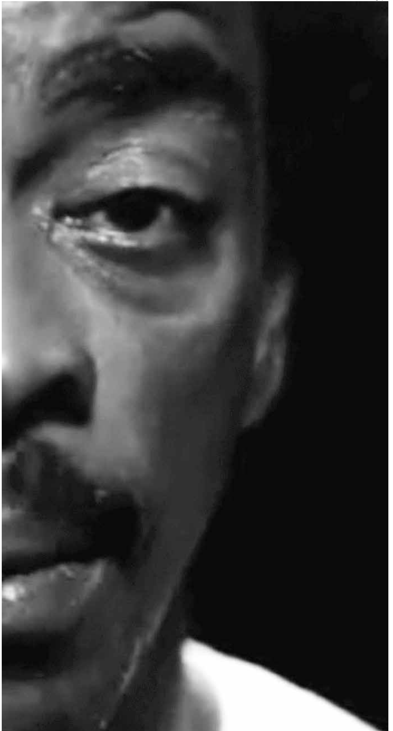
Negro é mais visado nas ações policiais feitas nas periferias das cidades brasileiras, segundo diz estudo acadêmico