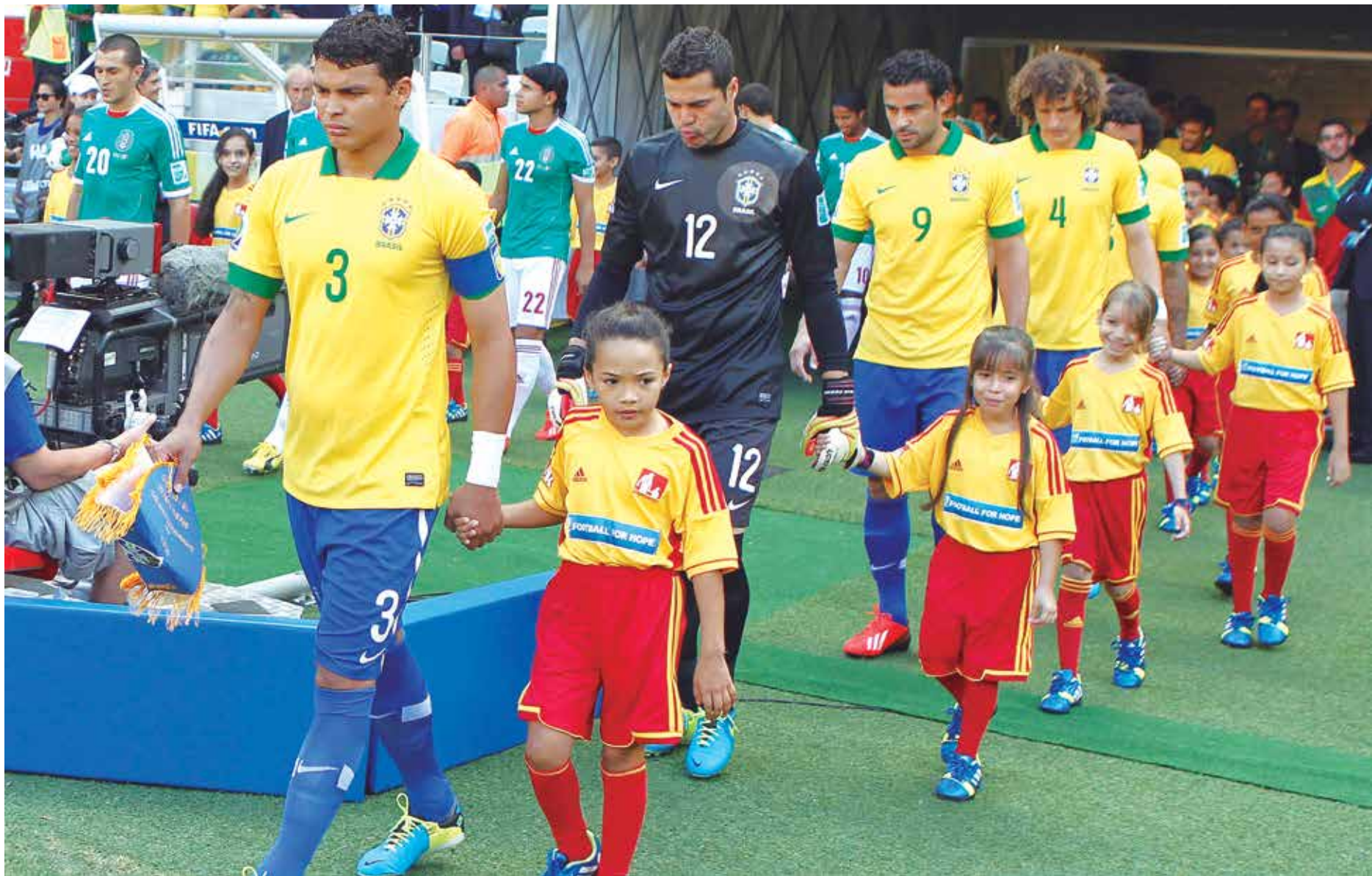
Com exceção de Paulinho, a equipe titular da Seleção Brasileira será a mesma que venceu o Japão, na estreia por 3 a 0 e o México, na última quarta-feira, por 2 a 0

Ontem, a Fifa anunciou os árbitros que apitarão os dois jogos que encerram o grupo A da Copa das Confederações. Ravshan Irmatov, do Uzbequistão, apita Brasil x Itália, em Salvador, partida que define o primeiro colocado da chave. O alemão Felix Brych comanda o duelo dos eliminados Japão e México, em Belo Horizonte.