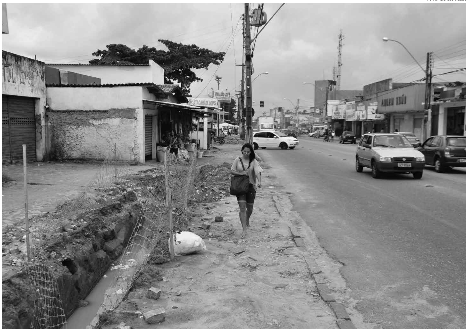
Projeto prevê a relocação de toda a rede de água, esgoto, energia e telefonia existentes do trecho da Avenida Cruz das Armas que está sendo duplicado