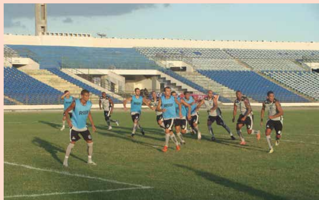
O Galo da Borborema treina firme pensando em vencer no domingo e voltar à segunda posição

“É um time organizado, perigoso e que sabe jogar na Graça, que tem dimensões pequenas para quem atua nos estádios maiores. Vamos nos precaver e entrar com uma equipe mais forte, principalmente com a volta de jogadores importantes para o elenco”, avaliou. Além do Tigre, o alvinegro serrano terá dois clássicos pela frente, diante do Botafogo, no dia 12 de maio, às 16h, no Amigão, e o Campinense, no Clássico dos Maiores, no mesmo local, faltando apenas a Federação Paraibana de Futebol (FPF) marcar a data do jogo.