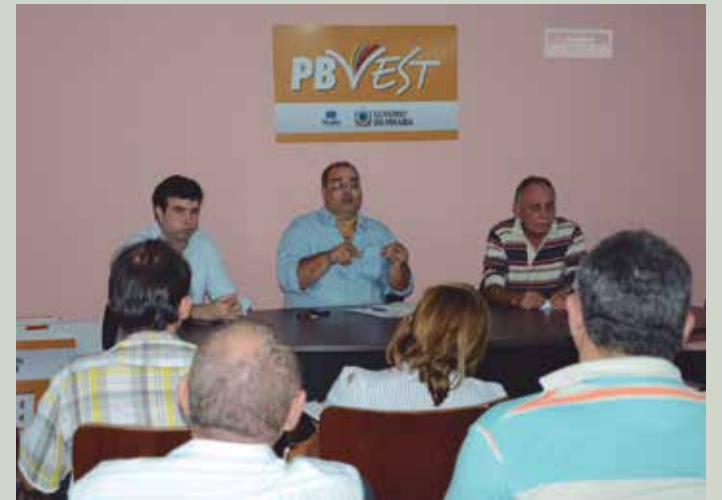
A coordenação do programa se reuniu para discutir detalhes

vo também fazer uma avaliação com os coordenadores de polos dos resultados obtidos em 2012, apresentar soluções para a correção de eventuais falhas e as metodologias pedagógicas que serão implementadas neste ano. O PBVest é oferecido pelo Governo do Estado, por meio da