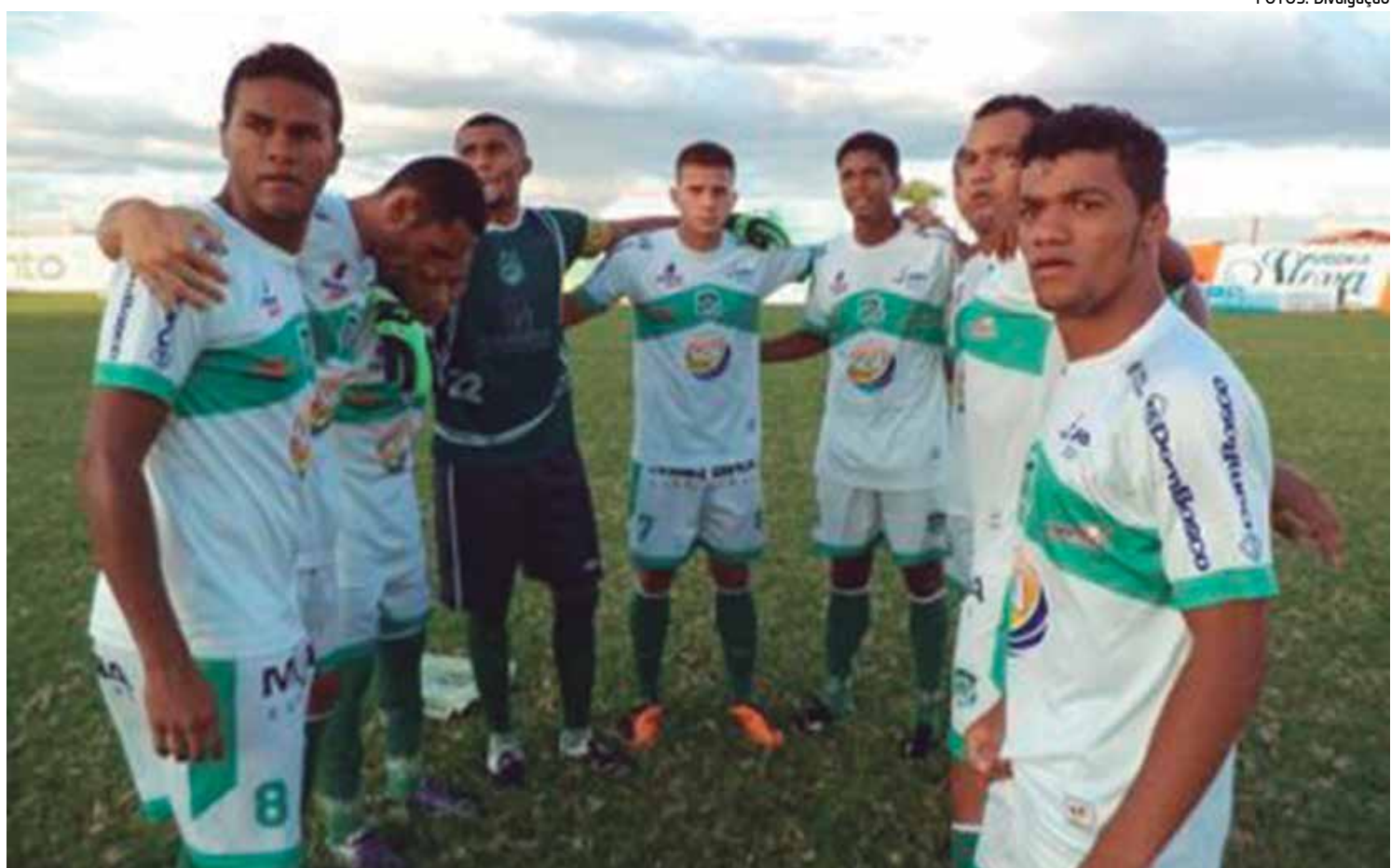
O time do Nacional ocupa a lanterna do Campeonato Paraibano 2013 e joga hoje contra o CSP precisando do apoio da sua torcida