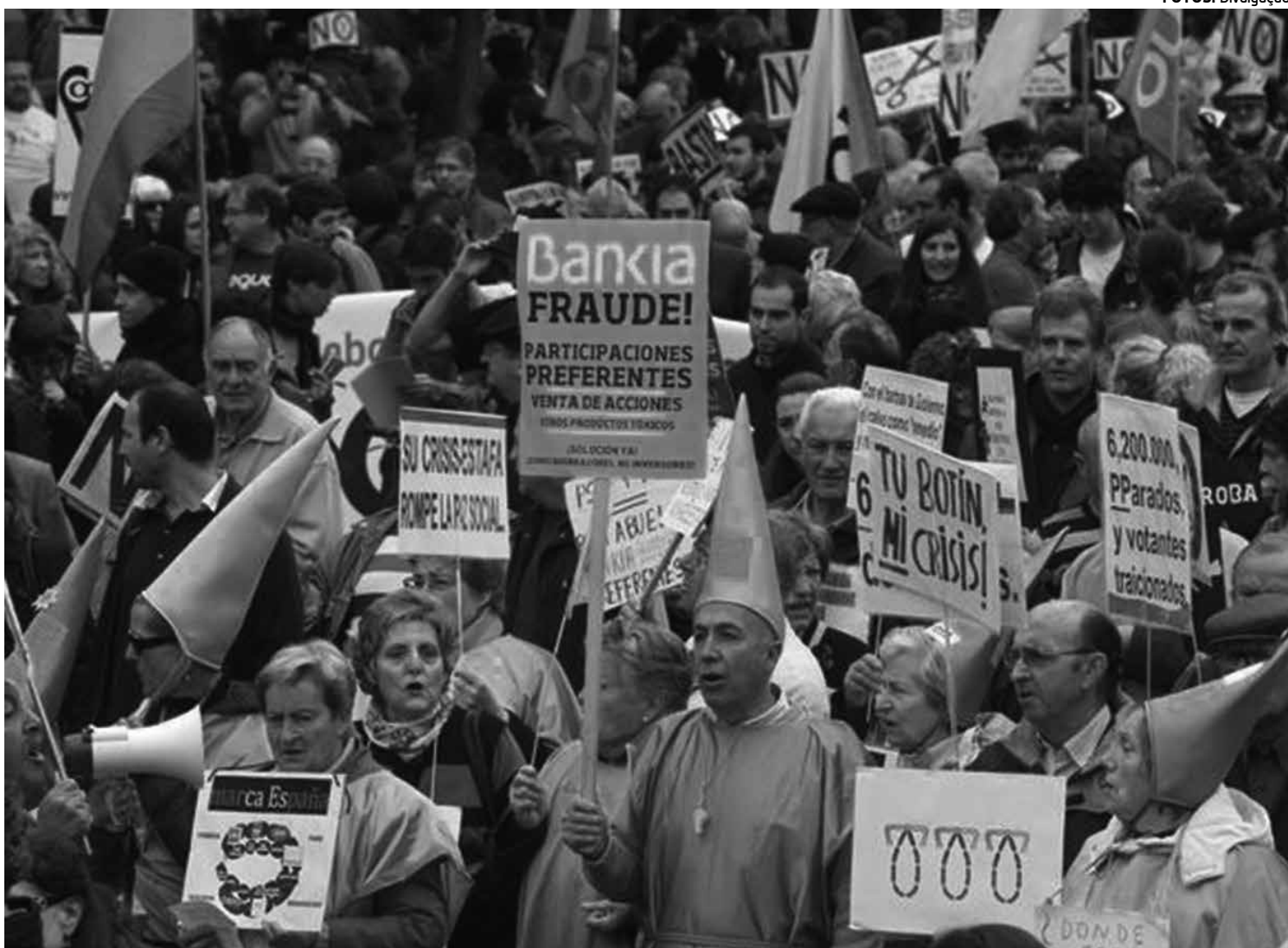
Trabalhadores marcham em Madri para protestar contra as políticas de austeridade, a recessão e o desemprego recorde na Espanha.

Na Turquia, após violentos protestos, a polícia atirou água e gás lacrimogêneo para dispersar multidões que se reuniram em Istambul. Dez pessoas ficaram feridas, incluindo dois policiais, e 20 foram detidas pela polícia, segundo a agência AFP.