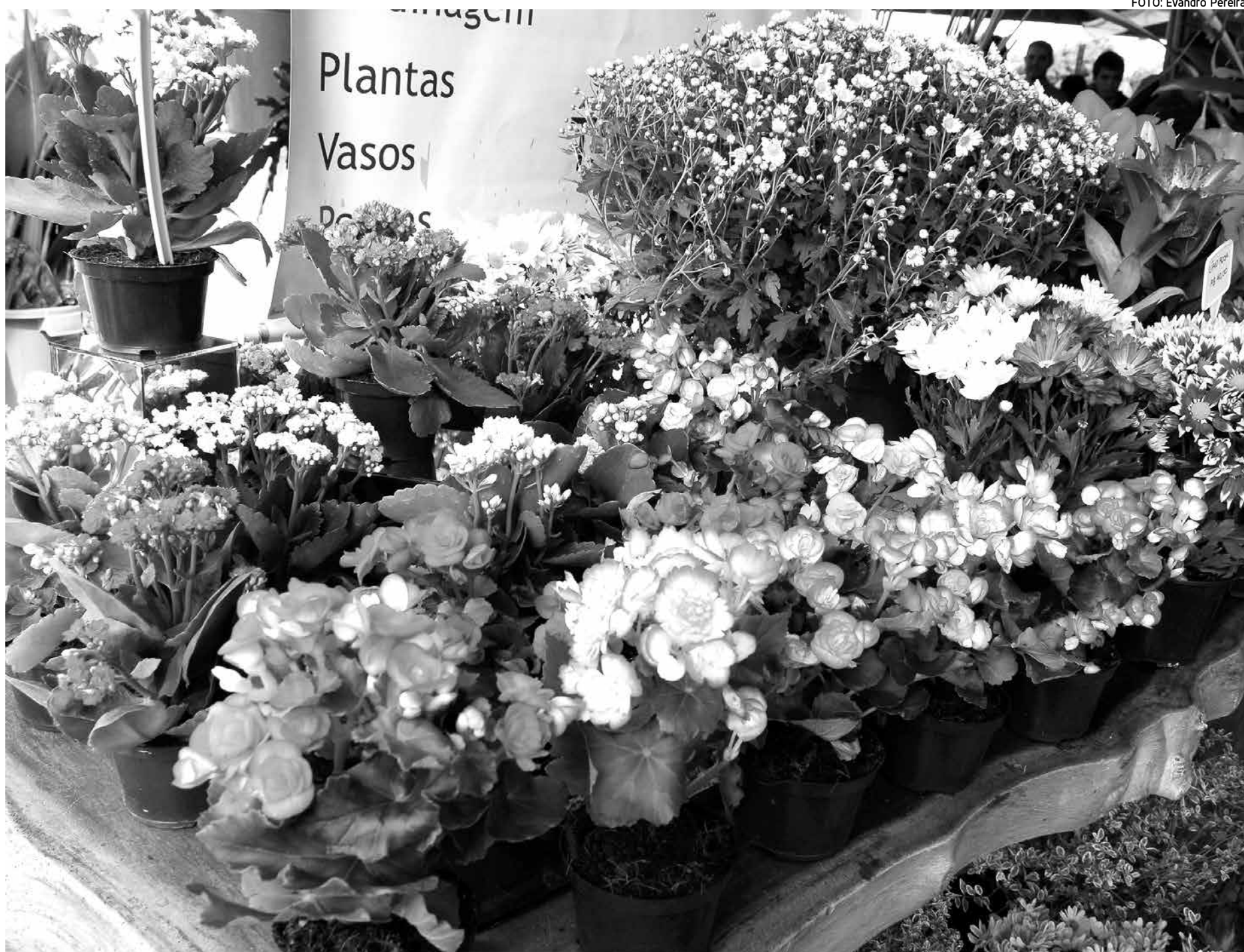
O maior valor praticado no comércio foi detectado pelo órgão de defesa do consumidor, na cesta com flores do campo selecionadas, grande, que custa R$ 150,00

A pesquisa foi realizada entre os dias 29 de abril e 2 de maio. Foram pesquisados 40 itens nos seguintes estabelecimentos: Floricultura Bancários (Bancários), Moça Flores (Centro), Rosa Mística (Centro), Deda Flores (Centro), Fábria Flores (centro), Capixaba (Tambaú), Floricultura Independência (Centro), Flora Falcone (Manáira) e Flor de Gileade (Centro).