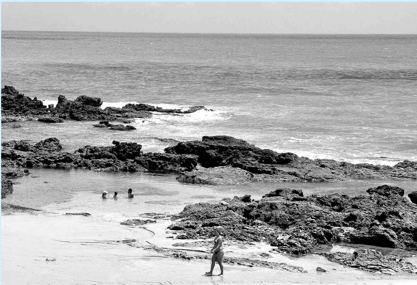
A Praia de Coqueirinho, no Litoral Sul da Paraíba, está em condições satisfatórias ao banho, segundo relatório da Sudema

O monitoramento é realizado semanalmente pela equipe da Coordenadoria de Medições Ambientais nos municípios localizados em centros urbanos com grande fluxo de banhistas: João Pessoa, Lucena e Pitimbu. Nos demais municípios do Litoral paraibano, a análise é feita mensalmente.