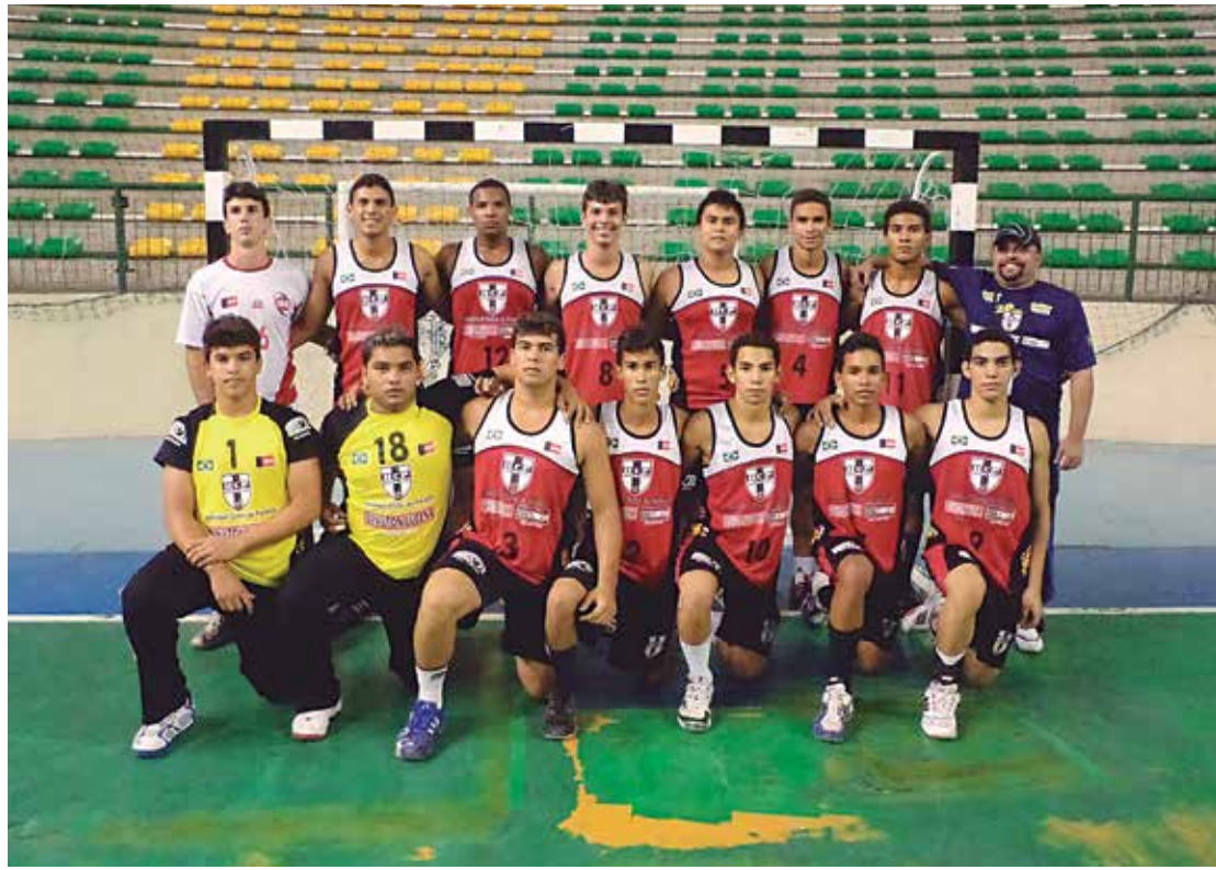
A time do HCP está buscando uma vaga no Campeonato Brasileiro que vai acontecer em Garanhuns

nior ressaltou que caso Delan volte do Brasileiro com a medalha de ouro, ele estará garantido no Mundial da categoria, que está programado para acontecer nos dias 24 a 27 de outubro, em Ljubljana, na Eslovênia.