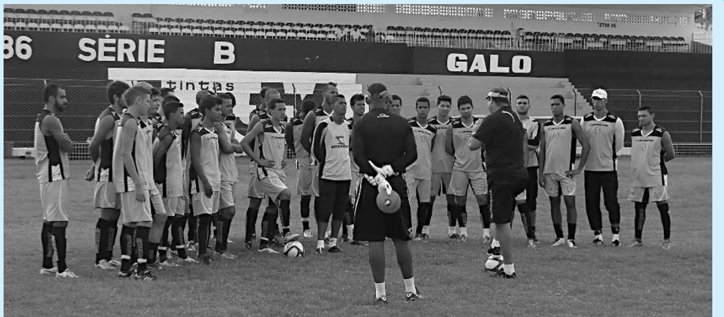
Técnico reúne jogadores no centro do gramado e cobra mais determinação nos jogos finais do Campeonato Paraibano de 2013

"Ainda não conseguimos nada. Não podemos perder a concentração nessa reta final do Campeonato", disse.