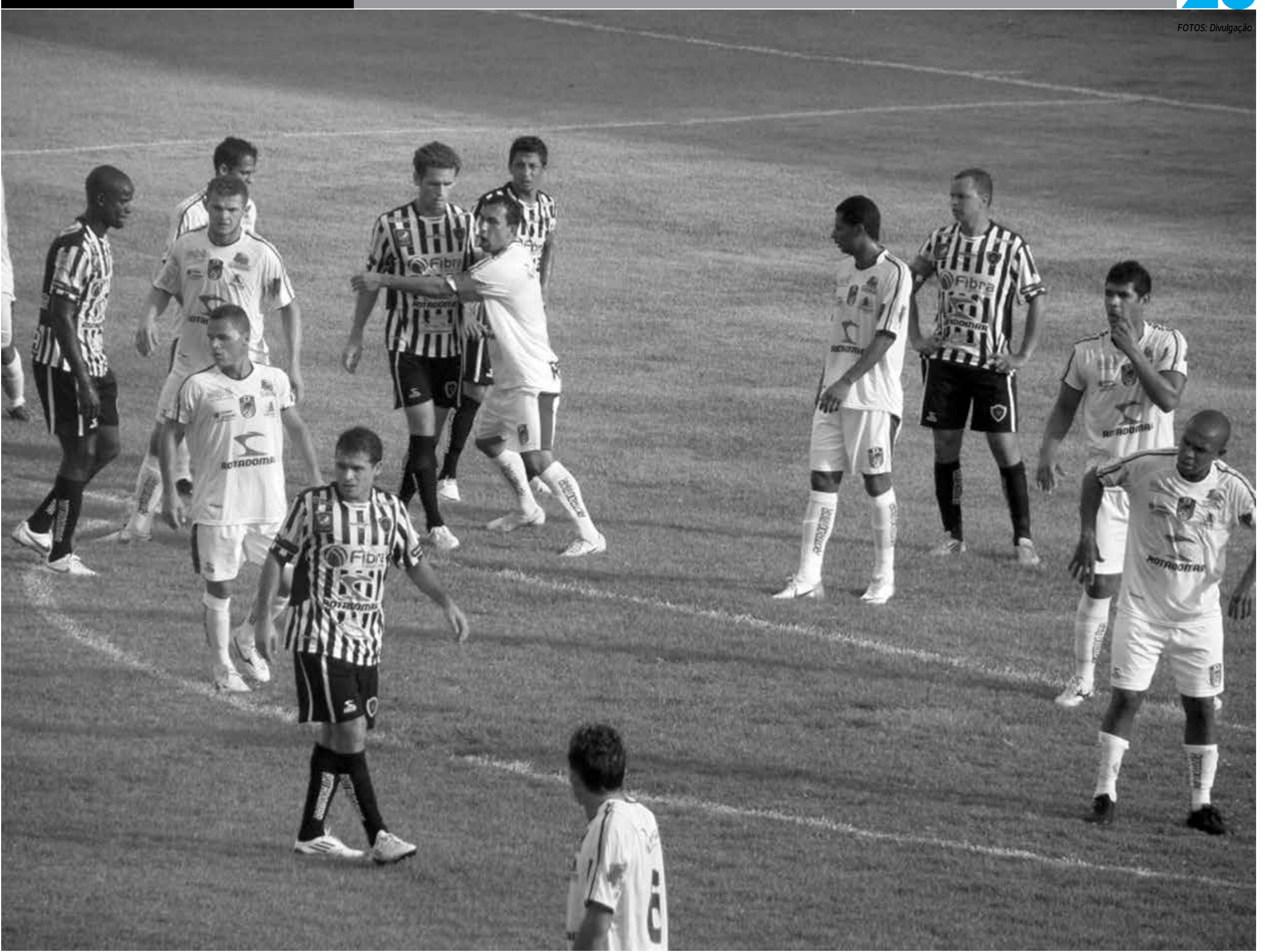
Botafogo e CSP têm jogos importantes pela décima terceira rodada do Campeonato Paraibano. O Tigre enfrenta o Treze, amanhã na Graça, enquanto o Botafogo só atua na segunda-feira contra o Atlético