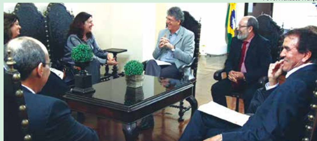
Ricardo Coutinho manteve encontro com a secretária Nacional do Consumidor, Juliana Pereira

De acordo com a secretária, a reunião discutiu a importância de reforçar a proteção do consumidor, porque o Estado coordena a política de atendimento e é fundamental levar o Procon-PB para as cidades que não dispõem do órgão de proteção ao consumidor. "O Governo Federal se coloca à disposição do Governo da Paraíba para colaborar com a criação de um plano