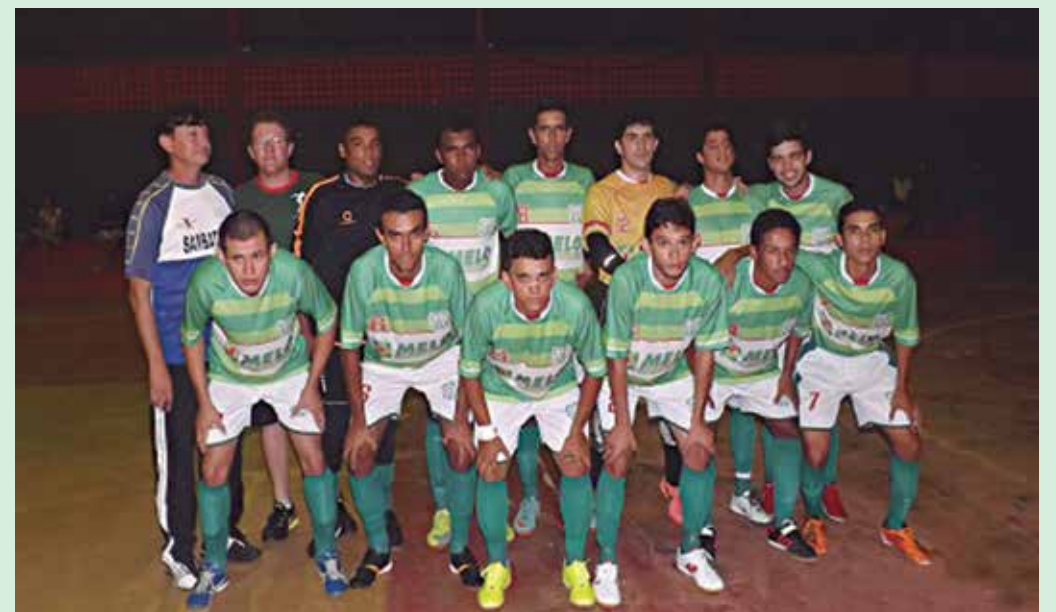
A equipe do Melo Esporte Clube, de Cajazeiras, venceu na estreia o Catoleense por 2 a 1

Além da vitória do Melo Esporte na Sociedade Esportiva Catoleense, no último sábado dia 27 de abril, foram realizadas quatro partidas. Em Patos, o 3-C ganhou do Grêmio Esportivo Sousense por 4x0, em São Mamede que levou a melhor foi o A.D. Brejo do Cruz que venceu o ASDDEMUS por 2x7 e em Cabedelo, o Cabedelo Clube perdeu para Servicar por 2x5.