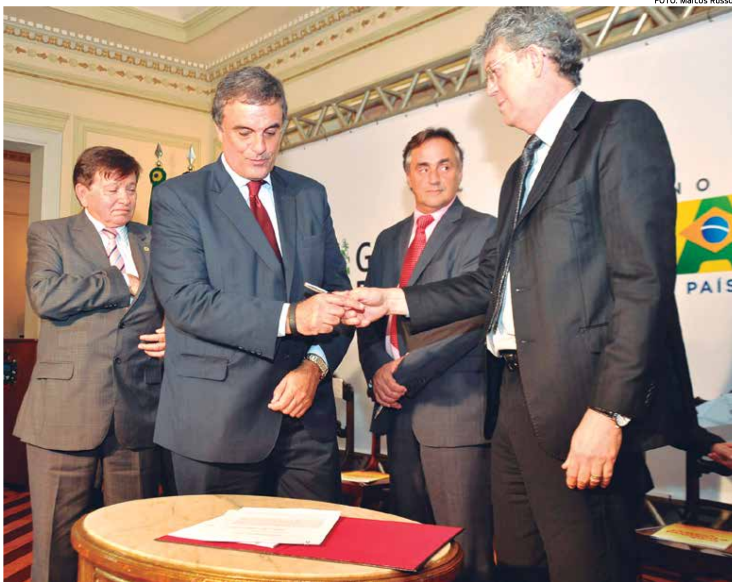
Governador Ricardo Coutinho e o ministro da Justiça, José Eduardo Cardozo, assinaram acordo ontem no Palácio da Redenção