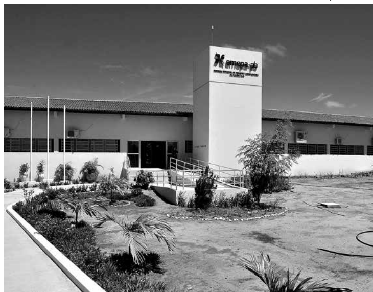
Unidade fica em Jacarapé e vai abrigar cerca de 100 funcionários