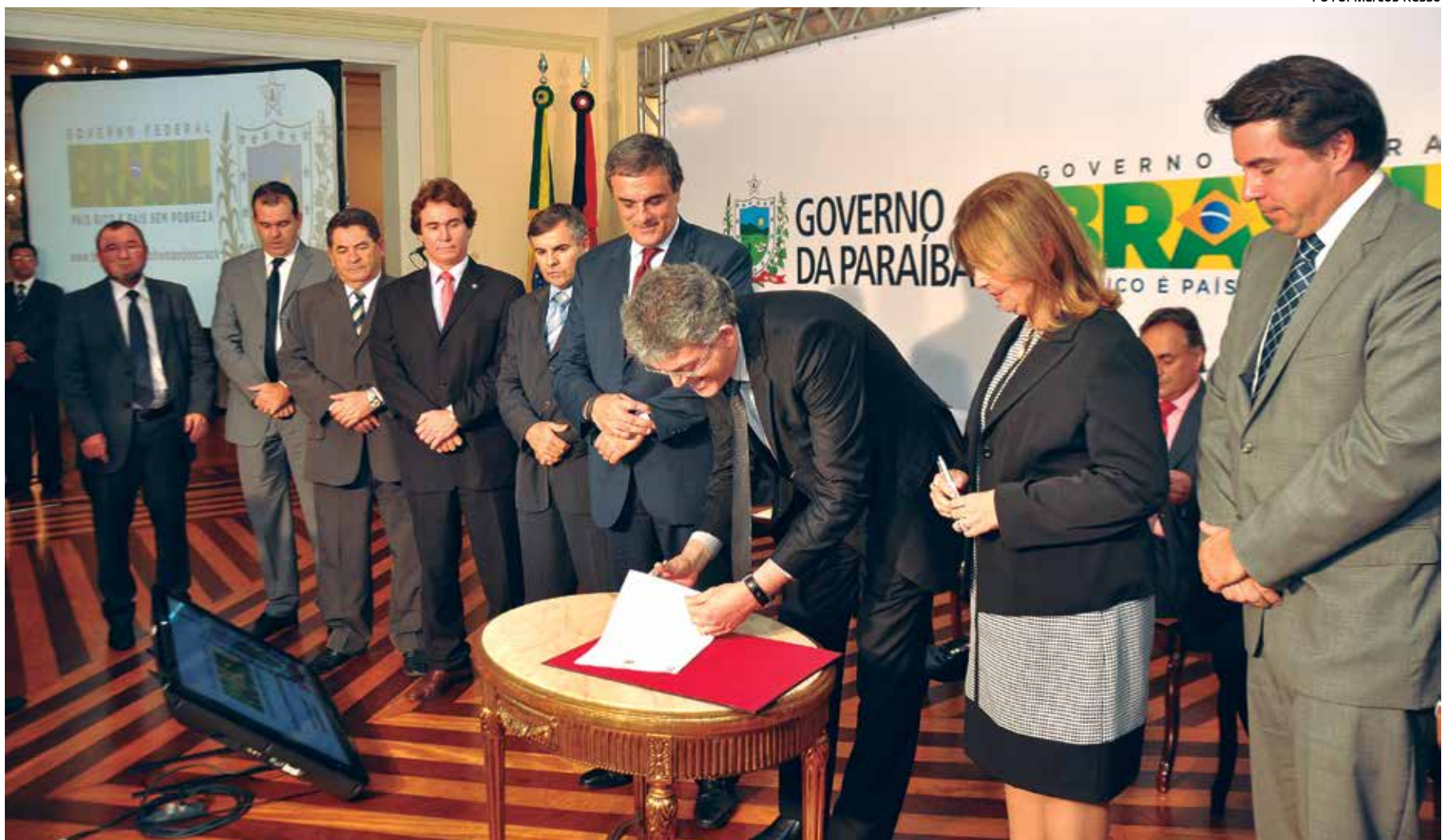
O governador Ricardo Coutinho e o ministro da Justiça, José Eduardo Cardoso, assinaram ontem os novos acordos para o enfrentamento da violência