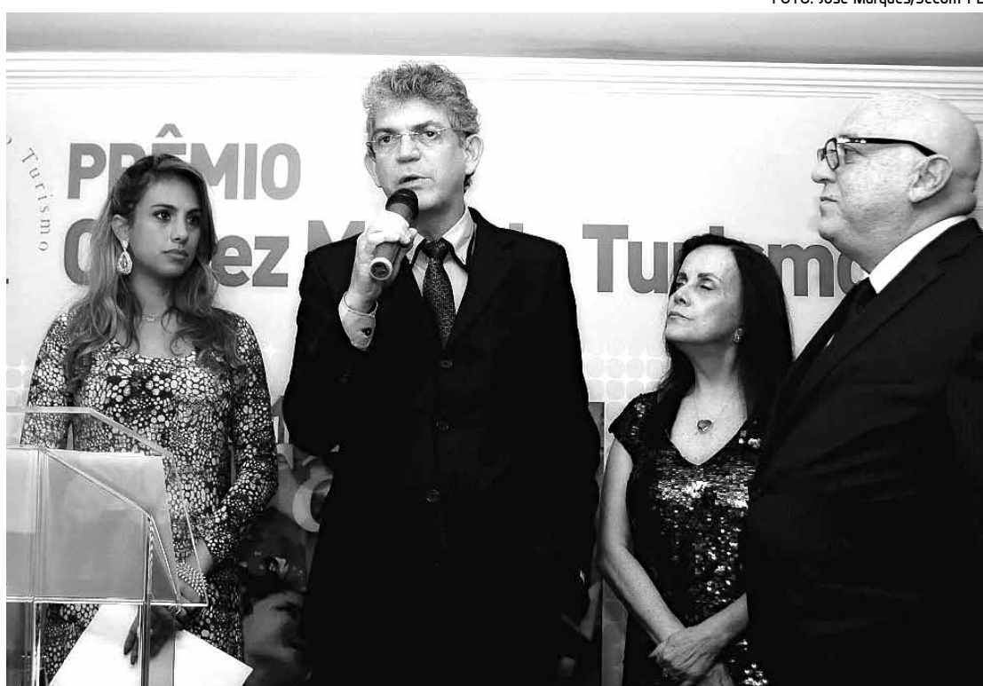
Governador Ricardo Coutinho também foi homenageado no evento com o troféu Personalidade do Ano

A equipe de jornalismo da revista passou 14 dias na