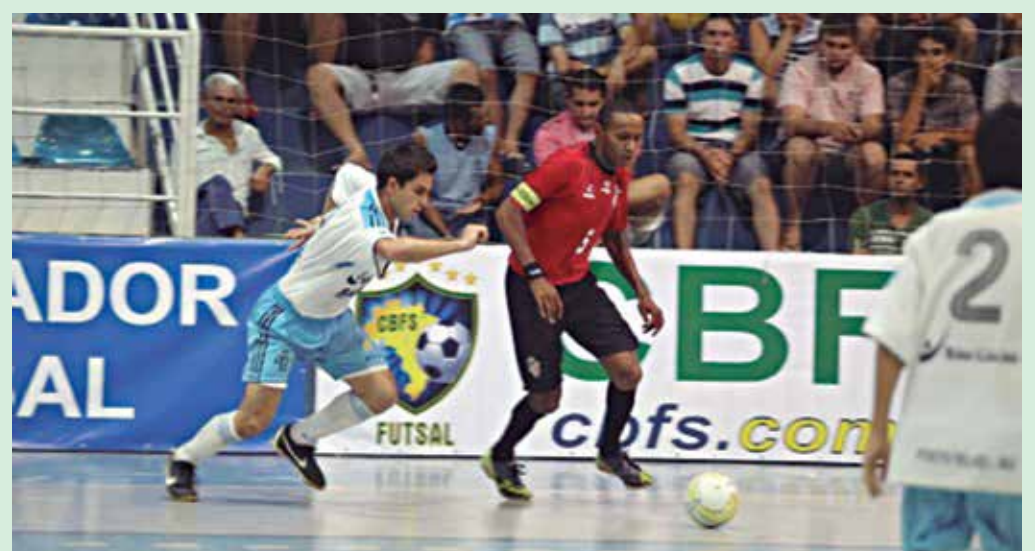
O futsal paraibano vive um bom momento com um Campeonato de Futsal dos mais disputados

Na chave do Litoral, o João Pessoa aplicou um 4x2 no COPM, em partida realizada na APCEF e fechando a 2ª rodada o EPCF Guarabira acabou em um empate com o Servicar, na cidade de Guarabira.