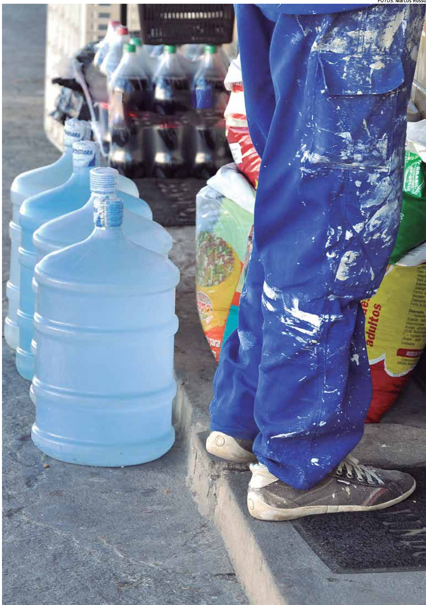
Lacre que envolve a tampa do garrafão de 20 litros é obrigatório e indica que o produto foi fiscalizado e não há risco de adulteração