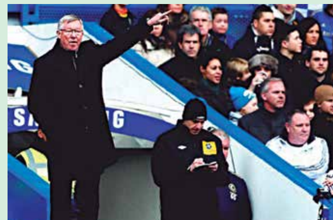
Ferguson anunciou a aposentadoria do Manchester United

Ferguson fez questão de agradecer o apoio familiar, reservando carinho especial à inseparável companheira, vista por ele como alicerce durante os longos 27 anos vividos à frente do time do Manchester United.