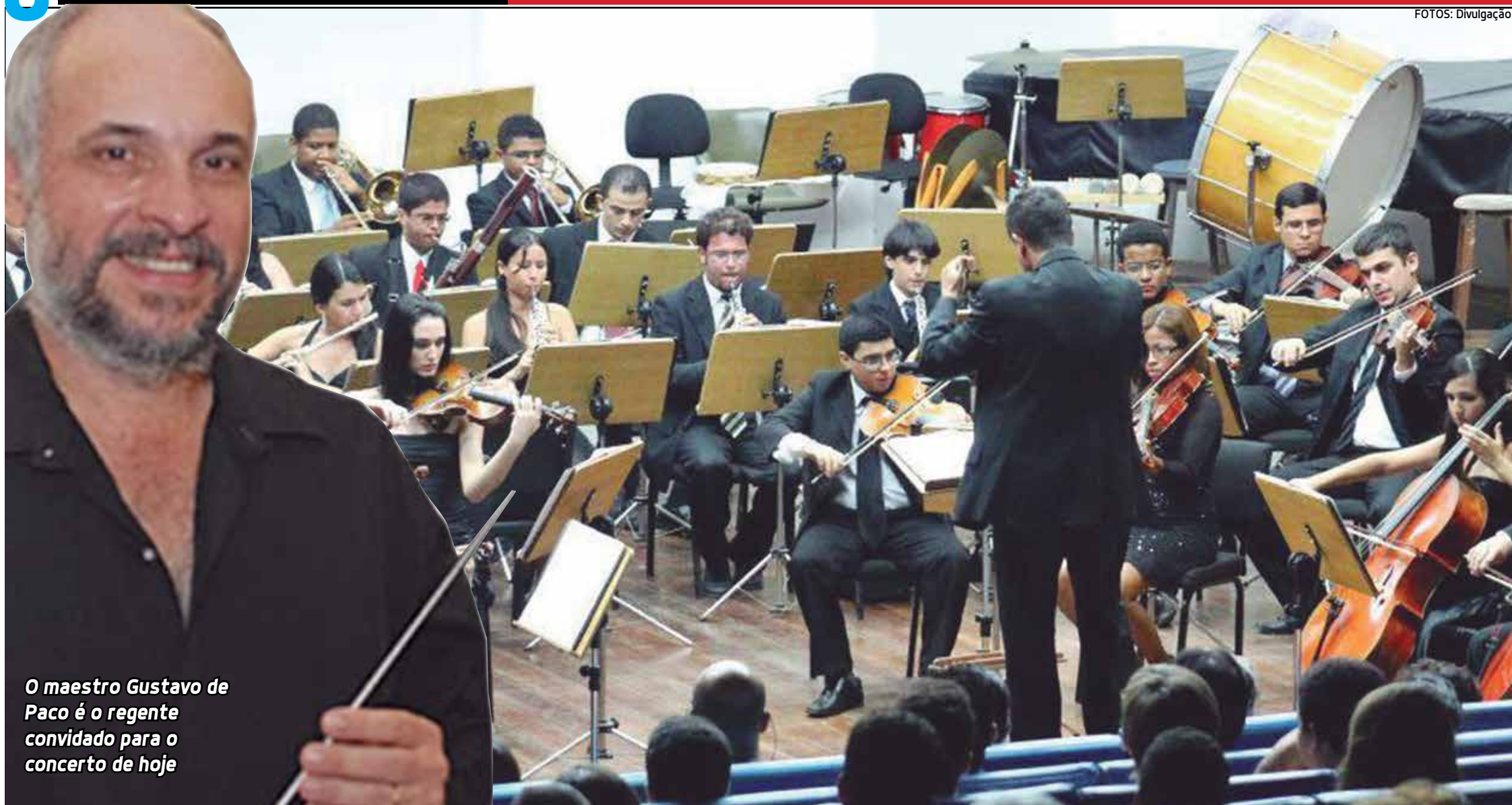
O maestro Gustavo de Paco é o regente convidado para o concerto de hoje