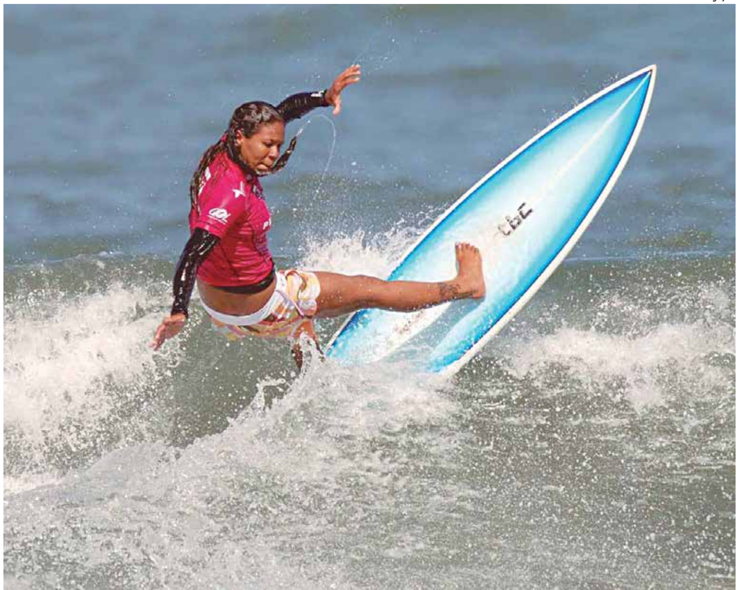
A paraibana da Baía da Traição vai se submeter a uma triagem antes da abertura da competição que acontece hoje no Rio de Janeiro

A competição está sendo realizada até o dia 19 deste mês na Praia da Barra da Tijuca, no Rio de Janeiro, e ainda este ano passará por Fiji, Indonésia, Taiti, Estados Unidos, França, Portugal e Havaí, onde teremos a grande final.