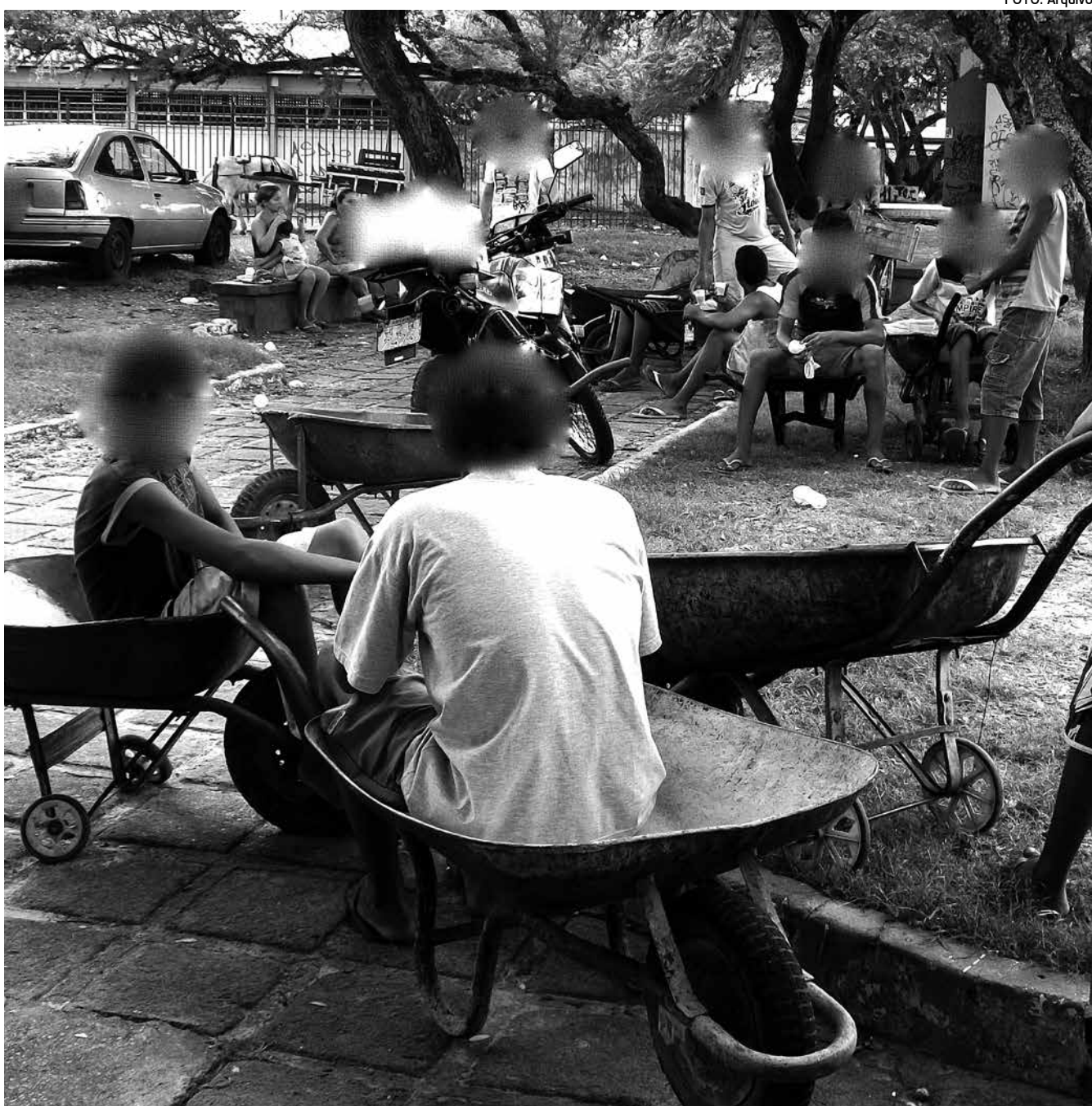
Trabalho insalubre de menores de 18 anos é proibido, conforme Emenda Constitucional 72, aprovada no último mês de abril

Concomitantemente, a ONG identificou a resistência cultural na sociedade brasileira, inclusive por parte de representantes do Poder Público, no sentido de naturalizar o trabalho infantil, tanto no âmbito do lar quanto em outros locais – o que dificulta a negociação com os possíveis empregadores e as denúncias feitas por terceiros. Em 2011, foram registrados mais de 3,1 mil casos de crianças e adolescentes trabalhando na iniciativa privada com autorização prévia da Justiça. Entre 2005 e 2010, esses casos superaram 33 mil.