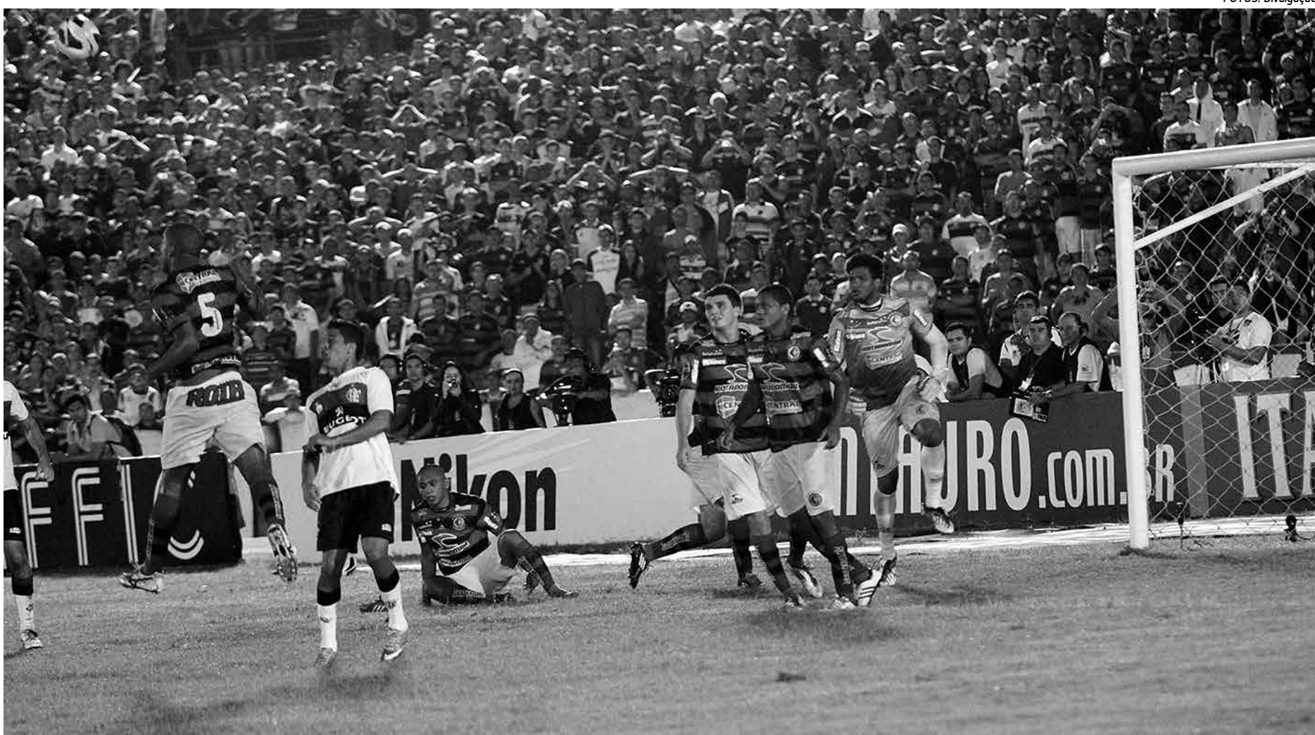
Envolvido em duas competições, o Campinense tem tudo para garantir classificação às semifinais do Campeonato Paraibano hoje no jogo contra o Atlético

Um resultado positivo para encarar o Treze, no próximo domingo, às 16h, no Amigão, e enfrentar o Flamengo-RJ, na próxima quarta-feira (15), no Estádio Municipal Radialista Mário Helênio, em Juiz de Fora-MG, no jogo de volta das duas equipes, com a Raposa perdendo a primeira, por 2 a 1, na Serra da Borborema, pela Copa do Brasil/2013. Com duas pedreiras pela frente - Treze e Flamengo-RJ - o objetivo é fazer o dever de casa e garantir presença na próxima fase da disputa. O