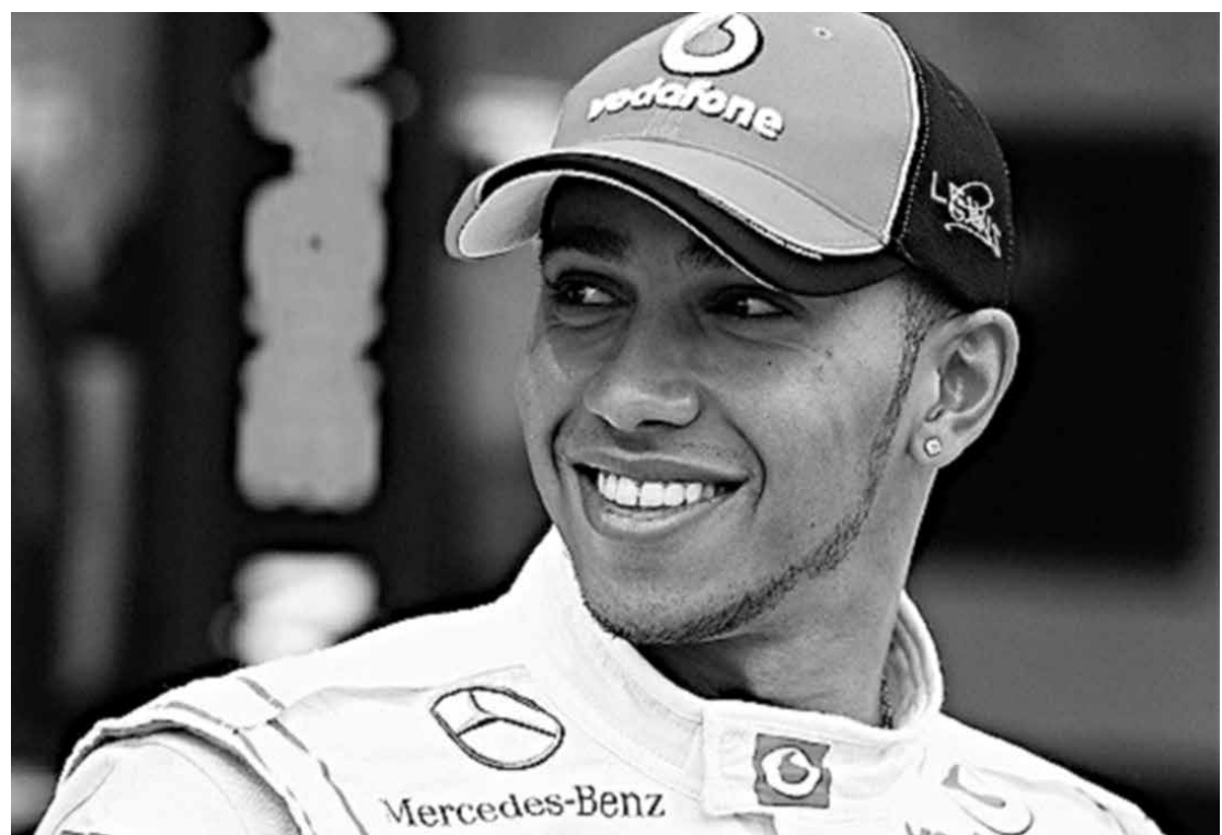
Lewis Hamilton já foi campeão pela McLaren e este ano se transferiu para a equipe Mercedes

Vítima de sua irregularidade em 2012, Felipe Massa passou por uma redução salarial para a atual temporada: o brasileiro, que recebia 10 milhões de euros em 2012, passou a ganhar 6 milhões de euros por ano em 2013, ou cerca de R$ 15,8 milhões pela temporada. Já Kimi Raikkonen ganha 3 milhões de euros (R$ 7,9 mi), mais 40 mil euros (R$ 105 mil) por ponto conquistado.