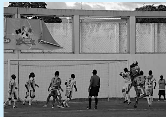
Auto Esporte e Sousa empataram na primeira fase do turno

Na opinião do treinador Jairo Santos, existe o ditado popular que diz, a esperança é a última que morre. "No futebol você tem que buscar até o apito final do árbitro. Sabemos que não será fácil, já que ficaremos dependendo dos outros. Vamos a luta e fazer a nossa parte", observou. Após perder para o Atlético de Cajazeiras (1 a 0), na última rodada, no Perpetão, e ser eliminado o Sousa, que vem na sétima posição, com 17 pontos ganhos, decidiu dispensar os jogadores que foram contratados e colocar em campo os atletas da