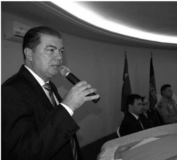
Novo chefe da Corregedoria quer mais capacitação para os policiais