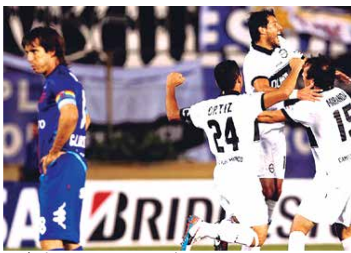
O Olímpia, de branco, venceu o Tigre e ganhou a vaga nas quartas

Como realizou campanha melhor do que o Fluminense na fase de grupos, o Olímpia atua fora de casa contra o Tricolor das Laranjeiras no jogo de ida das quartas de final na quarta-feira.