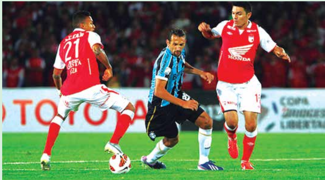
A equipe brasileira até que lutou muito, mas foi vencido pelo Santa Fé e saiu da competição