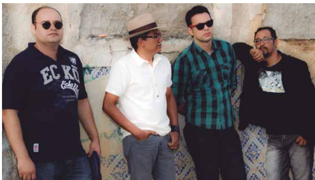
A banda In The Mood vai mostrar o repertório do primeiro disco, que será lançado no final do ano

De acordo com o músico, essa proposta do trabalho autoral da In The Mood - que já se apresentou na Paraíba e em outros estados do Nordeste, ao longo dos últimos oito anos - é reforçar a influência das bandas que surgiram a partir das décadas de 60 e 70. "Mas sem ter que abrir mão da essência musical. É tocar com paixão, sendo fiel a proposta inicial de res-