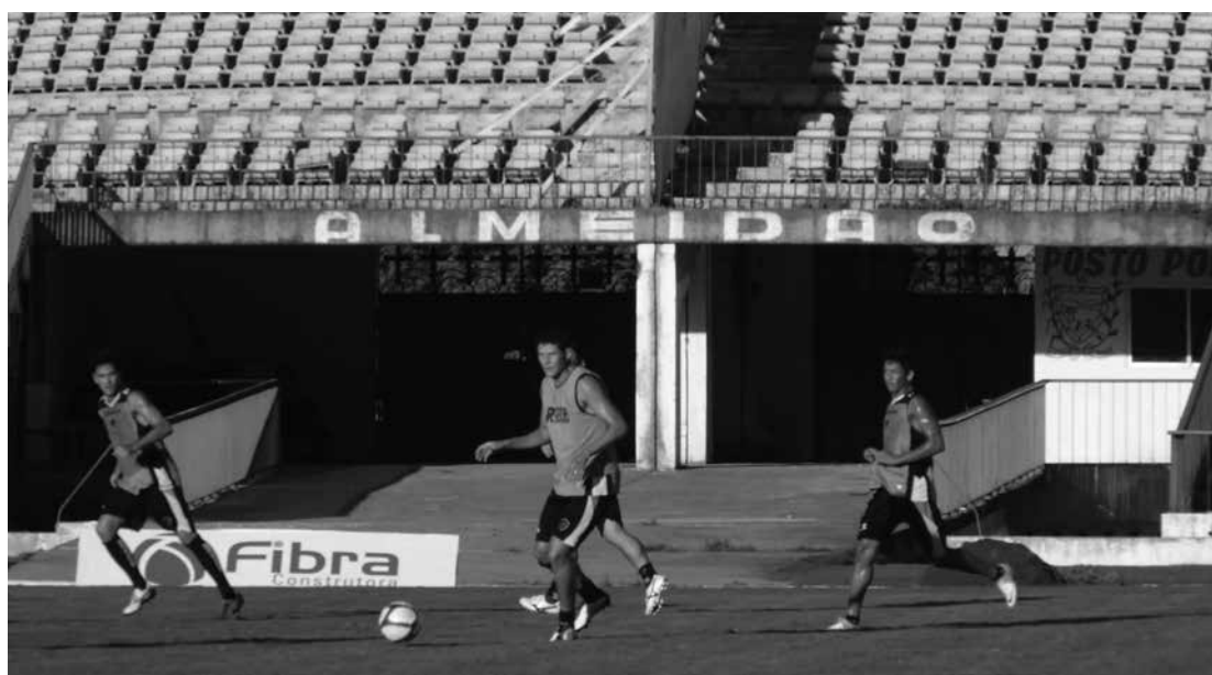
O treino pronto do Botafogo foi realizado no Almeida visando o jogo de hoje diante do Treze