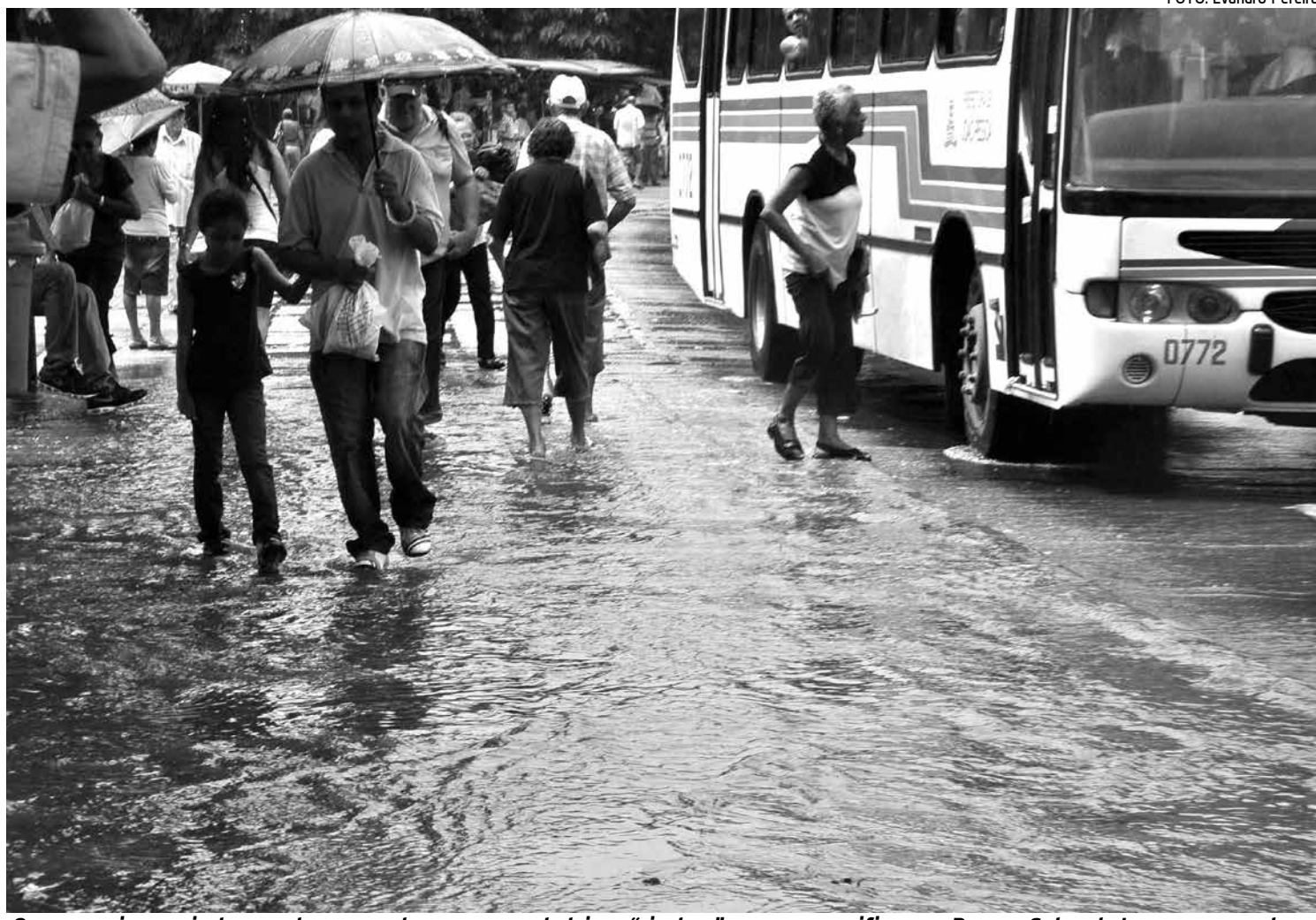
Quem precisou sair de casa teve que atravessar verdadeiros "riachos", como se verificou no Parque Solon de Lucena, no centro

A agressão dos filhos contra os pais é a modalidade de violência doméstica com maior incidência na região do Agreste da Paraíba