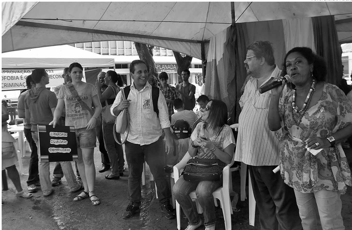
A comemoração feita ontem na Lagoa teve o objetivo de criminalizar a homofobia e conscientizar a população de que todos têm direito a viver em paz

Outros pontos, como descontos sobre juros e multas para os empregadores em atraso com contribuições previdenciárias e o boleto único para pagamento das contribuições de FGTS e Previdência, estão sendo discutidos com o governo.