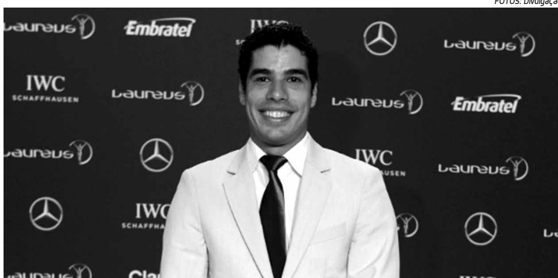
O atleta brasileiro paralímpico Daniel Dias, da natação, foi um dos premiados como melhor para-atleta

Diante de um evento único como esse na Cidade Maravilhosa, os brasileiros Bob Burnquist e Daniel Dias, ganhador do prêmio de "Melhor Atleta com Deficiência" desta edição, e a ex-ginasta romena Nadia Comaneci aproveitaram a oportunidade para fugir dos padrões de terno preto e vestido longo