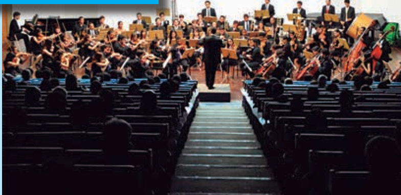
Sinfônica Jovem inicia temporada de concertos PÁGINA 5