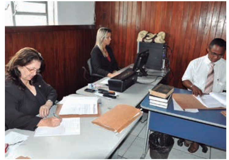
Equipe de defensores recebe os apenados diariamente no presídio