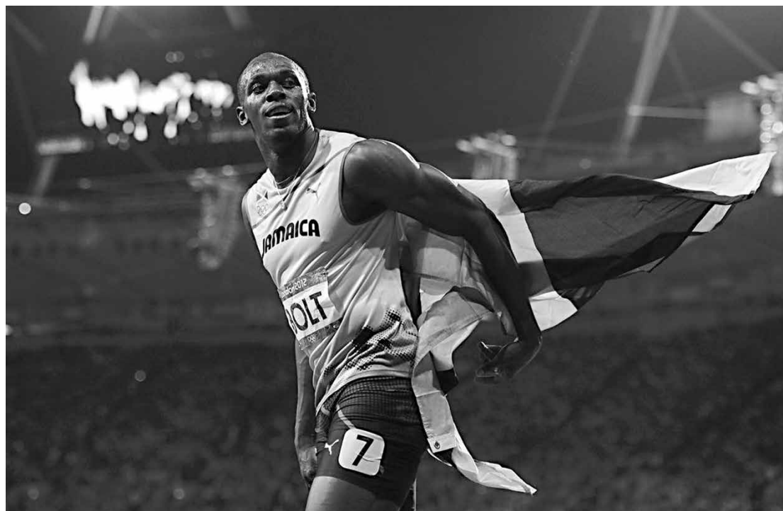
O jamaicano Usain Bolt ignorou a festa, mas acabou sendo eleito o atleta do ano pela terceira vez

e ousaram nos modelitos. A festa foi integralmente apresentada em inglês. Até o governador Cabral, que discursou no início do evento, abandonou sua língua natal para se fazer entender. "É um prazer muito grande recebê-los aqui. O povo do Rio ama esportes", afirmou ele, em inglês.