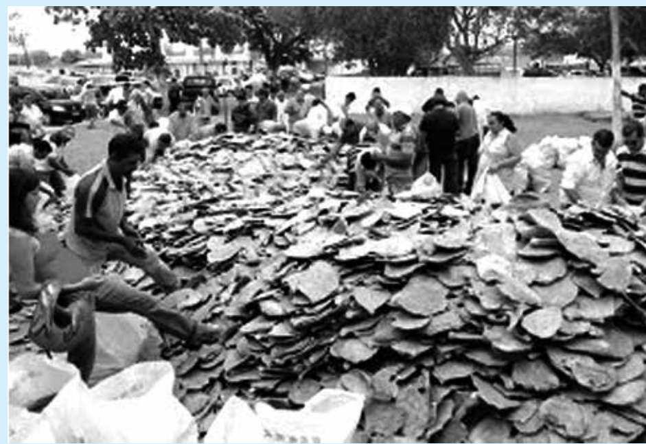
A distribuição de palma faz parte das ações do governo contra os efeitos da seca

Além da distribuição das mudas, o Sistema Faepa/Senar-PB, por