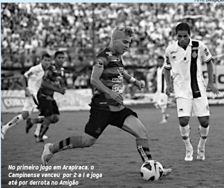
No primeiro jogo em Arapiraca, o Campinense venceu por 2 a 1 e joga até por derrota no Amigão