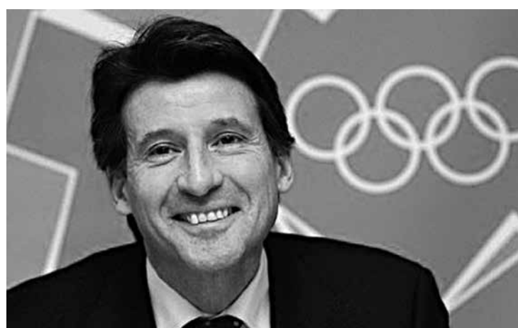
Sebastian Coe foi o presidente do Comitê dos Jogos de Londres

"Tenho certeza de que o Rio vai organizar Jogos maravilhosos, será uma grande oportunidade para o movimento olímpico impactar milhões de jovens brasileiros e sul-americanos que nunca viram este evento ao vivo", afirmou Coe, que foi ao Teatro Municipal na noite desta segunda-feira para