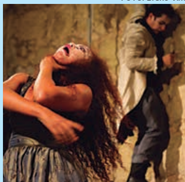
Abismo, peça inspirada no teatro do absurdo, estreia hoje no Cearte PÁGINA 8