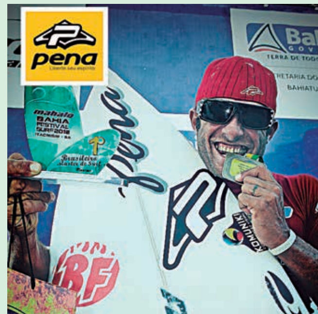
O surfista paraibano compete entre os dias 6 e 14 de abril

A delegação brasileira tem ainda o direito de levar uma mulher para competir na categoria Master, mas a CBSurf até o momento não anunciou oficialmente a atleta que fechará o grupo de participantes na edição deste ano do Mundial. O critério de classificação utilizado pela Confederação Brasileira de Surf (CBSurf)