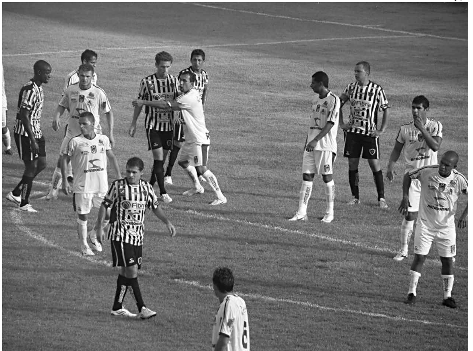
O CSP quebrou a invencibilidade do Botafogo no domingo passado com a vitória de 2 a 1, assim como o Auto, que venceu o Treze no PV

Já o CSP deve manter a equipe que derrotou e acabou a invencibilidade do Belo na disputa. Ele terá a disposição o zagueiro Luís Paulo e o volante Peu, que