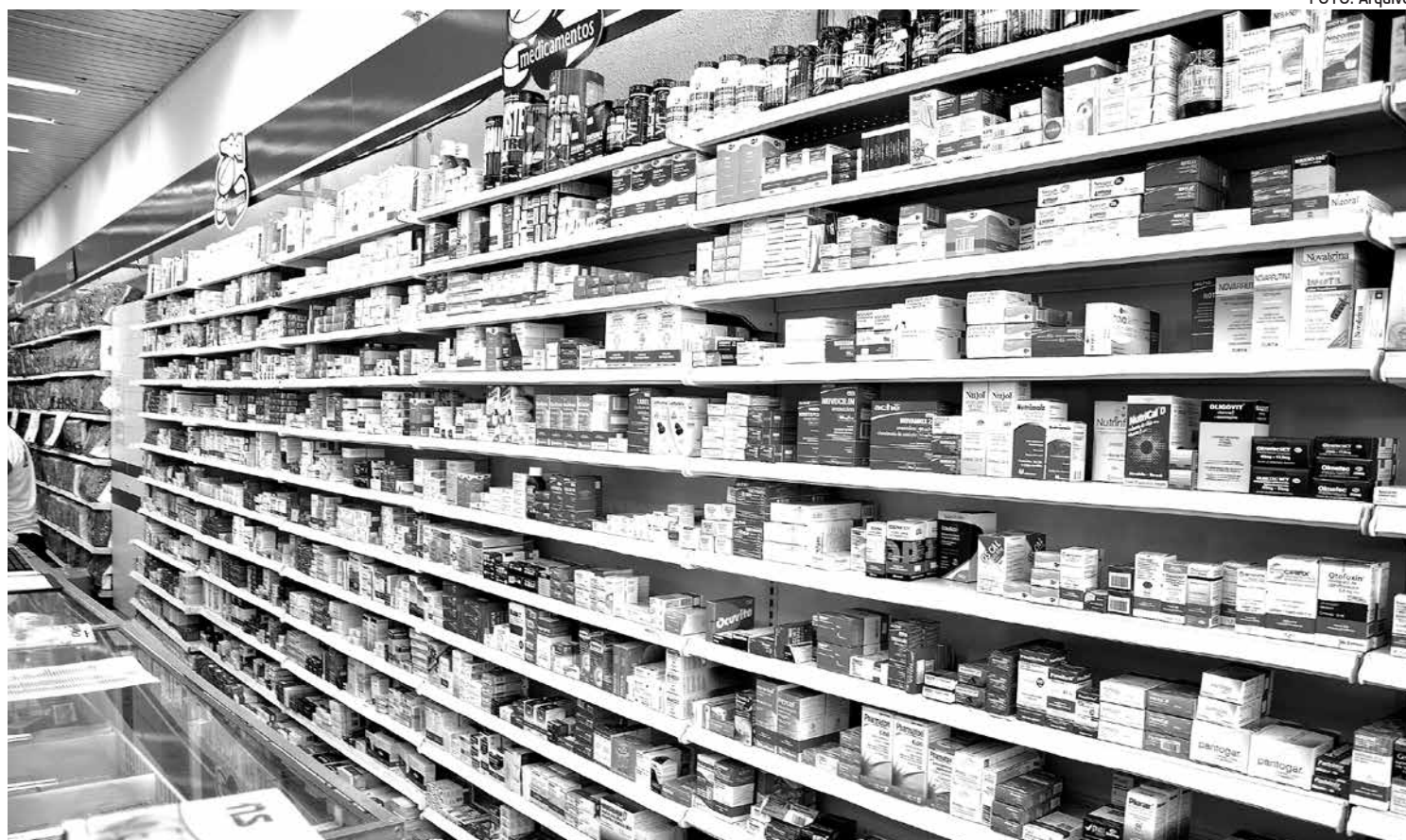
Majoração dos preços dos remédios vai levar em conta expectativas de inflação, ganhos de produtividade e o preço dos insumos

Para esses reajustes, serão consideradas as expectativas de inflação, de ganhos de produtividade das empresas de medicamentos e o preço dos insumos usados na produção dos remédios. Para a inflação, deverá ser usado o Índice Nacional de Preços ao Consumidor Amplo (IPCA), acumulado entre março de 2011 e fevereiro de 2012, calculado pelo Instituto Brasileiro de Geografia e Estatística (IBGE).