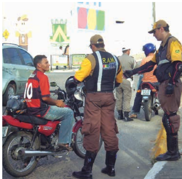
Agentes de Trânsito da STTP em trabalho conjunto com o Detran