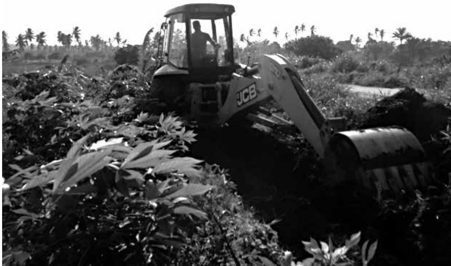
Ontem, começou a escavação dos locais onde vão ficar os tanques de armazenamento de água, em uma comunidade indígena de Belém

A entrega dos materiais de irrigação começou no ano passado. "A primeira comunidade beneficiada foi o assentamento Nova Vida, também em Pitimbu", declarou o gestor do Cooperar. O assentamento tem 200 famílias integradas nos projetos de agricultura familiar. O foco da produção é na agricultura orgânica. "As pessoas estão cada vez mais conscientes de que os produtos de base agroecológica são mais saudáveis e devem ser consumidos no lugar dos convencionais, que levam agrotóxicos. Por isso, o nosso incentivo", disse.