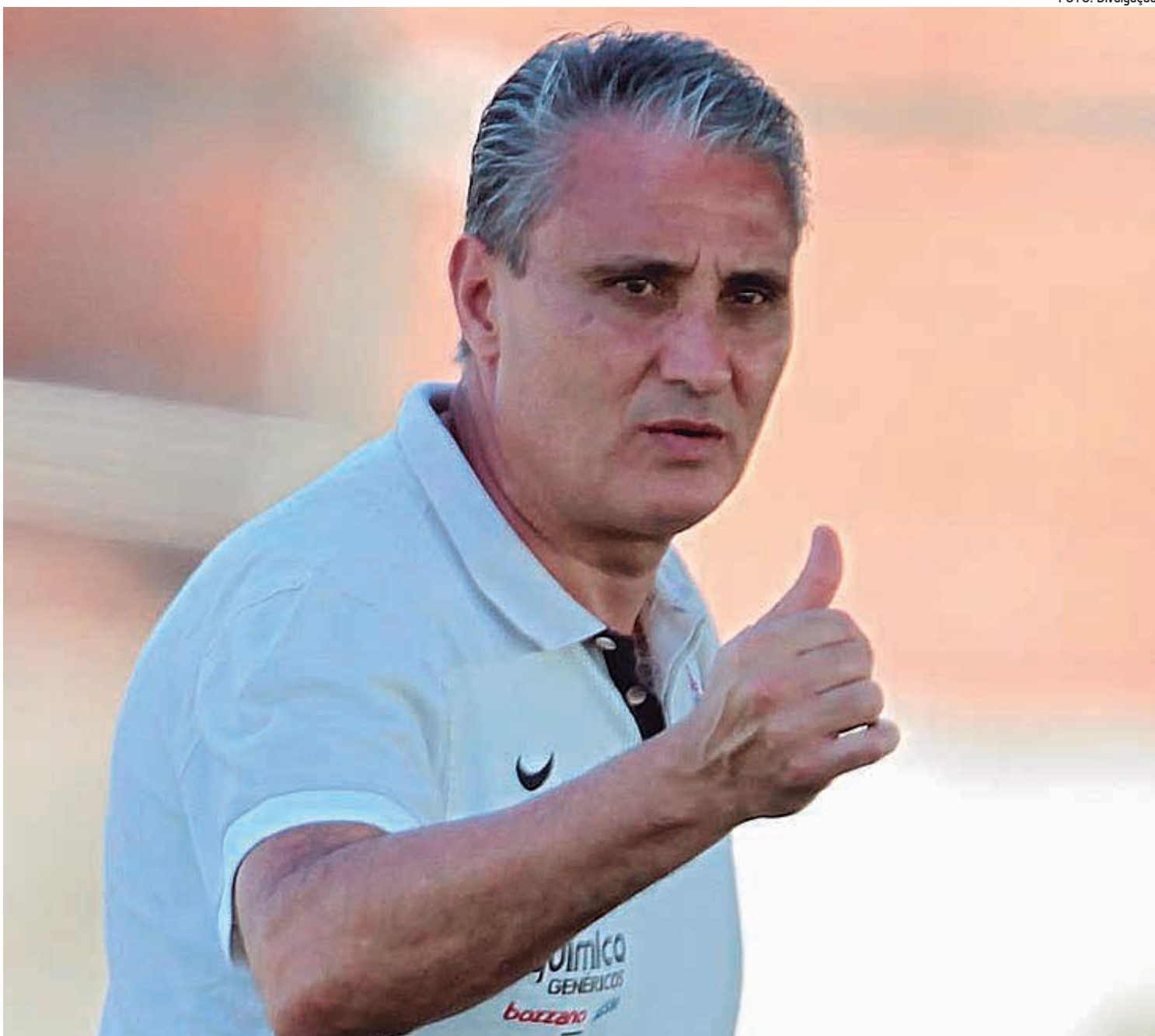
Sem mistérios, Tite anunciou que escalará contra o Tijuana, hoje, a mesma equipe que perdeu para o time mexicano na semana passada

Os vacilos recorrentes da defesa corintiana em cruzamentos dos adversários preocuparam o comandante. Tite destacou em diversas oportunidades a necessidade de o Timão tomar menos gols em bolas originadas do jogo aéreo. No último sábado, na vitória por 3 a 2 sobre o Ituano, a equipe voltou a vacilar no aspecto - os dois gols do time do interior saíram em falhas de posicionamento da defesa, formada, na oportunidade, por Chicão (que fazia sua primeira partida em 2013) e Felipe.