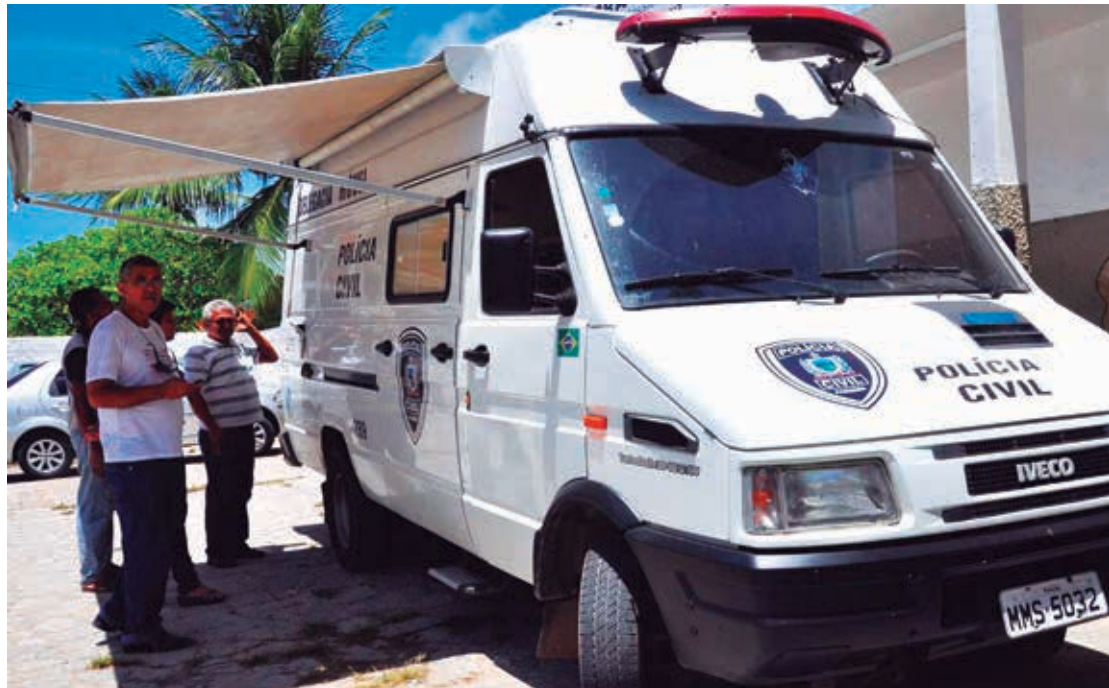
A Delegacia Móvel orienta e atende mulheres percorrendo vários bairros de João Pessoa

Em 2012, para reforçar a rede de proteção e atender mulheres em cidades do interior do Estado, a Secretaria da Mulher e da Diversidade Humana inaugurou o Centro Estadual de Referência da Mulher Fátima Lopes, em Campina Grande.