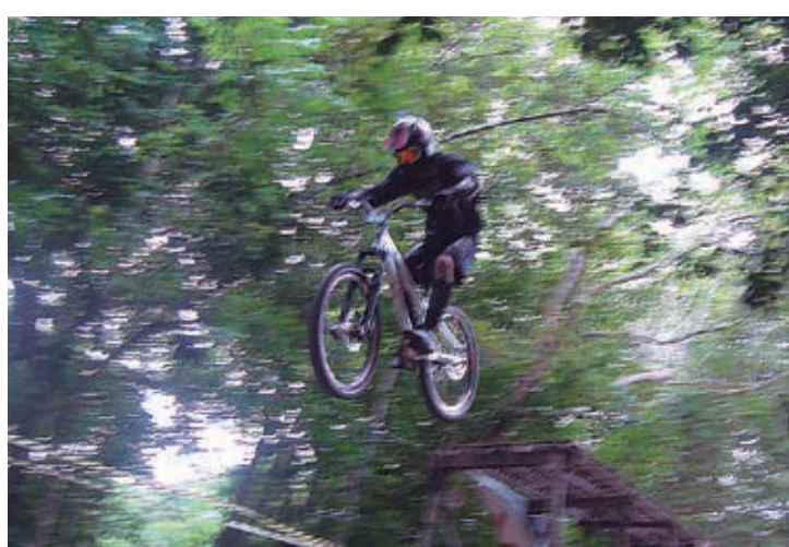
O downhill é uma modalidade de mountain bike com obstáculos