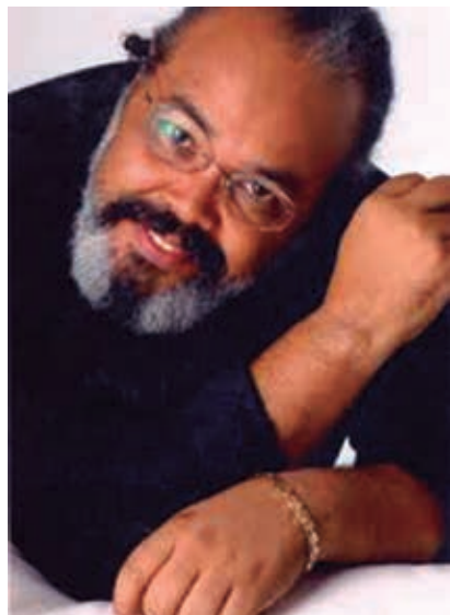
Alcione e Jorge Aragão em uma noite de samba hoje na Domus Hall PÁGINA 5