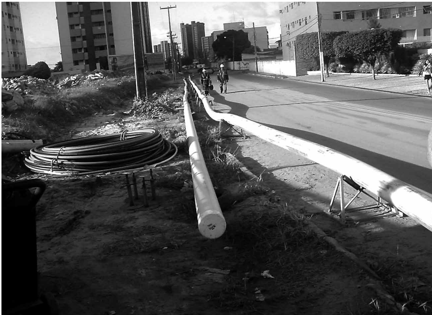
A PBGás está investindo na expansão e instalação de novas redes em João Pessoa e em Campina Grande

“Foram alguns dos fatores que levaram a PBGás a atingir um recorde histórico de comercialização nesse segmento”, disse ele, lembrando que o setor industrial continua sendo o principal mercado consumidor no Estado da Paraíba, respondendo por 75,2 % das vendas da companhia.