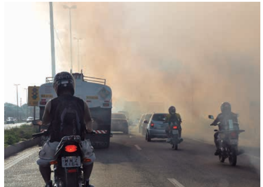
Foco de incêndio às margens da BR-230 prejudica a visibilidade dos motoristas

O Corpo de Bombeiros registrou somente na Região Metropolitana de João Pessoa quase 200 focos de incêndio. O fogo às margens das rodovias representa perigo de acidentes para os motoristas. PÁGINA 13