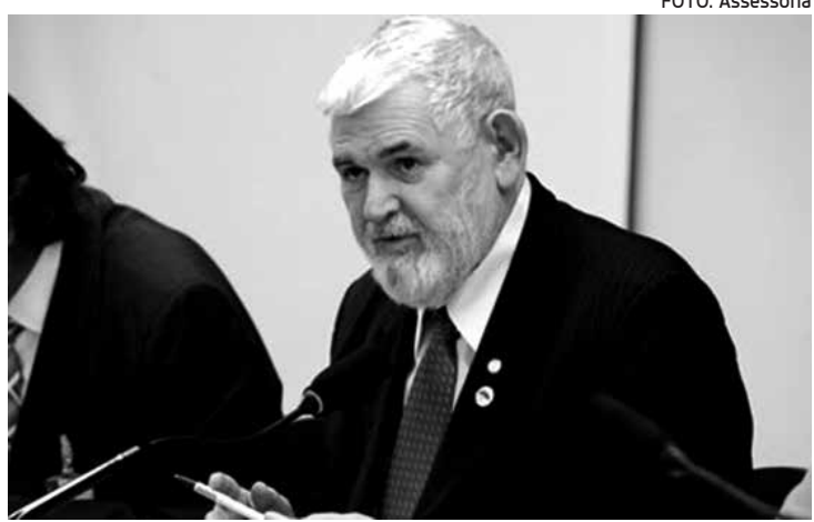
Por solicitação de Luiz Couto, capital terá R$ 600 mil e UEPB, R$350 mil

A população pode acionar a Ouvidoria pela internet, acessando o link da Prefeitura, no endereço www.joaopessoa.pb.gov.br, ou através do e-mail ouvidoria@joaopessoa.pb.gov.br; pessoalmente no Paço Municipal, Ouvidoria da Saúde (Eptácio Pessoa) ou Ouvidoria da Educação (Centro Administrativo Municipal); ou por meio de carta para o endereço - Ouvidoria Municipal de João Pessoa - Paço Municipal, Praça Pedro Américo, 70, Centro, CEP: 58010-970 - João Pessoa - PB. O telefone para contato é 3218-6167.