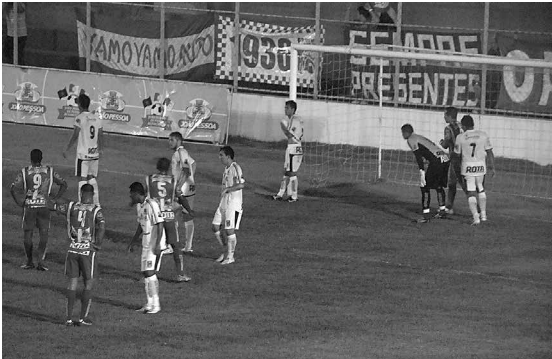
Escanteio para o Auto Esporte e muita preocupação da zaga do CSP que foi vencida em três vezes