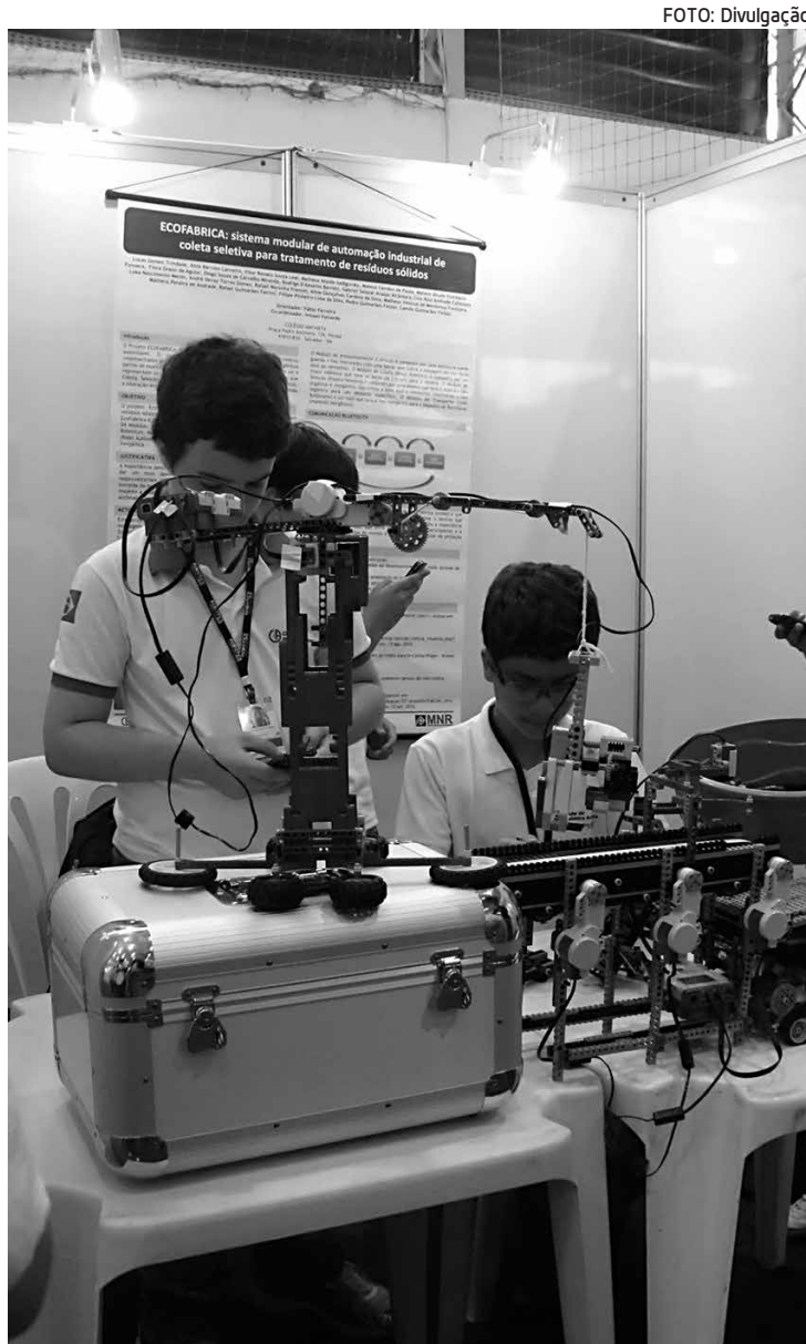
Laboratórios consumiram R$ 22,5 milhões do Tesouro do Estado