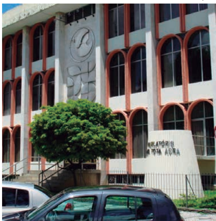
Assembleia terá até a próxima segunda-feira para definir nomes