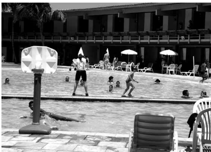
Ocupação hoteleira em JP chegou a 96,3% durante o Carnaval

De acordo com os dados, 46% dos turistas que visitaram o Estado são provenientes