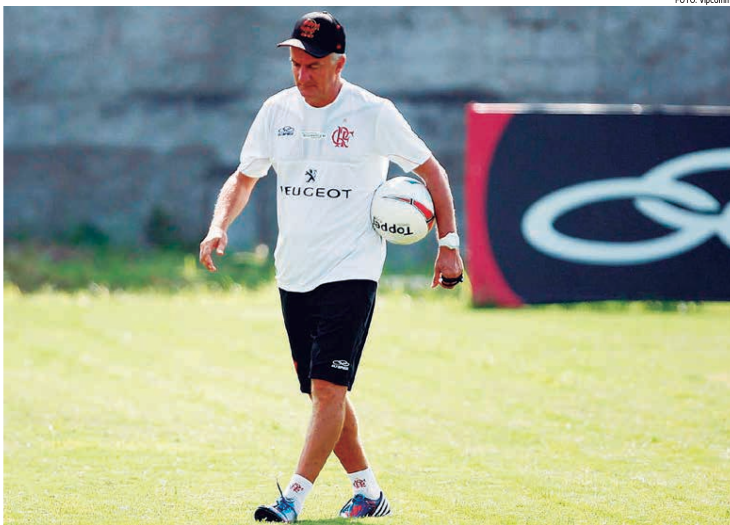
Pressão sob Dorival Júnior aumentou com os dois últimos resultados negativos da equipe, que perdeu para Botafogo e Resende

“Vamos continuar trabalhando de uma forma tranquila e consciente. Quando estávamos ganhando os jogos seguidos, vocês (jornalistas) não me viram tranquilo e relaxado. Estava atento, ciente de que muita coisa tinha que ser melhorada. E vocês colocavam a evolução do Flamengo, o favoritismo ao longo da competição. Para mim era um fato normal. Nunca aceitei a situação de favorito e não coloquei que estava satisfeito com o rendimento normal