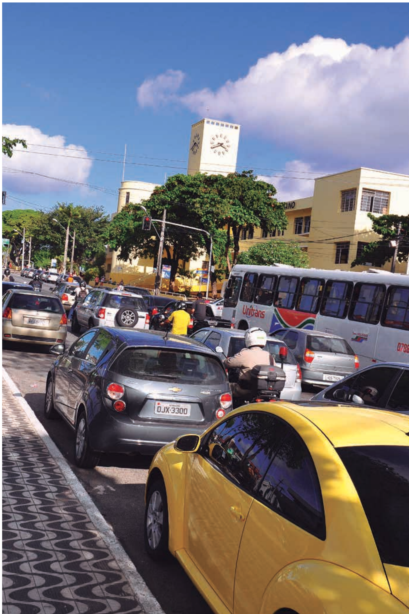
Somente a frota de veículos de João Pessoa, segundo o Detran-PB, passou de 100.427 veículos para 281.830 unidades