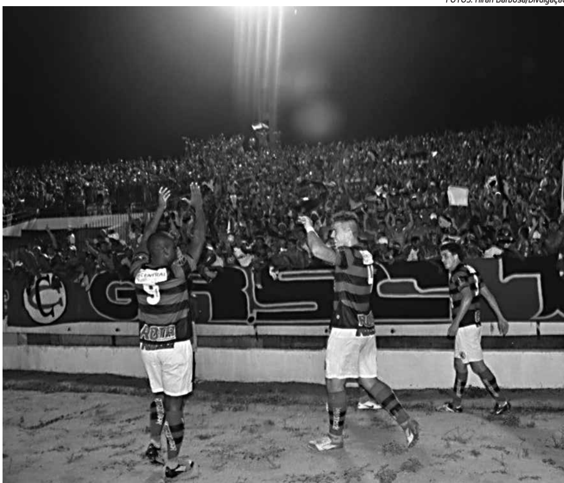
Jogadores comemoram gol junto a torcida do Campinense durante um jogo da Copa do Nordeste