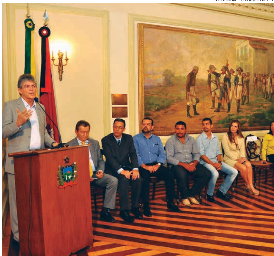
Governador Ricardo Coutinho autorizou criação do conselho durante cerimônia no Palácio da Redenção

O objetivo da Conferência é identificar os problemas enfrentados pelas microrregiões no crescimento urbano, e elaborar propostas para a diminuição da desigualdade social e o desenvolvimento funcional dos municípios, sem degradar a natureza. Esse diagnóstico fundamentará as novas diretrizes do Governo Estadual para o desenvolvimento regional. A Conferência das Cidades acontece com intervalos de dois ou três anos, quando também são eleitos os membros do conselho.