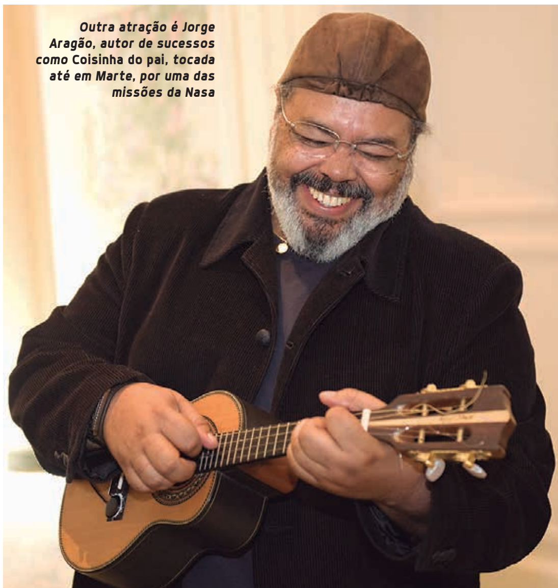
Outra atração é Jorge Aragão, autor de sucessos como Coisinha do pai , tocada até em Marte, por uma das missões da Nasa

Teatral, divertida, romântica e eclética, Alcione conseguiu cativar e conquistar gerações de todas as faixas etárias, classes sociais, do barraco à mansão. A apresen-