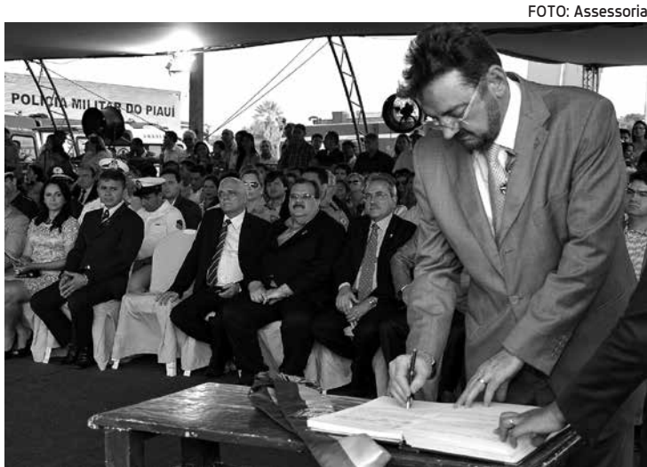
Vice-governador da PB recebeu maior honraria do Estado do Piauí

O Governo do Piauí justificou a homenagem ao