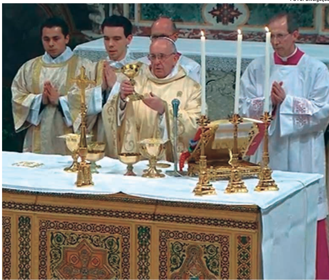
O papa Francisco celebrou ontem a primeira missa do seu pontificado na presença de cardeais

“O papa rezou sozinho, em silêncio. Depois, entoou alguns cânticos. Também pediu para que nós rezássemos por ele e pelo trabalho dele à frente da Igreja Católica”,