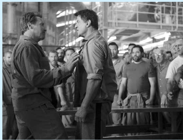
Filme de Costa-Gavras está em cartaz em um cinema da capital