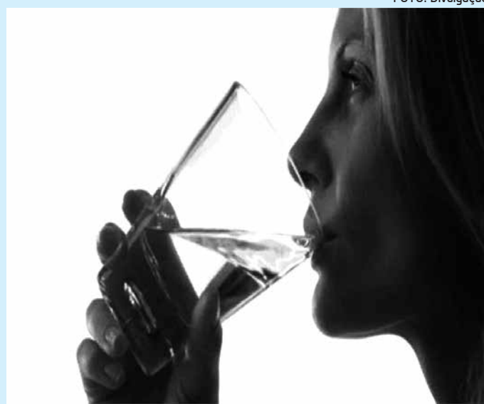
Uso dos enxaguantes não aumenta risco de câncer de boca

Segundo os procuradores, após a divulgação do estudo na mídia, a Câmara Técnica de Cosméticos da autarquia revisou e colheu elementos sobre o assunto em outros países, assim como na Organização Mundial de Saúde. Após análise, o órgão emitiu uma nota afirmando que “a literatura científica pesquisada até o momento não fornece dados suficientes para estabelecer a relação entre o uso de enxaguante bucal contendo etanol e a ocorrência do câncer de boca”.