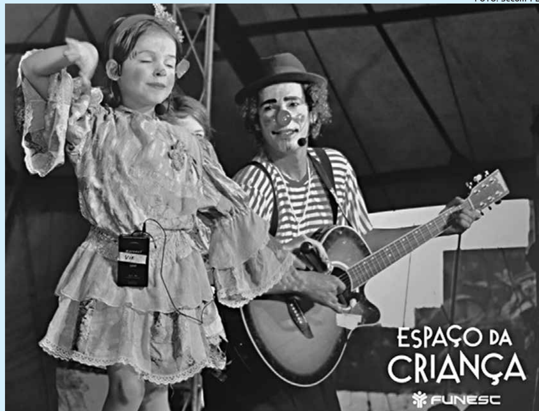
Os artistas do grupo Los Iranzi apresentam o espetáculo Caminhão de Palhaço, em Mangabeira