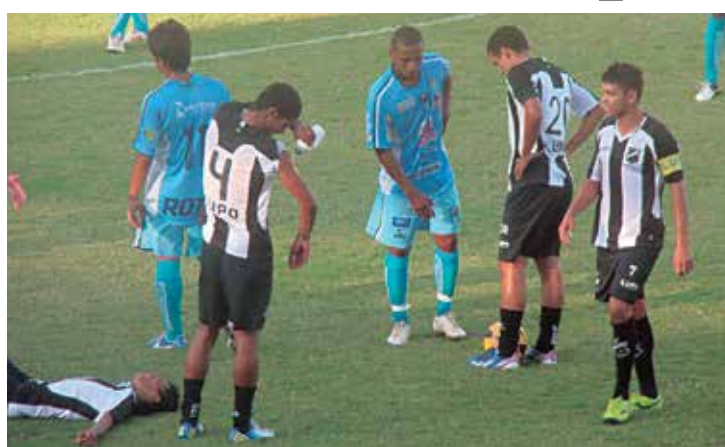
O CSP disputou a Copa Ecohouse com o time que vai à São Paulo

Dentro das quatro linhas a pré-temporada está a todo pique, com treinos durante a semana no Estádio Evandro Lélis, em Mangabeira. O Clube do Povo deve levar cerca de 20 atletas, na maioria com jogadores que conquistaram o bicampeonato paraibano