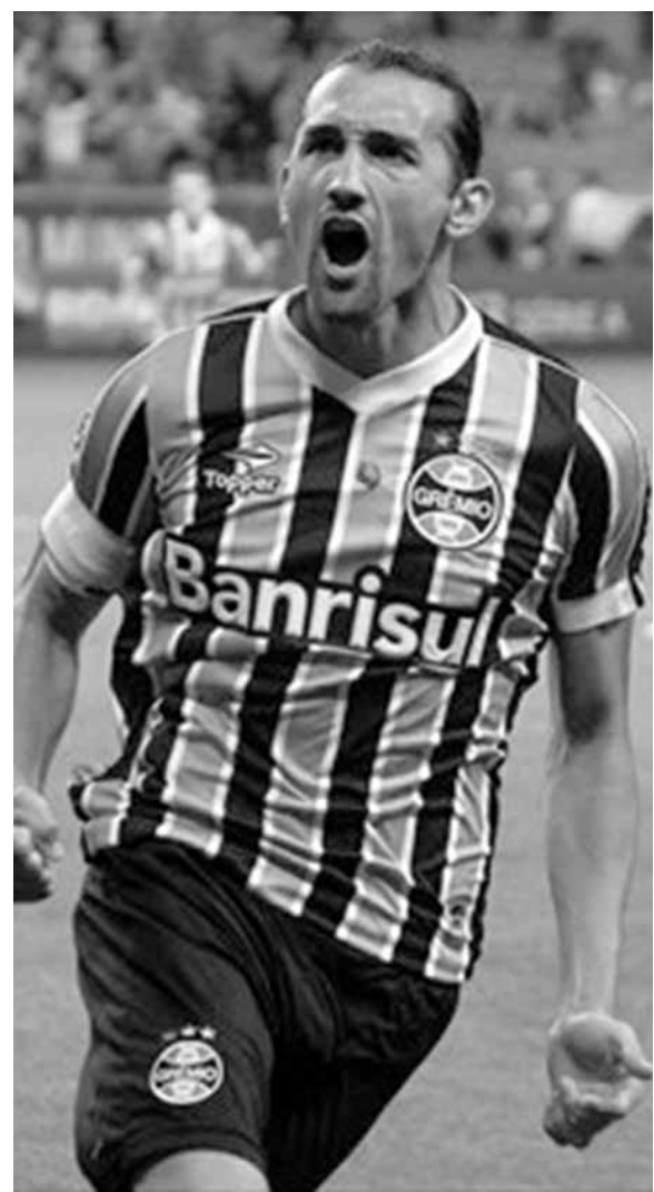
Atacante fez o gol da vitória contra o Corinthians