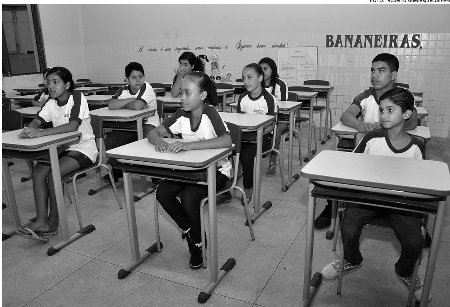
O Governo do Estado entregou a Escola Estadual de Ensino Fundamental Xavier Júnior, onde foram investidos R$ 321.608,63