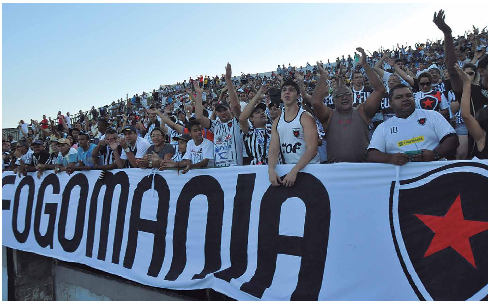
Em lua de mel com o seu torcedor, o Botafogo tem conquistado novos sócios e o plano da atual diretoria é chegar a 5 mil até o final da atual gestão

O time feminino deu adeus, na última quarta-feira, ao Campeonato Brasileiro da Série A, ao perder de 2 a 0 para o Caucaia do Ceará, em partida disputada no Estádio Presidente Vargas, em Fortaleza. Com o resultado, as belas do Belo terminaram na quarta posição do grupo, o que garantiu a participação do clube na Série A de 2014. O clube rebaixado acabou sendo o Mixto de Mato Grosso. O Botafogo saiu da competição com apenas uma vitória, exatamente sobre o Mixto. Nas demais partidas, perdeu para o Vitória-PE, São Francisco-BA e Caucaia-CE.