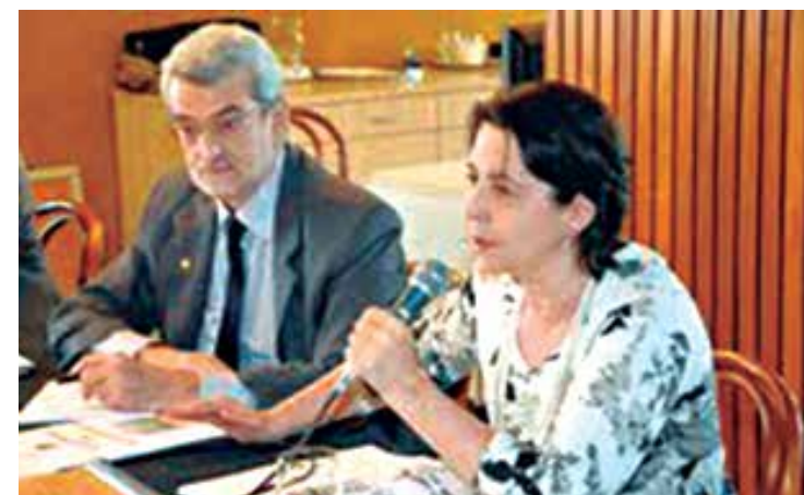
Ministra Tereza Campello (D) mostra pesquisa feita no Norte e no NE

O Programa Bolsa Família foi criado em 2003, durante o primeiro mandato do presidente Luiz Inácio Lula da Silva. Esse programa tem o objetivo de minorar, de imediato, a pobreza por meio de transferência de renda. Em troca, as famílias beneficiadas se comprometem, por exemplo, a manter os filhos na escola e a manter atualizada a caderneta de vacinação de crianças menores de sete anos.