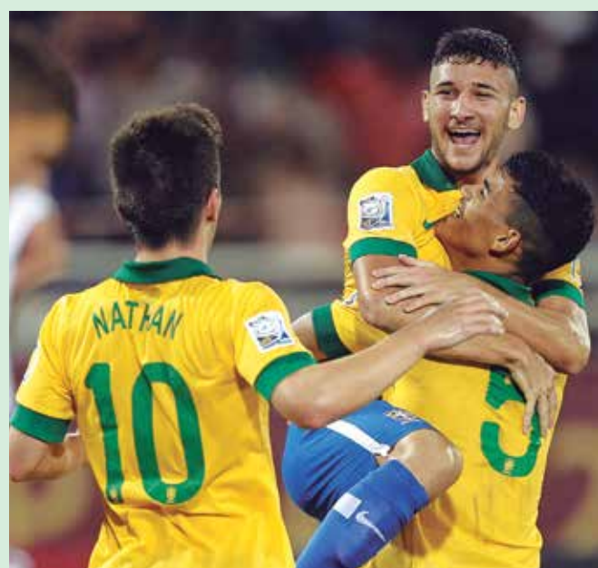
Em três jogos, os meninos do Brasil já marcaram 15 gols

Nas oitavas de final, o Brasil enfrentará um dos terceiros colocados dos Grupos C, D e E. Mesmo com a derrota, Honduras acabou classificada.