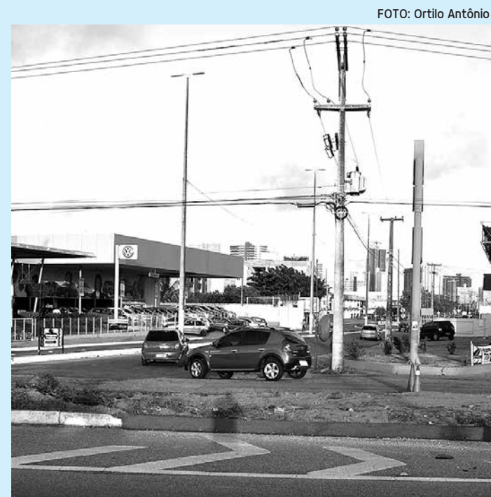
As alterações na rodovia vão melhorar a trafegabilidade