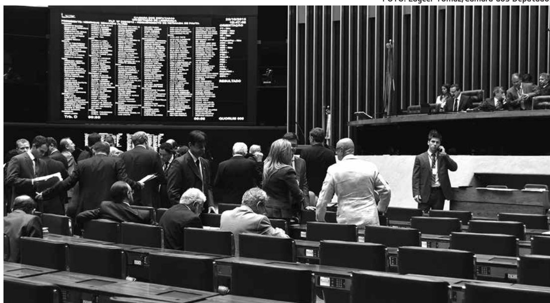
Os deputados chegaram a um acordo e aprovaram o texto principal do projeto de lei complementar

da que a renegociação vai atingir um total superior a R$ 400 bilhões, considerando as dívidas dos estados e municípios, e vai beneficiar principalmente as cidades de São Paulo, do Rio de Janeiro e de Salvador. Entre