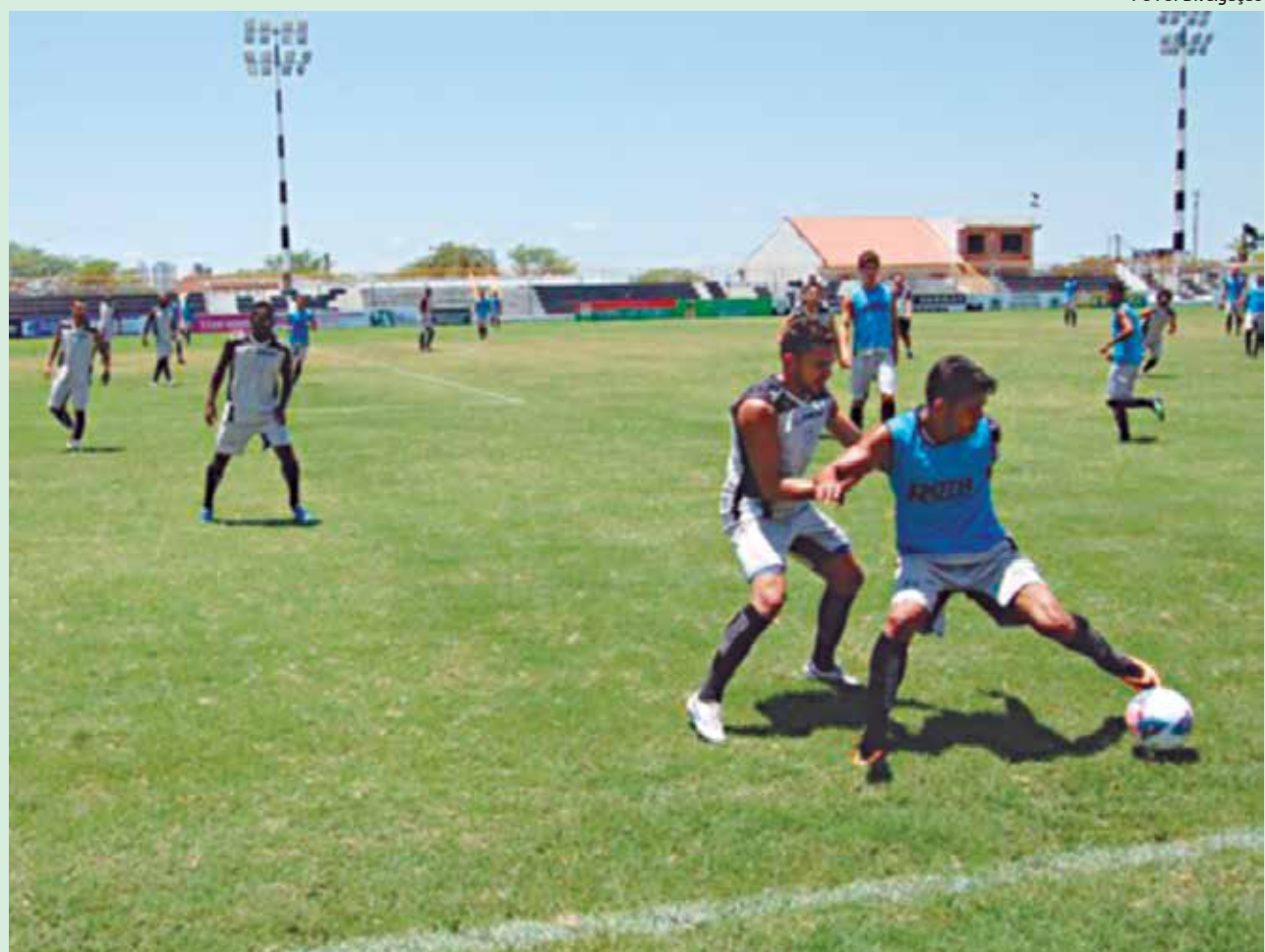
Jogadores do Treze voltam a treinar hoje, o último antes da viagem para o jogo mais importante do Galo na Série C

que está pronto para ajudar, se o clube necessitar. "Eu gosto de atuar em decisões. Já estou recuperado. Precisamos de um ataque veloz para superar a defesa do Treze, que é um time muito organizado. Acredito que será um bom jogo e bastante equilibrado", disse o atacante.