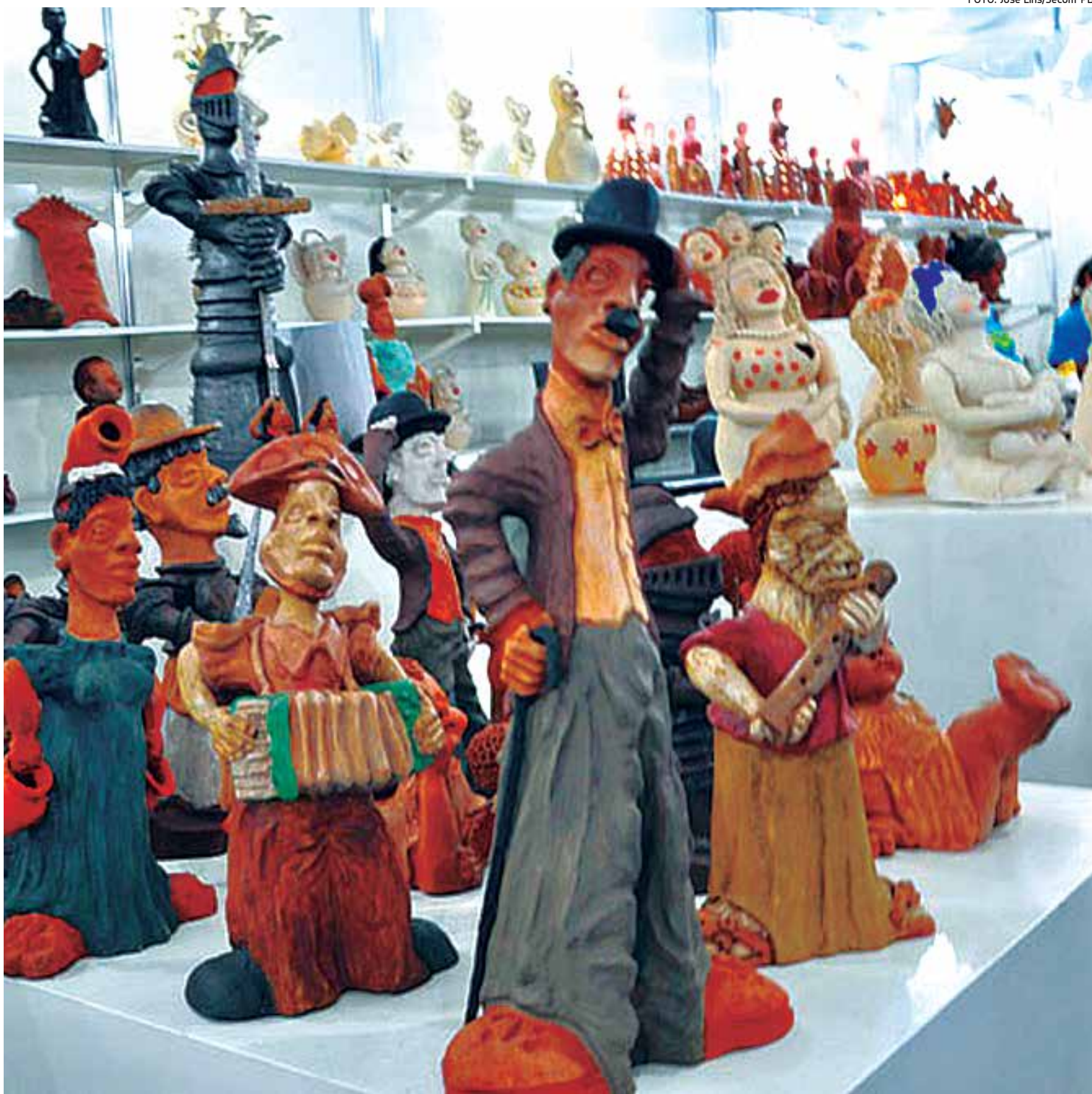
Produtos de artesãos paraibanos estarão expostos no ExpoBrasília, que ocorrerá entre os dias seis a 11 de novembro e deve gerar negócios em cerca de R$ 6 milhões

O evento vai ocorrer das 11h às 22h (de quarta a domingo), com entrada franca até as 16h. Os ingressos custam R$ 6,00 (meia) e R$ 12 (inteira).