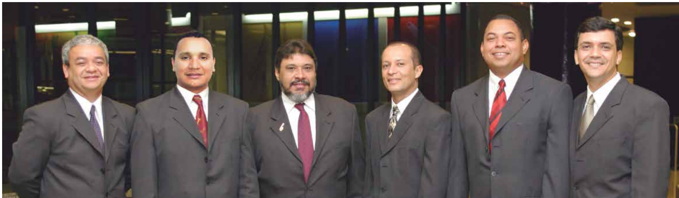
O Sexteto Brassil, que tem participado de festivais em vários estados brasileiros e tem trabalho reconhecido no exterior, será a principal atração da noite