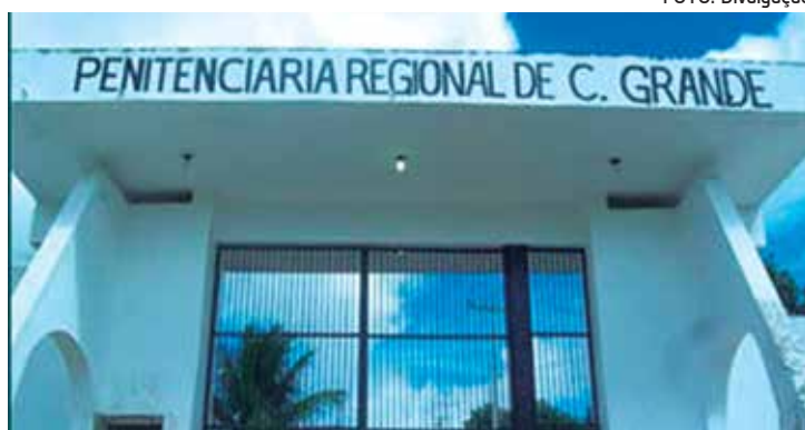
Entrada principal da Penitenciária Raimundo Asfora - o Serrotão

“Todos os dias, são realizadas buscas em presídios ou cadeias do Estado. Vamos continuar oferecendo as oportunidades de ressocialização, mas não deixaremos de combater aqueles que querem apenas promover a desordem”, afirmou o secretário.