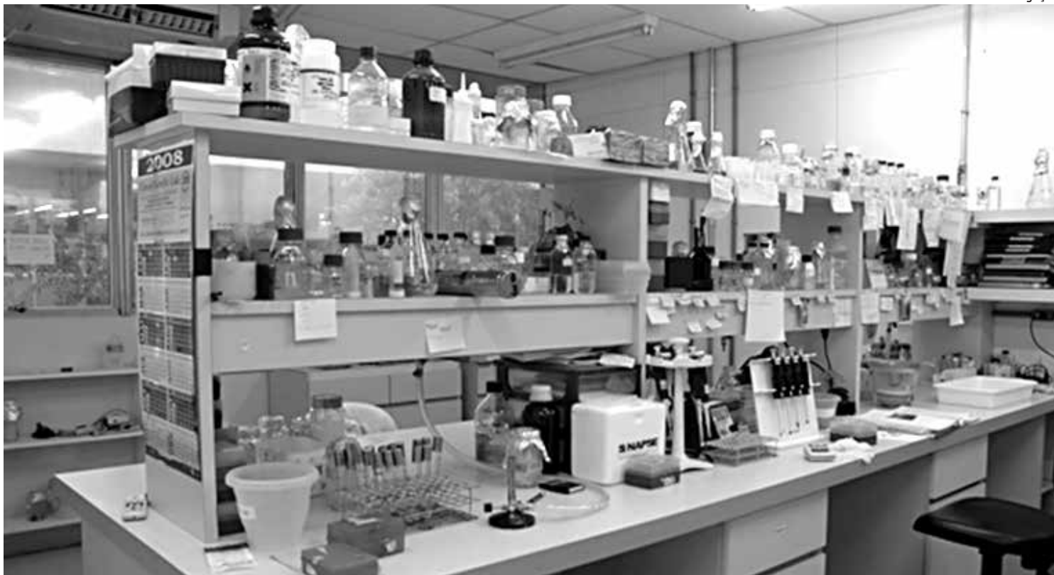
Laboratório fornece recursos para que a polícia desvende crimes que não tem suspeitos; comparativo genético esclarece delitos sexuais

Organismo é uma importante peça na investigação de diversos crimes