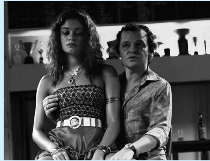
Sophie Charlotte e Matheus Nachtergaele contracenam em filme