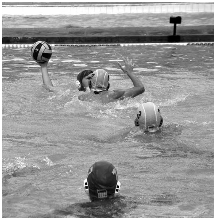
A competição de polo aquático será disputada até domingo

Para esta competição, a Seleção Paraibana de Polo Aquático treinou firme visando uma boa colocação. Os treinos ocorrerão na Vila Olímpica Ronaldo Marinho e no Esporte Clube Cabo Branco. (ML)