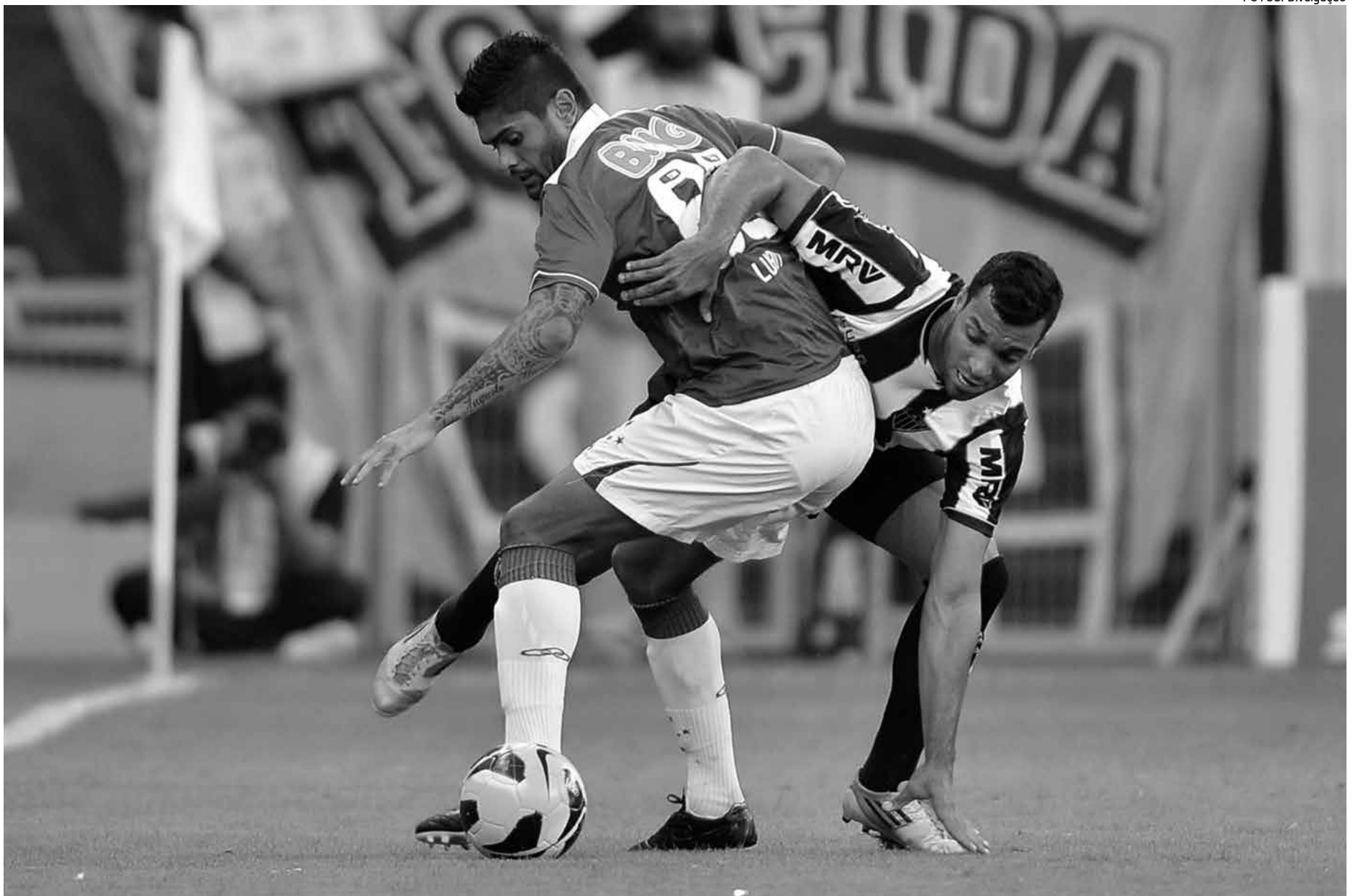
O clássico mineiro pode ocorrer na Libertadores de 2014 pela primeira vez. O Atlético é o atual campeão da disputa e tem vaga garantida, enquanto o rival está perto

Durante esses nove anos, o goleiro conseguiu uma marca de expressão: 500 jogos com a camisa do Cruzeiro, sendo um dos atletas que mais vestiu as cores durante toda a história do clube. Agora ele quer levantar a taça nacional para cravar seu nome nas páginas do time.