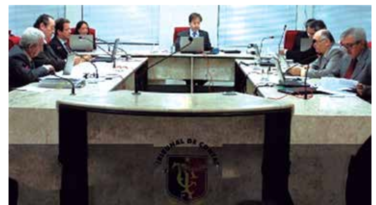
TC apreciou prestação de contas logo no começo da sessão