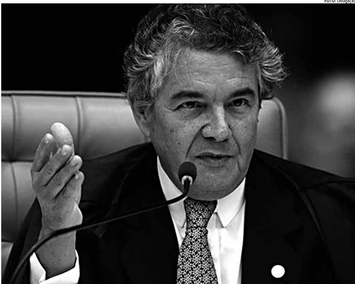
O ministro Marco Aurélio Mello não atendeu pedido do Sindilegis para suspender de maneira provisória a decisão do TCU

No Senado, o presidente Renan Calheiros (PMDB-AL) também decidiu, após alguns recuos, cortar o salário dos servidores da instituição que ganham acima do teto salarial do funcionalismo público e determinou que eles terão que devolver aos cofres públicos o dinheiro recebido irregularmente.