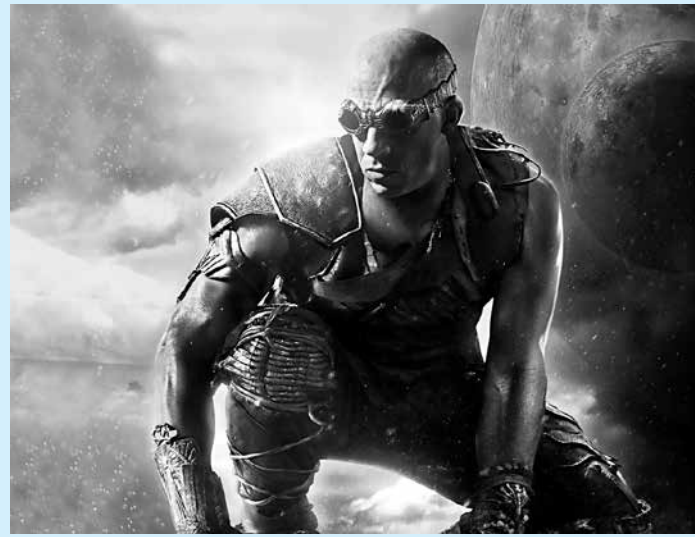
Vin Diesel em uma cena de Riddick 3, do diretor David Twohy