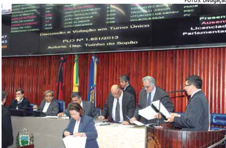
Em sessão movimentada, os parlamentares quase zeram a pauta

Acordo permitiu a votação de 4 projetos e de quase todos os requerimentos