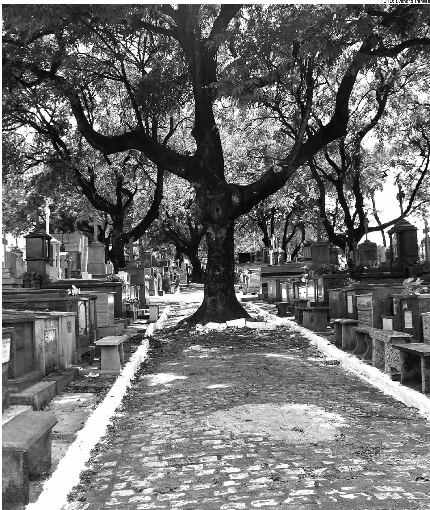
Para garantir tranquilidade aos visitantes, os cemitérios receberam iluminação especial e foi montado um plano de segurança

Com a proximidade da data (Finados), aumenta a procura por velas, flores e coroas de flores. Com isso, aumenta também a variação de preços destes produtos, já que o comércio é livre para praticar seus preços.