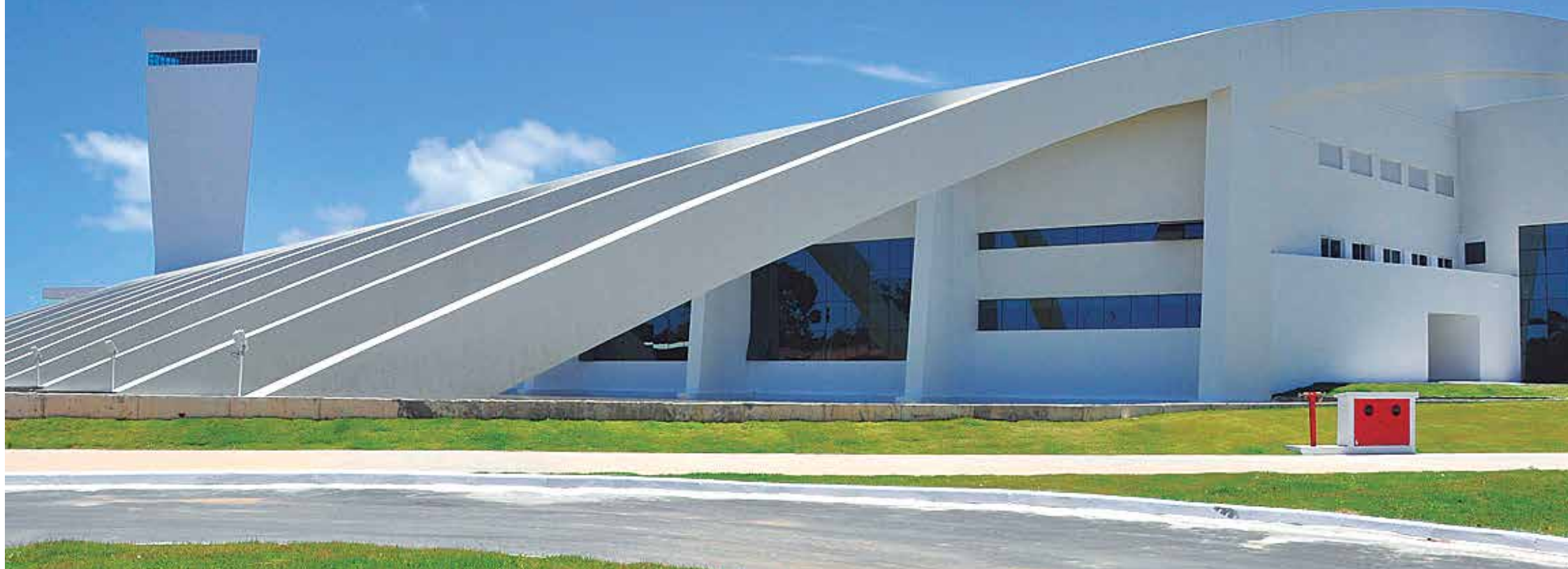
O Centro de Convenções "Poeta Ronaldo Cunha Lima" está localizado no Polo Turístico Cabo Branco, às margens da rodovia PB-008, e oferece toda a estrutura necessária para grandes eventos na Paraíba