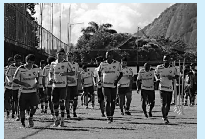
Jogadores do Botafogo treinando para enfrentar o Goiás

Com a vitória sobre o Atlético-MG, no último sábado, o Botafogo chegou a 53 pontos e reassumiu a vice-liderança do Campeonato Brasileiro. Na próxima rodada, o Alvinegro encara o Goiás, neste domingo, às 17h, no Serra Dourada.