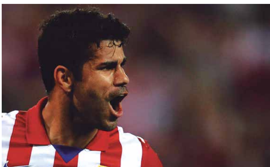
Artilheiro do Campeonato Espanhol ficou chateado por não ter sido convocado antes por Felipão

"Não tem um fim. É entregar-se à própria sorte ir a um estádio atualmente e não se expor à violência. Totalmente fora de controle. Cenário jurídico desportivo, seja normativo, seja pelo apego que está positivamente em detrimento da realidade que requer outras posturas, CBF e STJD não conseguem dar respostas à altura dos acontecimentos.