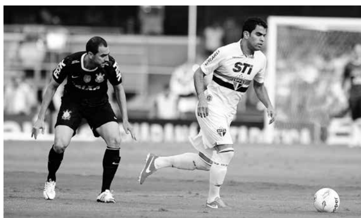
Corinthians e São Paulo é um dos jogos mais importantes

"Houve necessidade de fazer as modificações. Houve por conta do calendário de 2014, da Copa do Mundo, de uma conversa que a gente vem mantendo com o patrocinador, que é a Rede Globo de televisão. Isso já seria feito em 2015 com certeza absoluta. As competições seriam iniciadas