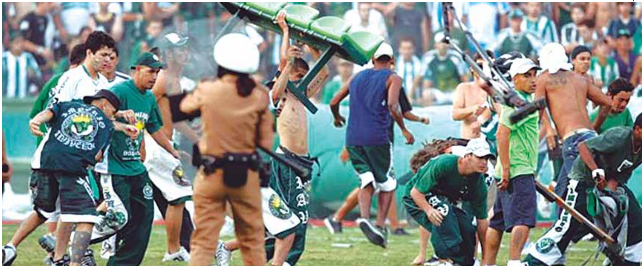
Briga entre torcidas tem sido comuns nos estádios do Brasil, o que vem acarretando em medo incrível daqueles que querem assistir um bom futebol, no entanto, muitos dos clubes já foram penalizados