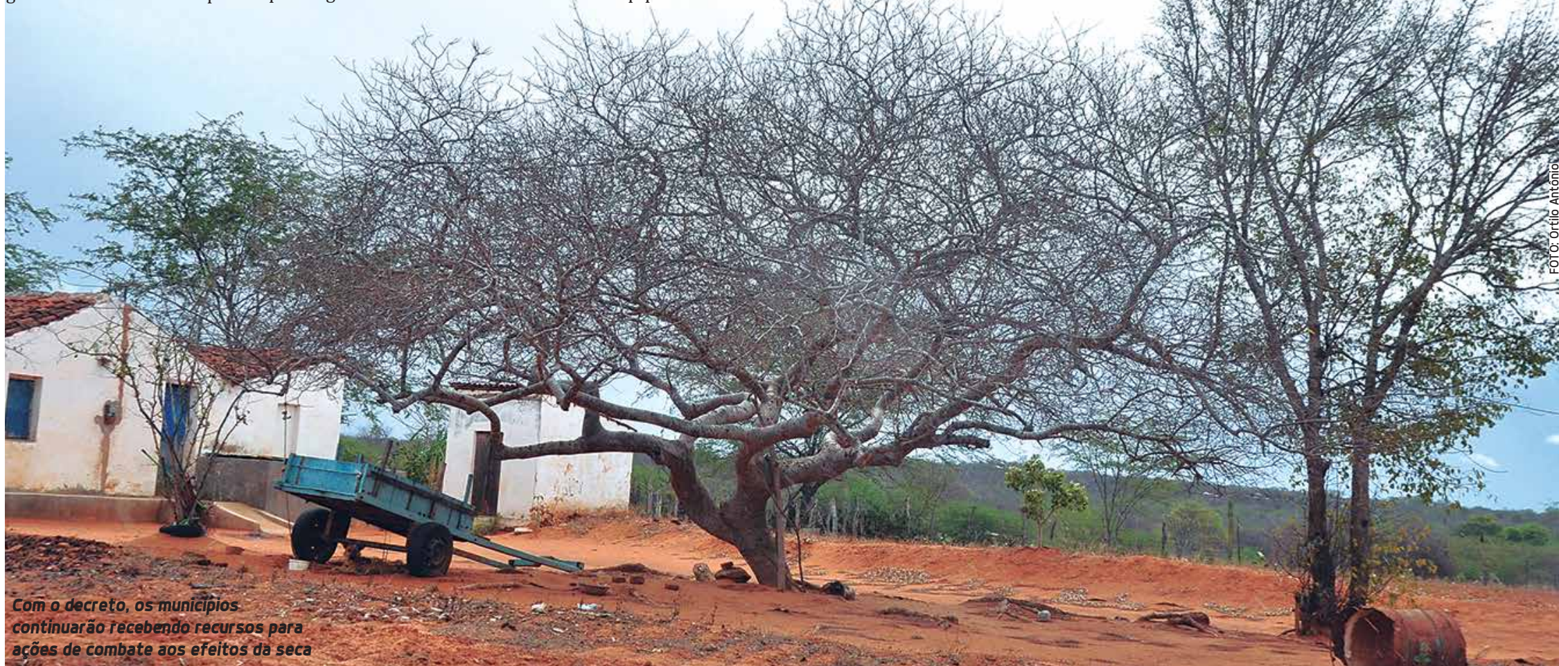
Com o decreto, os municípios continuarão recebendo recursos para ações de combate aos efeitos da seca

contratos de aquisição de bens e serviços necessários às atividades de resposta ao desastre, locação de máquinas e equipamentos e também de prestação de serviços e obras relacionadas com os problemas causados pela estiagem.