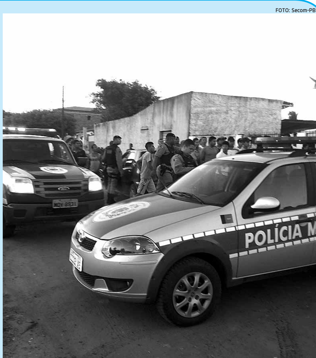
PM prendeu 2 homens e apreendeu 3 adolescentes suspeitos de roubo a um correspondente bancário

Quando chegaram próximo ao local, os policiais foram recebidos a bala por três homens que conseguiram se esconder em uma mata próxima