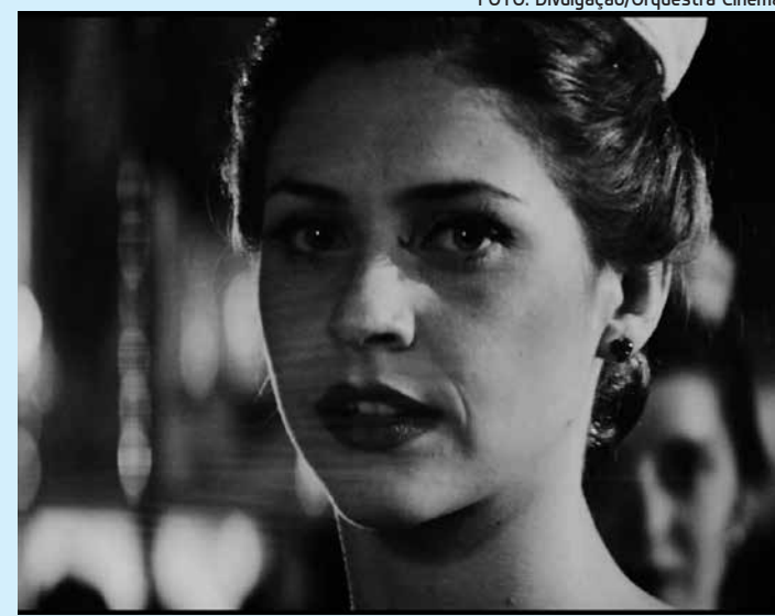
Em Recife, drama retrata o encontro de um trabalhador e uma artista