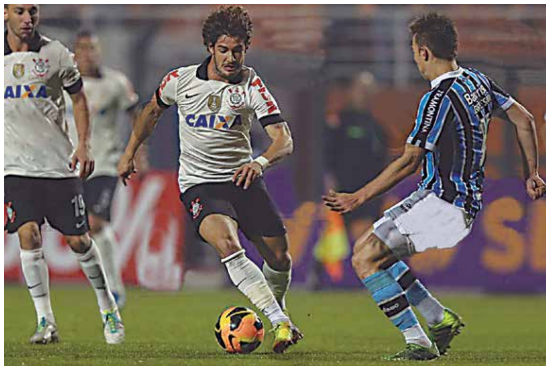
Corinthians e Grêmio voltam a se enfrentar, agora pelas quartas de final da Copa Brasil no Pacaembu