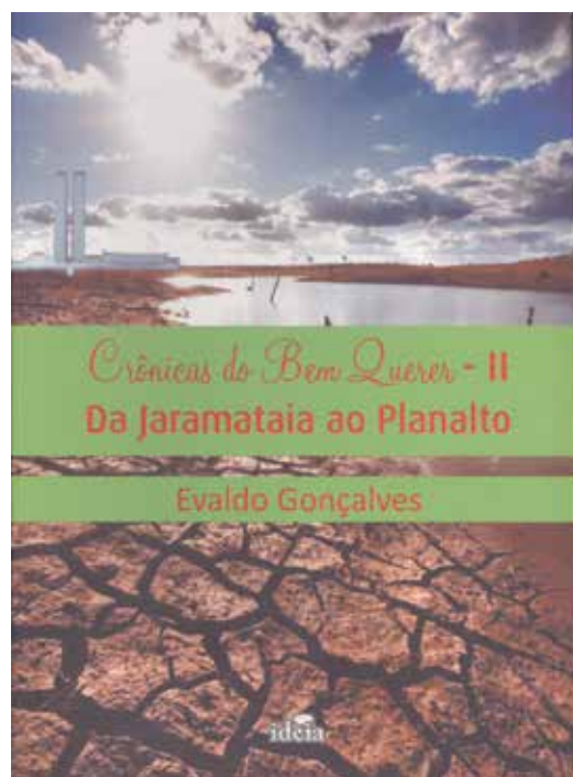
A nova obra não é vendida em livrarias

"No primeiro livro, procurei reunir, em capítulos autônomos, as crônicas so-