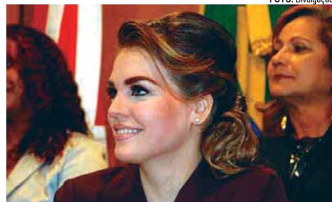
Primeira-dama do Estado, jornalista Pâmela Bório