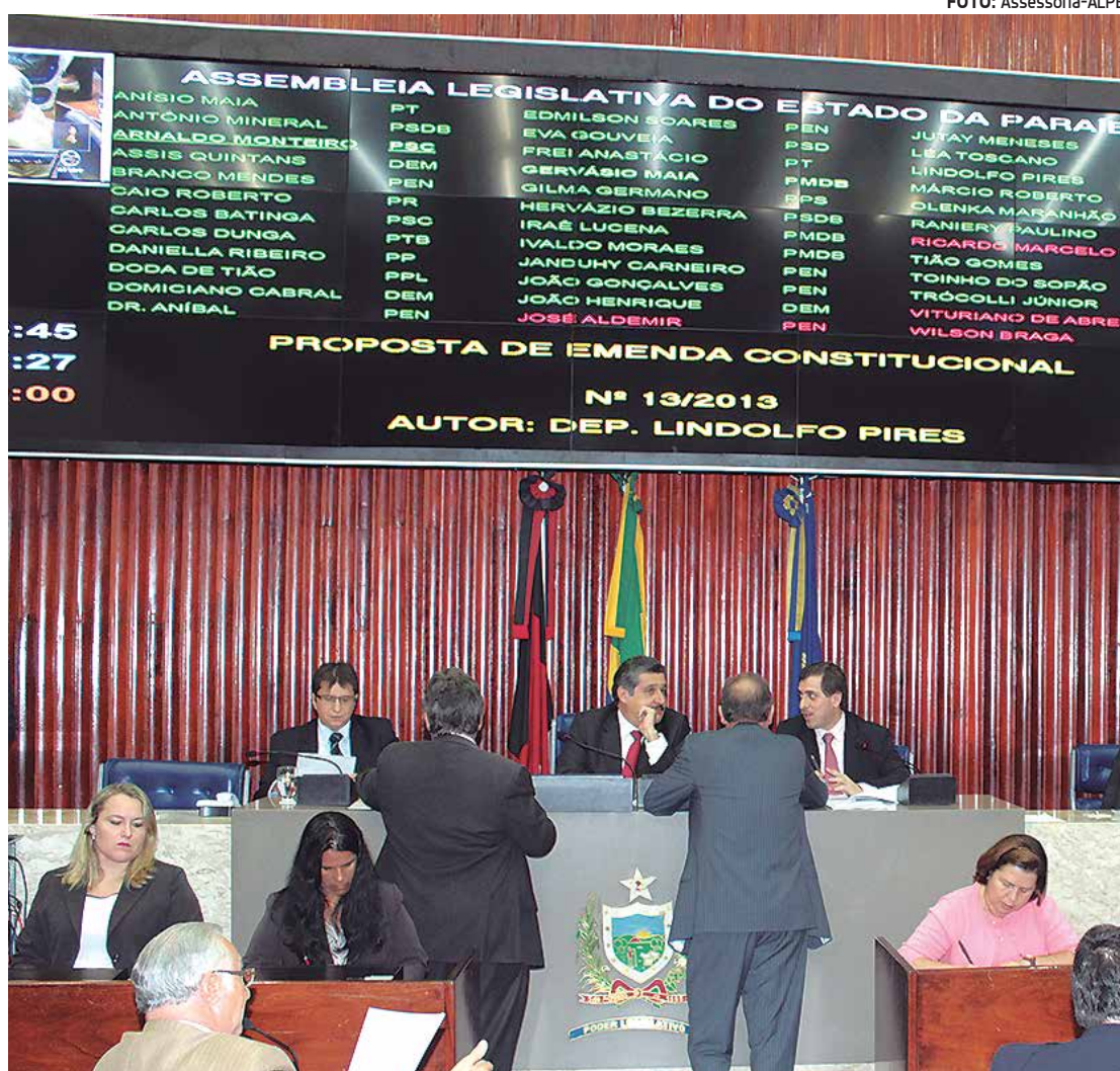
Deputados aprovam PEC que institui participação paritária na defesa e controle do meio ambiente