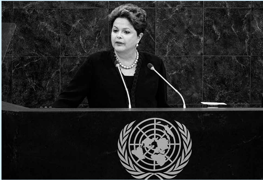
A presidente Dilma abriu ontem a 68ª Assembleia Geral da ONU, em Nova York

Dilma disse que as revelações das atividades de espionagem provocaram indignação e repúdio na