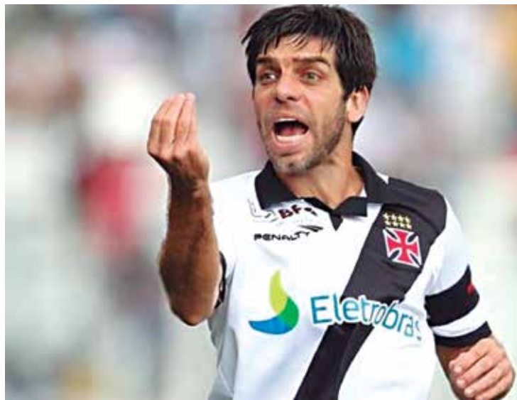
Juninho Pernambucano está fora do jogo contra o Goiás hoje