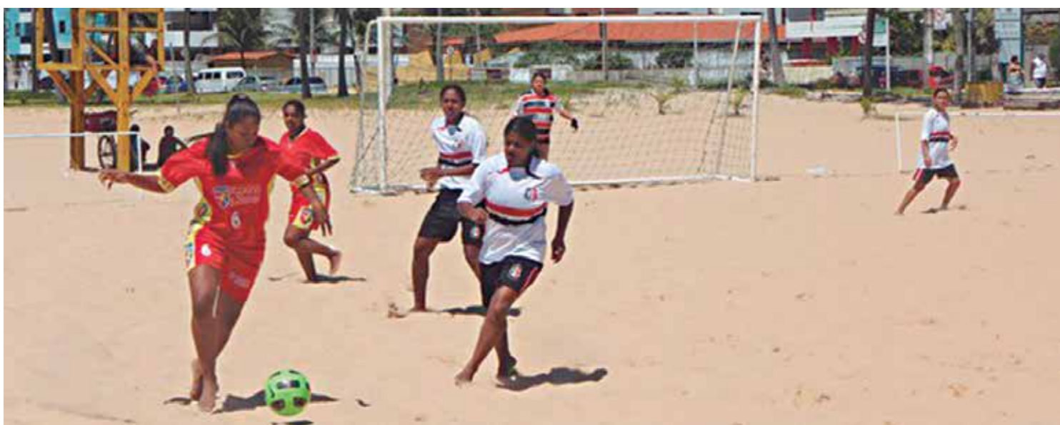
As disputas da competição de beach soccer estão acontecendo sempre aos domingos na arena montada na Praia de Cabo Branco