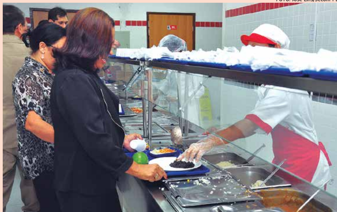
Atualmente são servidas por dia cerca de 600 refeições no restaurante, que funciona em Jaguaribe

No almoço é oferecido salada, duas opções de carne, suco, dois tipos de arroz e o feijão. A partir de outubro, duas vezes por semana será servido macarrão, uma solicitação dos servidores. O restaurante mantém um formulário e uma urna para que o servidor possa opinar e sugerir melhorias. As su-