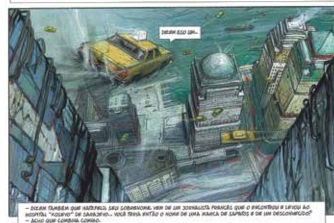
A Tetralogia Monstros, do iugoslavo Enki Bilal, chega ao Brasil seis anos após ser concluída