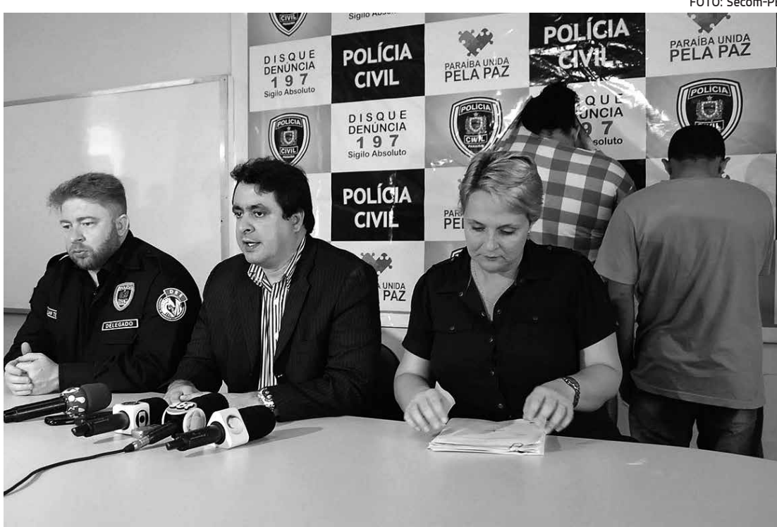
Segundo informações da polícia, o alvo dos atiradores seria dois filhos de um traficante