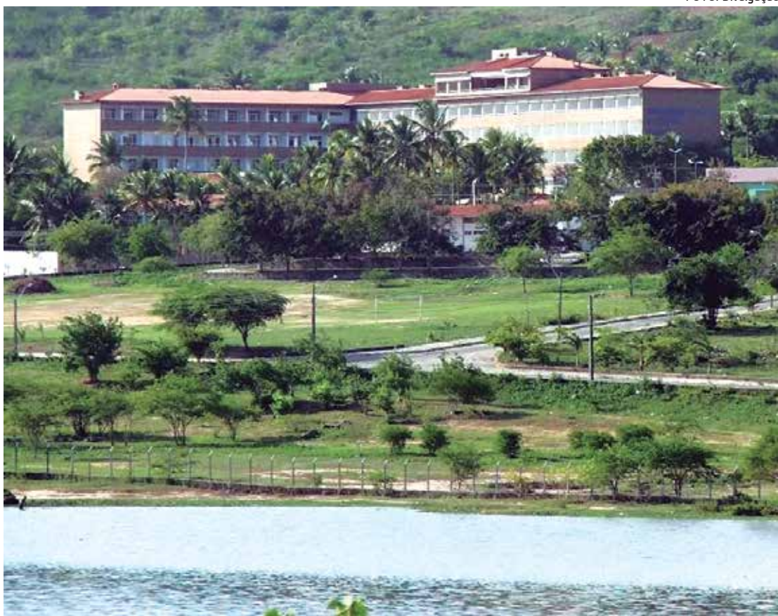
Campus I da Universidade Estadual da Paraíba, Bodocongó, responsável pela coordenação do programa