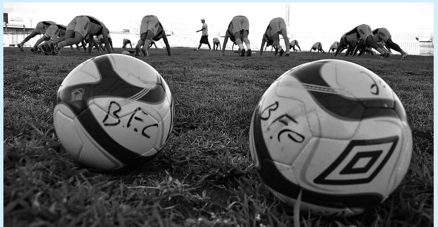
Com um treinamento físico e técnico, os jogadores do Botafogo voltaram às atividades já pensando no jogo contra o Salgueiro