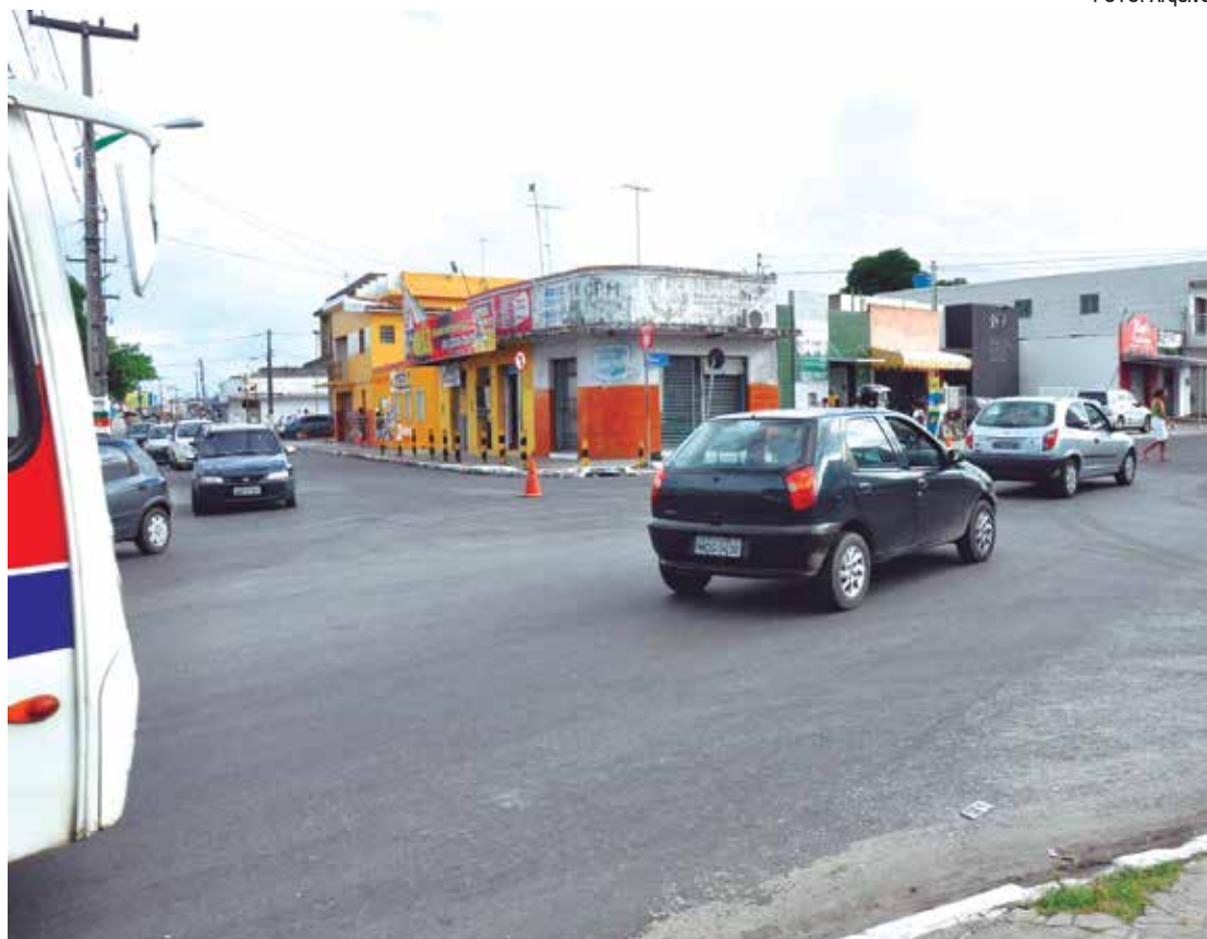
Binário vai desafogar trânsito na Avenida Liberdade, beneficiando a população de Bayeux e Santa Rita

A população de Bayeux e Santa Rita - cerca de 250 mil habitantes - ganhará amanhã mais uma via que visa desafogar o trânsito na Avenida Liberdade, que possui um tráfego médio diário de 18 mil veículos. Às 17h, o governador Ricardo Coutinho vai inaugurar a obra conhecida como Binário de Bayeux, na qual foram investidos R$ 9,5 milhões.