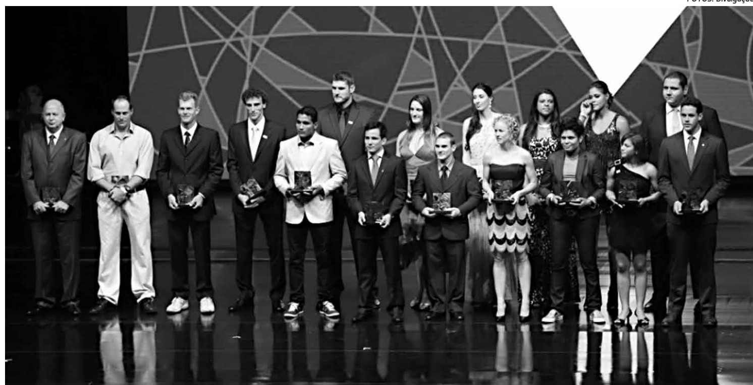
A premiação dos melhores atletas brasileiros nos mais diversos esportes na temporada de 2012 feita pelo Comitê Olímpico Brasileiro

Não tem músculo que aguente. A tendência é ter jogador exausto e pedindo para ser poupado, principalmente os mais velhos. Outro saturado de tantos jogos é o torcedor que tem encontrado dificuldades, principalmente agora com os estádios novos, onde o preço do ingresso subiu substancialmente, não acompanhando o seu salário minguado. Realmente não dá para ir a campo três vezes por semana. É muita despesa. Em resumo, quem está organizando e ganhando muito dinheiro não quer saber se há excesso de jogos e saturação do torcedor. O que vale para eles é o lucro.