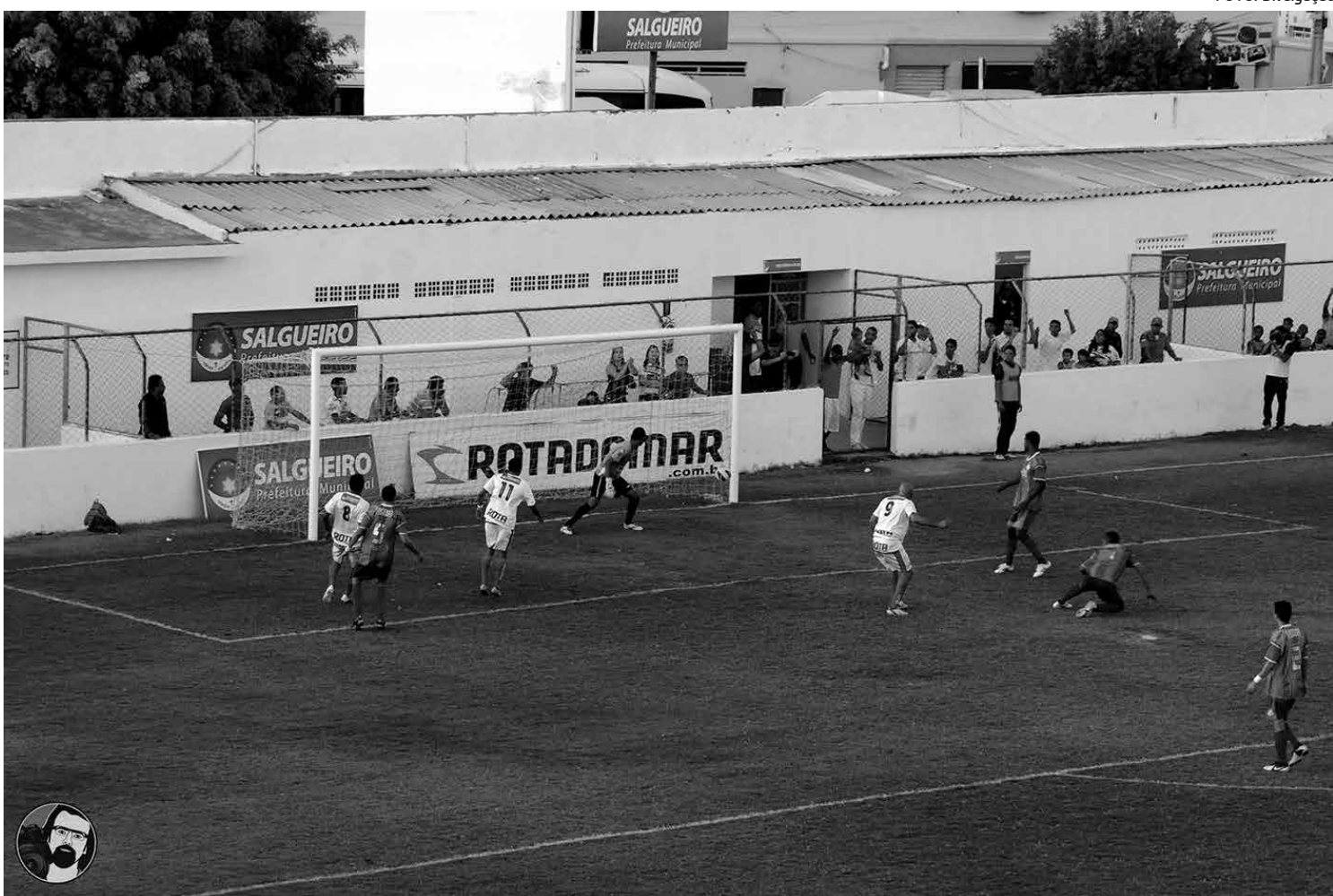
O Estádio Cornélio de Barros, em Salgueiro, foi inaugurado com capacidade para apenas 5 mil pessoas e recentemente ampliado para 10 mil