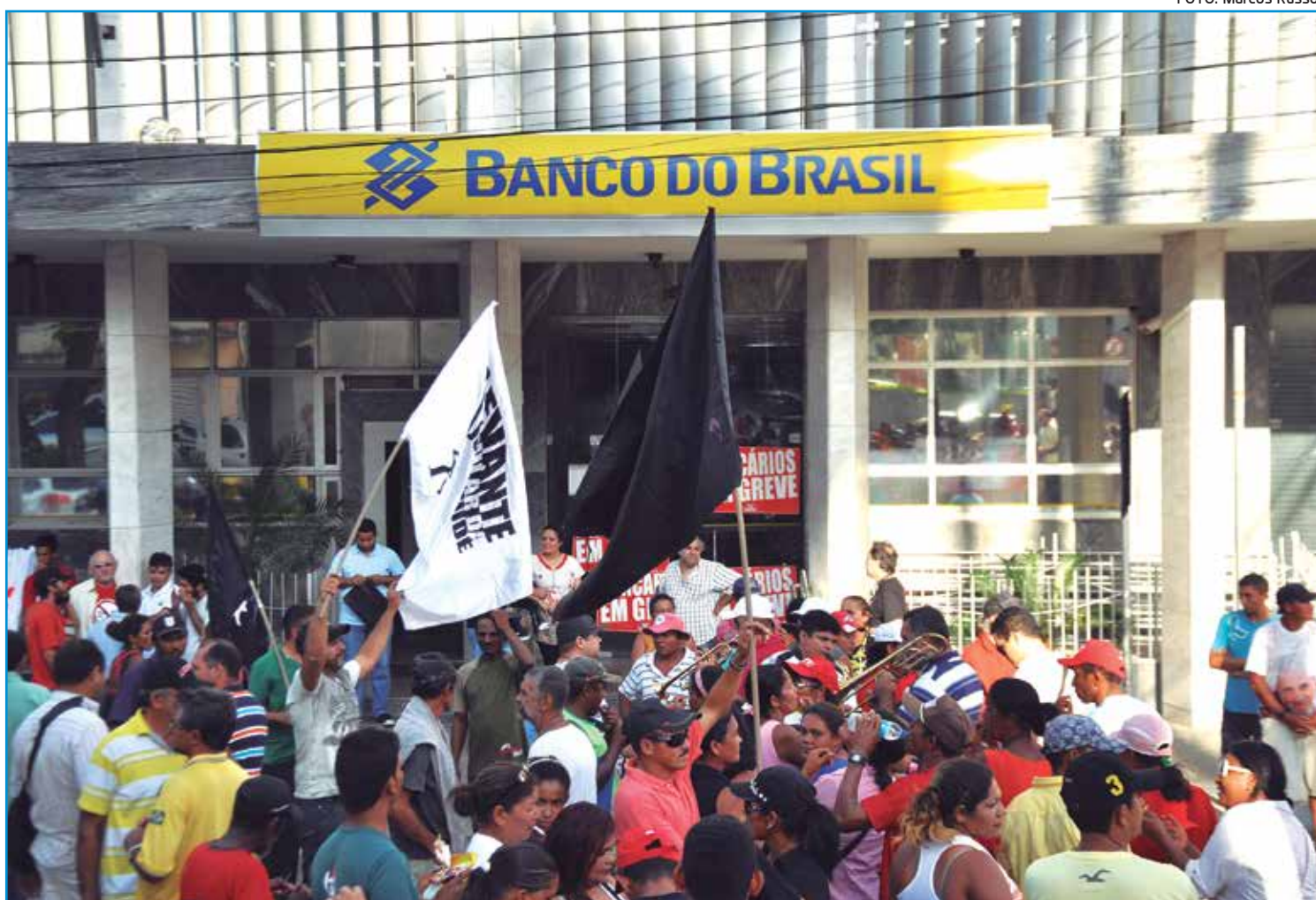
Funcionários de bancos e trabalhadores dos Correios e Telégrafos lutam por reajuste e ampliação dos benefícios trabalhistas

A categoria dos carteiros quer a reposição da inflação,