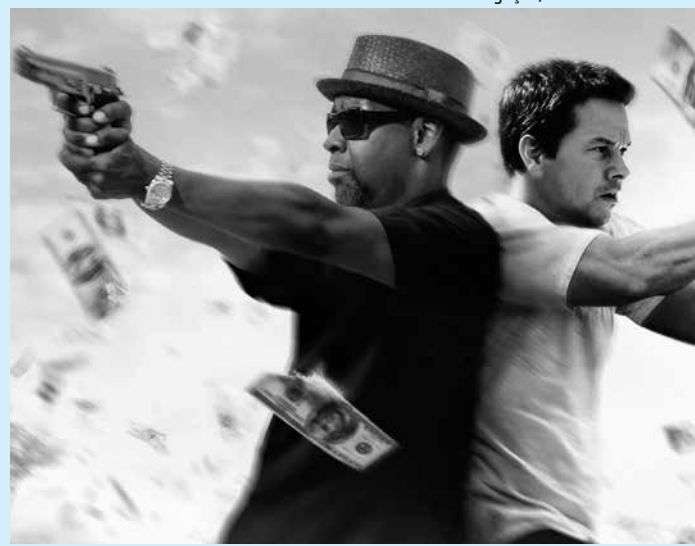
Ação com Denzel Washington e Mark Wahlberg é baseada em HQ