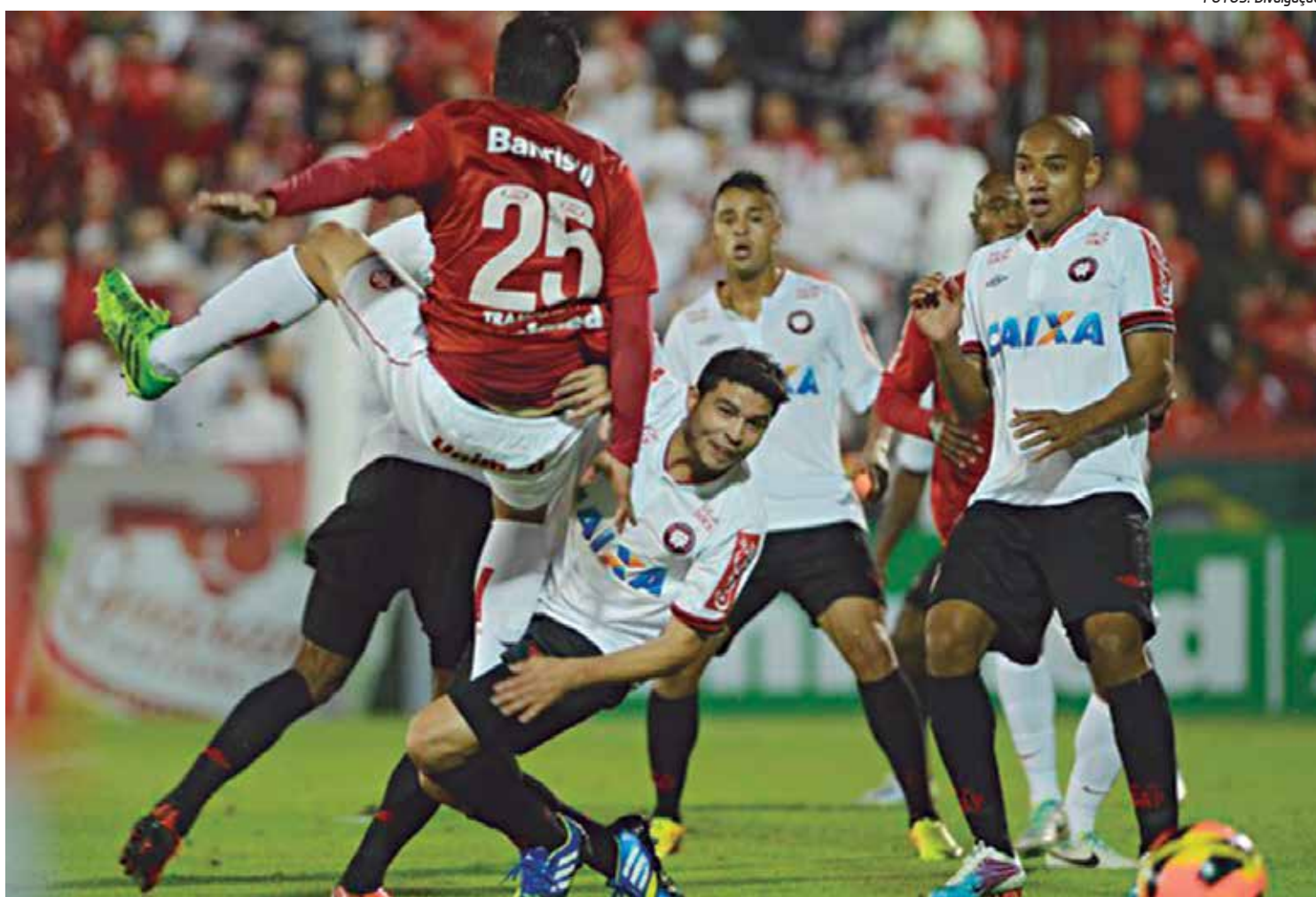
Internacional e Atlético-PR já jogaram este ano pelo Campeonato Brasileiro no primeiro turno e deu empate em 2 a 2

No Brasileiro, as duas equipes vivem momentos distintos. Após derrotar a Ponte e contar com tropeço do Grêmio, o Atlético-PR assumiu a terceira colocação, com 41 pontos. Já o time gaúcho vem de duas derrotas seguidas, estacionou em 34 pontos (5ª posição) e vê seu técnico Dunga cada vez mais pressionado no cargo.