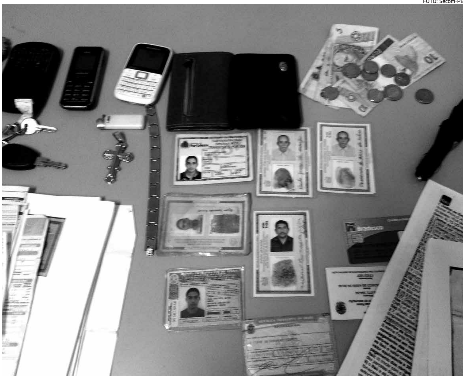
Com o grupo foi apreendido documentos falsos, cópias de contratos de empréstimos e um veículo com placa do Rio Grande do Norte

A prisão dos suspeitos foi efetuada por militares do Batalhão Ambiental, quando planejavam mais um golpe