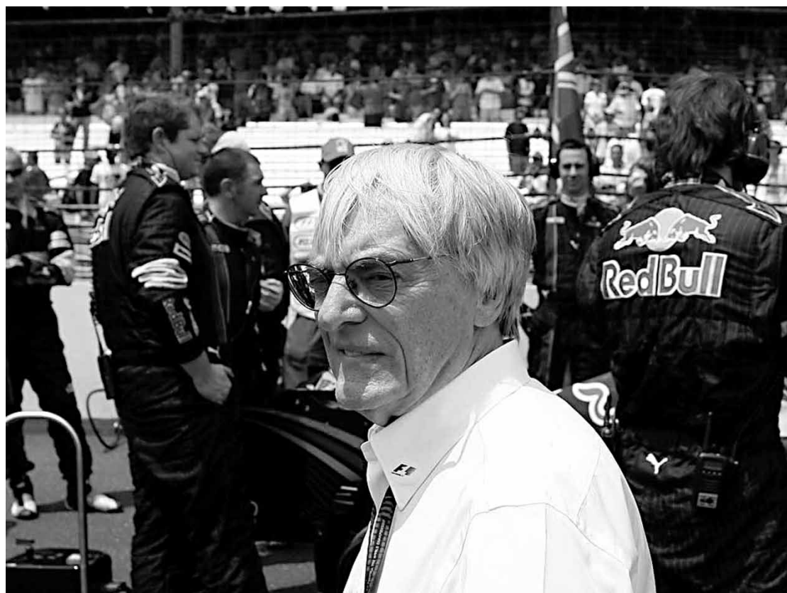
Bernie Ecclestone não acredita em domínio do alemão na próxima temporada com novos motores

A última vez que a categoria sofreu grandes mudanças foi de 2008 para 2009, quando surgiu o fenômeno da Brawn GP (hoje Mercedes), campeã do Mundial de pilotos com Jenson Button e também de construtores, e a ascensão da Red Bull.