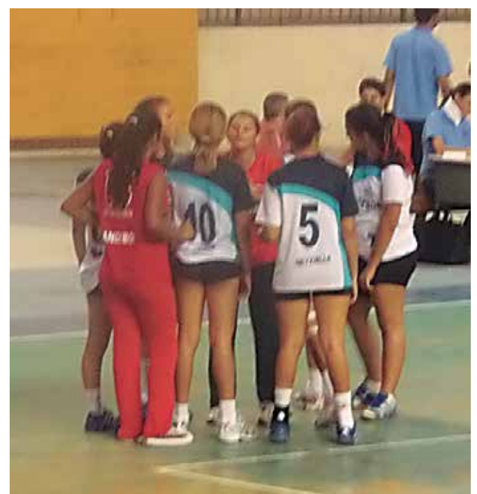
As disputas de handebol estão acontecendo em Patos

A etapa estadual dos Jogos Escolares da Paraíba, modalidades coletivas (Basquete e Handebol), faixa etária 15-17 anos, continua sendo disputada na cidade de Patos, Sertão do Estado. A Sejel-PB prevê que até o próximo sábado, os campeões nas categorias Masculina e Feminina sejam conhecidos. Os vencedores vão representar o Estado nos Jogos Escolares da Juventude 2013, que ocorrerão na cidade de Belém, capital do Pará, no mês de novembro.