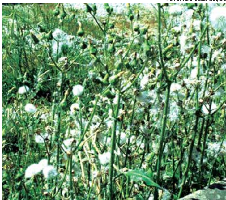
Ervas daninhas prejudicam várias culturas, como a do feijão

A programação contará com mesas-redondas, compostas de palestras e discussões que abordarão desde o manejo de plantas daninhas em culturas agrícolas importantes para a região, além de assuntos mais amplos, tais como, o sistema plantio direto, práticas voltadas às pequenas propriedades, re-