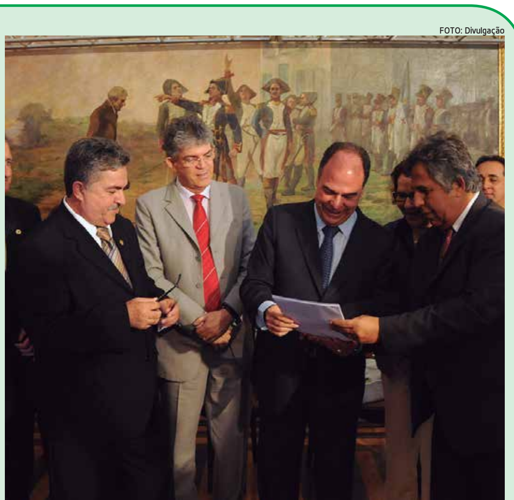
Governador Ricardo Coutinho recebe o ministro Fernando Bezerra e assina ordem de serviço