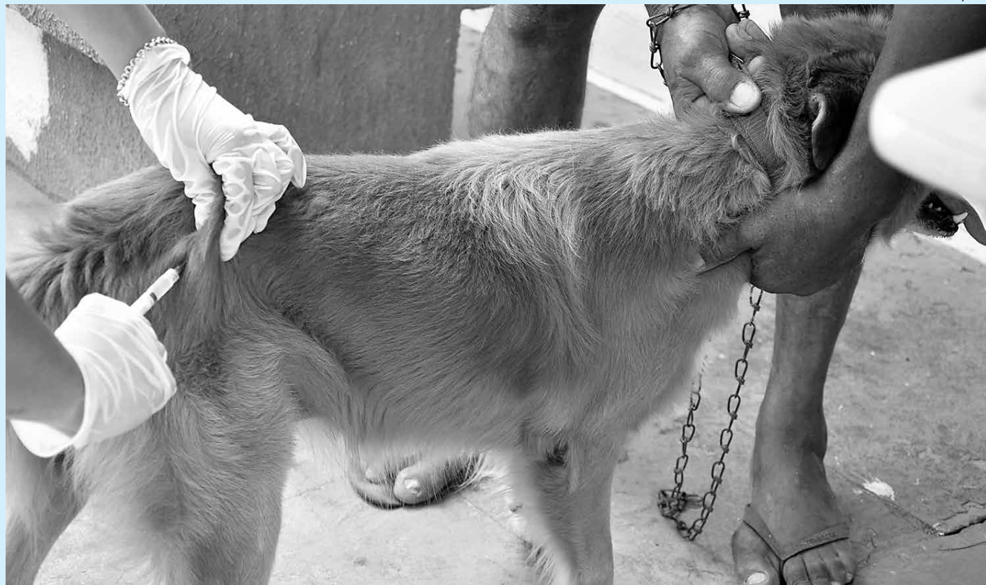
Oitocentas mil doses da vacina contra raiva animal foram destinadas à Paraíba pelo Ministério da Saúde para esta campanha