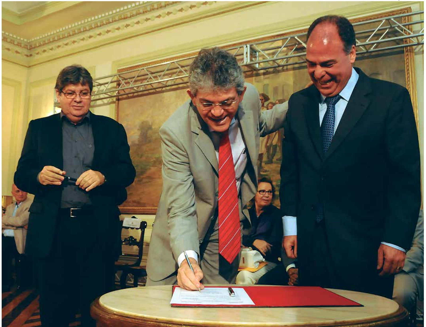
O governador Ricardo Coutinho e o ministro da Integração, Fernando Bezerra, assinaram a ordem de serviço para construção do Lote II do Canal Acauã-Araçagi