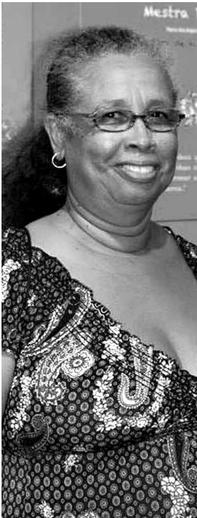
Mestra Doci integra tradição dos contadores de histórias e Peña contribui para diversidade sociocultural do Vale do Gramame

Patrimônio cultural imaterial resguarda para as gerações futuras significativas expressões culturais e as tradições