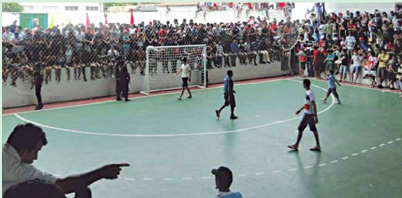
No primeiro jogo disputado em Catolé, a Associação Desportiva de Brejo do Cruz levou a melhor e venceu por 3 a 1

O Campeonato Paraibano de Futsal Adulto Masculino 2013 teve início no mês de março com a participação de 13 equipes. No entanto, as quatro equipes da capital ficaram de fora das semifinais da competição. Quem se sagrar campeão no próximo domingo irá representar a Paraíba no Campeonato Brasileiro de Futsal Adulto Masculino de 2014, conforme disse ontem o presidente Bosco Crispim. Ao vice-campeão é assegurada vaga na Liga Nordeste de Futsal da próxima temporada.