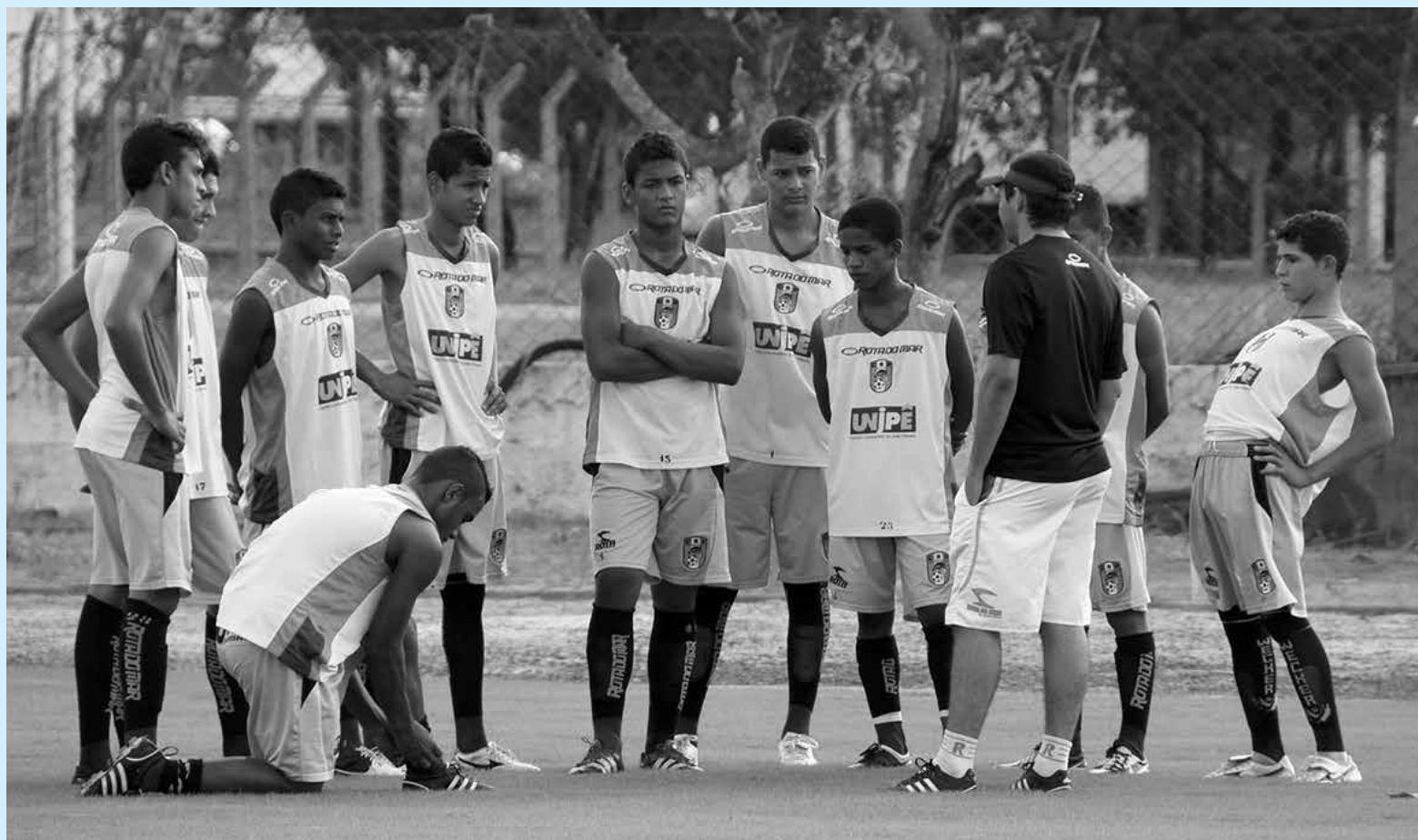
Jogadores da base do CSP já trabalhando visando à participação nas disputas da Copa São Paulo de Futebol Júnior a partir de janeiro

Agora, os dois clubes esperam terminar a Copa Ecohouse, que acontece em São Gonçalo do Amarante/RN, para iniciar o planejamento visando a 45ª edição da Copa São Paulo de Futebol Júnior/2014, que acontecerá no período de 4 a 25 de janeiro. Os dois representantes paraibanos terão mais uma partida na fase classificatória do grupo A para saber se avançam ou se despedem na competição potiguar. O primeiro é o Clube do Povo, que enfrentará amanhã, às 19h, o Sport do Recife-PE, no Estádio Ninho do Periquito-RN. Para permanecer na disputa os automobilistas terão que vencer e torcer que CSP e Sport - falta marcar a data e o horário - empatem para ficar com a segunda vaga. O Alecrim-RN garantiu a classificação antecipada, ao der-