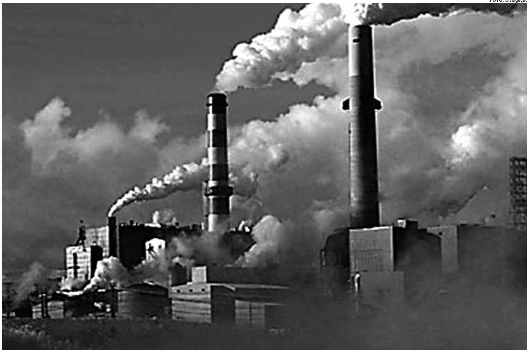
Emissão de gases de efeito estufa vai agravar o aquecimento global e causar drásticas mudanças climáticas, aponta relatório do Painel Intergovernamental