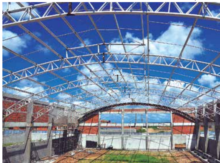
Setenta operários estão trabalhando na obra da unidade de ensino