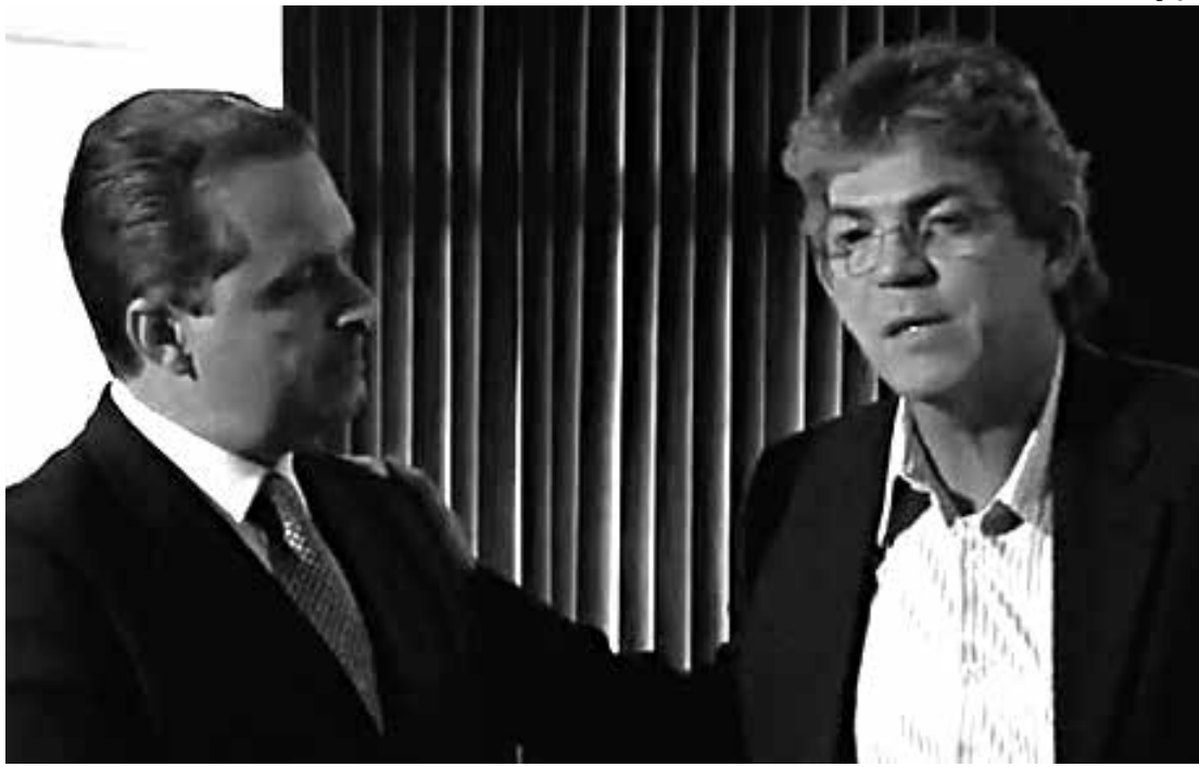
Eduardo Campos conversa com a juventude e se encontra com Ricardo Coutinho hoje à noite

“Eduardo Campos é um político que faz a diferença porque, numa atitude inédita na política brasileira, há poucos dias conduziu o partido a entregar todos os