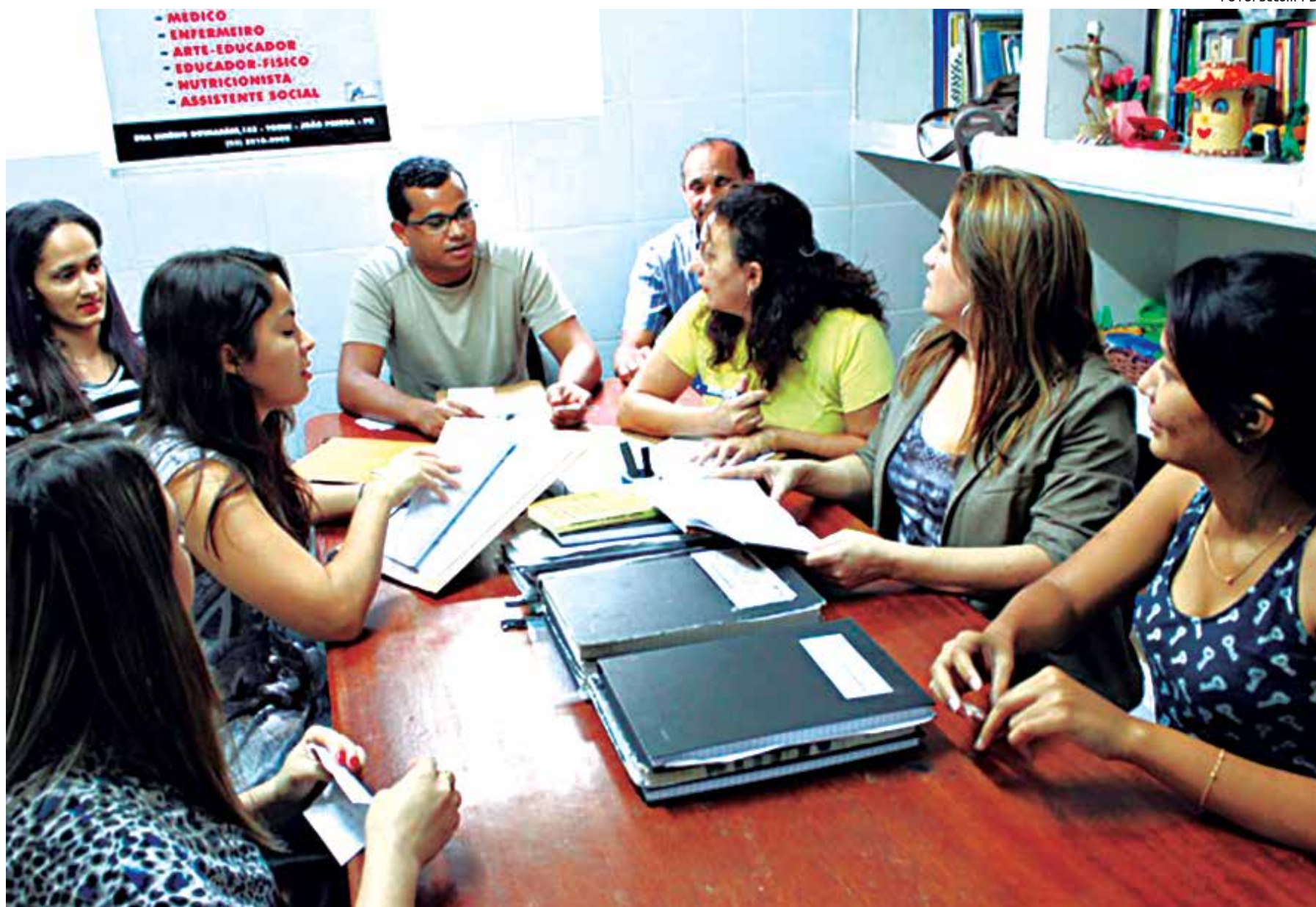
Equipe do CAPS Ad presta atendimento humanizado, individual e familiar por intermédio do Programa Jovem Cidadão a usuários de drogas na Paraíba