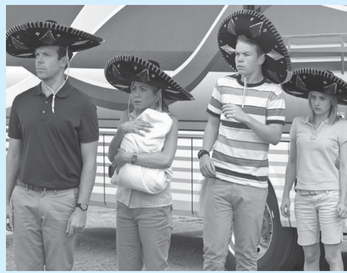
Família "fake" traz droga ilegalmente pela fronteira