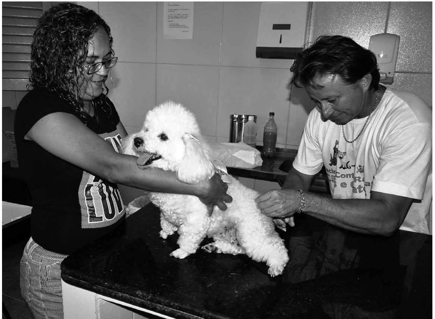
Diversos postos de vacinação serão colocados à disposição da população nos 223 municípios paraibanos e funcionarão até as 17h

A raiva apresenta quatro ciclos de transmissão: no ciclo rural, os bovinos, ovinos, caprinos, suínos e equídeos são os principais elementos transmissores da raiva; no ciclo silvestre, as raposas, guaxinins, macacos e roedores têm maior destaque na transmissão da doença; no ciclo aéreo, os morcegos representam o maior perigo; e no ciclo urbano os principais elementos responsáveis pela manutenção do vírus rábico são os cães e gatos.