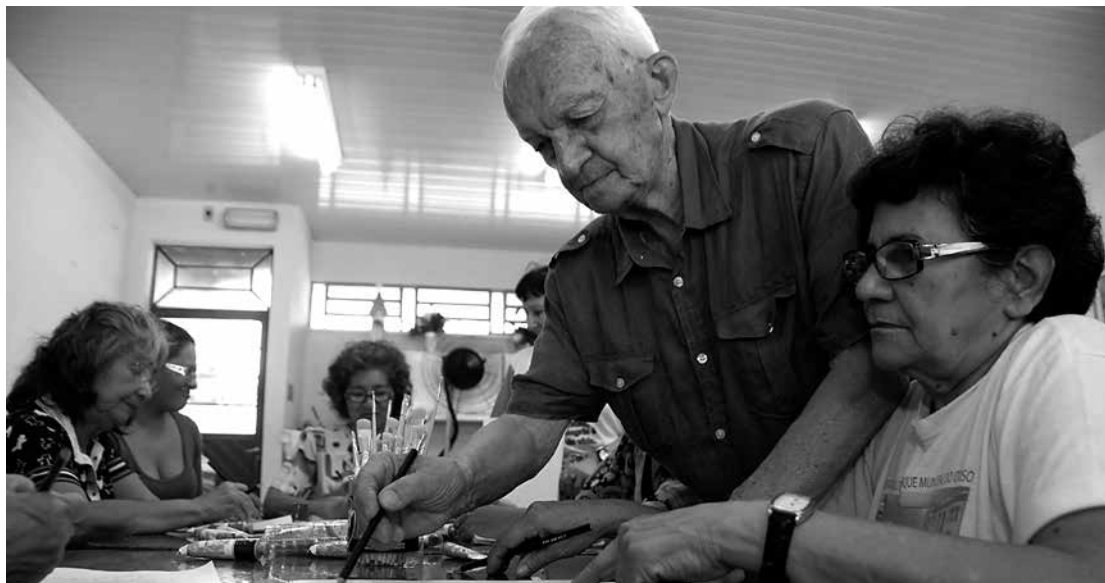
Envelhecimento populacional paraibano continua se ampliando e teve aumento de 22,9%

Mais de 90% dos moradores nasceram em território paraibano e 70% vivem em cidades de origem