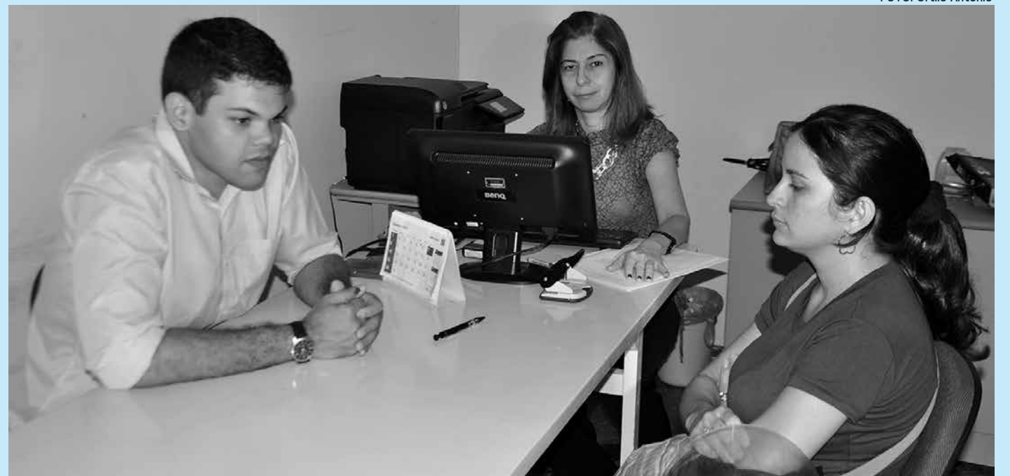
Durante o mutirão de conciliações do Procon Estadual foram feitos diversos acordos entre empresas e consumidores