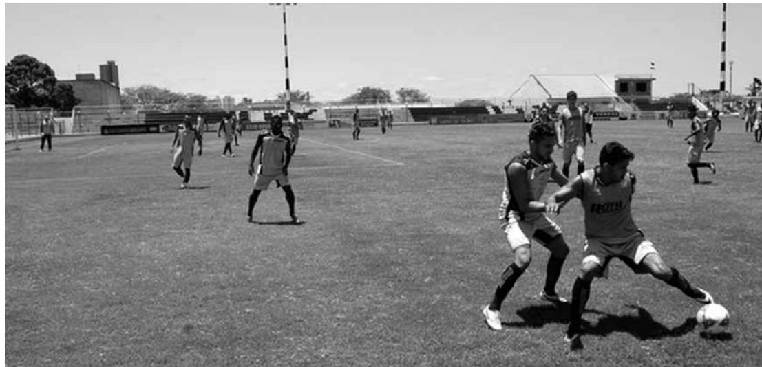
Jogadores do Alvinegro treinaram na manhã de ontem, visando o jogo contra o Brasiliense