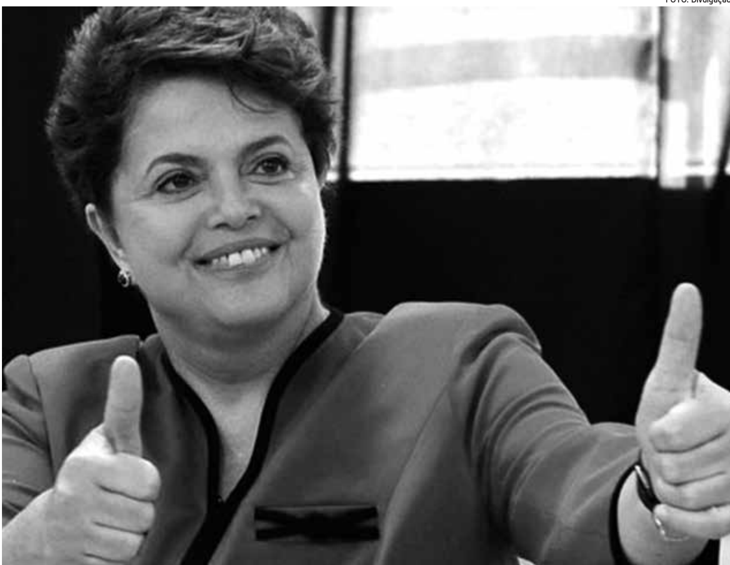
A popularidade da presidente Dilma Rousseff começa a subir depois de forte queda após as manifestações de julho passado

Apesar de ter subido em relação à última pesquisa de popularidade da CNI/Ibope, o índice de aprovação de Dilma ainda