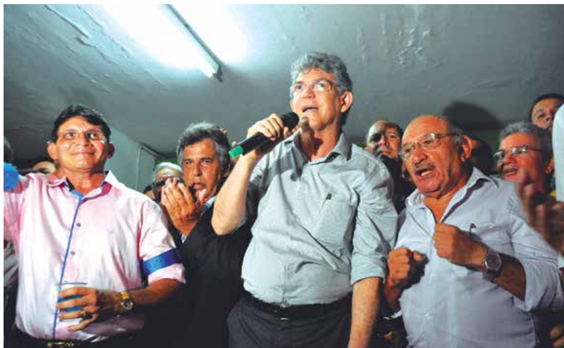
O governador Ricardo Coutinho ressaltou que o Estado investiu cerca de R$ 10 milhões no projeto

Foram investidos na obra cerca de R$ 10 milhões, com recursos próprios do Estado. Do total de recursos aplicados, R$ 6,5 milhões foram destinados às obras de engenharia e cerca de R$ 3,3 milhões em 117 desapropria-