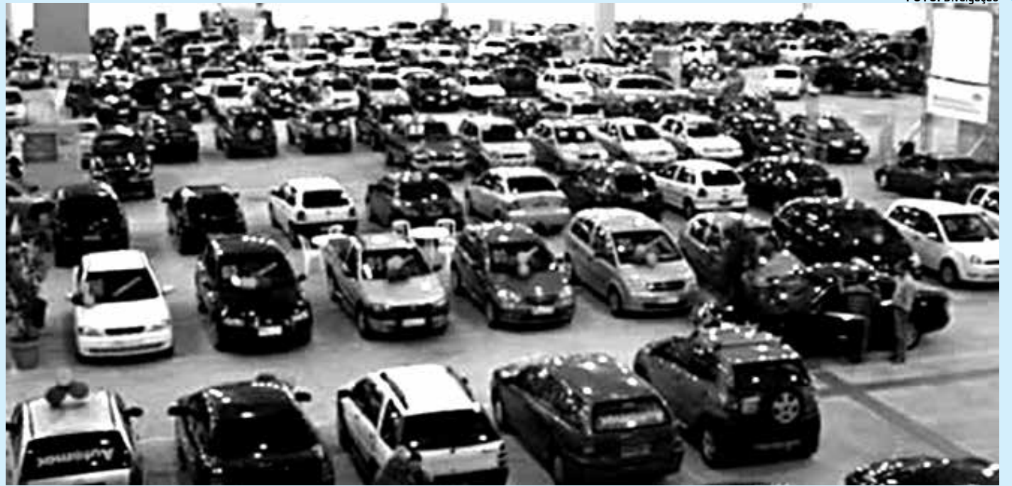
O Salão Auto Caixa será realizado em 363 municípios brasileiros, com financiamento de veículos que terá prazo de até 60 meses

A pesquisa chocou o país ao dizer que 65,1% dos brasileiros apoiam ataques a mulheres que usam roupa curta.