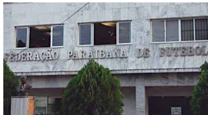
A sede da FPF está situada no bairro de Tambiá, no Centro