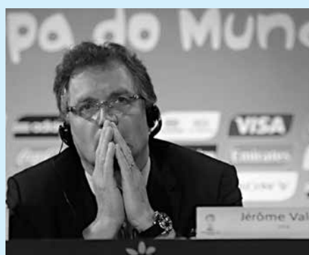
O secretário da Fifa, Jérôme Valcke

da Fifa, o secretário-geral avaliou como "bastante avançada" a preparação do Brasil a pouco mais de dois meses do início da competi-