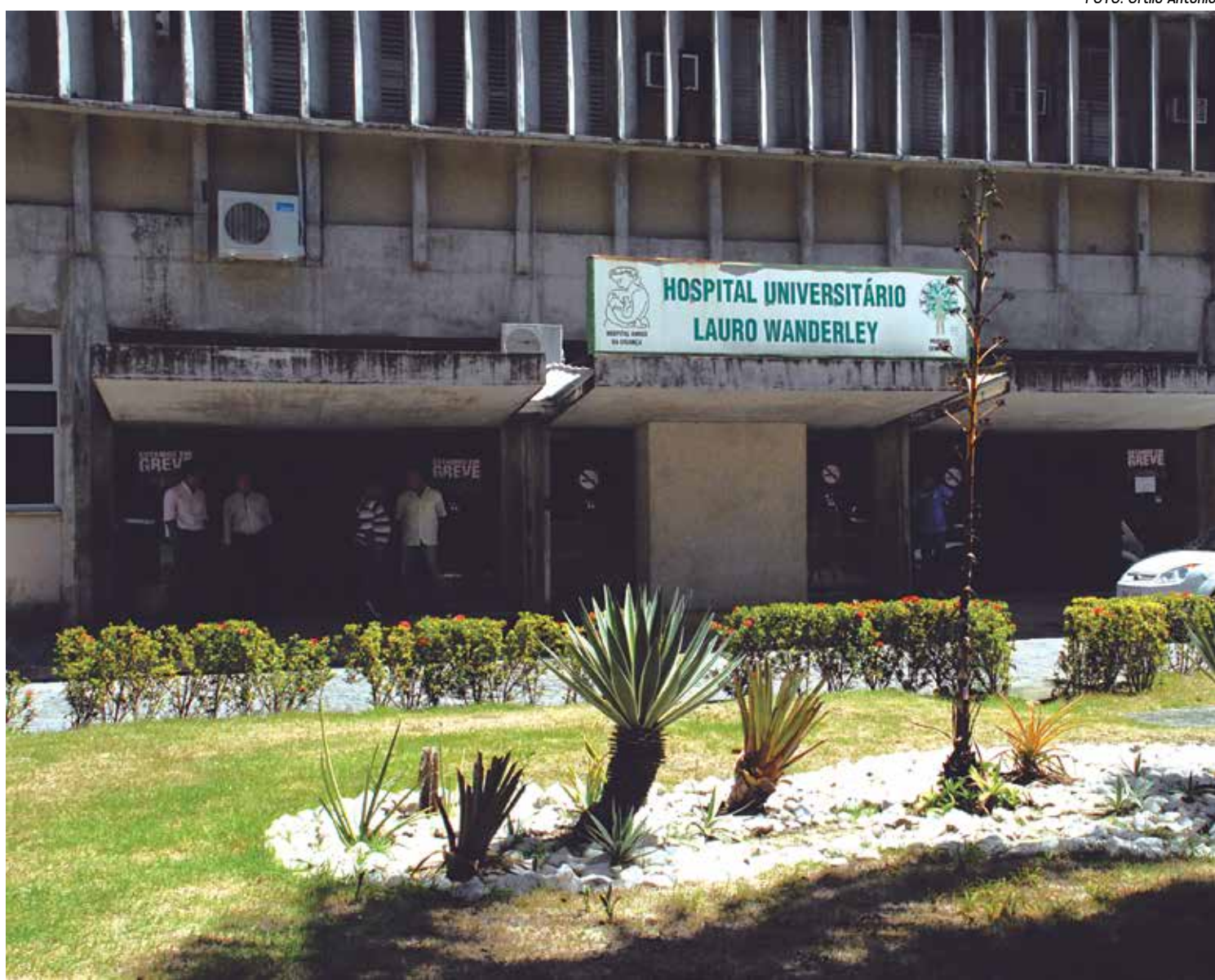
Hospital Universitário Lauro Wanderley tem aproximadamente 900 funcionários e chega a realizar até 10 mil consultas por mês

Ainda segundo informações do diretor administrativo do Sintesp, cerca