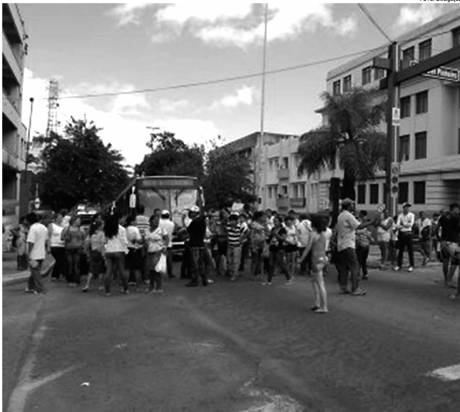
Os mototaxistas ocuparam a Avenida Floriano Peixoto, no centro da cidade, para reclamar do excesso de multas aplicadas a eles

Os condutores queimaram pneus e estacionaram suas motos em frente à Secretaria de Administração e Finanças