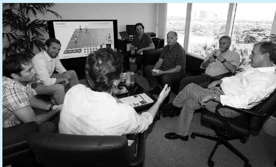
Comissão técnica da Seleção Brasileira em reunião na sede da CBF, no Rio de Janeiro

Para tanto, os integrantes da comissão técnica se encontraram