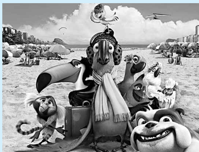
Animação é dirigida pelo brasileiro Carlos Saldanha