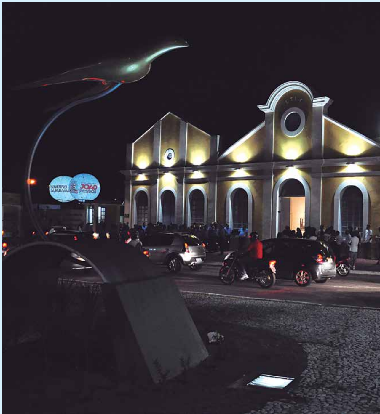
Usina Cultural Energisa, na Cruz do Peixe, onde acontece mais um Festival de Cinema de Países de Língua Portuguesa