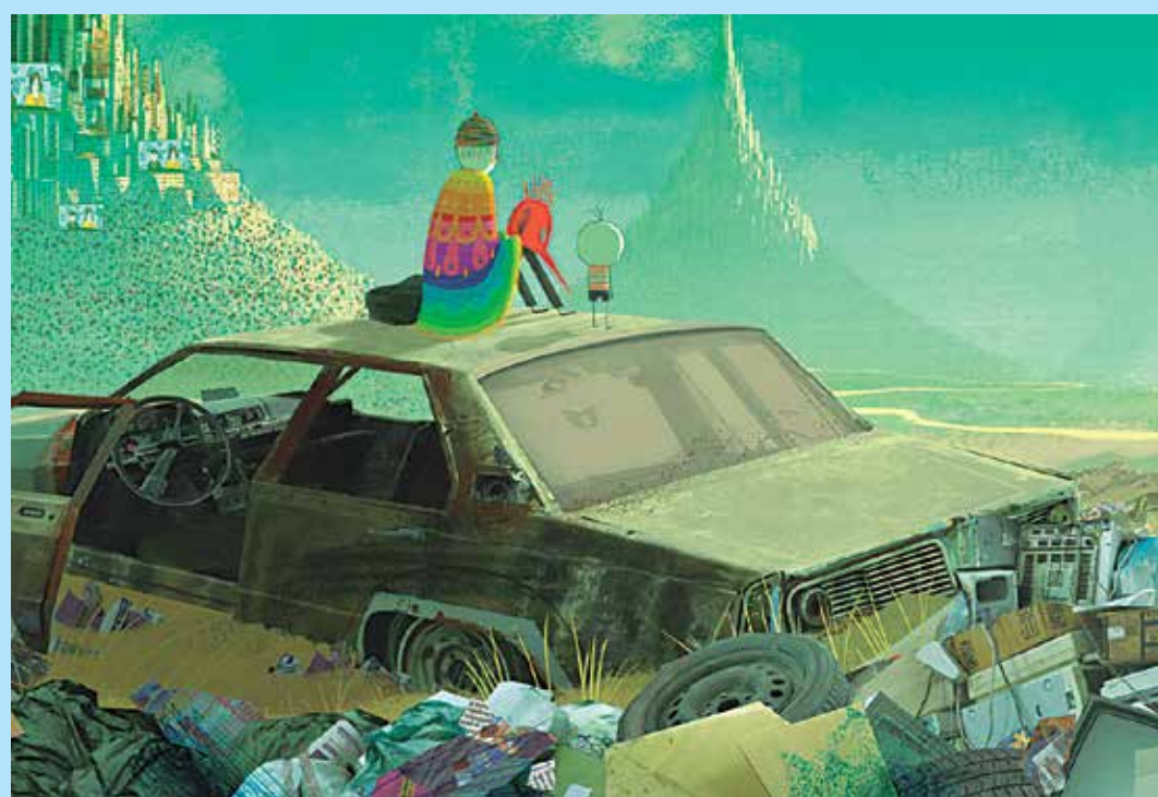
Cena do filme O Menino e o Mundo, que foi escrito, dirigido e montado pelo brasileiro Alê Abreu

Praticamente sem diálogos, os sons são fundamentais para contribuir na expressão dos sentimentos e na evolução da trama. O garoto guarda uma memória do pai, que é resumida no som de sua flauta, que guia o menino durante sua saga. A trilha sonora, composta por Gustavo Kurlat e Ruben Feffer, conta com a participação de Emicida, Naná Vasconcelos, GEM - Grupo Experimental de Música e Barbatuque.