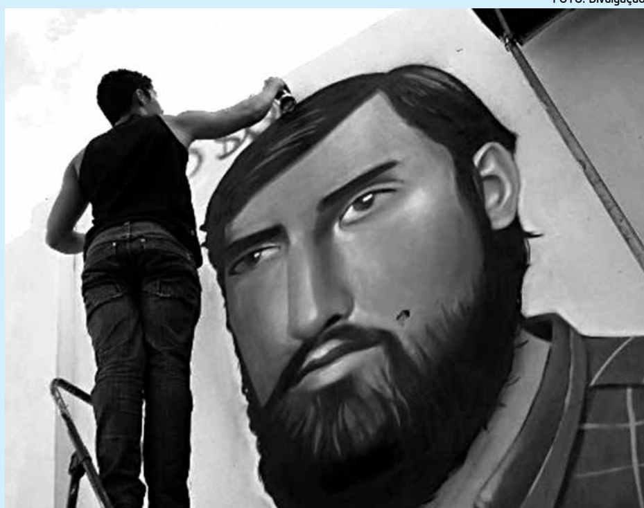
Grafito em ação no trabalho que homenageia desaparecidos e torturados

Os artistas têm obras urbanas reconhecidas nos muros da cidade e aceitaram o convite do DCE-UEPB para elaborar painéis