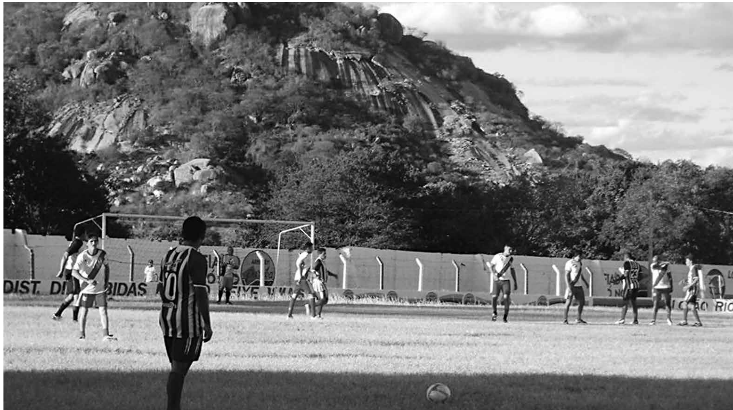
O Estádio Zezão, na cidade de Itaporanga, sedia os jogos do mais importante torneio de futebol amador com jogos de dia e de noite