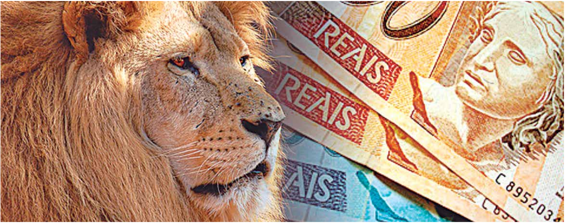
Contribuinte que não prestar conta ao 'Leão' pagará multa de R$ 165,74, podendo chegar a 20% do imposto devido; são obrigados a declarar quem recebeu rendimento superior a R$ 25.661 em 2013