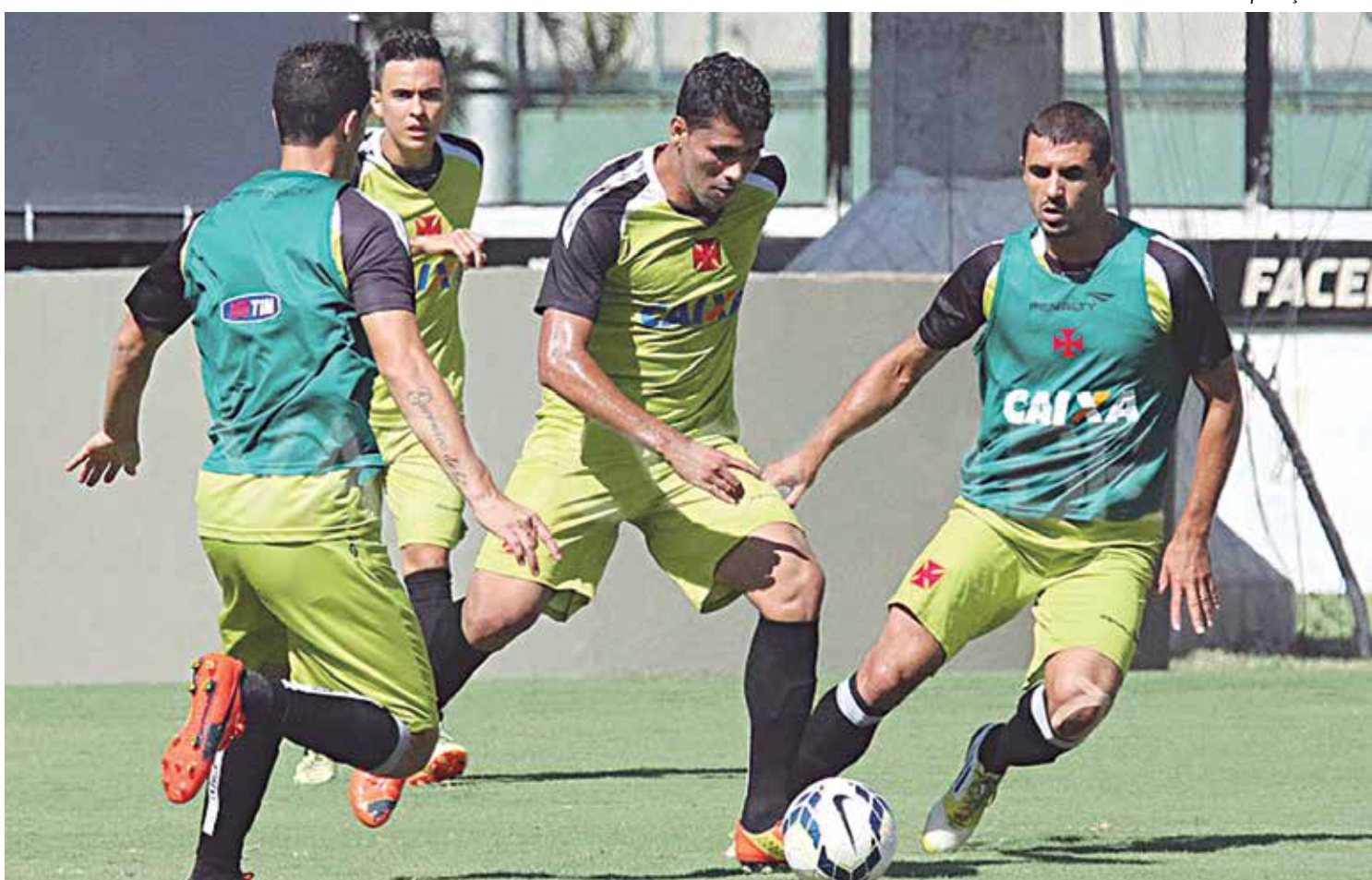
Jogadores do Vasco realizaram o último treinamento coletivo ainda em São Januário visando o jogo de hoje contra o Treze no Amigão

Os ingressos custam R$ 50,00 na arquibancada geral e R$ 80,00 na arquibancada principal, respeitando-se a meia-entrada.