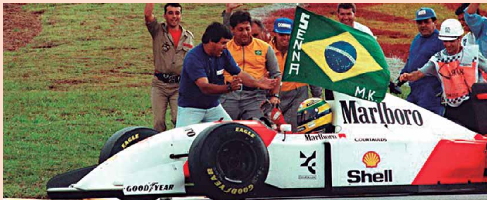
Ayrton Senna desfila com a bandeira do Brasil após mais uma vitória em Interlagos. O tricampeão deixou muita saudade no torcedor brasileiro

"Em termos esportivos, o futebol ainda era o esporte nacional. A Fórmula 1, por sua vez, ganhou amplo destaque a partir da figura carismática de Ayrton Senna. Fittipaldi pode ter tido sua brilhante trajetória de bicampeão ou Piquet pode ter sido igualmente tricampeão mundial se comparado a Senna; porém, nenhum deles mobilizou tantos afetos quando esse último. Senna era um mobilizador de afetos por onde passava e se construía dessa forma como pessoa e como piloto" opina Wagner Xavier de Camargo, antropólogo do Esporte e atual.