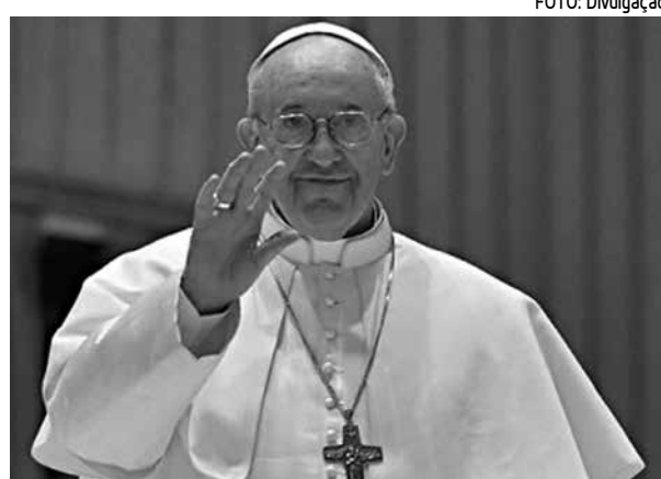
Francisco conquistou os fiéis pelo carisma

Na verdade o coração humano é tão rico de uma necessidade