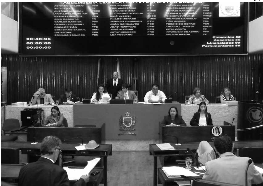
Os deputados que compõem a CCJ da Assembleia Legislativa estiveram reunidos ontem pela manhã

Outro projeto analisado e aprovado foi o nº 1.889/2014, do deputado Frei Anastácio (PT), que cria