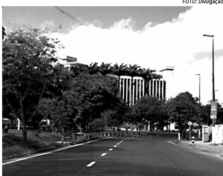
Arborização da Avenida Canal, próximo à Federação das Indústrias

Ao longo do ENAU serão promovidos workshops, mesas redondas, visitas técnicas, palestras magistrais e apresentação de painéis que destacarão assuntos relativos à recuperação e preservação de matas ciliares, aspectos gerais na locação