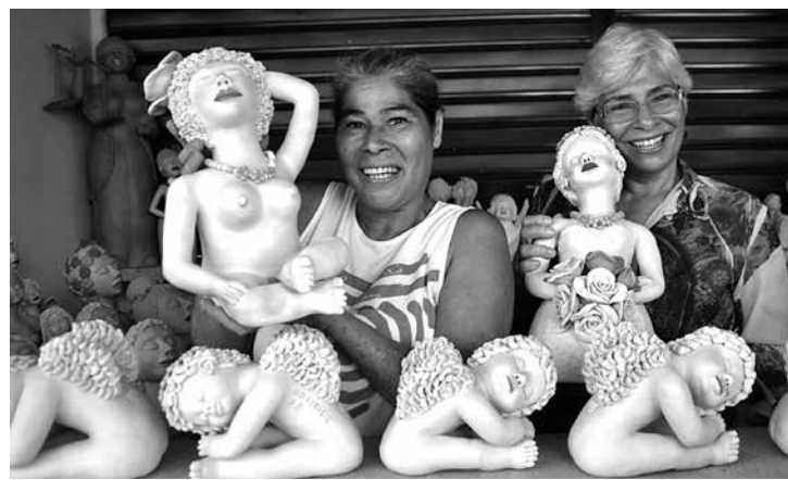
As irmãs ceramistas já participaram de todas as edições do evento

Criatividade, habilidade e matéria-prima genuinamente paraibana. Com esses atributos os artesãos estão produzindo peças em ritmo acelerado para ampliar o estoque de produtos na Casa do Artesão, no Varadouro, para a 21ª edição do Salão de Artesanato da Paraíba. O evento será aberto no dia 18 de dezembro e fica aberto à visitação até 20 de janeiro, na Praia do Cabo Branco.