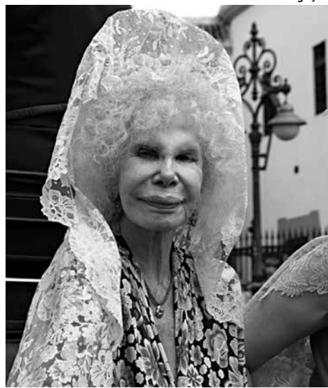
Personalidade reconhecida pelo bom gosto

A Espanha está de luto, faleceu no Palácio de Dueñas, em Sevilha, no último dia 20, aos 90 anos, a 18ª duquesa de Alba de Tormes, a milionária María del Rosário Cayetana Fitz-James Stuart.