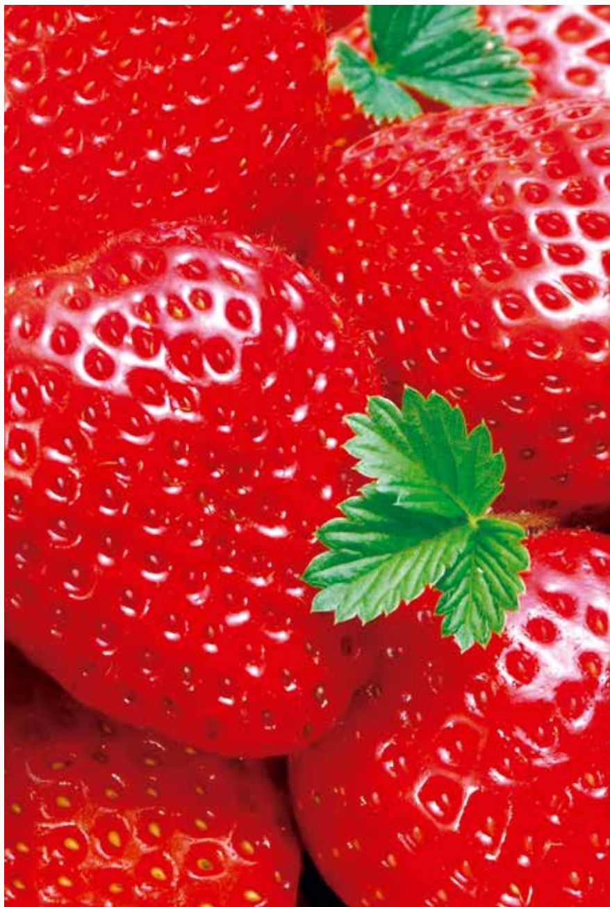
Morango apresentou alto teor de agrotóxicos e o caso do pimentão foi pior: o legume conduzia resíduo metamidofós, produto proibido no país desde 2012

A Empresa Paraibana de Abastecimento e Serviços (Empasa) é um dos órgãos do Governo do Estado que, ao lado dos demais parceiros, está realizando um trabalho de