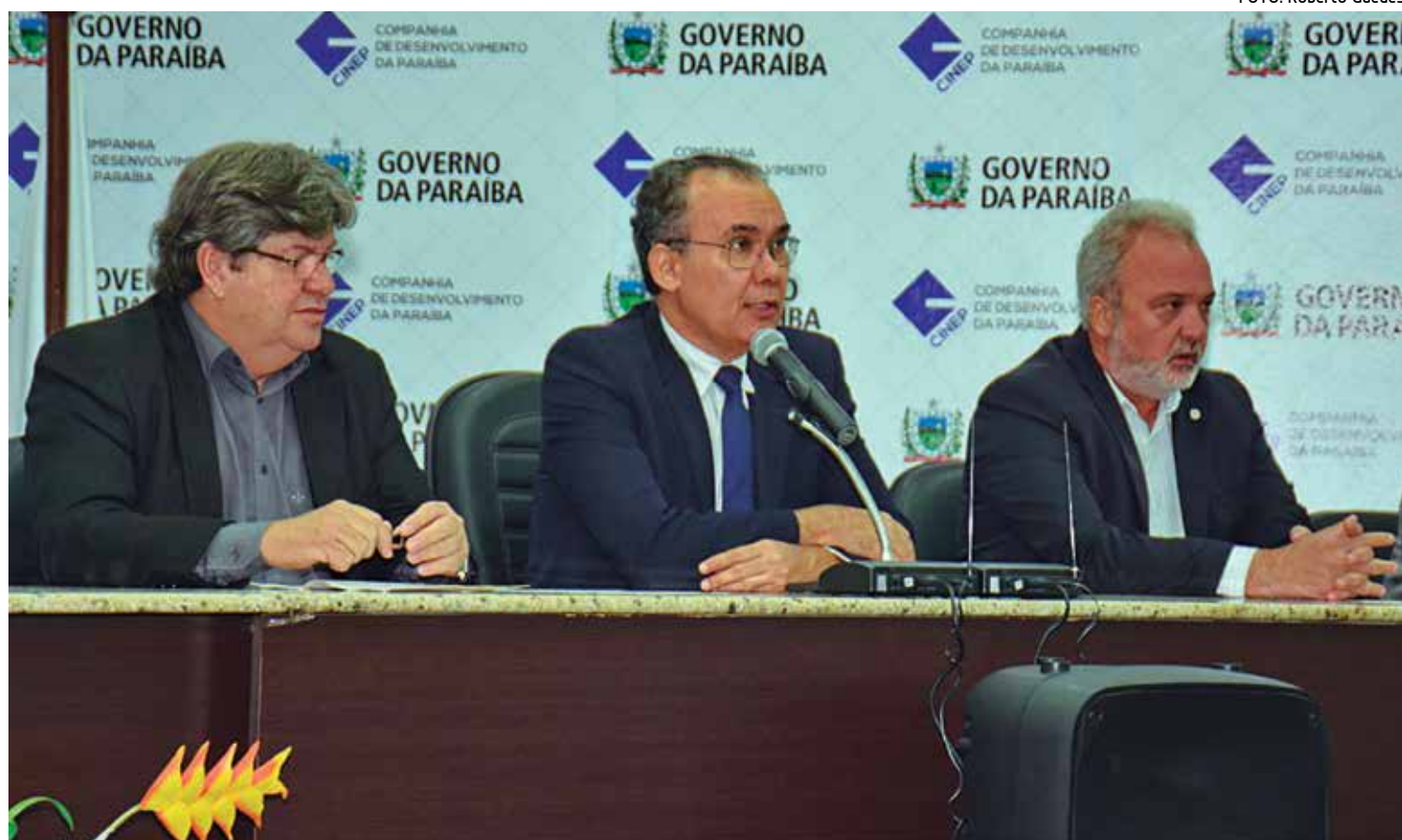
Encontro realizado na Companhia de Desenvolvimento da Paraíba marcou a apresentação do Plano para obras de grande porte