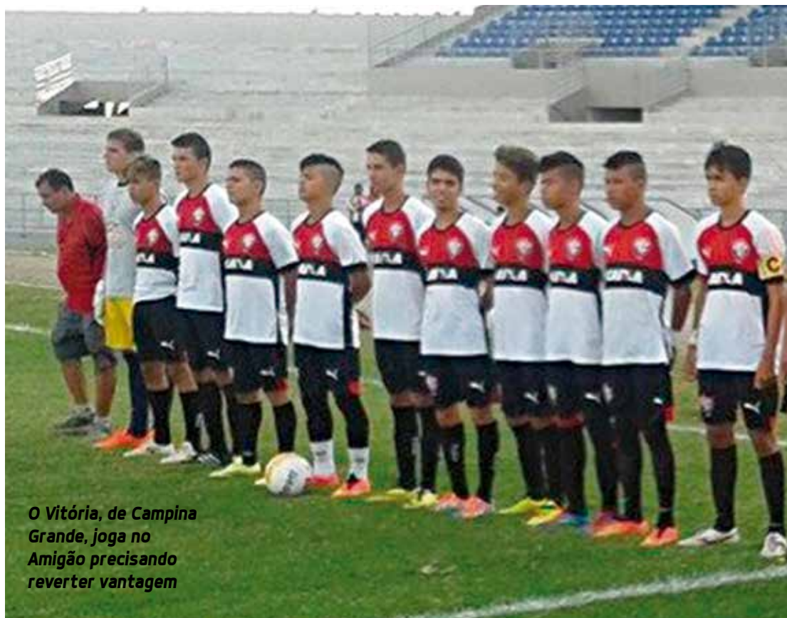
O Vitória, de Campina Grande, joga no Amigão precisando reverter vantagem

Na temporada atual, alguns garotos já foram chamados para integrar as categorias de base de grandes clubes do país.