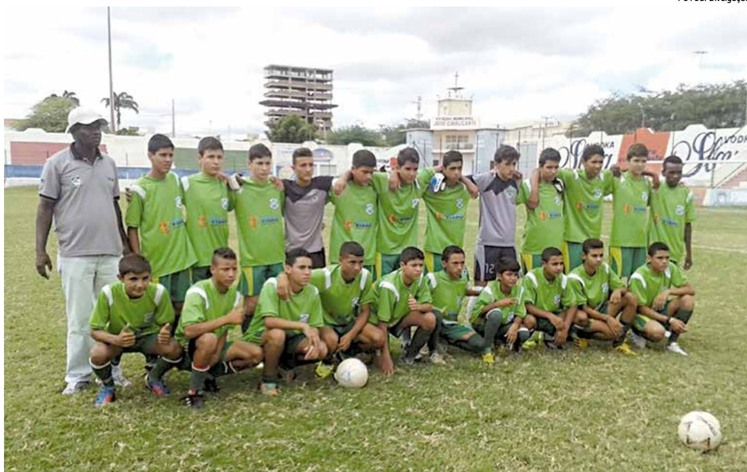
O Nacional de Patos joga hoje em Campina Grande e terá a vantagem de fazer a segunda partida decisiva em seus domínios, no sábado