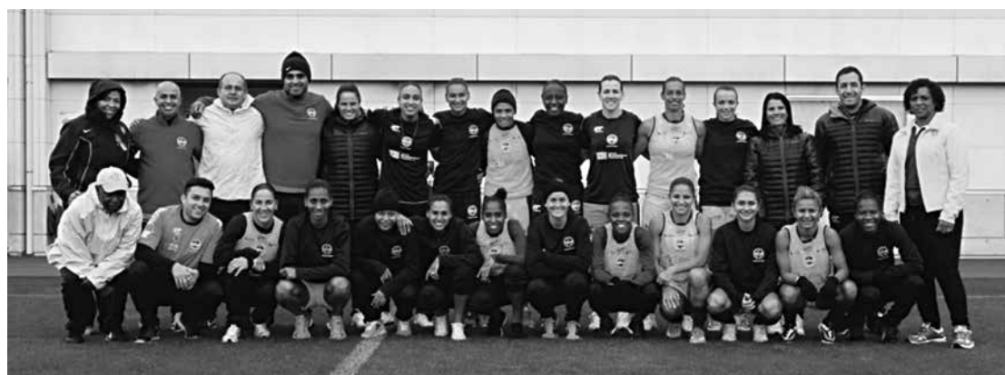
Jogadoras e membros da comissão técnica do São José que representa o Brasil no Mundial Feminino