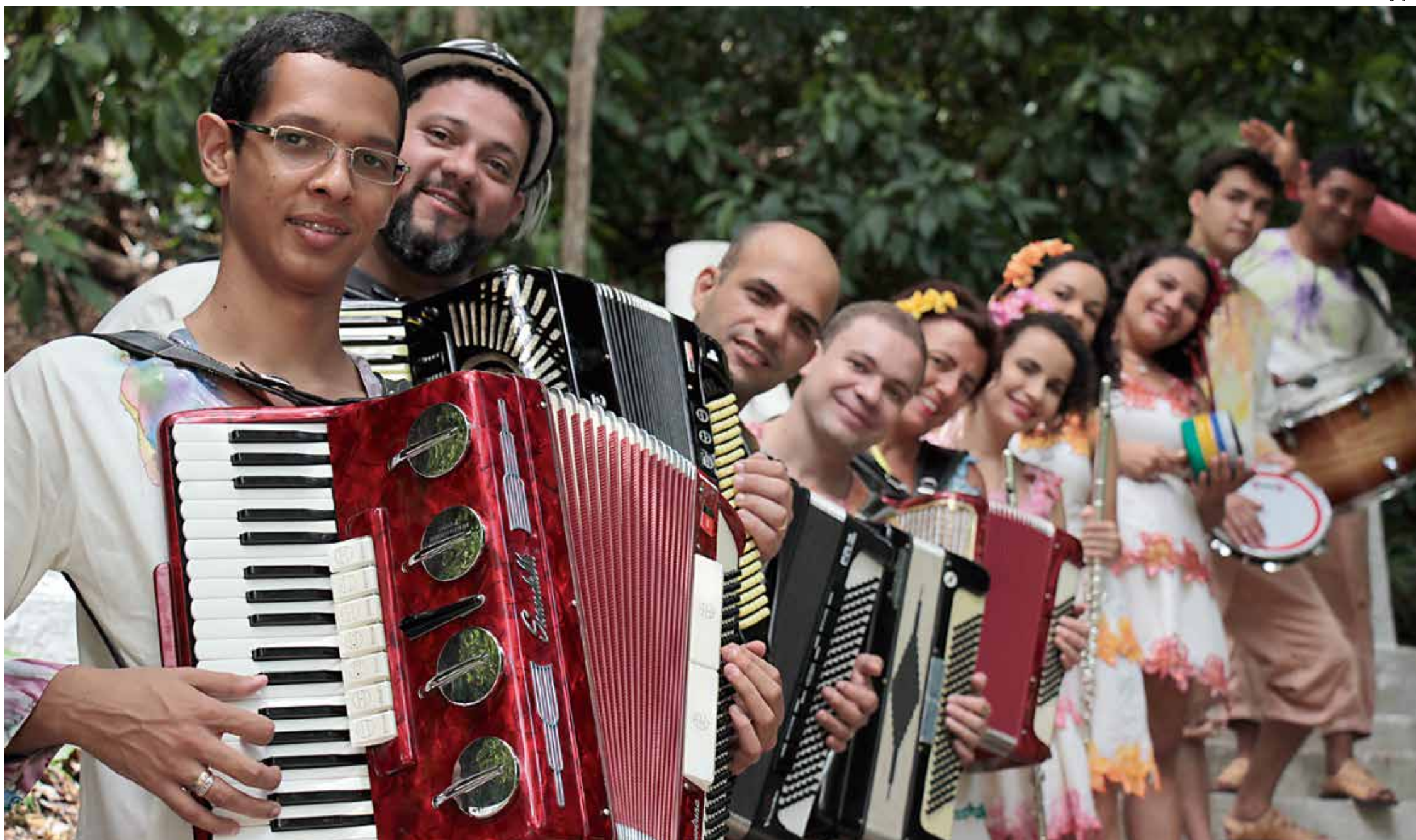
Enfatizando a beleza do som da sanfona, a orquestra que tem o mesmo nome da entidade artística, vem se firmando de forma brilhante no cenário musical da Paraíba