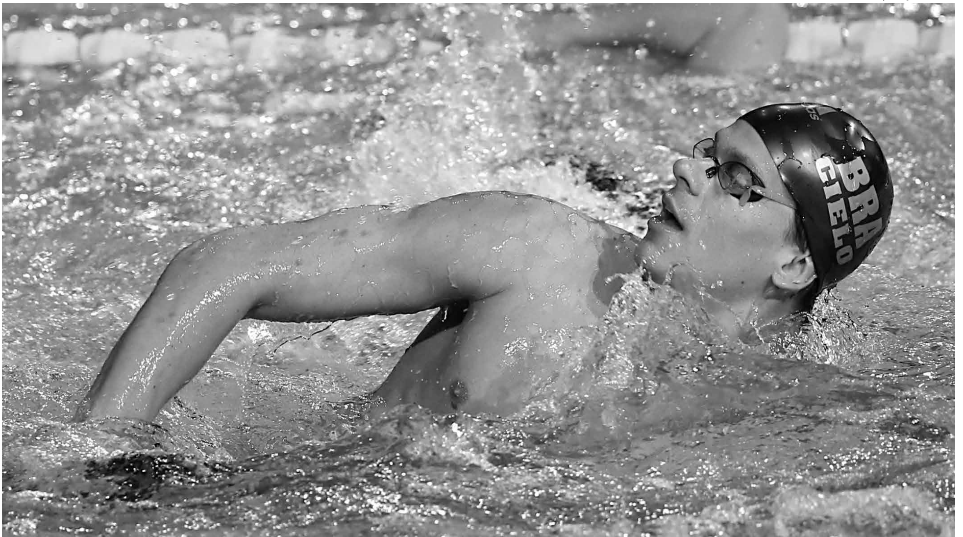
O brasileiro César Cielo é uma das atrações ao lado do norte-americano Ryan Lochte, dono de 30 medalhas na história do evento que vai até o próximo domingo

A Fina já vem testando em diversas competições, os revezamentos mistos, provas que reúnem dois homens e duas mulheres na mesma equipe. O Mundial em piscina curta será o pri-