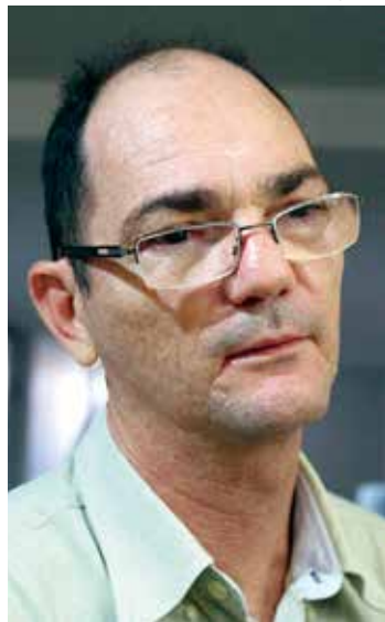
Coriolano, quer mudanças