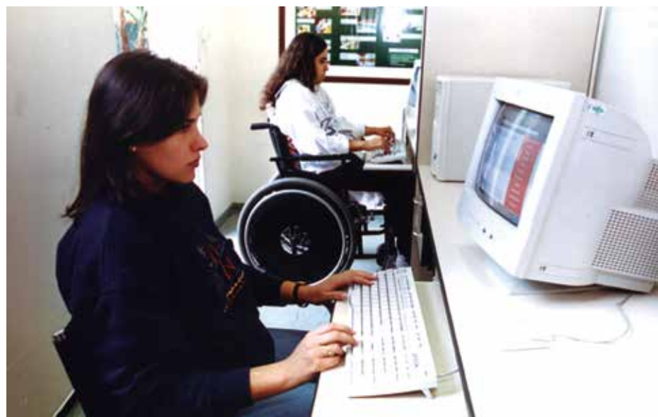
Para 77% dos entrevistados, desempenho do funcionário deficiente é similar ao dos demais

A pesquisa foi feita com 2.949 profissionais de RH, em sua maioria mulheres, sendo que apenas 35% dos entrevistados possuem bom conhecimento sobre a Lei de Cotas, embora 45% possuam Pós-Graduação completa ou cursando. Quase metade dos profissionais de RH já entrevistaram pessoas com deficiência, o que mostra que boa parte dos respondentes já passou por essa experiência em algum momento.