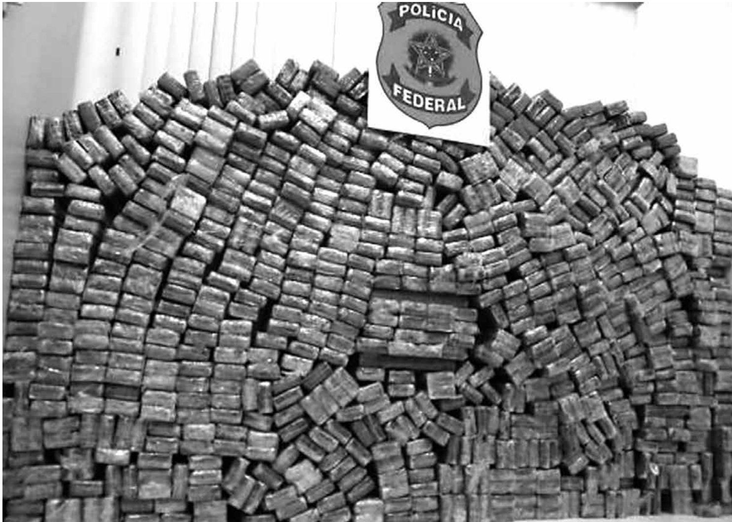
831 quilos de cocaína, que estavam camuflados em dois contêineres e seriam enviados a Madri, foram apreendidos pela Polícia

Iniciadas em fevereiro deste ano, as investigações identificaram, segundo a PF, um pecuarista da cidade paranaense de Umuarama, que recebia grandes carregamentos de cocaína e depois remetia para outros Estados. "Com o avançar das investigações, foi identificada uma ampla rede internacional de narcotráfico, que enviava os