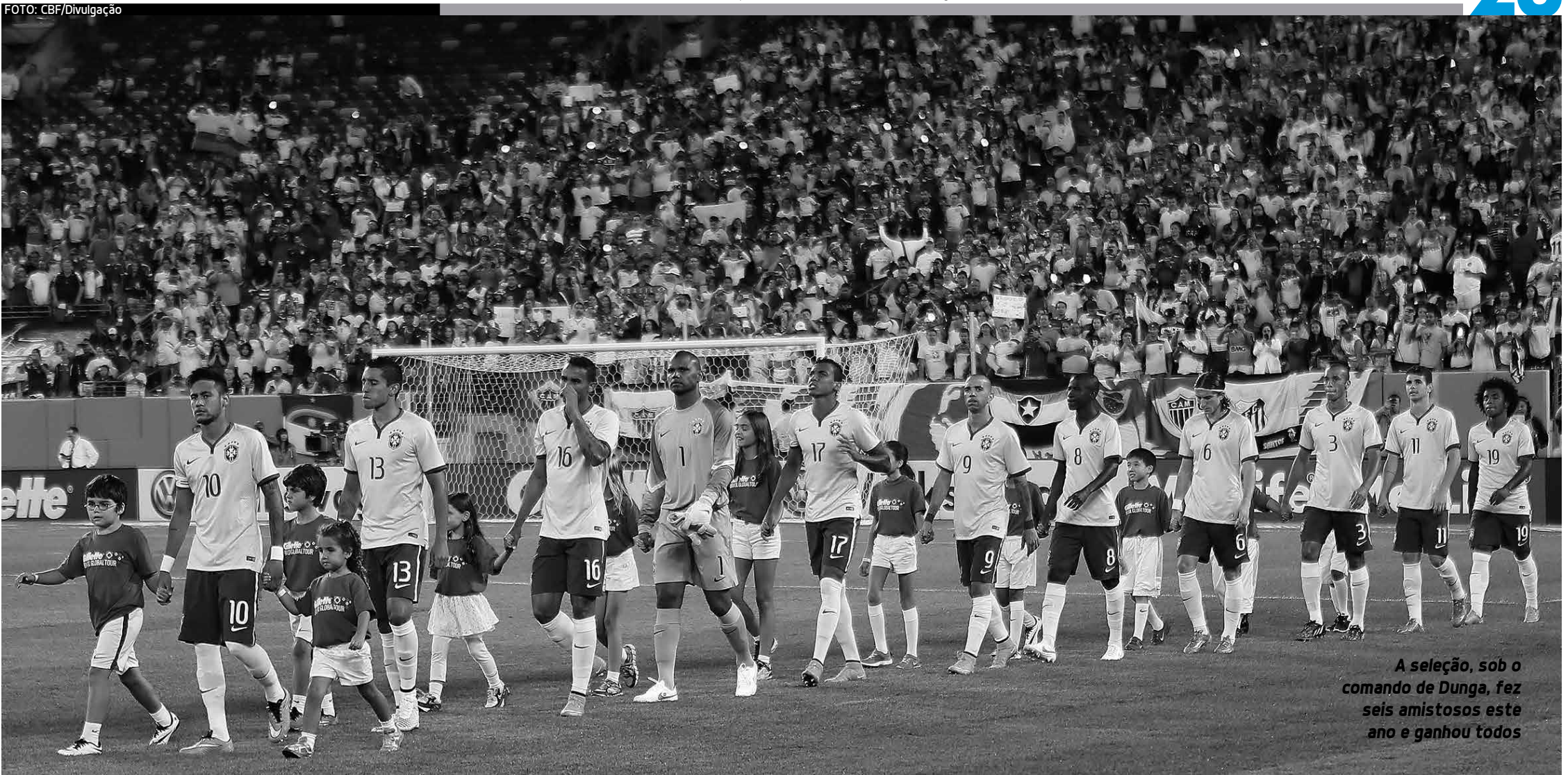
A seleção, sob o comando de Dunga, fez seis amistosos este ano e ganhou todos