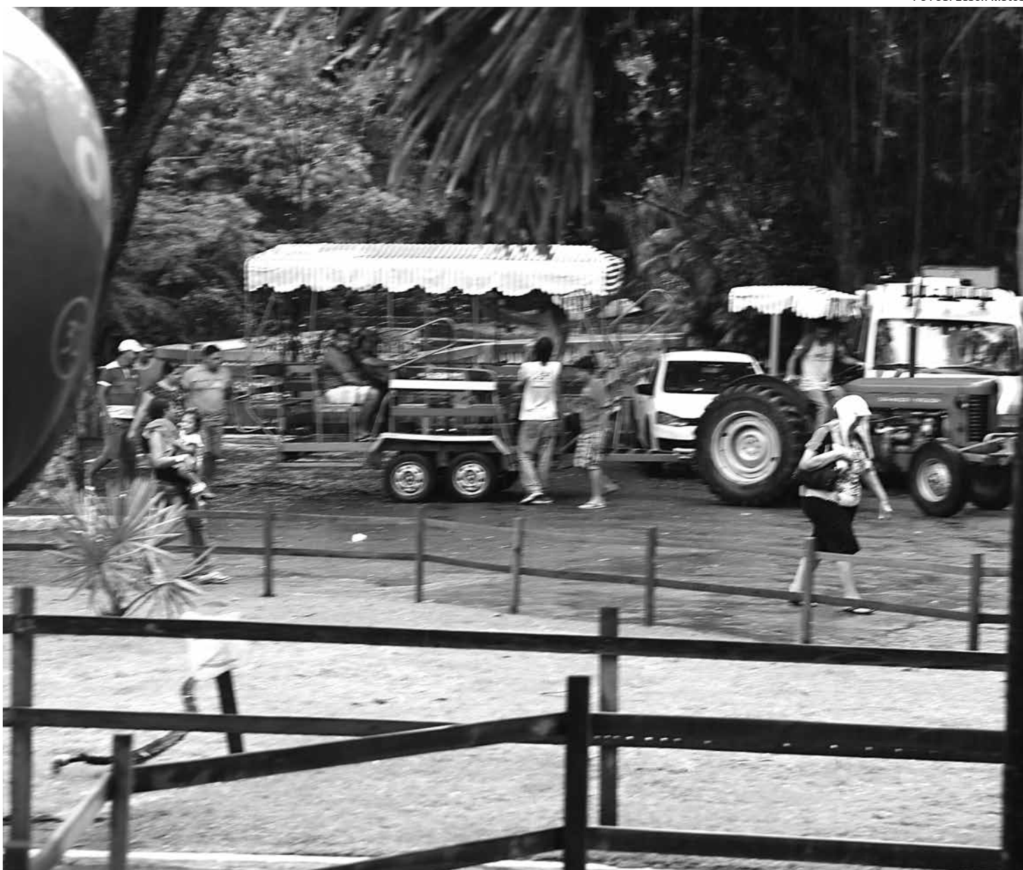
Algumas famílias que resolveram ignorar o mau tempo e realizar o passeio no trenzinho conseguiram ver os animais mesmo de longe