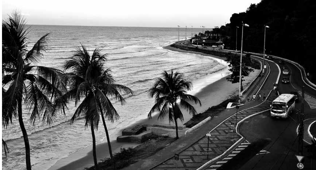
Praias e clima quente fazem do turismo uma das principais atividades econômicas do Nordeste

deste para o Produto Interno Bruto (PIB) nacional é de 13,6%. A economia nordestina está em constante processo de desenvolvimento. A região vem recebendo várias indústrias, um dos motivos é a concessão de benefícios fiscais pelos governos estaduais (isenção de impostos, doação de terrenos etc.), além de mão de obra mais barata; um dos exemplos foi a instalação da Ford, na Bahia, e diversas empresas têxteis, no Ceará.