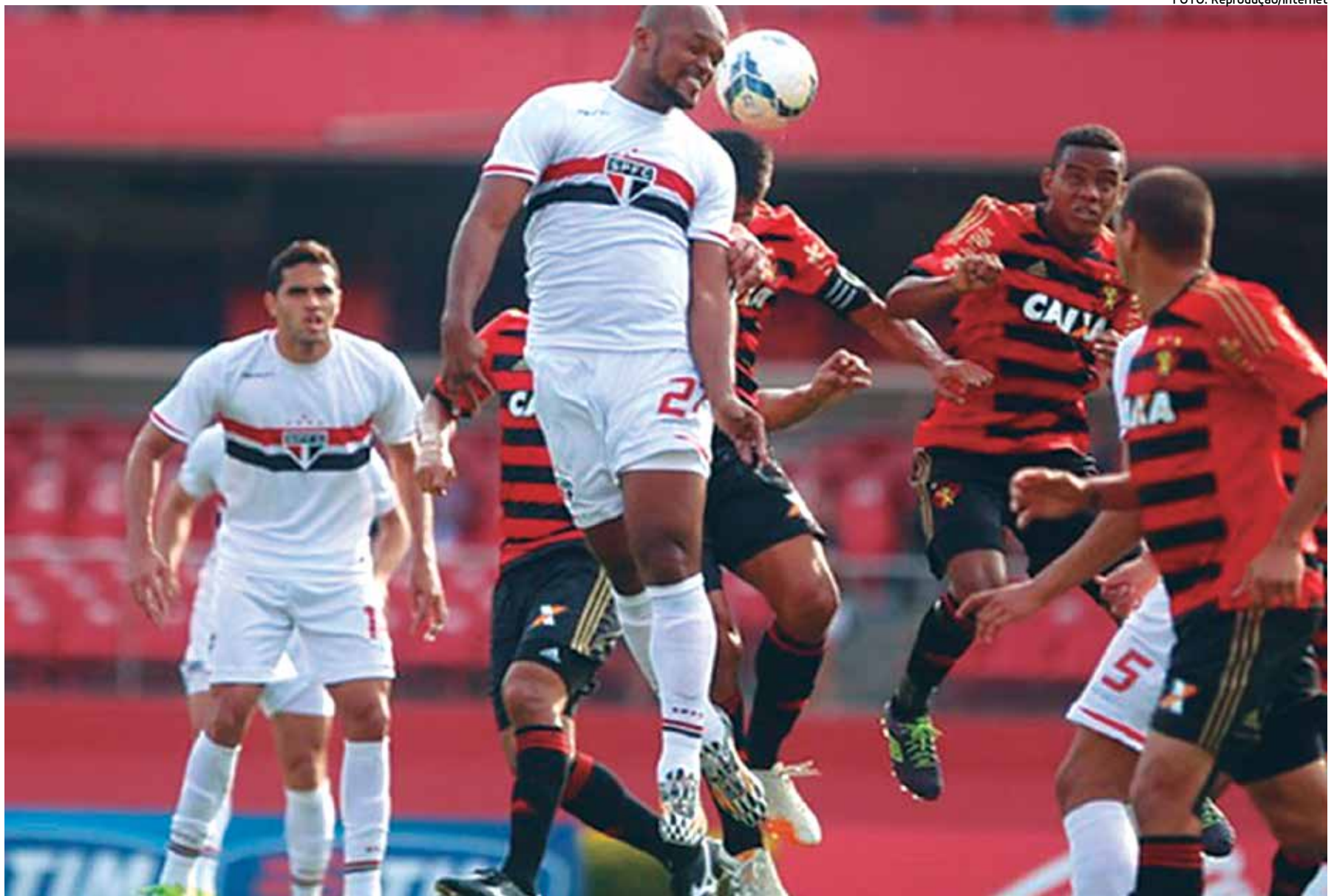
O Sport Recife, que derrotou o São Paulo, na última rodada em Recife, terminou a competição em décimo primeiro lugar com uma campanha satisfatória

A estatística não é inédita na comparação com o tempo dos mata-matas. Em 2002, último ano sem pontos corridos, o Fluminense classificou-se para as quartas-de-final com 46 gols sofridos, mesmo número do Palmeiras, rebaixado. Como o Flu sofreu cinco gols no mata-mata, terminou como a defesa mais vazada e não rebaixado.