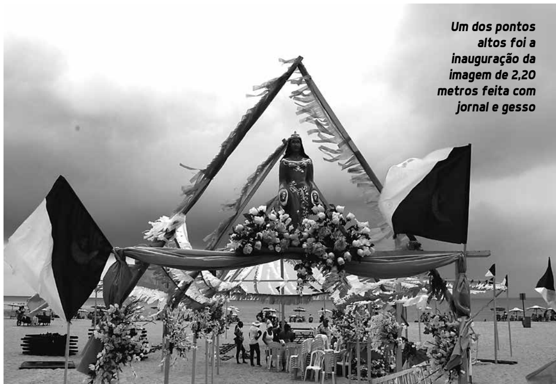
Um dos pontos altos foi a inauguração da imagem de 2,20 metros feita com jornal e gesso

A exemplo dos anos anteriores, a festa de Iemanjá na orla de João Pessoa atrai pessoas de praticamente todos os municípios paraibanos e turistas de diversos Estados. O evento de ontem contou com representantes de terreiros de vários municípios paraibanos e dos Estados do Ceará, Maceió e Rio Grande do Norte.