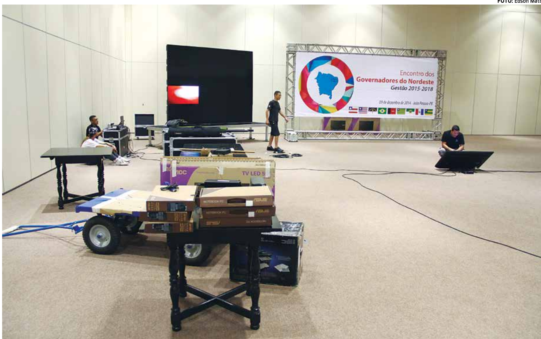
Equipes passaram o dia de ontem finalizando os preparativos do Encontro dos Governadores do Nordeste, no Centro de Convenções