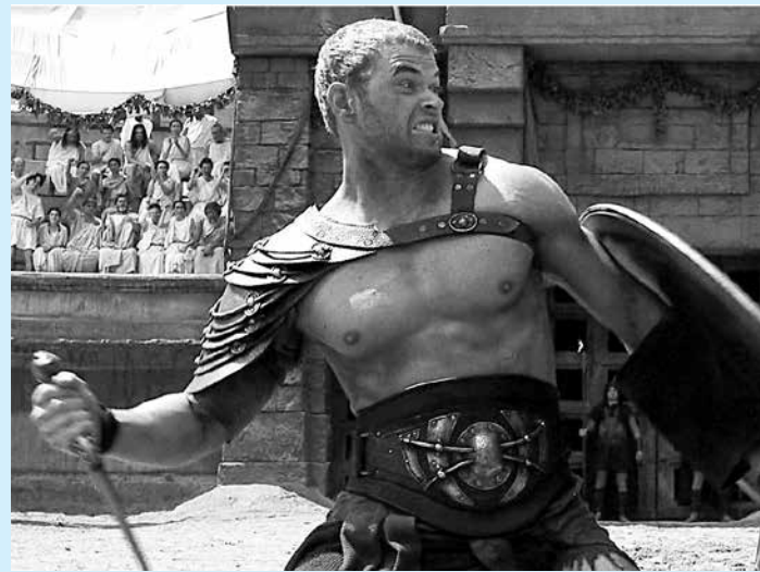
Lenda grega é tema do novo filme em cartaz