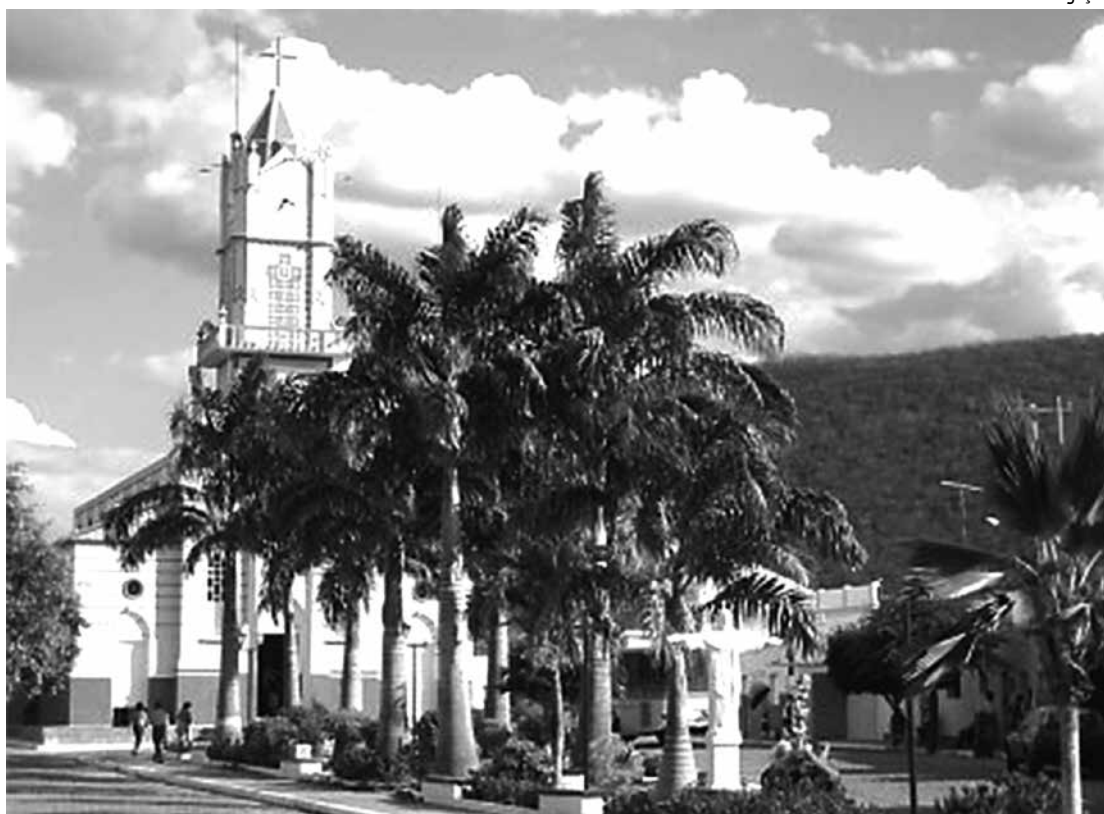
Igreja matriz da cidade de Nova Olinda, no Sertão da Estado, onde choveu 157,3 mm, na madrugada de ontem

Conforme dados da Aesa, da semana passada para cá, o município de Nova Olinda foi