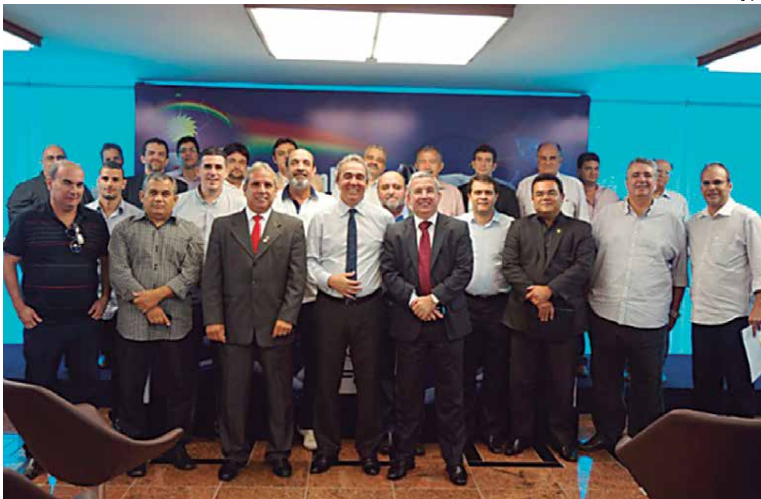
Presidentes de clubes integrantes da atual Copa do Nordeste se reuniram na última segunda-feira na Federação de Pernambuco

Para completar os 20 clubes, que serão divididos em 4 chaves de 5 times