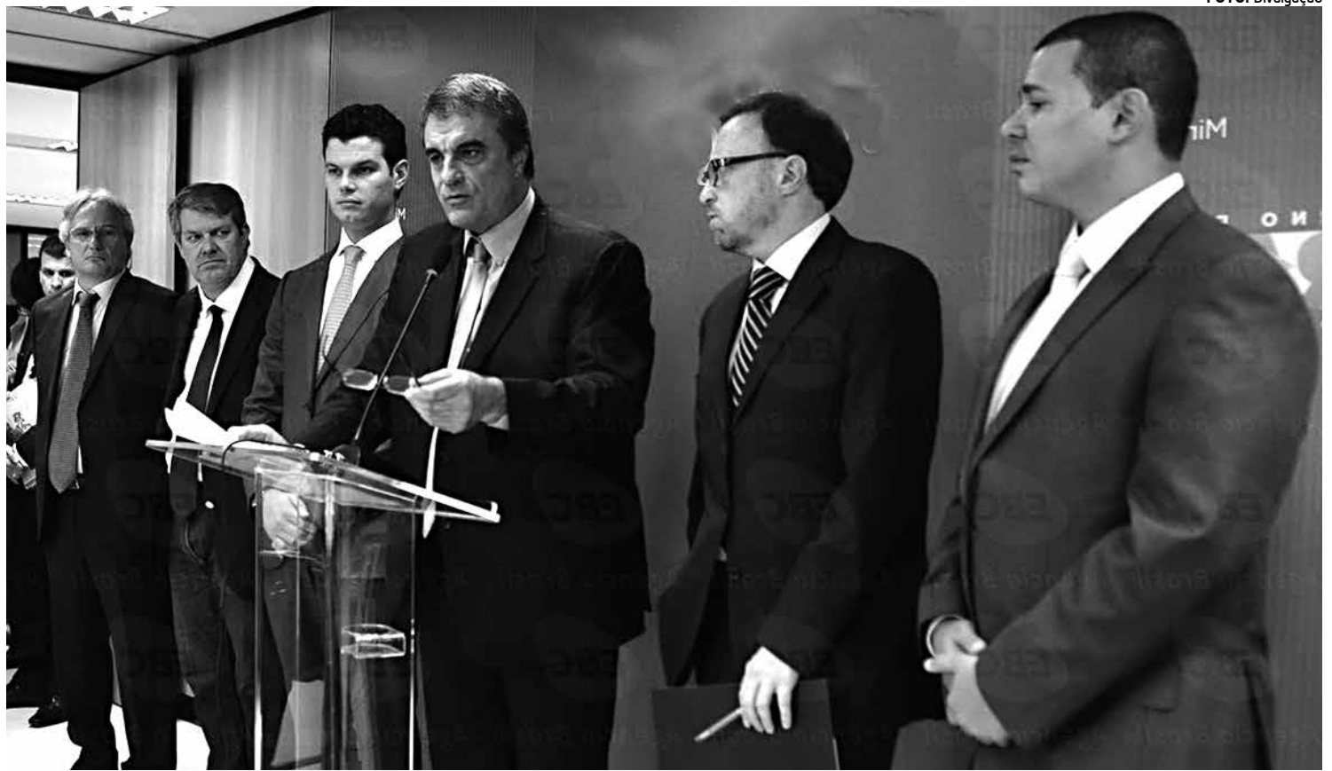
O ministro da Justiça, José Eduardo Cardozo, discutiu ontem o projeto de lei para conter a violência em manifestações de rua

O conteúdo da lei está sendo alinhavado e será objeto de apreciação pelo governo.