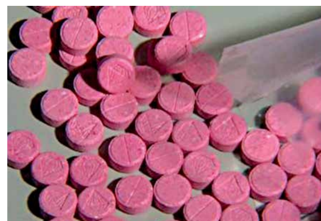
Metoxetamina é droga recreativa com efeito estimulante

A lista completa das 89 substâncias consideradas de uso proibido deve ser publicada hoje, no Diário Oficial da União, e será disponibilizada também no site da Anvisa. A última atualização da lista havia sido feita pela agência em 2012.