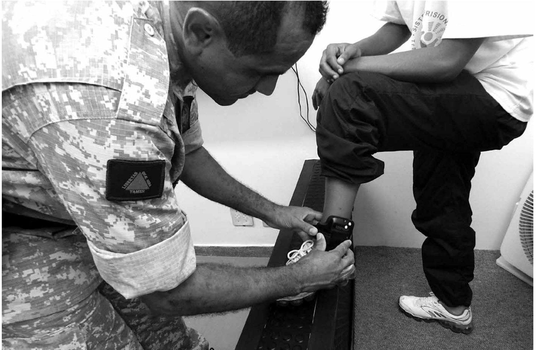
Uso de tornozeleira é uma opção que vem sendo adotada por juízes em casos de apenados que se encontram em livramento condicional ou regime semiaberto

Além de evitar que tais pessoas entrem em contato com o ambiente estigmatizante das prisões, as alternativas penais também geram economia aos cofres públicos. Enquanto um preso custa, em média, R$ 1,8 mil por mês, o monitoramento eletrônico de uma pessoa pode custar entre R$ 200,00 e R$ 600,00, dependendo do estado e dos termos contratuais da empresa que fornece os equipamentos.