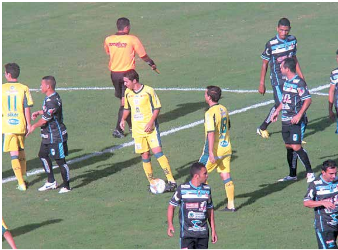
O CSP vai enfrentar o Santa Cruz, no Almeidão; enquanto o Sport Campina vai jogar em Cajazeiras