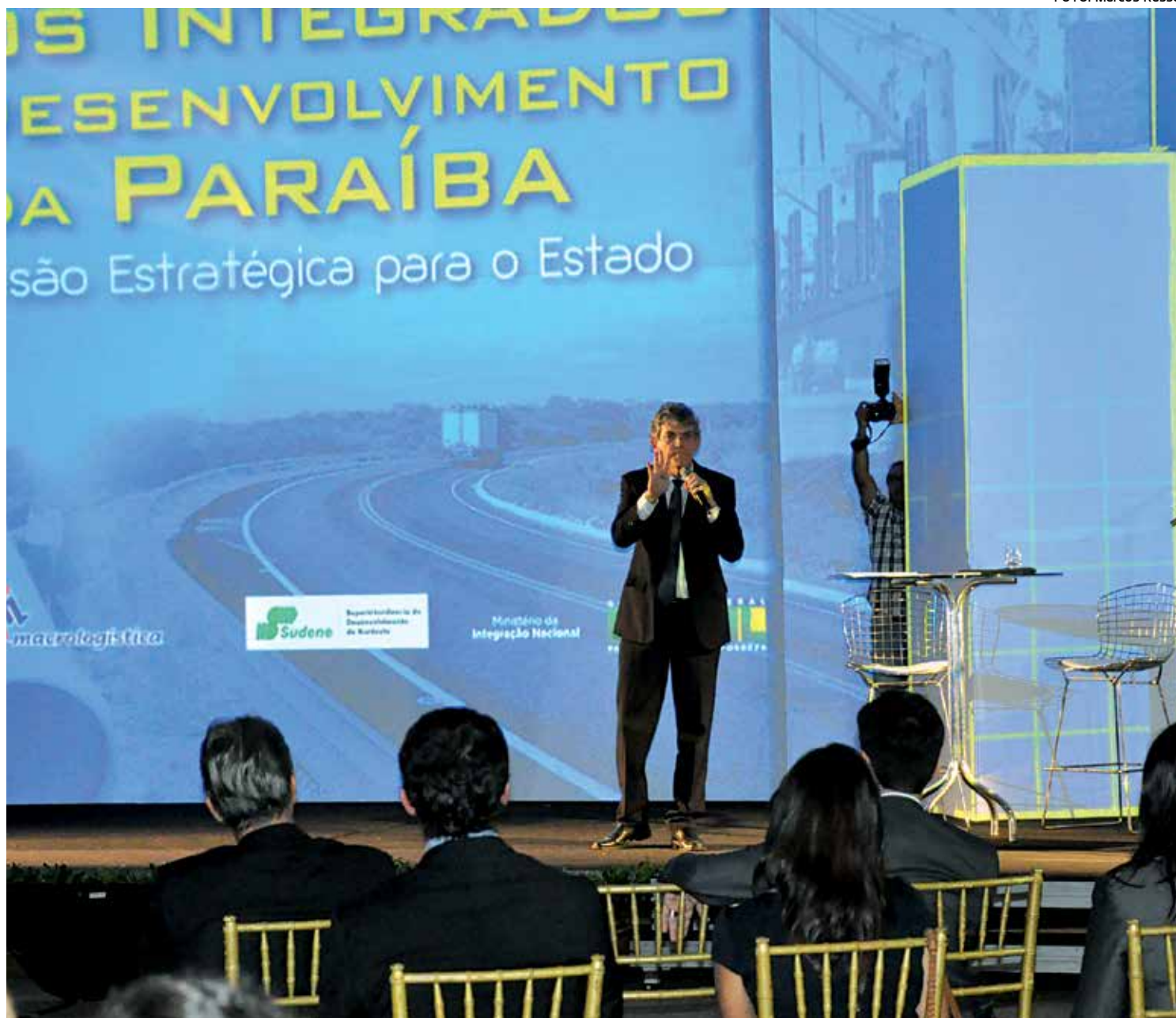
Governador Ricardo Coutinho apresentou o projeto "Eixo Integrado de Desenvolvimento da Paraíba", no Centro de Convenções

Ricardo adiantou que nestes três anos de governo não estão sendo investidos em toda a Paraíba, da região do Litoral ao Sertão, quase R$ 7 bilhões em obras, nas mais diversas áreas, como na construção de hospitais, mineração, turismo, ampliação de 600 leitos em casas