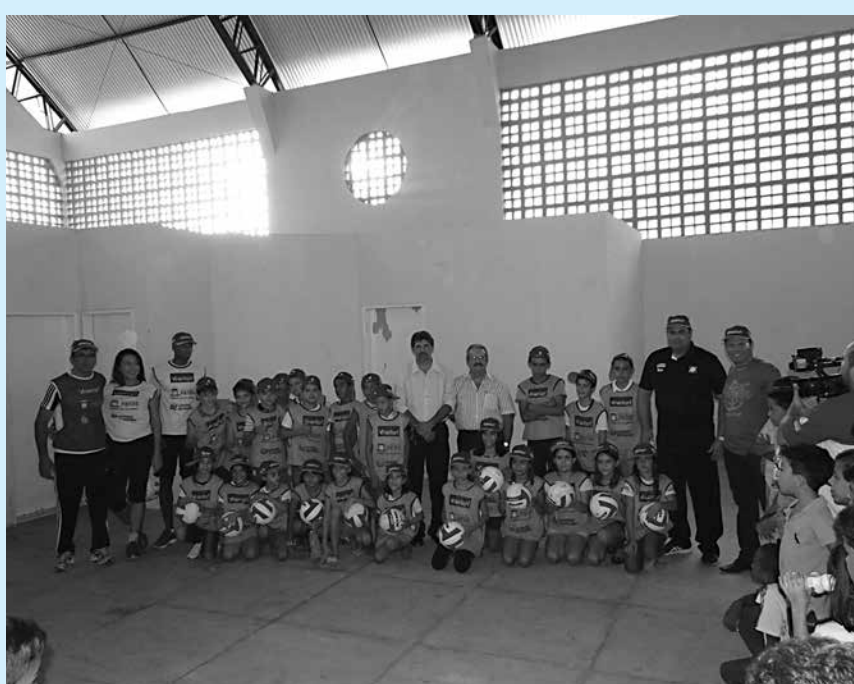
Projeto Viva Vôlei na Paraíba é uma parceria da CBV com o Governo do Estado