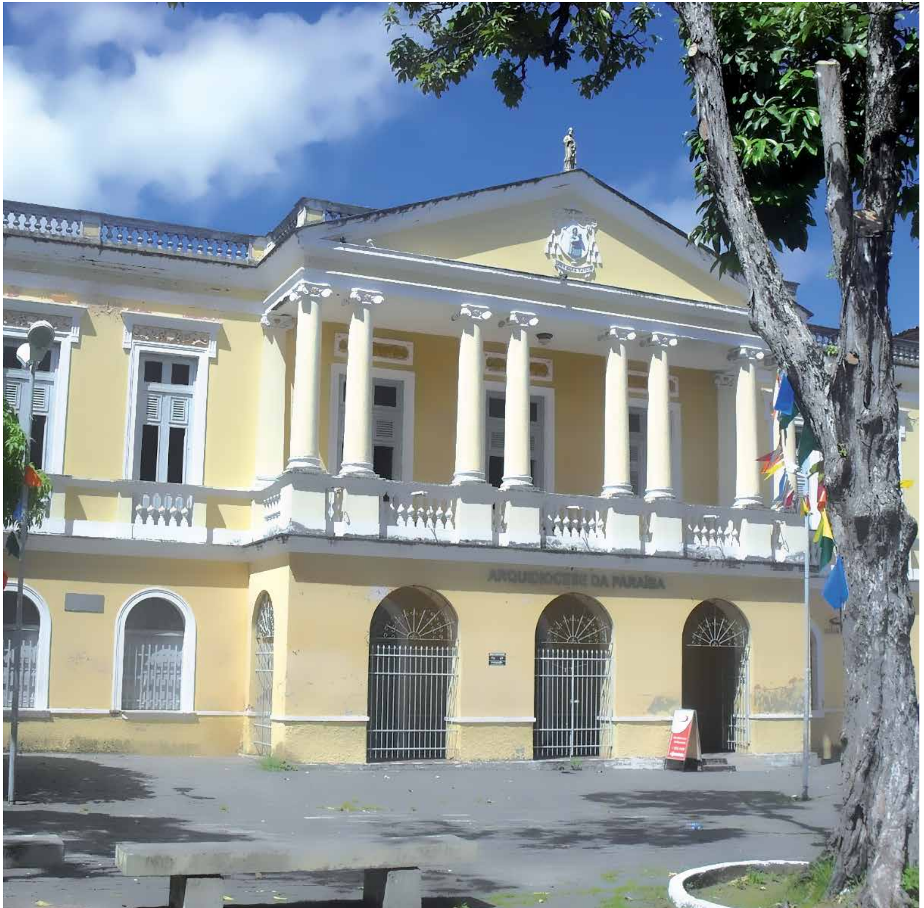
Mais conhecido como Palácio do Bispo pelos pessoenses, o belo e secular prédio abriga atualmente a centenária Arquidiocese da Paraíba

Dom Aldo relembra ainda que os valores cristãos devem permeiar a sociedade, e cita um trecho do Evangelho de Mateus, o primeiro livro do Novo Testamento. "A Igreja sugere que os valores antropológicos cristãos permeiem as políticas estruturantes voltadas ao desenvolvimento integral da população, fazendo o bem, cultivando o amor solidário e fraterno aos semelhantes, evitando prejudicar quem quer que seja, como Jesus ensina: 'Façam aos outros, o que querem que eles façam a vocês' (Mt. 7:12)".