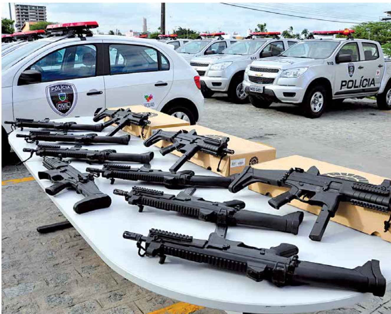
Governo reforça policiamento com novas armas e viaturas PÁGINA 3

▶ Mais de 300 pessoas trabalham para o sucesso do Circuito de Vôlei PÁGINA 16