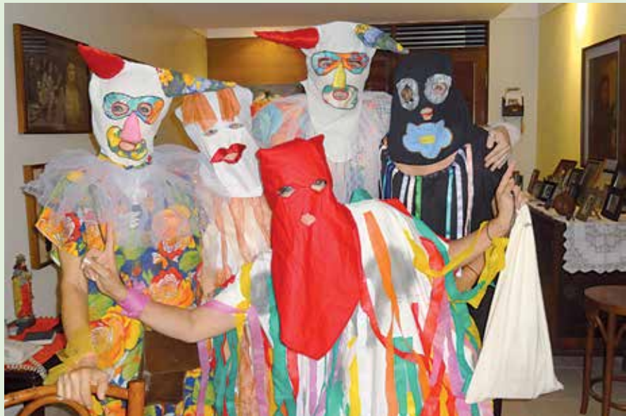
Grupo de amigos que há 25 anos se prepara para sair no bloco das Piabas