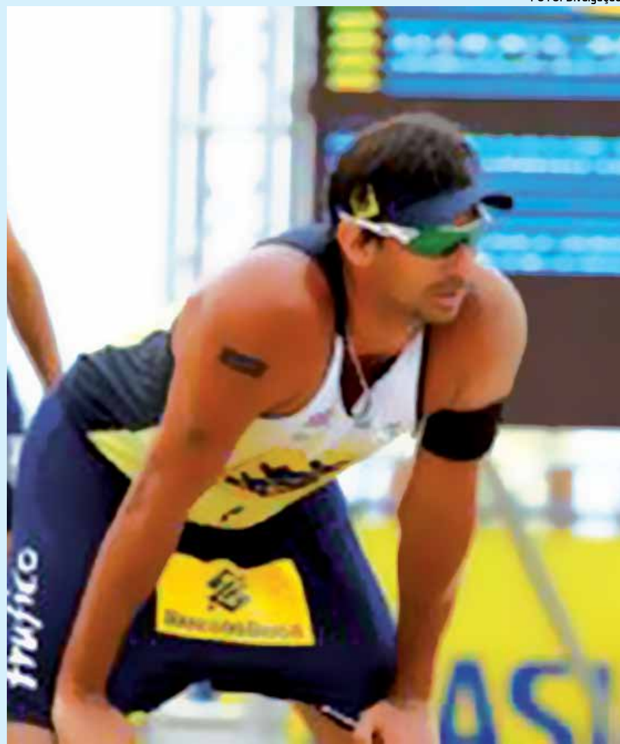
O baiano que reside na capital, Ricardo, conseguiu a classificação para as quartas

Os confrontos de hoje, a partir das 11h, são os seguintes, Alison/Bruno Schmidt (ES/DF) x Bernat/Ferramenta (RJ); Oscar/Fernandão (RJ/ES) x Evandro/Vitor Felipe (RJ/PB); Ricardo/Márcio (BA/CE) x Luciano/Edson Filipe (PB/ES); e Emanuel/Pedro Solberg (PR/RJ) x Bruno/Hevaldo (AM/CE). No feminino a Paraíba ficou de fora, com os confrontos a partir das 10h, das duplas, Ágatha e Bárbara Seixas (PR/RJ) x Talita/Tatiana (AL/CE); Maria Clara/Carol (RJ) x Lili/Duda (ES/SE); Val/Ângela (RJ/DF) x Juliana/Maria Elisa (CE/PE); e Vivian/Josi (PA/SC) x Elize Maia/Fernanda Berti (ES/RJ).