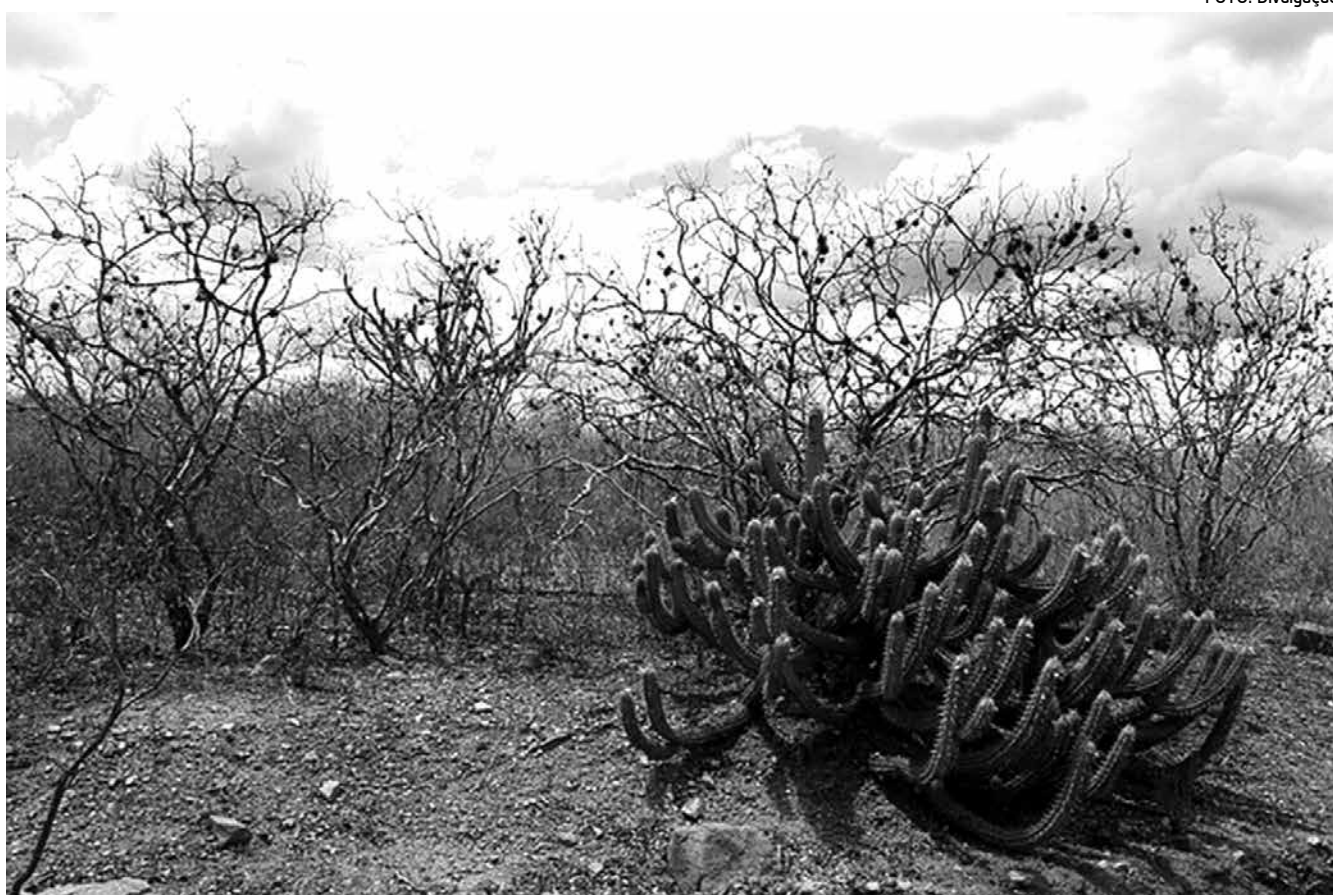
Caatinga será alvo de novas expedições e estudos em Ecologia, Botânica, Zoologia e Socioecologia por pesquisadores

Pesquisadores da Floresta Nacional (Flona) da Restinga de Cabedelo (PB), da Universidade Federal da Paraíba (UFPB), da Universidade Federal de Pernambuco (UFPE) e da Universidade Federal do Vale do São Francisco (Univasf) participaram da expedição Catingueira 2014, que percorreu quase quatro mil quilômetros entre o Oeste de Pernambuco, o Sul do Piauí e o Norte da Bahia.