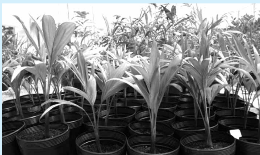
Emater e Emepa participaram da doação que visa recompor o plantio na região

Nesta primeira etapa, foram cadastrados agricultores de 19 associações. A distribuição foi programada em duas etapas: a primeira nessa quinta-feira, quando os agricultores receberam 2.200 mudas de caju e 230 de goiaba, e a segunda na primeira quinzena de março, com a entrega de mais 2.800 mudas de caju, 770 de goiaba e 3.000 de maracujá. O objetivo é ajudar