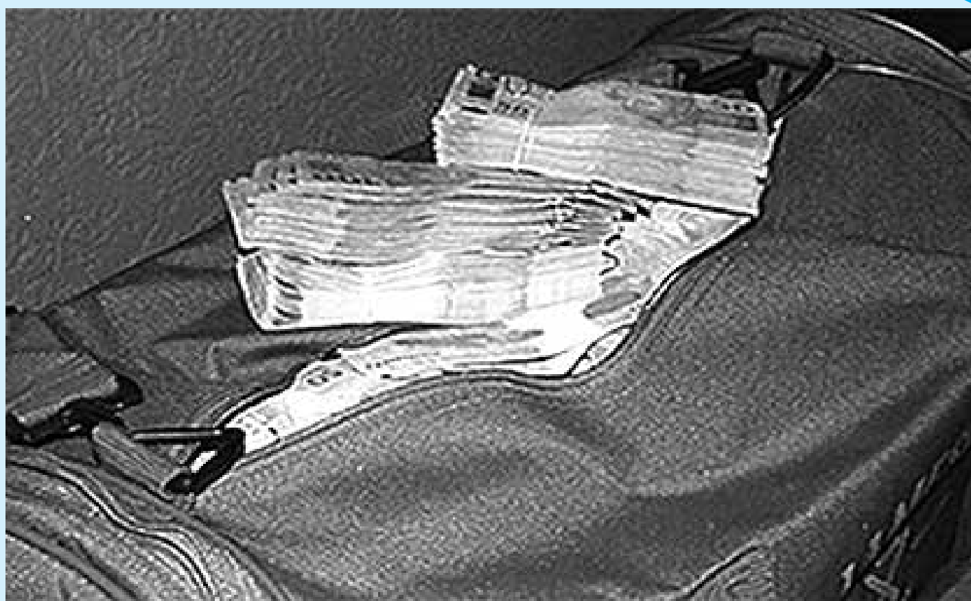
A Polícia Federal apreendeu uma mala cheia de dinheiro durante a Operação Carmelina contra os advogados, no Rio Grande do Sul

Em relação à balança comercial, o Banco Central prevê recuperação nos próximos meses e estima superávit de US$ 10 bilhões em 2014, contra superávit de US$ 2,5 bilhões observado em 2013.