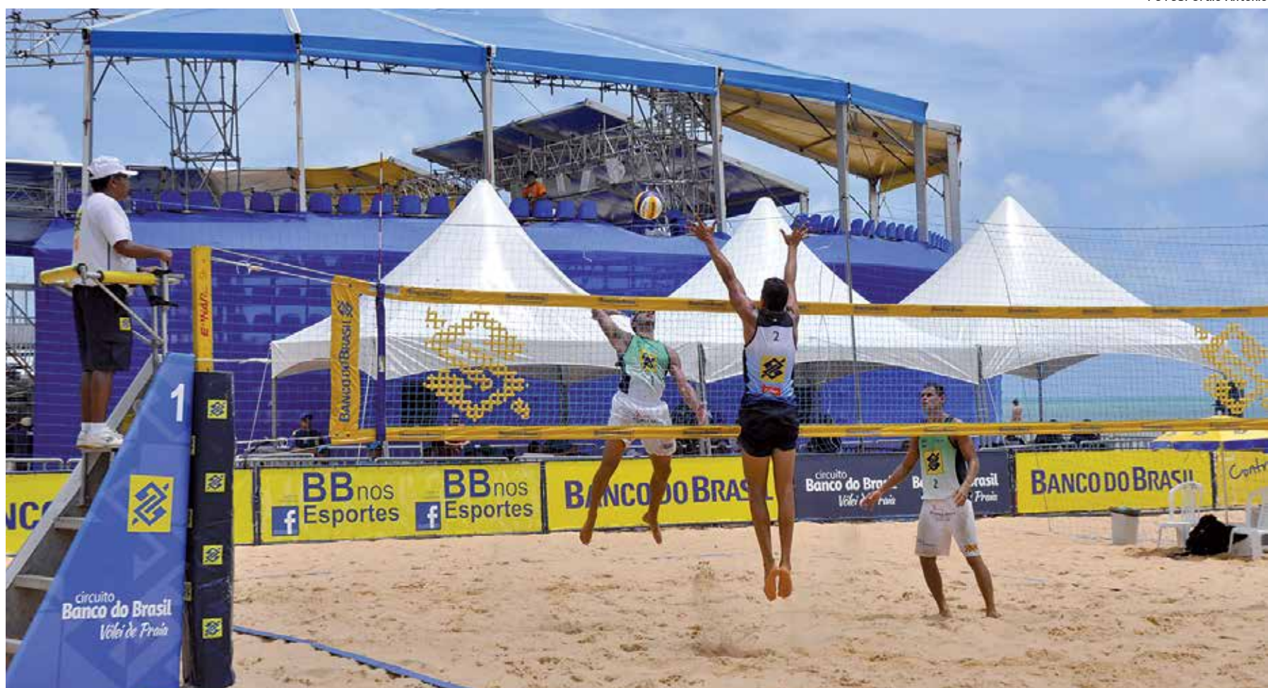
A fase nacional foi concluída na quinta-feira e os jogos foram realizados fora da arena principal, que sedia desde ontem a etapa Open do Circuito Banco do Brasil