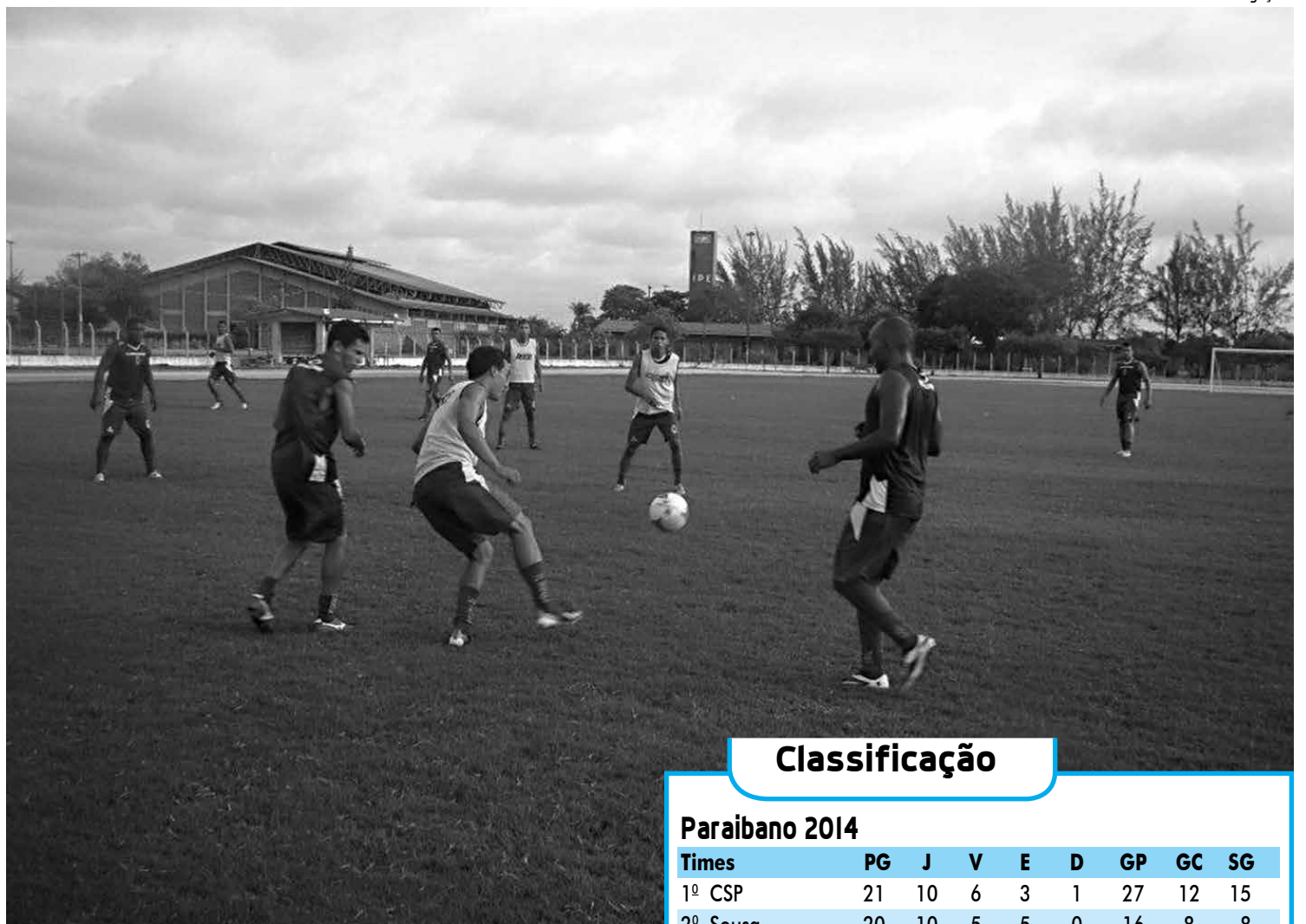
O CSP, treinando no campo do Unipê, lidera o Paraibano com 21 pontos e hoje é favorito contra a Queimadense no Amigão

Já a Queimadense caminha rumo a Segundona, ao lado do Sport Club Campina Grande, os dois últimos co-