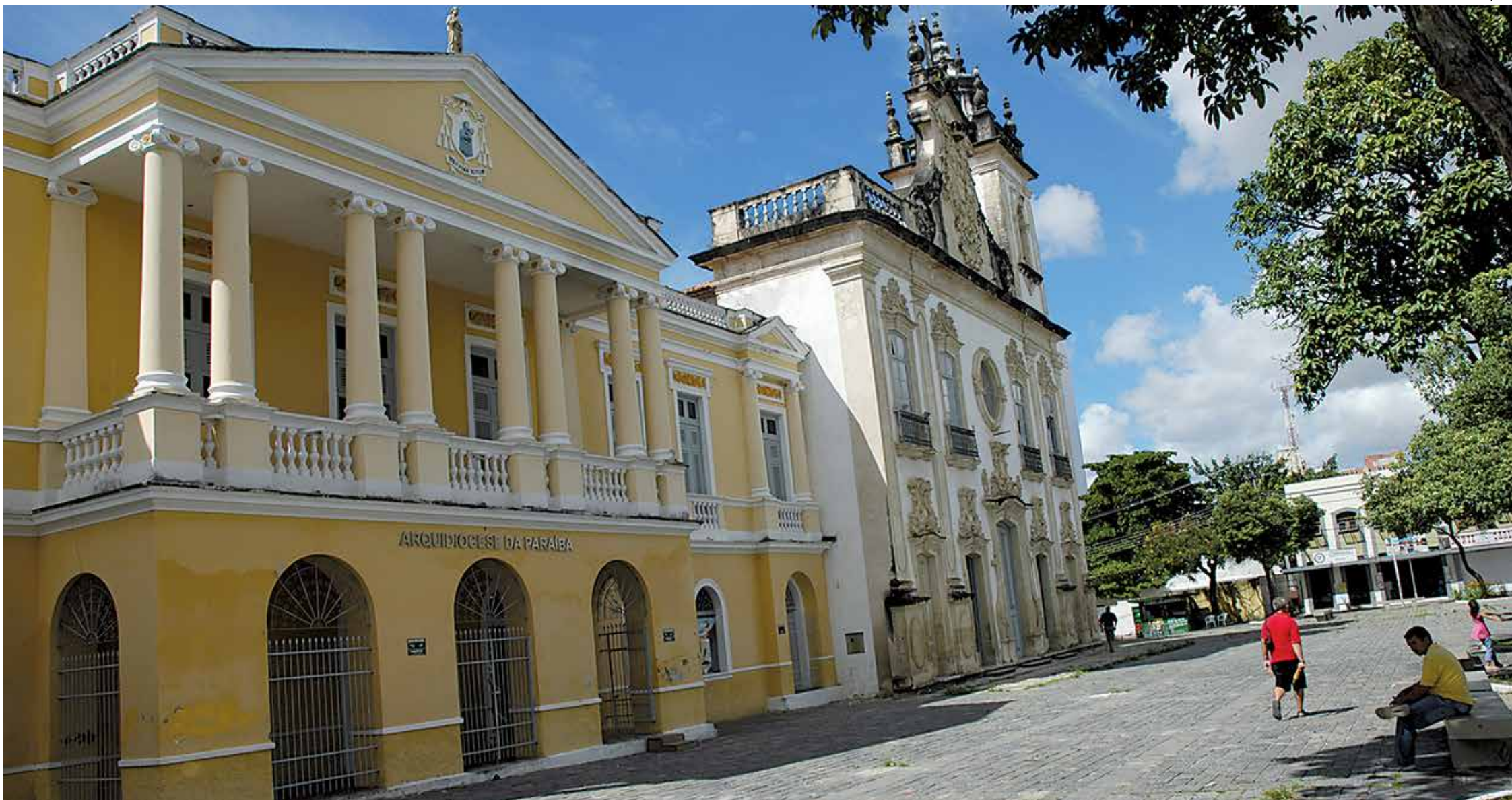
Arquiocese da Paraíba (foto) comemora centenário hoje com missa na Igreja de São Francisco PÁGINA 9