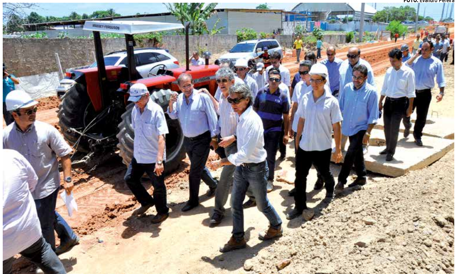
Governador Ricardo Coutinho visitou ontem as obras de pavimentação das vias localizadas no entorno do futuro Trevo de Mangabeira

“Nos próximos dias meu desejo é estar assinando a licitação do Viaduto do Geisel, ou seja, tudo aquilo que projetamos está acontecendo. Temos ainda a duplicação da Avenida Cruz das Armas que é uma obra lenta por causa das desapropriações, por conta do posteamento que já foi retirado, e a Perimetral Sul que ainda está pouco visível, no lado leste da cidade, mas vai ligar a BR 101 até a PB 008. A Perimetral Sul vai fazer com que quem venha do Recife ou do Distrito Industrial não tenha que seguir até o Viaduto Sonrisal para poder acessar o Valentina Figueiredo”.