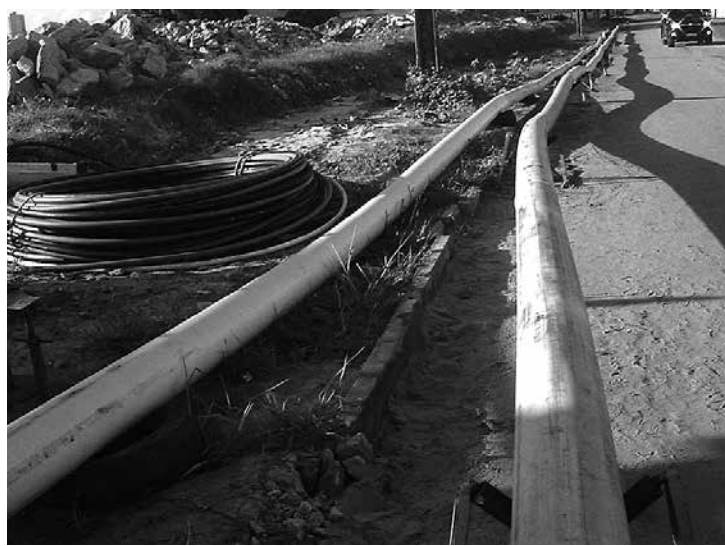
Ramal com tubulações de gás natural da PBGás já instaladas

Vilarim acrescentou que com a conclusão dessa primeira fase da obra deverão ser atendidas 945 unidades residenciais, além de 19 empreendimentos comerciais, incluindo os Shoppings Boulevard e Luiza Motta. O único estabelecimento comercial atendido pela PBGás em Campina Grande é o restau-