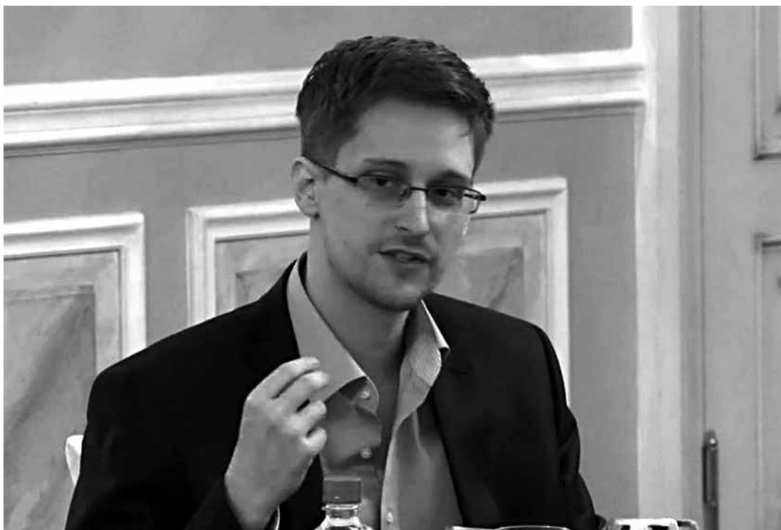
O ex-analista da NSA, Edward Snowden, fez graves denúncias sobre espionagem contra os EUA

O ministro russo das Relações Exteriores, Serguei Lavrov, considerou ontem que a situação está prestes a “escapar a qualquer controle” na Ucrânia e denunciou o apoio “indecente” dado, segundo ele, à oposição pelos europeus. Estes acusam o poder ucraniano de ter provocado a escalada da violência, adotando leis repressivas contra os manifestantes.