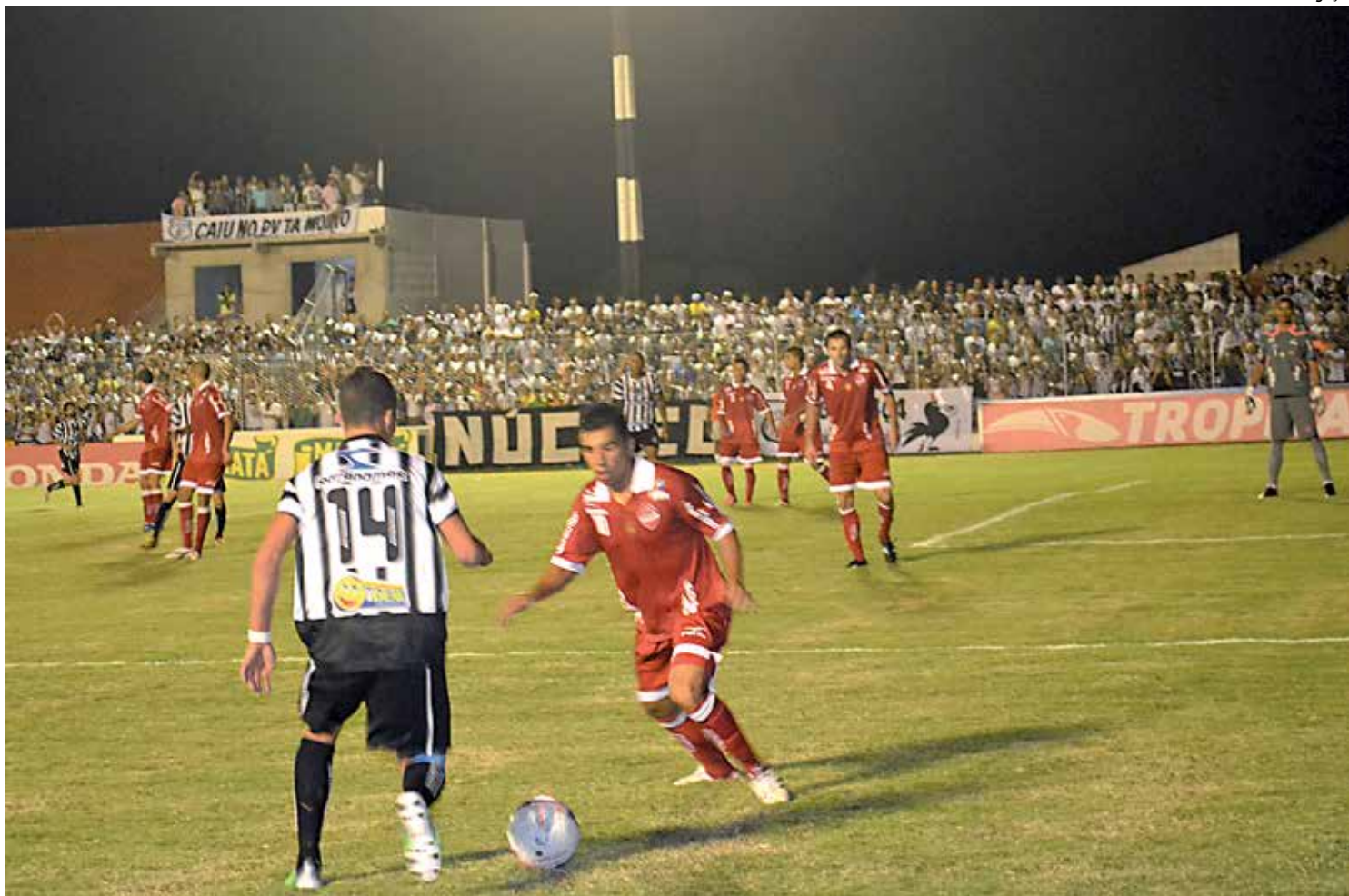
O Galo vai estreiar em casa diante de seu torcedor hoje pela Copa do Nordeste com o objetivo de conquistar a sua primeira vitória

Os ingressos para o jogo custam R$ 20,00 na geral, R$ 30,00 na arquibancada principal e R$ 60,00 nas cadeiras e podem ser comprados na loja do clube, no centro da cidade ou nas bilheterias do Estádio Presidente Vargas.