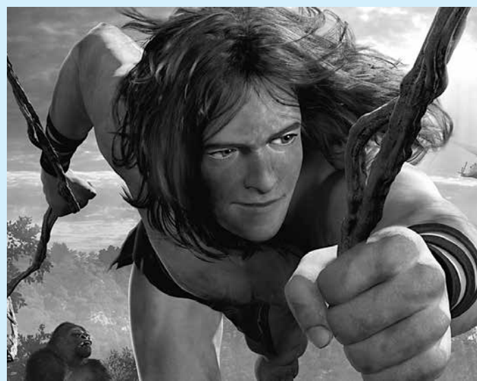
Animação alemã reconta a história do rei da selva