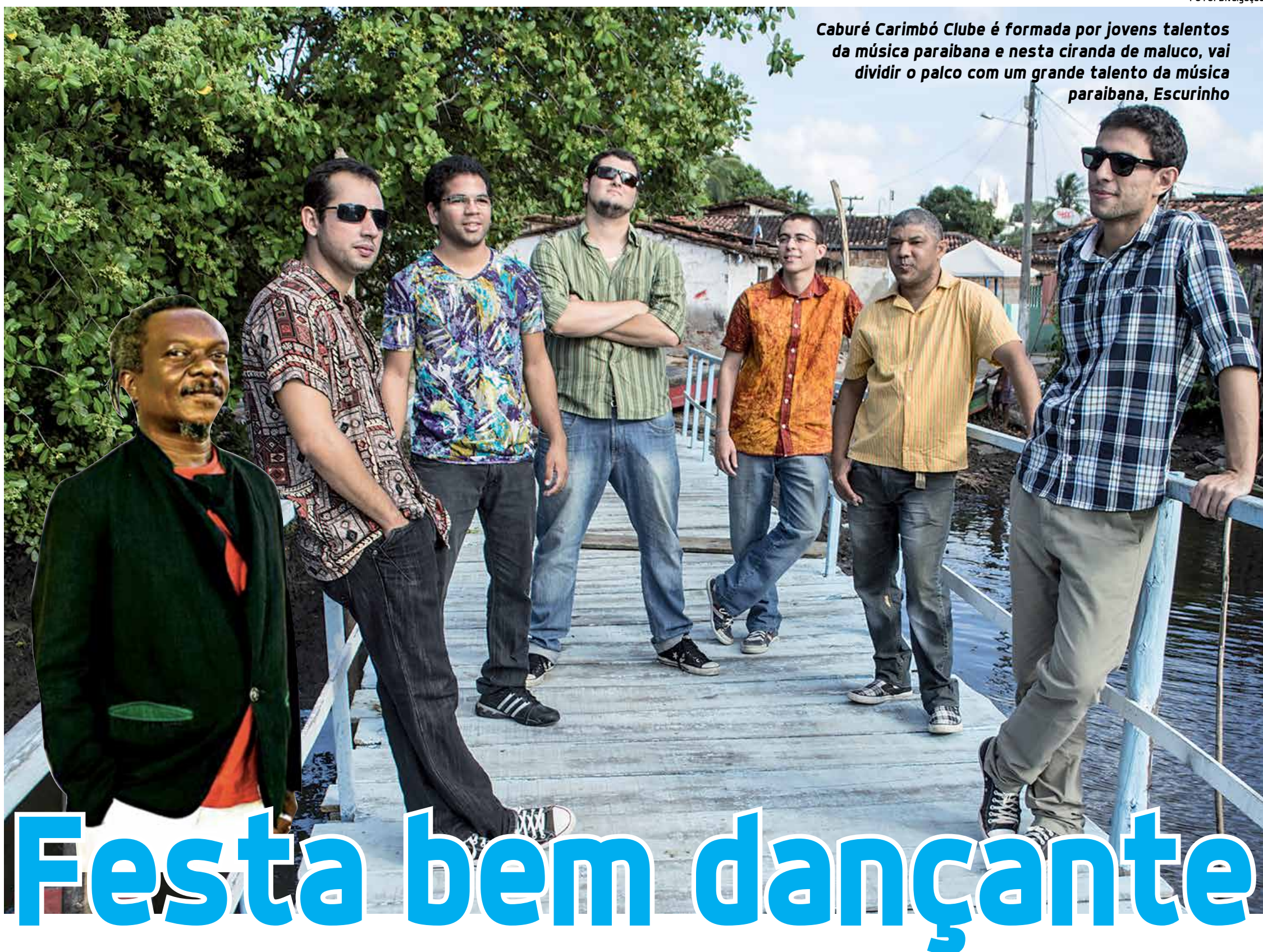
Caburé Carimbó Clube é formada por jovens talentos da música paraibana e nesta ciranda de maluco, vai dividir o palco com um grande talento da música paraibana, Escurinho