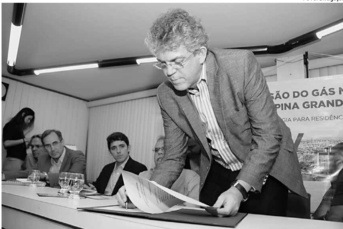
Governador Ricardo Coutinho assinando documento que autoriza a construção da rede de gás natural

Ele ainda ressaltou que, graças às boas condições e à organização da PBGás, está expandindo o sistema em Campina Grande, que será a primeira cidade do interior nordestino com uma rede de 10 km de gás natural que disponibiliza boas condi-