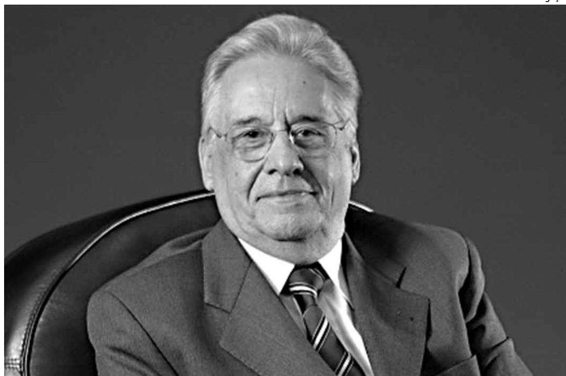
FHC diz que cita Eduardo porque não está pensando partidariamente, mas sim historicamente

Perguntado se disputaria a Presidência se ainda fosse mais jovem, ele disse que sim e justificou: "Disputaria porque eu estou com vontade de mudar", respondeu o octagenário cacique tucano. "O Brasil está preci-