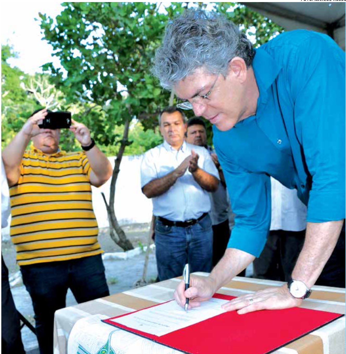
Governador Ricardo Coutinho assina a autorização para abertura de licitação para construção do Viaduto do Geisel

O governador Ricardo Coutinho assinou ontem a Autorização para Abertura de Processo Licitatório para a construção do Viaduto do Geisel, em João Pessoa. Investimento é de mais de R$ 31 milhões. PÁGINA 4