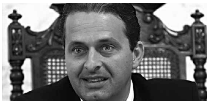
Eduardo Campos (PSB) é governador de PE no segundo mandato