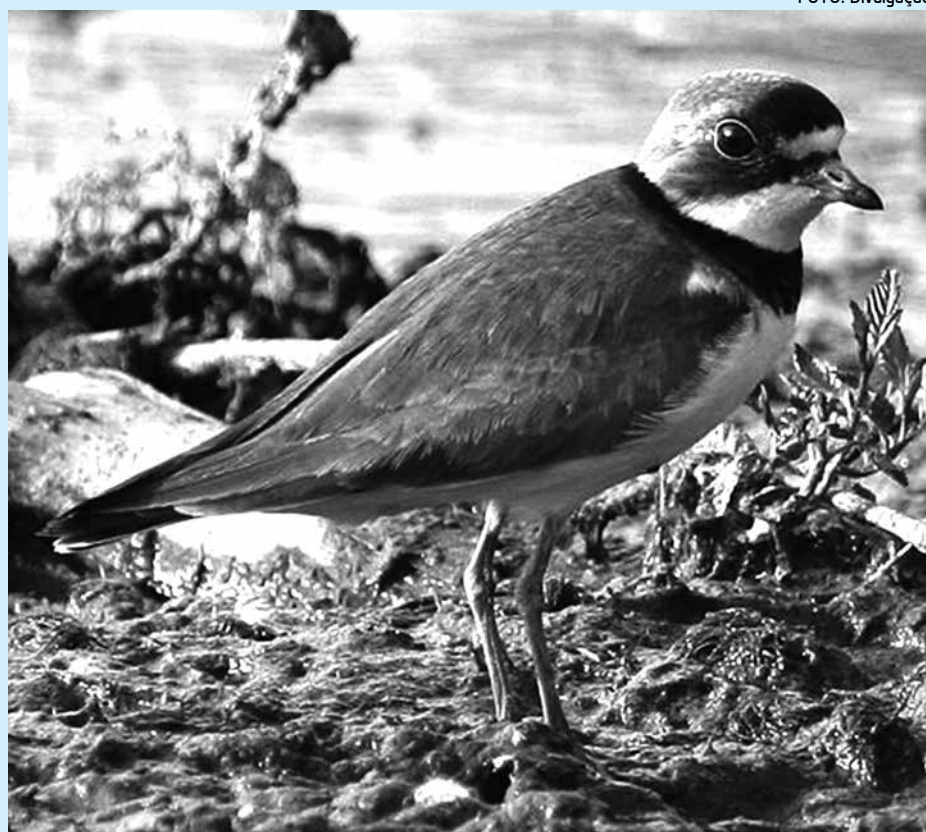
Comportamento incomum de maçarico migratório despertou atenção de pesquisadores