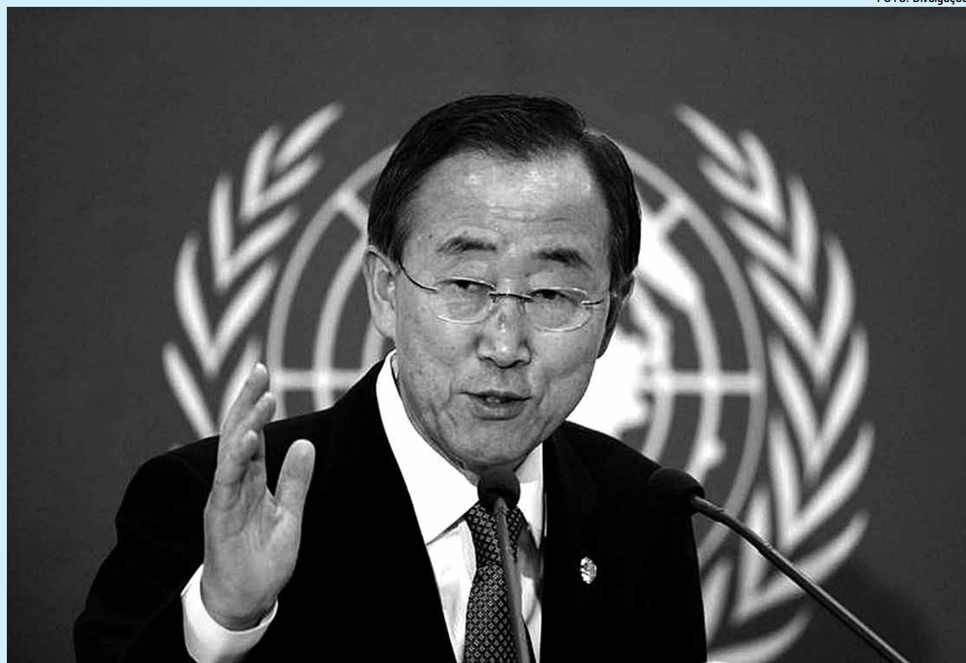
O secretário-geral da ONU, Ban Ki-moon, definiu os membros de uma comissão que vão participar de investigação no país

O restante será voltado a ações sociais, projetos de investimentos e compromissos internacionais.