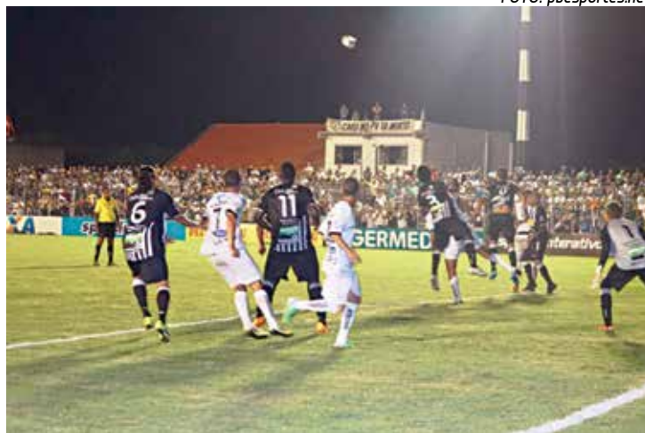
O Treze perdeu duas partidas neste início de Copa do Nordeste

durante o jogo, e em alguns momentos fomos até superiores ao adversário em campo. Notamos uma grande evolução em relação ao primeiro jogo, mas infelizmente saímos derrotados, com um gol no final da partida, em um descuido na saída de bola", disse o treinador.