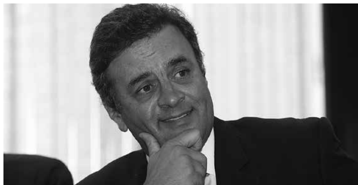
Aécio Neves (PSDB) é senador e ex-governador de Minas Gerais

Sem ilusões quanto à dificuldade da disputa, ele celebra uma novidade: "Pela primeira vez, houve um deslocamento de blocos do governo. Tanto a Marina quanto o Eduardo saem do bloco do governo e vão pro outro lado", afirmou. "A campanha vai forçar uma certa radicalização".