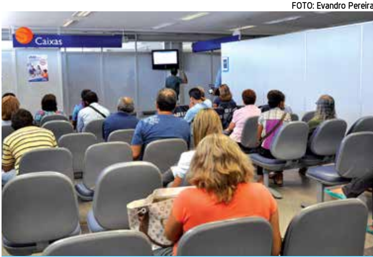
Segurado deve se dirigir ao banco onde recebe o benefício

Para os titulares que não podem se deslocar até a agência, a renovação poderá ser