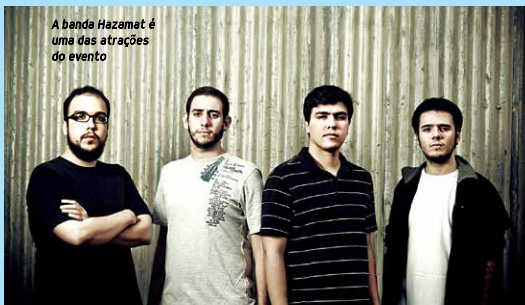
A banda Hazamat é uma das atrações do evento

evento é a Soturnus, que realizou turnê por várias capitais nordestinas e interior, incluindo a participação em alguns festivais, destacando-se as edições do "ForCaos", em Fortaleza (CE). Criado no ano 2000, possui, na bagagem, duas demos, cujos títulos são Poems of Love... Poems of Pain... (2001) e Solitude (2006), além de dois CDs: When Flesh Becomes Spirit (2008) e Of Everything That Hurts (2013).