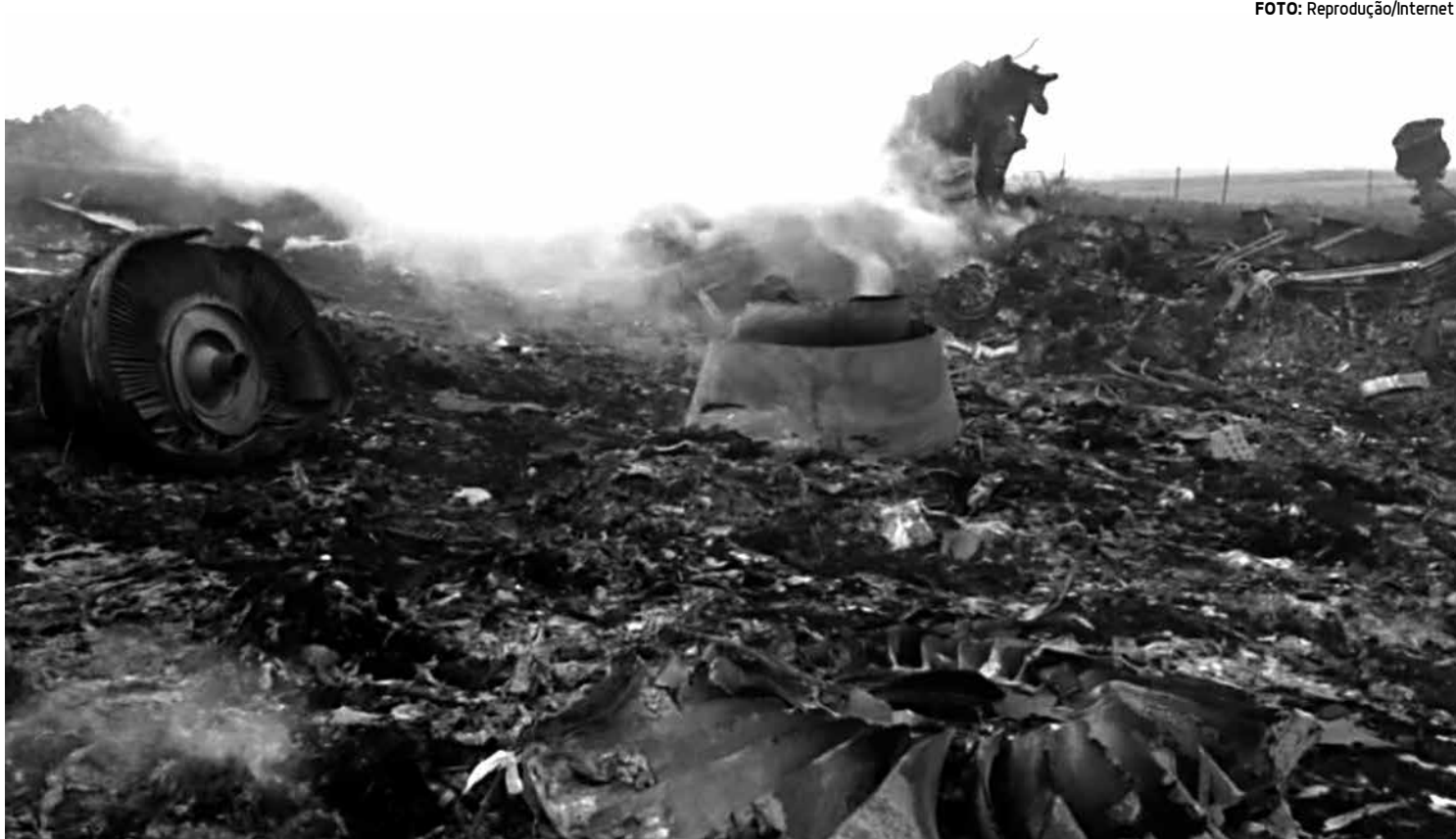
Cidadãos dos Estados Unidos, Holanda e Alemanha estão entre as vítimas. Segundo o governo da Ucrânia, todos a bordo morreram

Oficiais de defesa da Ucrânia disseram que o trabalho na região de Donetsk, onde o avião caiu, é difícil em razão dos destroços espalhados por áreas extensas. As buscas também são