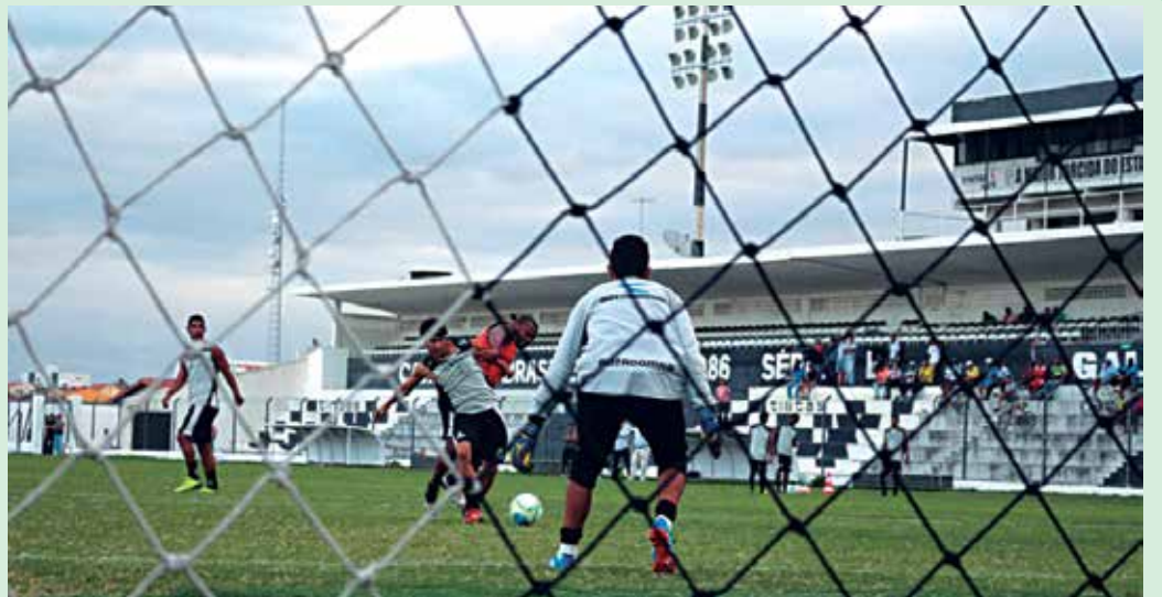
Ontem, o Treze voltou a treinar forte para não ser surpreendido pela equipe cearense