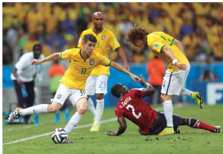
A Seleção Brasileira que fracassou na Copa do Mundo continua sem treinador

"Não é o momento. Acho que é o momento de buscar na nossa casa alguém que tenha esse conhecimento dos nossos problemas e do