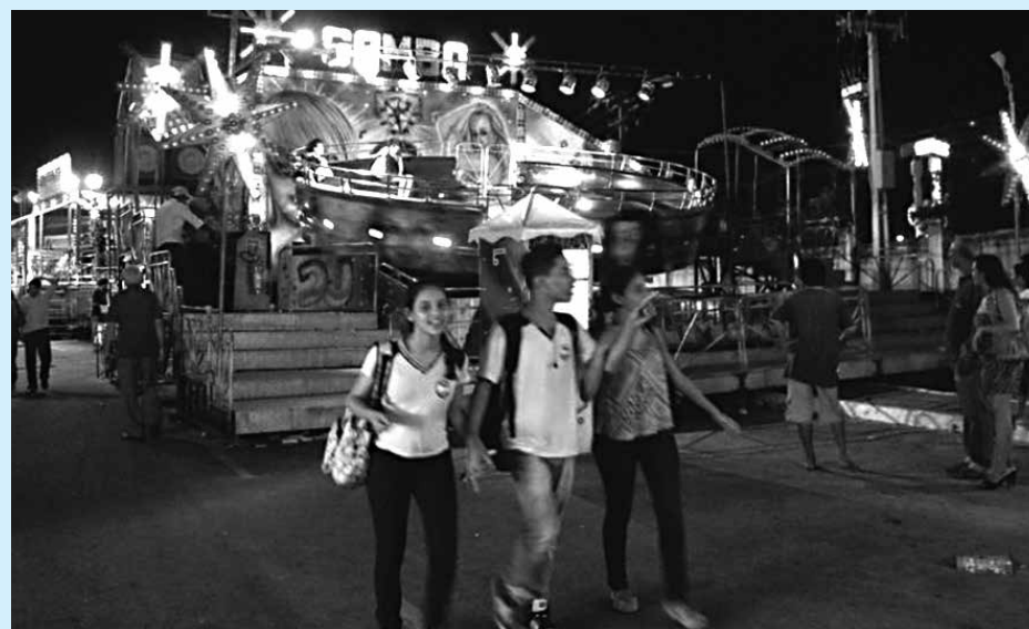
Parques de diversões é uma das principais características Festa das Neves

A festa é um evento que homenageia a padroeira de João Pessoa, Nossa Senhora das Neves, e reúne uma programação religiosa e profana. São diversas atrações, desde os parques de diversão, até as barracas de comidas e bebidas, que oferecem às pessoas guloseimas como a maçã-do-amor e o churrasquinho. A festa ainda reserva um espaço para apresentações musicais, cultura popular, exposição fotográfica e espetáculos para crianças. A programação deste ano ainda será divulgada pela PMJP.