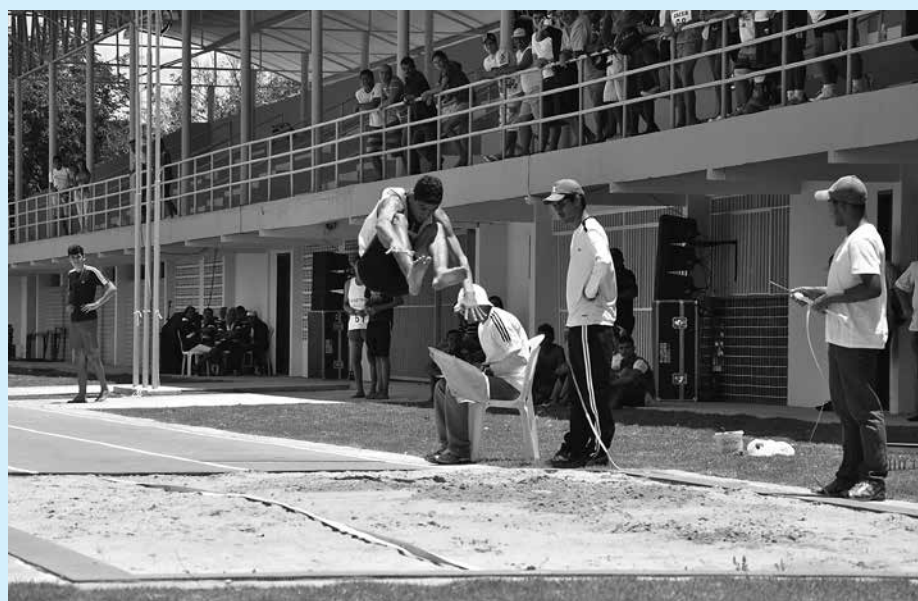
Salto em distância é uma das modalidades a ser disputada no Campeonato

Com base no regulamento previamente divulgado, os oito melhores atletas em cada prova, conquistam pontuação que valerão para o índice estadual. Serão agraciados com premiação especial os atletas (masculino e feminino) que obtiverem o melhor resultado técnico da competição, de conformidade com a decisão de uma comissão apontada pelas entidades participantes.