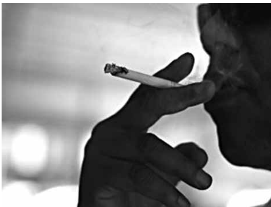
Custos de tratamento de doenças provocadas pelo tabaco chegam a R$ 21 bilhões

Segundo as autoras do estudo, com base em evidências científicas e por meio de firmes decisões políticas, há quase três décadas o Brasil vem implementando um conjunto de medidas de controle do tabaco efetivas e abrangentes. Entre essas políticas destacam-se: a proibição da publicidade de produtos derivados de tabaco; a obrigatoriedade de impressão de imagens e frases de advertência sobre os malefícios para a saúde nas embalagens dos produtos;