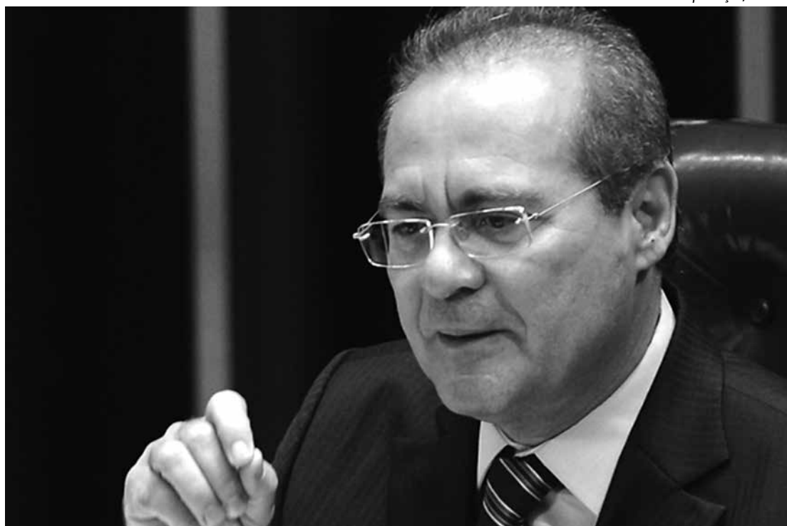
Para o senador Renan Calheiros (PMDB-AL), a decisão sobre o assunto não pode mais ser adiada

Nas próximas semanas, o ritmo no Congresso deve ser mais lento. Mesmo sem votarem o projeto da Lei de Diretrizes Orçamentárias (LDO) - condição constitucional para que ocorra o processo do primeiro semestre -