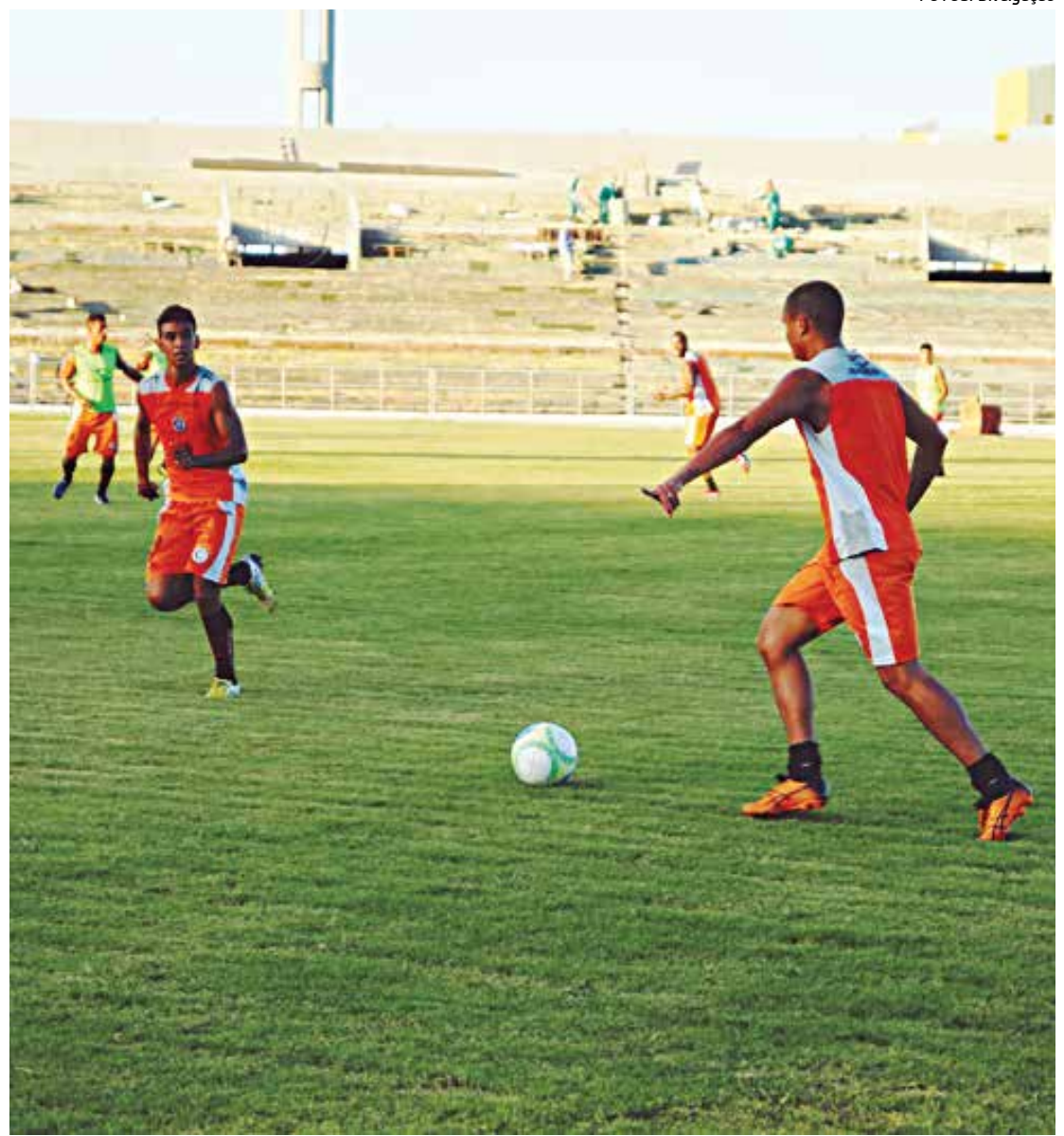
O Campinense, que não estreia na primeira rodada, continua em atividades para disputas da Série D

Pelotas-RS x Penapolense-SP, Remo-PA x Moto Club-MA Coruripe-AL x Jacuipense-BA Santos-AP x P. dos Solimões-AM Goianésia-GO x Operário-MT Porto-PE x Globo-RN Guarany-CE x River-PI Metropolitano-SC x B. Vista-RJ Vila Nova-MG x Brasiliense-DF Luziânia-GO x Tombense-MG Baraúnas-RN x Central-PE Itaporã-MS x Anapolina-GO; Nacional-AM) x Atlético-AC Rio Branco-AC x S. Raimundo-RR