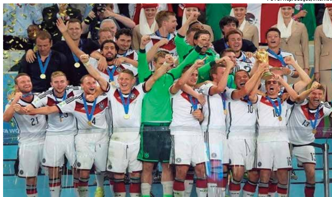
Tetracampeã mundial, a Alemanha comemora não só o título, mas a primeira posição no ranking