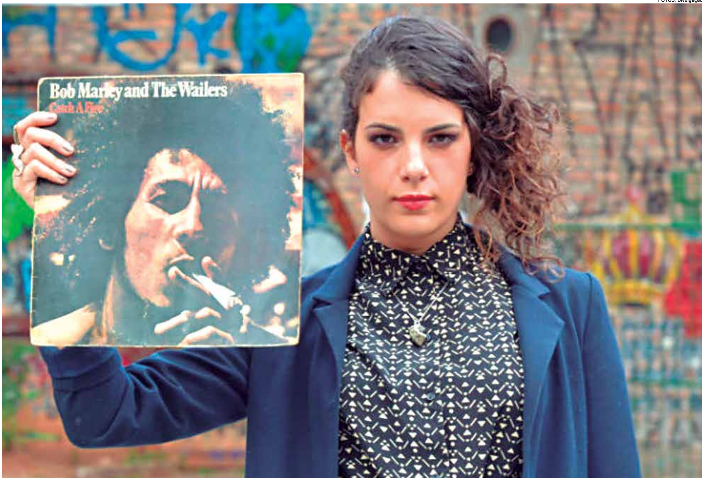
Céu está na Paraíba pela quarta vez e realizará novo show para o público, cantando clássicos do disco Catch a Fire , lançado em 1973 pelo rei do reggae, Bob Marley