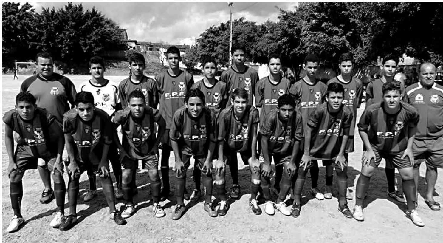
A equipe do Femar vem brilhando na Copa Paraíba Sub 15 e amanhã vai enfrentar o Botafogo, outra forte concorrente ao título