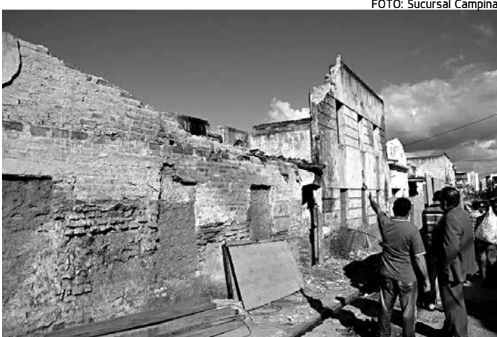
Parte da estrutura do prédio desabou no dia 3 deste mês