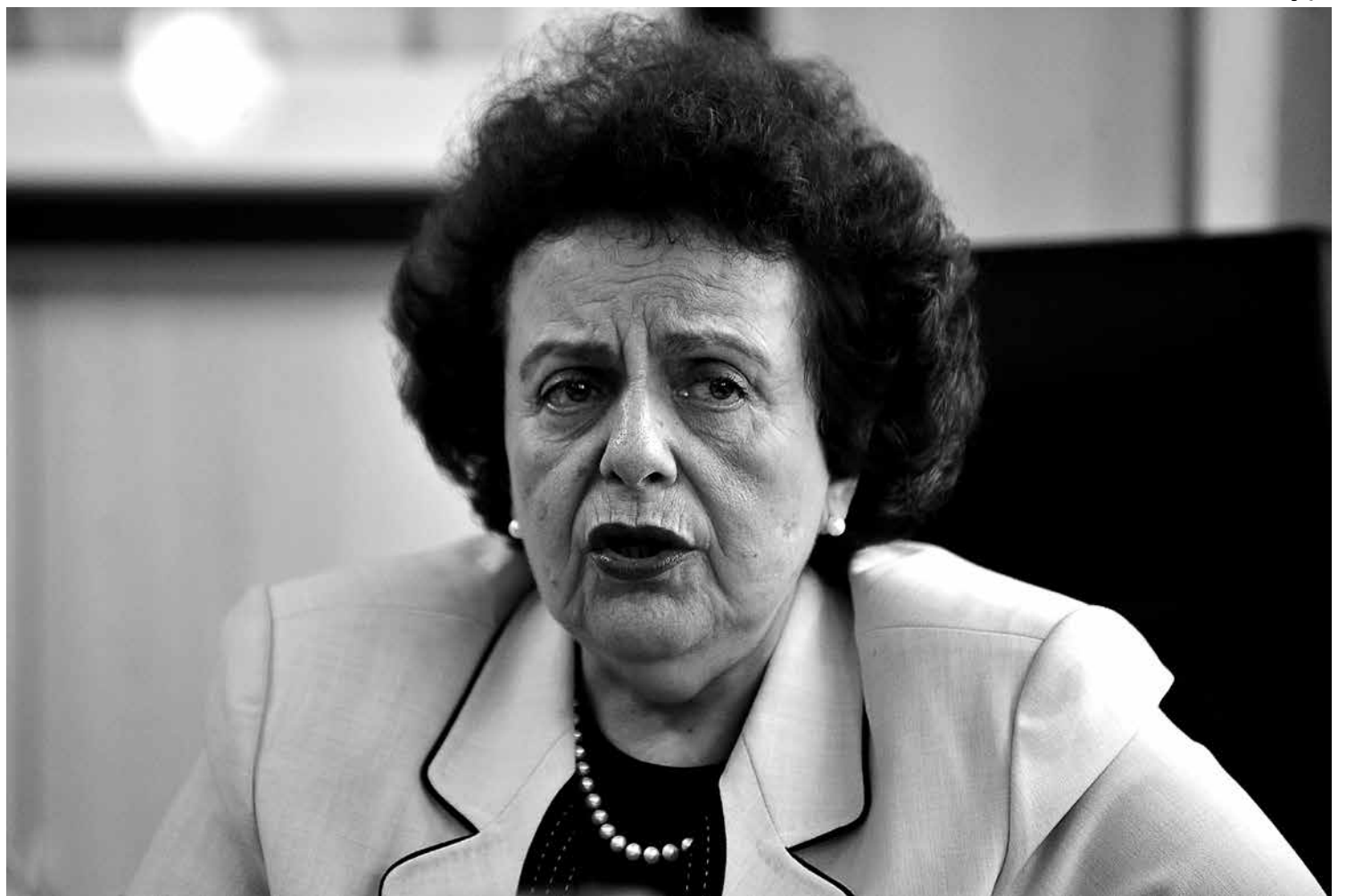
A ministra Eleonora Menicucci atribuiu o aumento das denúncias à campanha nacional "Violência contra as mulheres - Eu ligo"

Eleonora repudiou as vaia e ofensas à presidente Dilma Rousseff na abertura da Copa, na Arena Corinthians, o Itaquerão. "Foi lamentável, foi execrável. As mulheres