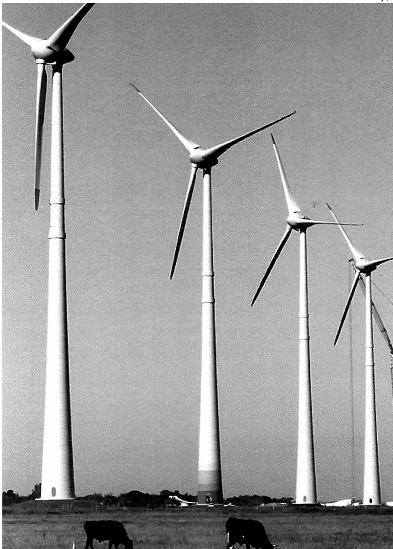
Geração eólica de energia conta com novo equipamento que permite controle mais efetivo da tensão na rede de transmissão

"A tecnologia atualmente empregada nos aerogeradores dispõe de equipamentos eletrônicos que requerem certo nível de robustez no ponto em que irão se conectar para garantir seu adequado funcionamento. E essa robustez é medida pela potência de curto-circuito do ponto de conexão", esclarecem os técnicos da Divisão de Proteção e Estudos do Sistema da Eletrosul.