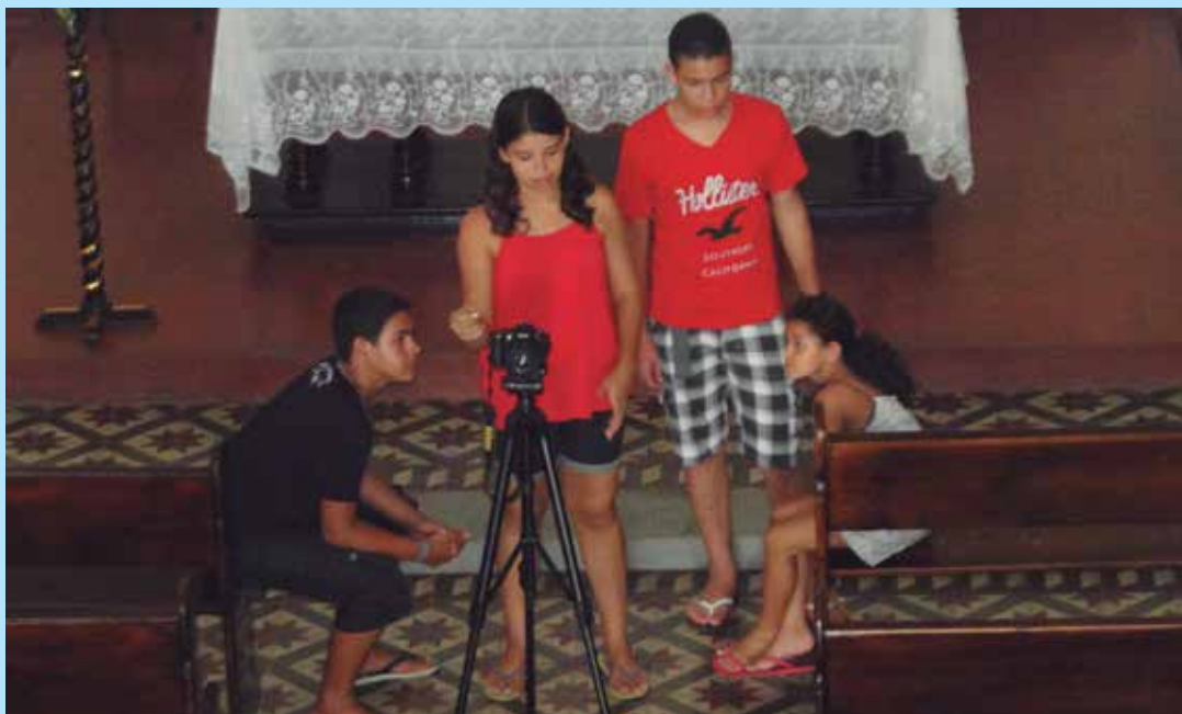
Imagem da equipe de produção do curta 'Recordar é viver', durante a etapa de captação de imagens

O projeto aconteceu durante duas semanas entre os meses de maio e junho de 2013, realizado pela Empresa de Serviços Culturais (Emserc), Associação Castelo Audiovisual e Prefeitura de Itabaiana. O idealizador e coordenador geral do Paraíba Cine Senhor destacou que a exibição dos cinco curtas culmina o sucesso do trabalho, que, além das produções, ainda incluiu oficinas e exibições de filmes e vídeos e quatro campanhas socioeducativas. Na ocasião, ainda foram prestadas homena-