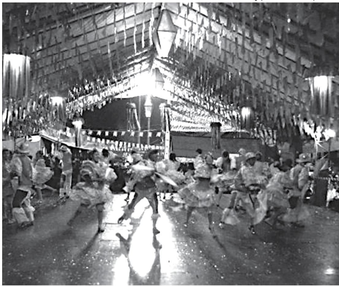
Contagem dos casais que formam a quadrilha, no Parque do Povo, foi feita pela empresa Rank Brasil

O evento de ontem, fez parte da programação do famoso São João de Campina Grande, mais conhecido como o Maior São João do Mundo. A festa começou na última sexta-feira, dia 6, e vai até o início do mês de julho. São esperadas durante todo o mês de festividades aproximadamente 2 milhões de pessoas.