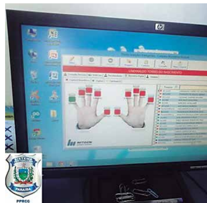
Sistema em experimento, já funciona em outros presídios