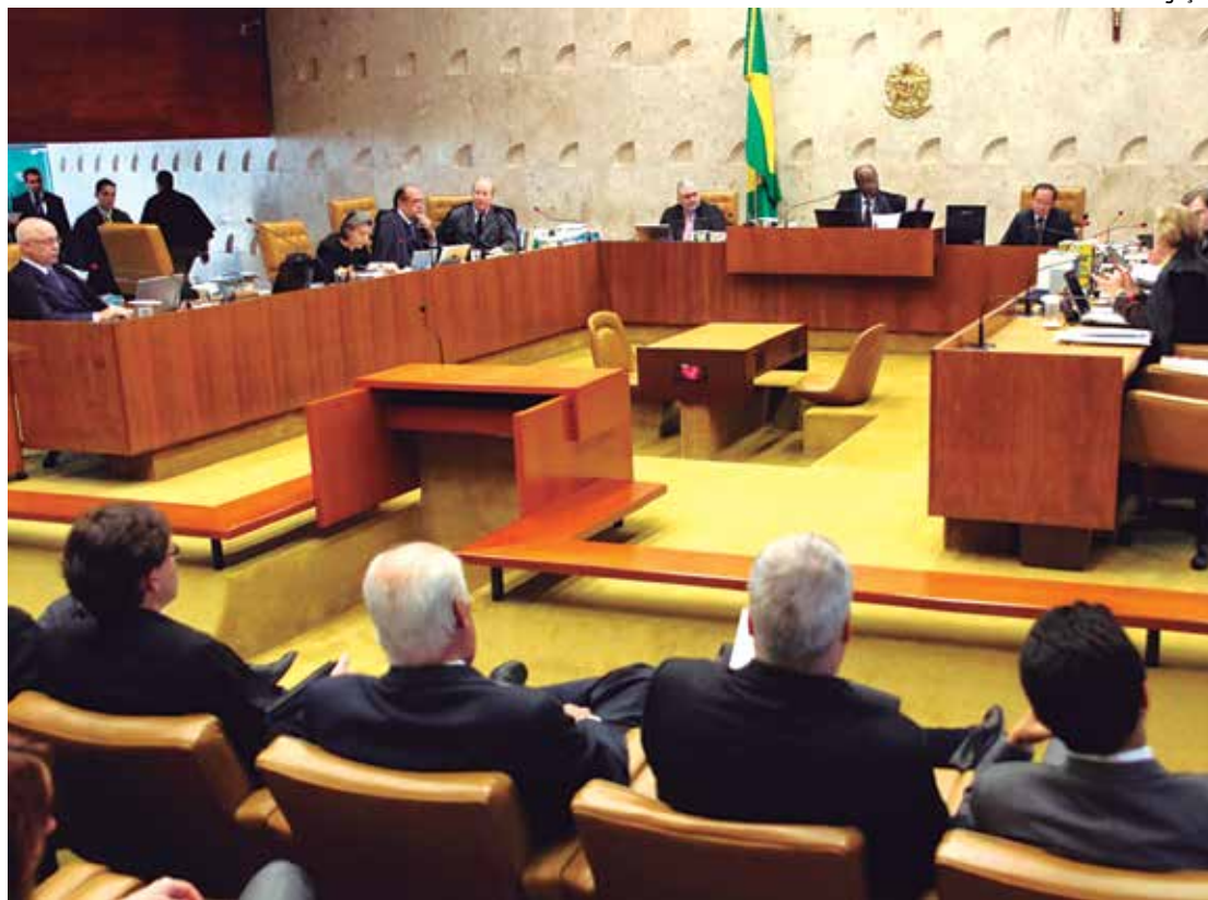
Plenário do Supremo Tribunal Federal - STF -, ontem durante a sessão que discutia o assunto

Rosa Weber considerou que o TSE extrapolou o pa-