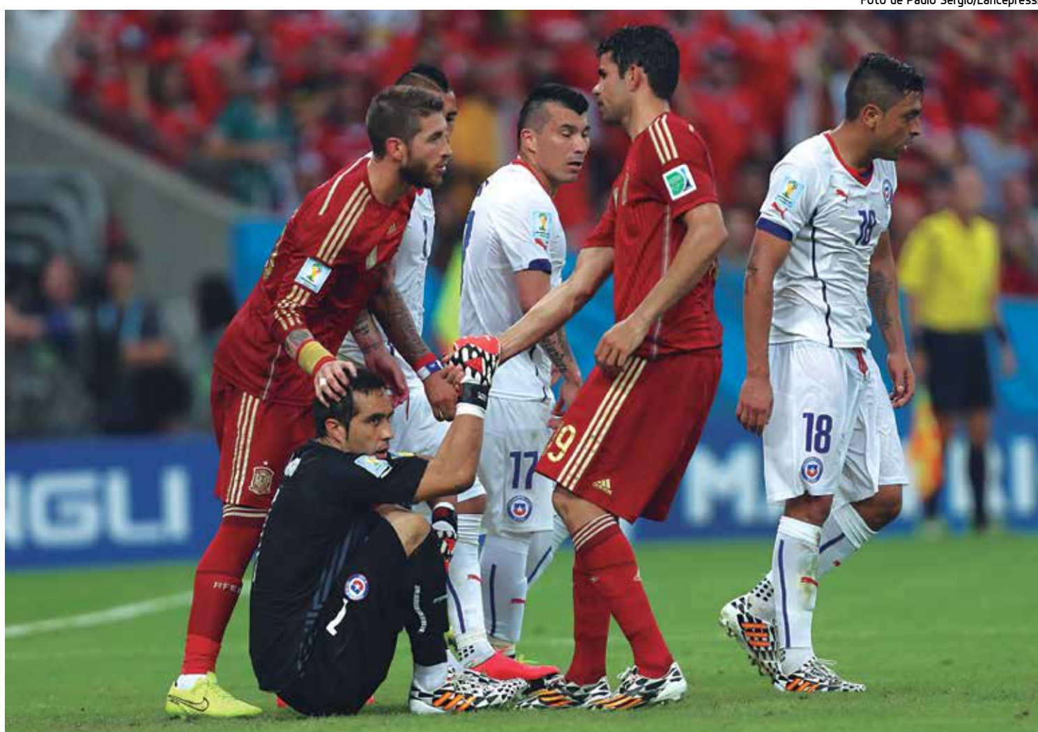
A atual campeã do mundo não disse para que veio nesta Copa e ontem, no Maracanã, voltou a perder, dando adeus ao Mundial

A França em 2002 também caiu na fase inicial, mas conseguiu um empate e uma derrota nos dois primeiros jogos e só seria eliminada no último. O Brasil em 1966 saiu precocemente, embora tenha vencido seu jogo de estreia. A eliminação só veio no terceiro duelo, uma derrota para Portugal. E finalmente a Itália em 1950 saiu da disputa mais cedo, mas pelo menos conseguiu uma vitória nas duas partidas que fez no torneio.