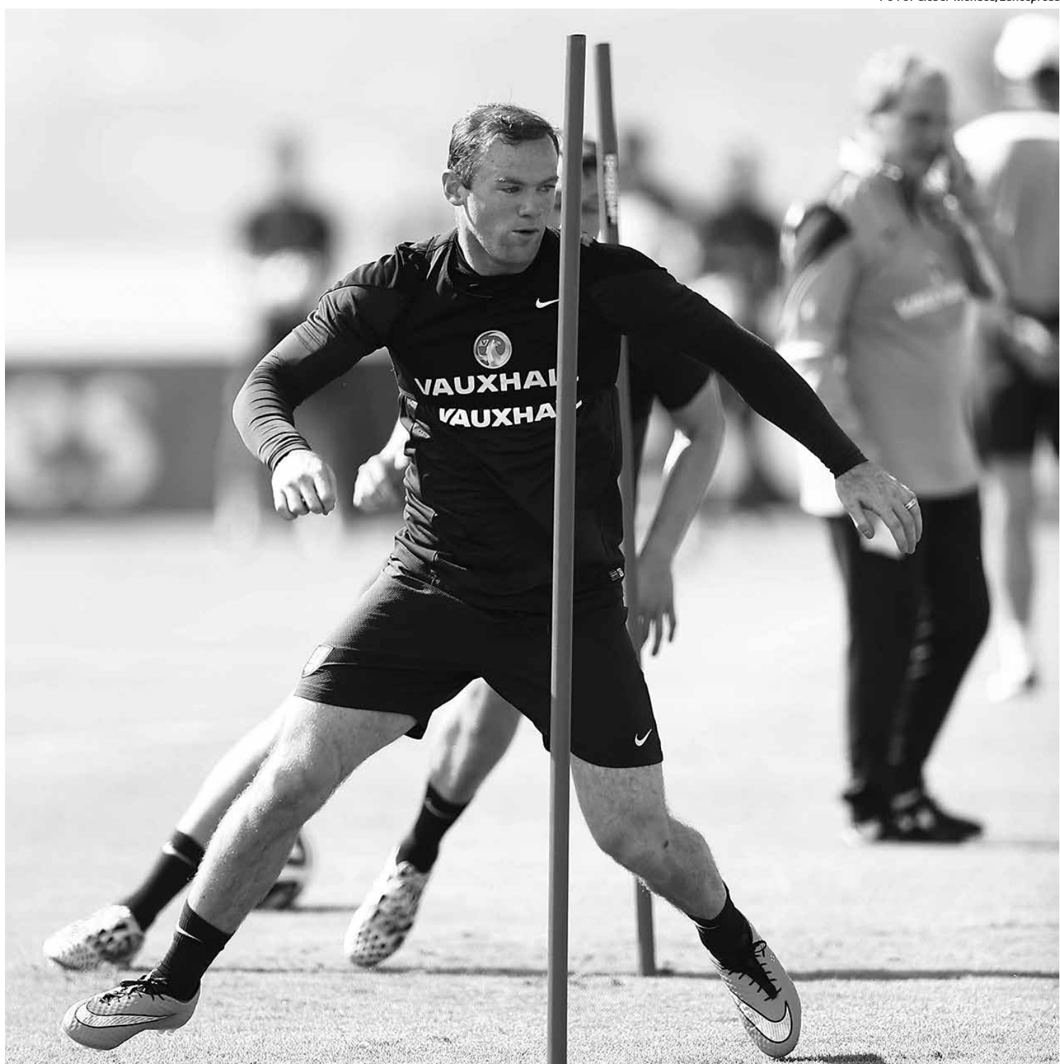
Rooney é a grande esperança do time inglês para vencer o Uruguai e manter viva a seleção depois da derrota para a Itália na estreia

"Temos que temer um pouco. Respeito, mas medo de ninguém. É uma seleção que surpreendeu a todos com o resultado contra o Uruguai, ninguém pensava que seria assim. Ela revelou algumas individualidades importantes também" disse De Rossi, focando o jogo de amanhã às 13h em Recife.