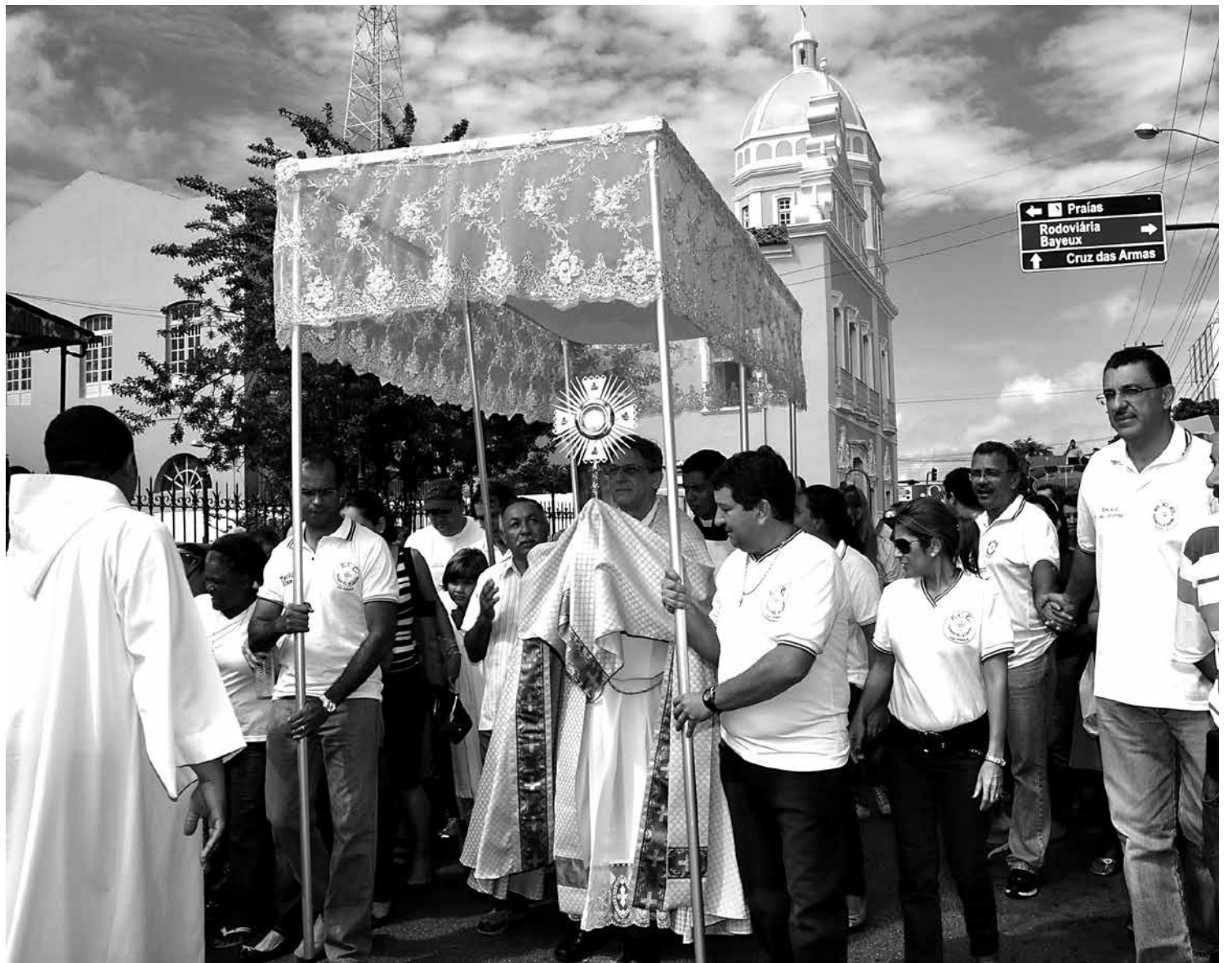
Imagem da procissão do ano passado; hóstia consagrada será conduzida em um ostensório pelas ruas do Centro de João Pessoa

Antes da procissão em Mangabeira, das 16h às 17h, haverá adoração ao Santíssimo Sacramento na Capela de Santo Antônio.