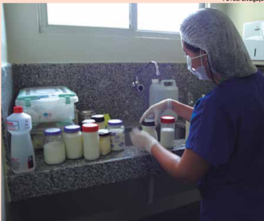
Coordenação do Banco no Sertão faz apelo às mães para doarem seu leite excedente

O Banco de Leite Humano Dr. Vilani Kehrle, da Maternidade de Patos, oferece alimento apropriado para os bebês hospitalizados que necessitam de complemento alimentar, e orienta centenas de mães sobre a importância da amamentação exclusiva do seu filho até os seis meses de idade. Todos os meses, o Banco de Leite auxilia cerca de 100 crianças nascidas na Maternidade, proporcionando a primeira e a principal fonte de nutrição dos recém-nascidos até que eles se tornem aptos a sugar o seio da mãe. Contudo, essa ajuda está seriamente comprometida, uma vez que o estoque de leite da unidade encontra-se bastante baixo e o número de doadoras fixas também está bem reduzido.