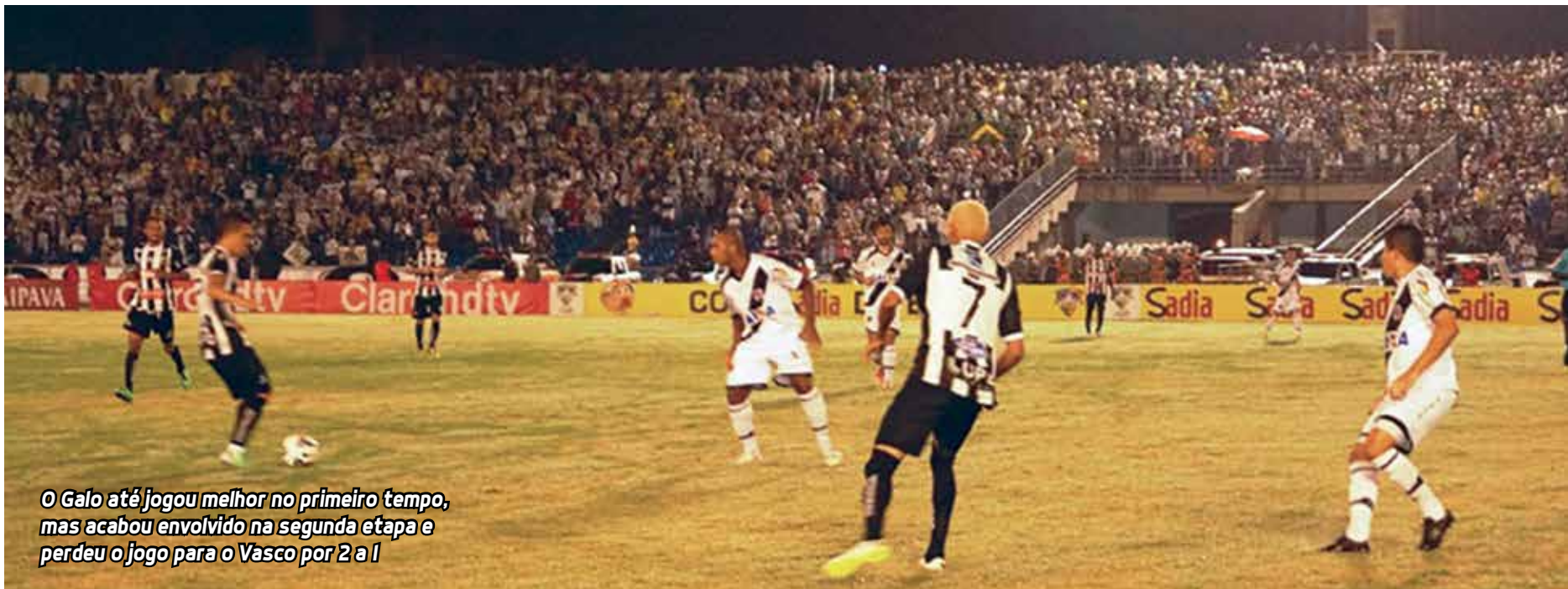
O Galo até jogou melhor no primeiro tempo, mas acabou envolvido na segunda etapa e perdeu o jogo para o Vasco por 2 a 1