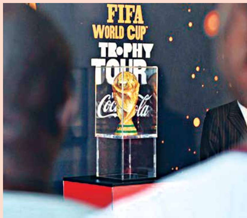
A Taça Fifa está sendo exposta em diversas capitais pelo Brasil

A mais famosa taça da Copa do Mundo chegará a João Pessoa no próximo dia 11 e ficará exposta apenas um dia na Estação Cabo Branco - Ciência, Cultura e Artes, no Altiplano. A Taça da Copa do Mundo ou 'Tour da Taça', como está sendo chamado, faz parte da campanha da Coca-Cola para a Copa do Mundo Fifa 2014.