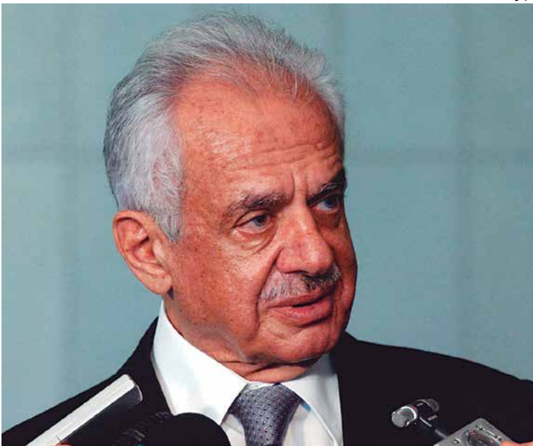
A proposta do senador Pedro Simon gerou protesto entre os senadores do PT que não concordam

A proposta gerou debate entre os senadores e levou Gleisi a apresentar voto em separado pela rejeição. Após afirmar que "os tempos do Congresso não são os tempos da sociedade", a petista disse temer que o Legislativo se alongue nas discussões e postergue a votação da peça orçamentária, causando, assim, dificuldades para a governança do país. Seu receio é de que esse impedimento também prejudique a tramitação de medidas provi-