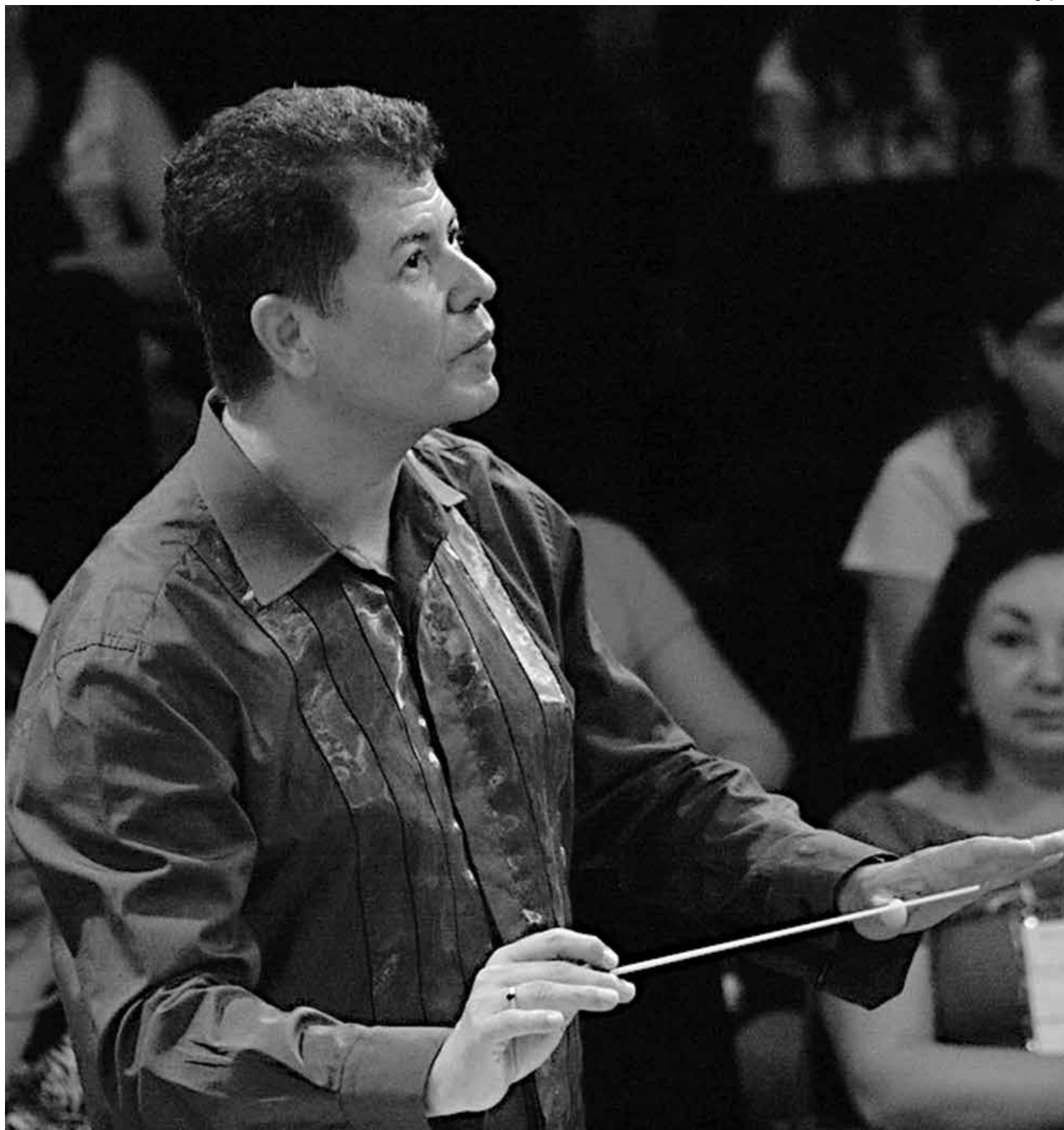
O trabalho do maestro Durier, direcionado para jovens músicos em formação, é reconhecido em todo o Brasil