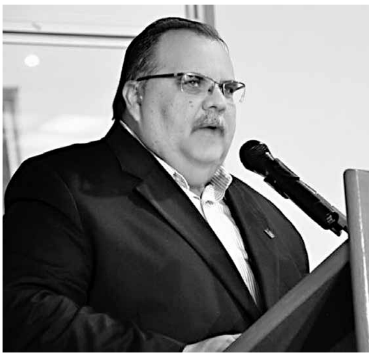
O vice-governador Rômulo Gouveia é presidente PSD na Paraíba

Rômulo Gouveia lembrou que para fazer um dos cursos que serão oferecidos pela Fundação não é preciso ser filiado ao partido e adiantou que os interessados já podem se inscrever no site