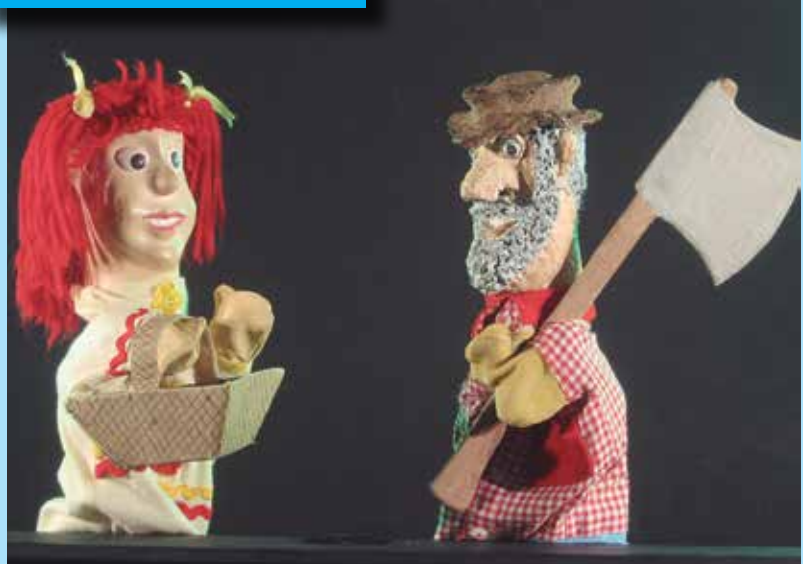
Bonecos do grupo Boca de Cena no espetáculo Colcha de Retalhos