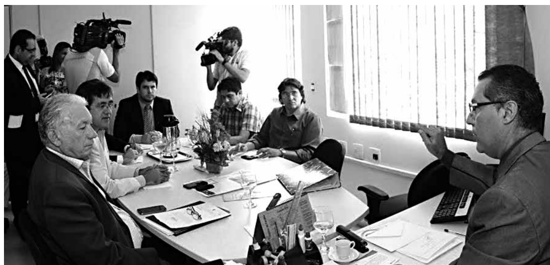
Autoridades debatem serviço de carga e descarga, limite de velocidade e revitalização da Lagoa

Na reunião realizada antontem foi discutida a forma de fiscalização da situação de cargas e descargas considerada, que é desordenada no comércio e empresas de João Pessoa, em especial no segmento de abastecimento e distribuição, comercialização de produtos alimentícios, como os supermercados. Neste aspecto, o promotor sugeriu a criação de um centro de logis-