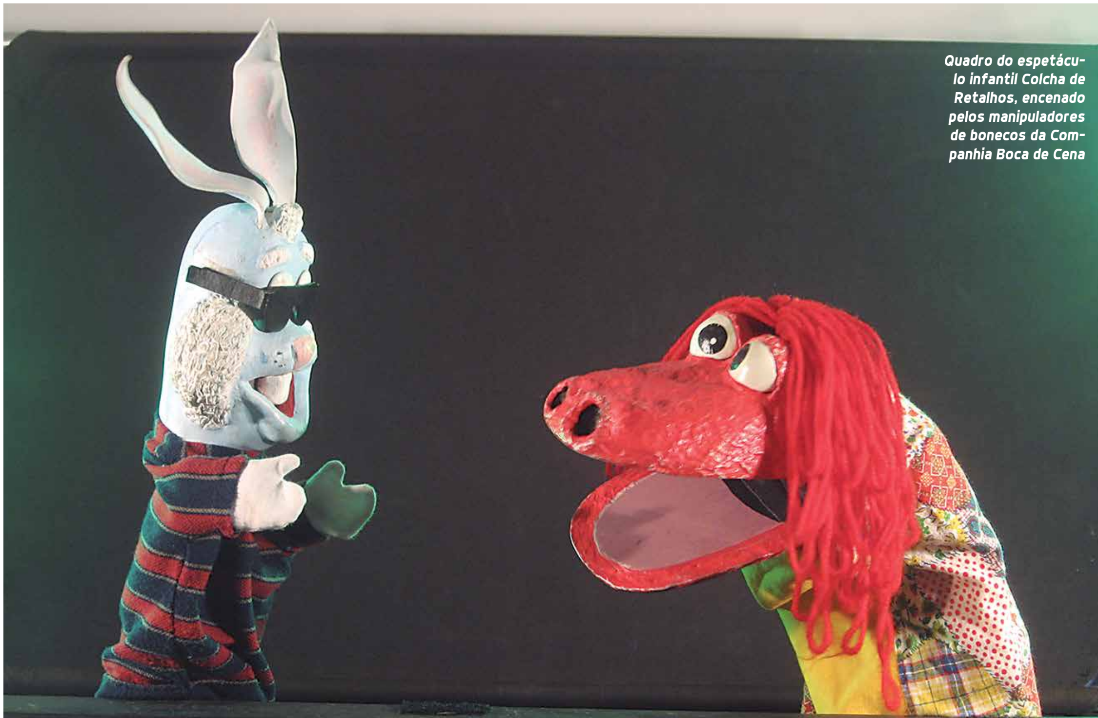
Quadro do espetáculo infantil Colcha de Retalhos , encenado pelos manipuladores de bonecos da Companhia Boca de Cena