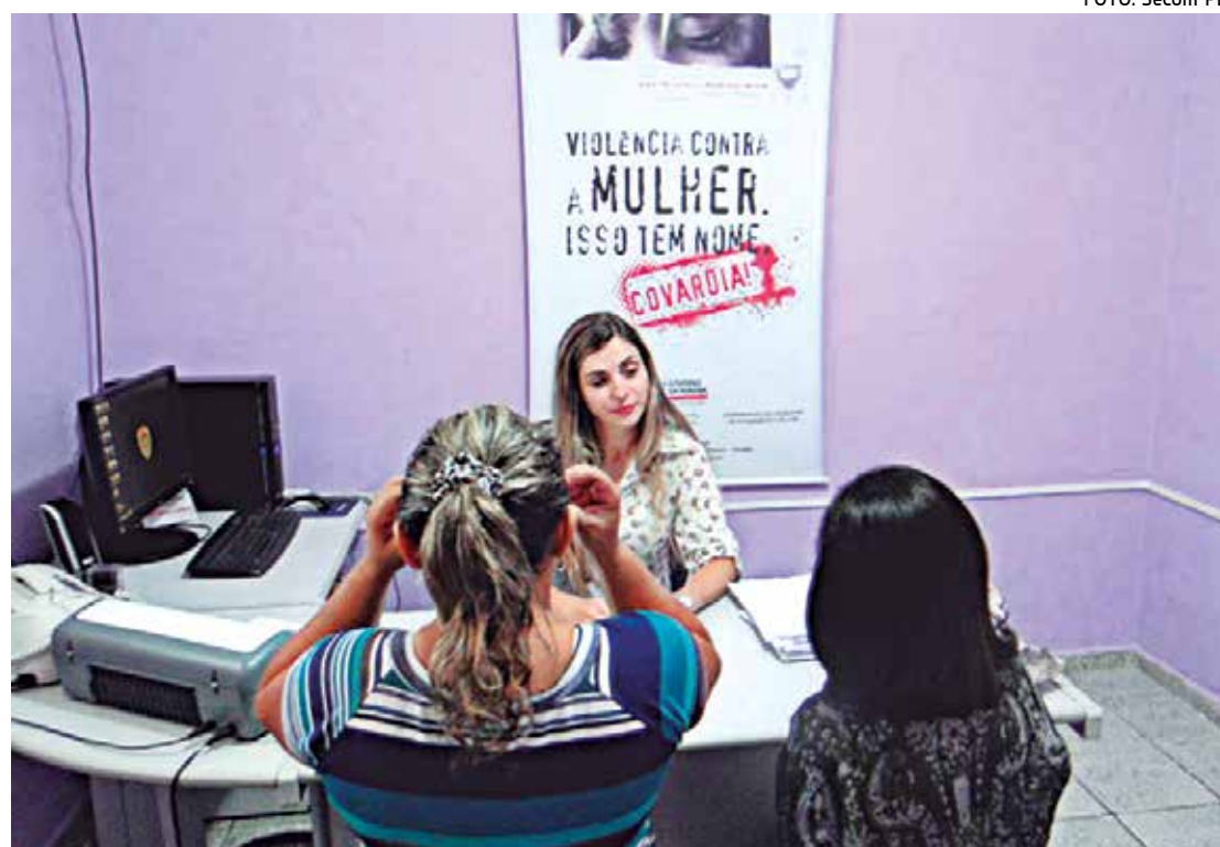
Atendimento na Delegacia da Mulher de Patos; número de denúncias vem crescendo no Estado

Com o sistema georeferenciado, vítimas ficarão constantemente interligadas à Delegacia da Mulher e à PM