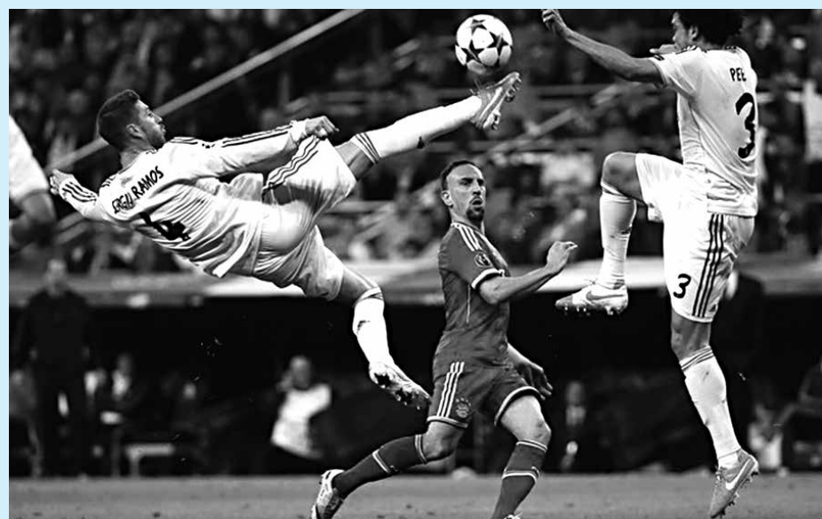
O Real Madrid eliminou o Bayern de Munique, enquanto o Atlético de Madrid despachou o Chelsea, da Inglaterra, e a final é espanhola e em Portugal, no próximo dia 24

A final da Liga dos Campeões desta temporada será no dia 24 de maio, em Lisboa, no Estádio da Luz. O Real Madrid busca o décimo título da sua história, mas terá pela frente o Atlético de Madri que chega invicto à decisão.