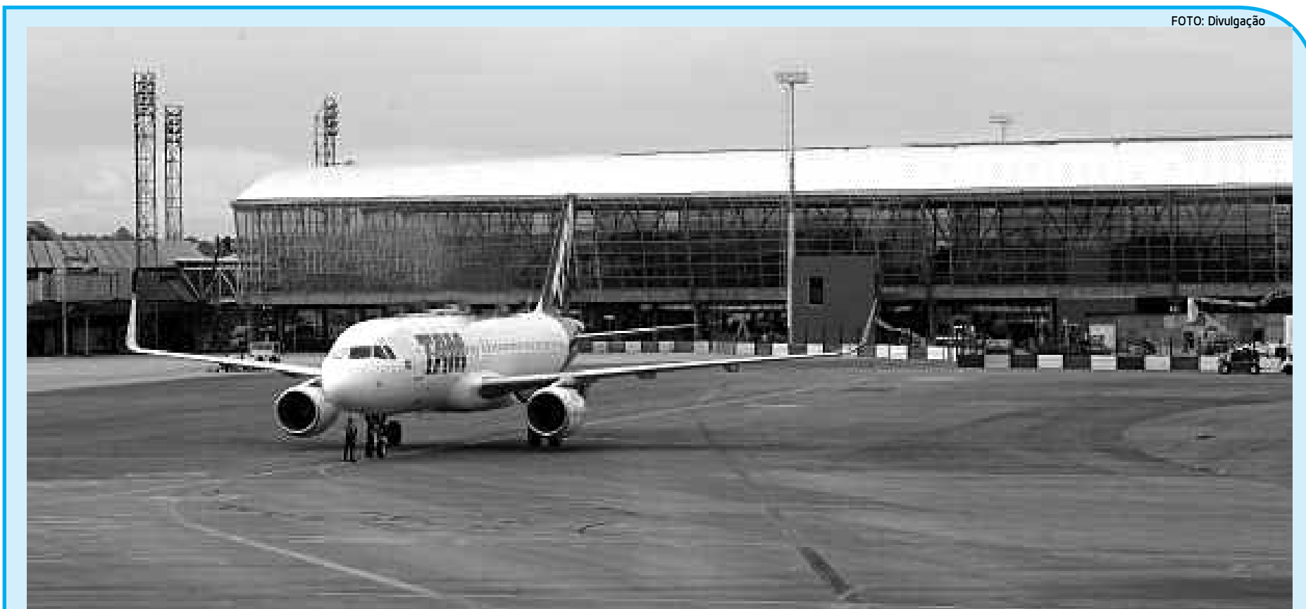
As medidas punitivas anunciadas pela Anac começam a valer a partir de hoje para as empresas de aviação, com multas que variam entre R$ 12 mil e R$ 90 mil

Van Rompuy, que chegou hoje a Kiev, reiterou a ameaça de novas sanções contra a Rússia caso Moscou não ajude a diminuir a tensão na Ucrânia.