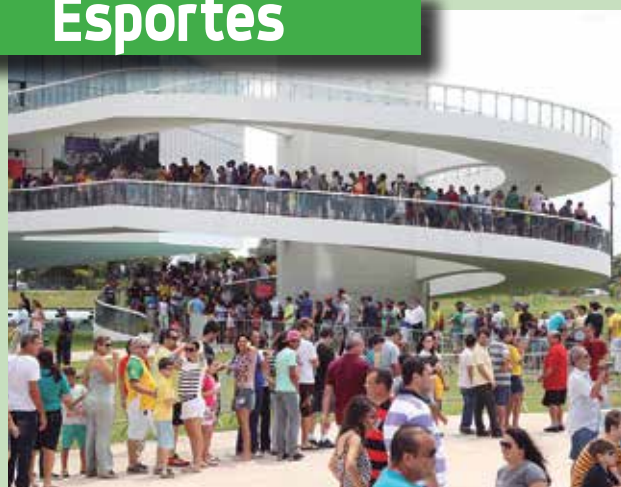
Os torcedores compareceram em massa à Estação Ciência para observar a Taça Fifa