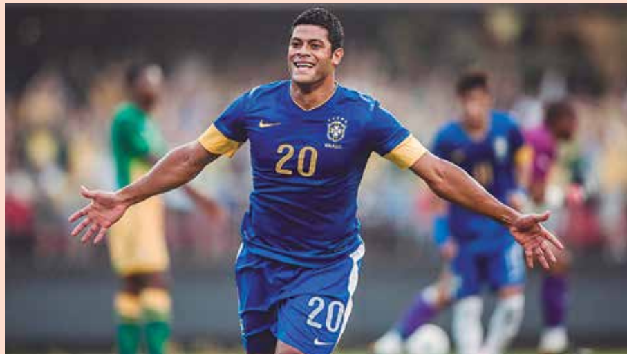
O paraibano que joga no Zenit marcou 21 gols nos 33 jogos disputados na temporada

status de favorito na opinião de especialistas. Deixou posições aquém no ranking da Fifa para chegar às vésperas do Mundial como quarto lugar. E isso sem disputar as eliminatórias da Copa do Mundo.