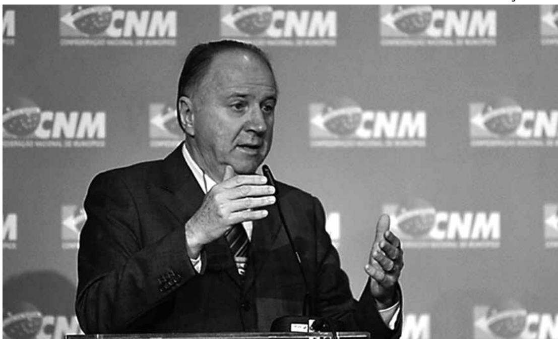
Presidente da Confederação Nacional de Municípios, Paulo Ziulkoski, quer elevação de 2% do FPM

A abertura oficial acontece hoje e deverá contar com a presença da presidente da República, Dilma