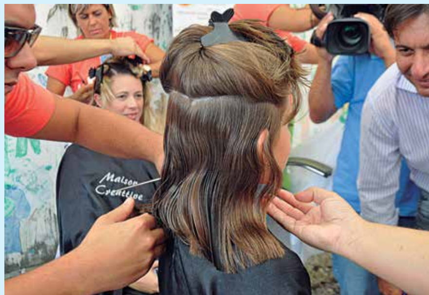
A campanha para doação de cabelos vai se estender até o dia 30 deste mês