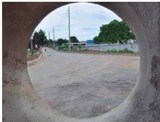
Vias de circulação estão preparadas