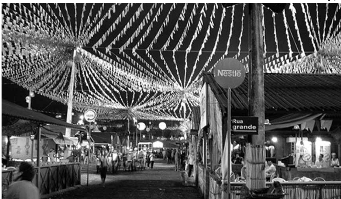
Corredor interno do parque onde se instalam os principais restaurantes da Rainha da Borborema

Os barraqueiros selecionados terão dessa segunda (12) até o dia 16 de maio (próxima sexta-feira) para efetuarem o pagamento da taxa de uso do solo do Parque do Povo, por intermédio