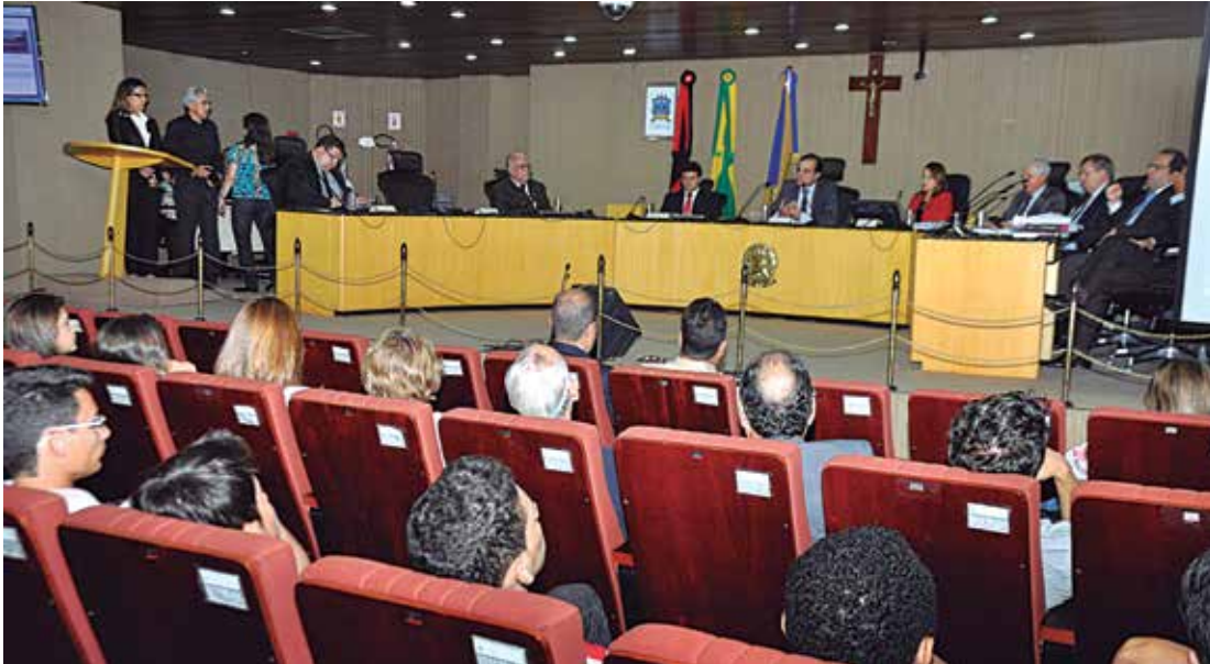
Plenário do Tribunal Regional Eleitoral da Paraíba, durante solenidade de abertura da exposição

À plateia, formada por alunos das escolas Olivina Olvívia e Liceu Paraibano, o desembargador contou que foram muitas as pessoas punidas por atos arbitrários praticados. “Para se resolverem questões de país tudo pode ser feito, menos quebrar a regra da democracia. Acabando com