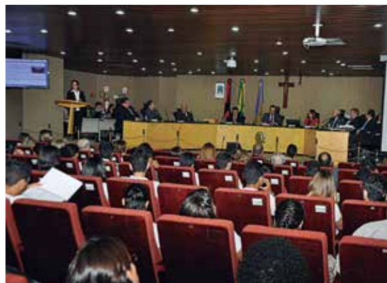
Solenidade no TRE atraiu grande público