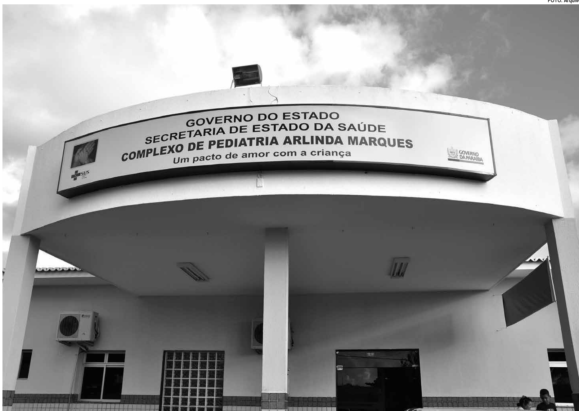
O Complexo de Pediatria abriu as comemorações da Semana da Enfermagem, ontem, na Capela Nossa Senhora de Fátima, com o Coral de Vozes do Arlinda Marques

A programação acontece até o dia 20 do corrente mês, porque se comemora o Dia do Enfermeiro (dia 12) e o Dia do Auxiliar e Técnico de Enfermagem (dia 20). As principais palestras, cursos e workshops são: "Workshop sobre feridas, uma abordagem sobre avaliação e tratamento avançado das lesões de pele crônicas", "Minicurso sobre monitorização hemodinâmica com ênfase na gametria arterial", "Palestra sobre cuidados intensivos em neonatologia" e "Palestra sobre atualização em imunização e Administração de medicamentos". A Paraíba conta atualmente com mais de 31 mil profissionais de enfermagem, enquanto que no Brasil existem quase 2 milhões.