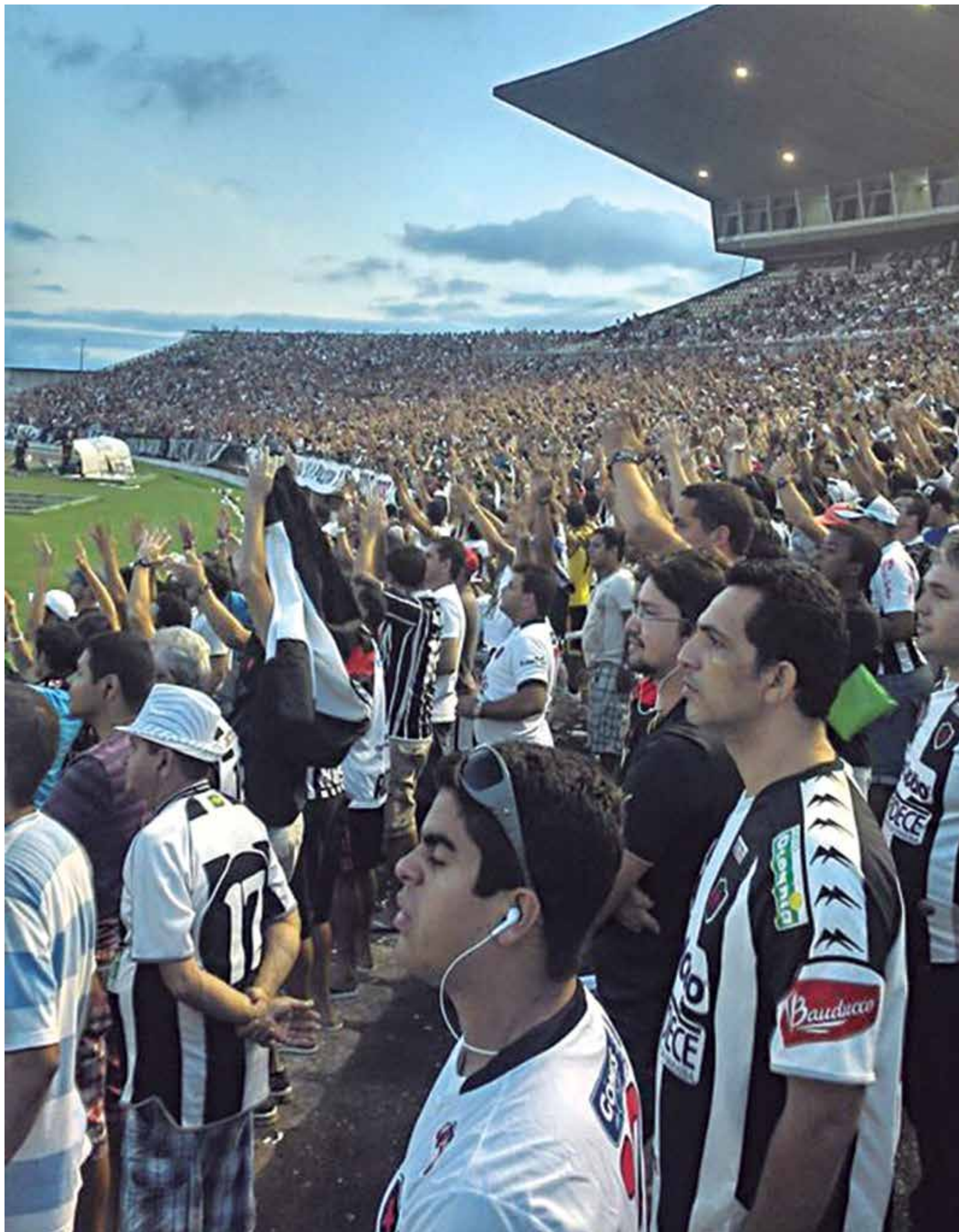
A torcida botafoguense deve lotar o Almeidão amanhã e apoiar o time em mais um jogo da Copa do Brasil, agora diante do Santa Cruz

O Ministério Público chegou a enviar um ofício à FPF, sugerindo o cumprimento do que foi acordado, mas a Junta não o considerou.