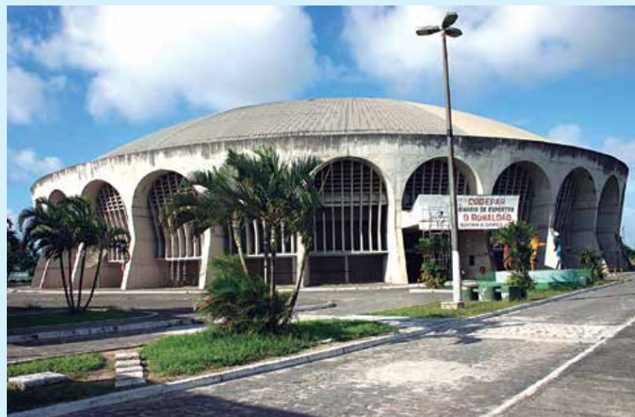
Serão investidos mais de R$ 750 mil na reforma estrutural do Ginásio O Ronaldão

O Governo do Estado deu início nesta semana à maior reforma estrutural já realizada no Ginásio de Esportes Ronaldo Cunha Lima, O Ronaldão, na capital paraibana. Ao todo serão investidos mais de R$ 750 mil. A primeira etapa consiste na retirada de todo o piso de paviflex, que será substituído por um material com padrões internacionais.