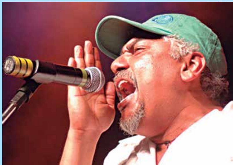
Totonho participa de evento solidário que quer atrair artistas locais