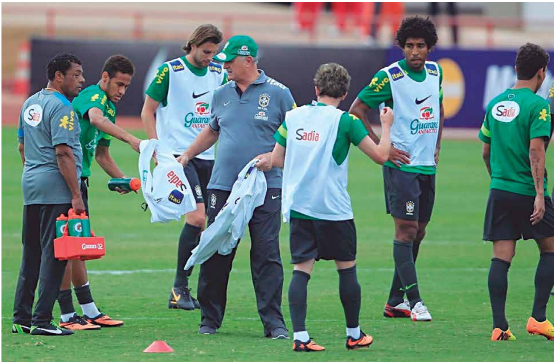
O técnico Luiz Felipe Scolari só deve começar os trabalhos no campo da granja Comary a partir do dia 29, já visando o amistoso diante do Panamá no Serra Dourada

O cronograma, aliás, deve ser bastante parecido no segundo amistoso, 6 de junho, contra a Sérvia, desta vez no Estádio Morumbi, em São Paulo. Para não perder tempo, os jogadores da seleção voltam ao Rio de Janeiro logo depois da partida, seguindo à concentração em Teresópolis. Até 9 de junho, os atletas ganharão um dia inteiro de folga apenas no dia 7.