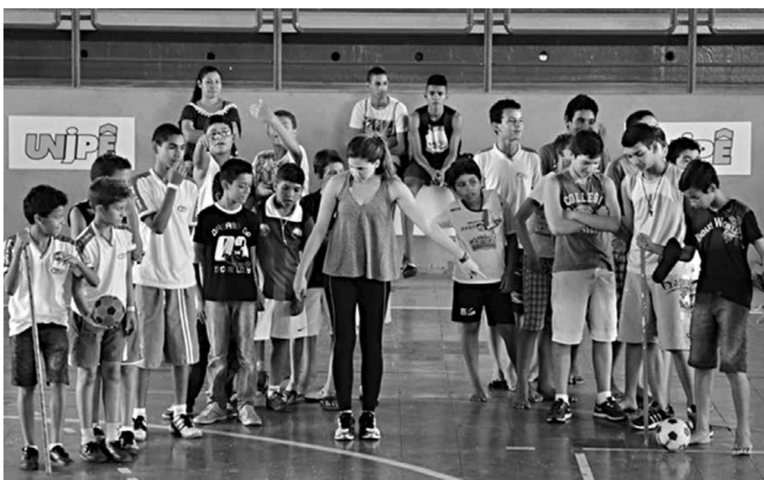
Escolinhas beneficiam 13 escolas da rede estadual e fazem parte de um convênio firmado pelo Governo

As escolas integrantes do projeto estão localizadas nos bairros de Mangabeira, Cristo Redentor, Ernesto Geisel, Rangel, José Américo e Centro. São cerca de 800 alunos, matriculados no Ensino Fundamental II (6º ao 9º ano) e Ensino Médio, beneficiados pelo projeto.