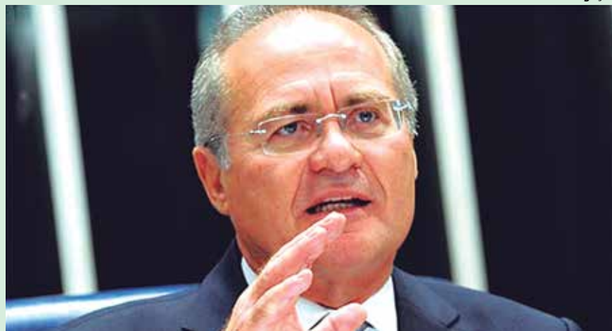
Renan Calheiros: "Instalação não tem a ver com o presidente do Congresso"

O presidente do Senado, Renan Calheiros (PMDB-AL) disse ontem que não cabe a ele instalar a Comissão Parlamentar Mista de Inquérito (CPMI) para investigar irregularidades na Petrobras, como reivindica a oposição.