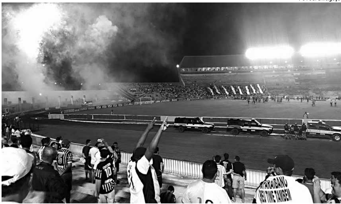
A torcida botafoguense ficou frustrada com o empate de 1 a 1 diante do Santa Cruz pela Copa do Brasil

Mesmo com as modificações forçadas, o treinador do Belo gostou da atuação do time contra o Santa Cruz. "Foi um grande jogo, muito disputado, tivemos chances de matar a partida, como eles também tiveram. A equipe sentiu um pouco a falta de entrosamento com os jogadores que entraram, mas fizemos um grande jogo e espero o mesmo diante do CRB, quando terei ainda mais opções para escalar a equipe e