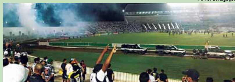
Torcedores querem que o time atue com garra e com visão estratégica