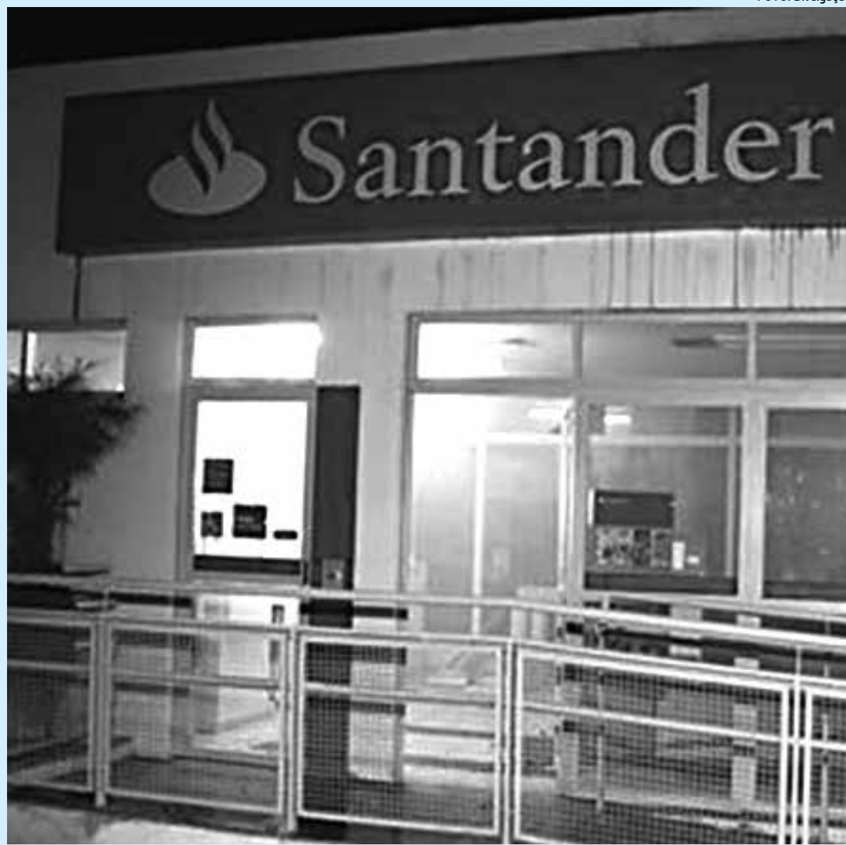
Após ser alvo do tiroteio, o homem teria se refugiado no campus da UFPB, próximo à agência do Santander

Policiais militares e a segurança interna da Universidade Federal da Paraíba (UFPB), continuam na busca por três homens que se envolveram em um tiroteio, na tarde de ontem, ocorrido no interior do Campus de João Pessoa. Uma pessoa foi presa e outra ficou ferida após troca de tiros.