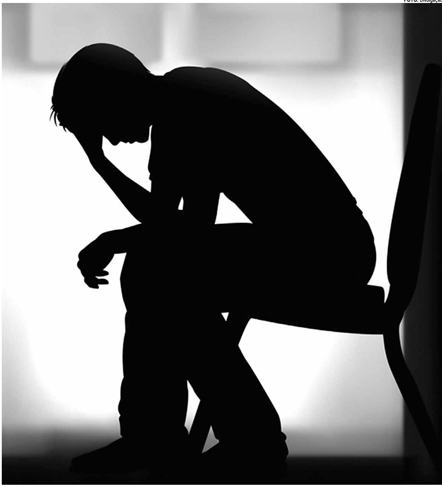
Na Paraíba, existem atualmente 63.682 pessoas que possuem algum tipo de transtorno mental, de acordo com dados do IBGE

Até 2012, havia 53 pacientes que moravam por mais de duas décadas no Complexo Psiquiátrico Juliano Moreira.