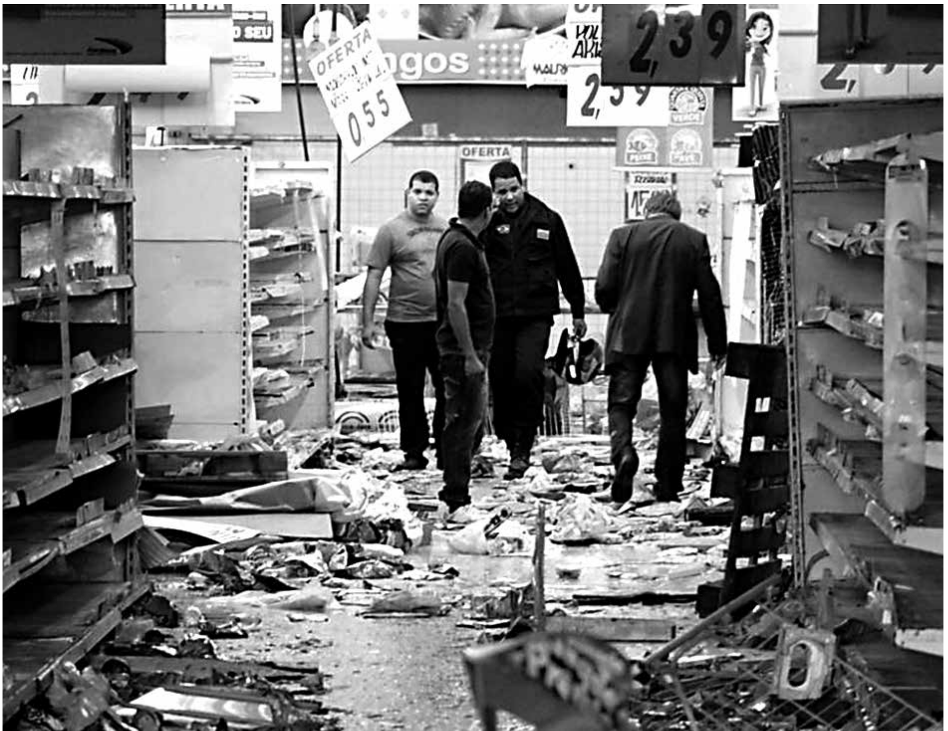
Com greve de policiais e bombeiros, um supermercado foi saqueado na cidade de Abreu e Lima (PE), Região Metropolitana de Recife, capital pernambucana

Apesar de aprovado, o fim da greve não foi pacífico entre os integrantes da categoria. Um pequeno grupo mais exaltado seguiu na frente do Palácio do Campo das Princesas, onde a negociação foi realizada, gritando que os líderes do movimento eram covardes por terem encerrado o movimento paredista. A insatisfação se dá, principal-