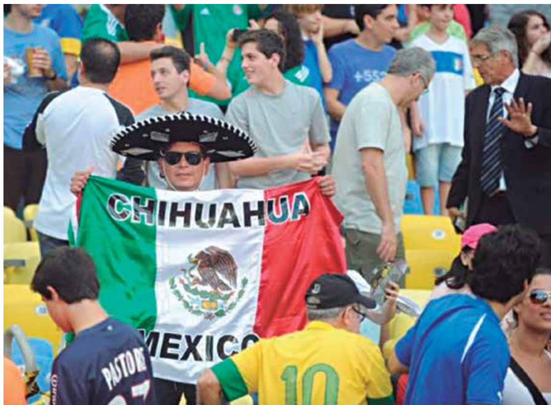
Turistas que virão à Copa devem assistir a pelo menos quatro jogos durante o Mundial no Brasil

Os maiores gastos serão feitos pelos 300 mil turistas estrangeiros que virão, especificamente, para acompanhar a Copa. Em média, eles devem assistir a quatro jogos e a projeção é que gastem R$ 5.500 durante a estadia no Brasil, já descontadas as despesas com passagens aéreas e valores gastos no país de origem.