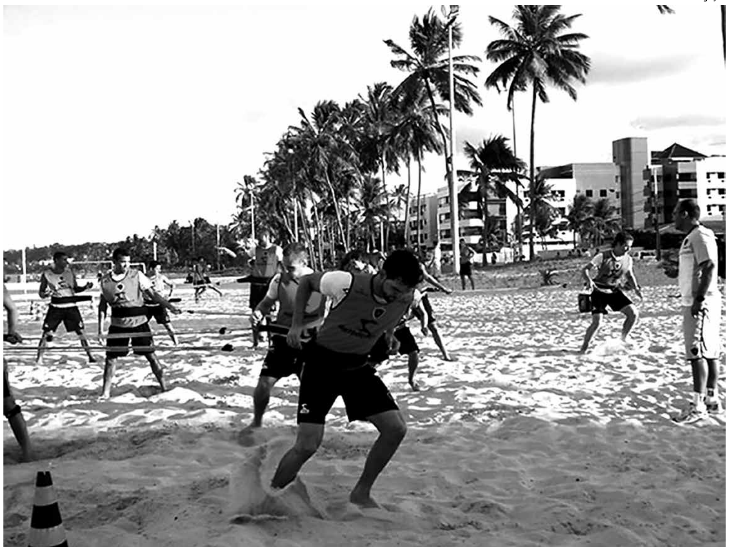
Na última segunda-feira, os jogadores treinaram na Praia do Cabo Branco fisicamente e ontem os trabalhos aconteceram em Cabedelo

Desde que iniciou a sua participação no Campeonato Paraibano, em 2012, na Segunda Divisão, o Sport Campina não conseguiu vencer uma só partida e já foi destaque na última Revista Placar quando foi comparado ao Ibis de Pernambuco, o pior time do mundo. Rebaixado, o Sport só pensa em reformulação para 2015.