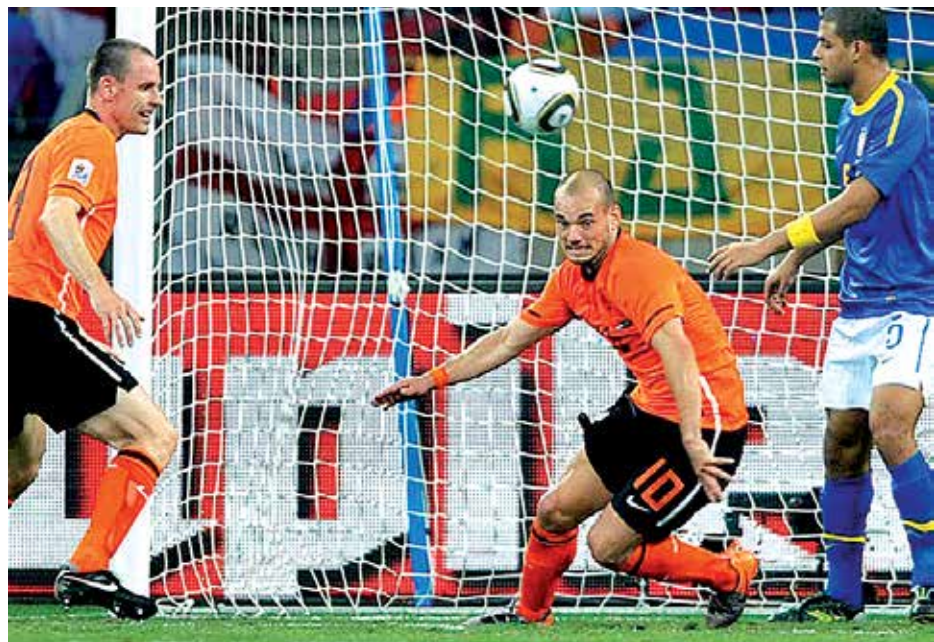
Em 2010, o Brasil foi eliminado da Copa da África pela Holanda no Nelson Mandela

Segundo Blatter, o país receberá a competição "de braços e corações abertos". "Futebol é uma filosofia de vida no Brasil, os artistas que dominam a bola de forma única são brasileiros. O futebol foi organizado pelos britânicos, mas o nascimento do futebol habilidoso ocorreu no Brasil", analisou.