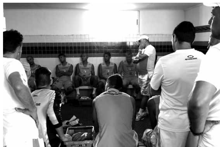
Técnico conversou bastante com os jogadores na apresentação

Desde que chegou ao Rubro-negro pela primeira vez, no segundo semestre de 2007, Freitas comandou a equipe em 155 jogos, sendo 70 vitórias, 43 empates e 42 derrotas: um aproveitamento de 54,4% dos pontos disputados.