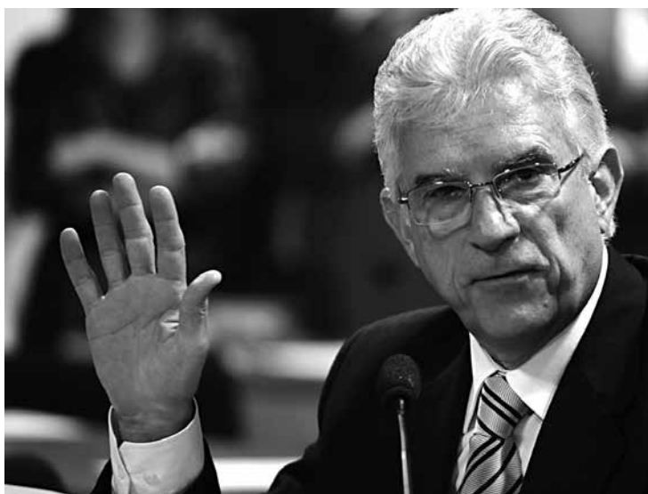
Líder Rubens Bueno vê frouxidão na reação do governo Dilma

Como o ministro tem foro privilegiado, só pode ser investigado por inquérito no STF, por isso a PF fez essa sugestão em relatório encaminhado à Justiça Federal de Santa Catarina. Filiados do PDT constavam da folha de pagamento da Agência de Desenvolvimento Regional do Vale do Rio Tijucas e Itajaí Mirim (ADRVale) sem nunca terem trabalhado para a entidade, que teria recebido R$ 11 milhões de convênios com o ministério. A PF em Santa Catarina confirmou