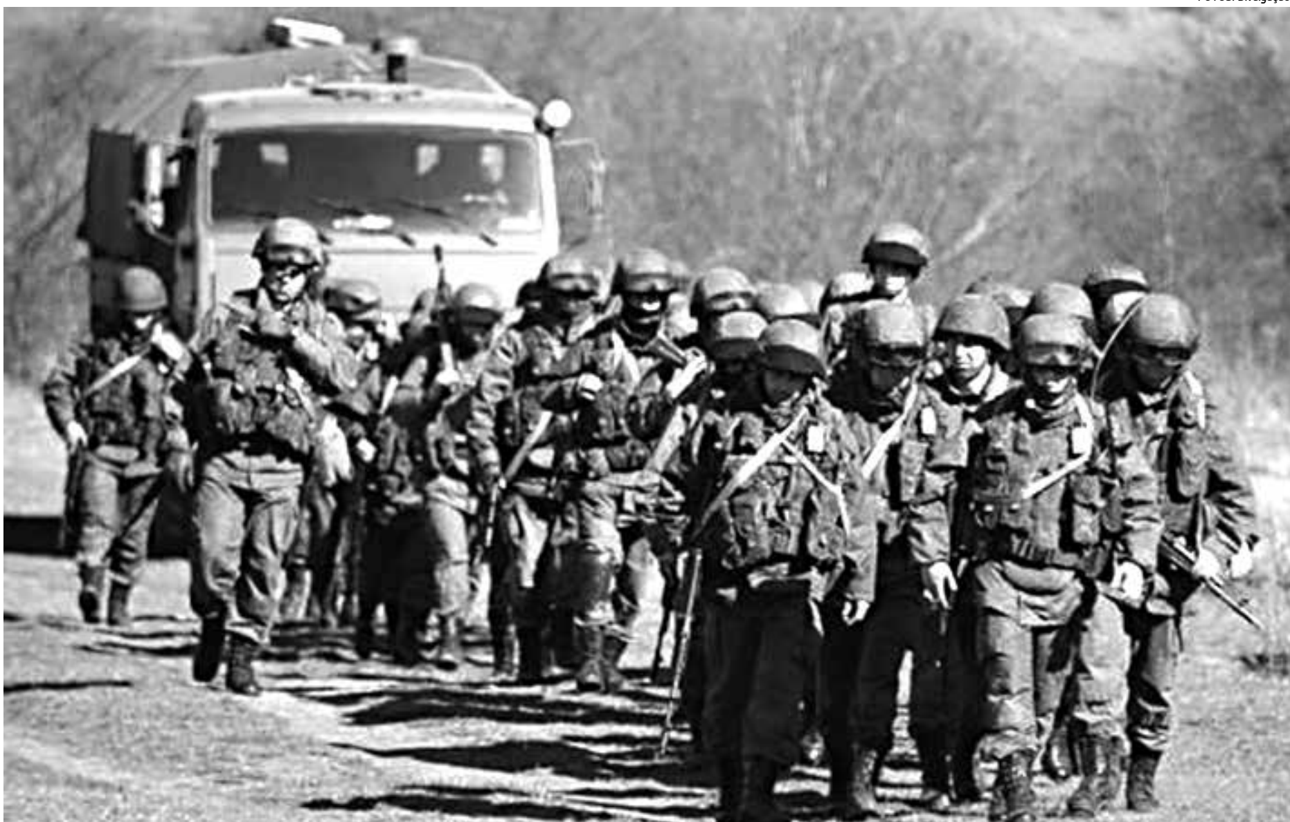
Por determinação do presidente e do ministro da Defesa, tropas russas suspenderam exercícios e começaram a voltar aos quartéis no começo da manhã de ontem

As primeiras entregas serão realizadas ao longo deste ano, informou a SAAB AB em comunicado. Os sistemas estão destinados "a proteger a infraestrutura estratégica do Brasil e serão usados na proteção dos próximos grandes eventos, incluindo a Copa do Mundo e os Jogos Olímpicos do Rio de Janeiro em 2016", assinalou a empresa sueca.