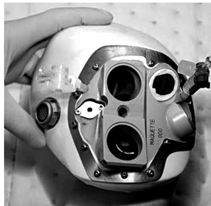
Médicos mostraram, na França, um modelo do coração artificial

O ministro da Defesa da Rússia, Sergei Shoigu, negou então que o surpreendente alerta emitido para essas unidades militares estivesse relacionado com a crise na Ucrânia. Um total de 150 mil militares, 90 aviões, mais de 120 helicópteros, 80 blindados, 1.200 peças de artilharia e 80 navios participaram das manobras, as maiores já registradas na Rússia.