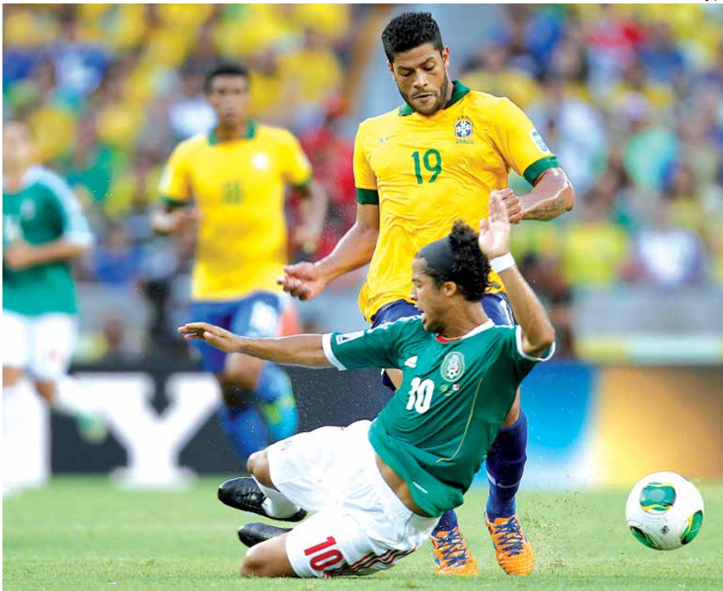
O paraibano Hulk se encaixou bem no esquema tático de Felipão e deve ser aproveitado no amistoso de hoje contra a África do Sul

Júlio César foi o primeiro jogador do time a receber um recado. No primeiro amistoso após o título, contra a Suíça, foi para o banco de reservas. Jeferson foi o titular. A comissão técnica esperava que ele encontrasse outra equipe, já que seria reserva no Queens Park Ran-