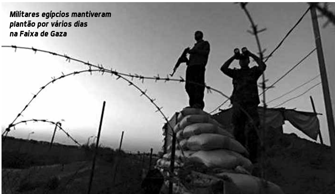
Militares egípcios mantiveram plantão por vários dias na Faixa de Gaza

As causas da morte só podem ser conhecidas precisamente depois de todos os dados médicos serem analisados