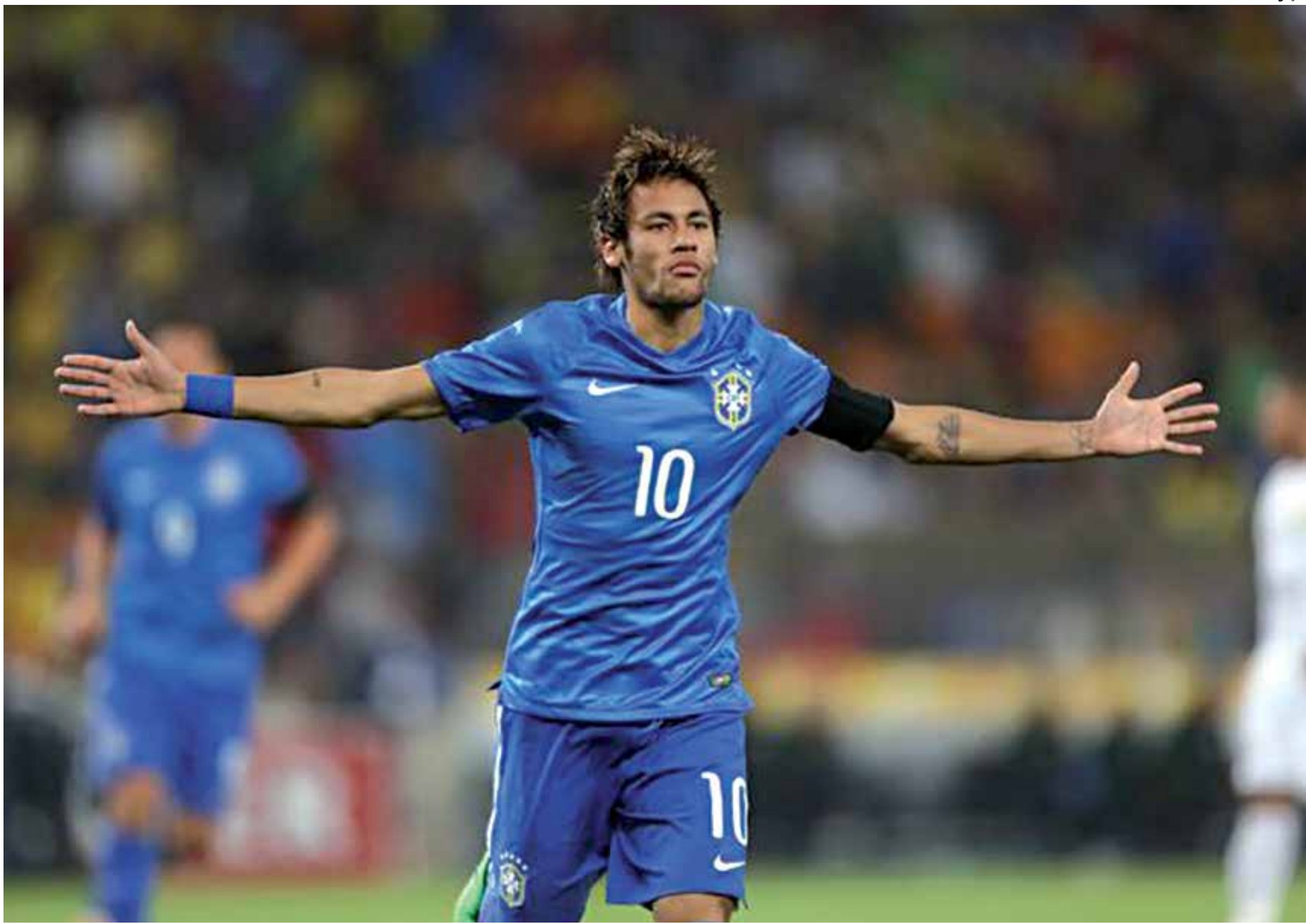
Neymar voltou a ser destaque e fez três gols na fácil vitória de 5 a 0 sobre a África do Sul. Agora os jogadores ficam aguardando a convocação final no dia 7 de maio

Fernandinho fez o quarto e Neymar fechou a goleada. Agora é aguardar a convocação final no dia sete de maio.