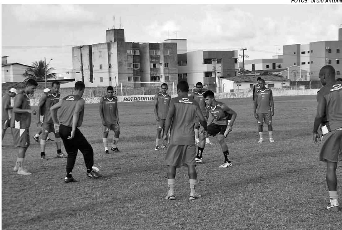
Jogadores do Auto Esporte participando de um "bate bola" no Centro de Treinamento em Mangabeira