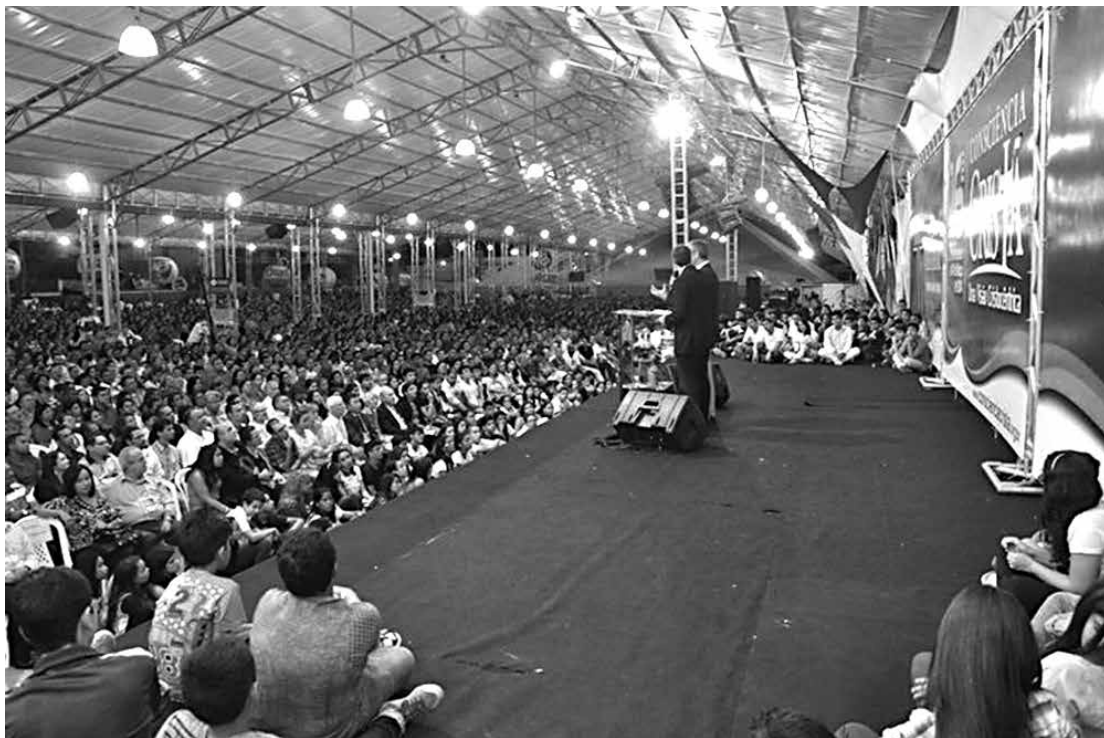
Parque do Povo, Campina Grande, onde foi montada a estrutura que recebeu centenas de pessoas

Durante os 6 dias do evento aconteceram 91 seminários, seis grandes concentrações noturnas e 17 eventos paralelos, com destaques para o Primeiro