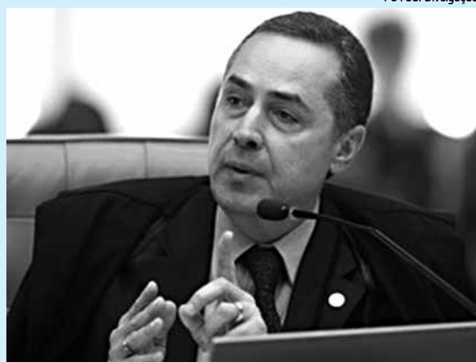
No último julgamento, Barroso pediu mais tempo para analisar

Em outubro do ano passado, ao apresentar seu voto, o ministro Luiz Fux – relator da ação dos precatórios – propôs que sejam adotados índices de