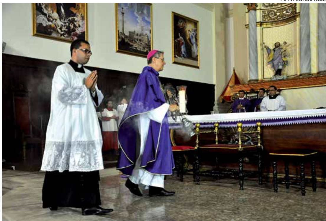
Missa abriu Campanha da Fraternidade, que este ano tem o tema "Fraternidade e Tráfico Humano"