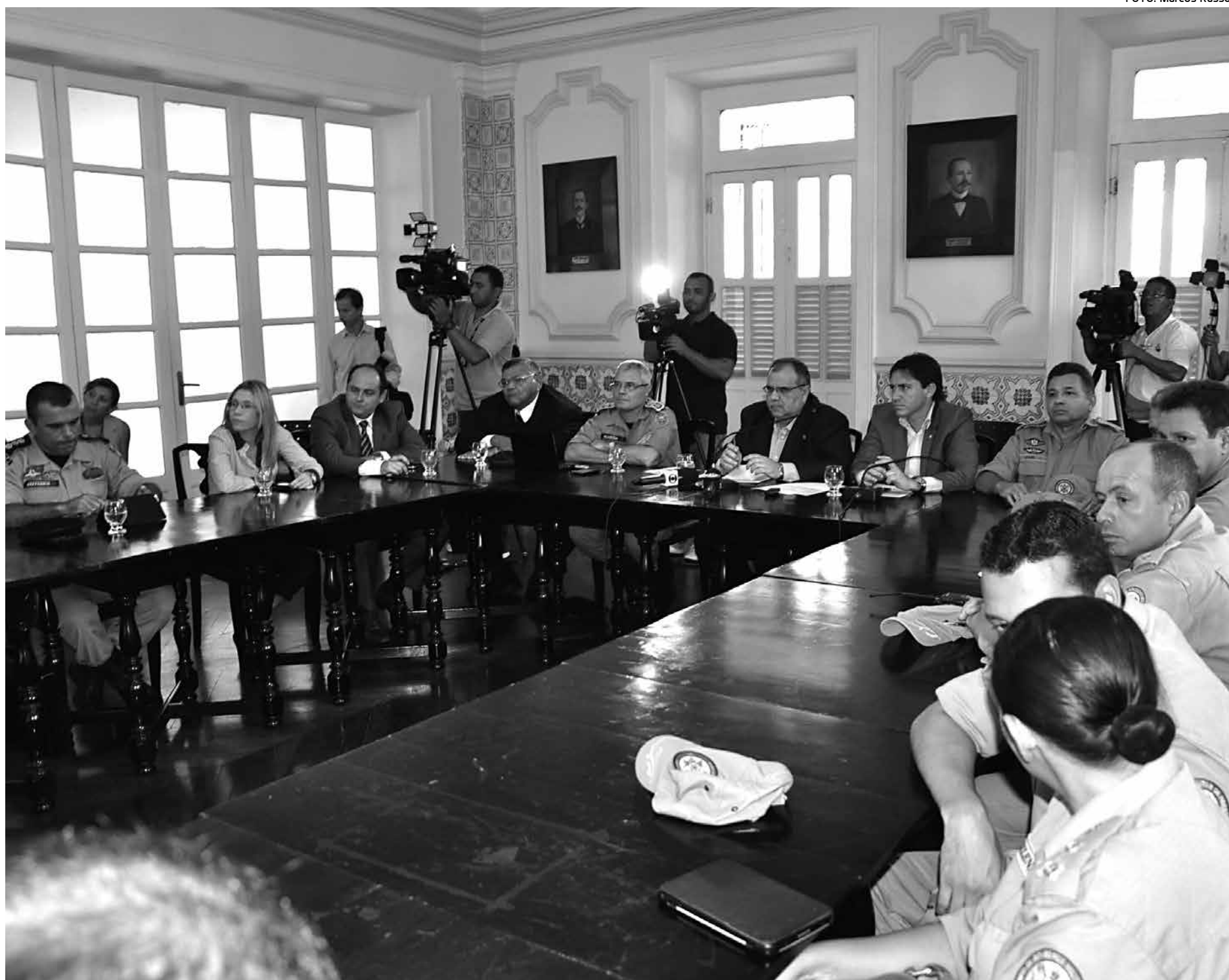
O governador em exercício Rômulo Gouveia juntamente com os gestores da Segurança Pública do Estado apresentaram ontem o resultado da Operação Carnaval

A Polícia Civil realizou 87 auto de prisão em flagrante delito, 76 Termos Circunstanciados de Ocorrência (TCO) e sete procedimentos de menor infrator. Os flagrantes lavrados foram por crimes de trânsito