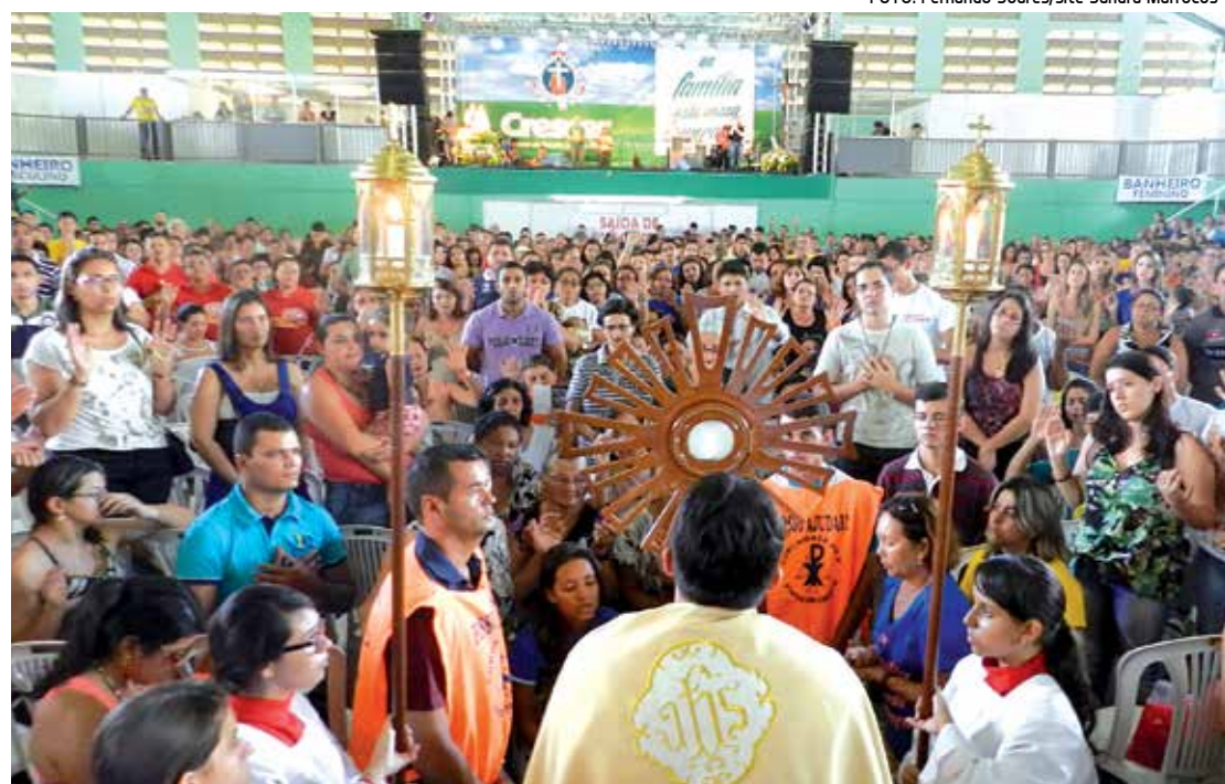
17ª edição do Crescer - O Encontro da Família Católica encerrou-se na última terça-feira, em Campina