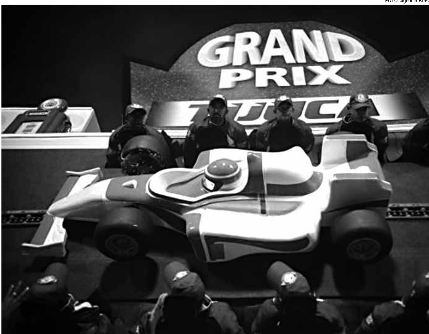
Unidos da Tijuca prestou homenagem ao tricampeão de Fórmula 1, Ayrton Senna, e empolgou o público na segunda noite do desfile

Os 3,6 mil componentes vieram divididos em 34 alas. Personagens de desenhos animados como Speed Racer, Ligeirinho, Papa Léguas, Sonic, The Flash, Penélope Chamosa e Dick Vigarista também deram o ar da graça na avenida. O quinto carro alegórico levou para a Sapucaí diversas fotos de Senna.