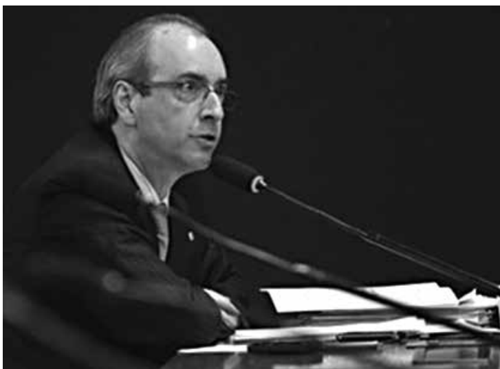
Cunha acha que, apesar de unido, o PT não respeita o PMDB

“Quando falei em repensar, não falei ainda em romper, e sim em rediscutir os termos dessa aliança, na qual não somos respeitados”, disse.