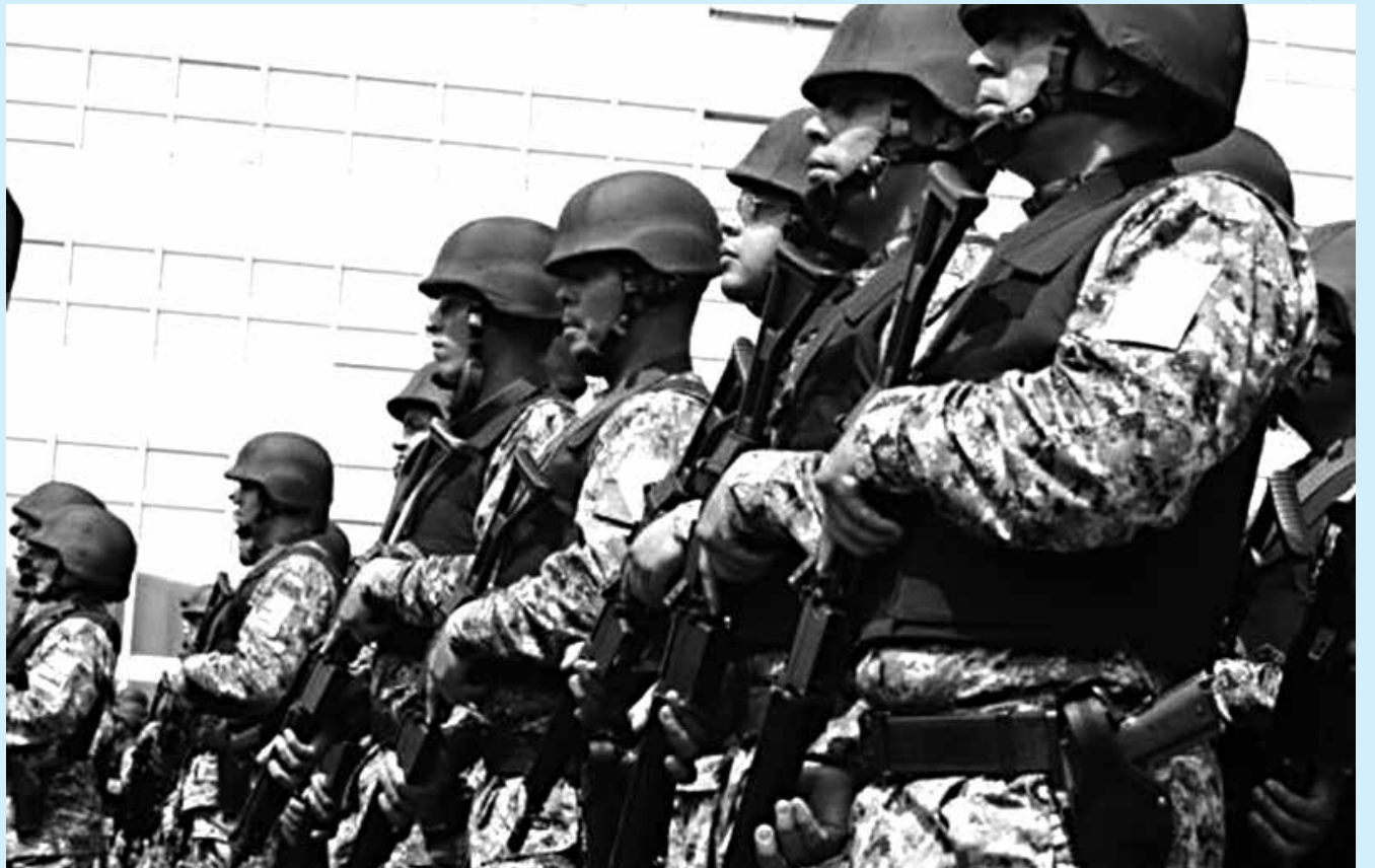
O prazo de atuação dos agentes da Força Nacional poderá ser prorrogado se o governo maranhense achar necessário

O episódio levou o governo estadual a decretar estado de emergência no sistema prisional por 180 dias, prazo durante o qual o Poder Executivo maranhense pôde dispensar exigências burocráticas impostas à execução de obras públicas, construindo unidades prisionais em caráter emergencial. Em outubro, a Secretaria de Justiça e Administração Penitenciária (Sejap) anunciou o projeto de construir dez unidades prisionais e reformar os estabelecimentos já em funcionamento,