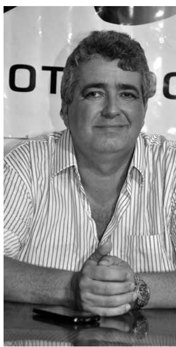
"Em time que ganha, não se mexe"