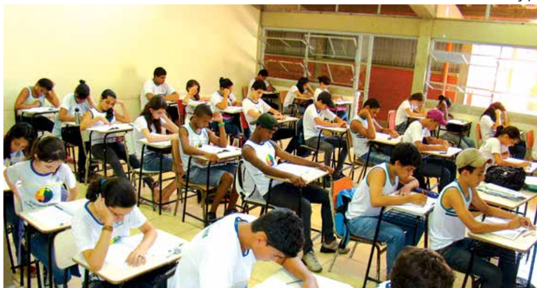
Alunos do 2º ano do Ensino Fundamental vão enfrentar provas de português e matemática

A Provinha Brasil é um instrumento do qual a escola, a coordenação pedagógica e o professor dispõem para realizar o diagnóstico do aprendizado das crianças que cursam o segundo ano do Ensino Fundamental. Sua aplicação não é obrigatória. Segundo informações do Inep/MEC, a partir de março de 2014 será disponibilizado para as instituições de ensino o Sistema Provinha Brasil.