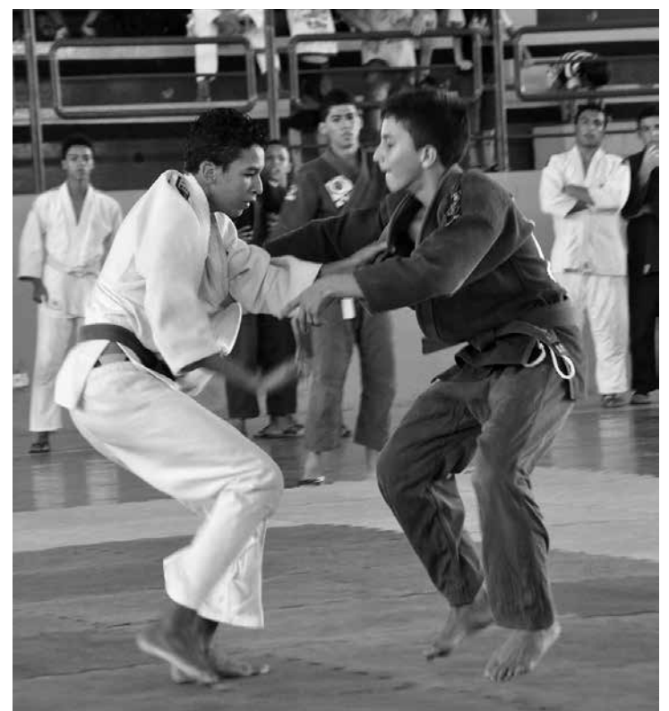
As disputas vão acontecer a partir das 9h com mais de 300 atletas