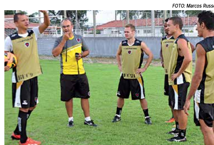
Jogadores do Bota em treino descontraído no início da semana