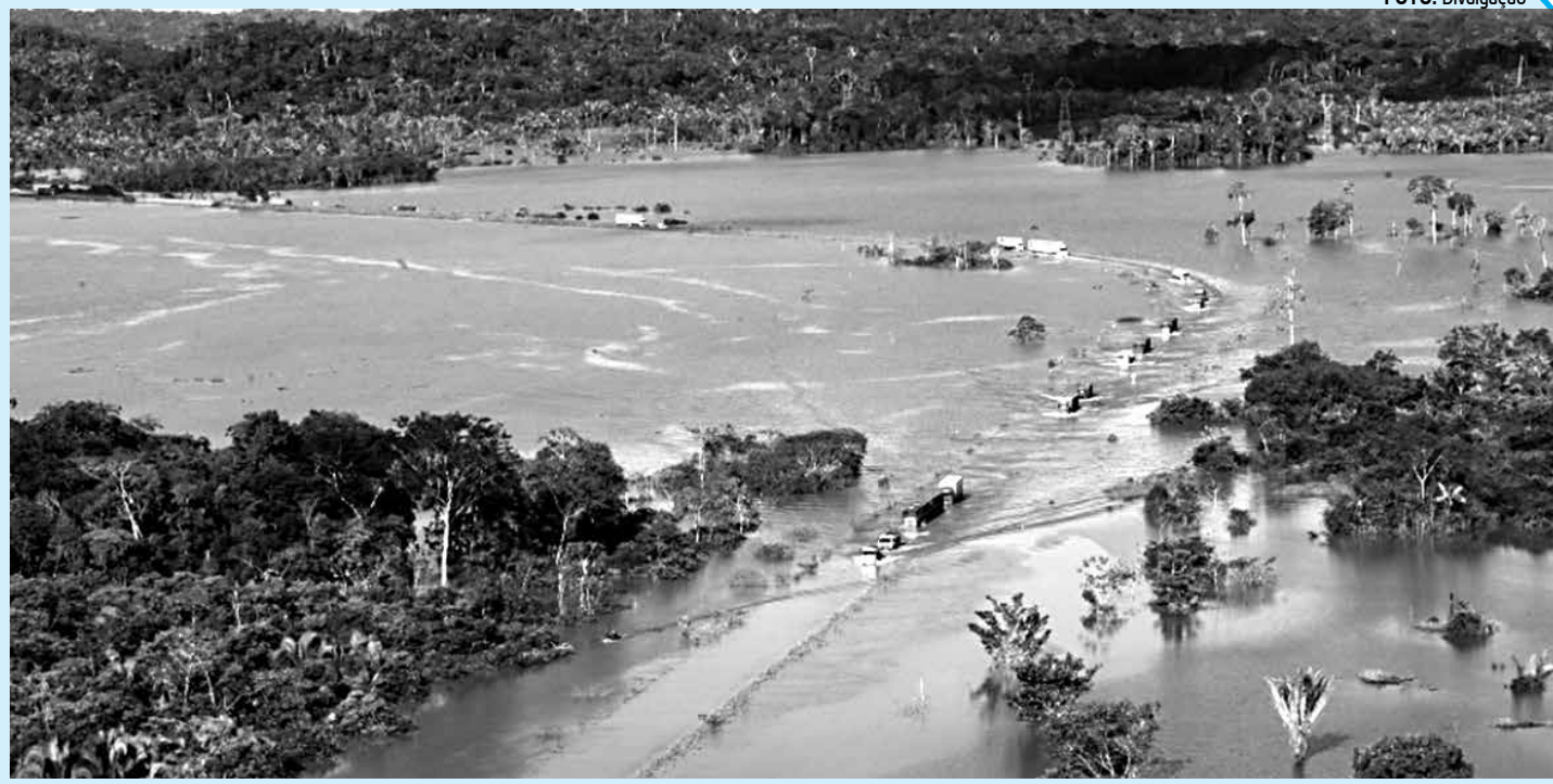
As cheias causadas pelo Rio Madeira levou a Prefeitura de Porto Velho a decretar estado de calamidade por conta da situação

“Caso o pedido tenha sido indeferido pelo Conare, ele poderá ingressar com recurso junto ao Ministério da Justiça ou poderá solicitar ao Conselho Nacional de Migração alguma outra regularização que seja por outros critérios econômicos que não aqueles de perseguição que ele nos fez”, completou o secretário.