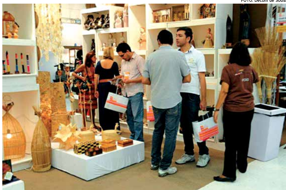
Feira promove exposição e comercialização das criações de 160 artesãs de 35 municípios paraibanos

As dúvidas sobre o sucesso do leilão surgem porque, para as geradoras que hoje têm sobra de energia, é mais lucrativo vender no mercado à vista. Para atrair essas geradoras para o leilão, onde vão ter que negociar a preços mais baixos, uma das saídas encontradas é oferecer a elas contratos de longo prazo.