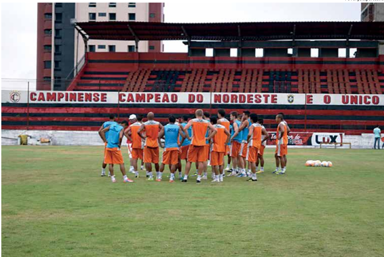
Técnico do Campinense reúne jogadores no centro do gramado do estádio do Renatão e ressalta a importância de vencer a Queimadense