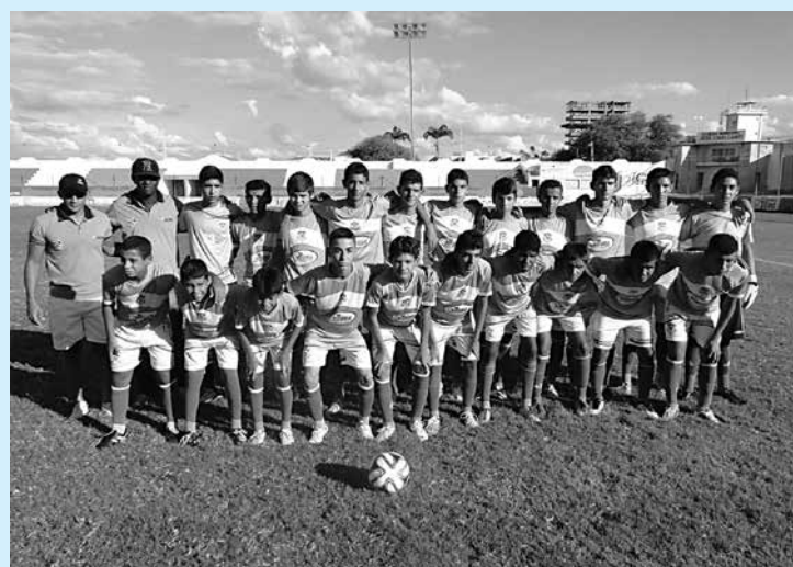
A equipe do Nacional de Patos vai decidir o título contra a Seleção de Monteiro, em jogo dos mais esperados no Cariri paraibano

niu 300 times de todas as regiões da Paraíba restando saber apenas quem será o campeão da edição Cariri-Sertão. No primeiro jogo, realizado no último sábado, em Patos, o resultado foi um empate em 1 a 1 e na partida de volta, caso não haja vencedor, o campeão será conhecido na decisão de pênaltis. "O regulamento foi bem claro e todos os participantes concordaram que se nos dois jogos finais o resultado desse empate a decisão sairia nos pênaltis", disse o coordenador geral da competição, Rai-