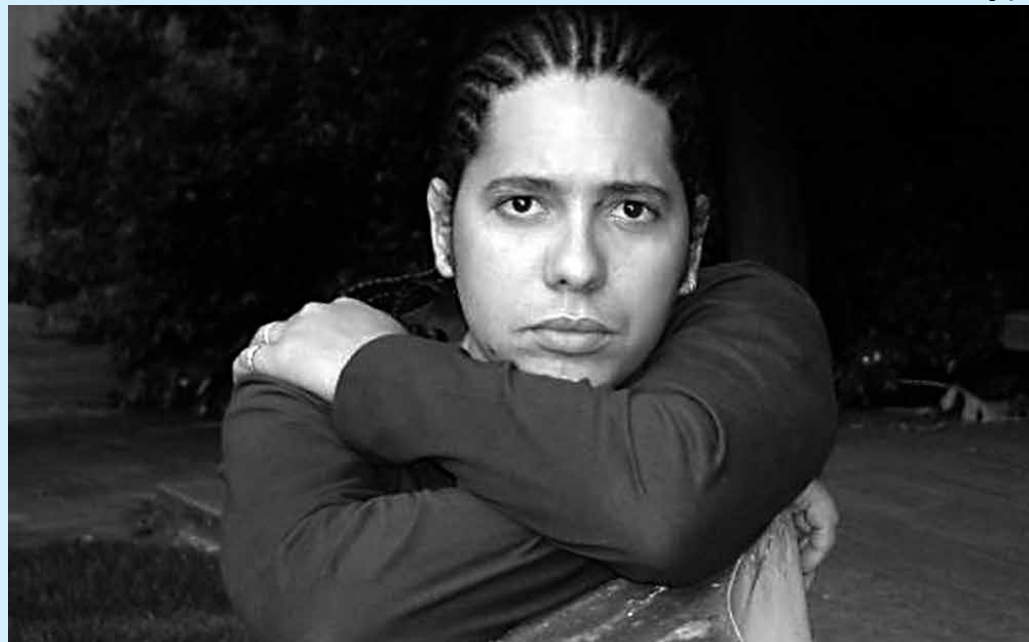
Ondjaki foi o vencedor do Prêmio José Saramago de 2013 e participa de evento hoje na UFPB

Aproximadamente dois mil estudantes são beneficiados com alguns desses projetos de assistência desenvolvidos pela UEPB. Os valores fornecidos pelos bolsa moradia é de R$ 450 e R$ 225 para o bolsa transporte.