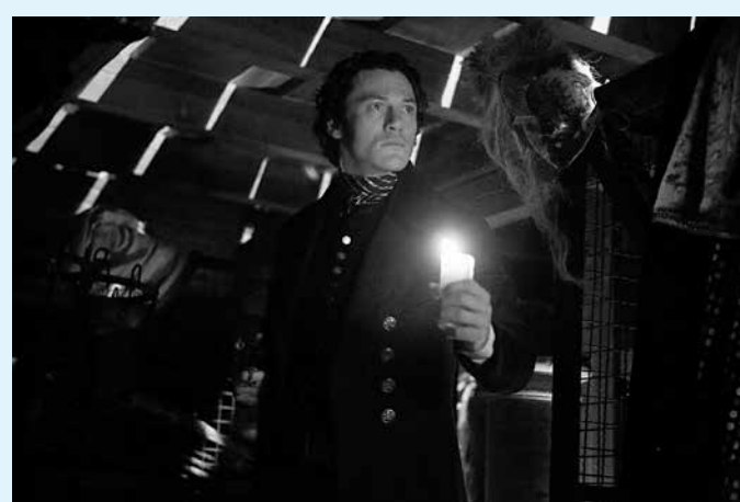
A produção retrata as guerras e sacrifícios

TIM MAIA (BRA 2014) . Gênero: Drama. Duração: 141 min. Classificação: 16 anos. Direção: Mauro Lima. Com Babu Santana, Robson Nunes e Alinne Moraes. Cinebiografia do cantor Tim Maia, baseada no livro "Vale Tudo - O Som e a Fúria de Tim Maia". O filme percorre cinquenta anos na vida do artista, desde a sua infância no Rio de Janeiro até a sua morte, aos 55 anos de idade, incluindo a passagem pelos Estados Unidos, onde o cantor descobre novos estilos musicais e é preso por roubo e posse de drogas. Maneira 4: 15h10, 18h e 21h. Maneira 5: 13h10, 16h, 19h e 22h. CinEspaço 2: 15h, 18h e 21h. Tambá 5: 14h30, 17h30 e 20h30.