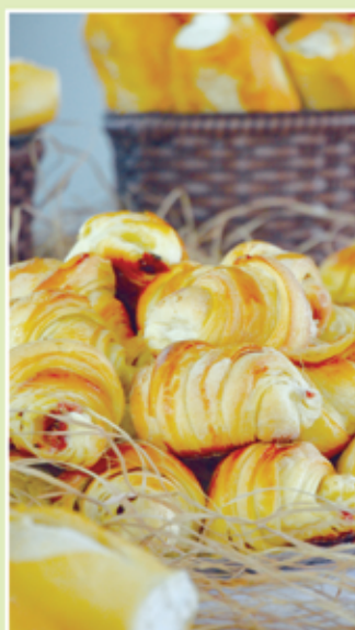
Para obter produtos de qualidade a indústria da Panificação precisa estar em dia com as inovações do setor