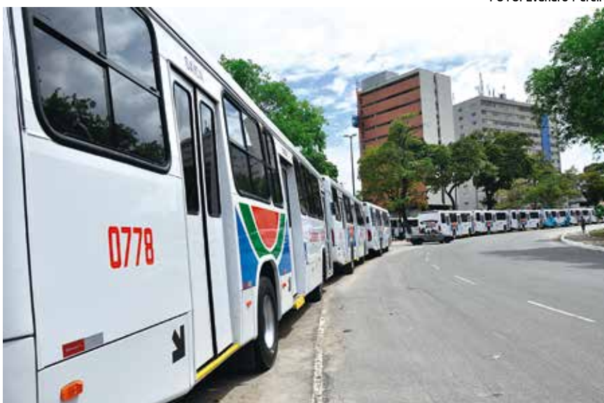
MAIS ÔNIBUS A capital conta desde ontem com 35 novos ônibus para atender à população. PÁGINA 14