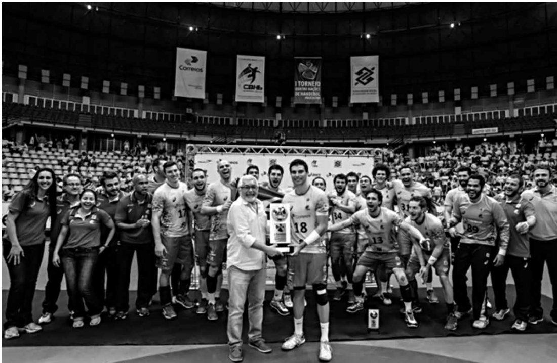
Equipe brasileira, com toda sua comissão técnica, recebe o troféu de campeão da competição

Na segunda parte, a seleção nacional foi mais guerreira, conseguiu tirar a diferença,