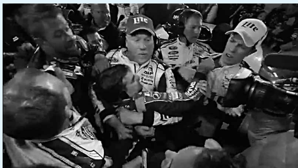
Muito empurra-empurra, socos e pontapés protagonizados por pilotos insatisfeitos

gundo e terceiro, respectivamente. Foi então que depois do fim da corrida, o tetracampeão Gordon parou o carro ao lado do de Keselowski - campeão de 2012 - no pit lane e foi tirar satisfação por causa do encontro. Jeff tentava partir para a briga e era impedido pelos mecânicos quando, pelo outro lado, Kevin Harvick empurrou Keselowski e desencadeou uma pancadaria generalizada, envolvendo pilotos e mecânicos. Depois da troca de agressões, Keselowski e Gordon apareceram com cortes na boca.