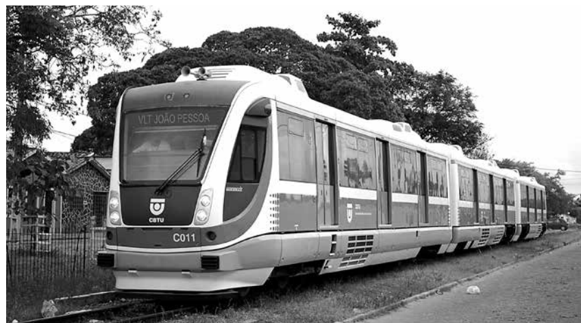
O VLT não terá aumento na passagem, que permanecerá por R$ 0,50

Com o novo trem, a população terá, em curto prazo, viagens mais confortáveis, rápidas, seguras e muito mais baratas. O superintendente da CBTU em João Pessoa disse ainda que não