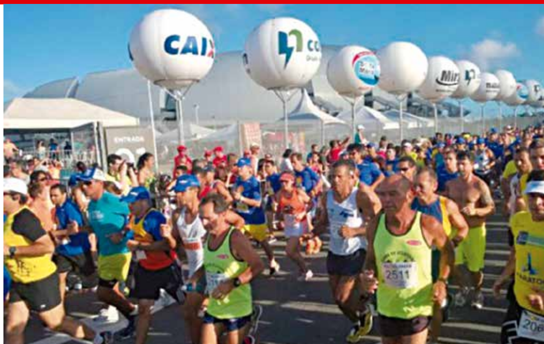
Os quatro mil corredores tiveram que superar o calor e o percurso cheio de obstáculos