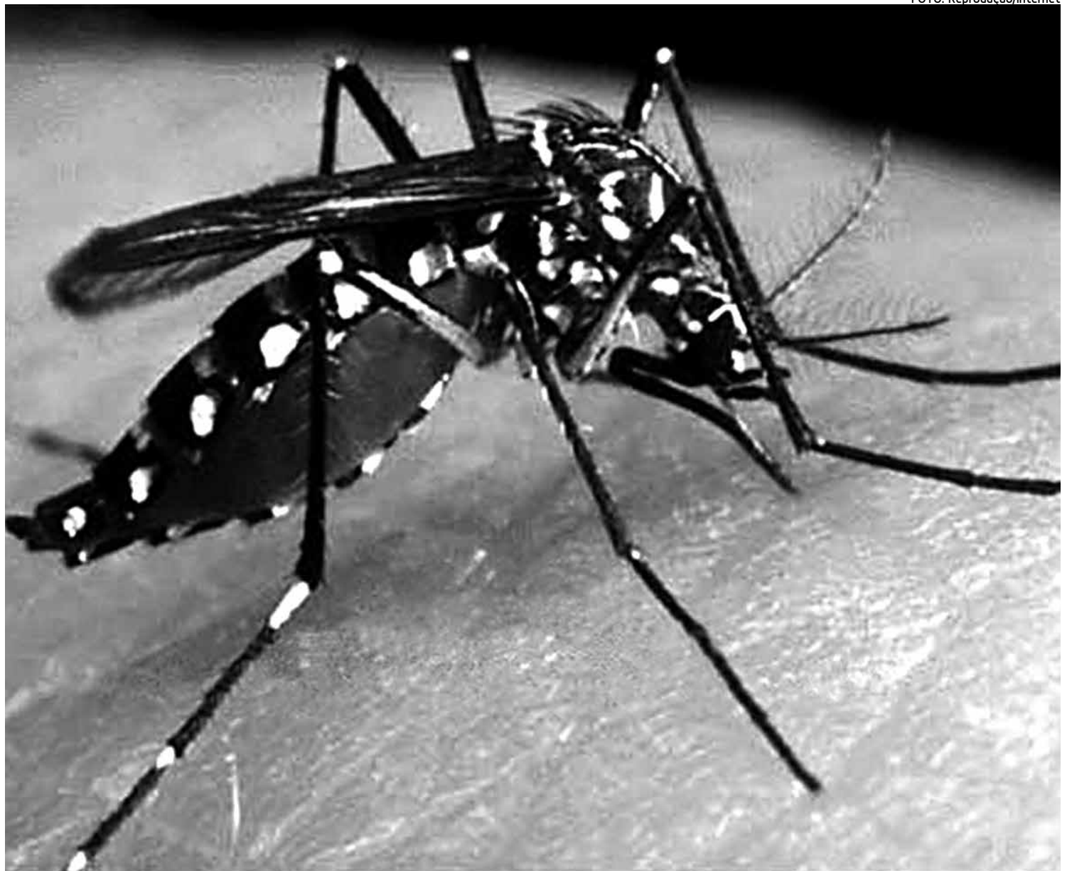
Até a primeira semana de outubro passado, 377 pessoas morreram em decorrência da dengue no país, segundo dados do governo

A vacina foi desenvolvida pelo Laboratório Pasteur e é a 1ª contra a dengue no mundo