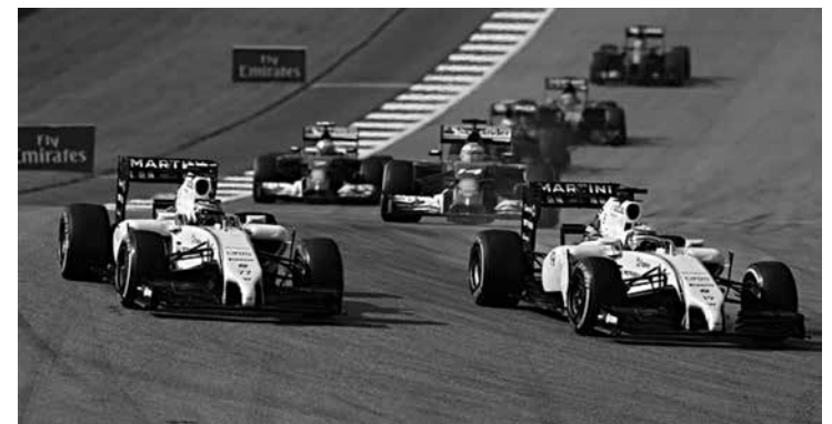
No GP dos Estados Unidos, brasileiro não conseguiu vaga no pódio

Além disso, dois outros fatores podem ter contribuído para a Williams deixar de subir ao pódio em Austin. Um deles foi que, na segunda rodada de paradas, a equipe chamou Bottas antes de Massa, deixando de privilegiar o piloto que estava na frente, como é de costume nas estratégias das equipes. Quando o brasileiro deixou os boxes, retornou atrás de Ricciardo, que havia parado uma volta antes. Outro foi a