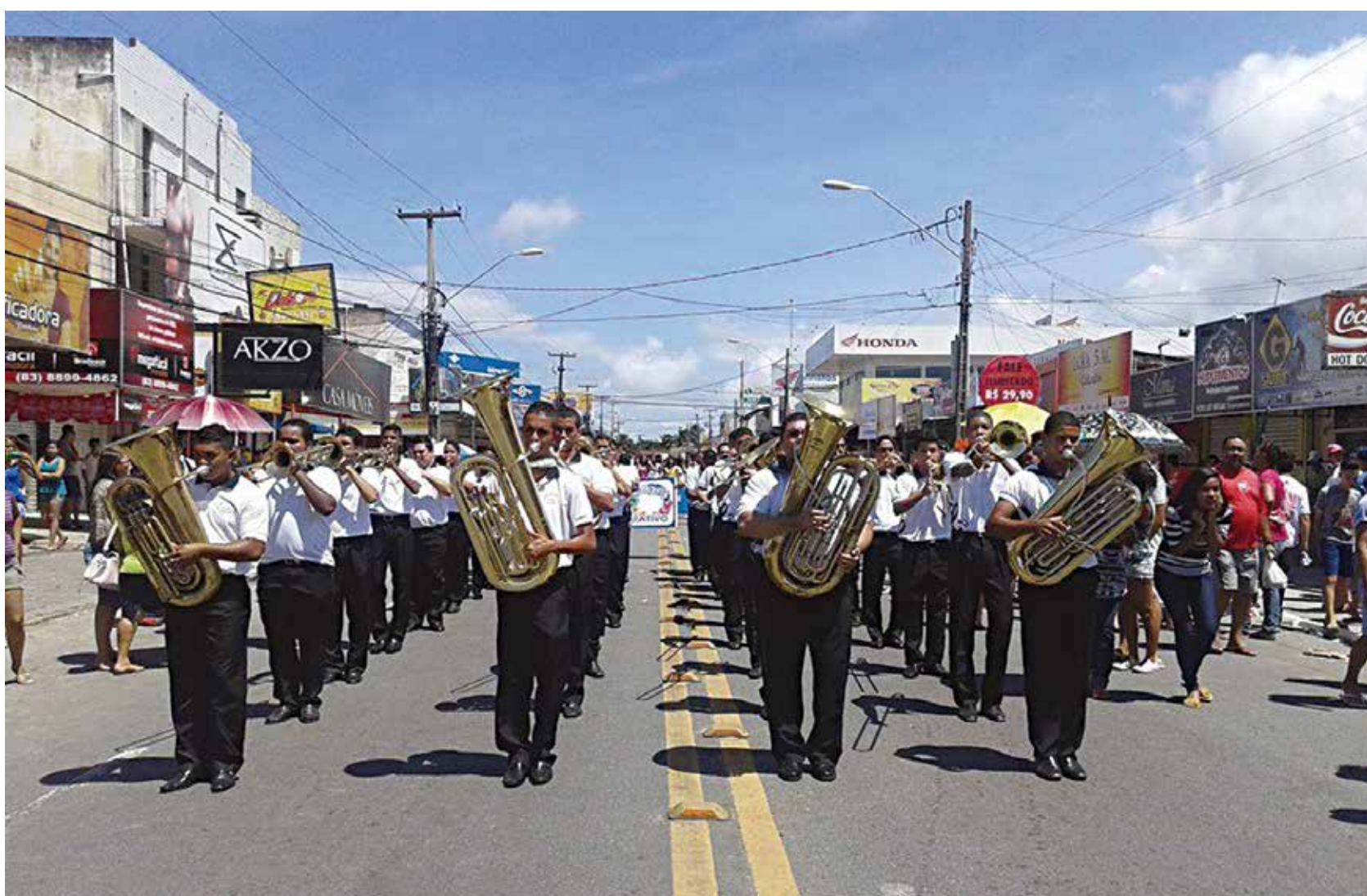
A banda marcial Luís Ramalho surgiu na Escola Estadual de Ensino Médio, localizada em Mangabeira, que também homenageia o compositor paraibano