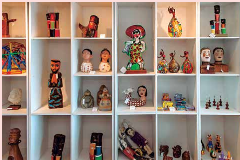
A Babel das Artes, selecionada na categoria Artesanato, é uma das finalistas

A Babel das Artes, selecionada na categoria Artesanato, tem como projeto transformar