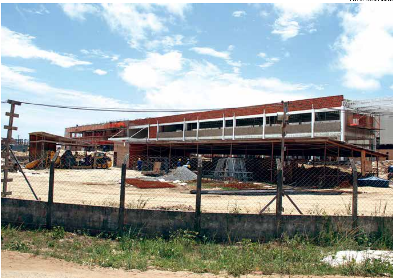
A obra do call center no Distrito Industrial de Mangabeira está em fase bastante adiantada

A direção da UEPB ainda não informou o número de vagas que serão oferecidas via Sisu. PÁGINA 3