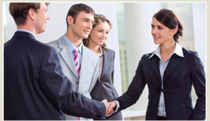
O mercado de trabalho exige profissionais mais qualificados

O valor das inscrições variam de R$ 65,00 e R$ 75,00, a depender da categoria do aluno, ou seja, se este é industrial ou comunitário. Para maiores informações e inscrições ligue: (83) 3322.5570.