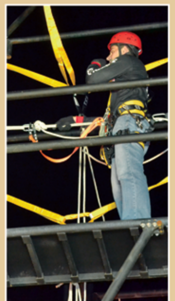
Para a indústria a segurança do trabalhador é fundamental

É o SENAI criando formas de manter a indústria paraibana em dia com a segurança do trabalho e as normas legais vigentes. Para mais esclarecimentos, as empresas interessadas devem entrar em contato pelo telefone (83) 3182-3700.