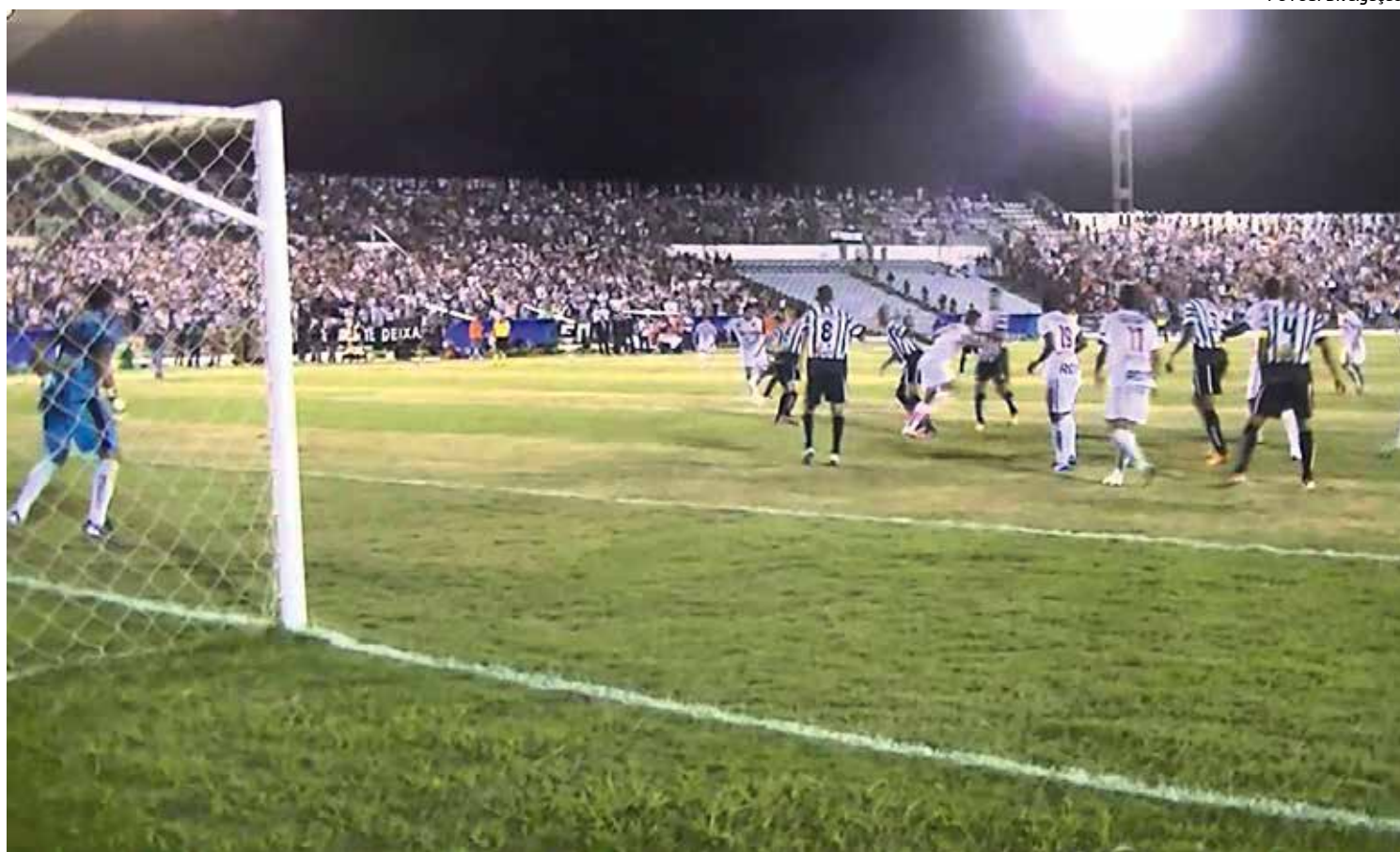
Botafogo e Treze, que sempre têm proporcionado grandes jogos, mais uma vez se enfrentarão na Primeira Divisão do Estadual

A Junta Administrativa já determinou ao Departamento Técnico os estudos relacionados as datas para que os jogos do Paraibano de 2015 não coincidam com as competições promovidas pela Confederação Brasileira de Futebol.