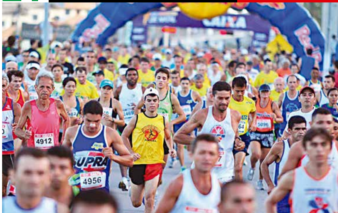
Atletas de todo o país disputaram em Natal-RN a primeira edição da Meia Maratona da cidade