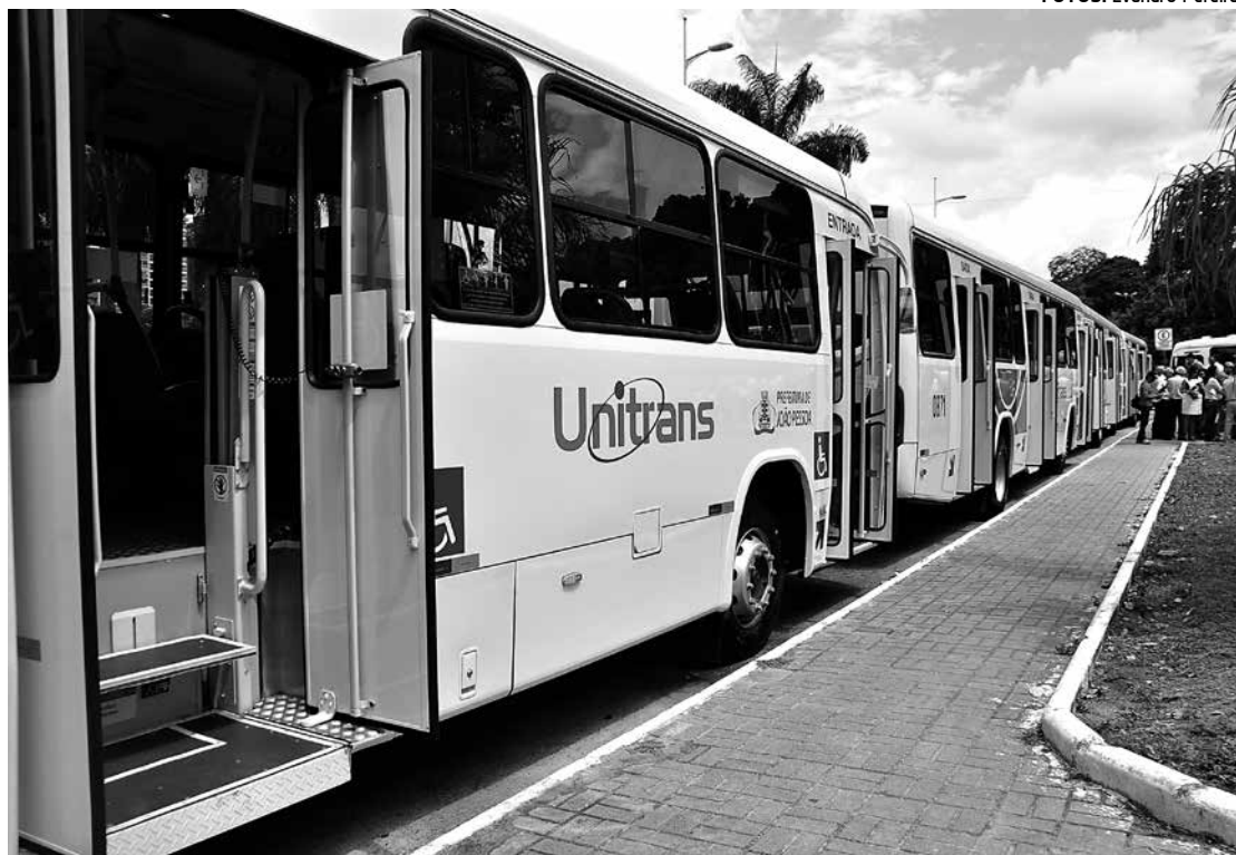
Frota tem 570 veículos, sendo que desse total, 470 são colocados nas ruas e 100 ficam de reserva

Ele disse também que com a chegada das composições dos VLTs – Veículos Leves Sobre Trilhos, e a chegada da nova frota de ônibus, o Terminal de Integração Municipal do bairro do Varadouro será totalmente reconstruído e transformado para que o passageiro do VLT que chegue ao Centro da cidade possa utilizar também o ônibus com a mesma passagem. Ele disse que o novo Terminal de Integração vai ser construído com estacionamento, bicicletário e lojas de multisserviços.