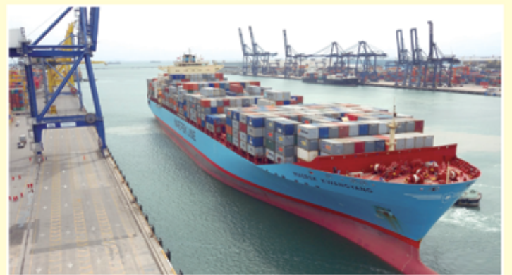
O tráfego de mercadorias nos portos será beneficiado com o Portal Único

O Portal Único promete concentrar num único endereço eletrônico os documentos necessários para a exportação ou importação com redução de tempo e de custos. Atualmente, por exemplo, o exportador precisa preencher o número do CNPJ em 17 documentos diferentes e o NCM da mercadoria aparece em 13 documentos. Os 27 órgãos envolvidos no processo de exportações têm exigências parecidas e o Portal Único deverá concentrá-las num único