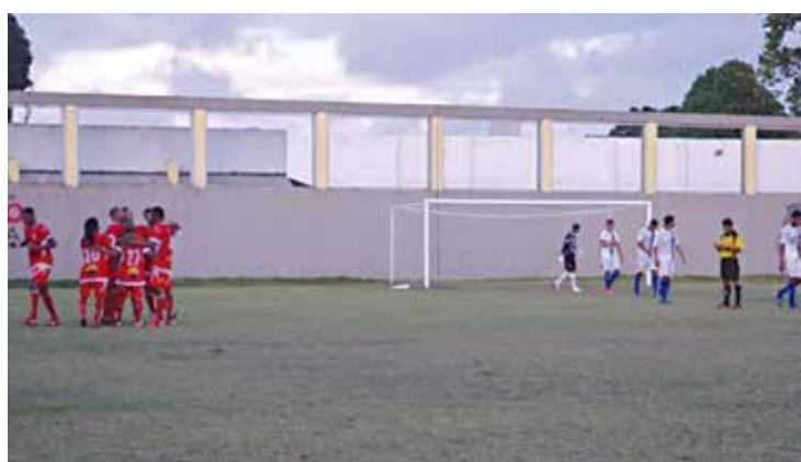
Jogo equilibrado na vitória do Lucena contra o Internacional, por 2 a 1